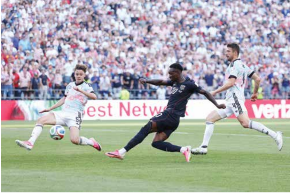
○ بالوغون أثناء المباراة.

وأضاف لاعب أستون فيلا الإنجليزي لقناة آر تي بي أف البلجيكية: «قلنا لأنفسنا إن علينا أن نرد فوق أرض الملعب. وهذا ما فعلناه اليوم. أنا فخور جدا بالفريق».