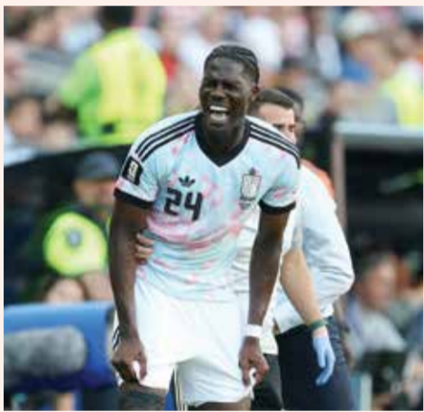
○ أونانا. (إ ف ب)