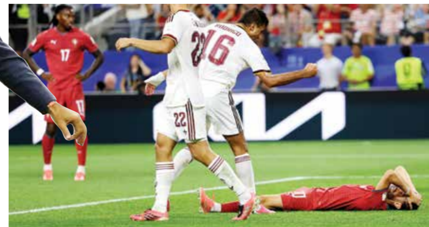
○ رودري يحتفل أمام سيلفا.

وتابع: «لكن هذا كل ما في الأمر، نظرا إلى علاقة الثقة التي تجمعنا». وبينما ودعت البرتغال منافسات البطولة، تأهلت إسبانيا إلى الدور ربع النهائي، حيث ستواجه منتخب بلجيكا.