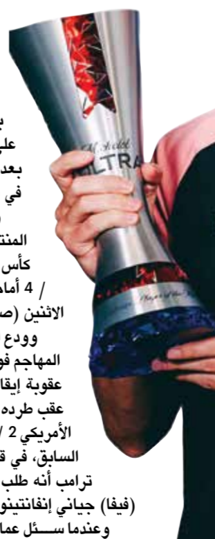
○ دي كيتلاري

وعندما سئل عما إذا كانت الضجة التي صاحبت القرار