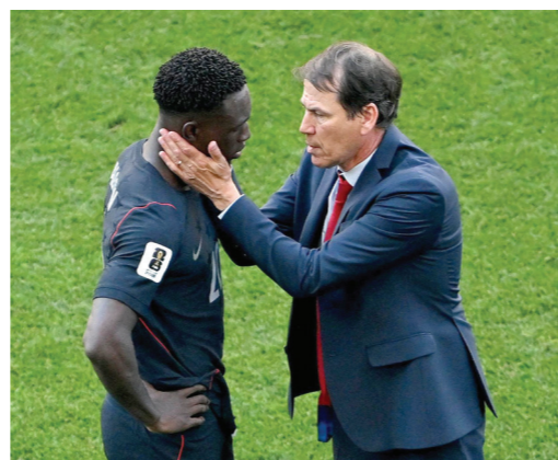
غارسيا مع بالوغون

كبيرة، على البطولة. وكان من بين أشد المنتقدين للقرار رودي غارسيا مدرب منتخب بلجيكا، الذي تحدث مع بالوغون عقب المباراة. وقال غارسيا: «جاء لي، وأنا أقدر هذا. هذا ليس خطأ، لم يفعل أي شيء خاطئ. أنا أحترمه». وبعد المباراة سارع الحساب الرسمي لمنتخب بلجيكا على موقع «إكس» للتواصل الاجتماعي إلى نشر رسالة عقب تأكد الفوز، جاء فيها: «الغوا هذا»، مرفقة بصورة لاحتفالات اللاعبين بالأهداف.