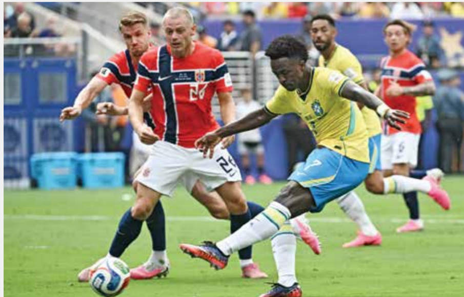
○ من مباراة البرازيل والنرويج.