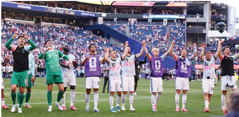
لاعبو بلجيكا يحيون الجماهير.