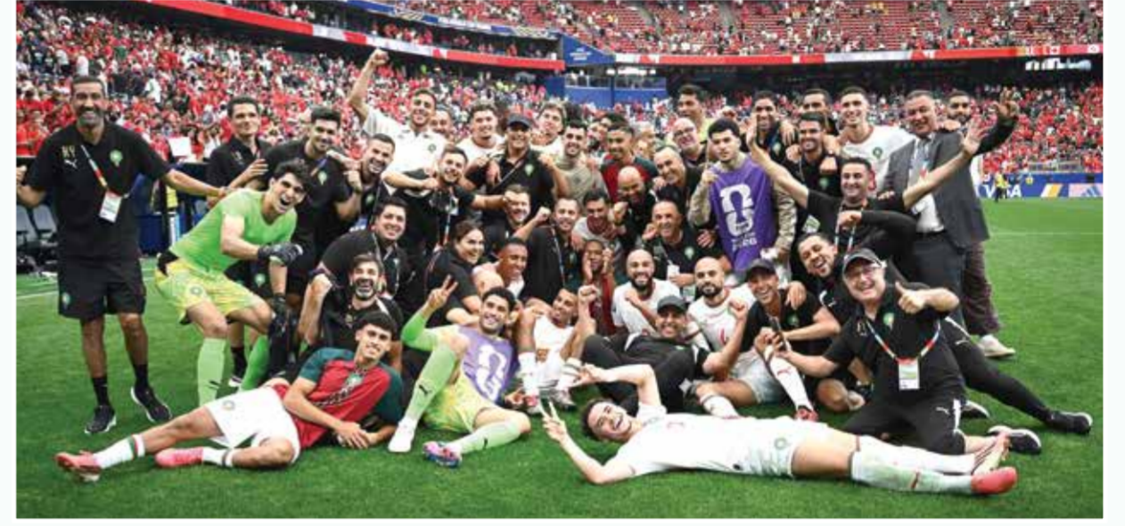
○ فرحة مغربية بالتأهل.

وأضاف: «المغرب أمام تحدٍ كبير في مباراته المقبلة، وإذا واصل الظهور بنفس الثبات والانضباط والروح القتالية التي شاهدها طوال البطولة، فأراه قادراً على مواصلة مشواره، لما يمتلكه من شخصية قوية داخل الملعب وقدرة على التعامل مع مختلف مجريات المباريات». وتطرق عبدالمجيد إلى خروج