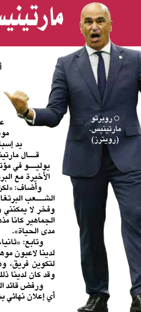
○ روبرتو مارتينيس.

وتابع: «ثانيا، أشكر اللاعبين على عملهم. لدينا لاعبون موهوبون، لكن الأهم هو الالتزام لتكوين فريق، وهذا يبدأ بالموقف والالتزام، وقد كان لدينا ذلك». ورفض قائد المنتخب كريستيانو رونالدو أي إعلان نهائي بشأن اعتزاله الدولي، قائلا: