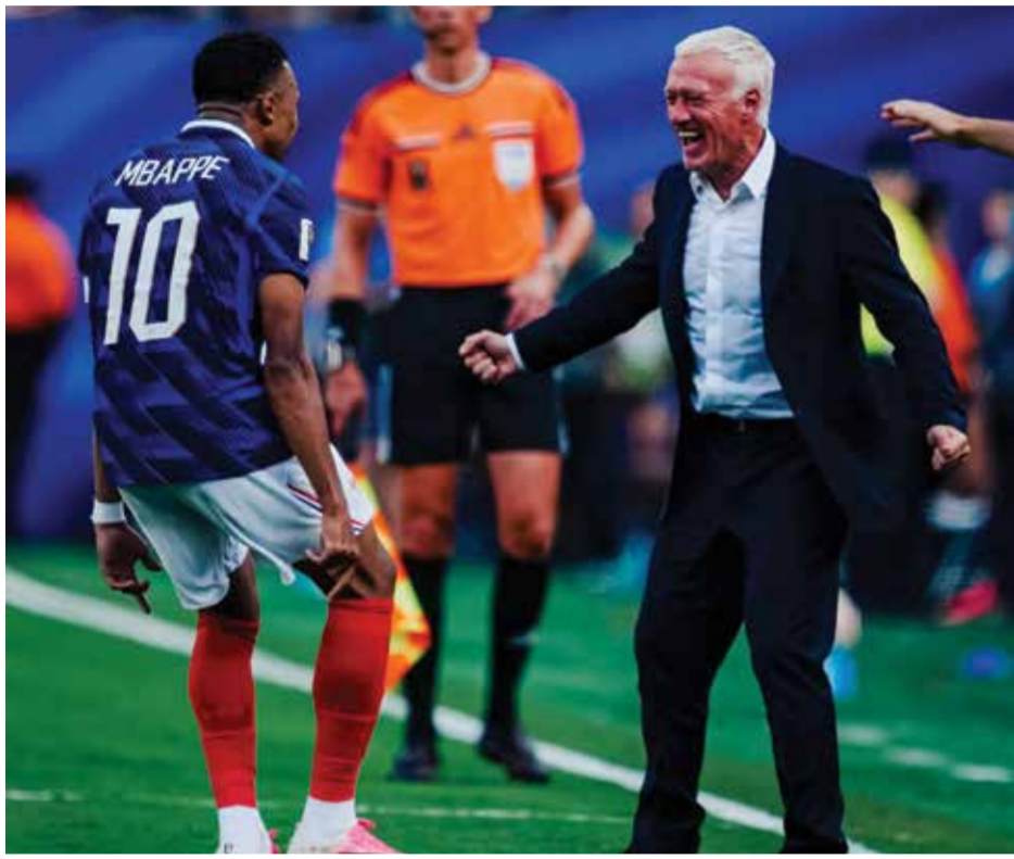
ديشان يحتفل مع مبابي.