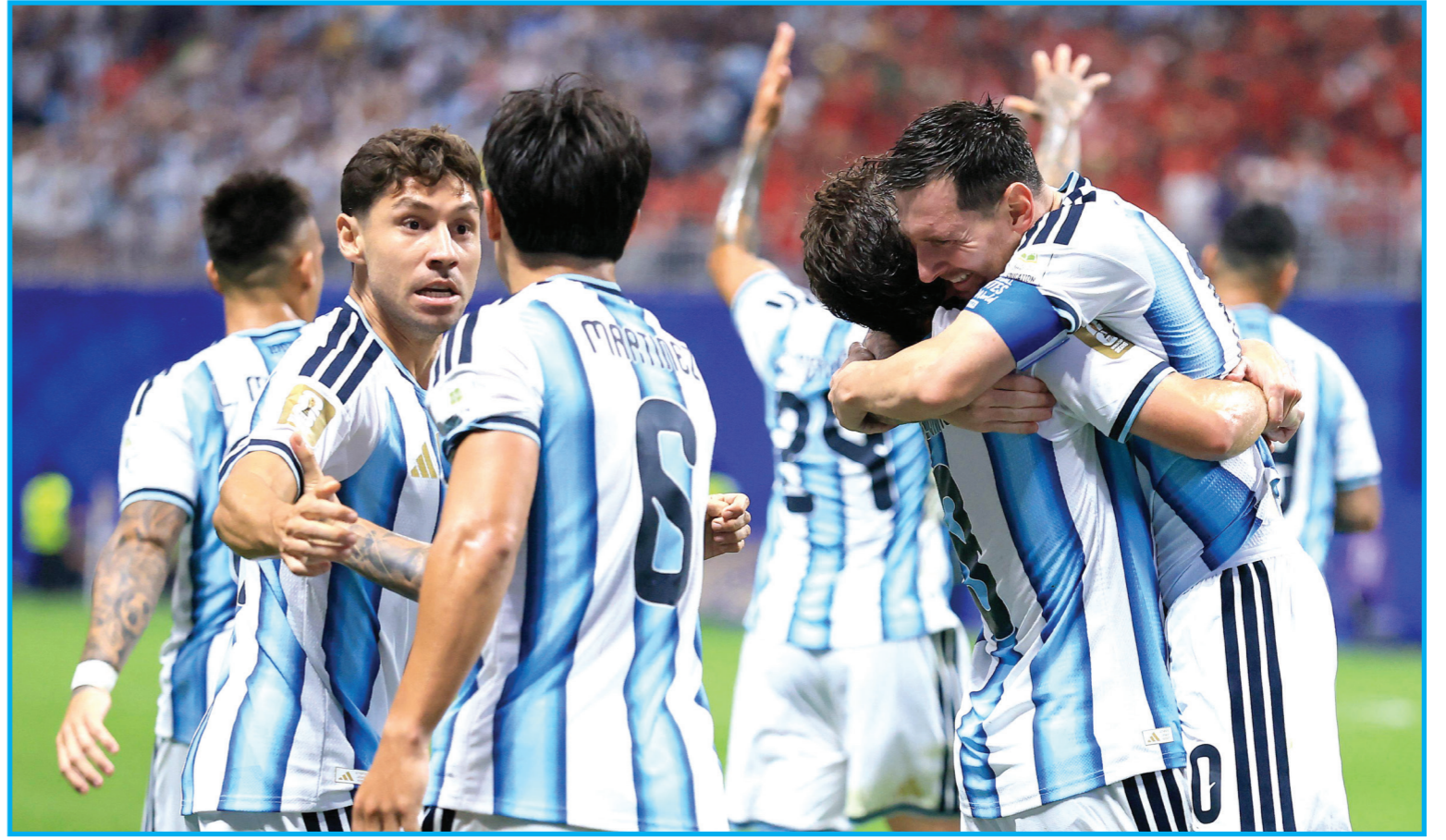
فرحة لاعبي الأرجنتين بالنتاهل

وأضاف مهاجم بيراميدز وهو يحاول أن يتماثل نفسه من البكاء: «عملنا بطولة كبيرة، وكنا نتمنى الذهاب بعيداً، فخور بكل لاعب مصري شارك في هذه البطولة، ونشكر الجماهير التي جاءت لمساندتنا». وقال غارسيا: «جاء لي، وأنا أقدر هذا. هذا ليس خطأ، لم يفعل أي شيء خاطئ. أنا أحترمه». وبعد المباراة سارع الحساب الرسمي لمنتخب بلجيكا على موقع «إكس» للتواصل الاجتماعي إلى نشر رسالة عقب تأكد الفوز، جاء فيها: «الغوا هذا»، مرفقة بصورة لاحتفالات اللاعبين بالأهداف.