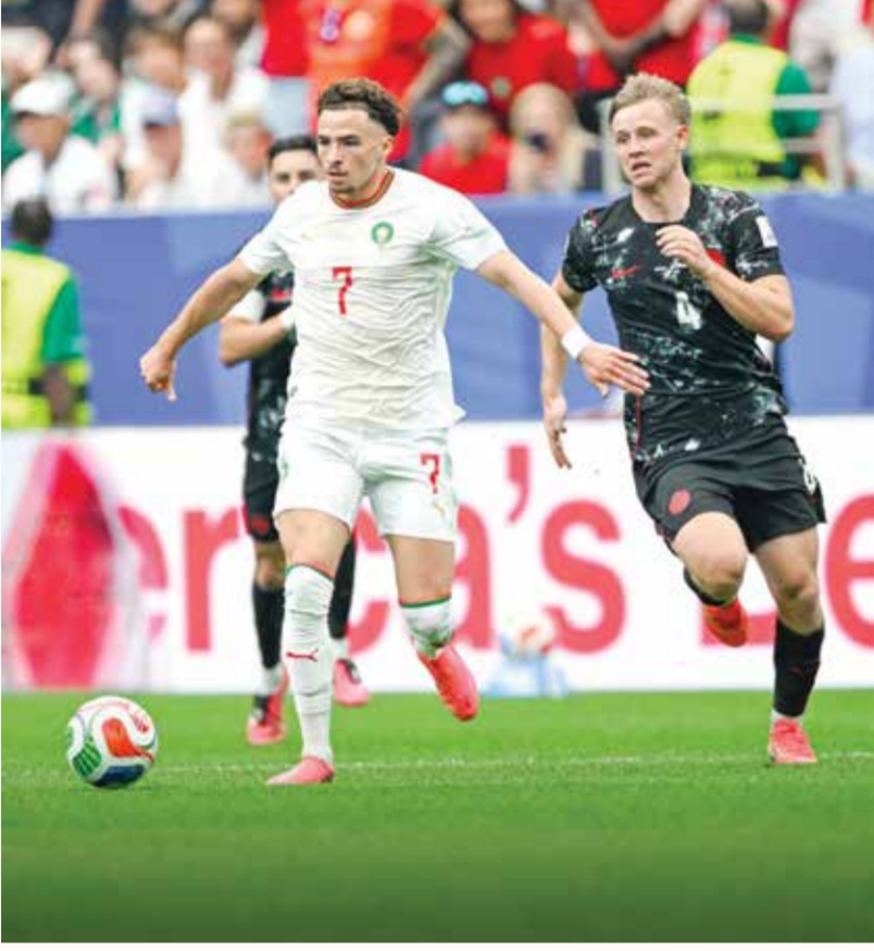
○ من لقاء المغرب وكندا.

المحافظة على الأداء نفسه في جميع الأدوار.