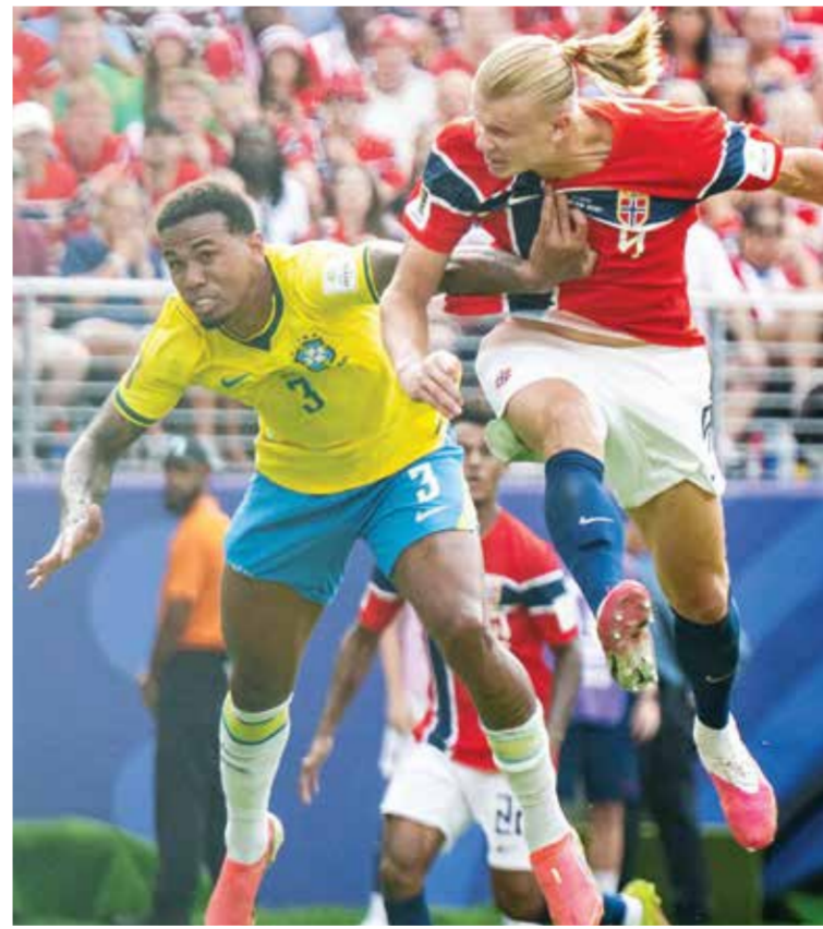
○ من لقاء النرويج والبرازيل.