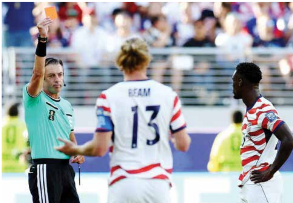
○ كلاوس يشهر البطاقة الحمراء إلى بالوغون.

وكتب سايروس يانسن، وهو معلق على الشؤون الدولية عبر الإنترنت: «يفتقر ترامب إلى النزاهة، ومن الطبيعي أن يحاول استخدام منصبه للتأثير في النتيجة».