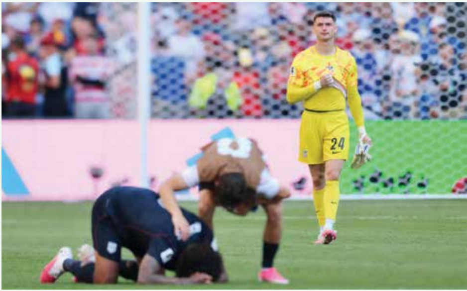
○ حصرة لاعبي أمريكا.

الذي شارك كبديل مع بداية الشوط الثاني، عن الخسارة قائلا: «لقد كان واحدا من تلك الأيام التي لم تسر فيها الأمور لصالحنا، لم تكن مباراتنا الأفضل، وشعرت أنه كان بإمكاننا إدارة بعض اللحظات بشكل أفضل قليلا، لقد كانوا الفريق الأفضل اليوم». واختتم حديثه بالقول: «لقد استمتعنا جميعا بوقتنا معا، وكانت هذه واحدة من أفضل التجارب في مسيرتي كلاعب حتى الآن».