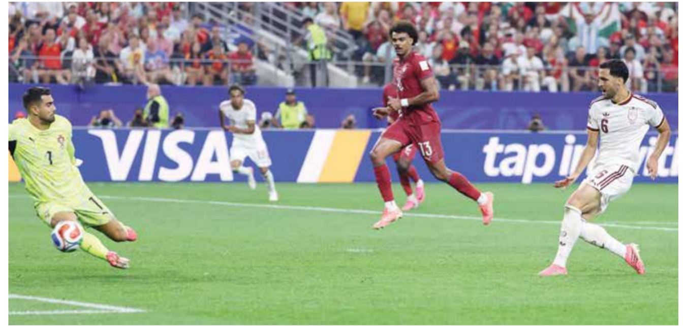
○ ميرينو يسجل هدف الفوز. (أ ف ب)

واختتم كوكوريللا حديثه بالقول «في النهاية، كانت مباراة متكافئة للغاية أيضا، وشهدت لحظات كان علينا فيها الصمود حقا، لكننا حافظنا على تركيزنا طوال الوقت، وقدمنا كل ما لدينا، وأعتقد أننا استحققتنا الفوز».