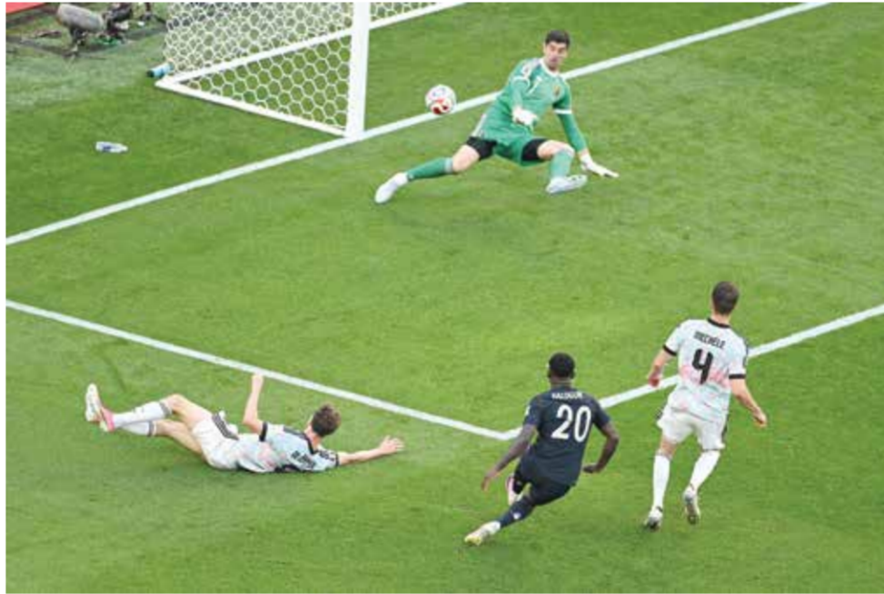
○ من مباراة بلجيكا وأمريكا.

وفي وقت سابق، دافع الاتحاد البرازيلي أيضا عن حكمه، واصفا إياه ب«المحترف النموذجي»، رغم