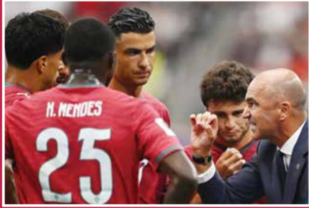
○ رونالدو ومارتينيس

«خورخي جيسوس؟ ليس هذا هو الوقت المناسب للحديث عما سيأتي، وليس من شأننا القيام بذلك، من تقع عليه مسؤولية الاختيار سيقرر من هو المدير الفني».