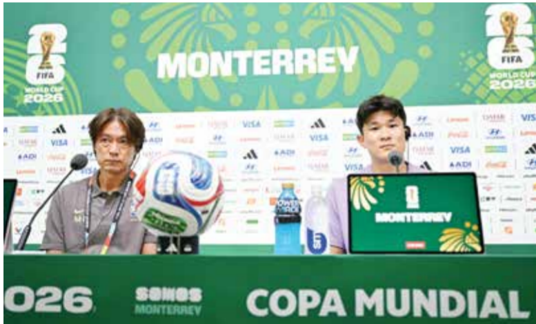
○ جانب من المؤتمر الصحفي.