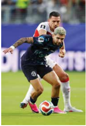
○ إنيسيو