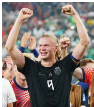
○ هالاند. (رويترز)