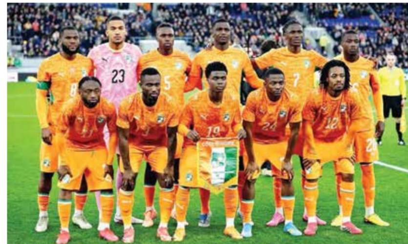
○ منتخب ساحل العاج.

وتستعد كوت ديفوار المصنفة 31 عالميا لخوض أول مواجهة لها في كأس العالم أمام منتخب من اتحاد كونكاف.