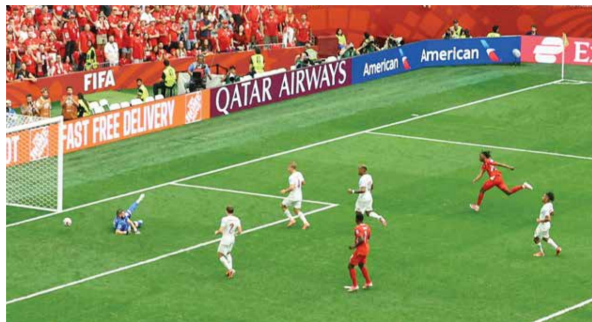
جانب من اللقاء.

فانكوفر (كندا) - (أ ف ب): انتزع المنتخب السويسري صدارة المجموعة الثانية في كأس العالم 2026 بعد أن أسقط البلد المضيف كندا 2-1 في ختام دور المجموعات، لكن ذلك لم يكن يمنع الكنديين من التأهل عن المركز الثاني.