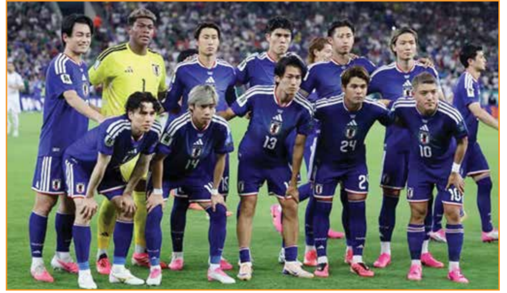
○ منتخب اليابان.