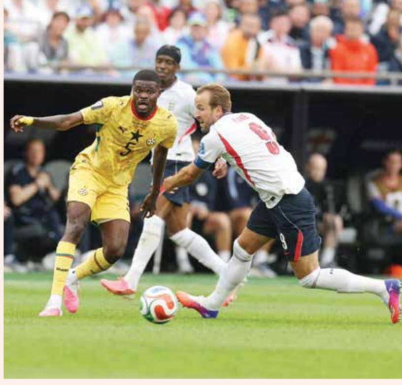
○ من مباراة إنجلترا وغانا

والمنافسة على المجد. وعندما سئل عما إذا كان تعادل غانا بمثابة جرس إنذار، قال المدرب الألماني: «لا، نحن لسنا بحاجة إلى جرس إنذار».