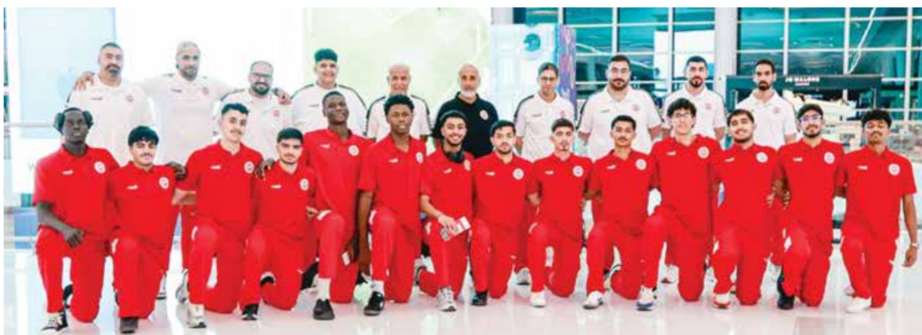
○ من مغادرة المنتخب.

استقبل الشيخ عبدالعزيز بن مبارك آل خليفة، رئيس الاتحاد البحريني للتنس، الشيخ عبدالله بن خالد آل خليفة، الرئيس التنفيذي للاتصالات المؤسسية وعلاقات المستثمرين في زين البحرين، حيث بحث الجانبان سبل تعزيز التعاون المشترك بما يخدم مسيرة تطوير لعبة التنس في مملكة البحرين. وخلال اللقاء الذي جمعهما بمقر الاتحاد، استعرض الشيخ عبدالعزيز بن مبارك آل خليفة الخطط والبرامج الحالية والمستقبلية التي ينفذها الاتحاد البحريني للتنس، والهادفة إلى تطوير اللاعبين وصقل مواهبهم وإعداد أجيال متعاقبة من اللاعبين القادرين على تمثيل البحرين بصورة مشرفة في مختلف المحافل الإقليمية والدولية.