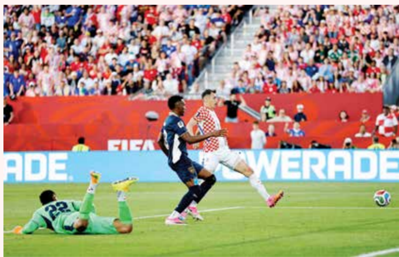
بوديمير يسجل هدف الفوز. (أ ف ب)

تورونتو - (أ ف ب): أُنشئت كرواتيا، وصيفة نسخة 2018 وثالثة 2022، آمالها في بلوغ دور الـ 32 بفوزها الصعب على بنما 1-0 وأقصتها من المنافسة الثلاثة على ملعب بي إم أو فيلد في تورونتو، في ختام الجولة الثانية من المجموعة الثانية عشرة لمونديال أميركا الشمالية في كرة القدم.