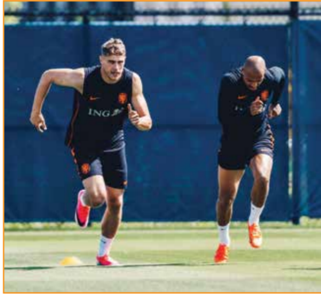
○ تدريبات هولندا.