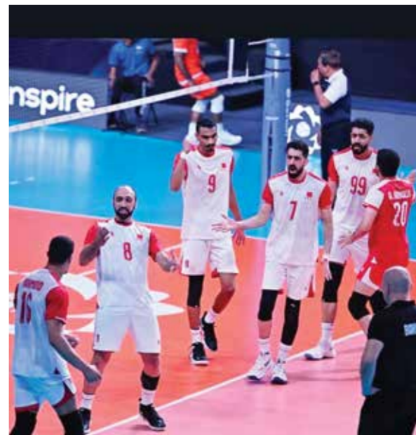
○ منتخبنا الوطني لكرة الطائرة

يواجه منتخبنا الوطني للرجال لكرة الطائرة اليوم الخميس منتخب كازاخستان في رابع مبارياته لحساب المجموعة الأولى لبطولة المنتخبات الآسيوية المقامة في الهند حتى 28 يونيو الجاري. يدخل منتخبنا مباراة اليوم وفي رصيده 6 نقاط من انتصارين وخسارة واحدة، ويحتل المركز الثاني في المجموعة، ويأتي المنتخب الكازاخستاني في المركز الثالث بـ 5 نقاط من انتصارين وخسارة واحدة. ويذكر أن المنتخب الهندي يتصدر مجموعة منتخبنا بـ 12 نقطة من أربعة انتصارات.