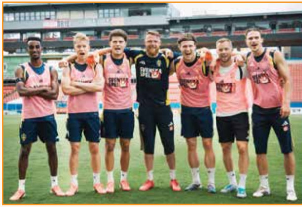
○ لاعبو السويد.