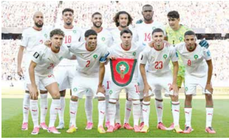
○ منتخب المغرب.