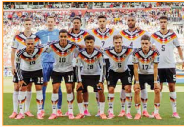
○ منتخب ألمانيا.

الإقصائية للمرة الأولى في تاريخها بعدما أهدرت فرصة حسمها في الجولة الثانية. ويعد منتخب «الفيلا» من أبرز المرشحين للتأهل، ويبدو أنه قادر على تحقيق ما عجزت عنه الإكوادور، بالنظر إلى ترسانته الهجومية بقيادة لاعب مانشستر يونايتد الإنجليزي أماد ديالو.