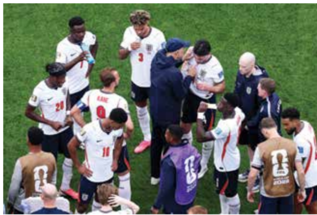
لاعبو إنجلترا أثناء استراحة شرب المياه.

الفرص للجميع، ولذلك تطبق هذه الاستراحتات في كل مباراة». وفي انتقاده لفترة الراحة لشرب المياه، قال توخل قبل مباراة غانا: «اعتقد أنها تعطل وتغير مسار المباراة أكثر مما كنت أتوقع، سبق أن أخذت فترات راحة لشرب الماء عندما كان الجو حاراً جداً وكنت في أمس الحاجة لذلك، لكنها كانت أقصر في المدة، أما الآن فهي تقسم المباراة تقريبا إلى أربعة أشواط». وتحظى فترات الاستراحة بتأييد البعض أيضاً، حيث أيدها كل من ديبية ديشان وكارلو أنشيلوتي، مدربا فرنسا والبرازيل.