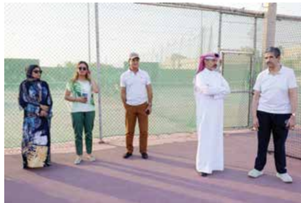
○ جانب من الزيارة.