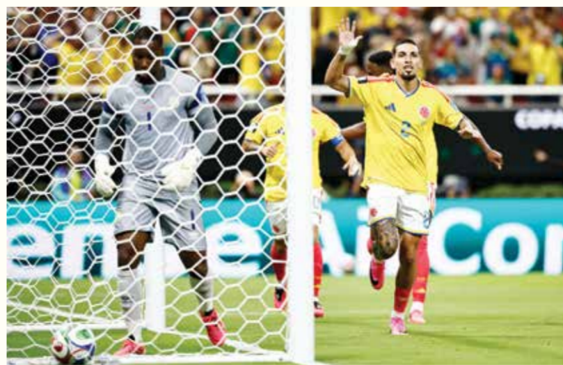
مونويس يحتفل بهدف الفوز. (أ ف ب)

غوادالاخارا - (أ ف ب): بلغ المنتخب الكولومبي دور الـ 32 من مونديال 2026 لكرة القدم، بفوزه على جمهورية الكونغو الديمقراطية 1-0 في غوادالاخارا ضمن الجولة الثانية من المجموعة الحادية عشرة.