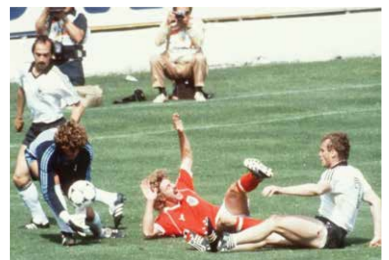
من مباراة النمسا وألمانيا الغربية

وعقب موجة إدانة عالمية وشكوى رسمية لم تسفر عن نتيجة من جانب الجزائر، قرر الاتحاد الدولي لكرة القدم