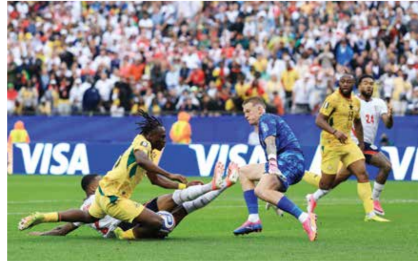
○ لحظة الاحتكاك بين كونسو وادو نغعا

أن يتم احتسابها لغاننا، ركلة جزاء واضحة ضد إنجلترا (تم تجاهلها)». وكان الحكم الأمريكي أرماتو فياريال هو حكم الفيديو المساعد للحكم في المباراة التي أقيمت في فوكسبورو، في حين كان الهنودراسي سعيد مارتينيز حكما للمساحة، وتابع المدرب البرتغالي في تصريحاته التي أوردتها وكالة الأنباء البريطانية (بي