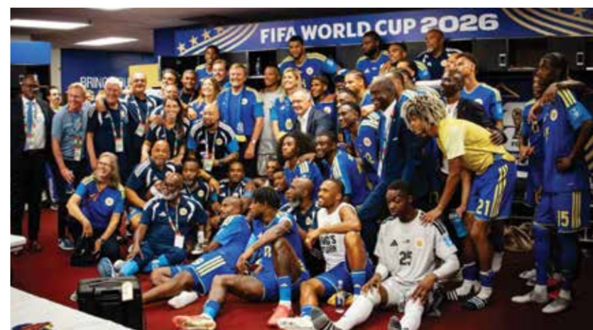
○ منتخب كوراساو.

إلى المونديال. ودعا أدفوكات جماهير كوراساو إلى أن يكونوا واقعيين قبل مواجهة الإكوادور التي حلت ثانية في تصفيات أميركا الجنوبية المؤهلة لنهائيات النسخة الثالثة والعشرين من