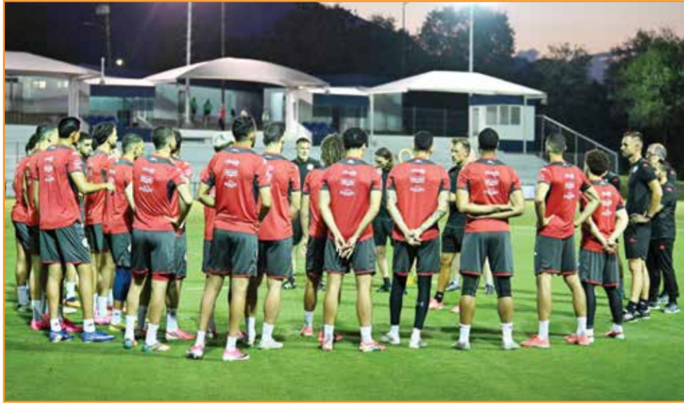
○ تحضيرات تونس.