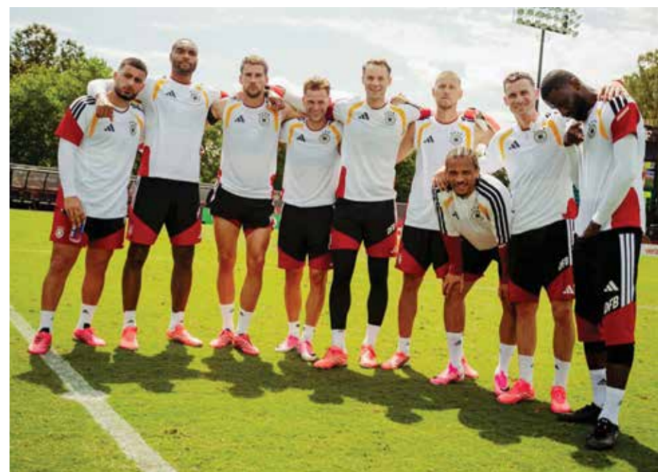
○ لاعبو ألمانيا.

وسجل ميسي خمسة أهداف في أول مباراتين للأرجنتين بالنسخة الحالية للبطولة، المقامة حاليا في الولايات المتحدة والمكسيك وكندا، محققا رقما قياسيا جديدا لأكثر عدد من الأهداف في تاريخ كأس العالم برصيد 18 هدفا. في المقابل، أحرز مبابي أربعة أهداف مع فرنسا، ليحتل المركز الثاني في قائمة الهدافين التاريخيين للمونديال، مناصفة مع الألماني المعتزل ميروسلاف كلوزه، برصيد 16 هدفا لكل منهما. وقال مبابي: «ليو يسجل دائما. سيظل يسجل. إذا أردت أن أرى ما يفعله ليو، يتعين علي أن أبدأ جهدا أكبر». وميسي ومبابي ليسا الوحيدين