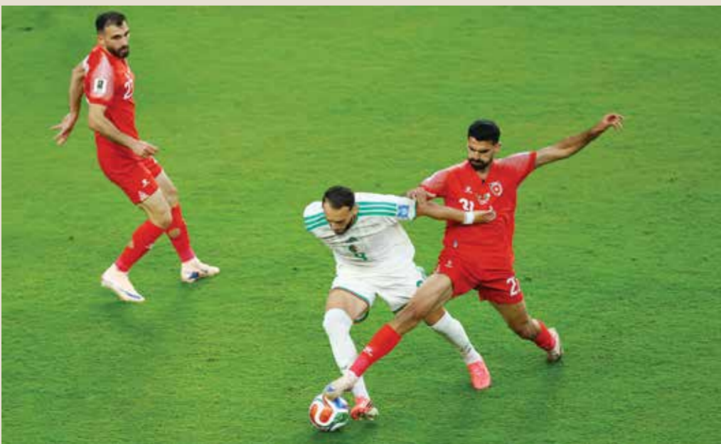
○ من مباراة الجزائر والأردن.

متفاوتة، حيث نجحت منتخبات مصر والمغرب والجزائر في تحقيق انتصارات مهمة عززت من حظوظها في التأهل، فيما تعرضت منتخبات قطر والسعودية وتونس والعراق والأردن للخسارة. ورغم ذلك، فإن العديد من المنتخبات العربية قدمت مستويات فنية جيدة أمام منافسين أقوياء، ما يعكس التطور الملحوظ الذي تشهده الكرة العربية.