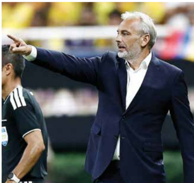
○ ديسابر. (أ ف ب)

وأكد: «علينا الآن أن نحل أداءنا وننتقل إلى الأمام، ستكون مستعدين لمواجهة أوزبكستان، فهم يمتلكون بعض المدافعين المميزين».