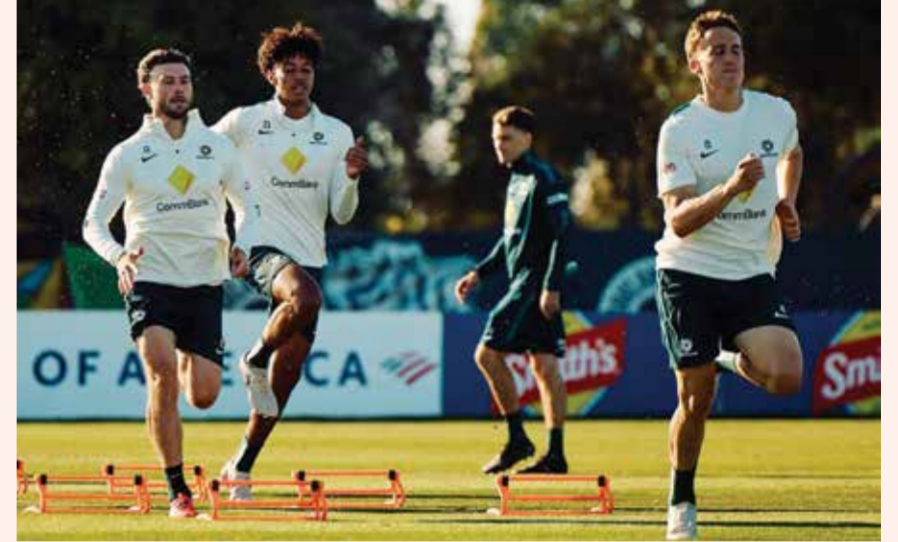
○ تحضيرات أستراليا.