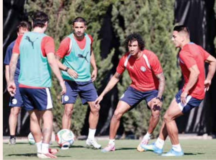
○ تدريبات باراغواي.

وبعد أن صنع هدف حفظ ماء الوجه في الخسارة الثقيلة أمام الولايات المتحدة (1-4)، كرر اللاعب صاحب 34 مباراة دولية (4 أهداف) حضوره في المباراة الثانية، وهذه المرة بفوز على تركيا 1-0، ما منح «ألبي روكا» فرصة خوض مباراة حاسمة أمام أستراليا اليوم الخميس ضمن المجموعة الرابعة. ويبدو ابن كاغواسو حتى الآن على قدر التطلعات المعقودة عليه.