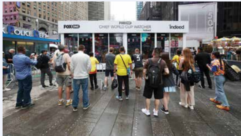
الاستاديو الزجاجي.

ورد نجم التنس الإسباني المعتزل عبر مواقع التواصل «شكراً، ليو ميسي، نهانينا على انطلاقه المونديال... ويحمل نادال رقماً قياسياً بعدد ألقاب رولان غاروس (14)، وهو يطل السلسلة الوثائقية «رافا» التي طرحت في مايو على نتفليكس. ويكشف «رافا» الجانب الإنساني خلف البطل الإصابات، الألم، الإرهاق، الشوك، وكيف تمكن نادال من تجاوزها إلى أن قال جسده كلمته الأخيرة في 2024، بعد أن حصد 22 لقباً في البطولات الأربع الكبرى، و36 لقباً في دورات ماسترز الألف نقطة، وذهبيتين أولمبيتين. وترتبط علاقة ميسي-نادال منذ سنوات. ففي 2023، وبعد عام من تنويعه بكأس العالم في قطر، أرسل ميسي قميصه موقعاً على نادال. وقال الأخير حينها «رؤية ميسي يرفع كأس العالم أسعدتني».