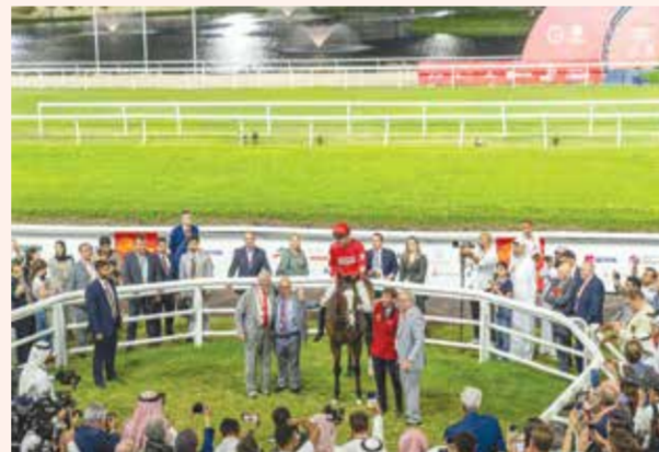
لقطة من كأس البحرين الدولي الخامسة 2023