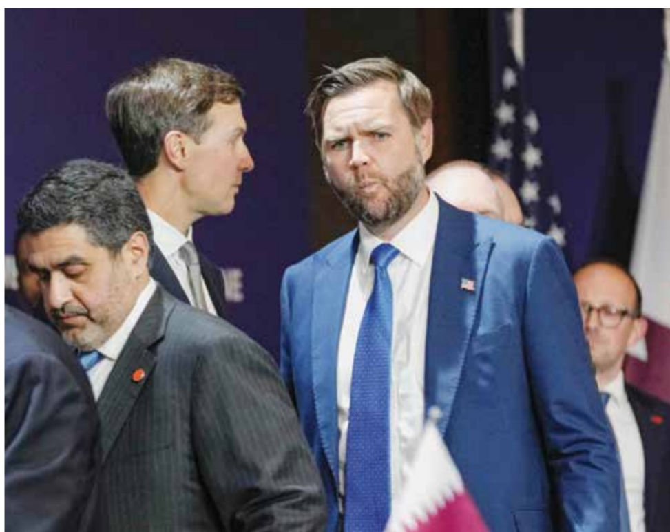
○ فانس مستمعاً إلى كوشنر خلال المحادثات بمشاركة إيران وأمريكا وباكستان وقطر في سويسرا. (أ ف ب)

جنييف - (د ب أ): قال نائب الرئيس الأمريكي جيه دي فانس إن «تقدماً كبيراً» قد تحقق بالفعل في المحادثات بين مسؤولين أمريكيين وإيرانيين في سويسرا، والتي تهدف إلى التوصل إلى اتفاق سلام طويل الأمد.