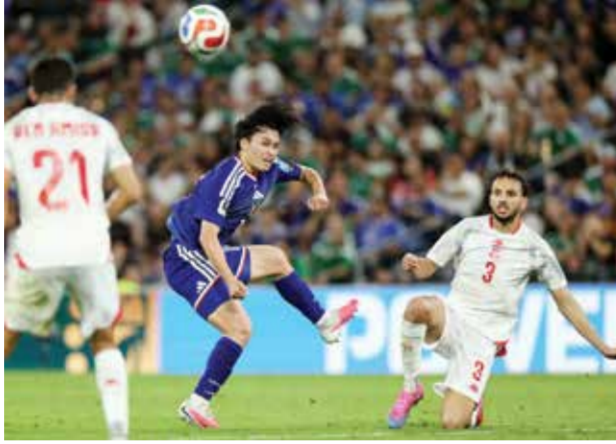
○ من مباراة اليابان وتونس

وذكرت صحيفة «الشروق» عبر موقعها الإلكتروني «بعد تأكد خروج المنتخب فإن هدفه في المباراة المقبلة هو إنهاء مشاركته بصورة مشرفة أمام المنتخب الهولندي قبل العودة إلى أرض الوطن».