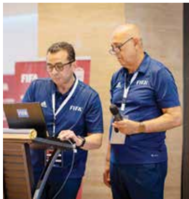
○ جانب من الورشة.

الغنية التي تغطي جوانب كثيرة وشاملة متعلقة بكرة القدم للهواة. وأضاف: «تعد هذه الورش والدورات المتخصصة ركيزة أساسية وعاملاً جوهرياً في تحقيق التطوير المنشود الذي نسعى إليه جميعاً؛ لما تقدمه من أدوات وحلول تساهم في الارتقاء بالمنظومة الرياضية».