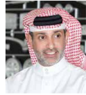
○ الشيخ سلمان بن عيسى آل خليفة.

أعلنت حلبة البحرين الدولية «موطن رياضة السيارات في الشرق الأوسط»، تعيين أحمد سامي التاجر مديراً تنفيذياً لإدارة المرافق. ويمتلك التاجر خبرة تمتد لأكثر من خمسة عشر عاماً في مجالات تطوير البنية التحتية والتخطيط الاستراتيجي وإدارة المشاريع.