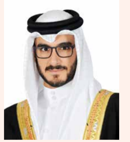
سمو الشيخ عيسى بن سلمان بن حمد آل خليفة