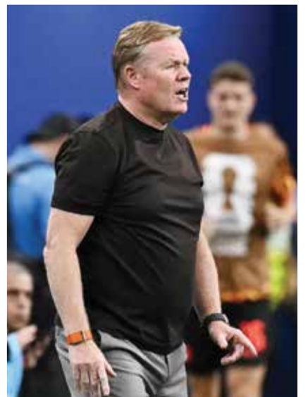
○ كومان (أ ف ب)

هيوستن - (أ ف ب): رأى مدرب منتخب هولندا رونالد كومان في فريقه قدرة على «يكون خطيرا جدا» في الهجوم، بعد الفوز الكبير على السويد 5-1 السبت في هيوستن ضمن الجولة الثانية من منافسات المجموعة السادسة لمونديال 2026. وكان المنتخب الهولندي فعلا جدا أمام المرعي، بفضل براين بروبي وكودي خاكبو اللذين سجل كل منهما ثنائية. وقال كومان في المؤتمر الصحفي عقب المباراة «إذا نظرتم بتفصيل أكبر إلى الأهداف التي سجلناها، فإن ذلك سيتسبب بالخشية لدى منافسينا: الطريقة التي جاءت بها هذه الأهداف، في الهجمات المرتدة، مع الكثير من السرعة والجودة، تُظهر أننا يمكن أن نكون خطيرين جدا». وأضاف «بإمكاننا ربما اكتساب الثقة من الطريقة التي لعبنا بها، وأيضا التعلم من فتراتنا الأقل جودة في هذه المباراة». وأوضح أن إشراك بروبي أساسيا جاء لأن طبيعة المنافس كانت تتطلب وجود مهاجم رأس حربة أكثر. لاعب