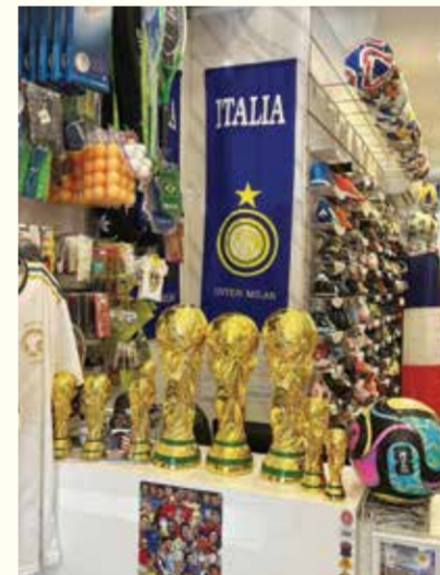
○ جانب من المعروضات.

تأسس مشروع يلو سبورت في عام 2020 كمبادرة بحرينية انطلقت من فكرة بسيطة وطموح كبير، وتمكن خلال فترة وجيزة من ترسيخ اسمه وبناء قاعدة واسعة من الثقة داخل مملكة البحرين وخارجها، بفضل التزامه بتقديم منتجات عالية الجودة والاهتمام بأدق التفاصيل التي تلبى تطلعات العملاء.