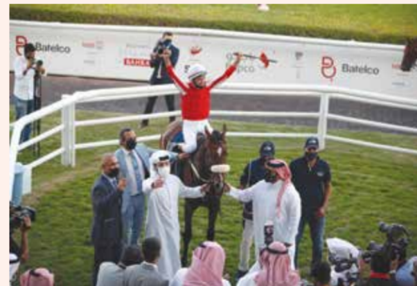
لقطة من كأس البحرين الدولي الثانية 2020

المشاركات الدولية من خلال استقطاب نخبة من الإسطبلات والملاك والمدربين والفرسان العالميين، مما أسهم في رفع تصنيف السباق إلى المستوى الدولي الثاني (Group 2) في عام 2023، قبل أن يواصل مسيرة نجاحاته هذا العام بحصوله على أعلى تصنيف دولي (Group 1) في فترة قصيرة نسبياً ليكون ضمن أبرز وأعرق سباقات الخيل في العالم.