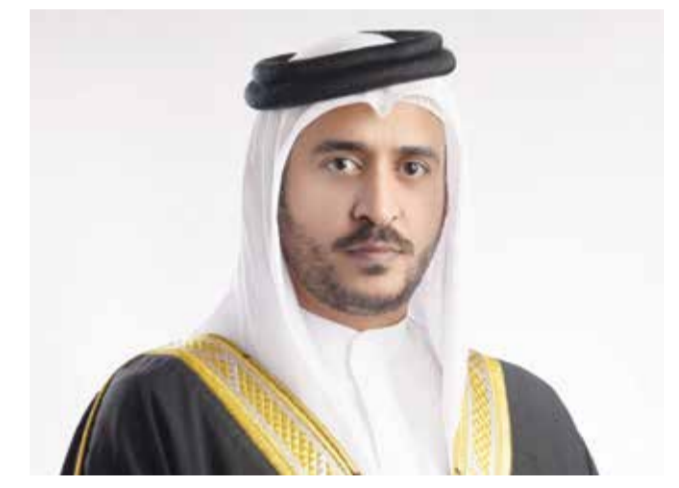
سمو الشيخ خالد بن حمد آل خليفة.

تحت رعاية سمو الشيخ خالد بن حمد آل خليفة النائب الأول لرئيس المجلس الأعلى للشباب والرياضة ورئيس الهيئة العامة للرياضة رئيس اللجنة الأولمبية البحرينية، تستضيف مملكة البحرين مؤتمر البحرين الثاني للسكري والسمنة بالتعاون مع شركة أديوكيشن بلاس، وذلك خلال يومي 1 و2 أكتوبر 2026 بمشاركة نخبة من الخبراء والمتخصصين والأكاديميين من داخل المملكة وخارجها لمناقشة أحدث المستجدات العلمية في مجال السكري والسمنة وسبل تعزيز الوقاية وأنماط الحياة الصحية. وقتها من جانب شركة أديوكيشن بلاس الدكتور أمين عبدالله المدير العام لشركة أديوكيشن بلاس، وذلك بحضور عدد من ممثلي الجهات والشركاء الفاعلة بين مختلف الجهات الصحية والأكاديمية والمجتمعية. وأضاف أن المؤتمر سيستهدف في رفع مستوى الوعي الصحي وتعزيز تبني أنماط الحياة الصحية، بما ينعكس إيجاباً على صحة الأفراد والأجيال القادمة.