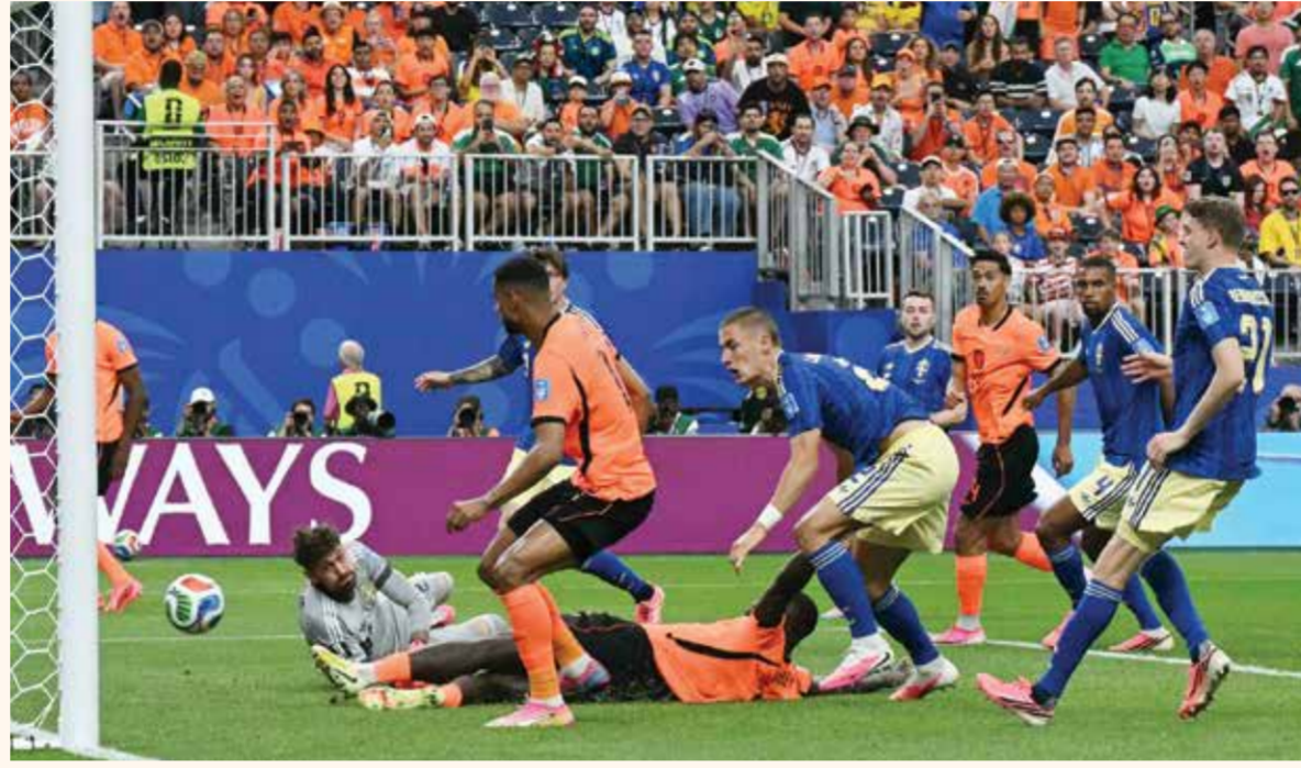
هدف جاكوبو في مرمى السويد

وأعدت هذه الإصابة العضلية القلق داخل أوساط «سيلساو» ومدربه الإيطالي كارلو أنشيلوتي بشأن حالة رافينيا الذي عانى في الأشهر الأخيرة من مشاكل بدنية متكررة على مستوى الفخذين.