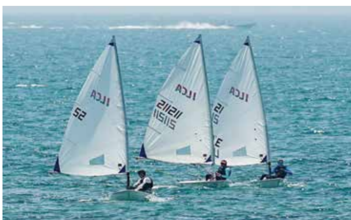
○ جانب من منافسات سابقة.

وشؤون الشباب رئيس المجلس الأعلى للشباب والرياضة وسمو الشيخ خالد بن حمد آل خليفة النائب الأول لرئيس المجلس الأعلى للشباب والرياضة رئيس الهيئة العامة للرياضة رئيس اللجنة الأولمبية البحرينية على دعمهما اللامحدود للرياضة بشكل عام والرياضات البحرية بشكل خاص.