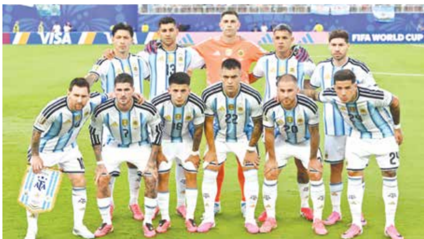
○ منتخب الأرجنتين.