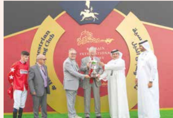
لقطة من تتويج كأس البحرين الدولي الخامسة 2023