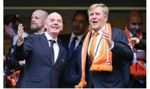
إيفانغيتينو مع ملك هولندا.

؟واختتم علاء حديثه بالإشارة إلى الجاهزية التامة وتركيز جميع اللاعبين الـ26 الموجودين في معسكر المنتخب، موضحاً أن أي لاعب يقرر المدير الفني استدعائه للمشاركة سيكون على قدر المسؤولية بفضل الدعم الكامل والثقة الكبيرة التي يمنحها الجهاز الفني لجميع عناصر القائمة.