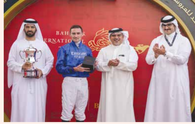
لقطة من تتويج كأس البحرين الدولي الرابعة 2022