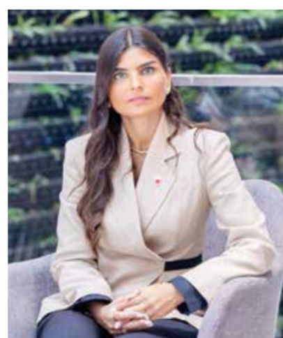
رئيسة هيئة البحرين للسياحة.

تنشط الحركة السياحية ودعم القطاعات الاقتصادية المرتبطة بها. وقالت الرئيس التنفيذي لهيئة البحرين للسياحة والمعارض سارة بوجحي إن برنامج صيف البحرين لهذا العام يأتي ضمن رؤية الهيئة الرامية إلى تقديم تجارب سياحية وترفيهية متكاملة تناسب مختلف الأعمار والاهتمامات، وتعكس ما تتمتع به المملكة من تنوع في المقومات السياحية والثقافية والترفيهية. وأضافت: «حرصنا على إعداد برنامج متكامل يجمع بين الفعاليات الكبرى والأنشطة العائلية والتجارب الثقافية والترفيهية، بما يوفر للزوار والمقيمين خيارات متنوعة على امتداد الموسم الصيفي.