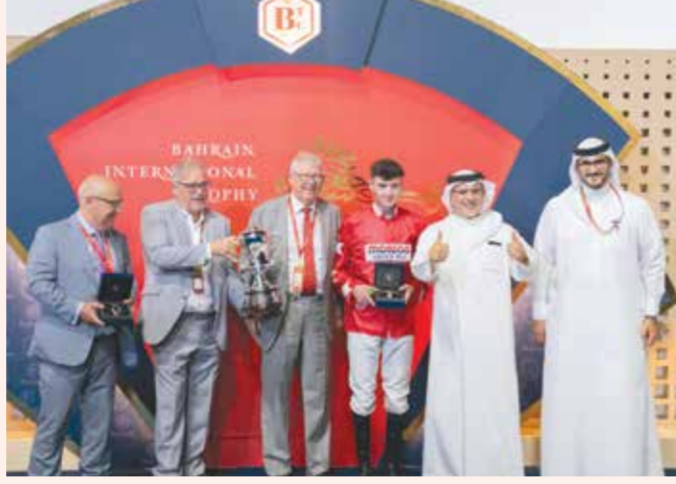
لقطة من تتويج كأس البحرين الدولي الخامسة 2024