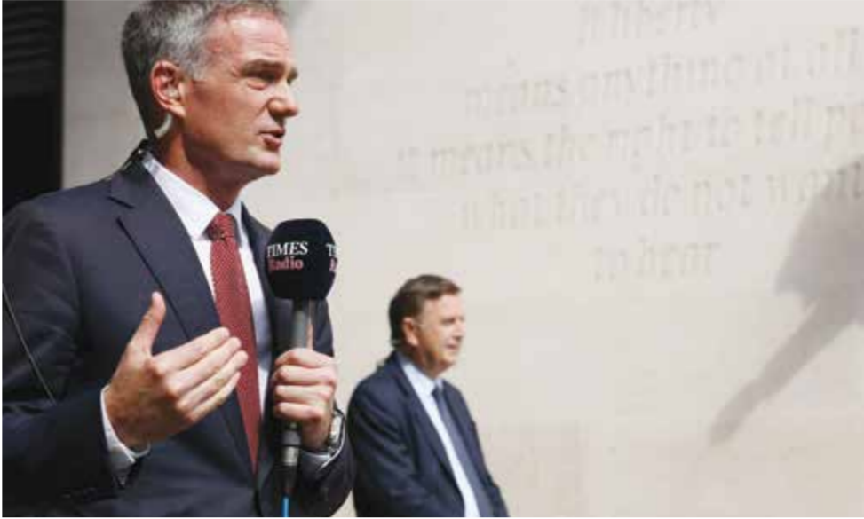
○ وزير الأعمال والتجارة البريطاني بيتر كابل يتحدث إلى الصحفيين بشأن ستارم خارج مقر الي بي سي وسط لندن. (أ ف ب)

بالاستقالة. ويحاول ستارم الذي تولى السلطة في يوليو 2024 البقاء في الحكم منذ أشهر في ظل ولاية شابتها العديد من الأخطاء والتحوّلات في السياسات والفضائح والاستقالات في صفوف الوزراء.