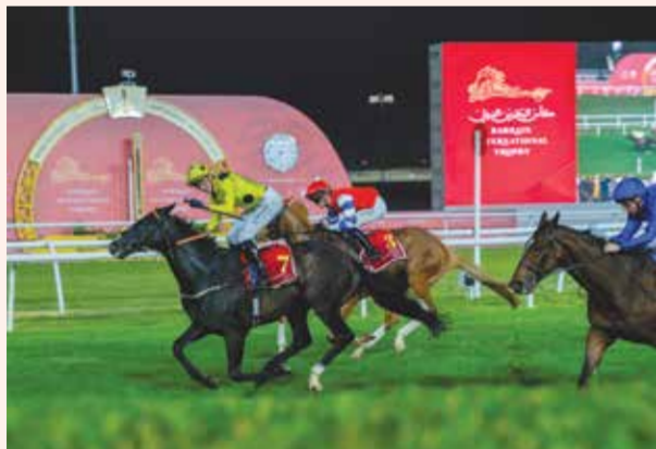
لقطة من كأس البحرين الدولي السابعة 2025

وأشار سموه إلى أن هذا الإنجاز يعكس ما تمتلكه مملكة