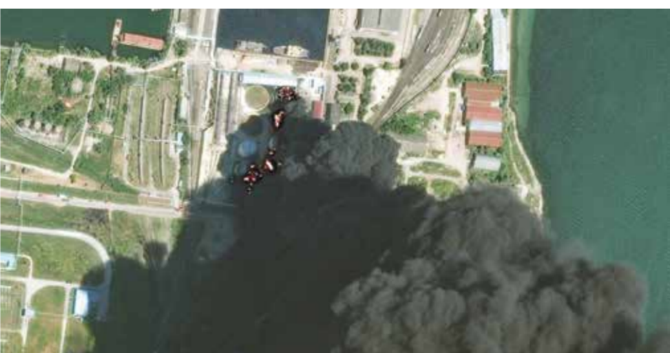
○ عمود كثيف من الدخان يتصاعد من المنشأة نفطية في القرم بعد أن استهدفتها ضربات أوكرانية.

قريبة ثلث أنشطة تكرير النفط في روسيا. ومن الجانب الأوكراني، قتل ثلاثة أشخاص جراء ضربات روسية على منطقتي بولتافا ودينيبوربتروفسك. وقال أولكسندر غانزا رئيس الإدارة العسكرية المحلية في إقليم دنيبوربيتروفسك في منشور على تلغرام «قتل شخص وأصيب تسعة آخرون» في عمليات قصف وهجمات بمسبّرات وقصف مدفعي على ثلاث مناطق في الإقليم.