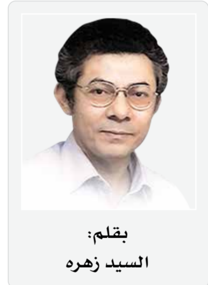
بقلم: السيد زهره

أمن واستقرار الخليج العربي لم يعد في صلب اهتمامات أمريكا