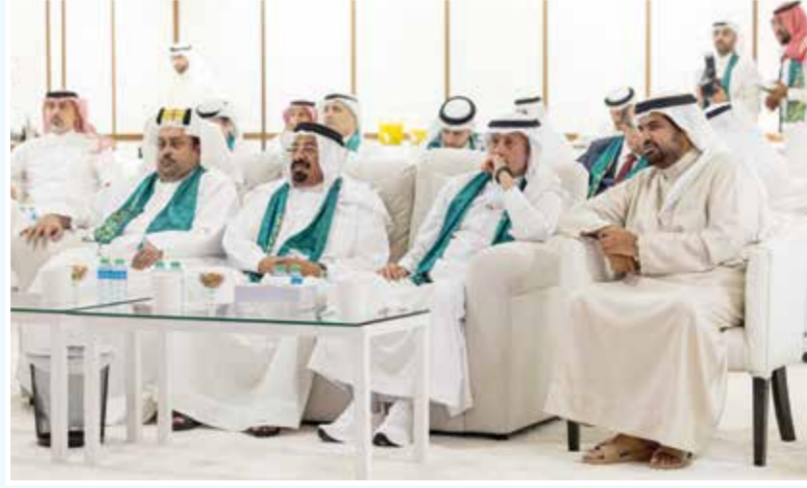
○ سموه يتابع اللقاء.

الشقيقة لحضور هذه المباراة في كأس العالم 2026، ونتمن الجهود التي تبذلها السفارة في تعزيز التواصل المجتمعي والرياضي بين البلدين الشقيقين» وأضاف سموه: «العلاقات البحرينية السعودية نموذج راسخ للأخوة والتعاون في مختلف المجالات، والرياضة تمثل أحد الجسور المهمة التي تعزز هذه العلاقات وتدعم