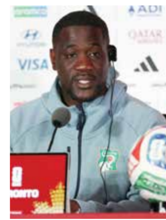
○ فاي. (أ ف ب)

تورونتو - (د ب أ): قال إيميرس فاي، المدير الفني لمنتخب كوت ديفوار لكرة القدم، إن المنتخب الألماني افتقد الروح الرياضية في المباراة التي جمعتها مساء السبت. وقال فاي في المؤتمر الصحفي بعد المباراة: «ننظر إلى هذه المنتخبات كنماذج تساعدنا على التطور، وقد شعرت بخيبة أمل بسبب افتقاد الروح الرياضية التي أظهرها هذا المنتخب الألماني». وقال المنتخب الألماني 2 / 1 بهدف دينيز أونداف في الوقت بدل الضائع ولكن فاي كان غاضباً بشكل أساسي من حادثة وقعت في