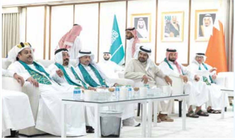
○ حضور رسمي كبير.

قيم التقارب والتفاهم بين الشعوب» وفي ختام الزيارة، أعرب سمو الشيخ عيسى بن علي آل خليفة عن تمنياته التوفيق للمنتخب السعودي فيما تبقى من مشواره بكأس العالم، وأن يواصل تقديم المستويات المشرفة التي تعكس تطور كرة القدم السعودية ومكانتها على الساحة الدولية.