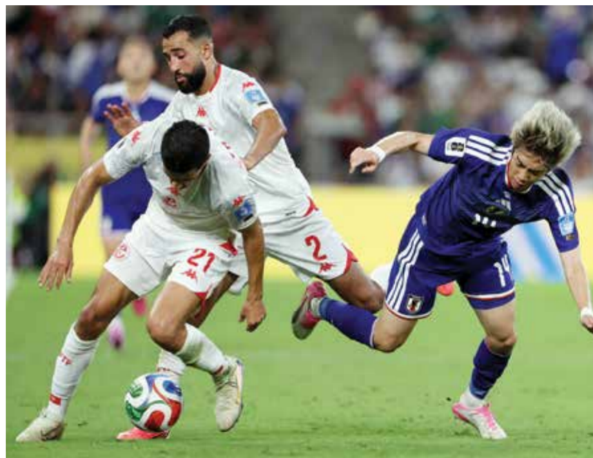
○ من مباراة اليابان وتونس

عنها تاكيفوسا كويو المصاب. وفي 151 مباراة سباقية شاركت فيها منتخبات من آسيا في كأس العالم، لم يسبق لأي منتخب أن سجل أربعة أهداف في مباراة واحدة.