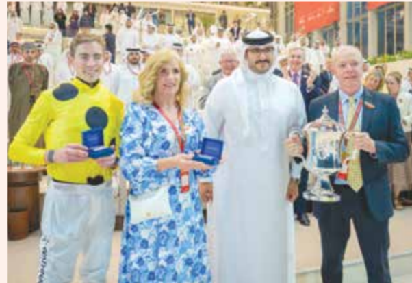
لقطة من تتويج كأس البحرين الدولي السابعة 2025