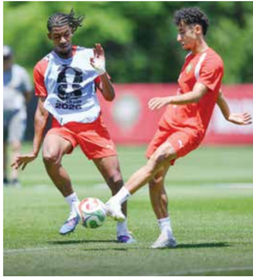
○ من تدريبات المغرب