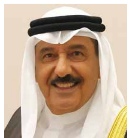
○ الشيخ خليفة بن عبدالله آل خليفة.

أعرب الشيخ خليفة بن عبدالله آل خليفة رئيس الاتحاد البحريني للرياضات البحرية عن اعتزازه بتنظيم النسخة 32 من بطولة البارح الدولية للشراع والتي ستقام خلال الفترة من 23 لغاية 27 يونيو الجاري على ساحل بلاج الجزائر. ورحب الشيخ خليفة بن عبدالله آل خليفة بجميع المشاركين من الدول الشقيقة والصديقة في بطولة البارح الدولية إحدى أهم البطولات العربية والتي أقيمت على مدى 31 عاماً بكل تميز ونجاح لما تحمله من أهمية في هذا الوقت كل عام والذي تهب فيه رياح البارح الموسمية. وأضاف «نحتفل هذا العام بانطلاق النسخة 32 من بطولة البارح الدولية التي تحمل العديد من المنافع بالإضافة إلى استغلال هذا الوقت من كل عام في التنقل بالسفن للهند وأفريقيا منذ مئات