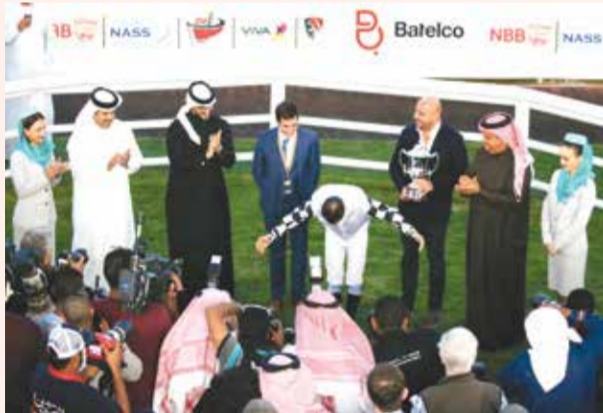
لقطة من تتويج كأس البحرين الدولي الأولى 2019