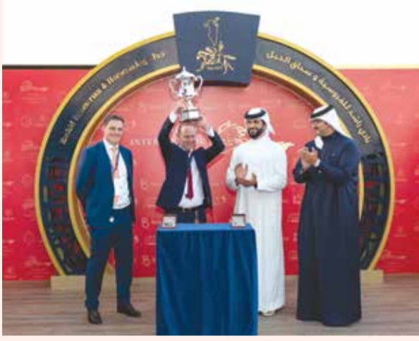
لقطة من تتويج كأس البحرين الدولي الثالثة 2021