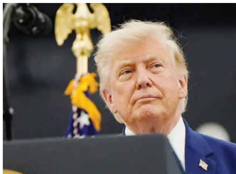
○ دونالد ترامب.

(العربية. نت): هدد الرئيس الأمريكي دونالد ترامب مجدداً بتدمير إيران إذا لم يتم التوصل إلى اتفاق، أمس، رغم بدء المفاوضات المباشرة بين أمريكا وإيران في بورغنشتوك في سويسرا.