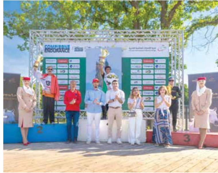
○ جانب من التتويج.