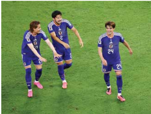
○ سيكو يحتفل مع زملائه

واللعب بأسلوبه المعتاد، واختتم بالقول إنه تلقى تهينة من زملائه بعد المباراة، مؤكداً أن التواصل بينهم مستمر وأن الجميع يدعم بعضه البعض داخل المنتخب.