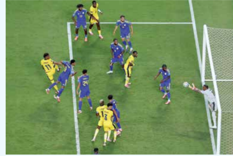
○ روم بيتسدي لإحدى الهجمات.

وهي النقطة الأولى لكوراساو بعد خسارتها المذلة أمام ألمانيا 7-1 افتتاحاً، كما هي الأولى لإكوادور بعد خسارتها أمام ساحل العاج 0-1، فتعقدت مهمتها في تحطى الدور الأول حيث ستلاقي في الجولة