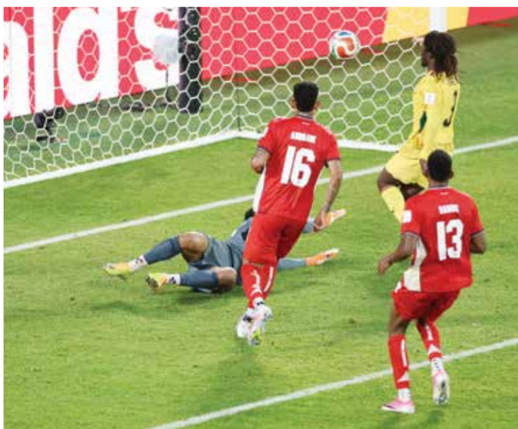
○ بيرينكي يسجل هدف الفوز (أ ف ب)

تورونتو - (أ ف ب): حقق منتخب غانا فوزا قاتلا على بنما 1-0 في تورونتو، ضمن الجولة الأولى من منافسات المجموعة 12 لمونديال 2026 المقام في أمريكا الشمالية.