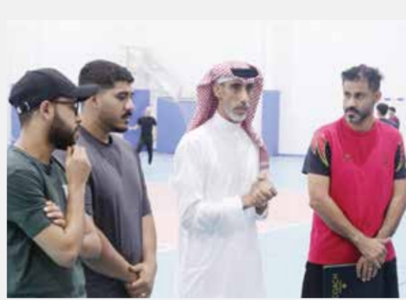
○ جانب من الزيارة

والإداري، مؤكداً حرص مجلس إدارة الاتحاد على توفير كل المتطلبات التي تسهم في نجاح مشاركة البحرين بالصورة المشرفة.