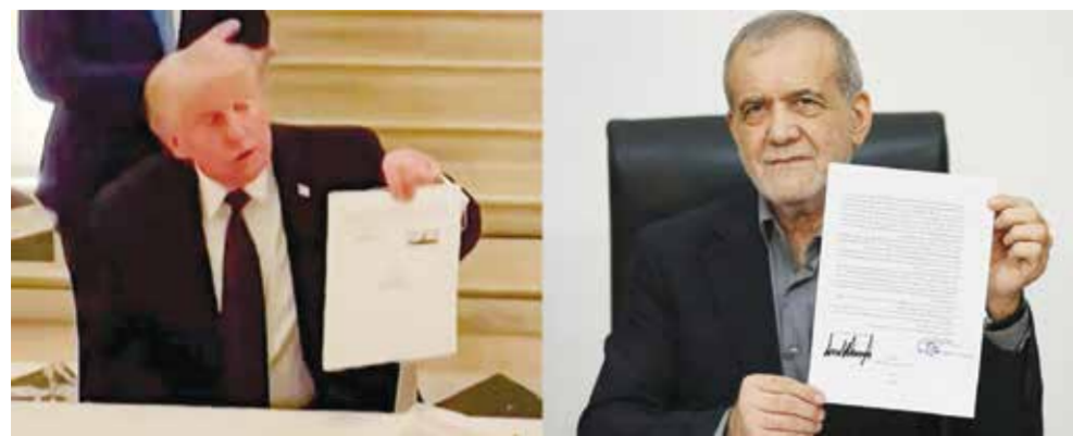
○ رئيسا إيران وأمريكا يعرضان مذكرة التفاهم بعد التوقيع.

سمحت بتجاوز 12 سفينة على الأقل الحصار الأمريكي بعد التفاهم مع طهران. يذكر أن أسعار النفط العالمية تراجعت بعد توقيع الرئيس الأمريكي دونالد ترامب ونظيره الإيراني مسعود برزشكيان مذكرة تفاهم لإنهاء الحرب وإعادة فتح مضيق هرمز أمام ناقلات النفط وغيرها من السفن. وأدت الحرب إلى ارتفاع أسعار الطاقة بشكل كبير، بعد أن شملت الإجراءات الإيرانية إغلاق الممر المائي الجيوي الذي يمر عبره عادة خمس إمدادات النفط والغاز العالمية.