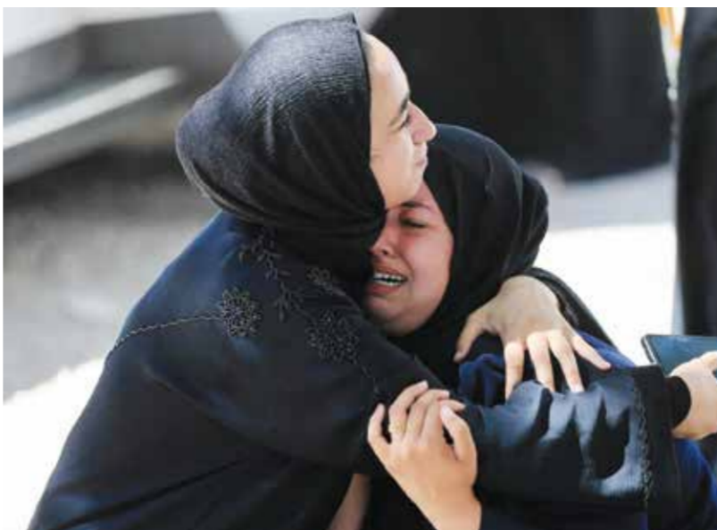
○ الأحران لا تتوقف في غزة. (رويترز).

وأضافت «هاجمت قوتان نوويتان دولة لا تملك أسلحة نووية وأجبرت القوتان النوويتان على إيقاف الحرب». ورأت أنه كان من الواضح بالتالي أن «الأسلحة النووية لم تجلب الأمن ولا التفوذ. كل ما فعلته هو