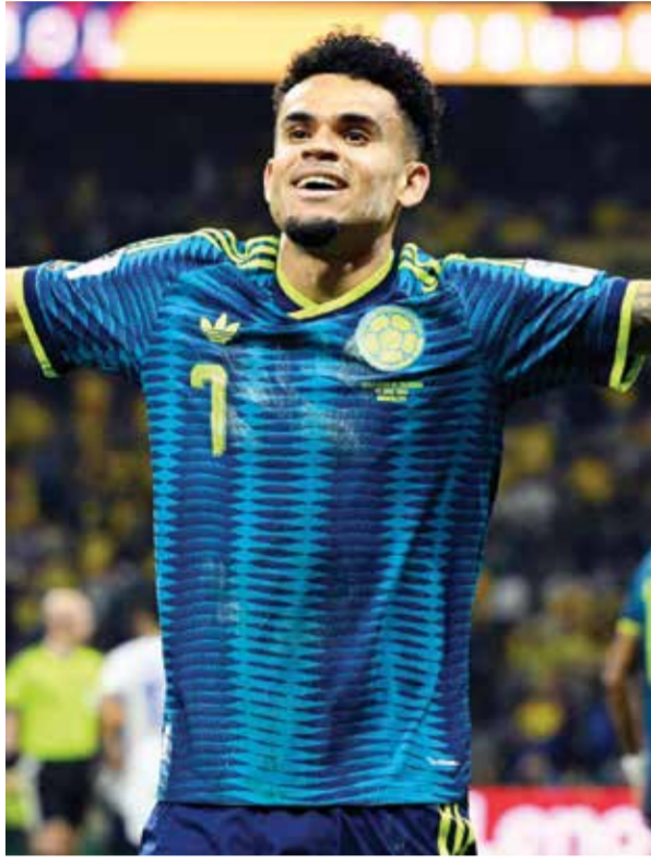
○ دياز. (أ ف ب)