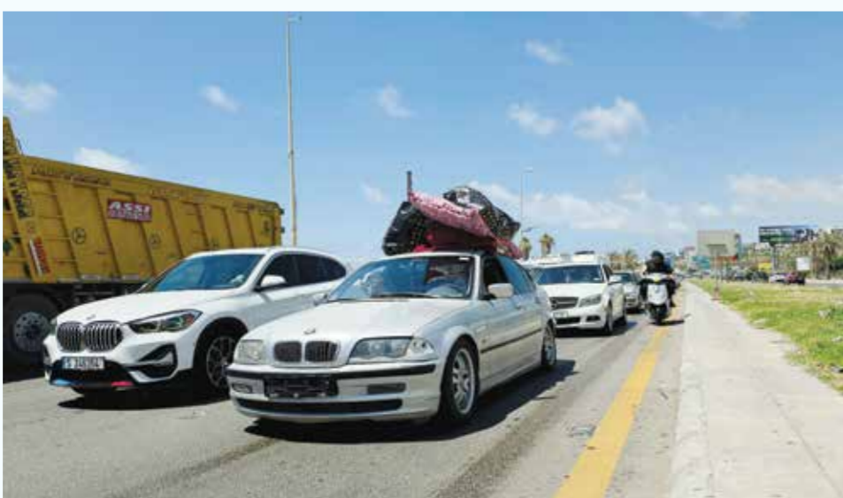
○ لبنانيون يقصدون العودة إلى ديارهم في صيدا بعد التوصل للاتفاق الأمريكي الإيراني.

جميع هذه المحاولات عبر استهداف تحركات وتحشدات العدو بالصواريخ والسيارات والمركبات الانتحافية». وفي إسرائيل، أعلن الجيش أمس مقتل أحد جنوده الأربعة خلال القتال الدائر في جنوب لبنان الذي أدى أيضاً إلى إصابة سبعة جنود آخرين. ودعا المسؤول العسكري الإسرائيلي منذ أربعة أيام، التقدّم باتجاه بلدة كفرتينبنت ومنطقة علي الطاهر عبر أكثر من مسار مدعوماً بصصف مدفعي عنيف يستهدف المنطقة»، موضحاً: «تصدّى مجاهدو المقاومة الإسلامية