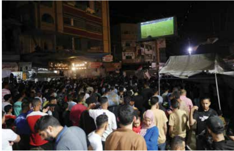
○ فلسطينيون يتابعون مباريات المونديال.

النسخة الحالية برصيد 10 أهداف مدفوعة بالفوز الكبير للسويد على تونس 5/1، متقدمة على المجموعة الخامسة التي شهدت فوزا كاسحا لألمانيا على كوراسو بنتيجة 7/1، والمجموعة التاسعة التي شهدت فوز فرنسا على السنغال 3/1، والنرويج على العراق 4/1. وتساهلت المجموعات الرابعة والعاشر والثانية عشرة بـ 7 أهداف لكل منها. بالمقابل، تذيلت المجموعة الثامنة التي تضم إسبانيا أحد أكبر المرشحين للتتويج باللقب وأوروغواي والسعودية، وكاب فسادري، التصنيف، حيث لم تعرف تسجيل سوى هدفين فقط. وراء