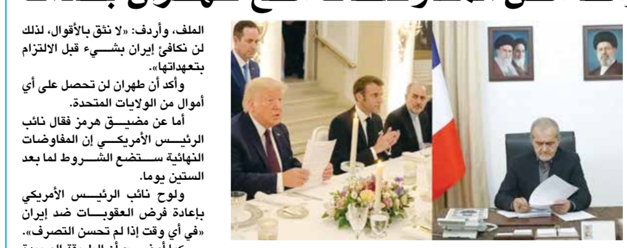
○ صورة وزعها البيت الأبيض لتوقيع الرئيسين الأمريكي والإيراني على الاتفاق.

«وقد تكون يوم الأحد»، وأكد فانس أنه في حال لم يتغير إيران سلوكها فإن الولايات المتحدة ستلتجأ إلى «طرق أخرى»، مؤكداً أن بلاده «ستنفوز في كل الحالات»، فيما شدد على أن الإيرانيين يدركون حجم الضغوط والأوراق التي تمتلكها الولايات المتحدة في هذا