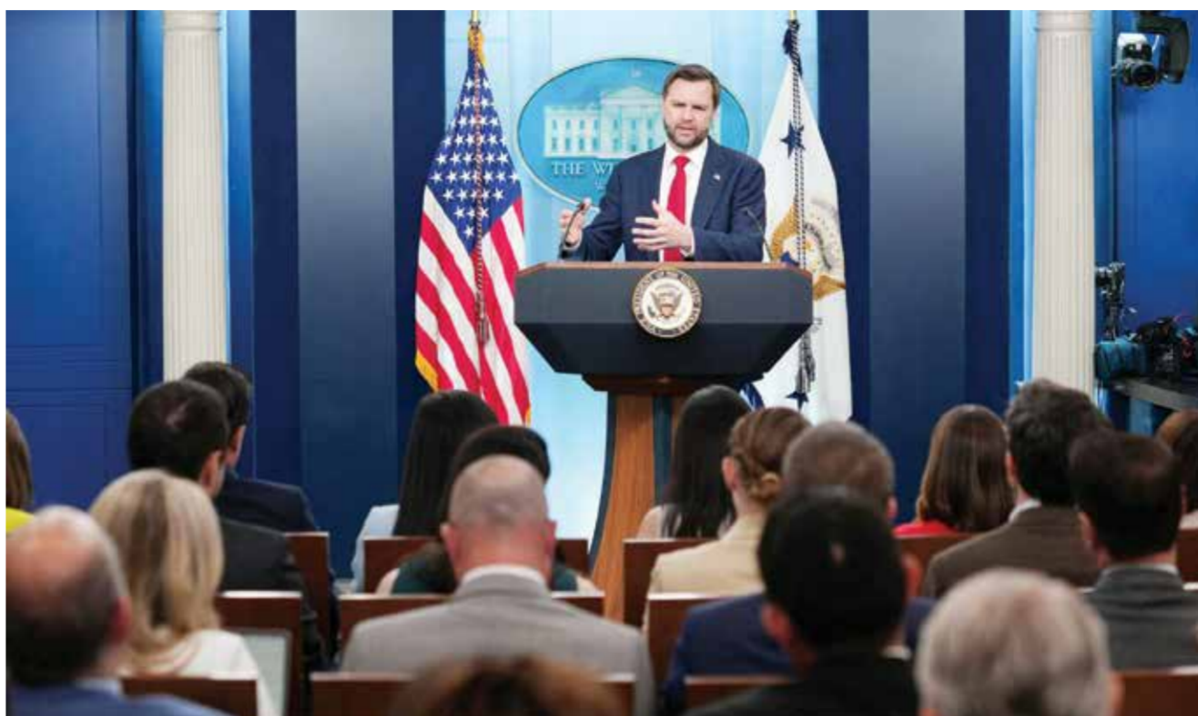
○ فانس خلال المؤتمر الصحفي.

(العربية.نت): أعلن نائب الرئيس الأمريكي جي دي فانس، أمس، أن فترة الـ60 يوما من المفاوضات مع إيران بدأت رسمياً، مشيراً إلى أن واشنطن تتعامل مع الملف الإيراني وفق مقاربة مختلفة تماماً عن الاتفاق الذي تم التوصل إليه في عهد الرئيس الأسبق باراك أوباما.