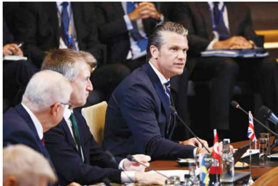
○ هيغسيث لدى مشاركته في اجتماع وزراء حلف الناتو في بروكسل. (أ ف ب).

موسكو - (أ ف ب): نفذت أوكرانيا أمس الخميس هجوماً بطائرات مسيرة على موسكو، في أكبر استهداف للعاصمة الروسية منذ سنوات، ما أدى إلى اندلاع حرائق داخل المدينة وفي محيطها. وشمل الهجوم مصفاة نفط كبرى وتسبب بإجلاء ركاب من أكبر مطارات العاصمة، على ما أفاد مسؤولون. وشاهد مراسلو وكالة فرانس برس أعمدة كبيرة من الدخان الأسود فوق سماء العاصمة الروسية، بينما شوهدت ألسنة اللهب تشتعل في قسم من منشأة نفطية في منطقة كابوتنيا الجنوبية. وتساعدت أعمدة الدخان فيما استمر الحريق في المصفاة طوال الفترة الصباحية. وتزامنت هذه الضربات مع استضافة الرئيس الروسي فلاديمير بوتين قيادة من جنوب شرق آسيا ضمن قمة روسيا-آسيان المنعقدة في مدينة كازان التي تبعد حوالي 700 كيلومتر شرق العاصمة. وقال الرئيس الأوكراني فولوديمير زيلينسكي عبر مواقع التواصل إن الهجوم هو «رد منيرز تماماً على الهجمات الروسية على مدننا ومجتمعنا، فضلاً عن كونه نتيجة مهمة أخرى لعملياتنا مقاتلتنا ضد المنشآت التي تدعم آلة الحرب الروسية». وفي وقت لاحق، قال زيلينسكي إن «الأمم هو أن يبدأ