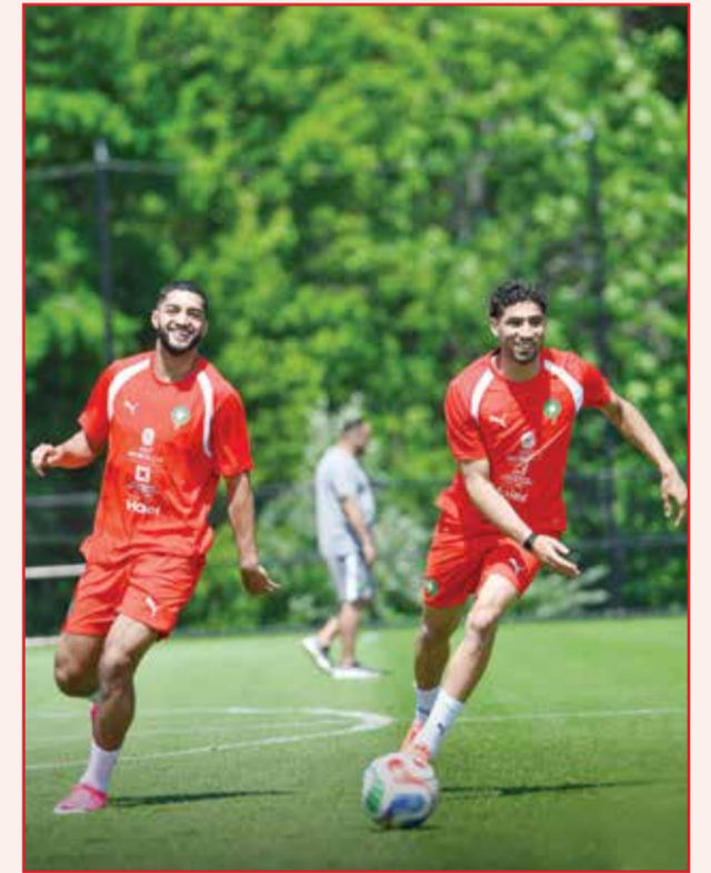
○ تدريبات المغرب.

التسديدات في المجموعة (15)، إلى جانب 22 لمسة داخل منطقة جزاء الخصم.