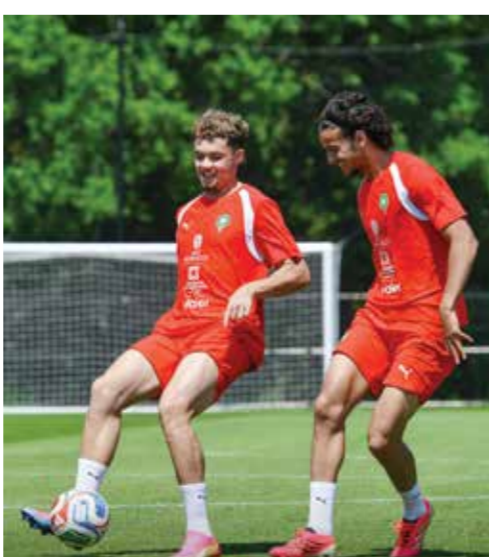
○ تدريبات المغرب.

ويعني المغرب النفس بتكرار عرضه الرائع أمام البرازيل مع فعالية كبيرة أمام المرعى لعدم السقوط في فخ مواجهة سيليساو، عندما أهدر العديد من الفرص وخصوصا في الشوط الاول وخرج بنقطة واحدة.