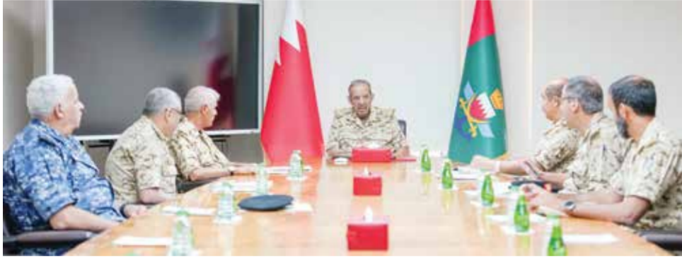
○ القائد العام خلال اجتماعه مع عدد من كبار الضباط.