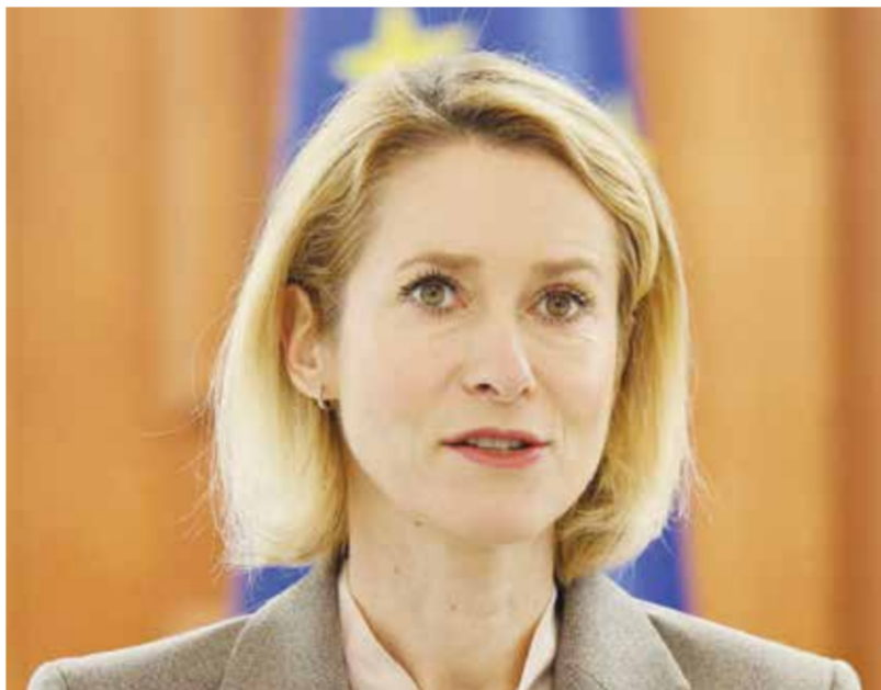
○ كايا كالاس. (رويترز).

القدس المحتلة - (أ ف ب): أعلنت إسرائيل أمس الخميس قطع التواصل مع مسؤولة السياسة الخارجية للاتحاد الأوروبي كايا كالاس على خلفية تصريحات نسبت إليها، قارنت فيها بين إسرائيل ونظام الفصل العنصري في جنوب إفريقيا. وقال وزير الخارجية الإسرائيلي جديعون ساعر عبر منصة إكس: «نشر أنه وخلال زيارتها (كالاس) إلى المكسيك قارنت إسرائيل بنظام الفصل العنصري الذي كان قائماً في جنوب إفريقيا».