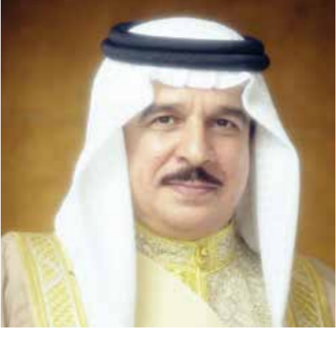
○ جلالة الملك المعظم.

قصيدة مهداة إلى حضرة صاحب الجلالة الملك حمد بن عيسى آل خليفة المعظم حفظه الله ورعاه