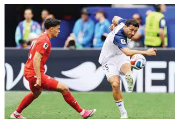
○ جانب من المباراة.

لوس أنجلوس - (أ ف ب): اقترب المنتخب السويسري من ضمان تأهله إلى دور الـ 32 في نهائيات كأس العالم 2026 بعد أن حقق باكورة انتصاراته بفوزه الكبير على البوسنة والهرك المنقوصة 4-1 أمس على ملعب «لوس أنجلوس ستادיום»، في لوس أنجلوس في الجولة الثانية من منافسات المجموعة الثانية.