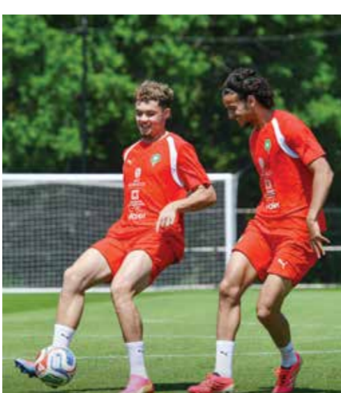
○ تدريبات المغرب.

ويعني المغرب النفس بتكرار عرضه الرائع أمام البرازيل مع فعالية كبيرة أمام المرعى لعدم السقوط في فخ مواجهة سيليساو، عندما أهدر العديد من الفرص وخصوصا في الشوط الأول وخرج بنقطة واحدة.