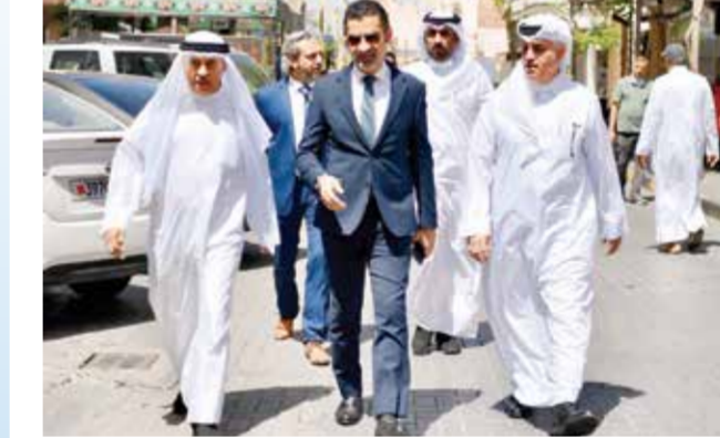
○ وزير البلديات خلال تفقده العاصمة المنامة.

وأوضح أن خطة الوزارة لخدمات النظافة في العاصمة المنامة خلال الموسم تخصيص 300 عامل نظافة، و12 مفتشاً لخدمات النظافة، وتوفير 300 حاوية للمخلفات، و250 سلة مهملات، و7 شاحنات لنقل المخلفات، و10 حاويات