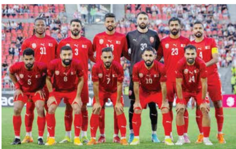
○ المنتخب الوطني

تلقي الاتحاد البحريني لكرة القدم دعوة رسمية من نظيره التايلاندي لمشاركة المنتخب الوطني الأول لكرة القدم في النسخة الثانية والخمسين لبطولة «كأس ملك تايلاند» الدولية الودية، والمقرر إقامتها في تايلاند خلال الفترة 9 وحتى 17 نوفمبر 2026.