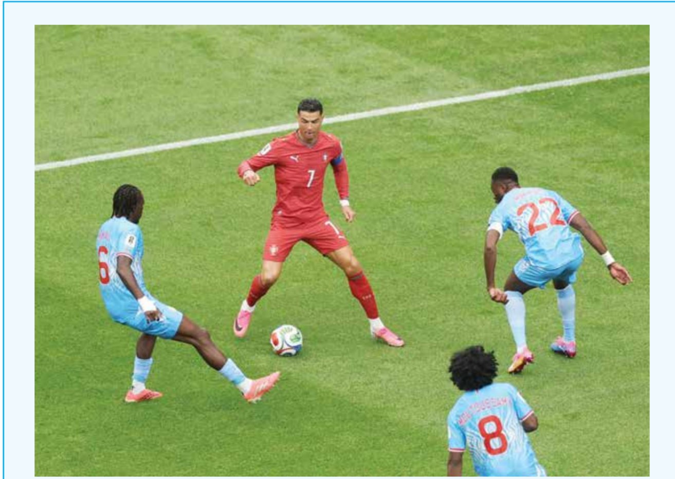
○ موكاو يواجه رونالدو

دالاس - (د ب أ): اشتكى توماس توخل، المدير الفني للمنتخب الإنجليزي، من عدم قدرته على رؤية لاعبيه وهم يرددون النشيد الوطني بسبب كثرة عدد المصورين أمامه، وطالب الاتحاد الدولي لكرة القدم (فيفا) بضرورة التدخل. وقاد المدرب الألماني المنتخب الإنجليزي للفوز على كرواتيا 4 / 2 في افتتاح مشوار الفريقين بطولة كأس العالم 2026. لكن توخل لم يكن سعيدا في أول مباراة له مع الفريق في بطولة كبرى، لأنه لم يتمكن من رؤية لاعبيه أثناء أداء نشيد «فليحفظ الله الملك». وقال توخل في تصريحات، أبرزتها وكالة الأنباء البريطانية (بي إيه ميديا): «أتوسل إلى فيفا بتغيير مكان المصورين أثناء عزف النشيد الوطني، لأنني لم أتمكن من رؤية فرقي أثناء هذه اللحظة». وأضاف: «كنت أنتظر هذه اللحظة الخاصة، ولكن كان يوجد أمامي ما يزيد على 50 مصورا على بعد مسافة قريبة (نصف متر)، لذا لم أتمكن من رؤية لاعب واحد، وهو ما أفسد علي هذه اللحظة الاستثنائية». وختم توخل «إنها لحظة عاطفية للغاية، لم أكن أحلم بها عندما كنت شابا أو في بداية مسيرتي التدريبية». وتوصلت بي إيه ميديا مع فيفا للتعليق على رغبة المدير الفني لمنتخب إنجلترا.