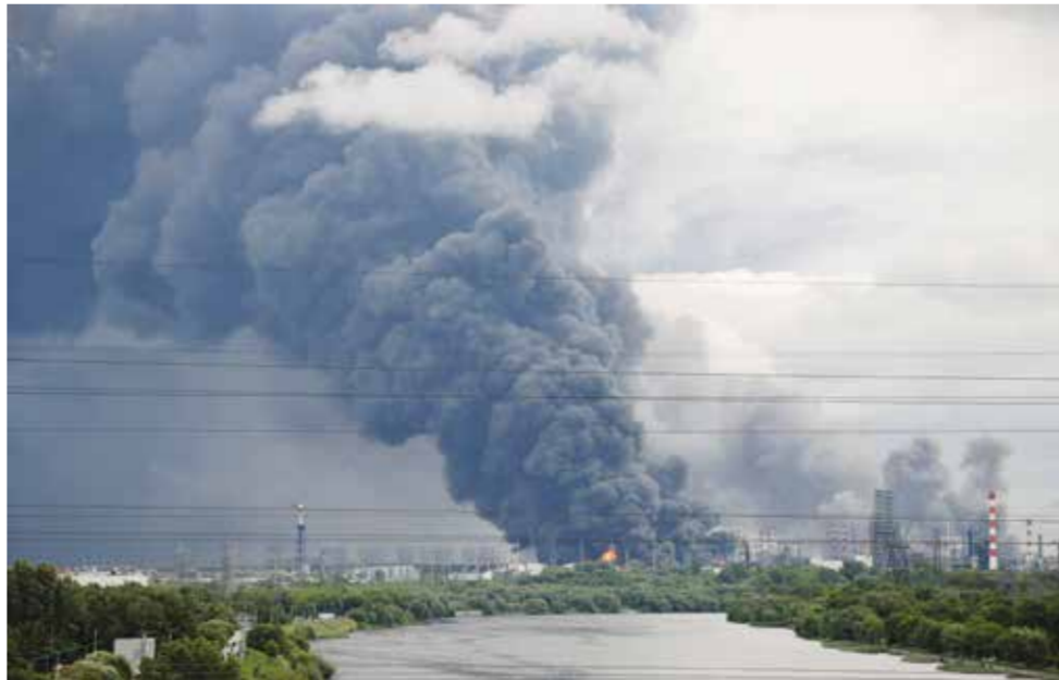
○ دخان كثيف يتصاعد من مصفاة النفط الروسية بعد أن استهدفتها أوكرانيا بالمسيرات. (رويترز).

وإصابة اثنين على الأقل. وكثفت أوكرانيا هجماتها داخل الأراضي الروسية، بما في ذلك على أهداف في العمق الروسي، مستهدفة خصوصاً منشآت نقل المحروقات وتخزينها، في مسعى إلى تقويض قدرة موسكو على تمويل عملياتها العسكرية. والهجوم الأوكراني ليل الأربعاء هو الثاني على مصفاة النفط في موسكو هذا الأسبوع.