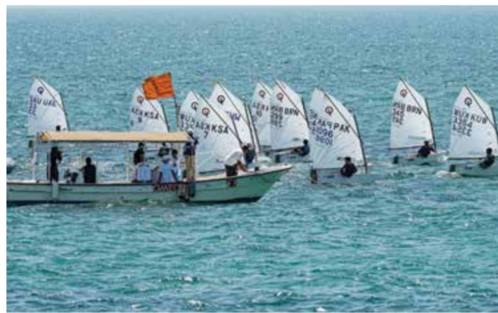
○ جانب من منافسات الشراع.

ويبرز الشعار ثلاثة قوارب شراعية تتقدم نحو الأمام في دلالة على روح