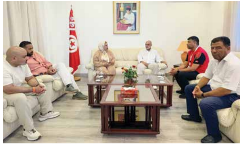
○ جانب من الاستقبال.

الوفد البحريني، زار الشيخ محمد بن دعيج آل خليفة، رئيس اللجنة البارالمبية البحرينية، مقر إقامة وفد الأولمبياد الخاص البحريني بمدينة سوسة، حيث التقى باللاعبين وأعضاء الأجهزة الفنية والإدارية، واطلع على جاهزيتهم واستعداداتهم لخوض منافسات البطولة. وخلال الزيارة، أكد أهمية الظهور بالمستوى المشرف الذي يعكس مكانة مملكة البحرين، داعياً اللاعبين إلى تقديم أفضل ما لديهم من أداء وعطاء داخل المنافسات، واستثمار هذه المشاركة لتحقيق نتائج متميزة تجسد روح الإصرار والعزيمة التي يتمتعون بها، متمنياً لهم كل التوفيق والنجاح في الاستحقاق الإقليمي.