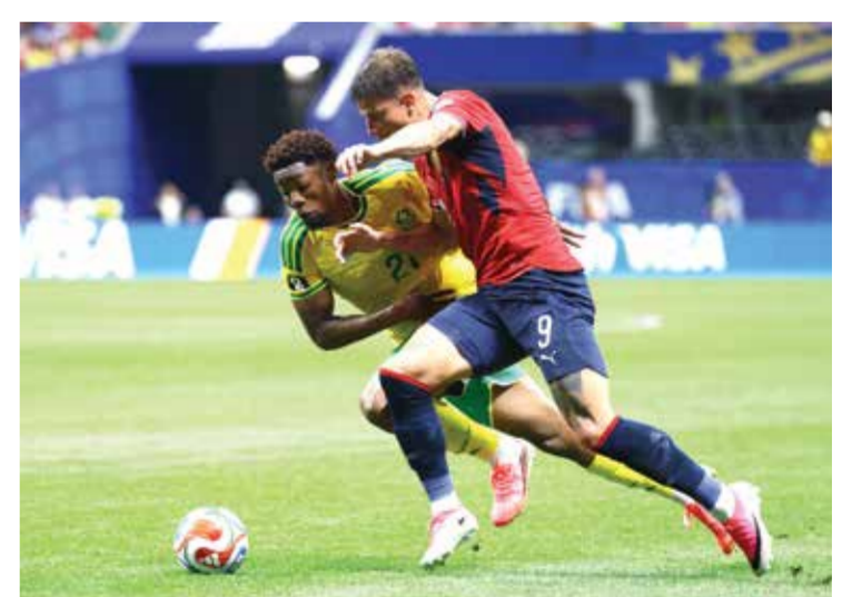
○ جانب من المباراة.

ودخل المنتخبان المباراة على وقع خسارتيهما في الجولة الأولى (تشيكيا أمام كوريا الجنوبية 2-1 وجنوب إفريقيا أمام المكسيك 2-0)، وبالتالي كسبا نقطتهما الأولى قبل لقاء المنافسين الآخرين في وقت لاحق.