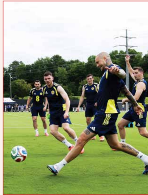
○ تدريبات اسكتلندا.