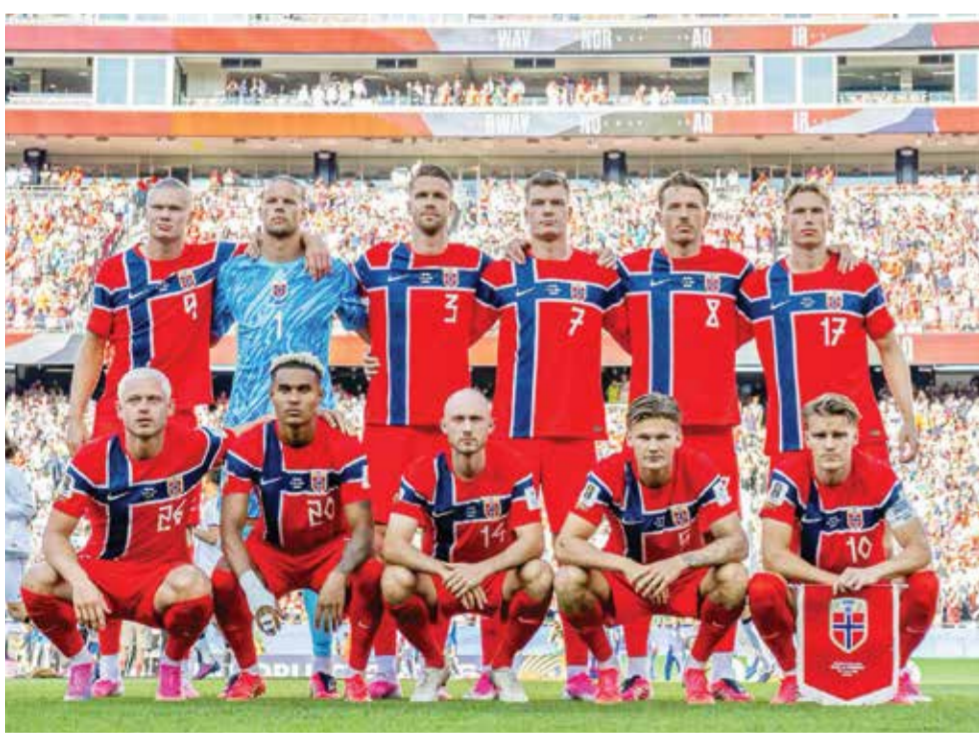
○ منتخب النرويج.

ويضيف «لم أعد أشعر بهذه الحماسة. أشاهد المباريات في مقهى في خيمة. نحن حاليا بانسون...»