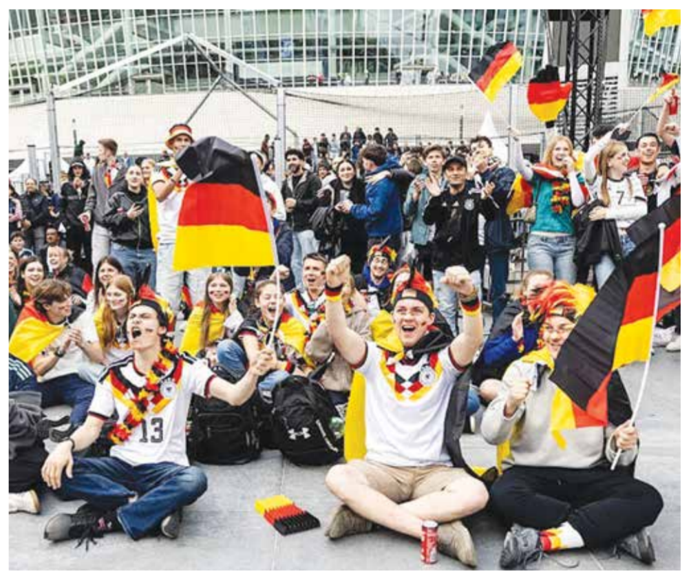
○ مشجعو ألمانيا.

وأبرز ماجر، أن المنتخب الجزائري مازال يمتلك حظوظ التأهل إلى الدور الثاني، لكن شريطة الفوز على الأردن ثم النمسا، داعيا إلى استعادة زمام الأمور.