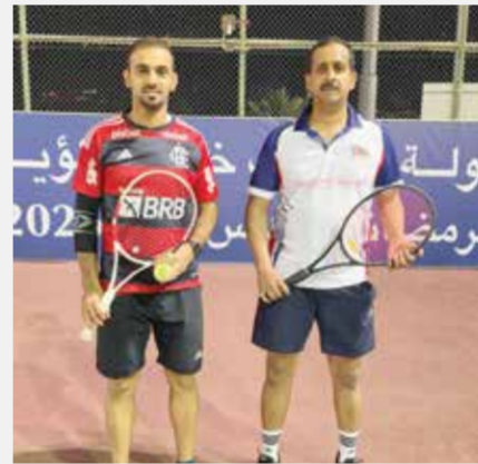
○ من المشاركين في البطولة.

شهدت منافسات بطولة المرحوم ماجد الزباني للتنس، التي ينظمها نادي البحرين للتنس، سلسلة من المباريات القوية التي عكست ارتفاع المستوى الفني للمشاركين واشتداد المنافسة مع اقتراب البطولة من مراحلها الحاسمة.