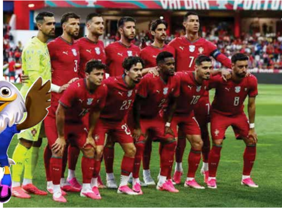
○ منتخب البرتغال.

استعادة مستواهم في الأدوار القادمة. وأعربت البناء عن أمنيّتها في مشاهدة قائد المنتخب البرتغالي كريستيانو رونالدو بأفضل مستوياته خلال البطولة، مؤكدة أن تتويجه بلقب كأس العالم سيكون إنجازاً استثنائياً يضاف إلى مسيرته الحافلة بالنجاحات والبطولات.