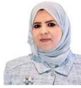
○ دلال الزايد.

أشارت المحامية دلال جاسم الزايد رئيس لجنة الشؤون التشريعية والقانونية بمجلس الشورى إلى توجه مملكة البحرين نحو إصدار قانون خاص لتنظيم الذكاء الاصطناعي يسترشد بالمشروع الأوروبي والقانون الاسترشادي العربي، بما يضمن الاستخدام المسؤول والأمن والشفاف لهذه التقنيات، ويعزز الثقة بالمؤسسات الديمقراطية. مؤكدة أن الذكاء الاصطناعي سيظل أداة مساندة للبرلماني، فيما تبقى المسؤولية السياسية والتشريعية والأخلاقية مسؤولية بشرية في المقام الأول، وأن تبادل الخبرات بين البرلمانات يشكل ركيزة مهمة لتطوير ممارسات تشريعية أكثر حداثة وفاعلية. جاء ذلك خلال مشاركة وفد الشعبة البرلمانية لمملكة البحرين في فعالية افتراضية نظمتها الاتحاد البرلماني الدولي يوم الأربعاء ضمن سلسلة التمكين للبرلمانيين الشباب، حول استخدامات الذكاء الاصطناعي في مجالات العمل البرلماني، وكيفية تسخير أدواته لمساعدة البرلمانيين الشباب في توفير الوقت والعمل بكفاءة وجاهزية أكبر، بما ينعكس على جودة المخرجات التشريعية.