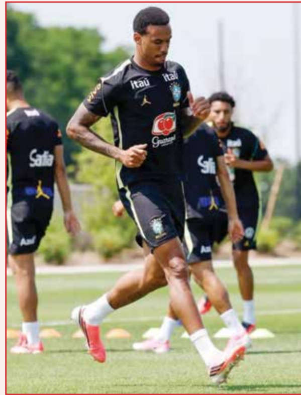
○ تحضيرات البرازيل.