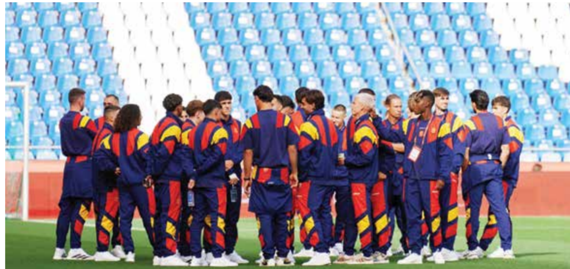
○ تحضيرات إسبانيا.

وفي المجموعة ذاتها، تلعب إيران التي تأثرت مشاركتها بالتوترات الناجمة عن الحرب مع الولايات المتحدة، مع نيوزيلندا في لوس أنجلوس في مواجهة في المتناول نسبياً.