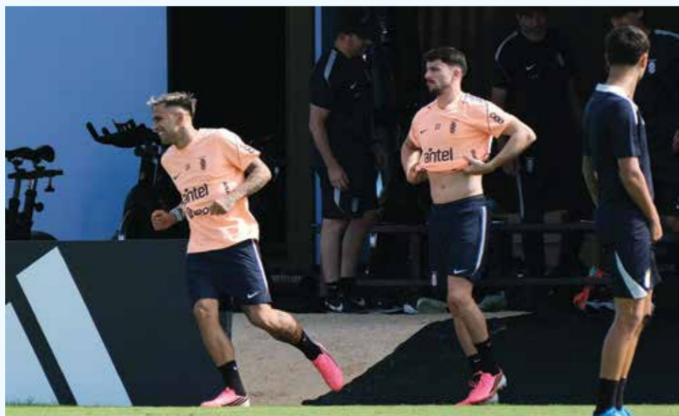
○ تدريبات الأوروغواي.