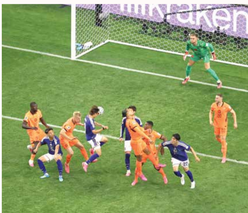
○ هدف اليابان الثاني (أ ف ب)

وتابعت ألمانيا سيطرتها المطلقة مسجلة الهدف الخامس عبر براون الذي سدّد بطريقة جميلة قريبة من الرمي بعد تمريرة البديل دينيز أونداف (68) الذي سجل بنفسه السادس متابعاً عرضية كيميتش (78). وختم هافيرتس مهرجان الأهداف بعد انفراده إثر تمريرة أونداف ووضعه الكرة من فوق الحارس روم (88).