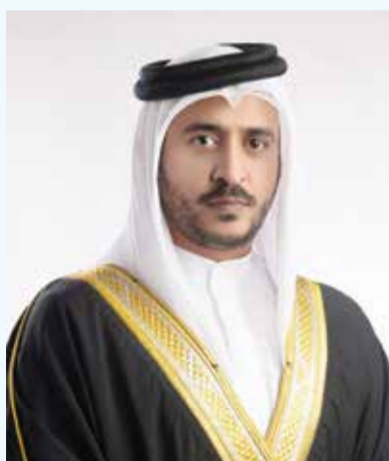
○ سمو الشيخ خالد بن حمد آل خليفة

الدائنة المتقدمة، والروبوتات، وتقنيات الطائرات المسيّرة وأنظمة مكافحة الطائرات المسيّرة، وهي تقنيات متطورة مصممة لتعزيز أمن المنشآت وإدارة المجال الجوي بكفاءة عالية. وإلى جانب العروض التقنية، سيسهم المعرض في الربط بين معايير الأمن الحديثة والأنشطة الرياضية المعاصرة، حيث سيشهد المعرض إقامة عروض حية لرياضة كرة القدم بالطائرات المسيّرة (Drone Soc-CEF)، وهي رياضة تشهد نمواً وانتشاراً متسارعين على المستوى الدولي، وتبرز الدقة والسرعة والإمكانات المتقدمة للتقنيات الجوية غير المأهولة ضمن إطار تنافسي مشوق.