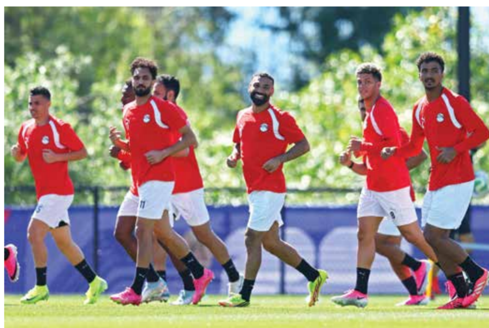
○ تدريبات مصر