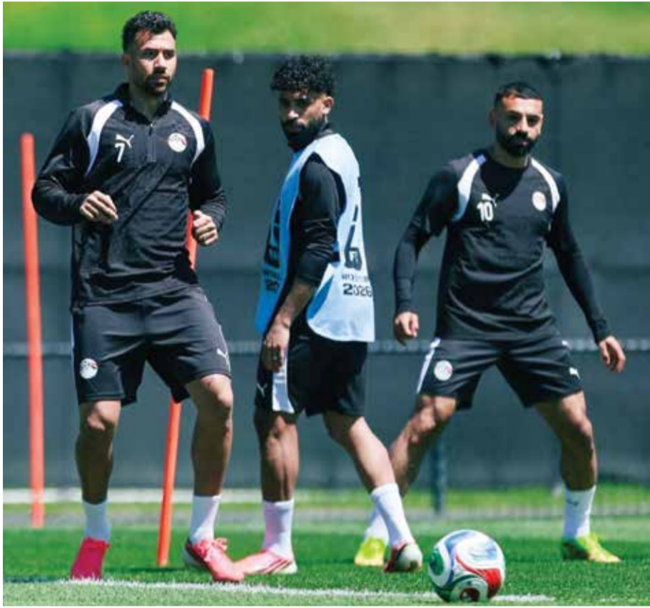
○ تحضيرات مصر.