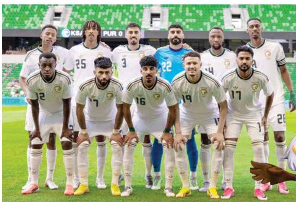
○ منتخب السعودية

موريسيتاون - (أ ف ب): يسعى المنتخب السعودي لكرة القدم إلى تكرار إنجازاته في افتتاح مشواره أمام منافس أمريكي جنوبي هو الأوروغواي اليوم الإثنين في ميامي ضمن مونديال 2026. فيما ترصد مصر فوزاً غير مسبوق عندما تلاقى بلجيكا في سياتل. لم تبلغ السعودية الأدوار الإقصائية في كأس العالم منذ وصولها إلى ثمن النهائي في مشاركتها الأولى عام 1994 في الولايات المتحدة، وبالتالي سيكون ذلك الهدف المنشود بعد 32 عاماً.