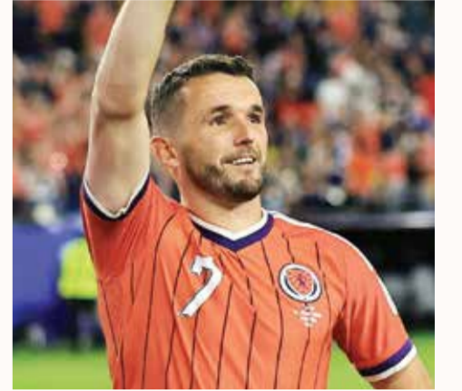
○ ماكجين (أ ف ب).

غانا 2:00 ص بنما اوزبكستان 5:00 ص كولومبيا