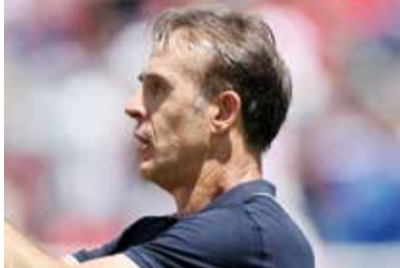
○ لوبيتيغي (أ ف ب)

وتابع لوبيتيغي «كنا محظوظين بعض الشيء في بعض اللحظات، لكن عليك أن تؤمن وتعمل بجد لكي تحظى بقليل من الحظ في الحياة وفي الرياضة». وأضاف «لذلك نحن سعداء جدا من أجل اللاعبين». من جهته، قال أبو ندي الذي اختير أفضل لاعب في المباراة لقتاة «الكأس»: «صراحة الكل قديم، من الجهاز الفني والإداري إلى اللاعبين. الجميع يعرف أن الأجواء صعبة جدا، نحن في كأس العالم. لكننا سعداء جدا بالحصول على أول نقطة في تاريخ المنتخب القطري (في كأس العالم)». وتابع «المباراة كانت رجولية من الجميع». وأردف قبل أن تنهض دموعه «صراحة، أريد أن أهدبها (هذه النتيجة) إلى والدي، ونوه «إن شاء الله نقرر نتأهل إلى الدور الثاني».