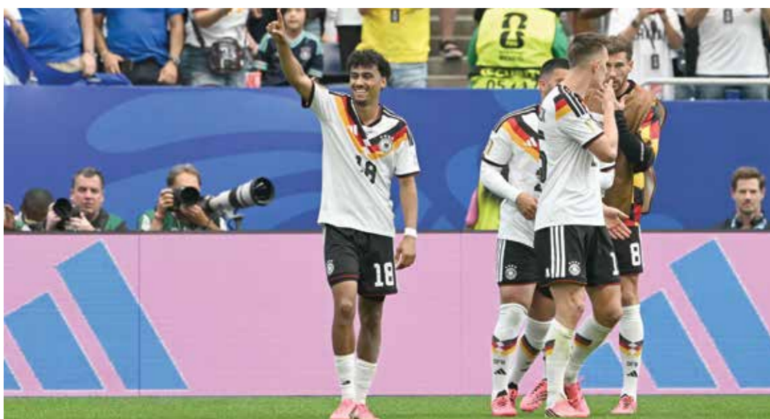
○ فرحة لاعبي ألمانيا بالهدف الرابع.