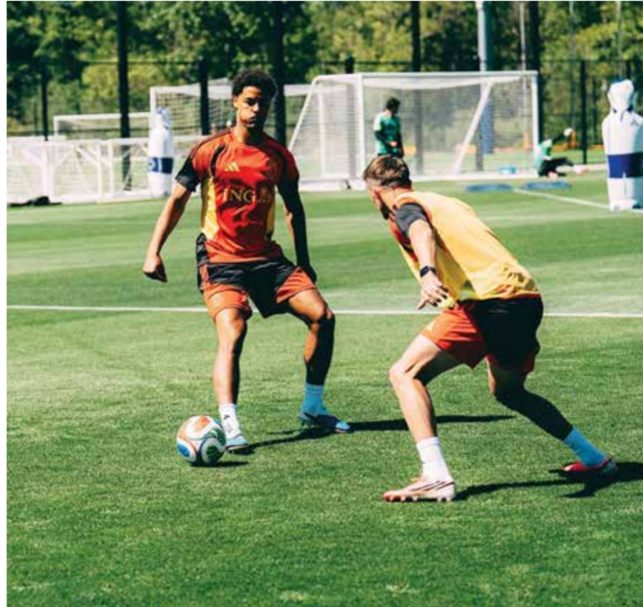
○ استعدادات بلجيكا.