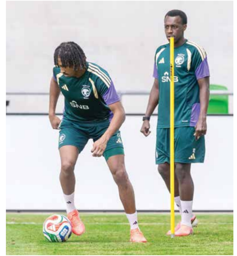
○ تدريبات السعودية.