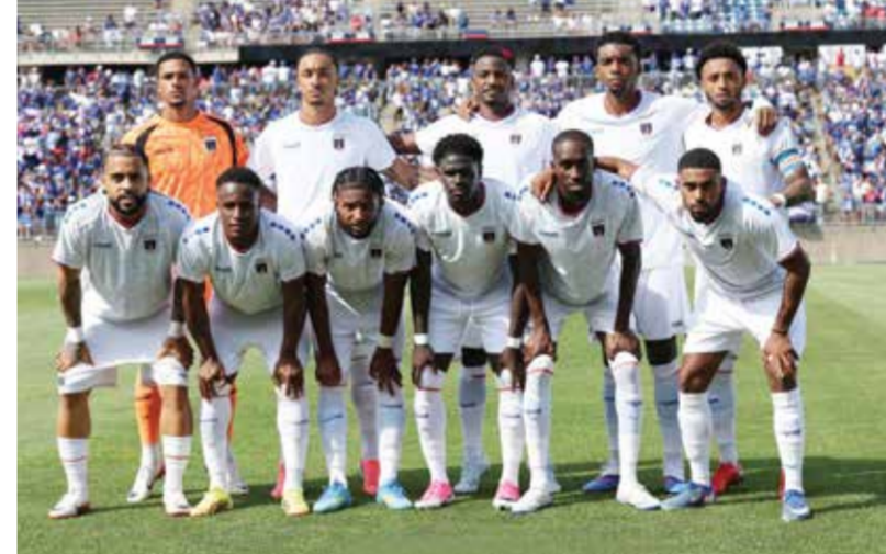
○ منتخب الرأس الأخضر

ج: معظم أبناء الرأس الأخضر لم يتوقعوا أن نتأهل الآن إلى كأس العالم، في ظل مواردنا المحدودة والمنافسة الهائلة في القارة الإفريقية. أعتقد أنه حلم تحقق لنا جميعًا ونحن سعداء جدًا. مشاركتنا ستشجع الكثيرين على ممارسة كرة القدم. كما تعلمون، هناك مشكلات اجتماعية بين الشباب، من العنف إلى المخدرات والكحول. وأعتقد أنه عندما تلعب كرة القدم تختفي الأمور السيئة.