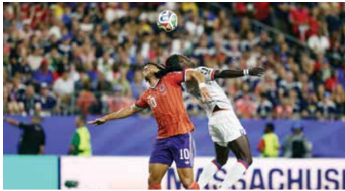
○ من مباراة اسكتلندا وهايتي