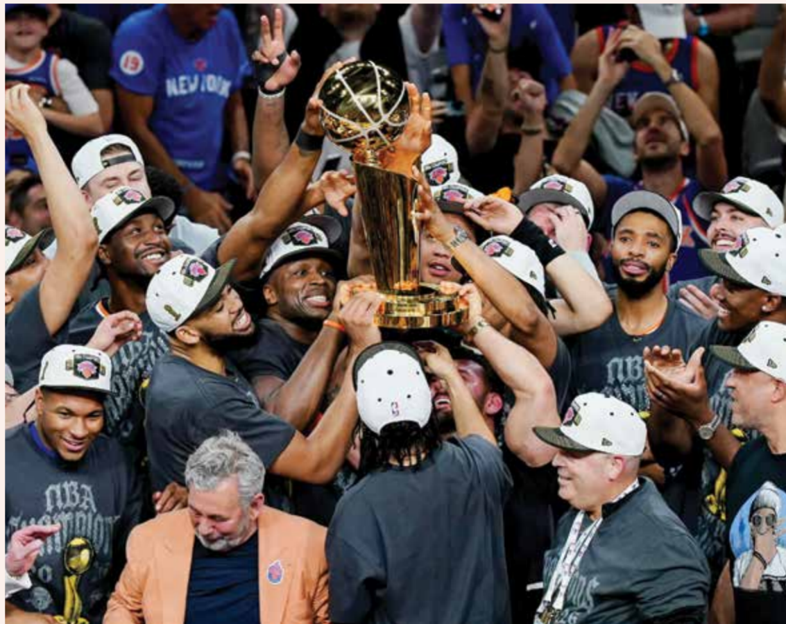
○ احتفال لاعبي نيكس باللقب.

وأوضح برانسون أنه لم يستوعب بعد حجم إنجاز نيكس أو إنجازه الشخصي، مضيفا «لم أستوعب الأمر حتى الآن. بصراحة، لا أعرف (ماذا يجول في خاطره) الآن. أنا ممتن وحسب لهذه الفرصة، وممتن لأن هذه الفرصة أتت لنا، وتمكنا من إنجاز المهمة».