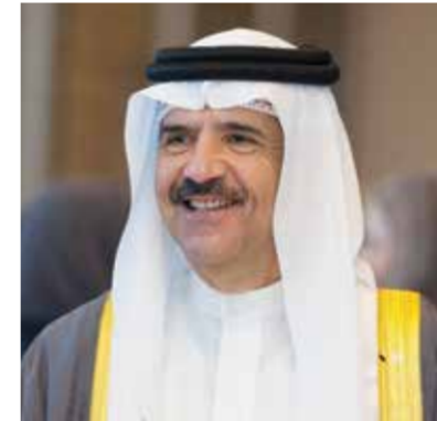
○ الشيخ عبدالعزيز بن مبارك آل خليفة

وتوسيع قاعدة المنتسبات إليها. وأوضحت أن البرنامج التدريبي للمعسكر ضم تجربة متكاملة تجمع بين الجوانب الفنية والبدنية والذهنية، حيث ستخضع المشاركات لتدريبات يومية مكثفة بإشراف مدربين متخصصين