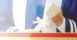
○ تلقى علي التهانني والتبريكات من الأهل والأصدقاء بهذه المناسبة السعيدة.