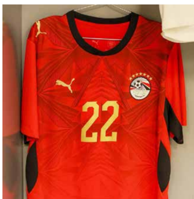
○ قميص المنتخب المصري.

القاهرة - (أ ف ب): أصدر الاتحاد المصري لكرة القدم بيانًا رسميًا السبت أوضح فيه حقيقة طلب نظيره الدولي «فيفا» إزالة النجوم من على قميص المنتخب الوطني المشارك في كأس العالم المقامة في الولايات المتحدة الأمريكية وكندا والمكسيك.