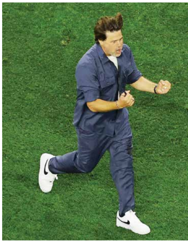
○ بوكيتينو (رويترز)

لوس أنجلوس - (أ ف ب): أشاد مدرب المنتخب الأمريكي لكرة القدم الأرجنتيني ماوريسيو بوكيتينو بأداء فريقه في فوزه الساحق على الباراغواي 4-1 في مباراته الافتتاحية بكأس العالم في لوس أنجلوس، وبمؤازرة الجمهور لأصحاب الأرض في أجواء احتفالية. وقال المدرب البالغ 54 عاماً والذي أراد في المقام الأول توجيه الشكر للجمهير «كان أداء المنتخب جيداً، لكنه مجرد فوز واحد، ثلاث نقاط فقط... لا يزال أمامنا الكثير لتحسينه، فالطريق طويل». وأضاف متحدثاً عن الجمهور «لقد كانوا اللاعبين الأساسيين في المباراة»، مضيفاً «إمكاناتنا تحقيق إنجازات عظيمة إذا استمروا على هذا المنوال».