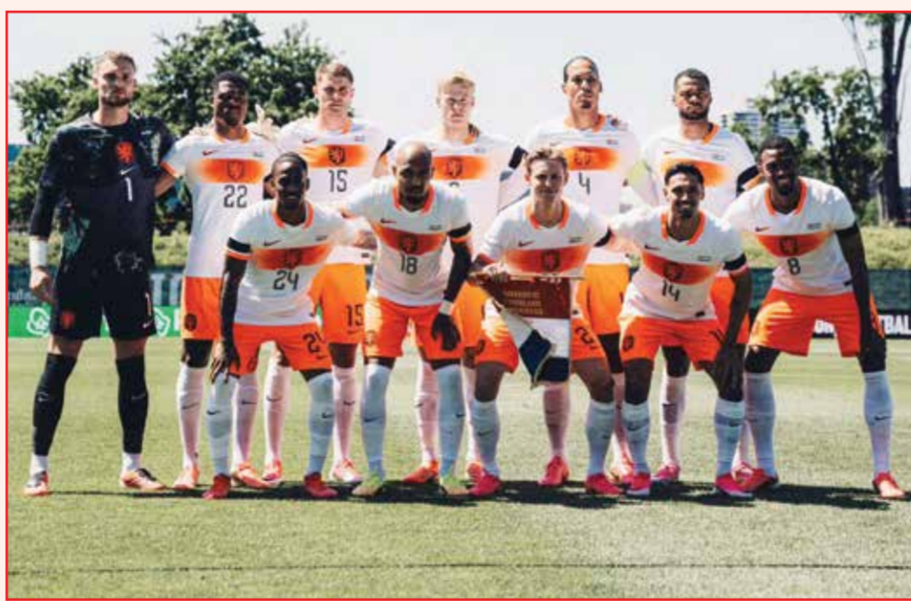
○ منتخب هولندا.

أما كوراساو، فيقودها الهولندي ديك أدفوكات (78 عاماً)، أكبر مدرب سنا يشرف على مباراة في تاريخ كأس العالم، في حين تُعدّ البلاد الأصغر من حيث المساحة وعدد السكان التي تتأهل إلى نسخة 2026. وتشكل مسيرتها