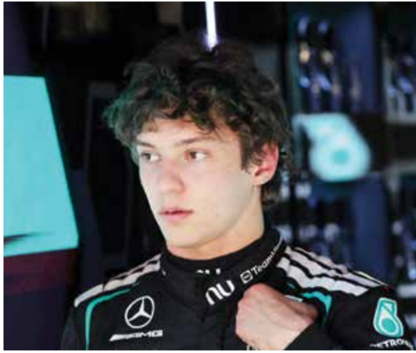
○ أنتونيلي (رويتزر)