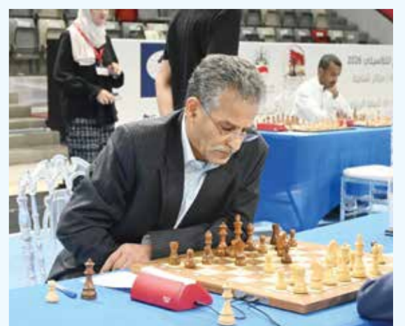
○ جانب من البطولة.