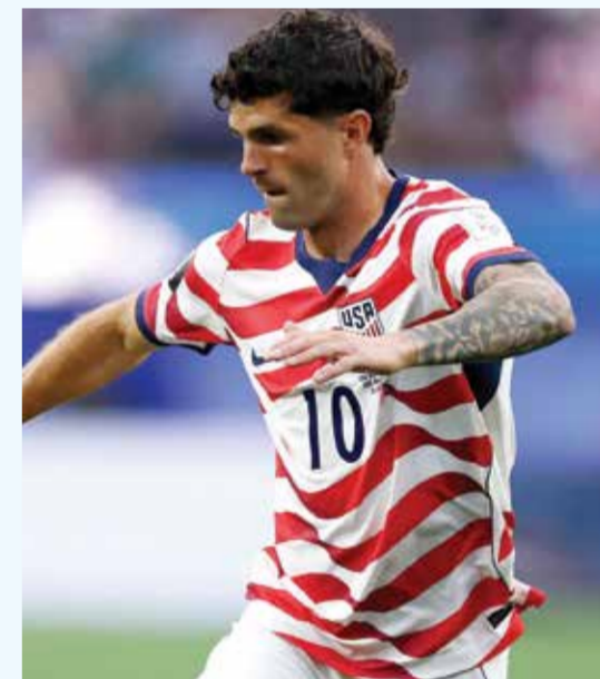
○ بوليسيك (أ ف ب)

وسئل مارش عن قرارين أساسيين في تشكيلته، من بينهما عدم إشراك لارين أساسياً، فعلق: «لم يكن كابل سعيداً بعدم البدء، وأجربنا حديثاً مقتضياً حول ذلك، لكنني قلت له انظر، لقد قدمت موسماً رائعاً مع ساوثمبتون (الإنكليزي) سواء