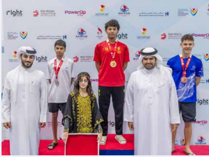
سموه يتوج الفائزين.