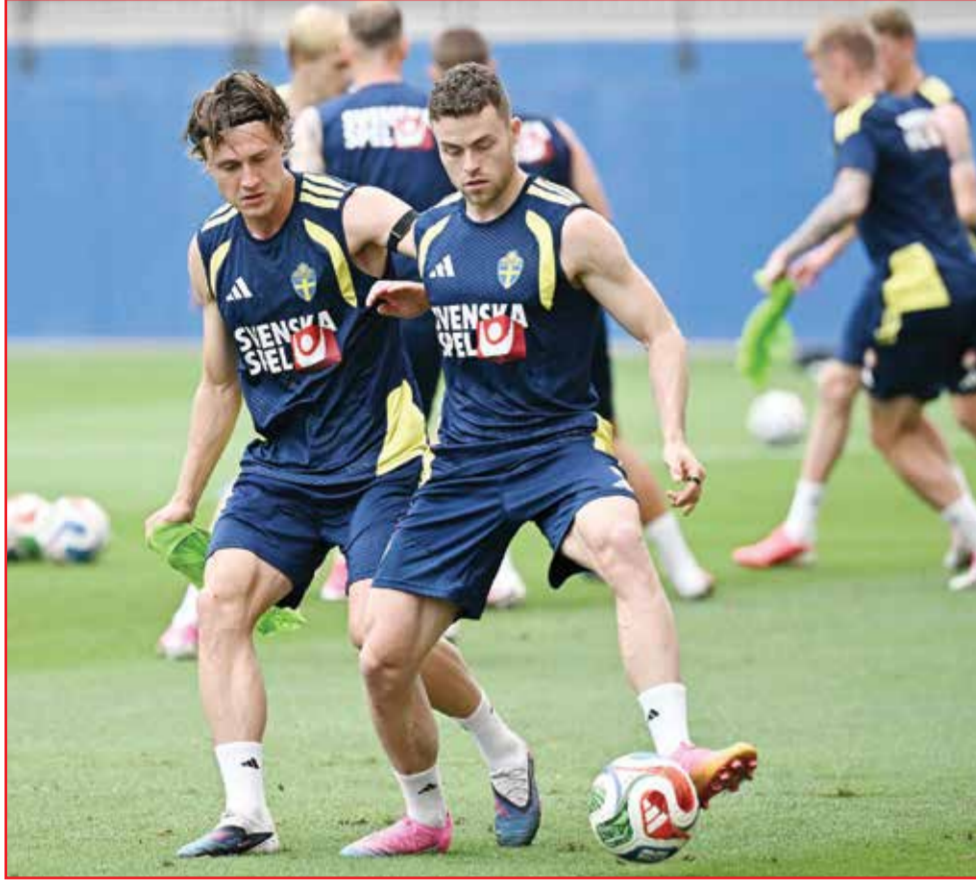
○ استعدادات السويد.