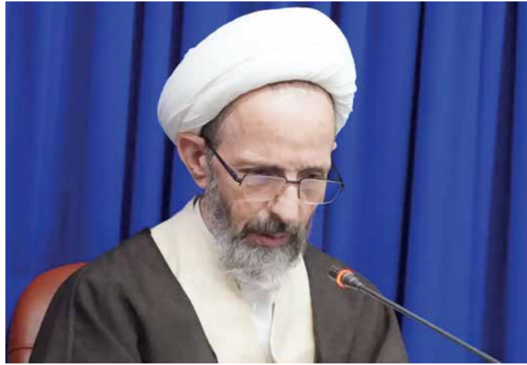
○ عضو مجلس خبراء القيادة الإيراني آية الله محمود رجبي.

ويأتي هذا البيان في ظل تصاعد الجدل داخل إيران حول طبيعة أي تفاهم محتمل مع واشنطن وشروطه وانعكاساته السياسية والإقليمية. وتشهد الساحة السياسية داخل إيران، وبالتحديد بين التيارات الداعمة للحكومة، تصاعداً في حدة الاعتراضات على مسودة التفاهم المتداولة