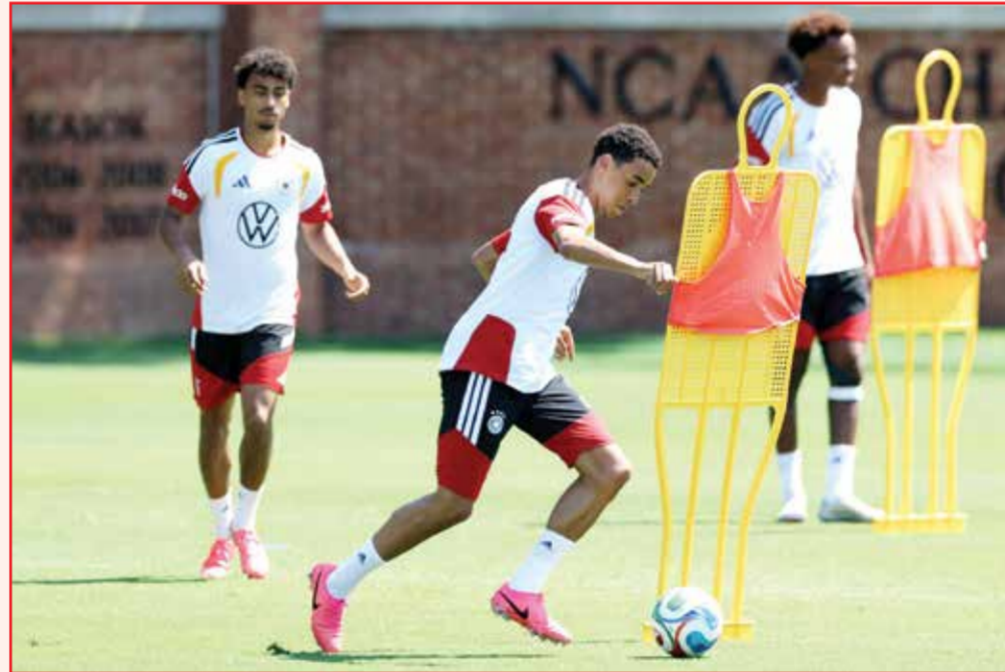
○ تدريبات ألمانيا. (أ ف ب)

موريسيتاون - (أ ف ب): تستهل تونس مشوارها في نهائيات كأس العالم بمواجهة «مفتاح» مطالبة بكسب نقاطها الثلاث لقطع شوط كبير نحو الدور الثاني عندما تلاقي السويد في مونتيري، وتنتظر هولندا مواجهة صعبة أمام اليابان في دالاس، فيما تخوض ألمانيا اختباراً سهلاً ضد كوراساو. في المباراة الأولى في مدينة مونتيري المكسيكية، تجد تونس نفسها أمام اختبار «حاسم» مبكر أمام السويد مطالبة فيه بكسب النقاط الثلاث لتأمين إنهاءها دور المجموعات في المركز الثالث على الأقل بالنظر إلى قوة منافسيها المقبلين في المجموعة السادسة: اليابان وهولندا وتاليا.