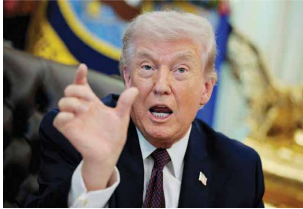
○ دونالد ترامب.

واشنطن - (أ ف ب): لا يُعرف الكثير عن نيات دونالد ترامب خلال مشاركته في قمة مجموعة السبع الأسبوع المقبل في فرنسا، لكن من المؤكد أنه سيفرض مزاجه وجدوله الزمني على اللقاء. وسيكون مزاج الرئيس الأمريكي إلى حد بعيد رهنا بمنحى التطورات بشأن الشرق الأوسط، مع إبداء طهران وواشنطن والوسط الباكستاني الجمعة تفاؤلاً بإمكان إبرام اتفاق بين الولايات المتحدة وإيران ينهي الحرب بعد أسابيع من المفاوضات الشاقة وخيبات الأمل.