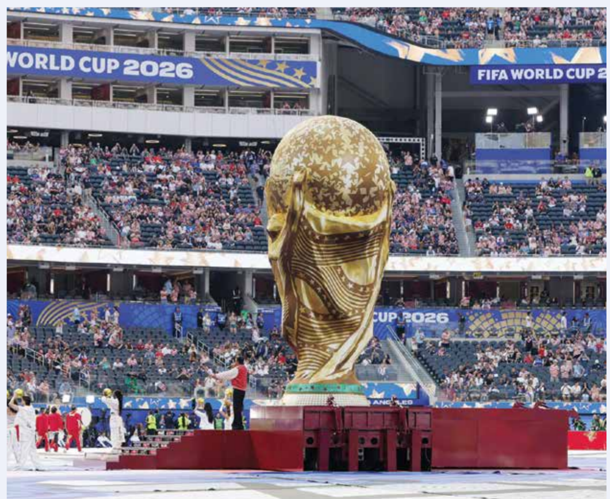
○ جانب من حفل الافتتاح

وتضمن الحفل عرضًا مميزًا على الطبول قبل أن يصعد كل من فيوتشر وتايلا إلى المسرح لأداء أغنيتهما «جيم تايم». واختتمت ليسا وأنيتا وريما الحفل بأغنيتهما العالمية «جولز»، التي تمزج بين موسيقى البوب «اللاتينية والكيبوب والأفرو بيتنس، كجزء من الألبوم الرسمي لكأس العالم، حسيما نقلت صحيفة «إنديبندينت» البريطانية. وقدمت كاتي بييري أغنية «واندر» بعد استعراض المنتخبات وقبل انطلاق المباراة مباشرة برفقة فتي صغير يدعى تيوس، والذي سجل الأغنية معها في الأصل.