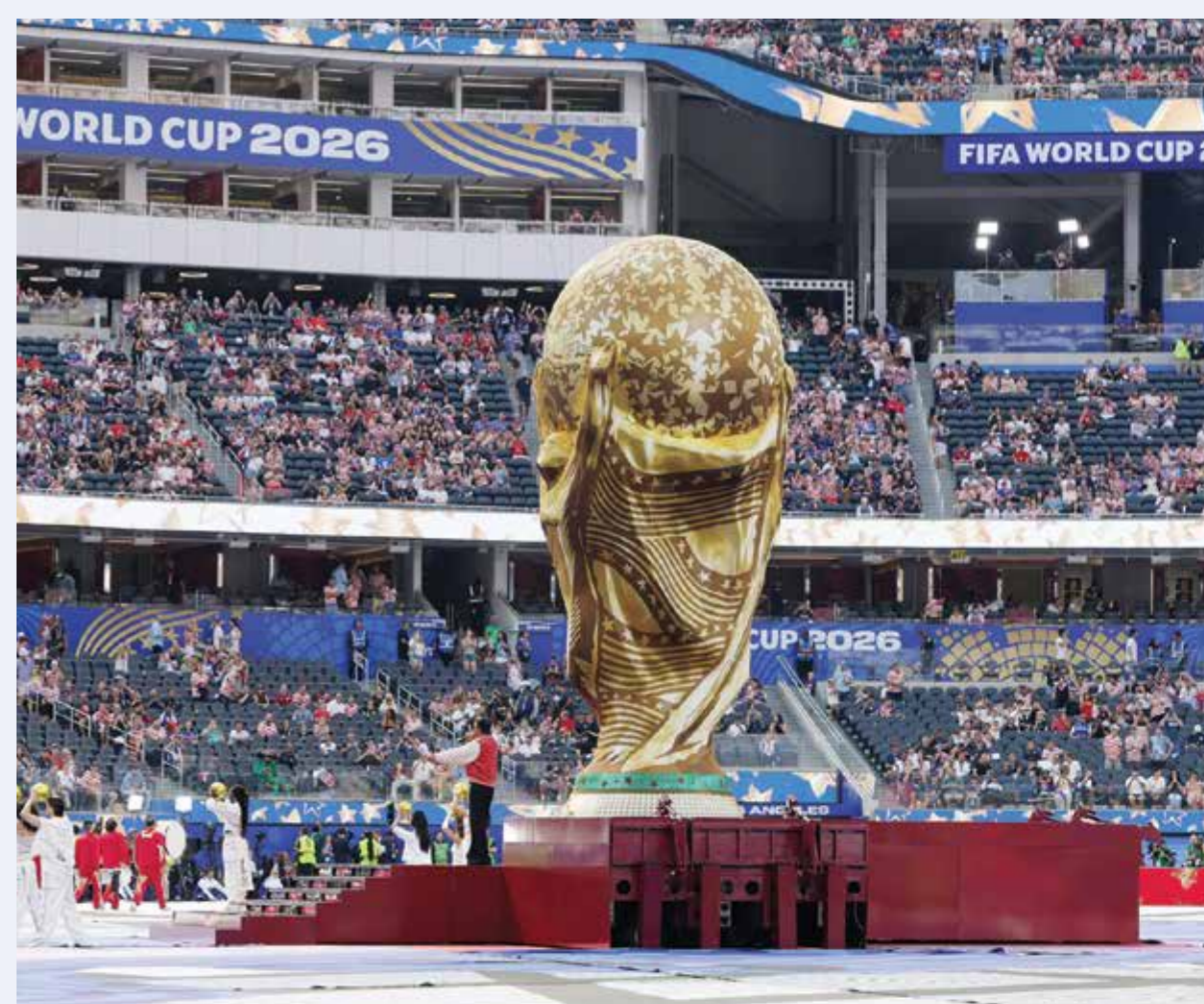
○ جانب من حفل الافتتاح