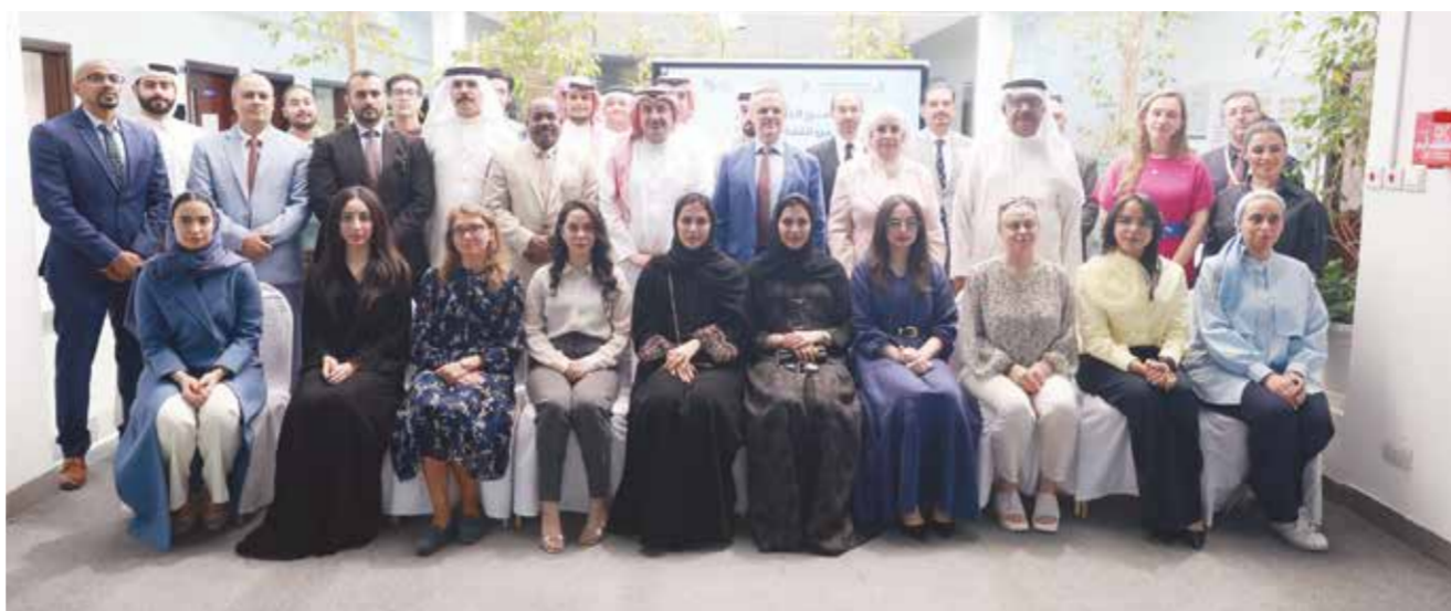
يخرج طلابا بحرينيين يتقنون الروسية..