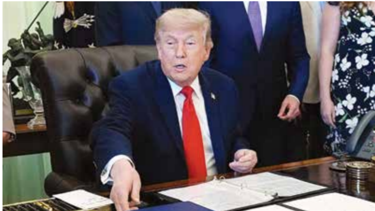
○ دونالد ترامب.

كان رئيس الوزراء الباكستاني شهباز شريف، الذي توسّطت حكومته بين إيران والولايات المتحدة لإنهاء الحرب بينهما، قد توقع إتمام التفاوض بين الجانبين خلال 24 ساعة. من جهته، وصف مسؤول أمريكي كبير، أمس السبت، الاتفاق الذي يجري التوصل إليه مع إيران بأنه قوي. وقال في حديث لوكالات الأنباء: «نعتقد أننا توصلنا إلى اتفاق قوي مع إيران». في الوقت نفسه أعلن الناطق باسم وزارة الخارجية الباكستانية أن إسلام آباد ستتنظم حفل توقيع إلكتروني عبر تقنية الاتصال المرئي بمناسبة الاتفاق بين الطرفين.