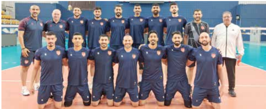
○ منتخبنا الوطني لكرة الطائرة