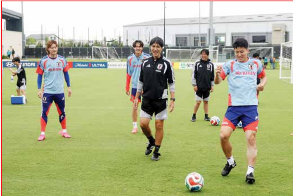
○ استعدادات اليابان.