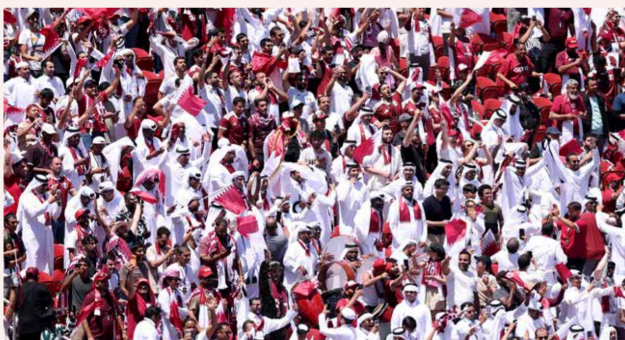
○ الجماهير القطرية تؤازر منتخبها.