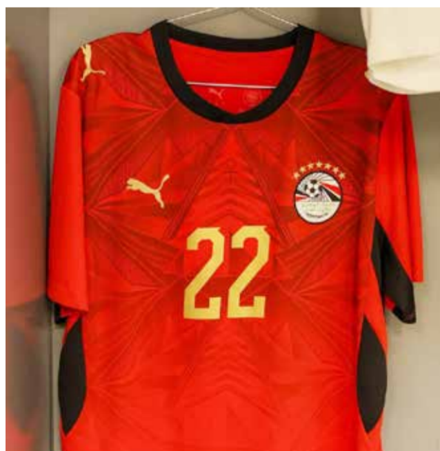
○ قميص المنتخب المصري.

القاهرة - (أ ف ب): أصدر الاتحاد المصري لكرة القدم بيانًا رسميًا السبت أوضح فيه حقيقة طلب نظيره الدولي «فيفا» إزالة النجوم من على قميص المنتخب الوطني المشارك في كأس العالم المقامة في الولايات المتحدة الأمريكية وكندا والمكسيك.