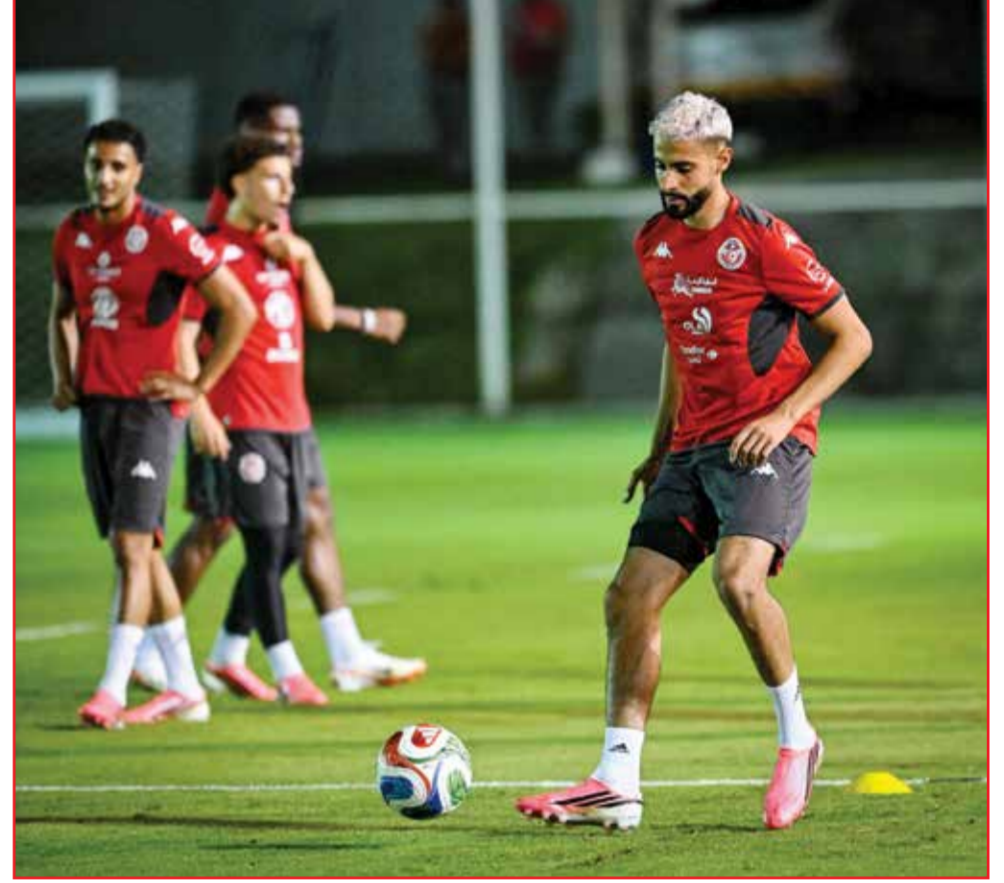
○ تدريبات تونس.