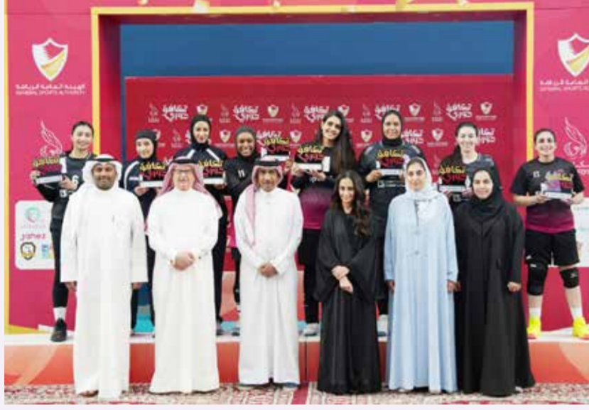
○ جانب من التتويج.