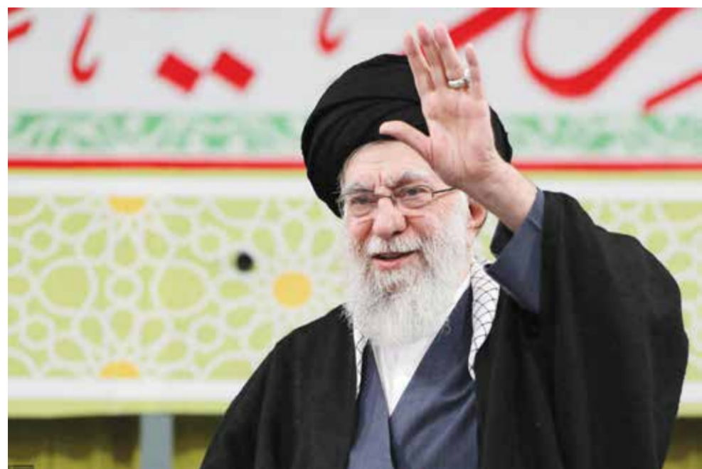
○ علي خامنئي.

للمفاوضات التي تؤدي إلى انسحاب إسرائيلي كامل وعودة مئات الآلاف من المدنيين النازحين، تحت إشراف الجيش اللبناني. وتريد إسرائيل تفكيك حزب الله كقوة عسكرية، على الأقل في جنوب لبنان، وإثبات زوال قوته قبل التخلي عن الأراضي المحتلة. ولم يخف سلام تأثر لبنان بمفاوضات إسلام آباد، لكنه أعاد التأكيد على الإصرار على التفاوض كدولة مستقلة، «لا يفاوض باسمها أحد». وأضاف في مكتبه «نحن طبعاً نتأثر بمسار التفاوض في اسلام آباد. فكيف بحرب ونتائجها خاض على أرضنا؟ نحن نتأثر بالحرب وبالسلام وبالتهنية في المنطقة. وإسلام آباد، أو أي مكان آخر، من شأنه أن يترك أثره علينا». وتابع «إذا هذا المسار يؤدي لوقف إطلاق نار وتهنية بالمنطقة، أكيد نحن نستفيد