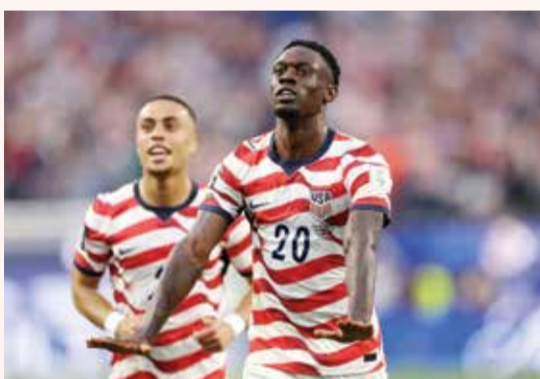
○ بالوجون (أ ف ب)

وبعمر 38 عاماً، أصبح أكبر لاعب في تاريخ منتخب الولايات المتحدة للرجال يشارك في بطولة كأس عالم.