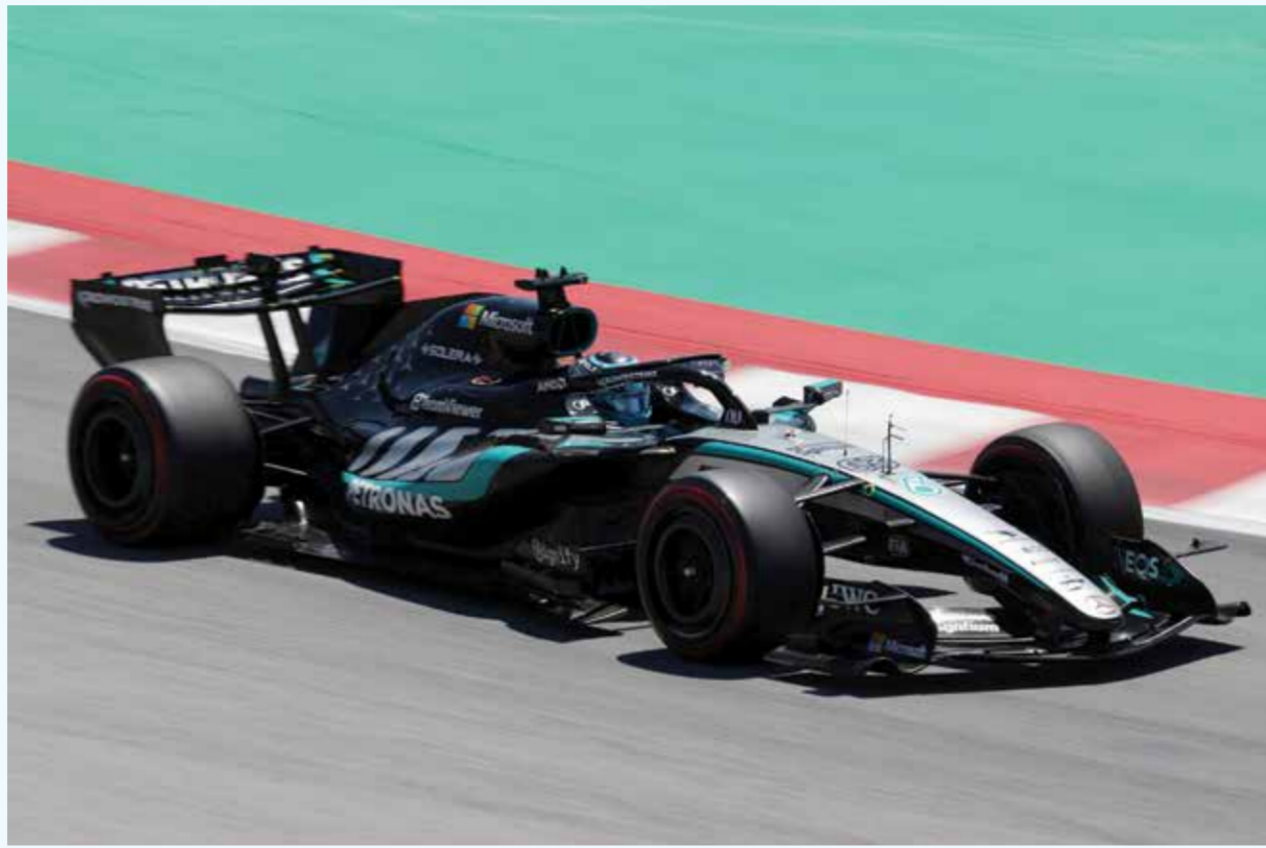
○ راسل (أ ف ب)

برشلونة - (أ ف ب): استعاد سائق مرسيدس البريطاني جورج راسل ثقته بنفسه قبل سباق جائزة برشلونة الكبرى بتصديه قائمة أسرع الأزمنة في الفترة الثالثة الاخيرة للتجارب الحرة، ضمن منافسات الجولة السابعة من بطولة العالم للفورمولا واحد أمس السبت.