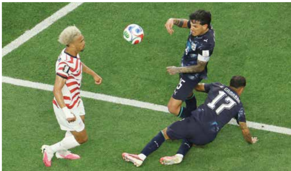
○ جانب من المباراة

المجموعات في مشاركتها الثلاث الأخيرة (2010، 2022).