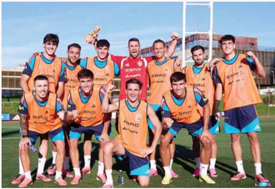
من تدريبات المنتخب الإسباني