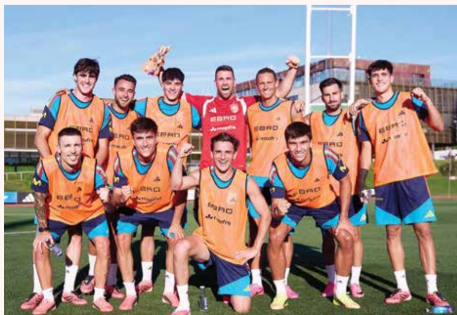
من تدريبات المنتخب الإسباني