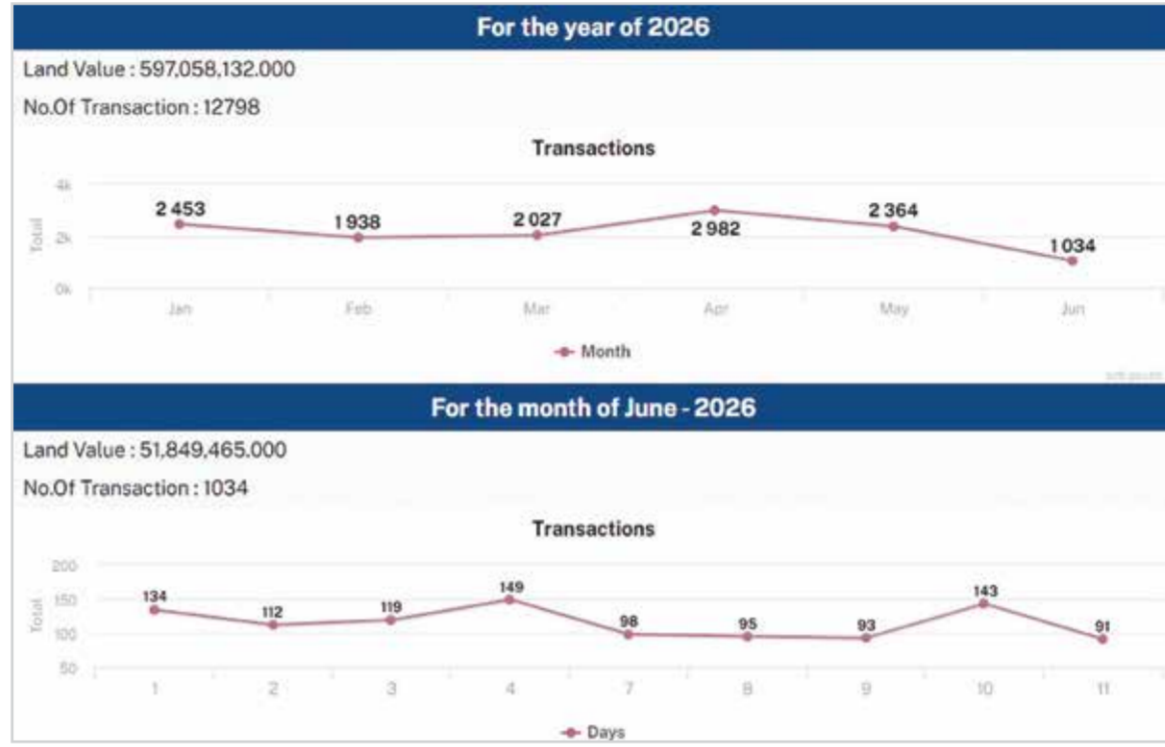
○ مؤشرات التداول العقاري خلال الأشهر الماضية.

والاستراتيجيات الحكومية بقيادة صاحب السمو الملكي الأمير سلمان بن حمد آل خليفة ولي العهد رئيس مجلس الوزراء، التي تركز على تنويع الاقتصاد الوطني وتعزيز البيئة الاستثمارية وتوفير المقومات الداعمة للنمو المستدام. كما أسهمت المنظومة التشريعية والتنظيمية المتطورة في تعزيز جانبية القطاع العقاري، من خلال تطوير الخدمات الإلكترونية وتبسيط إجراءات التسجيل والتوثيق ورفع مستويات الشفافية، إلى جانب الأدوار التي يضطلع بها جهاز المساحة والتسجيل العقاري ومؤسسة التنظيم العقاري في تنظيم السوق وحماية حقوق المتعاملين. وتؤكد هذه المؤشرات أن القطاع العقاري يواصل أداءه كأحد أكثر القطاعات حيوية في الاقتصاد الوطني، مستفيدا من الاستقرار الاقتصادي والتشريعات الحديثة والمشروعات التنموية المتواصلة، بما يعزز مكانة البحرين كوجهة عقارية واستثمارية رائدة على مستوى المنطقة.