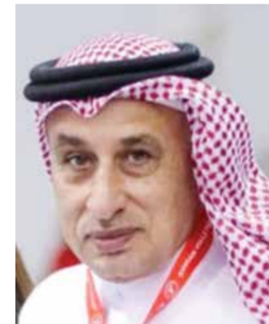
○ عبد الجليل فتيل

اللاعبين على التأقلم السريع مع نسق مباريات كأس العالم ومتطلباتها الفنية والبدنية. وأضاف: «الاستقرار الفني الذي يعيشه المنتخب، إلى جانب امتلاكه جيلاً مميزاً من اللاعبين، يجعله مرشحاً بقوة لتقديم مستويات جيدة والمنافسة على بلوغ مراحل متقدمة من البطولة». وبينما تتطلع الجماهير العربية إلى ظهور مشرف لمنتخباتها في مونديال 2026، يبدو أن المنتخب المغربي يحظى ببقعة كبيرة لدى المتابعين والخبراء، استناداً إلى ما راكمه من خبرات وإنجازات خلال السنوات الأخيرة.