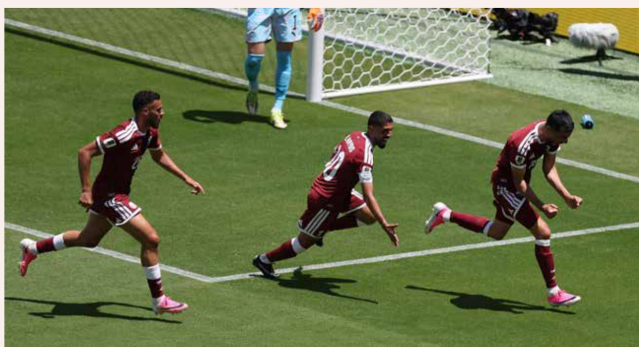
○ فرحة قطرية بهدف التعادل.

في المباراة تمكنت قطر في مستهل مشوارها بكأس العالم لكرة القدم 2026 من انتزاع تعادل بطعم الفوز أمام سويسرا، في سانتا كلارا بخليج سان فرانسيسكو بنتيجة 1-1. وهذه أول نقطة لمنتخب «العنابي» في المونديال.