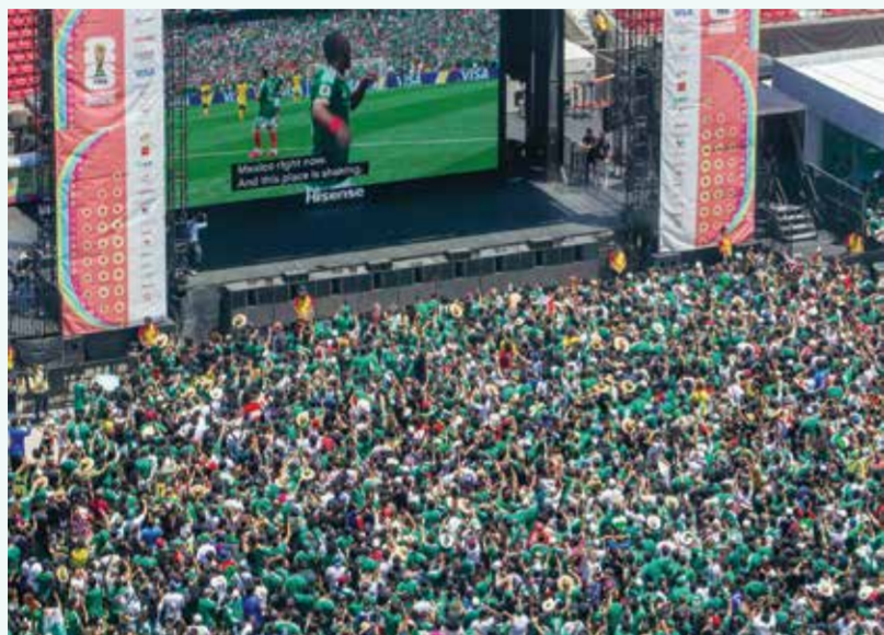
○ جماهير المكسيك