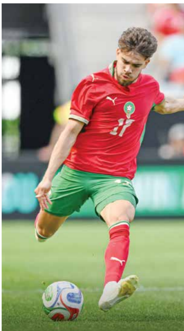
○ عبد الصمد الزلزولي.

موريستان - (أ ف ب): أعرب الجناح الدولي المغربي عبد الصمد الزلزولي عن حزنه الشديد عقب اضطراره إلى الانسحاب من نهائيات كأس العالم لكرة القدم في أمريكا الشمالية بسبب إصابة في الركبة.