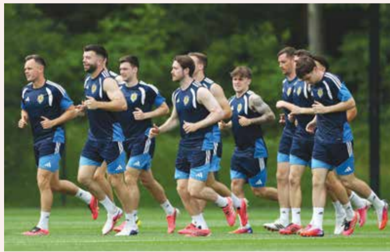
○ تدريبات اسكتلندا (أ ف ب)

الإقصائية فإن كل شيء ليس مجرد مسألة شكلية في هذه المرحلة. وبعد منتخب اسكتلندا المرشح الأوفر حظا للفوز على هايتي، حيث يستند هذا التوقع إلى عمق تشكيلة الفريق، وخبرته في البطولات الأوروبية، ومسيرته المميزة في التصفيات التي شهدت تفوقه على منافسيه، عقب تسجيله 13 هدفا فيما استقبل 7 أهداف في 6 مباريات.