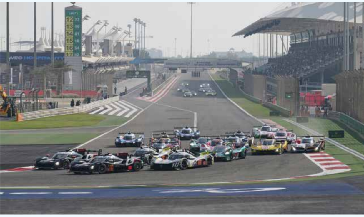
○ من سباقات التحمل في الحلبة

هذا العام، إقامة سباق بابكو إنرجيز البحرين 8 ساعات لعام 2026 في الفترة من 5 إلى 7 نوفمبر، والعام المقبل 2027 من 4 إلى 6 نوفمبر. وصرح فريدريك ليكوين، الرئيس التنفيذي لبطولة العالم للتحمل التابعة للاتحاد الدولي للسيارات: «يسعدنا تجديد عقدنا مع حلبة البحرين الدولية. فمنا انضمامها إلى تقويم بطولة العالم للتحمل قبل 14 عامًا، رسخت مكانتها كمحطة رئيسية في البطولة، بفضل الترحيب الحار الذي حظيت به من الفريق المحلي والتنظيم الرائع من البداية إلى النهاية، نتطلع إلى المزيد من المنافسات المثيرة في الصخير!».