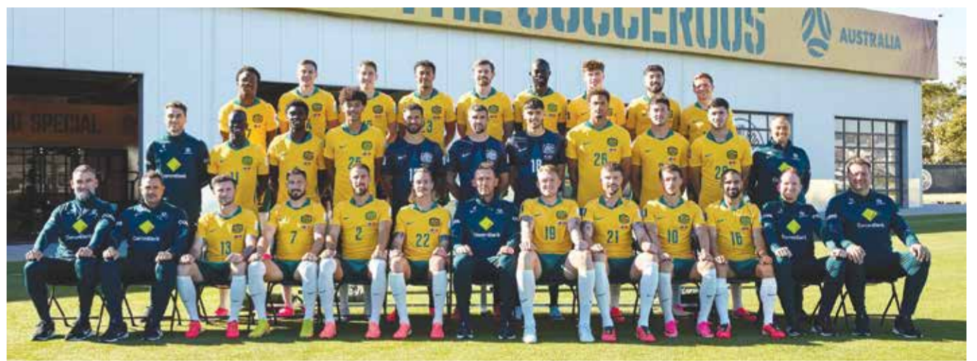
○ منتخب أستراليا

ويتطلع كلا المنتخبين لإنعاش آمالهما في التقدم لمرحلة خروج المغلوب للمرة الأولى في تاريخهما بكأس العالم، حيث أخفق منتخب اسكتلندا في اجتياز مرحلة المجموعات خلال مشاركاته الثماني السابقة بالمونديال، وهو ما ينطبق على منتخب هايتي، الذي فشل في بلوغ الأدوار الإقصائية خلال مشاركته الوحيدة في البطولة بنسخة المسابقة عام 1974 بألمانيا الغربية، التي شهدت خسارته في جميع مبارياته الثلاث التي لعبها. ويحتاج منتخب اسكتلندا، والعائدة إلى كأس العالم للمرة الأولى منذ نسخة مونديال فرنسا عام 1998، إلى النقاط من أجل البقاء في المنافسة أمام منتخبي البرازيل