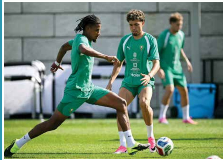
○ تحضيرات المغرب