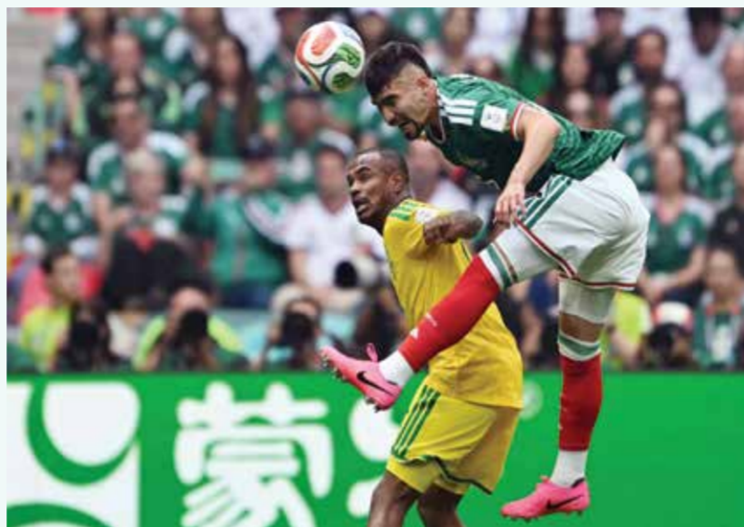
○ من مباراة المكسيك وجنوب إفريقيا