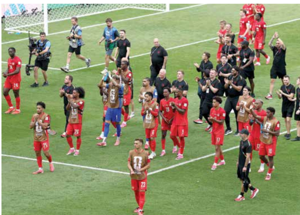
○ لاعبو كندا يحيون الجماهير.

تورونتو - (د ب أ): حصل منتخب كندا على أول نقطة في تاريخه ببطولة كأس العالم لكرة القدم، عقب تعادله المثير 1/1 مع منتخب البوسنة والهرسك مساء أمس الجمعة، في افتتاح مباريات المجموعة الثانية بمرحلة المجموعات للمونديال، الذي يقام في الولايات المتحدة والمكسيك وكندا. وفي مدينة تورونتو الكندية، يادر منتخب البوسنة والهرسك بالتسجيل عن طريق جوفو لوكيتش في الدقيقة 21، قبل أن يحرز كايلا لارين