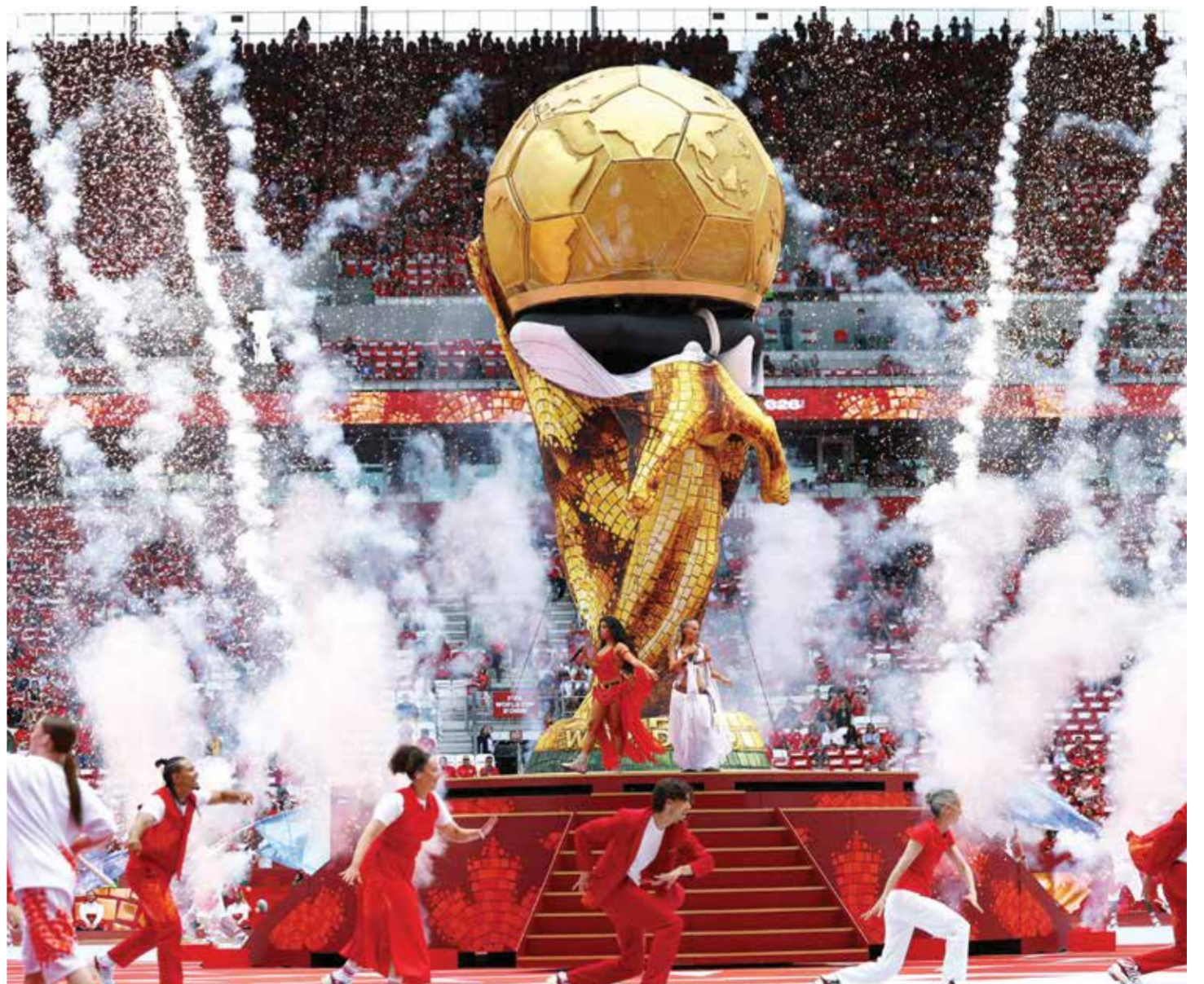
○ من حفل الافتتاح.

تورونتو - (د ب أ) - أعلنت كندا عن مشاركتها في استضافة مباريات كأس العالم 2026 مع أمريكا والمكسيك، وذلك بحفل افتتاحي مبسط قبل انطلاق مواجهة كندا والبوسنة والهرسك، ضمن منافسات الجولة الأولى بالمجموعة الثانية. وجاء ذلك الحفل ليكون الثاني في مونديال 2026 بعد حفل الافتتاح الأول في المكسيك الجمعة، والذي أقيم على ملعب «أزتيكا» في العاصمة مكسيكو سيتي، وشهد حضور نخبة من