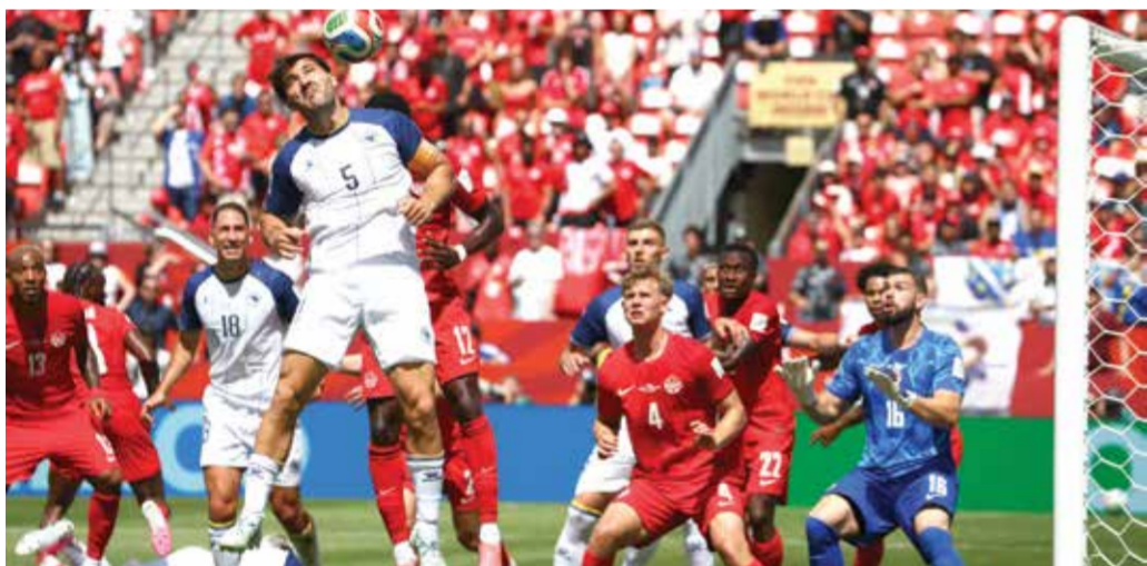
○ من مباراة كندا والبوسنة. (أ ف ب)

ويعد انتهاء السباق كل عام تستضيف الحلبة تجارب السائقين المبتدئين السنوي وحفل توزيع جوائز نهاية الموسم، ومن المقرر،