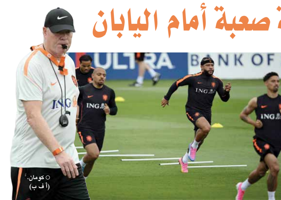
كومان. (أ ف ب)

سنقدم بطولة جيدة». وأضاف المهاجم فوت فيجورست: «لدينا هدف واحد وهو أن نصبح أبطال العالم».