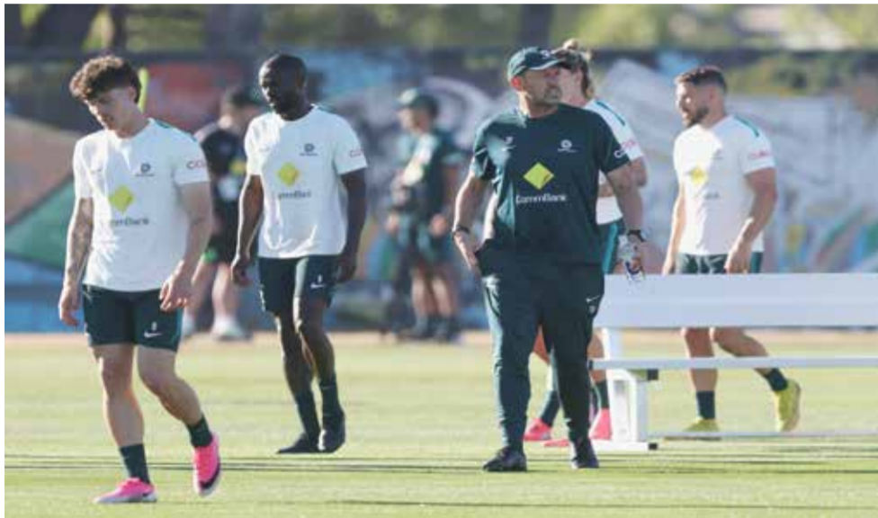
○ بوبوفيتش (أ ف ب).

حتى كأس آسيا. ومنذ اليوم الأول لتولي المهمة، حرصت على الموازنة بين المصالح طويلة الأمد للمنتخب وتحقيق النتائج المطلوبة على المدى القصير، وكان الهدف الأول يتمثل في ضمان التأهل إلى كأس العالم.