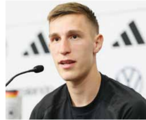
شلوتربيك (أ ف ب).

وقال المدير الرياضي رودى فولر، الذي كان مدرباً للمنتخب عندما اكتسح السعودية 8 / صفر