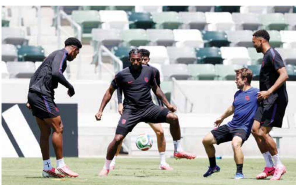
○ تدريبات أمريكا، (رويترز)