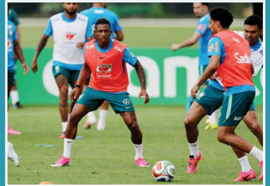
○ تدريبات البرازيل

كرة القدم تُحسم فوق أرضية الملعب، وسنبدل كل ما في وسعنا من أجل الخروج بنتيجة تليق بطموحات الجماهير المغربية.. وتسعى البرازيل، بقيادة مدربها الإيطالي الفذ كارلو أنشيلوتي، للتتويج بلقبها العالمي السادس وتعزير الرقم القياسي، بعد ثلاثة انتصارات متتالية في مباريات ودية، سجّلت خلالها 11 هدفاً، ما يبرز قوتها الهجومية التي تضعها بين كبار المرشحين للقب. وتعتبر النهائيات تحدياً جديداً بالنسبة لأنشيلوتي، أحد عمالقة التدريب، في أول مهمة له على رأس الإدارة الفنية للمنتخب بعد مشوار حافل بالألقاب مع الاندية. «كارليتو»، البالغ 67 عاماً والذي يسجل ظهوره الأول كمدرّب في كأس العالم، هو المدرب الوحيد الذي أحرز خمس بطولات لدوري أبطال أوروبا وتوج بالدوري في البطولات الأوروبية الخمس الكبرى.