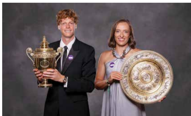
بطلا للنسخة الماضية.

إشارة قوية على جدية المنظمة». وأضاف «يرغب اللاعبون واللاعبات في استمرار ازدهار بطولة ويمبلدون ودعم استثماراتها في اللعبة. لم يكن السؤال يوما ما إذا كانت هذه الاستثمارات قيمة، بل ما إذا كان ينبغي للرياضيين الذين تسهم أداؤهم في نجاح البطولة عالميا أن يحصلوا على نصيب عادل من نموها المالي الهائل».