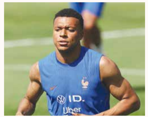
○ مبابي (أ ب).

وتابع: «لم تكن نلعب بشكل جيد، وهذا أمر لا يفيد... حتى عندما كنا نحقق الانتصارات، لم نشعر بالسعادة التي كان يفترض أن نشعر بها».