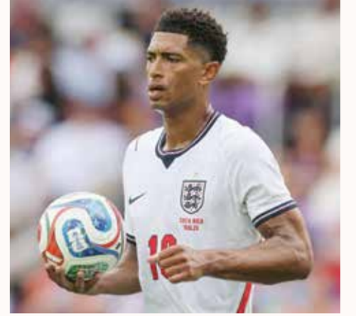
○ بيلينغهام (أ ب).

غانا 2:00 ص بنما اوزبكستان 5:00 ص كولومبيا