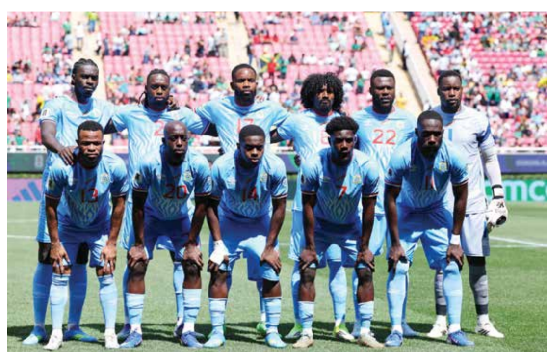
○ منتخب الكونغو.

وأكد: «الآن، مباراة المكسيك هي مباراة مهمة أخرى. سنقضي الأسبوع المقبل في الاستعداد بشكل جيد».