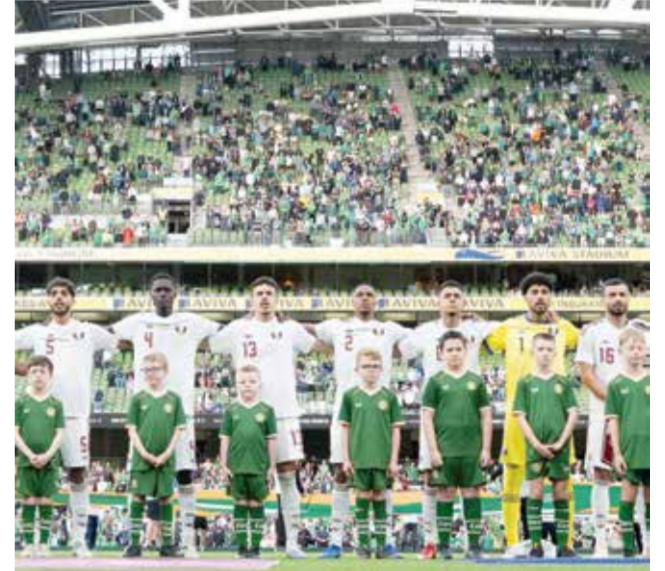
○ منتخب قطر