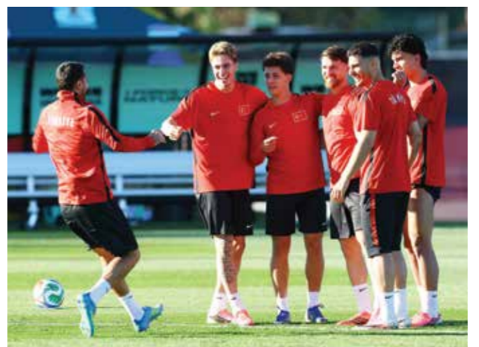
○ تدريبات تركيا

الإيطالي فينتشيزو مونتيللا، حيث حقق الفوز في 7 مواجهات منها، وتأهل إلى المونديال بعد الإطاحة بمنتخب كوسوفو بهدف دون رد في الملحق الأوروبي الحاسم في شهر مارس الماضي. وتأتي هذه المواجهة لتكون صراعا حقيقيا بين أسلوبين مختلفين تماما، حيث تعتمد أستراليا على القوة البدنية والتنظيم الدفاعي المحكم واستغلال الكرات الثابتة والمرتدات السريعة، بينما يفضل المنتخب التركي السيطرة والاستحواذ والاعتماد على الحلول الفردية والمهارات الفنية العالية لخط وسطه وهجومه، وسيحاول كلا المدربين استغلال نقاط ضعف الخصم، حيث ستكون الأطراف التركية مكانا مناسباً لانطلاقات مهاجمي أستراليا، بينما سيتعين على الدفاع الأسترالي الصمود أمام الطوفان الهجومي التركي.