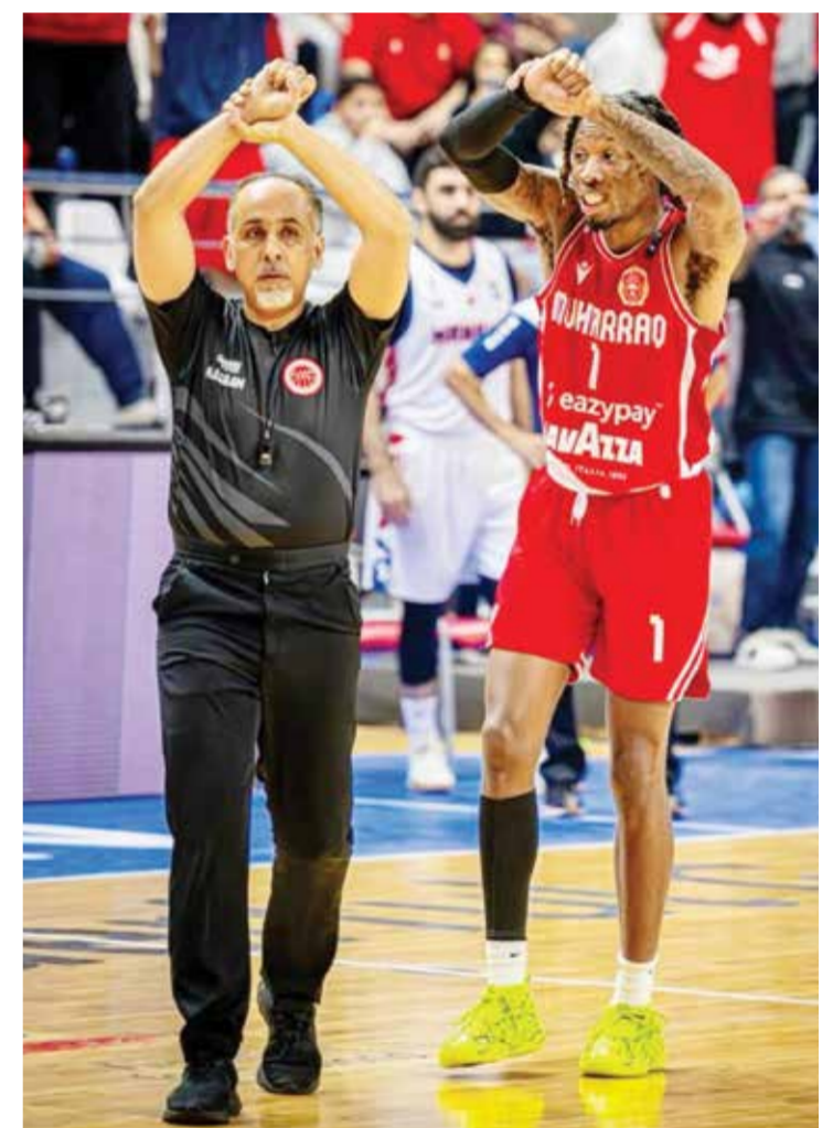
○ لحظة فنية تحكيمية

كما لعبت اللجنة دوراً مهماً في ترسيخ ثقافة الالتزام والمسؤولية بين مختلف مكونات المنظومة السلاوية، من أندية وأجهزة فنية وإدارية ولاعبين، الأمر الذي انعكس