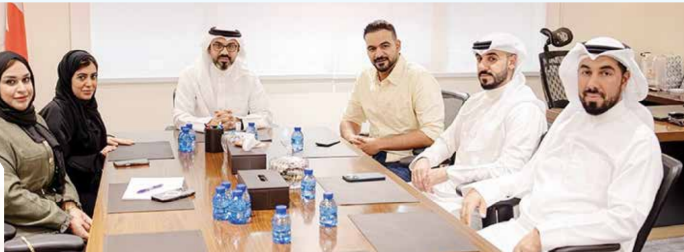
○ جانب من اجتماعات اللجنة