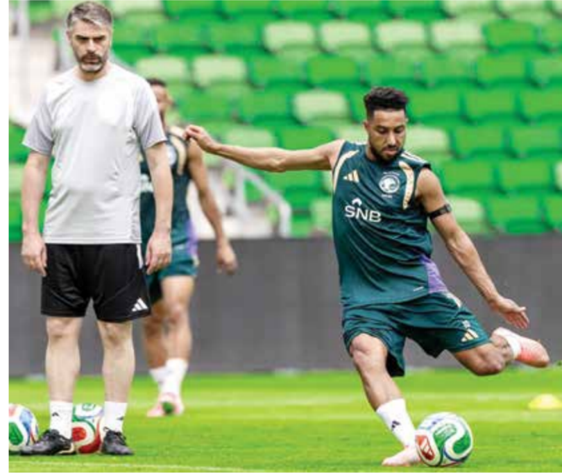
○ تحضيرات السعودية.

وأقر السرتي أنه من الطبيعي أن «يبقى بلوغ الأدوار الإقصائية هدفا رئيسيا، للسعودية».