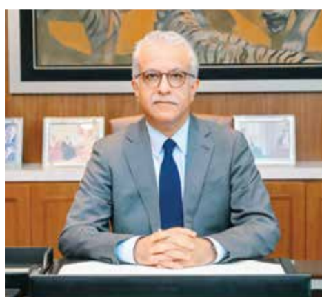
○ الشيخ سلمان بن إبراهيم آل خليفة.

كما أشاد الشيخ سلمان بن إبراهيم بالحضور الآسيوي المتميز في منظومة التحكيم الدولية، مؤكداً أن اختيار 25 حكماً آسيوياً من حكام القارة للمشاركة في إدارة مباريات كأس العالم يعكس المكانة الرفيعة التي بلغها التحكيم الآسيوي على المستوى العالمي.