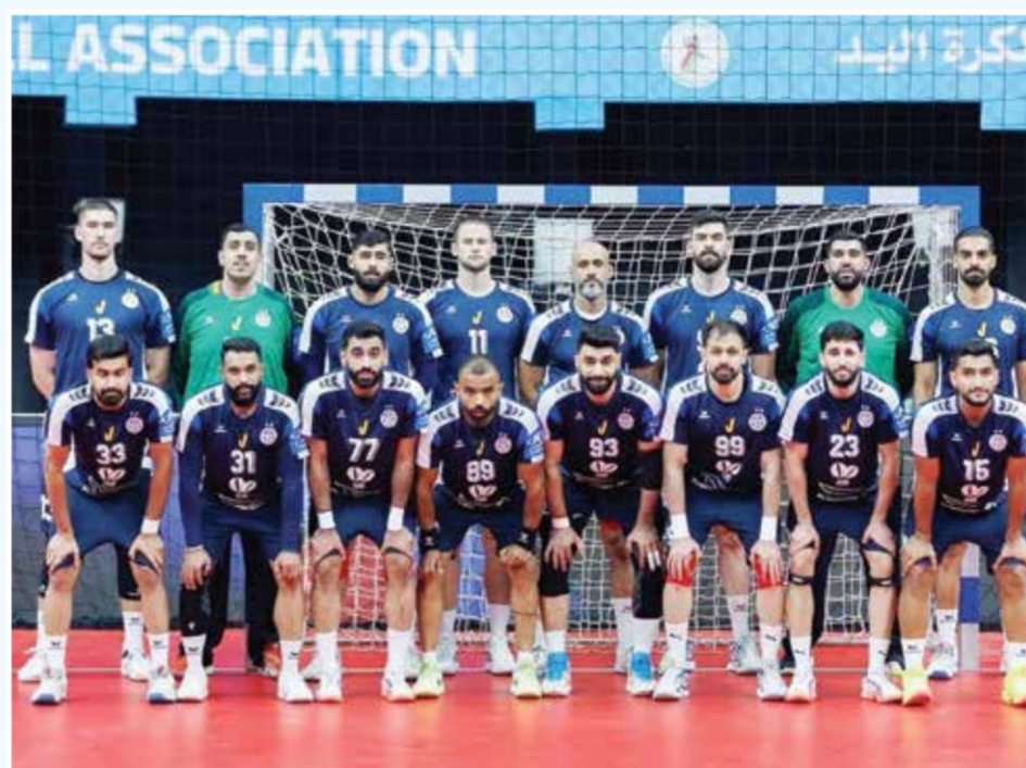
○ فريق النجمة.

ويعمل النجمة على مجموعة من لاعبيه المحليين والمحترفين لتقديم مستوى قوي أمام الشارقة، أملاً في تحقيق الفوز الأول وفتح صفحة جديدة في مسواره بالبطولة الآسيوية.