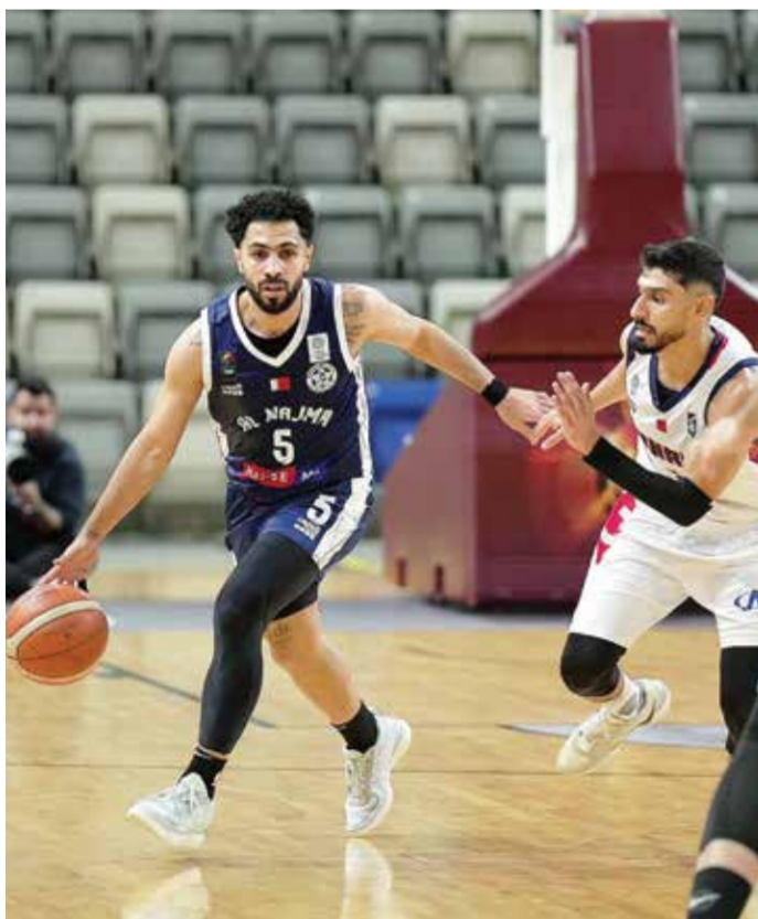
○ من منافسات فئة الكبار