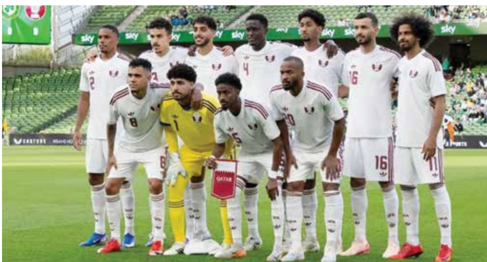
○ منتخب قطر