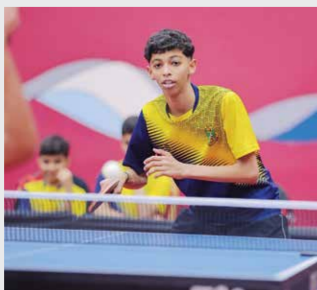
○ من مباريات سار.