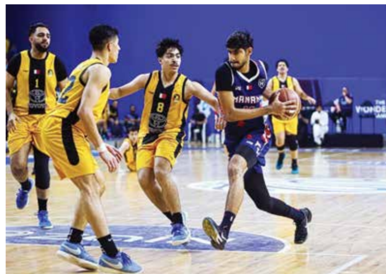
○ من منافسات الفئات العمرية