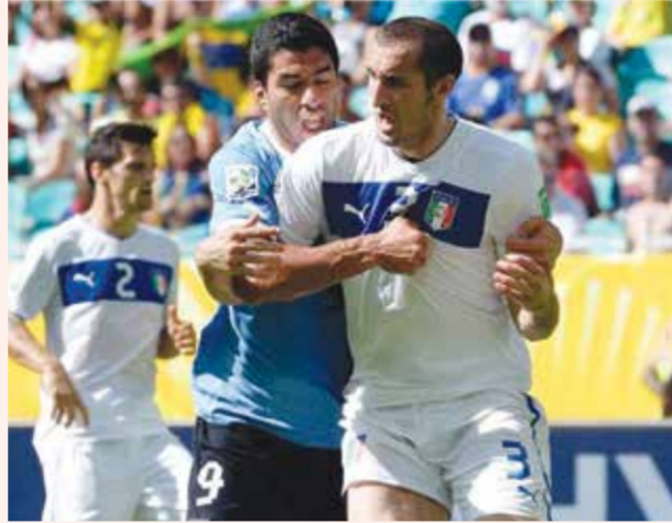
○ سواريس يعض كيبيلي.

في عام 2010، حرم لويس سواريس غانا من بلوغ الدور نصف النهائي. تعادل 1-1 والمباراة تصل إلى لحظاتها القاتلة. تسديدة غانية في طريقها إلى المرمى يقطعها سواريس عن الخط بيده. طرد سواريس، غير أن منتخب بلاده وصل إلى نصف النهائي بركلات الترجيح. في 2014، تصدر سواريس العناوين مجدداً: في دور المجموعات ضد إيطاليا، قام بـ «عض» كرف العادع جورجو كيبيلي بلا رحمة. صرخ الإيطالي من الألم، وطالب بلا جدوى بمعاذرة سواريس. لم تمر الحادثة مرور الكرام، إذ عوقب بعدها النجم الأوروغواياني بالإيقاف تسع مباريات مع منتخب بلاده.