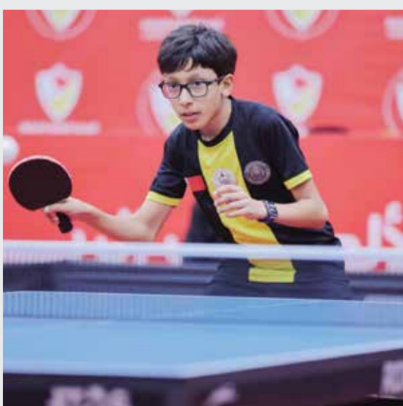
○ من مباريات مقابة.

يلتقي نادي سار بنادي مقابة في المباراة الختامية لدوري خالد بن حمد لجيل الذهب للأشبال لكرة الطاولة للموسم الرياضي 2025-2026 وذلك في تمام الساعة الخامسة مساء اليوم الأربعاء بحضور الشيخة حياة بنت عبد العزيز آل خليفة رئيس الاتحاد البحريني لكرة الطاولة وأعضاء مجلس الإدارة والمسؤولين في الهيئة العامة للرياضة. وتساوت أندية سار ومقابة والبحرين في عدد النقاط (14 نقطة) بعد اختتام القسمين الأول والثاني لدوري خالد بن حمد لجيل الذهب للأشبال لكرة الطاولة، وبحسب لوائح المسابقات