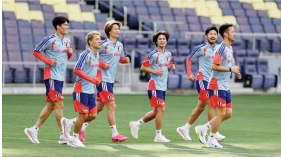
تدريبات اليابان.

وقال تيم ريم، قائد المنتخب الأمريكي: «أعتقد أن المجموعة في وضع جيد حقا في الوقت الحالي. لن أقول إننا شعرنا بالذهول، بل بمفاجأة سارة من الحماس والترقب المحيط بالفريق وفي الملاعب». وأضاف ريم «حضور 5500 مشجع مستعدين لمشاهدة حصة تدريبية فقط