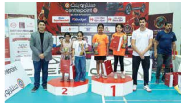
○ جانب من التتويج.