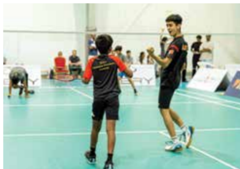
○ جانب من المنافسات.