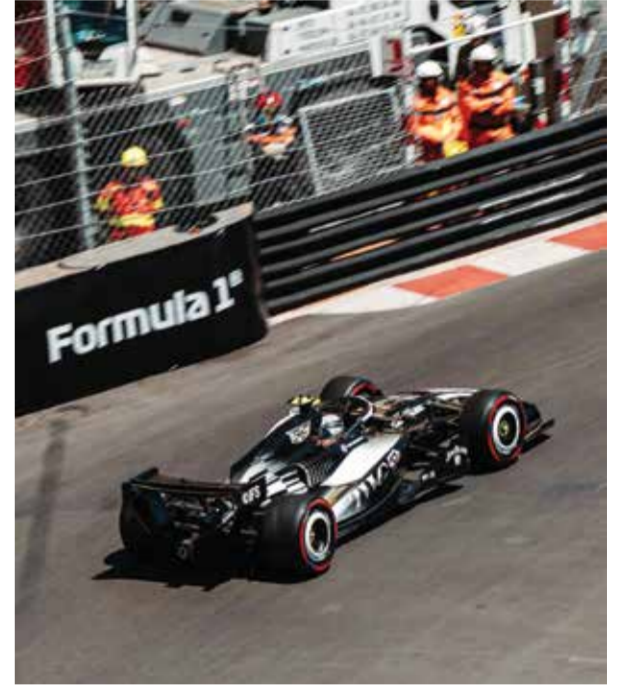
○ من مشاركة كاديلاك

وبعد خسارته في الدور الثالث، تراجع الصربي نوفاك ديوكفيتش ثلاثة مراكز ليحتل المركز السابع. وفي غياب ألكارس بسبب الإصابة والخروج الباكر