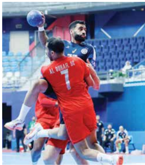
○ جانب من اللقاء.