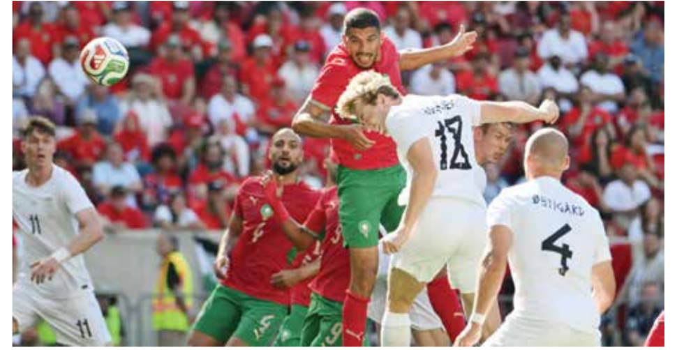
○ من مباراة المغرب والنرويج.

وبعدما سجل الهدف الوحيد في لوكسمبورغ، هُزّ مهاجم إنتر الشباب ابن الـ20 عاما الشيباك بتسديدة اصطدمت بأحد المدافعين واستقرت في الشباك (18). وكاد إسبوزيتو أن يضاعف النتيجة بعدما كسر مصيدة التسلسل، لكنه أهدر فرصة انفرادية مع الحارس أوديسياس فلاخوديموس (37)، بينما سدد لوكا كولوشوشو، لاعب وسط باريس اف سي الفرنسي، كرة ارتدت من العارضة (47).