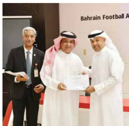
○ جانب من تسليم الشهادات.