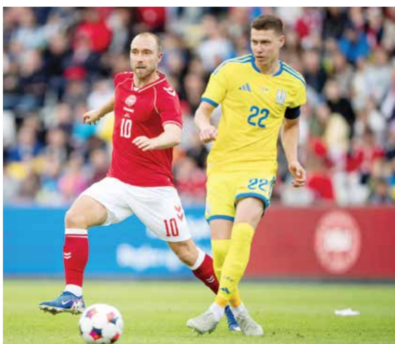
○ إريكسن قبل سقوطه في المباراة

تواصل داعم معهم». وسقط لاعب خط الوسط الهجومي البالغ 34 عاماً في الدقيقة 64 في ودية للمنتخب الدنماركي أمام ضيفه الأوكراني، عندما كان متقدماً 1-2. هرع الطاقم الطبي فوراً لنجذته، وأوقف الحكم المباراة التي كانت تقام في أودنسه بعد 15 دقيقة من الحادث. وبعد تلقيه العلاج، نهض لاعب خط الوسط الهجومي وغادر الملعب بمفرده، حسيماً أكد الطبيب بعد الحادث، ليتم نقله إلى مستشفى جامعة أودنسه. وأعاد هذا الحادث إلى الأذهان ذكريات المباراة الافتتاحية لكأس أوروبا 2021 في كوبنهاغن، عندما تعرض كريستيان إريكسن لأزمة قلبية. خضع إريكسن لاحقاً لعملية زرع جهاز مزيل الرجفان تحت الجلد، وتمكن من استئناف مسيرته الكروية في أوائل عام 2022، بعد ثمانية أشهر من الحادث.