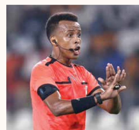
○ عمر عمرت (أ ف ب)

مونتيفيديو - (أ ف ب): غادر قلب دفاع برشلونة الإسباني رونالد أراوخو منتخب الأوروغواي مؤقتاً من أجل علاج «انزعاج عضلي»، على أن يلتحق بالمجموعة مجدداً اليوم الثلاثاء عند انطلاقها إلى موندiales 2026 المقرر في أمريكا الشمالية، بحسب ما أعلن الاتحاد المحلي لكرة القدم. وجاء في بيان الاتحاد «من أجل التخفيف من انزعاج عضلي، سيتلقى (أراوخو) علاجاً طبياً على أيدي مختصين قاموا بعلاجه سابقاً». ومن دون تقديم مزيد من التفاصيل، أوجى البيان بأن أراوخو توجه إلى برشلونة من أجل الخضوع لعلاج طبي سريع. وأضاف البيان أن أراوخو سيلتحق بالمنتخب اليوم الثلاثاء، على أن يتوجه في اليوم نفسه إلى مقر إقامة منتخب الأوروغواي خلال كأس العالم في بلابا ديل كارمن بالمكسيك التي تستضيفها النهائيات العالمية مع الولايات المتحدة وكندا اعتباراً من الخميس.