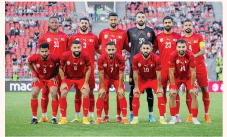
○ منتخبنا الوطني الأول لكرة القدم.