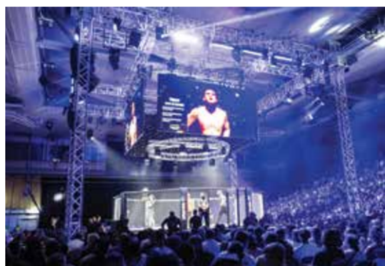
○ حضور جماهيري في بطولات بريف