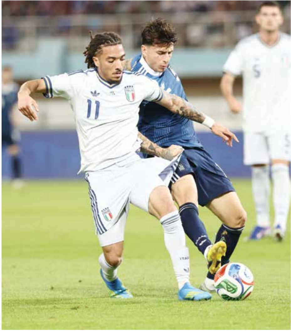
○ من مباراة إيطاليا واليونان

وأبقى المدرب بالديني ضمن التشكيلة الأساسية على تسعة لاعبين شاركوا أمام لوكسمبورغ، من دون أن يتمكن من تحقيق الأمل المنشودة، في حين عكس أداء المنتخب الإيطالي الشباب عملية إعادة بناء صعبة في المستقبل.