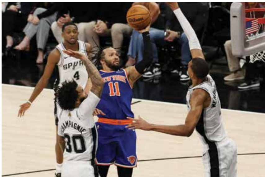
○ جانب من اللقاء.

سان أنتونيو - (أ ف ب): صمد نيويورك نيكس أمام عودة قوية لسان أنتونيو سيرز وفاز عليه مجددا في عصر داره 104-105، ليتقدم 2-0 في سلسلة نهائي دوري كرة السلة الأمريكي للمحترفين (أن بي إيه).