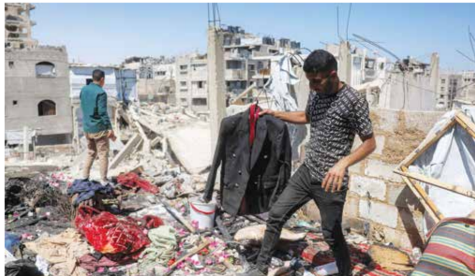
○ فلسطيني يحمل معطف قريبه الذي استشهد بنيران إسرائيلية قبيل زفافه بساعات. (أ ف ب)

غزة - (أ ف ب) - استشهد سبعة فلسطينيين في غارات إسرائيلية على قطاع غزة أمس، وفق ما أفاد الدفاع المدني ومصادر طبية. وأكد الدفاع المدني في بيان 25 أكتوبر 2025، تتواصل حرب الإبادة الإسرائيلية بنسق شبه يومي. وفي مدينة غزة، أسفرت غارة بطائرة مسيرة عن ستة شهداء و15 مصاباً في مخيم الجوازات للنازحين، حسبما أفاد الدفاع المدني. وأكد مستشفى الشفاء في مدينة غزة أنه استقبل ست جثث.