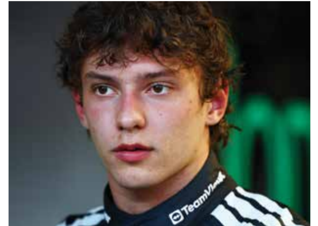
○ أنتونيلي (رويترز).

وهي فرصة مواتية للألماني البالغ 29 عاما، الذي اعتاد الأدوار الثانوية لسنوات: فالإسباني قلب عليه الطاولة في نهائي رولان غاروس 2024، والإيطالي هزمه في مواجهتهما التسع الأخيرة، بينها نهائي أستراليا المفتوحة 2025، فيما أقصاه الصربي من ربع نهائي باريس العام الماضي. كان دائما قريبا من القمة من دون أن يعقبها، حصل ابن هامبورغ على سمعة