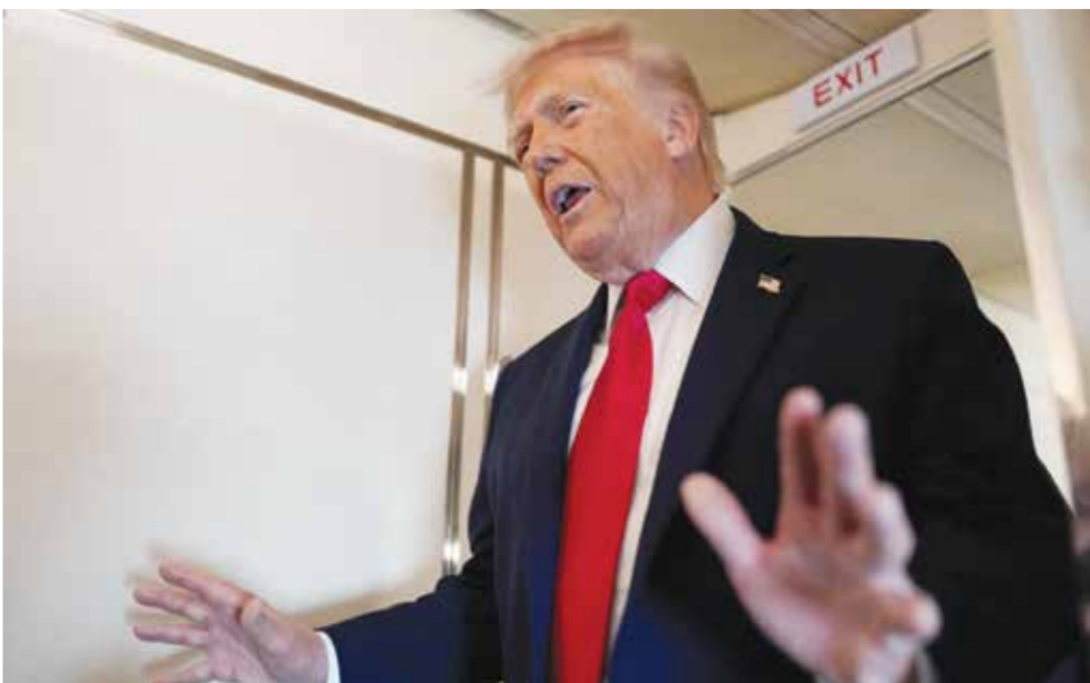
○ دونالد ترامب يرد على أسئلة الصحفيين على متن طائرة الرئاسة.

السياسية لكل قضية». وقالت مبادرات مدعومة من الرئيس، «الأشخاص الذين يختلفون معهم في الأساس من أقصاهم ترامب، وهذا في الحقيقة يدل على سيطرته المطلقة على الحزب». ومن جانبه، أرجع مسؤول في البيت الأبيض، طلب عدم الكشف عن هويته، هذا الاختلاف داخل الحزب الجمهوري إلى «حسابات سنة الانتخابات»، قائلاً «ليس كل عضو مستعداً لتحمل التكلفة