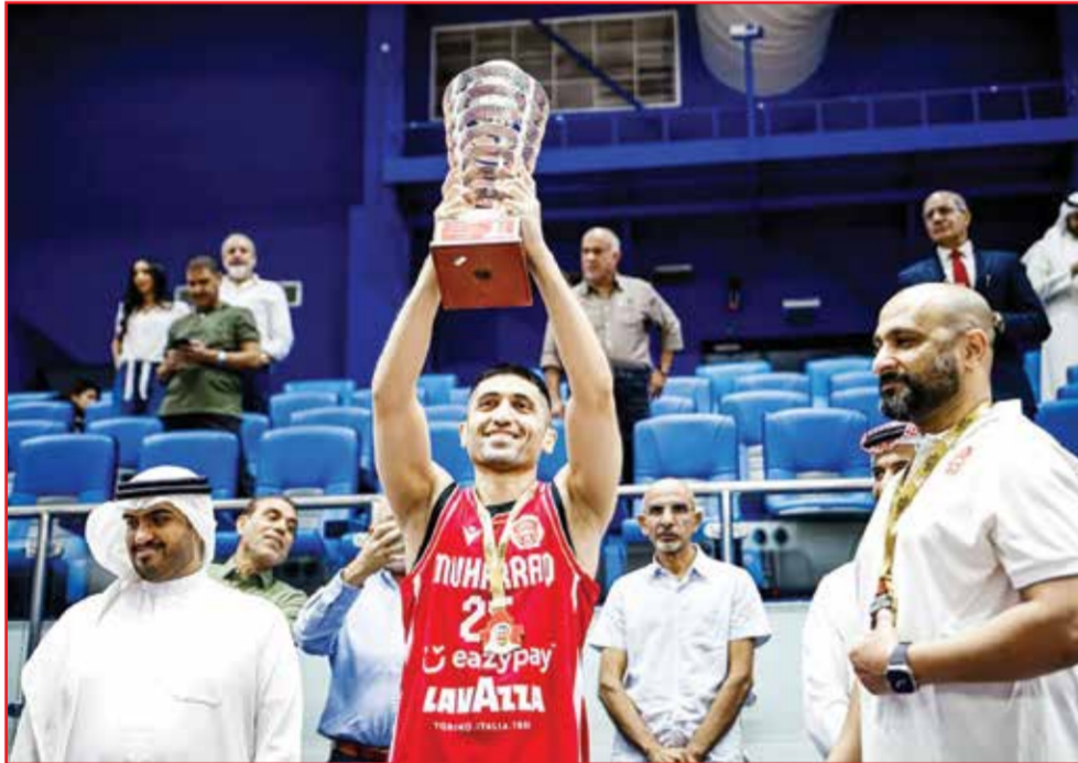
○ التتويج بكأس السوبر.