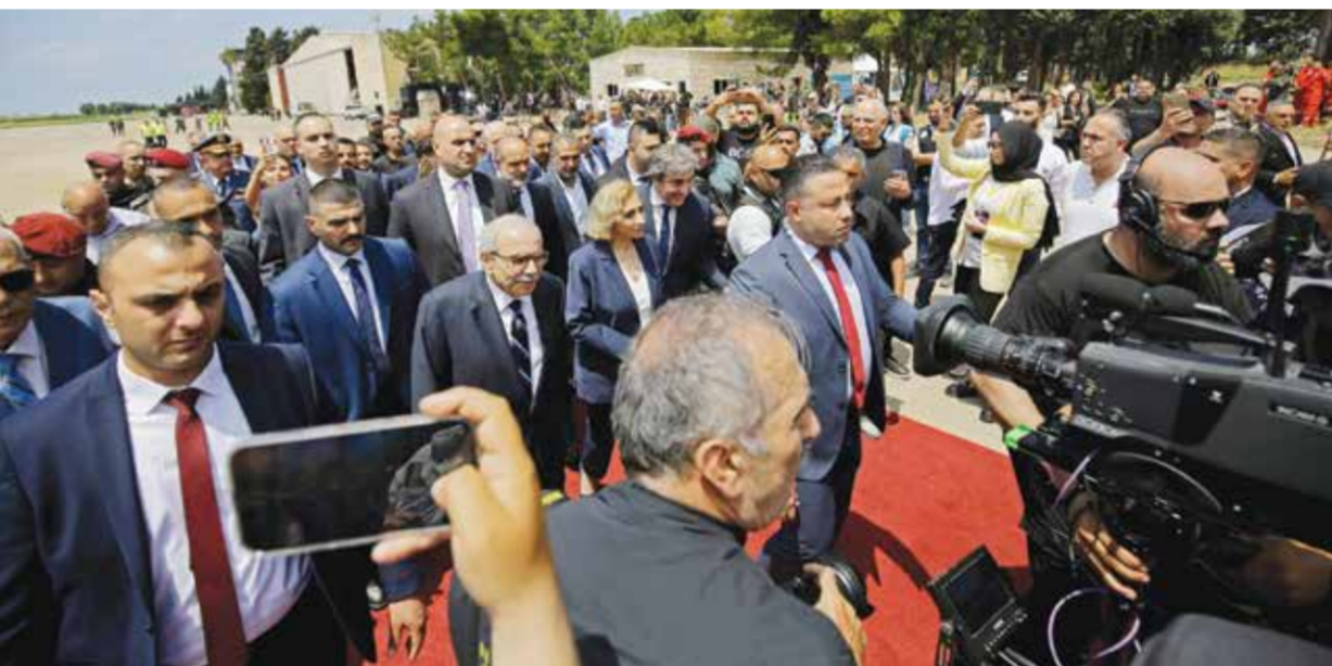
○ رئيس الوزراء اللبناني لدى وصوله إلى بلدة قليعات لحضور حفل افتتاح أعمال مطار رينيه معوض.

ومن شأن تشغيله كمنفذ دولي أن يتيح فرص عمل في محافظة عكار التي تعتبر من أكثر محافظات لبنان فقراً وتعاني من نسبة بطالة مرتفعة. واضطر لبنان مراراً إلى انتزاع ضمانات بعدم استهداف مطار بيروت الذي سبق أن اتهمت إسرائيل حزب الله باستخدامه في نقل الأموال والسلاح وهو ما نفته السلطات اللبنانية مراراً. وواصل المطار عمله على الرغم من الحرب بين حزب الله وإسرائيل منذ عام 2024 وصولاً إلى الحرب الأخيرة منذ 2 مارس. لكنه تعرض لصفع إسرائيلي في حروب أخرى.