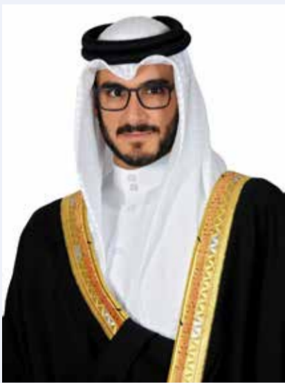
○ سمو الشيخ عيسى بن سلمان بن حمد آل خليفة.

هنأ سمو الشيخ عيسى بن سلمان بن حمد آل خليفة وزير ديوان رئيس مجلس الوزراء رئيس الهيئة العليا لنادي راشد للفروسية وسباق الخيل، سمو الشيخ ناصر بن حمد آل خليفة ممثل جلالة الملك للأعمال الإنسانية وشؤون الشباب رئيس المجلس الأعلى للشباب والرياضة، وسمو الشيخ خالد بن حمد آل خليفة النائب الأول لرئيس المجلس الأعلى للشباب والرياضة رئيس الهيئة العامة للرياضة رئيس اللجنة الأولمبية البحرينية، بمناسبة فوز المهر «باي سيتي رولر» لفريق فيكتور يوس فور إيفر في سباق كأس «كورونيشن» للفتة الأولى (Group 1)، ضمن منافسات مهرجان إبسوم داونز بالمملكة المتحدة، بقيادة الفارس أوشرين مرفسي وتدريب جورج سكوت.