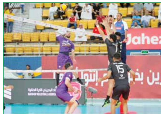
○ لحظة فنية للفريق خلال المنافسات