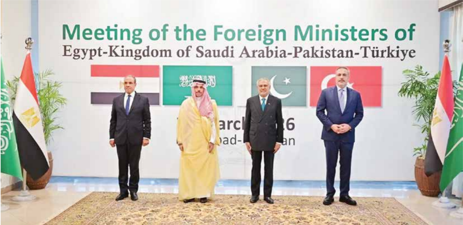
○ الاجتماع الرباعي لوزراء خارجية مصر والسعودية وتركيا وباكستان في إسلام آباد الذي أثار الذعر والقلق في إسرائيل.

ولا شك أن إنشاء هذا التحالف الاستراتيجي الجديد بقيادةه الرباعية (السعودية ومصر وتركيا وباكستان) سوف يحدث انقلابا استراتيجيا في كل المعادلات السياسية والعسكرية في المنطقة باتجاه استعادة القدرة الفاعلة على التأثير وإملاك روح المبادرة والثقة بالذات في صياغة المستقبل العربي والإسلامي بمبادرات أكثر عزة وشموخا واستقلالية.