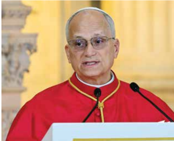
○ البابا ليو متحدثاً خلال مراسم استقباله في مدريد.

الإسباني. وسيلقي البابا خطاباً أمام البرلمان الإسباني، وسيبارك البرج الجديد لكاتدرائية ساغرادا فاميليا في برشلونة التي باتت تُعد الآن أطول كنيسة في العالم. وبعد إسبانيا حيث عيّن البابا عن «قلق» إزاء الوضع في أوكرانيا داعياً مجدداً إلى «حل» يتوجّه إلى جزر الكناري قبالة سواحل إفريقيا، وهي البوابة الرئيسية للمهاجرين إلى إسبانيا بعد رحلات طويلة محفوفة بالمخاطر من إفريقيا. وسيلتقي لاوون الرابع عشر يومي الخميس والجمعة بمهاجرين ومنظمات تساعدنهم. وسيستقبله بيدرو سانتشيز الذي سيحضر بعد ذلك حفلة تكريم لآلاف المهاجرين الذين لقوا حتفهم أثناء محاولتهم الوصول إلى أوروبا. وتقدّر المنظمة الدولية للهجرة التابعة للأمم المتحدة أن 1172 مهاجراً لقوا حتفهم أو فقدوا على طول هذا الطريق في عام 2025، وهو رقم أدنى يقلل من ذلك المسجل سنة 2024 والذي بلغ 1215 شخصاً.