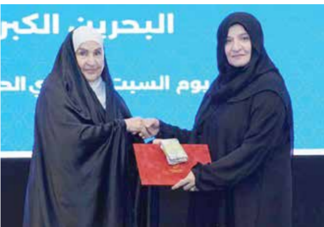
○ د. الشبيخة مريم بنت حسن خلال تكريم الفائزات.