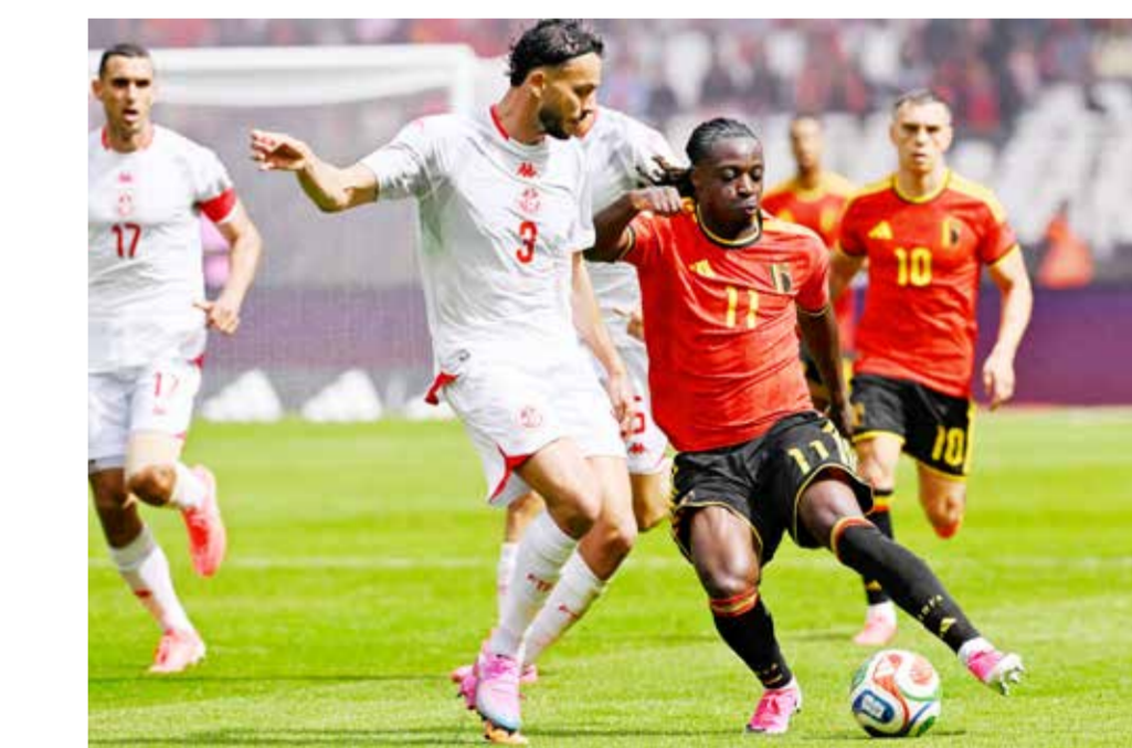
○ جانب من اللقاء.

وأوضح مدرب باراغواي الأرجنتيني غوستافو ألفارو في نهاية المباراة أن إنسيو تعرض للإصابة من زوجتين في الورك والفخذ الأيمن».