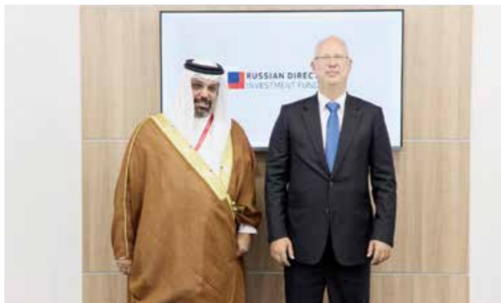
○ وزير المالية مع كيريل دميترييف.

تسبب هذا في زيادة التوقعات في الأسواق باستمرار التضخم في التزايد والضغط على البنوك المركزية العالمية بسبب استمرار التوترات الجيوسياسية