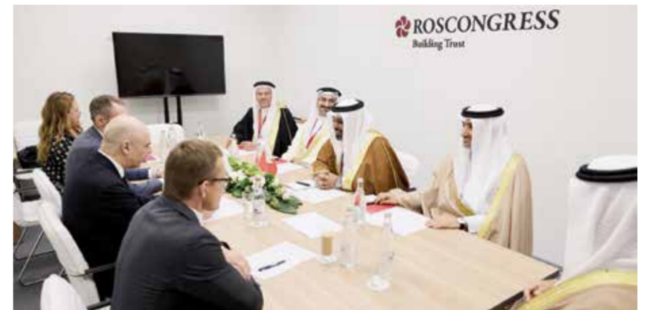
○ جانب من لقاء وزير المالية مع نظيره الروسي.