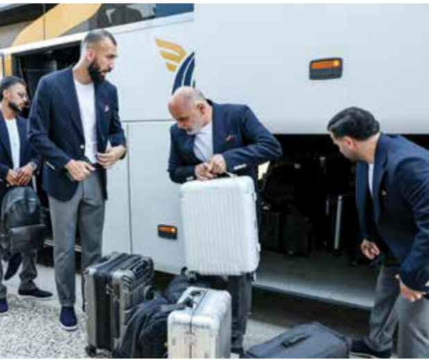
○ أعضاء المنتخب الإيراني لدى وصولهم إلى مطار انطاليا في طريقهم إلى المكسيك

فبراير. أما وقف إطلاق النار في 8 أبريل، الذي أوقف القتال، فيشهد حالياً انهياراً متسارعاً في ظل موجة ضربات حديثة بين الولايات المتحدة وإيران. وفي أبريل، قال وزير الخارجية الأميركي ماركو روبيو: إن أي مشكلة لن تكون مع اللاعبين