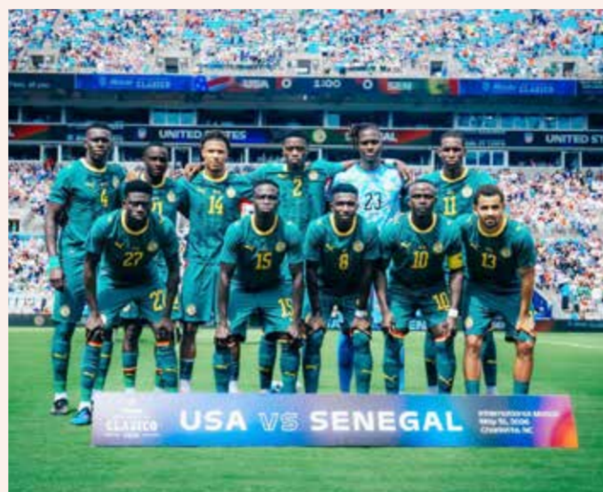
○ المنتخب السنغالي.

وتابع: «لو سارت الأمور لصالحنا، يمكننا أن نفوز على منتخبات كبرى مثل فرنسا وإسبانيا، لكن يجب أن تكون الأمور مثالية للغاية، ولا أراها بين المرشحين للفوز باللقب».