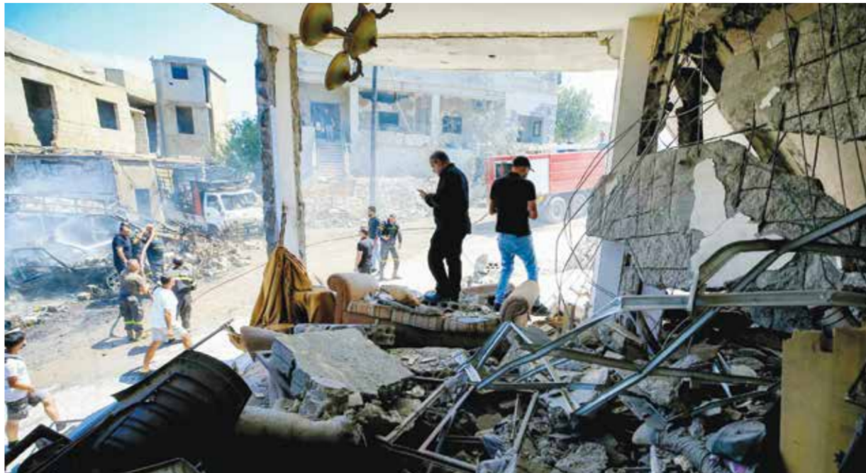
○ لبنانيون يتفحصون الأضرار التي لحقت بمنزلهم بعد غارات إسرائيلية على بلدة السكسية بقضاء صيدا. (أ ف ب)

بيروت - (أ ف ب) - ندد رئيس الجمهورية اللبنانية ميشال عون أمس بانتهاك صارخ لسيادة بلده بعد استشهاد ثلاثة عسكريين بغارة إسرائيلية استهدفت البنتاغون في جنوب لبنان، وذلك رغم اتفاق لبنان وإسرائيل على تطبيق هدنة مشروطة عقب جولة محادثات مباشرة في الولايات المتحدة. وتواصلت أسس الغارات الإسرائيلية على قرى عديدة في جنوب لبنان وفق ما أفادت الوكالة الوطنية للإعلام الرسمية، بينما أصدر الجيش الإسرائيلي إنذارا بإخلاء خمس قرى في جنوب وشرق لبنان.