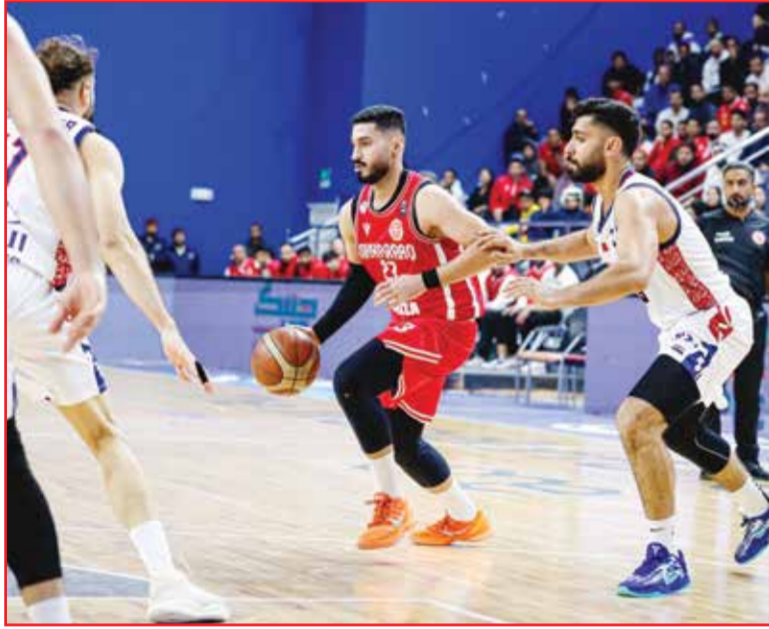
○ من منافسات الدوري.