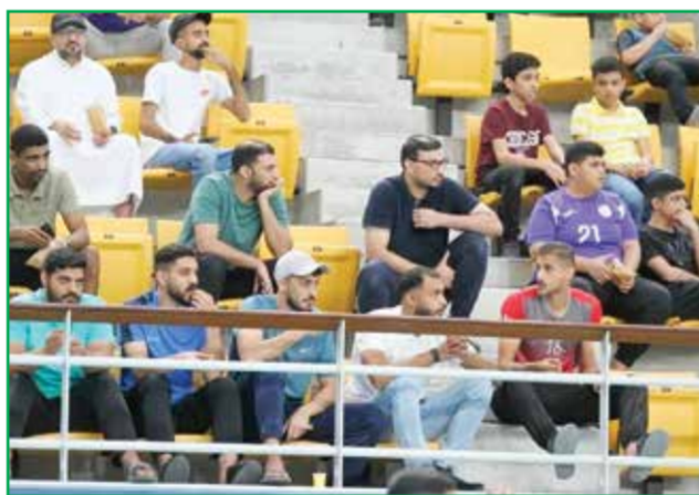
○ جانب من انصار الفريق