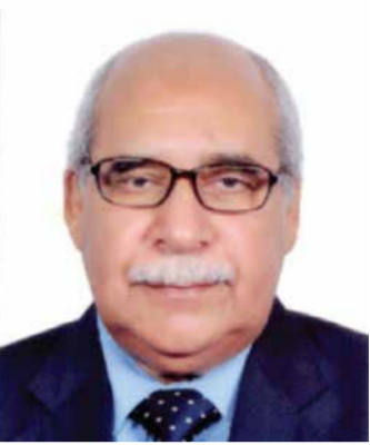
بـقلم: عبدالرحمن علي البنفلاح

ففي المدينة المنورة بدأ الرسول (صلى الله عليه وسلم) في تنظيم العلاقات بين المسلمين ونظرائهم من أهل الكتاب من اليهود والنصارى، ومن ليس لهم كتاب سماوي أمر الرسول (صلى الله عليه وسلم) أن يستن فيهم المسلمون سنة أهل الكتاب من اليهود والنصارى.