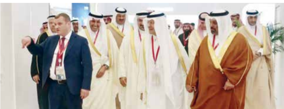
○ وزير المالية خلال مشاركته في منتدى سان بطرسبورغ.