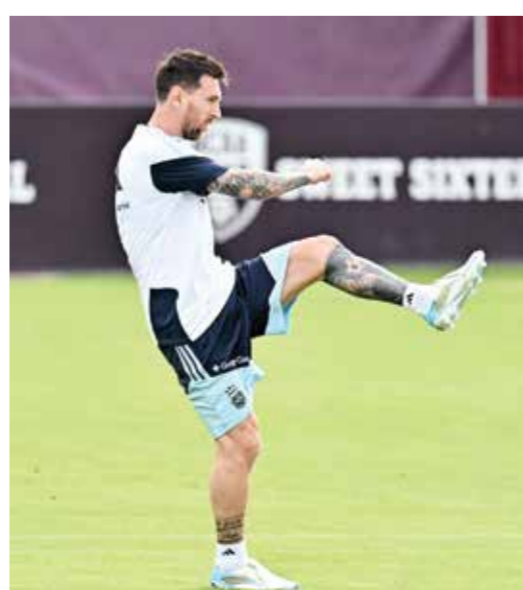
○ ميسي يشارك في التدريبات.

38 عاماً أمام هندوراس. وفي خط الدفاع، يواصل الظهيران الأيمنان ناهويل مولينا وغونزالو مونتيل التعافي من تمزقات عضلية، فاستدعى الجهاز الفني أغوستين غياري ونيكولاس كابالدو لتعويضهما في هاتين المباراتين الوديتين. كما أكد سكالوني أن الحارس خوان موسو (أتليكو مدريد) سيكون أساسياً أمام هندوراس، في ظل إصابة الحارس الأول إيميليانو مارتينيس (أستون فيلا الإنجليزي) بكسر في أصبع البنصر في يده اليمنى خلال الإحماء قبل نهائي الدوري الأوروبي (يوروبا ليغ) أمام فرايبورغ الألماني. وقرر الجهاز الطبي إراحة مارتينيس في هاتين المباراتين الوديتين، على أن يكون متاحاً لمباراة الأرجنتين الأولى في موندiales 2026 أمام الجزائر في 16 يونيو في كانساس سيتي.