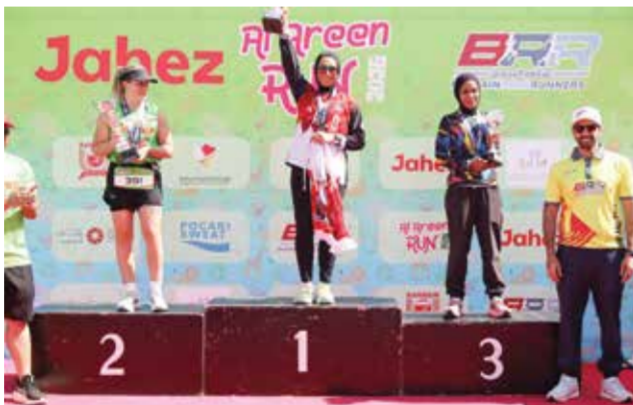
○ جانب من التتويج.

وتأتي هذه الفعالية في إطار حرص لجنة عدائي البحرين على نشر الثقافة الرياضية وتعزيز الصحة العامة في المجتمع، وفي إطار الخطة السنوية للجنة والتي تتضمن إقامة سلسلة من السباقات وأنشطة الجري بالتعاون مع مختلف مؤسسات القطاع العام والخاص، ويمكن للمتسابقين الراغبين في المشاركة بفعاليات اللجنة مستقبلاً متابعة صفحة اللجنة على الإنستغرام @bahrainroadrun-ners للحصول على الرابط للتسجيل وأحدث جدول أنشطة اللجنة.