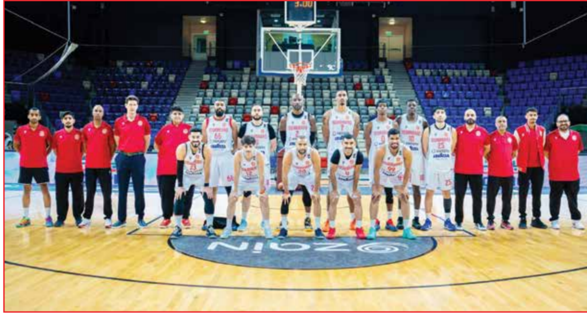
○ فريق المحرق الأول لكرة السلة.