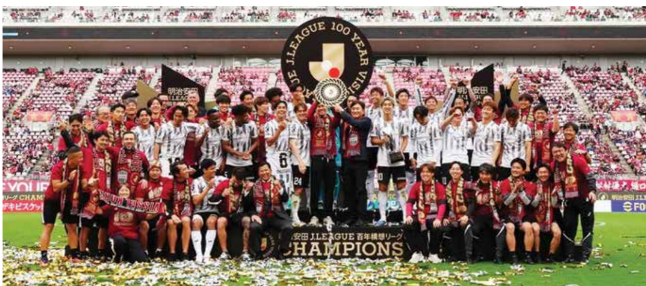
○ جانب من التتويج.

وأكد ويستهم أن تلك الادعاءات لا علاقة لها بالنادي أو أي شيء يخصه. وأضاف أن سوليفان نفى ارتكاب أي مخالفات، لكنه قرر