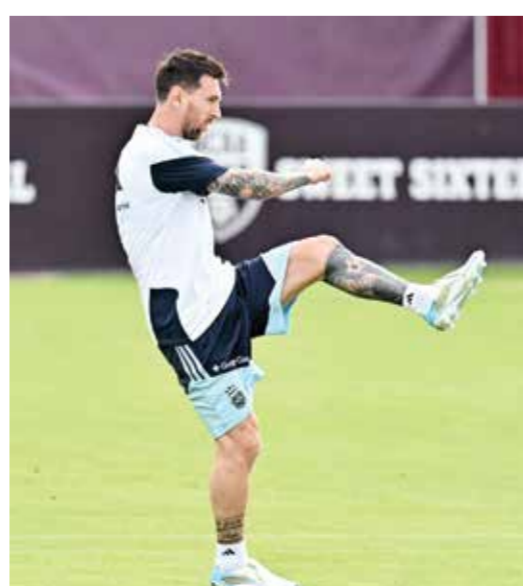
○ ميسي يشارك في التدريبات.

38 عاماً أمام هندوراس. وفي خط الدفاع، يواصل الظهيران الأيمنان ناهويل مولينا وغونزالو مونتيل التعافي من تمزقات عضلية، فاستدعي الجهاز الفني أغوستين غياني ونيكولاس كابالدو لتعويضهما في هاتين المباراتين الوديتين. كما أكد سكالوني أن الحارس خوان موسو (أتليكو مدريد) سيكون أساسياً أمام هندوراس، في ظل إصابة الحارس الأول إيميليانو مارتينيس (أستون فيلا الإنجليزي) بكسر في أصبع البنصر في يده اليمنى خلال الإحماء قبل نهائي الدوري الأوروبي (يوروبا ليغ) أمام فرايبورغ الألماني. وقرر الجهاز الطبي إراحة مارتينيس في هاتين المباراتين الوديتين، على أن يكون متاحاً لمباراة الأرجنتين الأولى في موندوبال 2026 أمام الجزائر في 16 يونيو في كانساس سيتي.