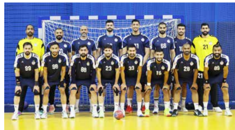
○ فريق النجمة

ركز الجهاز الفني خلال الفترة الماضية على تجهيز اللاعبين بالشكل الأمثل ووضع المسلمات الأخيرة على الجوانب التكتيكية الخاصة بالمباراة.