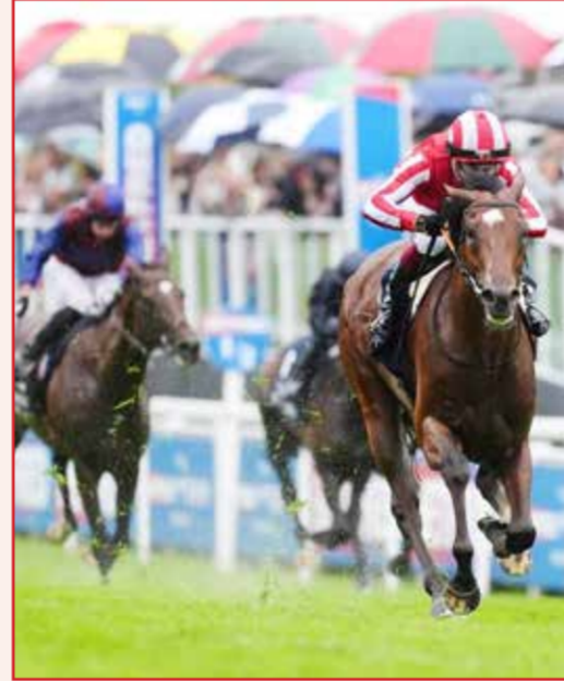
○ جانب من السباق

يضاف إلى سجل الإنجازات الرياضية المشرفة التي تواصل مملكة البحرين تحقيقها، ويؤكد المكانة الراقدة التي تتبوأها المملكة في رياضة الفروسية وسباقات الخيل، مشيداً بما حققه فريق فيكتوريوس فور إيفر بقيادة سمو الشيخ ناصر بن حمد آل خليفة وسمو الشيخ خالد بن حمد آل خليفة من نجاحات متواصلة على الساحة الدولية، متمنياً للفريق دوام التوفيق والنجاح وتحقيق المزيد من الإنجازات الرياضية المشرفة.