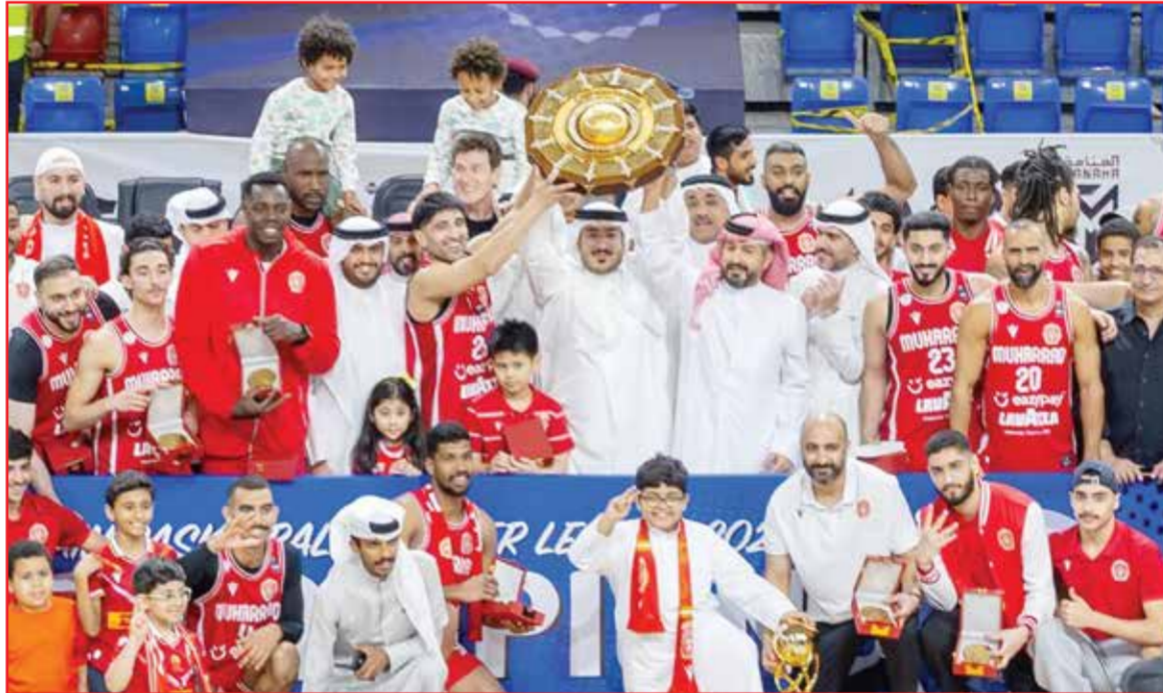
○ جانب من التتويج بدوري زين.