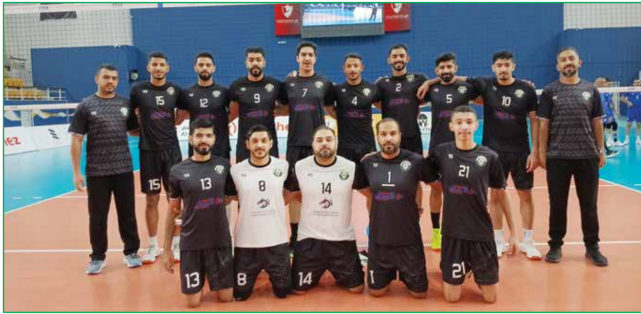
○ فريق بني جمرة لكرة الطائرة