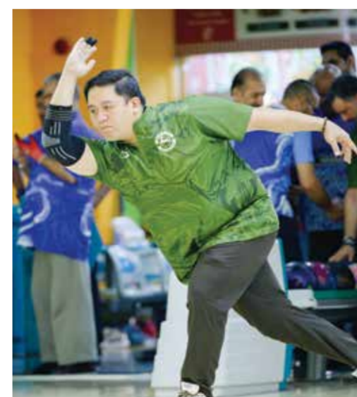
○ جانب من المنافسات.

وتنتج الأنتظار إلى منافسات الجولة السادسة المقبلة التي ينتظر أن تشهد مزيداً من الإثارة والمنافسة، وخاصة في ظل تقارب المستويات بين فرق المقدمة وسعيها لتعزيز حظوظها في المنافسة على لقب الدوري العام للبولينج، إذ ستقام منافساتها يوم الأحد المقبل عند الساعة السادسة والنصف مساءً بصالة أرض المرح ان سيلتيق مدينة عيسى مع الاتفاق، والبسيتين مع الرفاع، وام الحصم مع البحرين، والحالة مع سند.