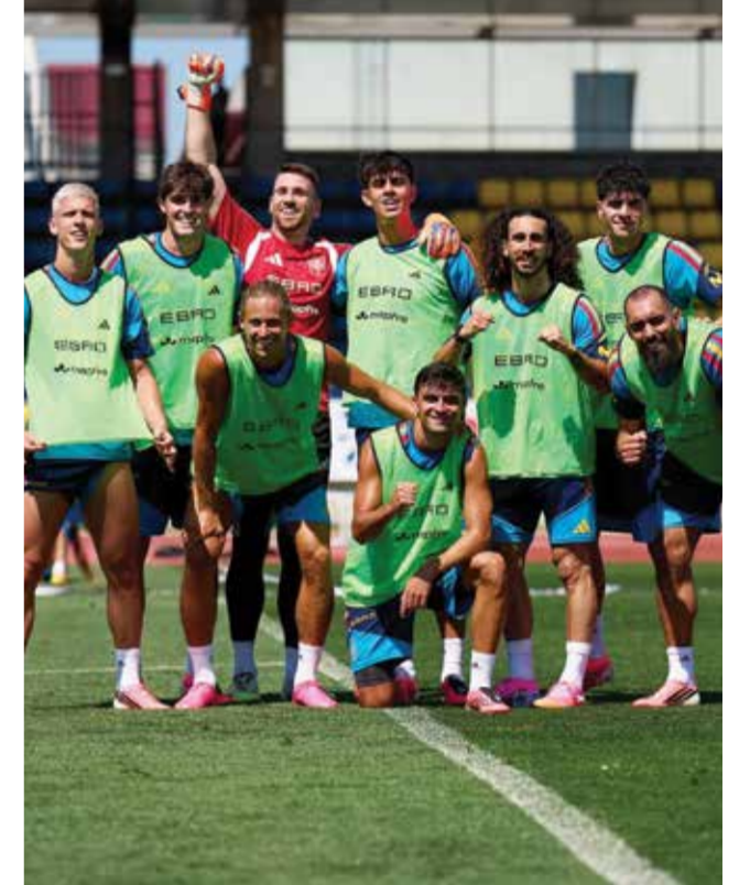
○ تدريبات منتخب إسبانيا.