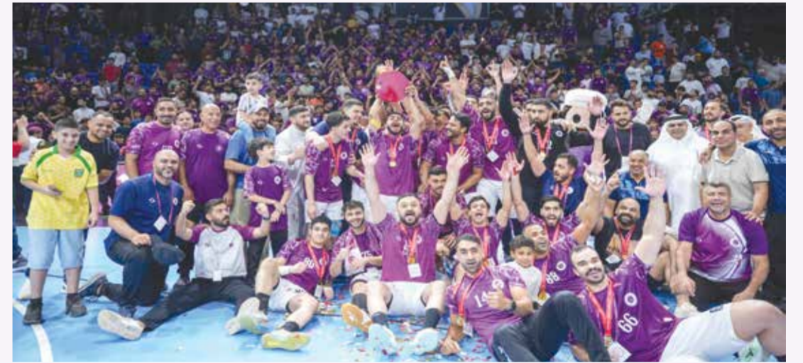
○ فرحة البطل.