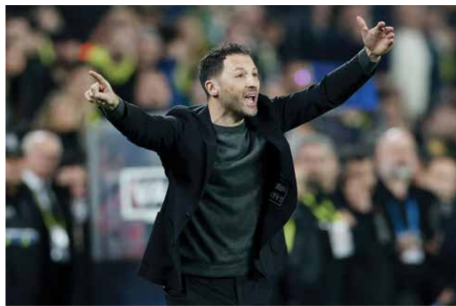
○ تيديسكو.

ووسع عبد الحميد الفارق بشكل كبير مع أقرب ملاحقيه من النجوم المحليين: حيث حل فرانس البريكان مهاجم الأهلي في المرتبة الثانية تاريخيا بـ 6 ملايين يورو، مصعب (4.5 ملايين يورو)، سالم الدوسري (3.2 ملايين يورو) وذلك عام 2021، يليه سلطان الغنام لاعب النصر 3 ملايين يورو وذلك في عام 2022، ويفصل الغامدي لاعب الاتحاد (2.5 مليون يورو).