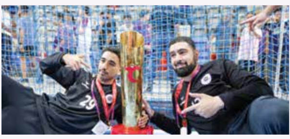
○ فرحة الحراس.