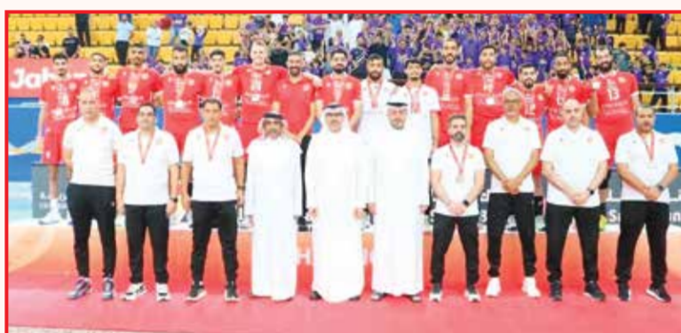
○ تتويج المحرق بوصافة بطل الدوري.