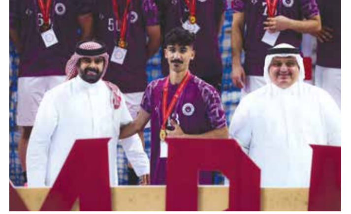
○ سموه يتوج الأبطال.