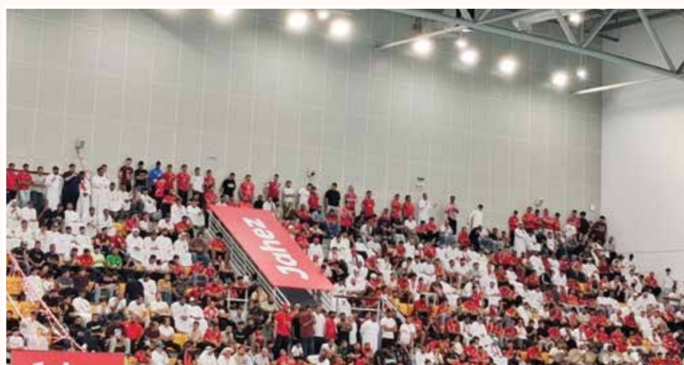
○ جانب من حضور جماهير المحرق.

○ لقد أثبتت طائرة المحرق هذا الموسم أن التحديات والصعاب مهما بلغت، تذوب أمام التخطيط السليم، وتكاتف الإدارة برئاسة الشيخ أحمد بن علي آل خليفة، وعزيمة الرجال داخل الملعب. لبيقي المحرق دائماً شامخاً بأبطاله، ومحلقاً في سماء الإنجازات.