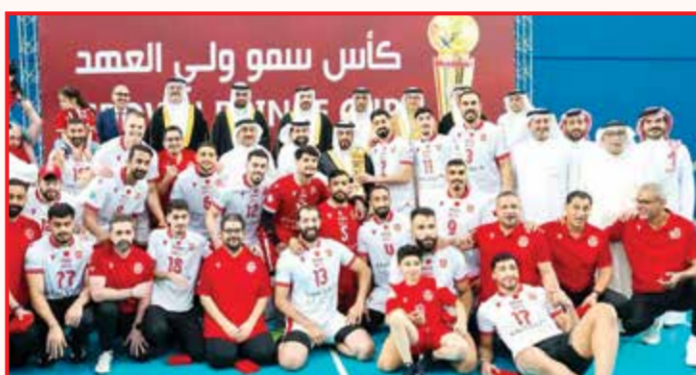
○ خلال تتويج المحرق بأعلى كؤوس الطائرة.