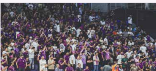
○ جماهير باربار.