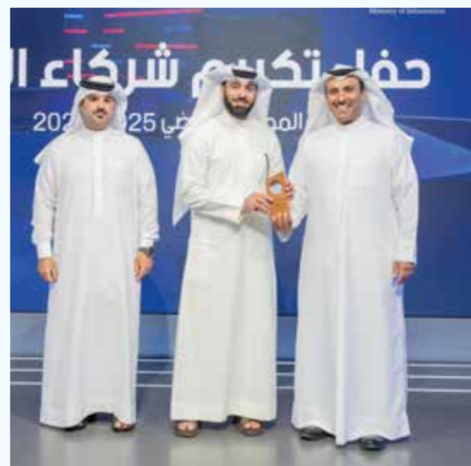
○ تكريم العاملين والداعمين