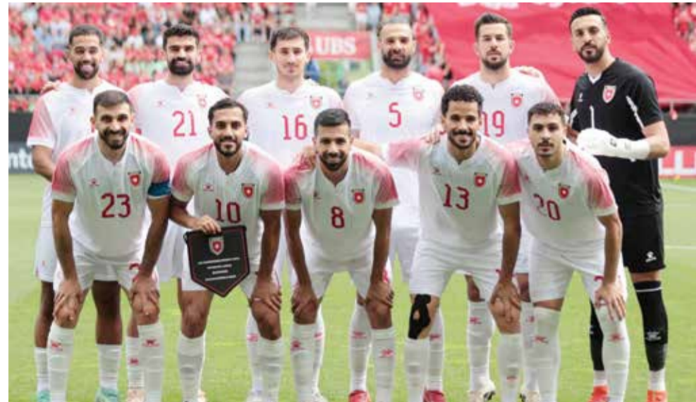
○ المنتخب الأردني.