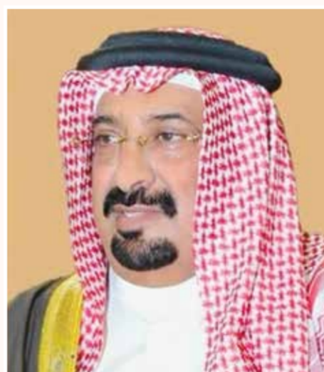
○ الشيخ أحمد بن علي بن عبد الله آل خليفة.