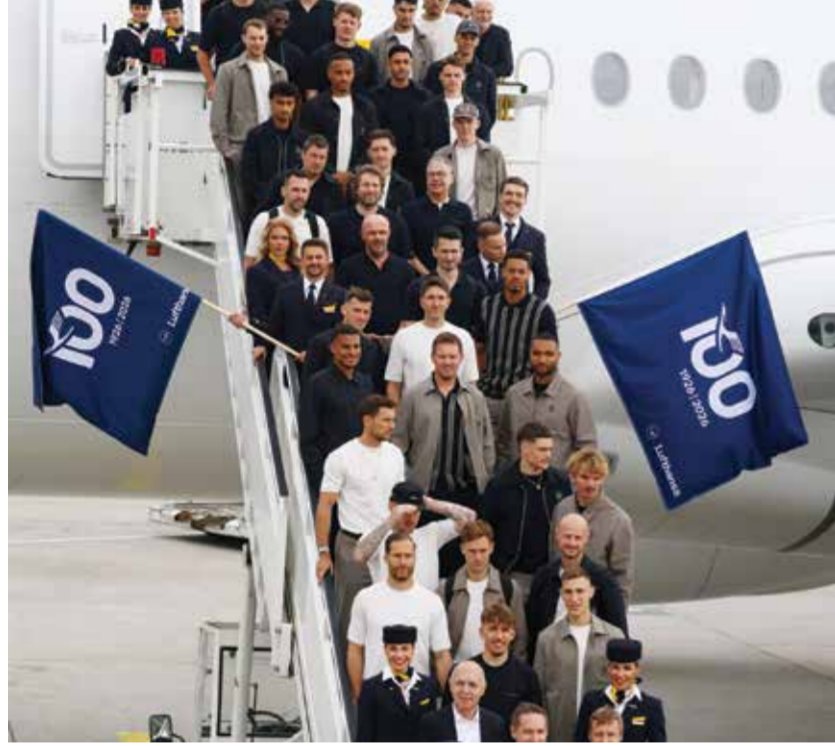
○ المنتخب الألماني.

لم يكن خالباً من التحديات، فقد حجزت ألمانيا بطاقة العبور في الجولة الأخيرة من التصفيات في نوفمبر 2025، بعد تصدرها المجموعة الأولى التي ضمت سلوفاكيا وإيرلندا الشمالية ولوكسمبورج. ورغم البداية الصادمة بالخسارة صفر / 2 في براتيسلافا، استعاد الفريق توازنه ليحقق خمسة انتصارات في ست مباريات، مسجلاً 16 هدفاً ولم تستقبل شباكه سوى ثلاثة أهداف فقط، واختتمت التصفيات بانتصار عريض بنصف دستة أهداف على سلوفاكيا.