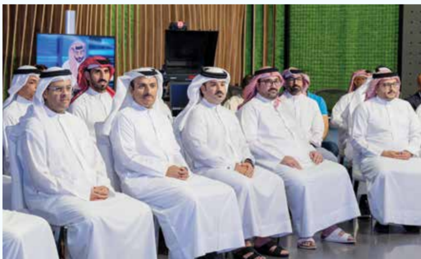
○ جانب من الحفل