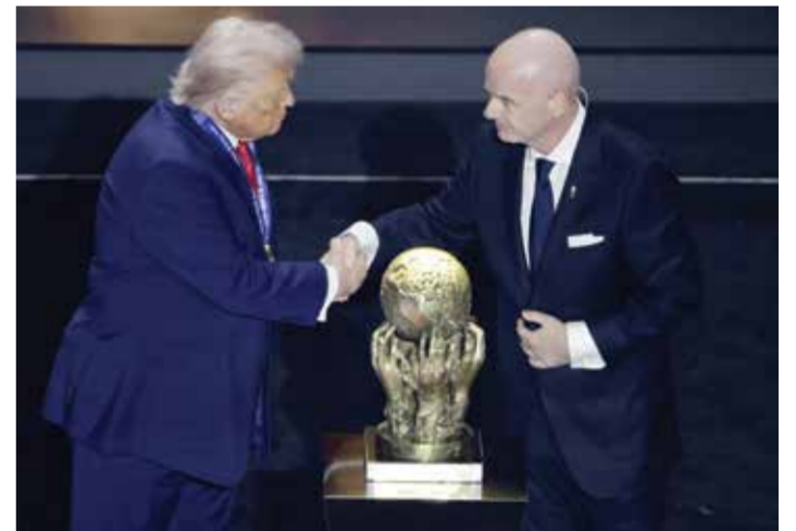
○ ترامب أثناء تسلمه جائزة السلام.

وكان جاني إيفانغيتينو رئيس فيفا قد منح ترامب جائزة السلام في نسختها الأولى خلال حفل سحب قرعة مونديال 2026 الذي أقيم في 6 ديسمبر الماضي. وفي وقت لاحق من الشهر نفسه، قدمت منظمة «فيرسكوير» الحقوقية شكوى إلى لجنة الأخلاقيات في «فيفا»، مدعية أن إيفانغيتينو قد خالف واجبه في الحياد بدعمه لترامب. ولم يكشف «فيفا» قط عن كيفية