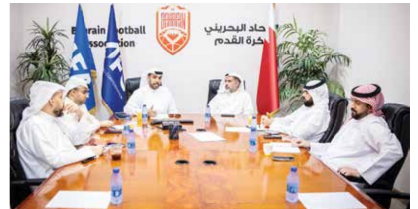
○ جانب من الاجتماع.