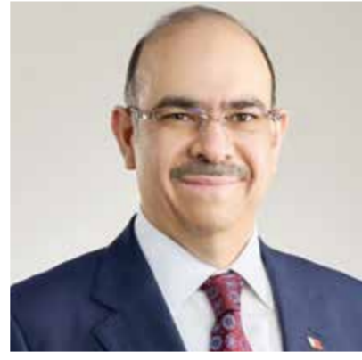
○ وزير العمل والشؤون القانونية.