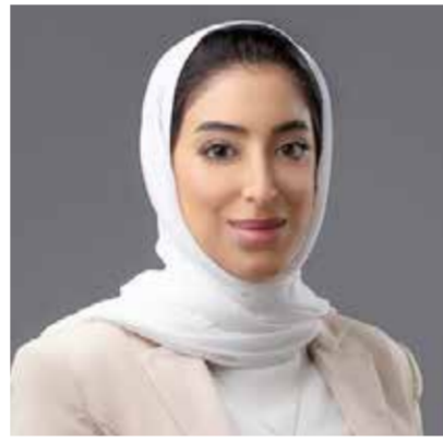
○ وزيرة السياحة.