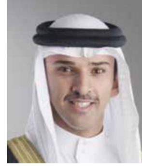
○ الشيخ علي بن خليفة.

والإسلامية، وبورها الريادي في تعزيز التضامن العربي، مؤكداً أن المملكة، بفضل الوعي المجتمعي والتكامل المؤسسي، قادرة دائماً على تحويل التحديات إلى فرص وأعادة تخدم تطلعات الوطن والمواطنين.