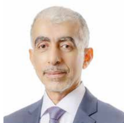
○ وزير الأشغال.