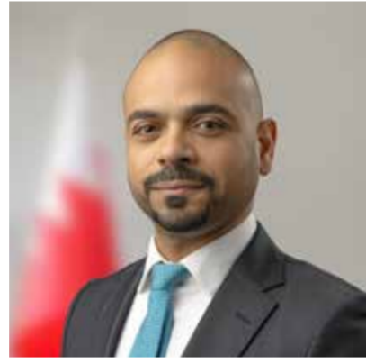
○ وزير التنمية الاجتماعية.