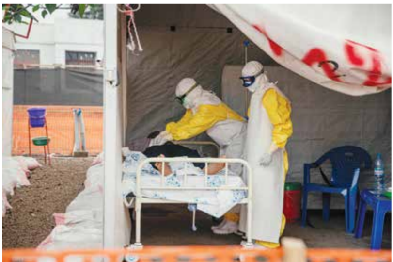
○ طبيبان من منظمة أطباء بلا حدود يفحصون مصابا بفيروس إيبولا في إحدى مناطق الكونغو.

ممن ثبتت إصابتهم بالفيروس خلال التفشي الحالي. ولا يتوافر حاليا لقاح أو علاج معتمد لسلالة «بونديبوجيو»، ما يجعل إجراءات الوقاية والسيطرة على العدوى الوسيلة الأساسية لاحتواء انتشار المرض.