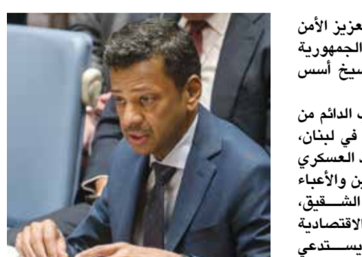
○ جمال الرويعي.

الذي ألقاه السفير جمال فارس الرويعي، المندوب الدائم لمملكة البحرين لدى الأمم المتحدة بنيويورك، خلال مشاركة المملكة في الجلسة الطارئة لمجلس الأمن التي تناولت التصعيد الأخير في الجمهورية اللبنانية الشقيقة. وفي إطار جهود منع التصعيد، أشاد المندوب الدائم بالجهود الحثيثة التي تبذلها الولايات المتحدة الأمريكية في إطار الوساطة والمسامحة الدبلوماسية الرامية إلى تثبيت الاستقرار ومنع اتساع دائرة النزاع، مؤكداً دعم مملكة البحرين للمسار التفاوضي بين الجمهورية اللبنانية ودولة إسرائيل، وتطلعها إلى أن يفضي هذا المسار