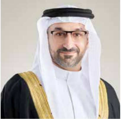
○ وزير الصناعة والتجارة.