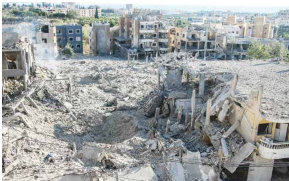
○ دمار هائل في صور جراء الغارات الإسرائيلية العنيفة.

واعتبر رئيس الوزراء اللبناني نواف سلام أمس أن المطلوب من المحادثات هو «تثبيت وقف إطلاق النار في كل أنحاء لبنان». وأضاف أن «المفاوضات هي الخيار الأقل كلفة على لبنان واللبنانيين».