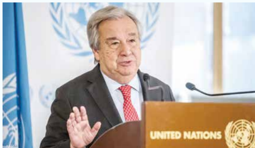
○ أنطونيو غوتيريش.

توغّل عسكري له منذ 26 عاما. وأعلن وقف إطلاق النار بين الجانبين في 17 أبريل، لكنه لم يحقق الكثير على الأرض لجهة وقف القصف والغارات والمواجهات.