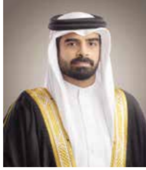
○ الشيخ سلمان بن محمد.