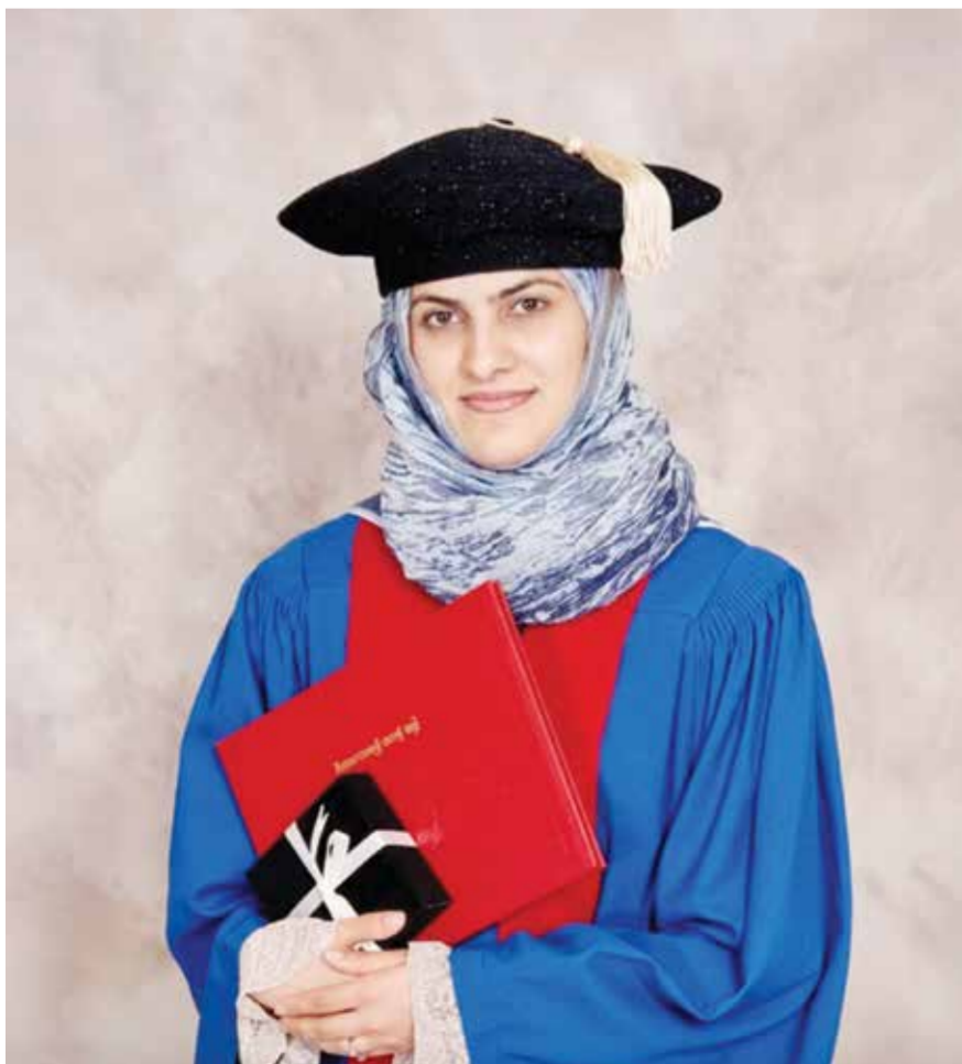
التخرج في جامعة ديبول.

عملي كرئيس لقسم الموارد البشرية بديوان سمو ولي العهد من أهم المحطات ■ أجمل حصاد المشوار أبنائي وأتمنى دور أكبر للمرأة البحرينية في الموارد البشرية