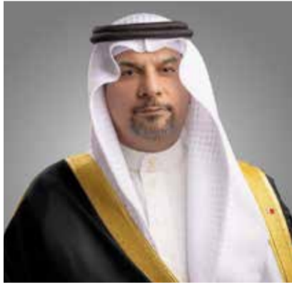
○ وزير النفط والبيئة.