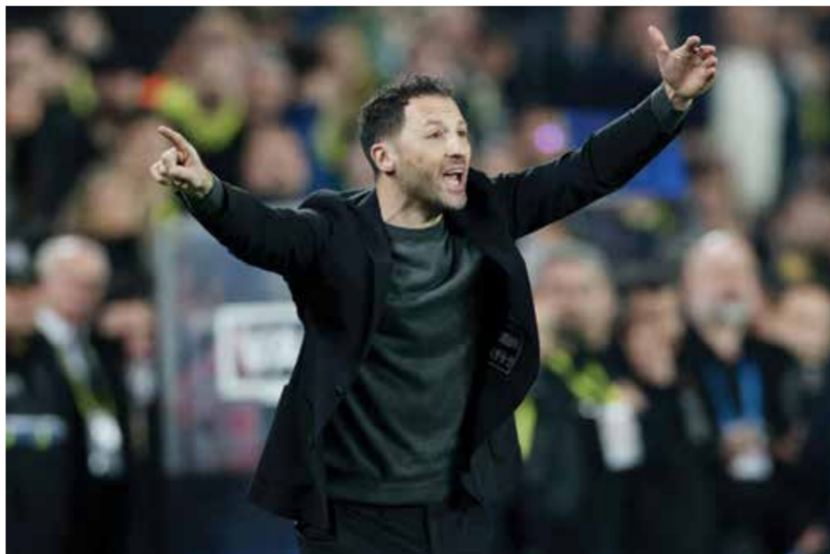
○ تيديسكو. (رويتزر)

وقد سعى إنفانتينو علنا إلى توطيد علاقاته مع ترامب قبيل انطلاق كأس العالم التي تقام في الفترة من 11 يونيو إلى 19 يوليو في الولايات المتحدة وكندا والمكسيك.