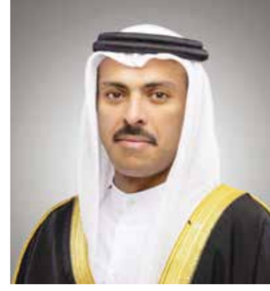
○ وزير الإعلام.

أكد الدكتور رمزان بن عبدالله النعيمي وزير الإعلام أن الخطاب الملكي السامي الذي تفضل به حضرة صاحب الجلالة الملك حمد بن عيسى آل خليفة ملك البلاد المعظم، خلال الاجتماع الاعتيادي الأسبوعي لمجلس الوزراء، جسّد منظومة القيم الوطنية الأصيلة وما تتضمنه من معاني الوفاء للوطن والانتماء والمسؤولية الوطنية، التي شكّلت على الدوام مصدر قوة مملكة البحرين ومنعتها.