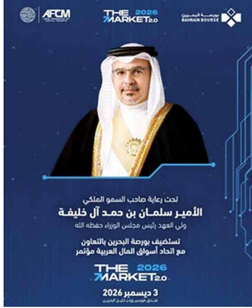
تحت رعاية صاحب السمو الملكي الأمير سلمان بن حمد آل خليفة ولي العهد رئيس مجلس الوزراء حفظه الله تستضيف بورصة البحرين بالتعاون مع اتحاد أسواق المال العربية مؤتمر THE MARKET 2.0 3 ديسمبر 2026

سبل جعل أسواقنا العربية أكثر كفاءة ومرونة وترباط واستعداداً للمستقبل. ونحن فخورون بالشراكة مجدداً مع بورصة البحرين في استضافة النسخة الثانية على التوالي في مملكة البحرين، والبناء على نجاح نسخة عام 2025، وعلى الأهمية المتزايدة للتكنولوجيا في رسم ملامح المرحلة المقبلة من تطوير الأسواق الإقليمية.