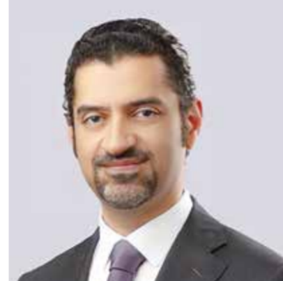
○ وزير شؤون البلديات والزراعة.