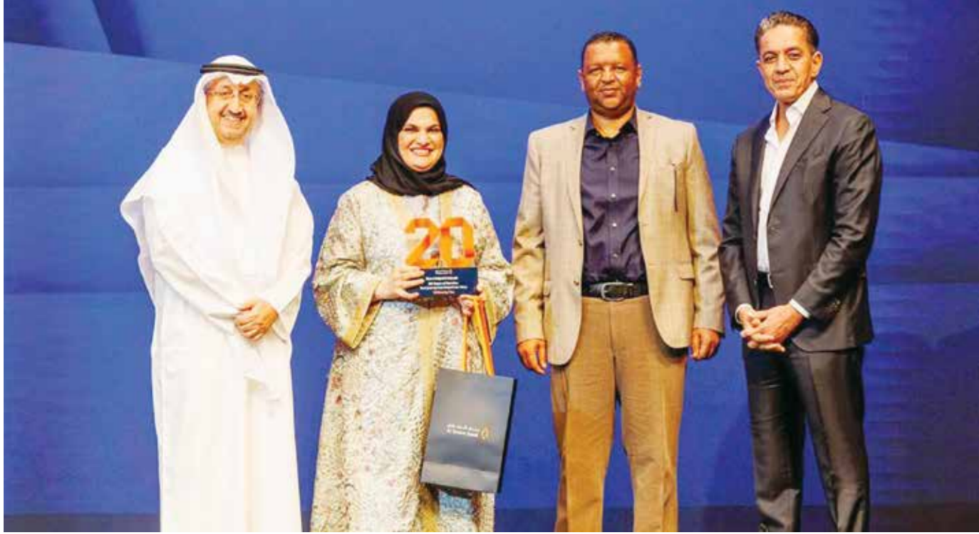
تكريم بمناسبة عشرين عام عمل مع البنك.