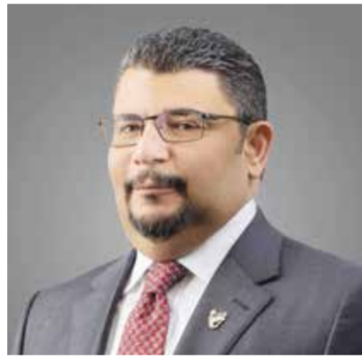
○ وزير شؤون الكهرباء والماء.