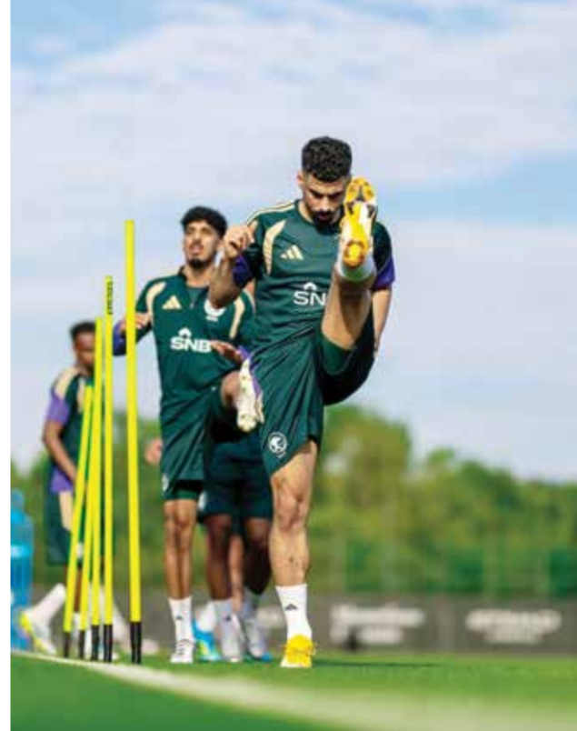
○ تحضيرات المنتخب السعودي.

لندن - (أ ف ب): واجهت تحضيرات إسبانيا لكأس العالم لكرة القدم مخاوف تتعلق بالجاهزية البدنية، من بينها النجم لامين جمال، في وقت يواجه فيه مدرب الأوروغواي مار سيلو بيلسا تحديا لسلطته قبل السعي إلى إحداث مفاجأة أمام أبطال أوروبا في المجموعة الثامنة. وقد غيب جمال، لاعب برشلونة، بحسب تقارير، عن أول مباراتين لإسبانيا أمام الرأس الأخضر، التي تشارك للمرة الأولى في البطولة، والسعودية، بسبب إصابة في العضلة الخلفية تعرض لها في أبريل. ولا يُعد اللاعب البالغ 18 عاما مصدر القلق الوحيد بالنسبة إلى المدرب لويس دي لا فوينتسي، إذ إن عددا من العناصر الأساسية في التشكيلة التي توجت بكأس أوروبا 2024 عانت من مواسم متقطعة. وعلى سبيل المثال، فإن رودري الذي فاز بالكرة الذهبية على وقع نجاح إسبانيا في ألمانيا قبل عامين، لم يتمكن من استعادة مستواه المعهود منذ تعرضه لتمزق في الرباط الصليبي للركبة في سبتمبر 2024. كما ضمّ دي لا فوينتسي كلاً من لاعب وسط أرسنال الإنكليزي ميكيل ميرينو وجناح أنتونيك بلباو نيكو وليامس، رغم غيابهما عن معظم عام 2026 مع ناديهما. ومع ذلك، يُتوقع أن تتأهل «لا روكا» بسهولة إلى الأدوار الإقصائية، في سعيها للاقتداء بالمنتخب الإسباني الوحيد المتوج سابقا بكأس العالم، الذي جمع بين لقب كأس أوروبا 2008 والتتويج العالمي بعد عامين في جنوب إفريقيا. وسيكون احتلال صدارة المجموعة بالغ الأهمية لحظوظ إسبانيا، إذ من المرجح أن يواجه صاحب المركز الثاني حامل اللقب الأرجنتيني في دور الـ32.