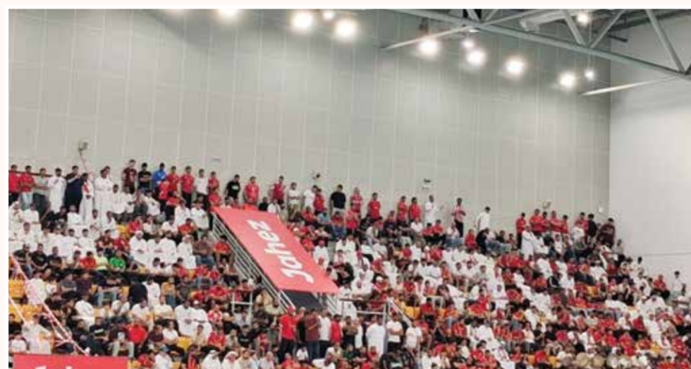
○ جانب من حضور جماهير المحرق.

○ لقد أثبتت طائرة المحرق هذا الموسم أن التحديات والصعاب مهما بلغت، تذوب أمام التخطيط السليم، وتكاتف الإدارة برئاسة الشيخ أحمد بن علي آل خليفة، وعزيمة الرجال داخل الملعب. لبيقي المحرق دائماً شامخاً بأبطاله، ومحلقاً في سماء الإنجازات.