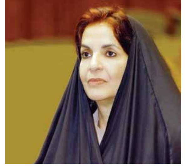
○ سمو الأميرة سبيكة بنت إبراهيم آل خليفة.

أعربت صاحبة السمو الملكي الأميرة سبيكة بنت إبراهيم آل خليفة قرينة ملك البلاد المعظم رئيسة المجلس الأعلى للمرأة عن بالغ اعتزازها وفخرها بالمضامين السامية والرسائل التاريخية الاستثنائية التي اشتمل عليها الخطاب الموجه من لدن حضرة صاحب الجلالة الملك حمد بن عيسى آل خليفة ملك البلاد المعظم،