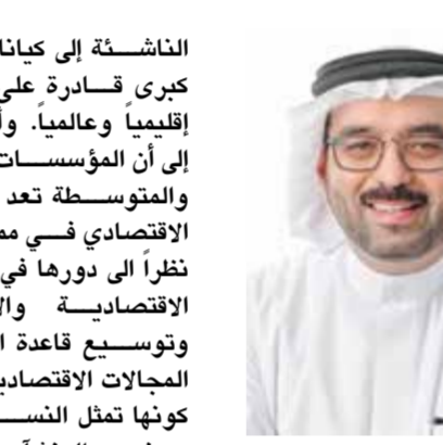
○ أحمد السلوم.

أكد النائب أحمد صياح السلوم رئيس اللجنة المالية والاقتصادية بمجلس النواب الأمين المالي بغرفة البحرين أن مناقشة مشروع قرار بشأن تصنيف المؤسسات متناهية الصغر والصغيرة والمتوسطة، بما يوسع نطاق دعم المؤسسات ويتوافق مع الممارسات الدولية خلال ترؤس حضرة صاحب الجلالة الملك حمد بن عيسى آل خليفة ملك البلاد المعظم، الاجتماع الاعتيادي الأسبوعي لمجلس الوزراء، بحضور صاحب السمو الملكي الأمير سلمان بن حمد آل خليفة ولي العهد رئيس مجلس الوزراء، حملت رسالة مهمة وواضحة بأهمية هذا القطاع في دعم النمو الاقتصادي وتنويع القاعدة الإنتاجية بما يجعله شريكا محوريا في مسيرة التنمية ومصورا لتعزير التنافسية والمرونة الاقتصادية. وأوضح أن هذا التوجه السامي يعزز مكانة المؤسسات الصغيرة