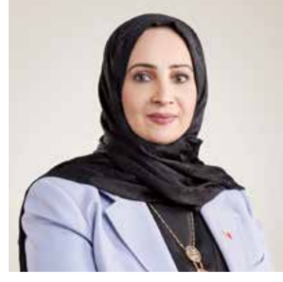
○ وزيرة الصحة.