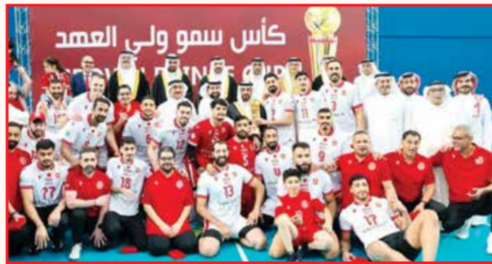
○ خلال تتويج المحرق بأعلى كؤوس الطائرة.