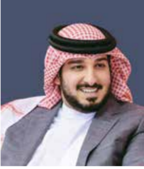
○ الشيخ عيسى بن عبد الله.

وفي ختام تصريحه عاهد سمو الشيخ عيسى بن عبدالله آل خليفة القيادة الحكيمة على مواصلة العمل الدؤوب والوفاء خلف نهج جلالة الملك المعظم، وموازرة جهود سمو ولي العهد رئيس مجلس الوزراء، مؤكداً سموه تسخير المنظومة الرياضية لترجمة هذه التوجهات إلى واقع يعزز رفعة مملكة البحرين.