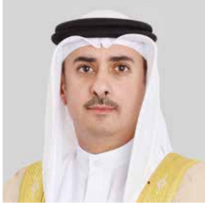
○ وزير العدل.