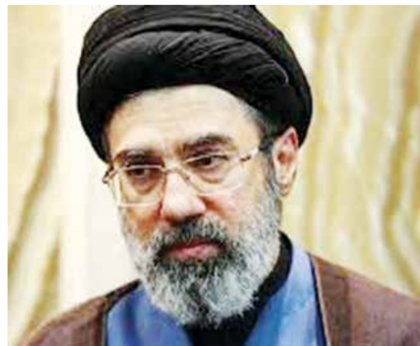
○ مجتبي خامنئي.

أي رسوم عبور لن تُفرض. وستساعد في إزالة الألغام التي زرعوها هناك، ولن تُستهدف السفن». وأضاف «يجب أن يوافقوا على التفاوض على قيود صارمة وطويلة الأمد، و/أو إلغاء أنشطة التخريب».