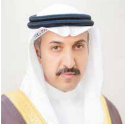
○ وزير المواصلات.