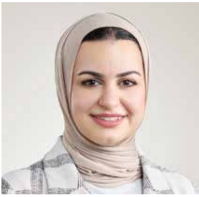
○ وزيرة شؤون الشباب.