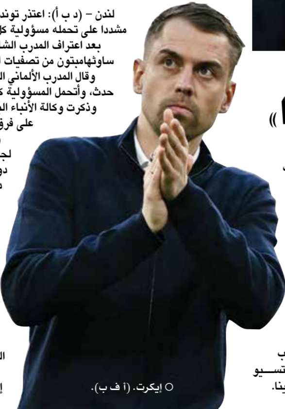
○ إيكرت. (ا ف ب).

وتسبب ذلك في ضياع عائداً مالية بقيمة 200 مليون جنيه إسترليني (269 مليون دولار) على نادي ساوثهامبتون.