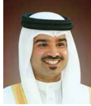
○ سمو الشيخ خليفة بن علي.