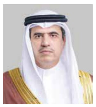
○ د.علي الرميحي.

أشاد الدكتور علي بن محمد الرميحي رئيس مجلس أمناء معهد البحرين للتنمية السياسية بالمضامين الوطنية السامية التي تضمنها خطاب حضرة صاحب الجلالة الملك حمد بن عيسى آل خليفة ملك البلاد المعظم، خلال ترؤسه الاجتماع الاعتيادي لمجلس الوزراء، مؤكداً أن الخطاب يجسد رؤية ملكية راسخة تعزز الثوابت الوطنية البحرينية، وترسخ قيم الولاء والانتماء، وتحافظ على وحدة الصف الوطني في مواجهة مختلف التحديات. وأكد أن ما تفضل به جلالة الملك المعظم من إشادة بالمواقف الوطنية المشرفة التي عبر