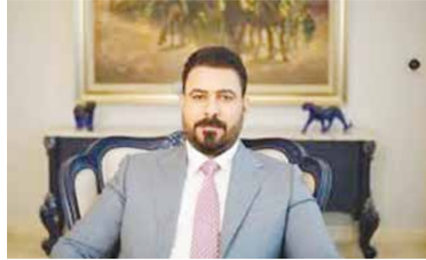
○ رئيس الحكومة العراقية مصمم على حصر السلاح بيد الدولة.

بزعامة مقتدى الصدر. وقالت مصادر صحفية عراقية إن خمسة فصائل مسلحة عراقية تجري مفاوضات مع الحكومة لتسليم سلاحها للدولة. ويترب أن تعلن كتائب حزب الله العراقي وحركة النجباء وكتائب الشهداء وفصائل أخرى عرف عنها رفع راية القتال ضد القوات الأمريكية في العراق والمنطقة بعد أن كشفت قوى الإطار التنسيقي الشيعي موقفها الصريح الداعم لحكومة العراقية من قضية حصر السلاح بيد الدولة وحصر قرار إدارة الحرب بالدولة وأن أي فعل خارج هذا الإطار يعد خروجاً على القانسون ومبادئ الدولة الدستورية.