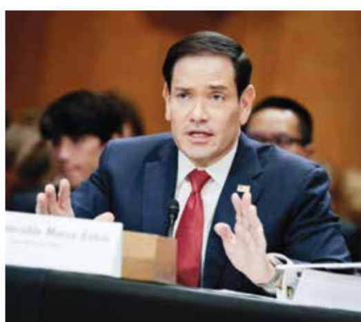
○ روبيو خلال جلسة الاستماع بمجلس الشيوخ.

وأضاف «المحادثات مستمرة من دون انقطاع، قبل أربعة أيام وثلاثة أيام ويومين ويوم واحد، وحتى اليوم»، وتابع «إلى أين ستقود هذه المحادثات؟ لا أحد يعلم، لكنني قلت لإيران: لقد حان الوقت لإبرام اتفاق. لن يستمر الوضع القائم منذ 47 عاما على حاله!».