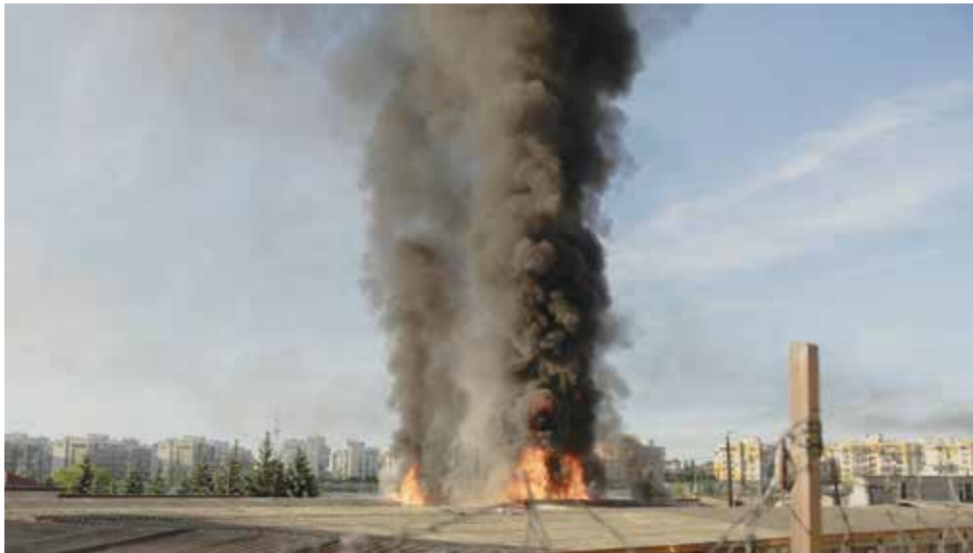
○ عمود من اللهب والدخان يتصاعد من منشأة في كييف بعد هجوم روسي.

الأوروبي منذ الحرب العالمية الثانية إذ أدى إلى مقتل مئات آلاف الأشخاص ودفن الملايين إلى النزوح. وأعلن الجيش الروسي أمس الثلاثاء تنفيذ «ضربة كبيرة» استخدمت فيها صواريخ فرط صوتية مستهدفا مواقع تابعة للمجمع العسكري الصناعي الأوكراني. وتنفى موسكو أن تكون قواتها تستهدف المدنيين.