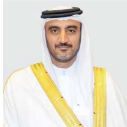
○ وزير شؤون مجلس الوزراء.