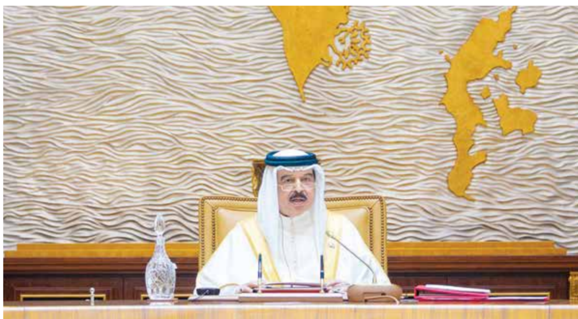
○ جلالة الملك المعظم خلال ترؤسه جلسة مجلس الوزراء أمس الأول.

وأوضحوا أن الرؤية الملكية القائمة على حماية المنجزات الوطنية وتعزيز الاستقرار السياسي والأمني تشكل ضماناً لاستدامة التنمية الاقتصادية، وترسخ مكانة البحرين كمركز إقليمي جاذب للأعمال والاستثمار.