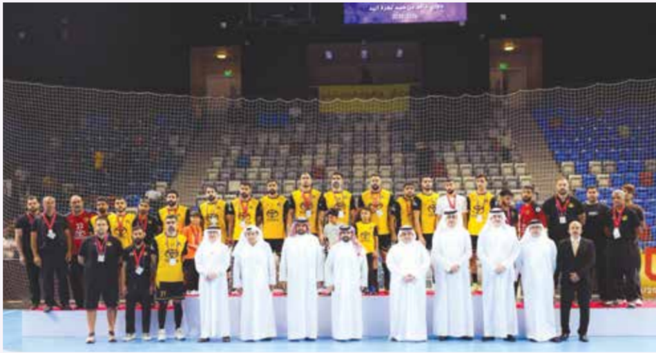
○ تتويج الوصيف.