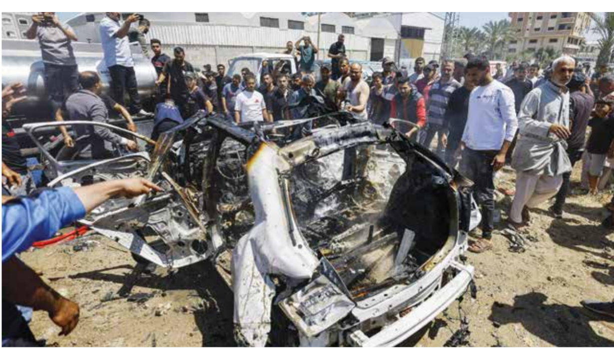
○ فلسطينيون يعاينون سيارة استهدفتها قوات الاحتلال في دير البلح.

نفس كبيرة شرقي خان يونس، وشرقي غزة، إلى جانب إطلاق نار وقصف مدفعي استهدف عدة مناطق من شرقي القطاع.