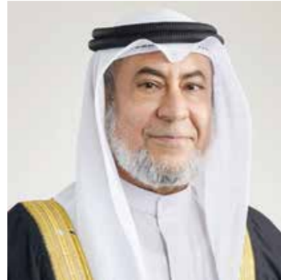
○ وزير شؤون المجلسين.