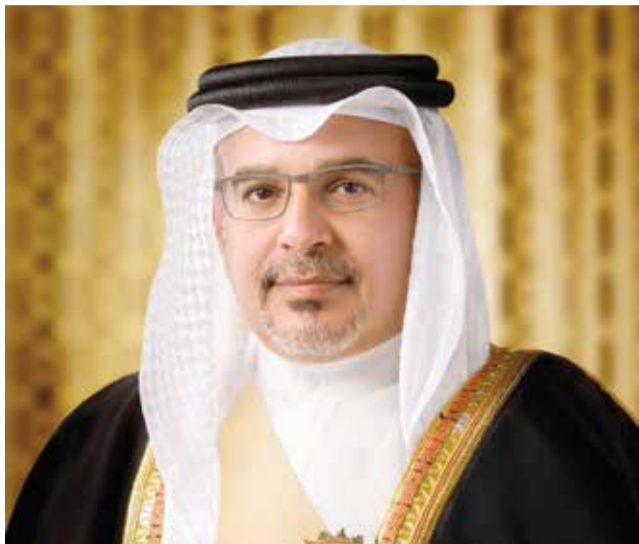
○ سمو ولي العهد رئيس الوزراء