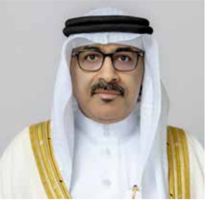
○ وزير التربية والتعليم.