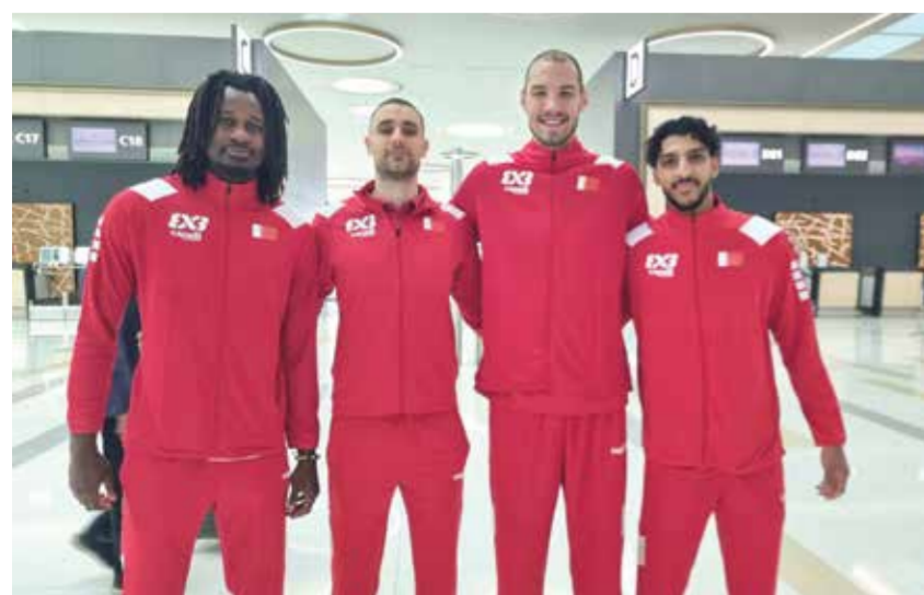
○ فريق السيف

غادرت بعثة فريق السيف البحريني لكرة السلة 3x3 إلى جمهورية صربيا، لإقامة معسكر تدريبي خارجي ضمن برنامج إعداد الفريق للمشاركة في بطولة المرحلة على أجنحة الاتحاد الدولي لكرة السلة (FIBA).