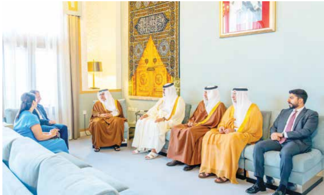
○ سمو ولي العهد رئيس الوزراء يستقبل السفير القبرصي.