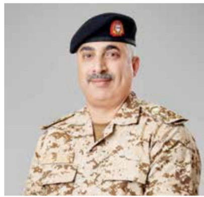
○ قائد الخدمات الطبية الملكية.

وأكد أن ما تحققه الخدمات الطبية الملكية من إنجازات نوعية ومتواصلة يأتي بفضل الدعم اللامحدود والبراعة الكريمة التي تحظى بها من حضرة صاحب الجلالة الملك حمد بن عيسى آل خليفة ملك البلاد المعظم القائد الأعلى للقوات المسلحة، والمتابعة الحثيثة والدعم المستمر من صاحب السمو الملكي الأمير سلمان بن حمد آل خليفة ولي العهد نائب القائد الأعلى للقوات المسلحة رئيس مجلس الوزراء، والدعم المتواصل والبراعة الكريمة من المشير الركن الشيخ خليفة بن أحمد آل خليفة القائد العام لقوة دفاع البحرين، الأمر الذي أسهم في تعزيز مسيرة التطوير والتحديث في الخدمات الطبية الملكية، وتمكينها من مواصلة تحقيق الإنجازات الطبية والعلمية وتقديم خدمات صحية تخصصية متقدمة وفق أعلى المعايير العالمية، بما يدعم مكانتها كمركز إقليمي رائد في القطاع الصحي ويعزز من جودة وكفاءة الخدمات الصحية المقدمة.