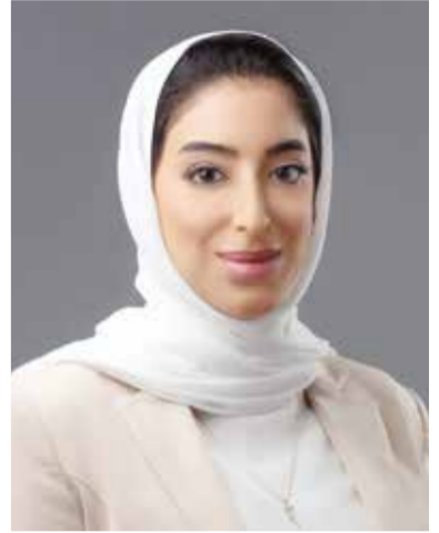
○ وزيرة السياحة.

أكدت فاطمة بنت جعفر الصيرفي وزيرة السياحة أن القطاع السياحي في مملكة البحرين يشهد مؤشرات متصاعدة منذ إطلاق حملة «ولهننا عليكم» واستئناف الفعاليات والبرامج السياحية والترفيهية، الأمر الذي انعكس على زيادة أعداد الزوار القادمين إلى المملكة خلال إجازة عيد الأضحى من الأشقاء من دول مجلس التعاون لدول الخليج العربية. وشددت الصيرفي على جاهزية مملكة البحرين لموسم الصيف في ظل تنامي الأقبال المحلي والخليجي من خلال إبراز ما تخر به المملكة من تجارب سياحية متنوعة تلبي مختلف الاهتمامات والفئات العمرية، إلى جانب إطلاق مجموعة من الباقات السياحية بالتعاون مع المكاتب