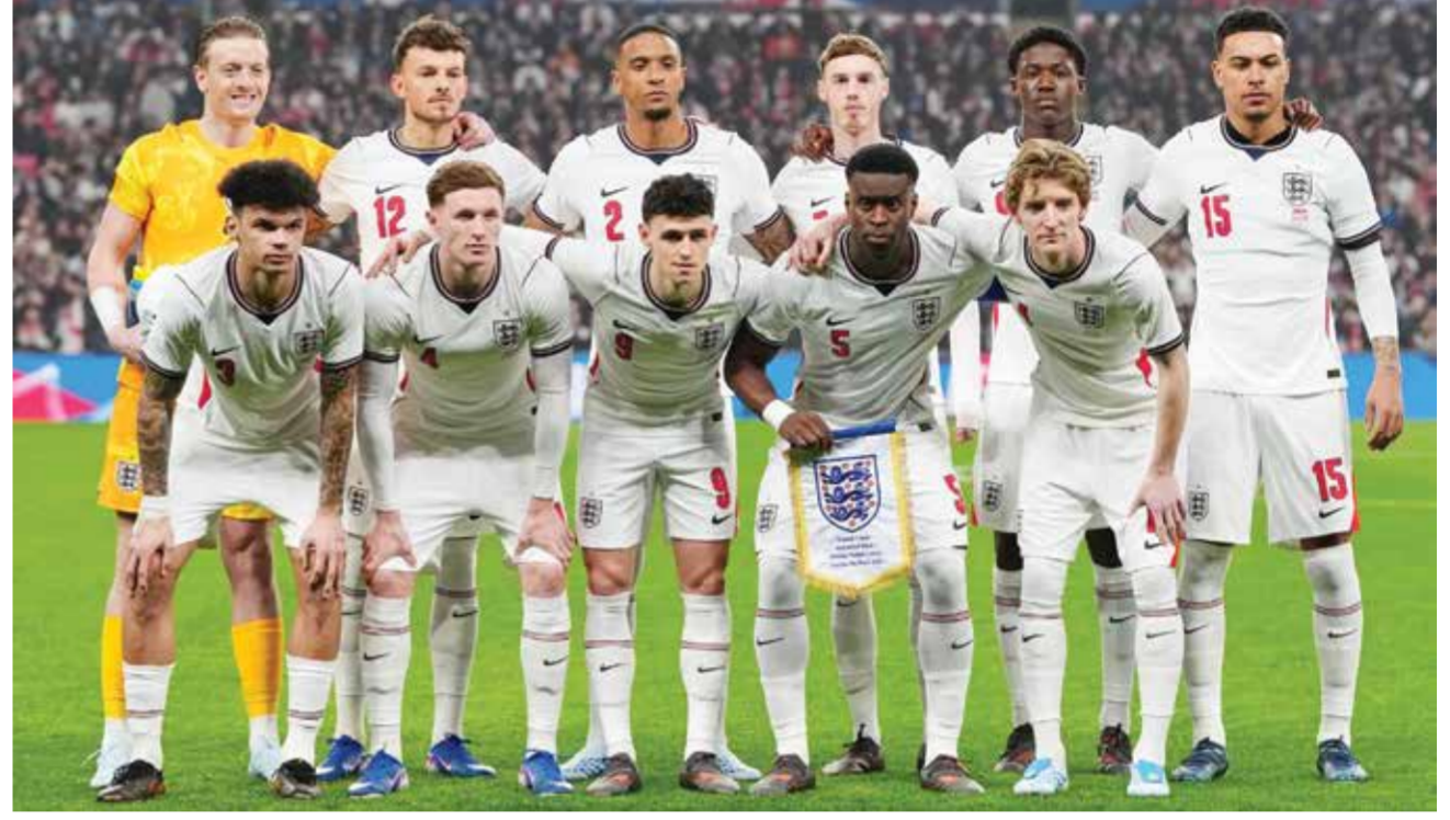
○ المنتخب الإنجليزي.