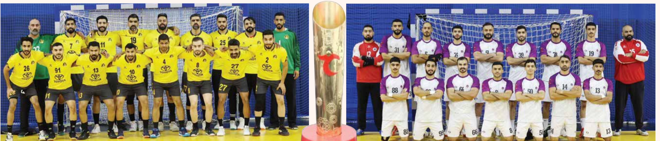
○ فريق الأهلي.