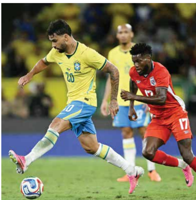
○ جانب من اللقاء.

واهتزت الشباك البرازيلية بهدف مفاجئ عبر النيران الصديقة بعد كرة حرة نفذها ميكائيل موريو واصطدمت بالجناح ماتيو كونيو وخذعت الحارس أليسون (13). وأعاد الثنائي فينيسوس وكازيميرو الأفضلية لأصحاب القمصان الصفراء بعدما سجل لاعب وسط مانشستر يونايتد الإنجليزي السابق هدفاً برأسه في الدقيقة 38. وأجرى الإيطالي كارلو أنشيلوتي مدرب البرازيل تغييرات بعد العودة من الاستراحة، فاستبدل تشكيلته الأساسية بالكامل باستثناء ليو بيريير مع انطلاق الشوط الثاني.