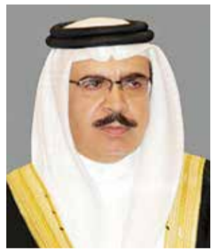
○ وزير الداخلية.

أعربت وزارة الخارجية عن إدانة مملكة البحرين واستنكارها الشديد لاستهداف دولة الكويت الشقيقة بهجمات صاروخية وطائرات مسيرة إيرانية معادية، معتبرة ذلك تعصيها خطيراً يهدد الأمن والاستقرار الإقليمي، وانتهاكاً سافراً لسيادة دولة الكويت، ومخالفة