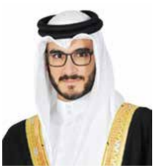
○ سمو الشيخ عيسى بن سلمان.

وأكد سمو الشيخ عيسى بن سلمان بن حمد آل خليفة وزير ديوان رئيس مجلس الوزراء، بالخطاب السامي الذي تفضل به حضرة صاحب الجلالة الملك حمد بن عيسى آل خليفة ولي العهد رئيس مجلس الوزراء، مؤكداً مسيرته البناء والتنمية مستندة إلى وحدة أبنائها وتلاحمهم والتفافهم حول راية الوطن بقيادة جلالته، كما لفت سموه إلى أن الإشادة الملكية السامية بما أظهره أبناء الوطن، من وعي ومسؤولية وكفاءة في التعامل مع مختلف التحديات، تمثل مصدر فخر واعتزاز للجميع، وتعاظم في الوقت ذاته حجم المسؤولية الملقاة على عاتق الجميع