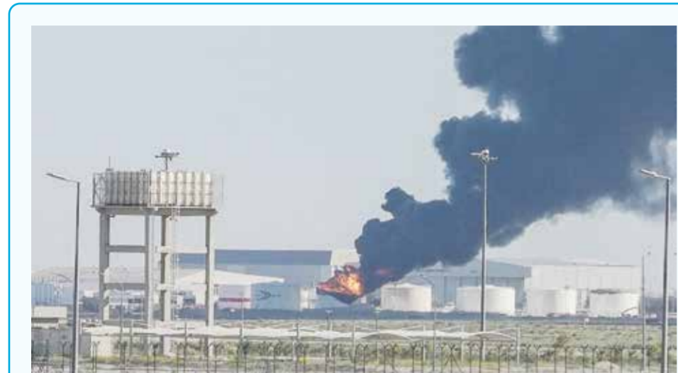
○ صورة أرشيفية لاعتداء إيراني غاشم على مطار الكويت.

ووجود عسكري» له عندما دخلتها القوات الإسرائيلية