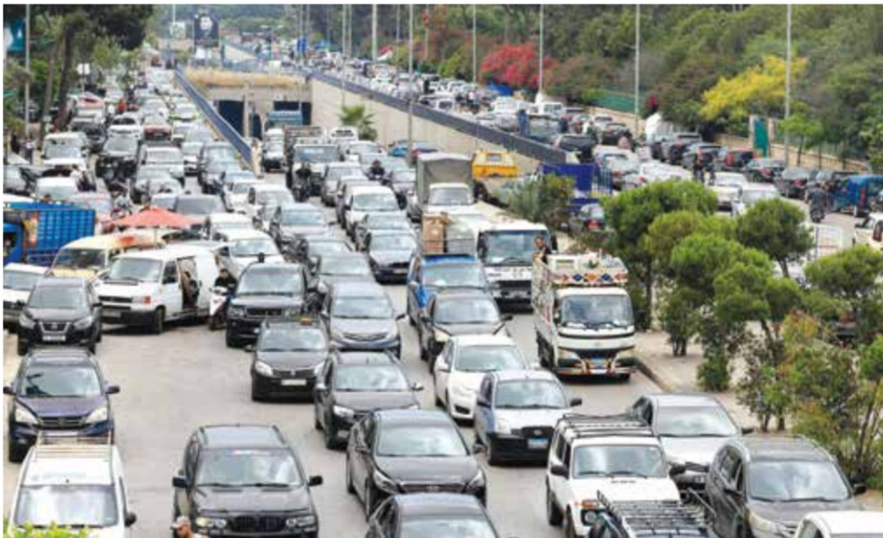
○ نزوح مكثف من الضاحية الجنوبية لبيروت بعد التهديدات الإسرائيلية. (رويترز)

بيروت - (أ ب): توعدت إسرائيل أمس باستئناف ضرباتها على ضاحية بيروت الجنوبية ردا على ما قالت إنه خرق حزب الله لوقف إطلاق النار، محذرة من أن العاصمة اللبنانية لن تنعم بهدوء» إذا واصل الحزب هجماته، وذلك غداة توغل لقواتها في جنوب لبنان هو الأعمق منذ انسحابها في عام 2000.