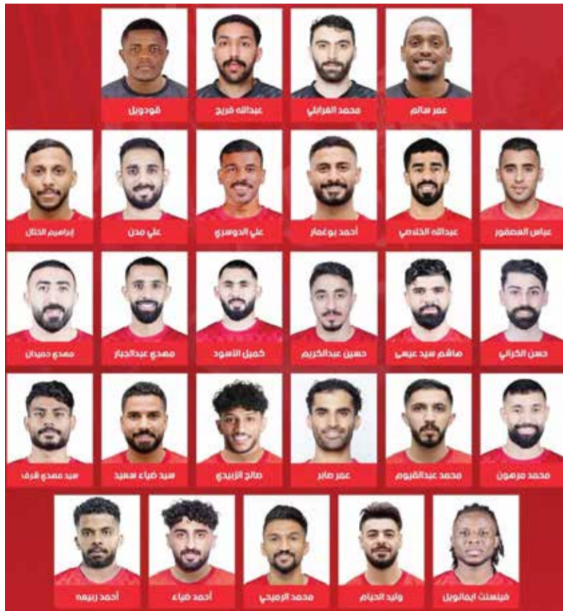
○ قائمة اللاعبين.