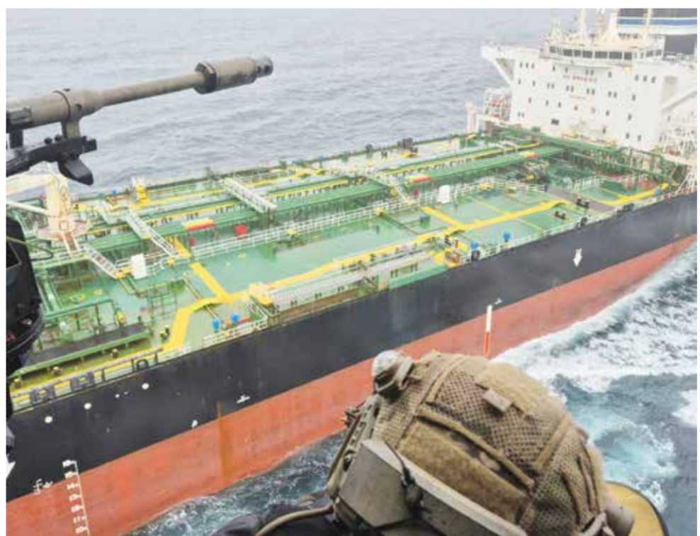
○ صورة وزعتها السلطات الفرنسية للناقلة المحتجزة «تاغور».

من أربع سنوات». ونشر مقطعاً مصورا لعملية السيطرة على السفينة، أظهر قوات كوماندوس تنزل بالبالا من مروحية إلى سطحها، وأوضحت سلطات الملاحة الفرنسية في الأطلسي أن عملية الاعتراض وقعت على بُعد أكثر من 400 ميل بحري (740 كيلومترا) غرب بريطانيا. وأضافت أن مراجعة الوثائق أكدت الشكوك حول «عدم قانونية العلم، الذي كانت السفينة ترفعه، علما أنها تحمل طاقما مؤلفا من 23 فردا». ورافتت البحرية الفرنسية السفينة «تاغور» إلى موقع رسو لإجراء مزيد من التحقيقات. وقالت وزارة الدفاع البريطانية: