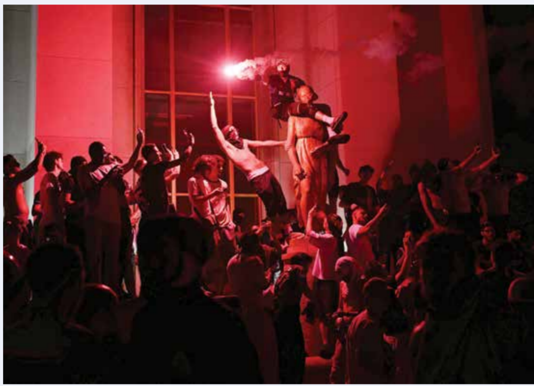
○ احتفالات مشجعي باريس سان جيرمان.

وأشار وزير الداخلية الفرنسي أيضاً إلى وجود 178 إصابة بين أفراد الأمن.