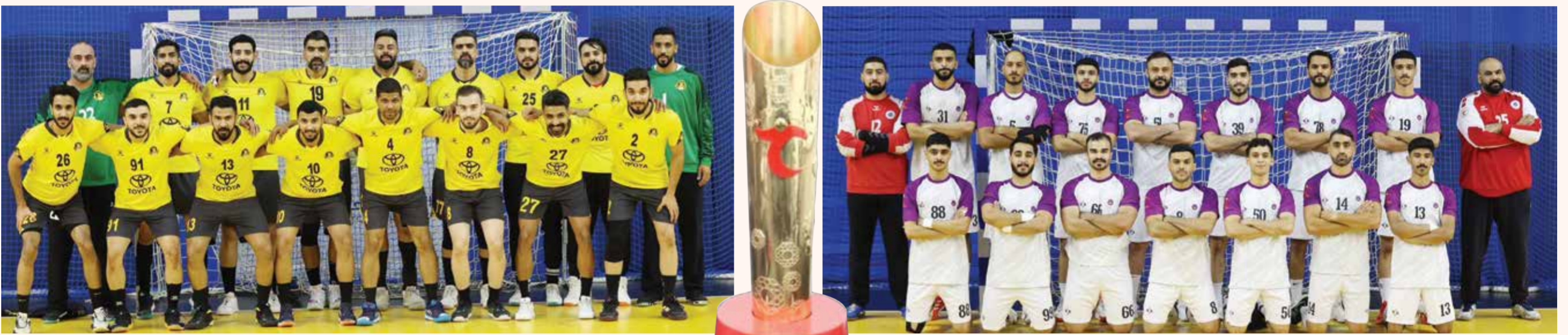
○ فريق الأهلي.