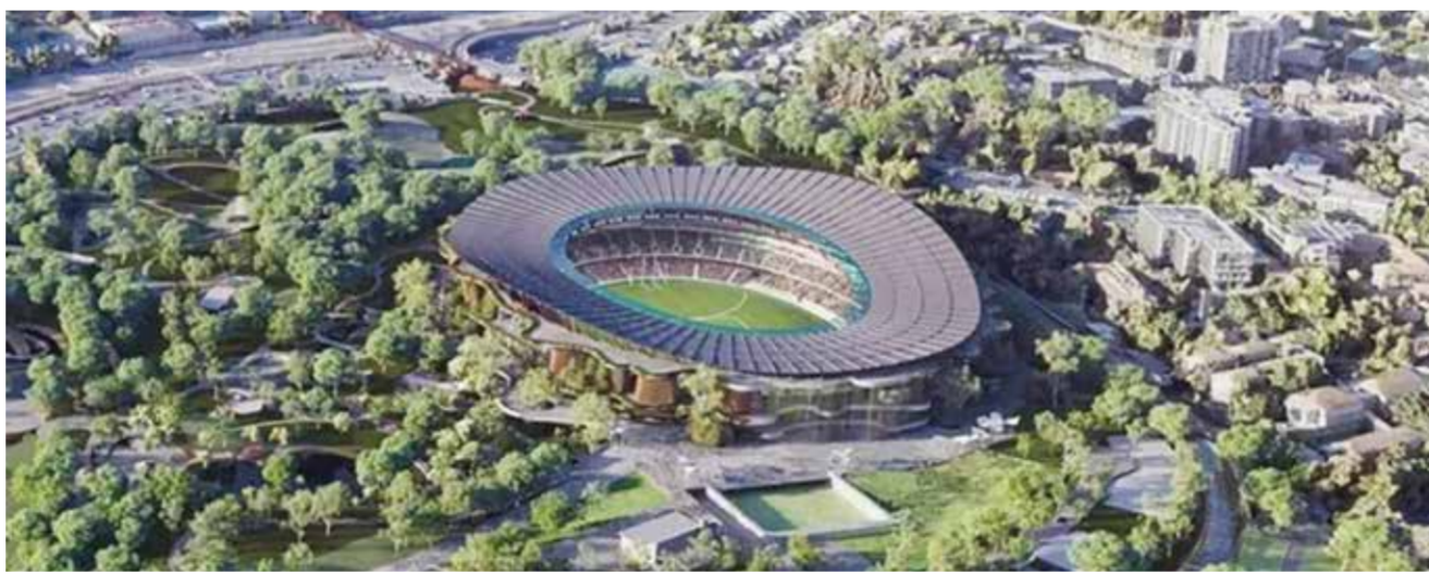
○ ملعب بريزبين

وأظهر فونسيكا جانباً مختلفاً من أدائه بعد عودته من خسارة مجموعتين أمام كل من الكرواتي دينو بريجميتش في الدور الثاني وديوكوفيتش الجمعة. تغلب على رود، وصيف بطولة فرنسا المفتوحة مرتين، في مباراة ماراثونية استمرت ثلاث ساعات و55 دقيقة وانتهت في تمام الساعة 12:27 صباحاً بالتوقيت