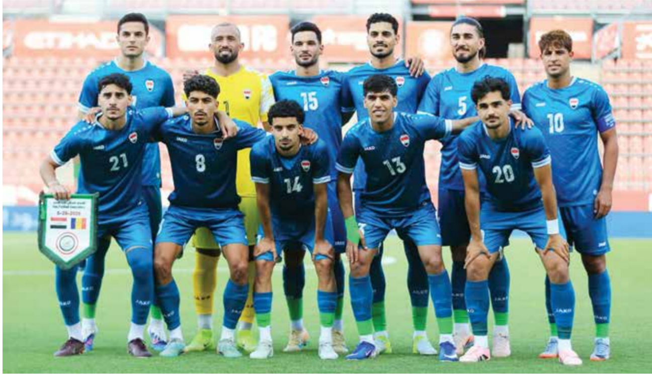
○ المنتخب العراقي.