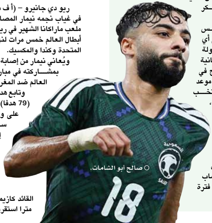
○ صالح أبو الشامات.

ومنح فينيسوس جونيو مهاجم ريال مدريد الإسباني سريعا الأفضلية لأصحاب الأرض في الدقيقة الأولى بعد صافرة الحكم، أثر تمريرة من القائد كازيميرو ليسدد كرة من قرابة 23 متراً استقرت في الشباك.