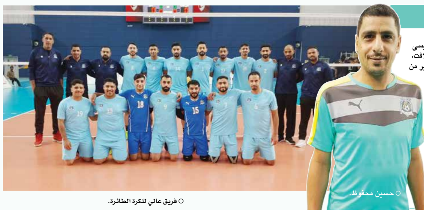
○ فريق عالي لكرة الطائرة.