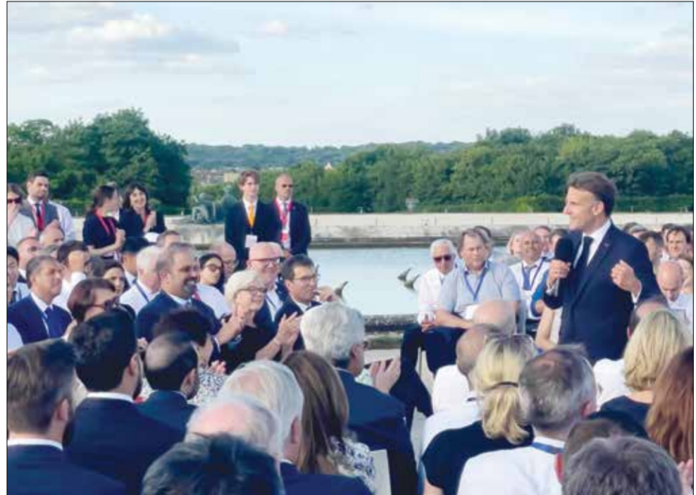
المالية والاقتصاد الوطني رئيس مجلس إدارة شركة ممتلكات البحرينية القابضة «ممتلكات» وعمق العلاقات الثنائية الراسخة التي تجمع مملكة البحرين

والجمهورية الفرنسية الصديقة في مختلف المجالات وبالأخص في المجالين الاقتصادي والاستثماري، مشيراً إلى أن مشاركة مملكة البحرين في مؤتمر «اختر فرنسا» تؤكد التزام المملكة بمواصلة تعزيز الشراكات الاقتصادية والاستثمارية الدولية، والاستفادة من الفرص الواعدة التي تسهم في دعم مسارات التنمية وتحقيق الأهداف التنموية المنشودة. وأشار إلى أن هذه المشاركة تأتي امتداداً لمخرجات الزيارات الرسمية المتبادلة بين البلدين الصديقين والتي أسهمت في تعزيز أوجه الشراكة وخلق المزيد من الفرص الواعدة بين البلدين، مؤكداً حرص مملكة البحرين على مواصلة توطيد التعاون مع الجمهورية الفرنسية والأخذ به نحو آفاق أوسع، بما يحقق التطاعات والمصالح المشتركة.