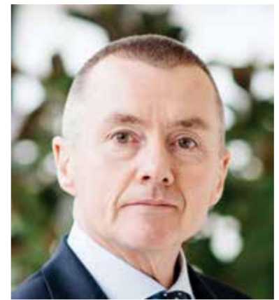
كتب: علي عبد الخالق

أعلن الاتحاد الدولي للنقل الجوي (IATA) تراجع الطلب العالمي على السفر الجوي خلال شهر أبريل 2026 بنسبة 3.4% مقارنة بالفترة نفسها من العام الماضي، متأثراً بشكل رئيسي بالتداعيات المستمرة للحرب في الشرق الأوسط، والتي أدت إلى انخفاض حاد في حركة المسافرين لدى شركات الطيران في المنطقة. وأوضح التقرير إلى أنه عند استبعاد منطقة الشرق الأوسط من الحسابات، فإن الطلب العالمي كان سيحقق نمواً بنسبة 1.2%، ما يعكس استمرار قوة الطلب في معظم الأسواق الدولية. وقال المدير العام للاتحاد الدولي للنقل الجوي ويلى والش: «إن انخفاض الطلب في الطلب لدى شركات الطيران الشرق أوسطية بنسبة 46.6% نتيجة الحروب الدائرة في المنطقة كان كافياً لدفع المؤشر العالمي إلى المنطقة السلبية». وأضاف أن قطاع النقل الجوي ما زال يواجه حالة من التقلبات الشديدة، لافتاً إلى أن أسعار وقود الطائرات تضاعفت أكثر من مرتين خلال أبريل، ما أدى إلى ارتفاع أسعار التذاكر، بينما تشير بيانات الجداول المستقبلية إلى تقليص