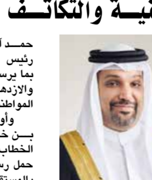
○ وزير المالية.

كما أثنى على ما جاء في الخطاب السامي من إشادة بقدرة وضباط الصف وأفراد قوة دفاع البحرين والحرس الوطني ووزارة الداخلية، مؤكداً أن ما تتمتع به هذه الجهات العسكرية والأمنية من جاهزية رفيعة المستوى وكفاءة عالية واحترافية متميزة.