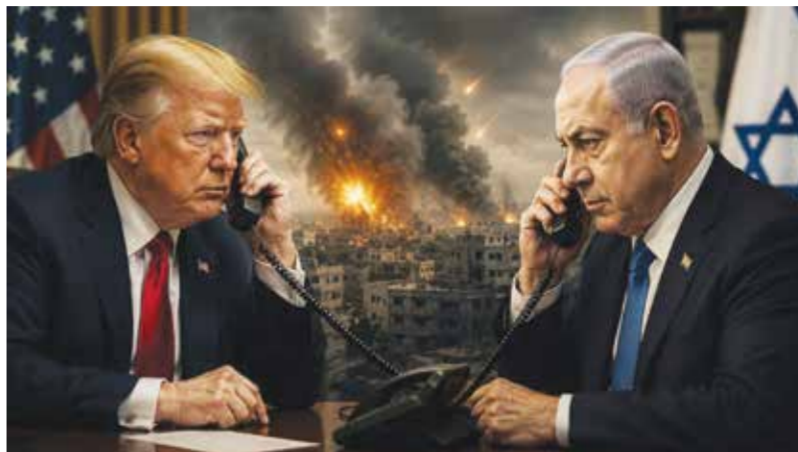
○ اتصال ترامب ونتنياهو. (تعبيرية)

(العربية. نت): أجرى الرئيس الأمريكي دونالد ترامب، ورئيس الوزراء الإسرائيلي بنيامين نتانياهو، اتصالا هاتفيا مساء أمس، في وقت تتجه فيه الأنظار إلى مستقبل المواجهة في لبنان وسط تقارير عن ضغوط أمريكية لمنع توسيع العمليات العسكرية الإسرائيلية ضد بيروت.