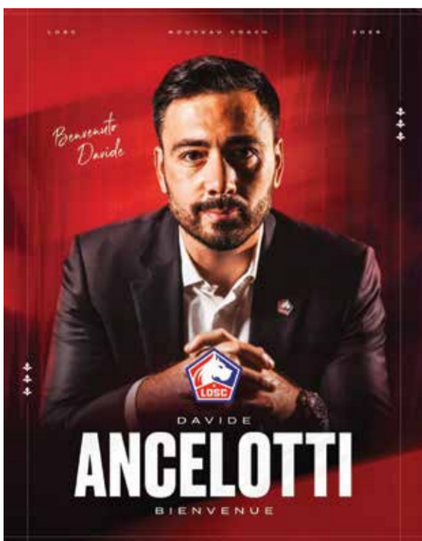
○ دافيدي أنشيلوتي