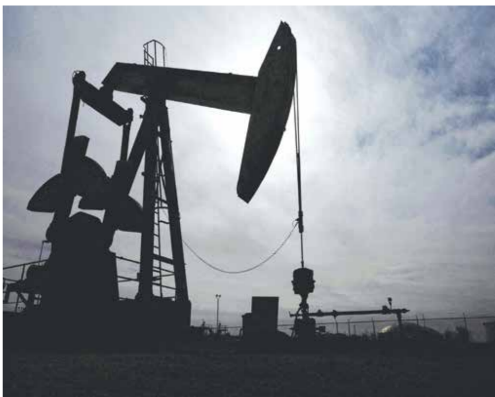
خام غرب تكساس الوسيط الأمريكي عند 83 دولارا، رغم أن اضطرابات الإمدادات في الشرق الأوسط ربما تقلل تدفق الأسعار إلى الارتفاع.

الأحد إن ضعف الطلب على النفط في الصين وأوروبا يشكل تهديدا كبيرا لتوقعاته لسعر خام برنت للربع الرابع عند 90 دولارا للبرميل وسعر