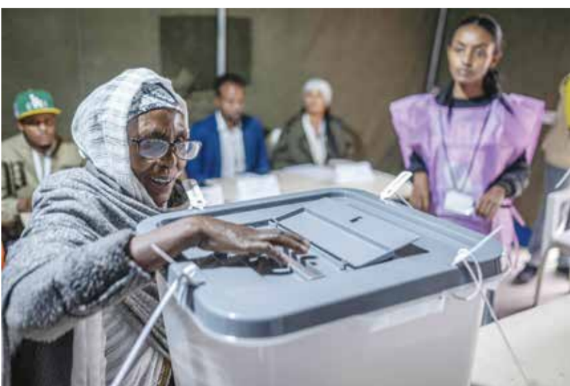
○ سيدة إثيوبية تدلي بصوتها في مركز اقتراع في أديس أبابا.

الدورة الحالية «مرشحة لأن تكون من أقل الاستحقاقات تنافسية منذ اعتماد الديموقراطية التعددية في العام 1991». في المقابل، تخوض المعارضة الانتخابات بإمكانيات مالية محدودة، وانقسامات على مستوى أكثر من 40 حزبا، فيما يخوض الحزب الحاكم السباق منفردا في عشرات الدوائر. وبحسب «تشانام هاسوس»، فإن «العديد من المنافسين لن يشارخوا في الانتخابات، إذ يعيش بعضهم في المنفى، أو أنه منزع من العمل، أو يقع في السجن، بينما يرى آخرون جدوى أكبر في مواصلة الكفاح المسلح بدلا من خوض الانتخابات». وفتحت مراكز الاقتراع أبوابها عند الساعة السادسة صباحا (03:00 بتوقيت جرينتش) على أن تغلق عند السادسة مساء، في انتظار إعلان النتائج بعد نحو عشرة أيام، علما أنه يحق لأكثر من 50 مليون ناخب من أصل 130 مليون نسمة الإدلاء بأصواتهم في نحو 48 ألف مركز اقتراع. رغم عقد الانتخابات في عموم أنحاء البلاد، لكنها ستستثني