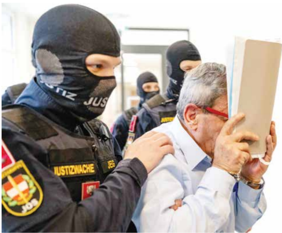
○ أحد المسؤولين السوريين يغطي وجهه أثناء اقتياده إلى المحكمة في فيينا.

طهران - (د ب أ): دعا الرئيس الإيراني مسعود بزشكيان يوم الأحد إلى تغيير جوهر في أسلوب القيادة في البلاد، بينما نفى مكتبه شائعات حول تخطيطه للاستقالة. وقال بزشكيان إن القيادة في إيران لا يجب أن تقتصر على مجموعة محدودة من القادة والمسؤولين، وفقا لوكالة الأنباء الرسمية فارس التابعة للحرس الثوري الإيراني ذي النفوذ. ودعا إلى إشراك جميع الفئات الاجتماعية والشركاء الاقتصاديين والعلماء، فضلا عن عامة الشعب، في عمليات صنع القرار في إيران. ويتعارض هذا المطلب من جانب بزشكيان، وهو إصلاح، بشكل صارخ مع الواقع في إيران، حيث يسيطر أفراد على صلة وثيقة بالحرس الثوري على المناصب الرئيسية في الحكومة منذ عقود.