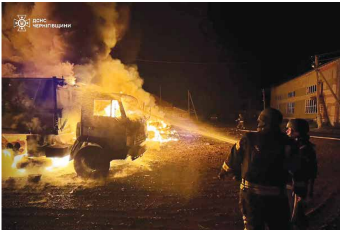
○ هجوم روسي بالمسيرات في منطقة تشيرنيهيف الأوكرانية. (أ ف ب)

كييف - (أ ف ب): أطلقت روسيا عددا قياسيا من المسيرات بعيدة المدى باتجاه أوكرانيا في مايو، بحسب ما أظهر أسس الاثنين تحليل أجرته فرانس برس لبيانات سلاح الجو الأوكراني، في وقت تطالب كييف حلفاءها بدعم أنظمتها للدفاع الجوي. وكشفت مجموع التقارير اليومية التي نشرها سلاح الجو الأوكراني أن روسيا أطلقت 8150 مسيرة بعيدة المدى في مايو، بزيادة تصل نسبتها إلى 24 في المئة عن العدد الذي أطلق في أبريل. وطورت كييف شبكة من أنظمة الدفاع الجوي في أنحاء البلاد قادرة على إسقاط معظم المسيرات، لكنها ما زالت تعتمد على حلفائها الغربيين في إسقاط الصواريخ الروسية. كما أطلقت روسيا 21 صاروخا في مايو، وهو عدد من بين الأعلى شهريا، في وقت دعت كييف الولايات المتحدة لمساعدتها بشكل عاجل عبر تزويدها بالذخيرة من أجل أنظمتها المضادة للصواريخ من طراز باتريوت.