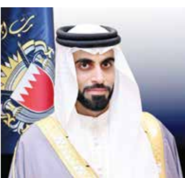
○ الشيخ خالد بن راشد.

خليفة وزير الداخلية، التي كان لها بالغ الأثر في تعزيز آليات التنفيذ وفق معايير دقيقة تتسم بالشفافية والانضباط، وضون الكرامة الإنسانية. واختتم الشيخ خالد بن راشد آل خليفة تصريحه بتأكيد أن ما تشهده مملكة البحرين من نقلة نوعية في منظومة العدالة الجنائية الإصلاحية إنما هو ثمرة من ثمار الرؤية الملكية السامية، ودليل ساطع على التكامل بين مختلف مؤسسات الدولة في خدمة الإنسان، مؤكداً أن المملكة ماضية بخطى ثابتة في تعزيز ريادتها الإقليمية والدولية في تبني السياسات الجنائية الحديثة وابتكار البرامج الإصلاحية التي تؤمّن بين سيادة القانون، وضون حقوق الإنسان، واستدامة الاستقرار المجتمعي.