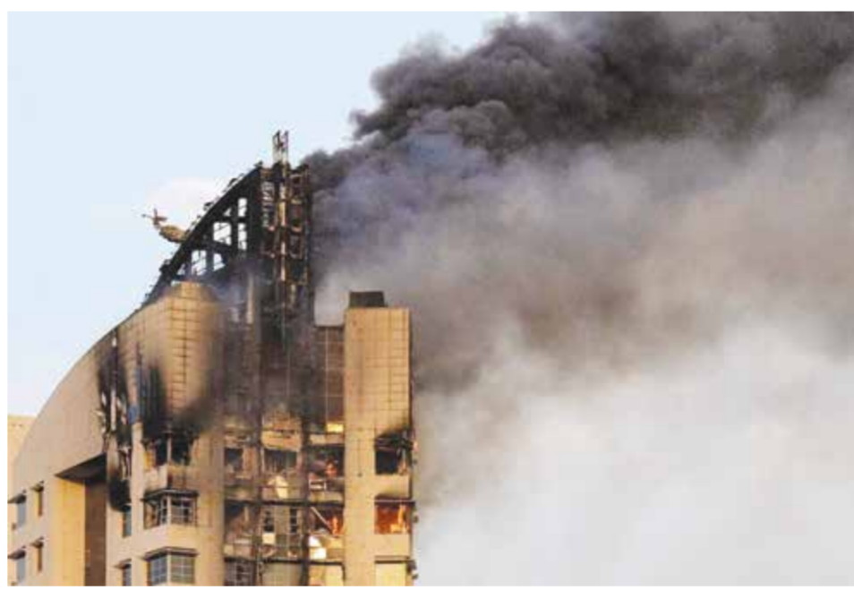
دخان يتصاعد من مبنى في الكويت جراء اعتداء إيراني سابق.

الطرفان على مذكرة تفاهم تمتد 60 يوماً لتمديد وقف إطلاق النار وبدء مفاوضات بشأن البرنامج النووي الإيراني، غير أن الخطة ما زالت بحاجة إلى موافقة ترامب النهائية. وعقب صدور التقرير، اتفق