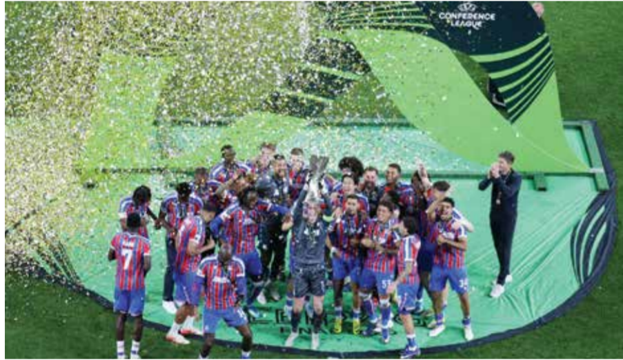
○ من تتويج بالاس بدوري المؤتمر