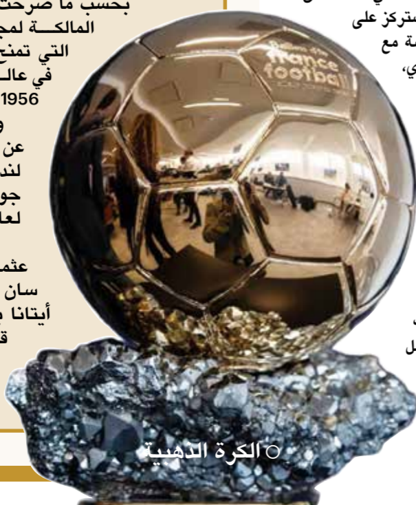
○ الكرة الذهبية

ولم يكشف المنظمون عن المكان المحدد في لندن لإقامة حفل توزيع جوائز الكرة الذهبية لعام 2026. وكان الفرنسي عثمان ديمبيلي (باريس سان جرمان) والإسبانية أيتانا بونماتي (برشلونة) قد توجتا بجائزة الكرة الذهبية العام الماضي.