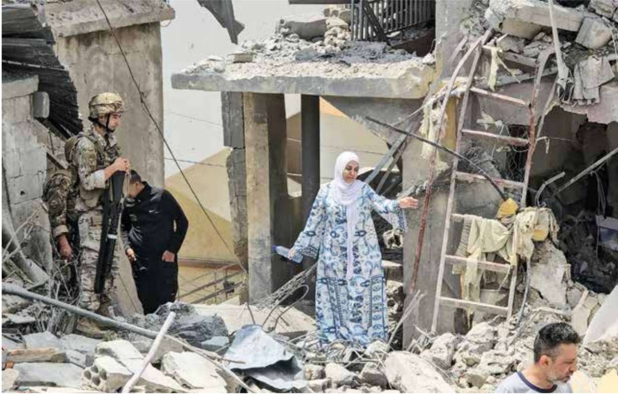
○ سيدة لبنانية تقف وسط حطام منزلها الذي دمرته غارة إسرائيلية في بلدة برج الشمالي بالجنوب اللبناني.

أشخاص، بينهم سبتان، وفق وزارة الصحة. وأفاد مراسل فرانس برس في المدينة بأن الغارة أدت إلى دمار في الطابقين الأولين من مبنى سكني. واستهدفت غارة أخرى فجر امس الخميس سيارة على طريق عدلون في منطقة صيدا، كانت تقبل عائلة بعد نزوحها فجرا، ما أسفر عن مقتل ستة اشخاص، بينهم رجل وزوجته وطفلهما، وفق وزارة الصحة. وأعلن الجيش اللبناني من جهته امس الخميس مقتل عسكري «نتيجة استهدافه بغارة إسرائيلية معادية أثناء تنقله على طريق» في منطقة النبطية. واستهدفت غارات أخرى بلدات وقرى عدة في جنوب لبنان.