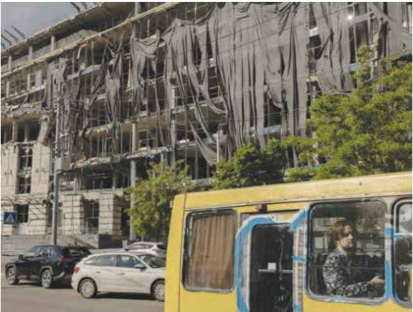
○ مبنى في كييف تضرر بدرجة بلغة جراء هجمات روسية.

هي موجبات ملزمة ترتب عليها مسؤولية قانونية على الأشخاص المعنيين». كذلك أشارت مفوضية الأمم المتحدة العليا لحقوق الإنسان إلى هجوم شنته القوات المسلحة الأوكرانية ليل 21 إلى 22 مايو على مهجع ومدرسة مهنية في ستاروبيلسك الواقعة ضمن منطقة في شرق أوكرانيا خاصة بسيطرة روسيا، أسفر بحسب موسكو عن مقتل 21 شخصا وإصابة 44 آخرين. وأوضحت المفوضية أنها «أجرت تدقيقا عمقا للمعلومات المتاحة للعام، التي تشير إلى أن المجمع المدرسي كان قيد التشغيل وقت الهجوم، وأن مدنيين، بينهم عدد كبير من التلاميذ، قتلوا أو جرحوا». وذكرت المفوضية أن بين القتلى 18 امرأة، وأن هجمات أوكرانية أخرى أدت إلى مقتل وإصابة مدنيين داخل روسيا نفسها. ودعا فولكر توروك السلطات الأوكرانية والروسية إلى إجراء «تحقيقات سريعة ومستقلة وفعالة، وإحالة المسؤولين إلى القضاء».