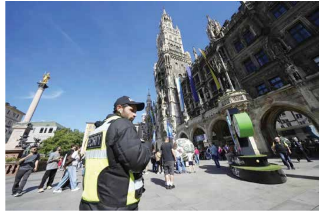
○ انتشار عسكري في مختلف أنحاء فرنسا

ويواجه سان جرمان، المتوج بلقبه الخامس توالياً في الدوري المحلي في وقت سابق من هذا الشهر، بطل إنجلترا أرسنال على ملعب بوشكاش أرينا في بودابست.