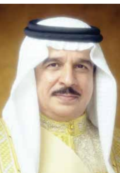
جلالة الملك المعظم.

بمناسبة النجاح الكبير للموسم حج هذا العام 1447 هجرية، كما بعث صاحب السمو الملكي الأمير محمد بن سلمان بن عبدالعزيز آل سعود ولي العهد رئيس مجلس الوزراء بالمملكة العربية السعودية الشقيقة.