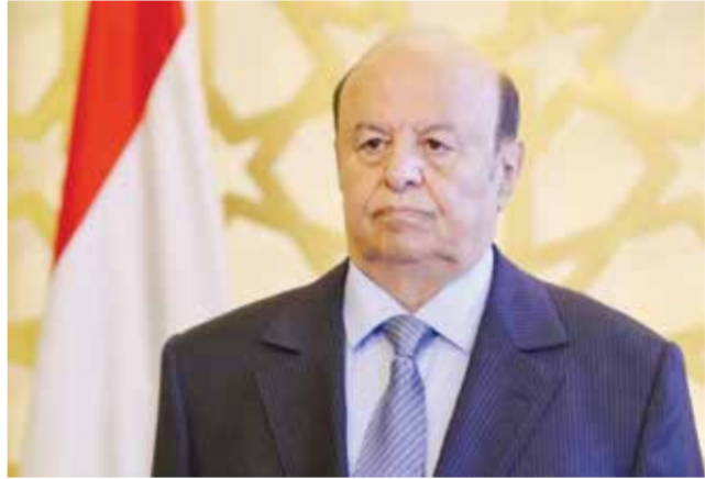
○ الراحل عبد ربه منصور هادي.

تولى هادي رئاسة اليمن بين 2012 و2022، وأقام في السعودية في العقد الأخير، إذ لجأ إلى المملكة مع إطلاقها عملية «عاصفة الحزم» في