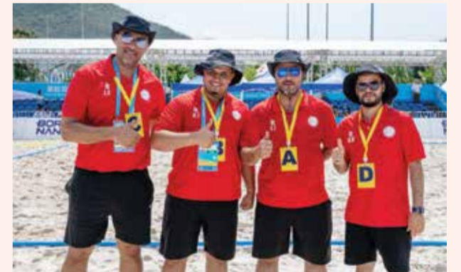
○ الجهاز الفني لمنتخب اليد الشاطئية