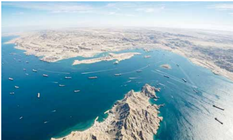
○ مضيق هرمز.