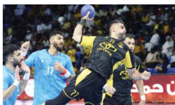
○ من لقاء الأهلي والشباب

ظلت النتيجة متقاربة بين الفريقين، في ظل الحذر الكبير والرغبة المشتركة في حسم بطاقة التأهل.