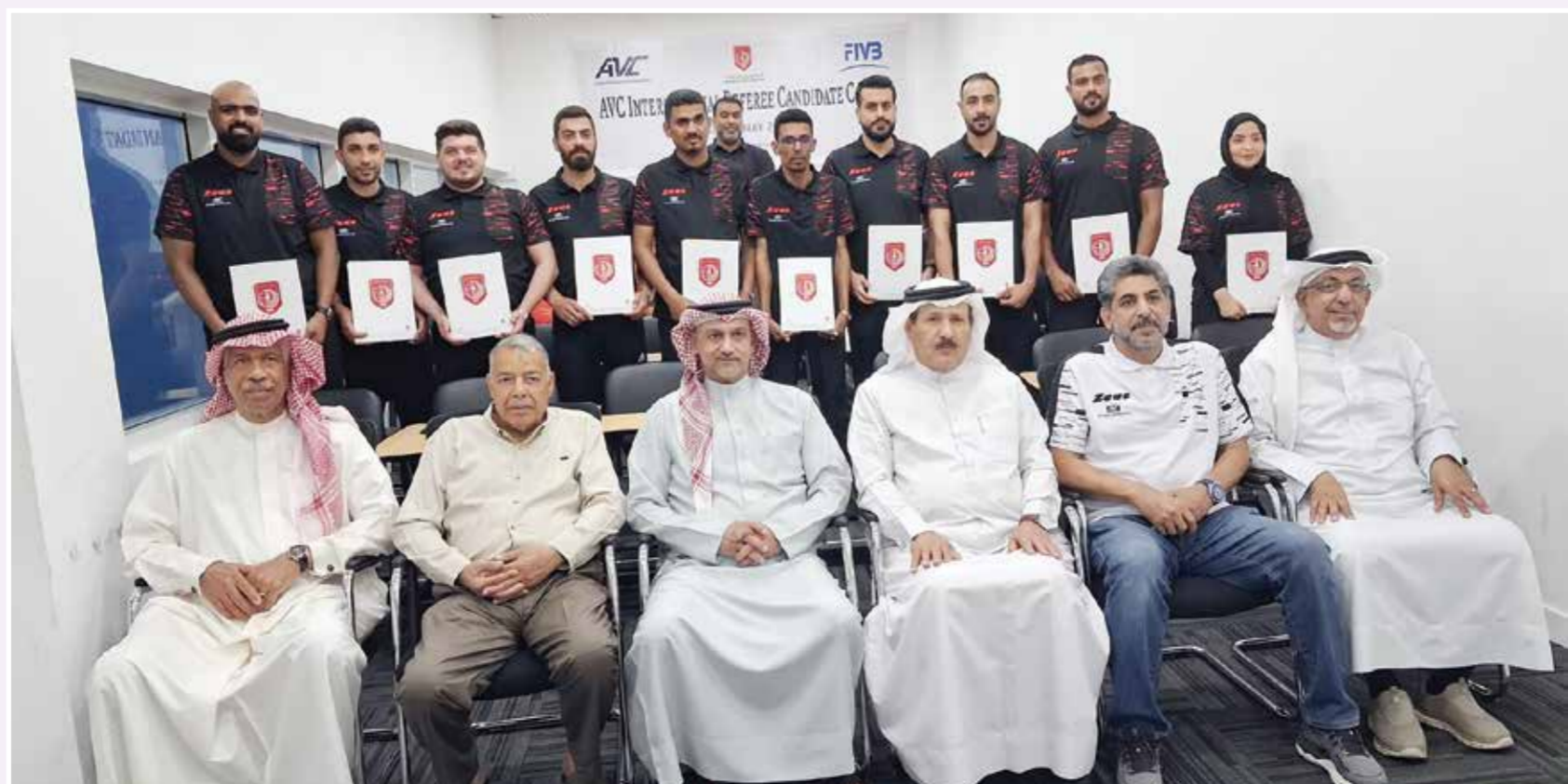
○ لقطة جماعية للدارسين

وفي ختام تصريحه وجه شكره الجزيل، وعظيم الامتنان إلى الشيخ علي بن محمد آل خليفة رئيس اتحاد اللعبة، على دعمه واهتمامه المستمر بتطوير الكوادر التحكيمية البحرينية، كما ثمن جهود الأمين العام، ورئيس مركز التطوير، ورئيس لجنة الحكام، على ما بذلوه من جهود كبيرة وحرص دائم من أجل تهيئة أفضل الظروف لإنجاح هذه الدراسات.