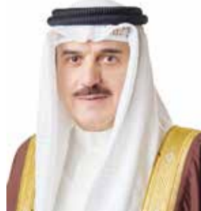
○ رئيس مجلس النواب.

الخاصة لموسم الحج، ومهنئاً رئيس مجلس النواب، الدكتور عبد الله بن محمد بن إبراهيم آل الشيخ رئيس مجلس الشورى بالملكة العربية السعودية الشقيقة، بمناسبة نجاح موسم الحج، الذي تحقق بفضل من الله تعالى وتوفيقه، وجهود الجهات السعودية المعنية.