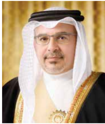
○ سمو ولي العهد رئيس الوزراء.