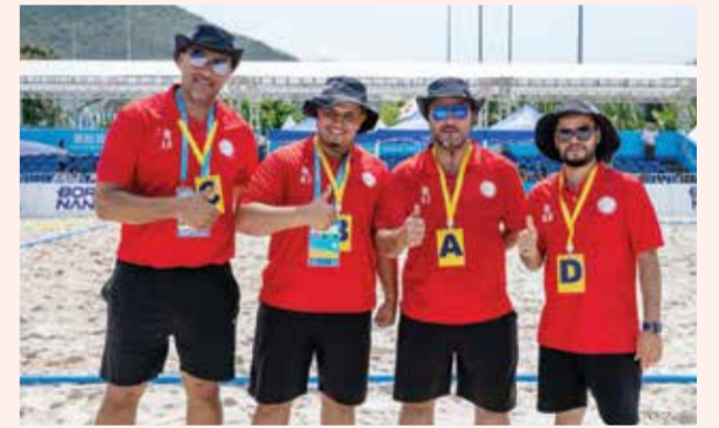
○ الجهاز الفني لمنتخب اليد الشاطئية