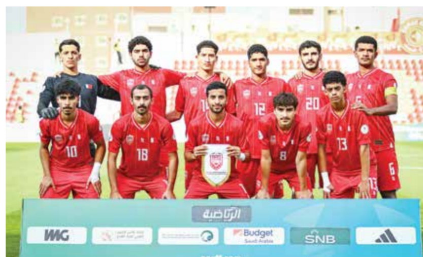
○ منتخب الشباب تحت 20 عاماً.

10 أبريل 2027، حيث يتأهل إلى النهائيات متصدرو المجموعات الثماني إلى جانب أفضل سبعة منتخبات حاصلة على المركز الثاني، فيما يهبط صاحب المركز الأخير في كل مجموعة إلى مرحلة التطوير في النسخة التالية من التصفيات.