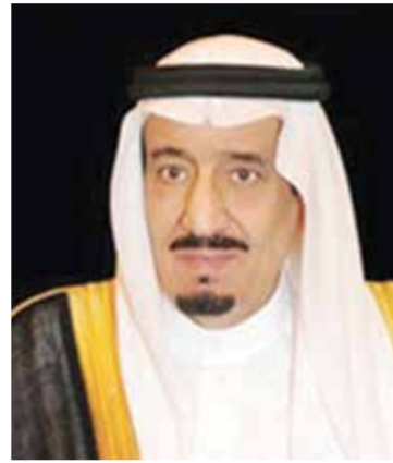
○ خادم الحرمين الشريفين.