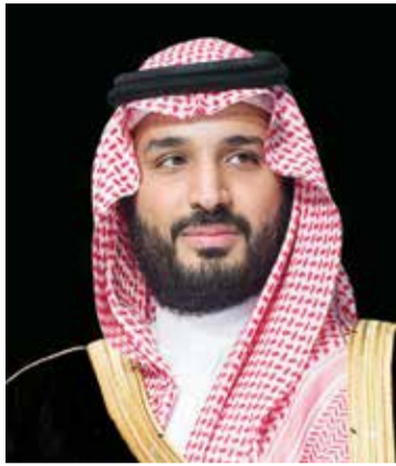
○ سمو ولي العهد السعودي.