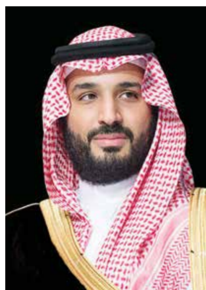
سمو ولي العهد السعودي.