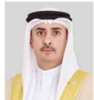
○ وزير العدل.

الأمنية من وزارة الداخلية، واللجنة الطبية من وزارة الصحة، وفرق الكشافة التابعة لوزارة التربية والتعليم، إلى جانب سائر الجوانب التنظيمية والخدمية، وما قدمود من خدمات متكاملة ومتابعة مستمرة للحجاج طوال فترة وجودهم في الأراضي المقدسة، وأكد أن ما تتمتع به المملكة العربية السعودية الشقيقة من إمكانيات متطورة وخبرات رائدة في إدارة الحشود وتنظيم حركة الحجاج، عبر الاستفادة من أحدث الأنظمة والتقنيات، يعكس مستوى العناية الكبيرة التي توليها قيادة المملكة لخدمة ضيوف الرحمن.