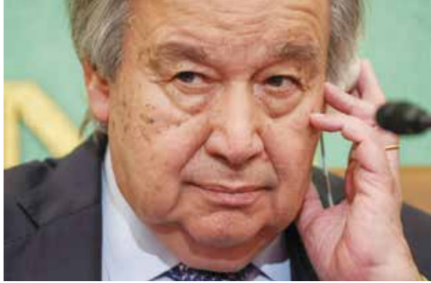
○ أنطونيو غوتيريش.

وفي أغسطس الماضي، حذر التقرير السنوي من إمكان إضافة إسرائيل إلى قائمة الأطراف المشتبه فيها أو المسؤولة عن العنف الجنسي في النزاعات المسلحة، وهي قائمة تضم حماس. ثم استشهدت الأمم المتحدة بـ«تقارير موثوقة» عن عنف جنسي ارتكبهت قوات الأمن الإسرائيلية ضد معتقلين فلسطينيين في السجون ومراكز الاحتجاز الأخرى، مسلطة الضوء على منع مفتشي الأمم المتحدة من الوصول إليها. وزعم داني دانسون «لقد دعونا ممثلي الأمم المتحدة إلى إسرائيل للتحقيق في هذه الاتهامات السخيفة، لكنهم اختاروا عدم الحضور وفضلوا الاستمرار في حملتهم ضد إسرائيل».