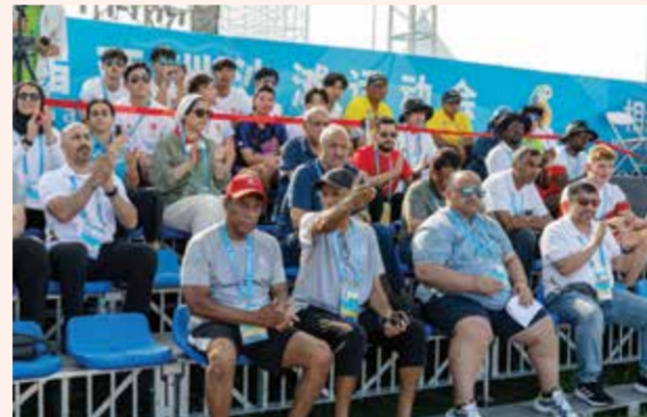
○ اللجنة الأولمبية تساند منتخب الشاطئية