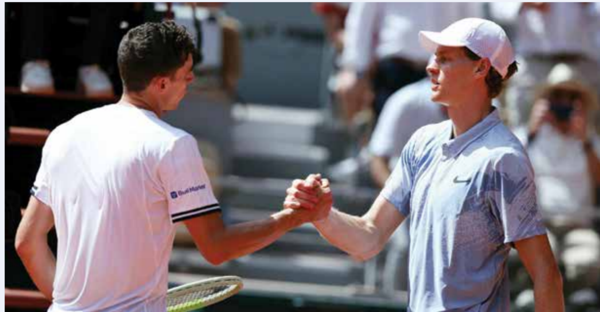
سيرينا ويليامز ونيك كيرغوس.