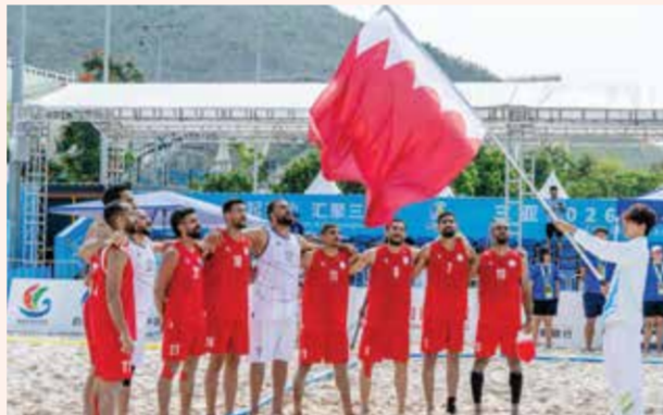
○ منتخب اليد الشاطئية