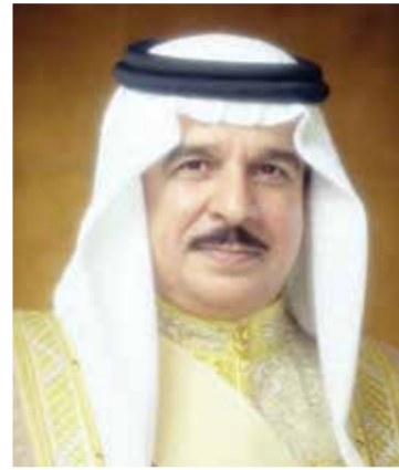
○ جلالة الملك المعظم.

النجاح الكبير والتنظيم الدقيق والمميز لموسم حج هذا العام 1447 هجرية. كما بعث صاحب السمو الملكي ولي العهد رئيس مجلس الوزراء برفقة تهنئة مماثلة إلى أخيه صاحب السمو الملكي الأمير محمد بن سلمان بن عبدالعزيز آل سعود ولي العهد رئيس مجلس الوزراء بالملكة العربية السعودية الشقيقة.