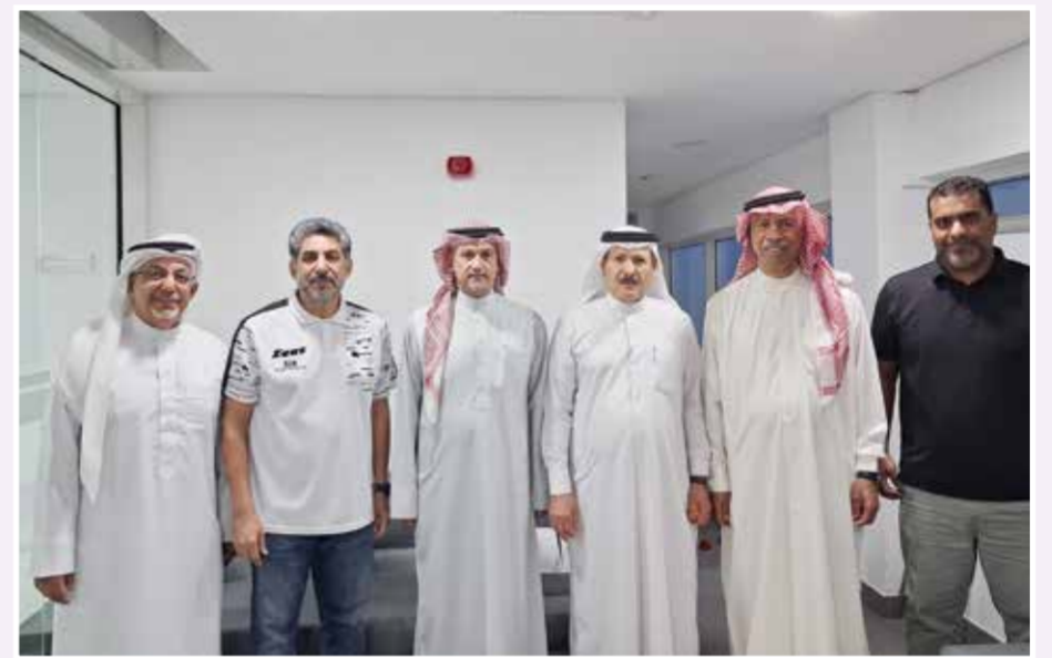
○ لقطة تجمع مسؤولي الاتحاد والمحاضر