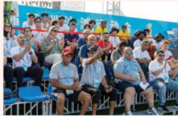
○ اللجنة الأولمبية تساند منتخب الشاطئية