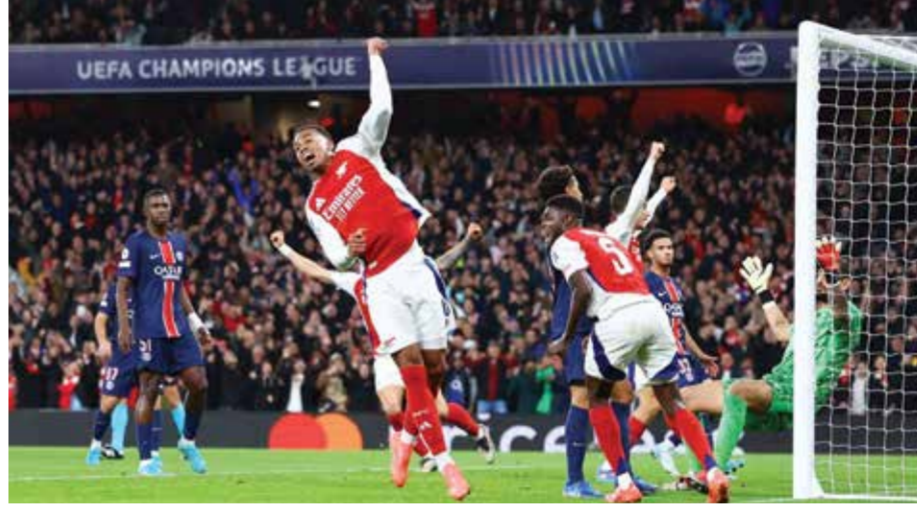
○ من مواجهة سابقة بين الفريقين

وقد يرى البعض في استخدام ابن الـ 56 عاماً لكلمة «ميكليتيو» لعبة ذهنية قبل النهائي، بإحياء اللقب الذي كان يطلقه على أرتيتا قبل ربع قرن. وفي نصف نهائي الموسم الماضي، حين التقيا، تفوق باريس سان جرمان بقيادة «لوتشو» وتأهل.