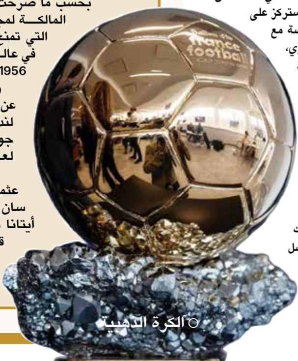
○ الكرة الذهبية

ولم يكشف المنظمون عن المكان المحدد في لندن لإقامة حفل توزيع جوائز الكرة الذهبية لعام 2026. وكان الفرنسي عثمان ديمبيلي (باريس سان جرمان) والإسبانية أيتانا بونماتي (برشلونة) قد توجتا بجائزة الكرة الذهبية العام الماضي.