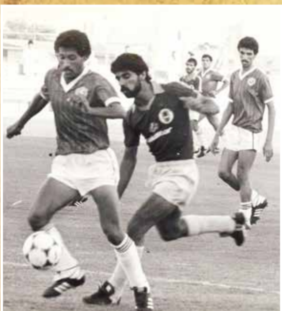
○ من لقاء البحرين وجدحفص في الدوري الممتاز 1984-1985.