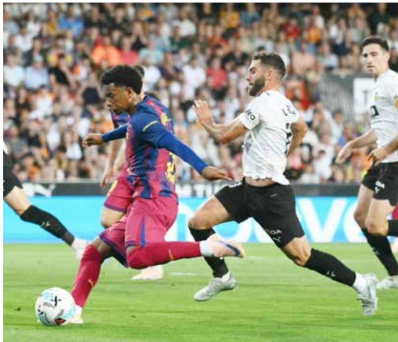
○ لحظة من المباراة.