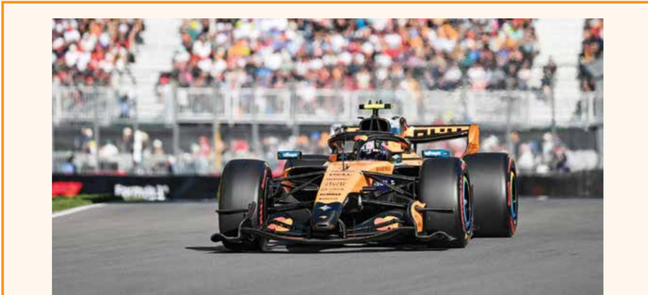
○ سيارة ماكلارين خلال التجارب