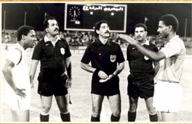
○ من مباراة الرفاع الغربي والبحرين في الدوري الممتاز 1985-1986.