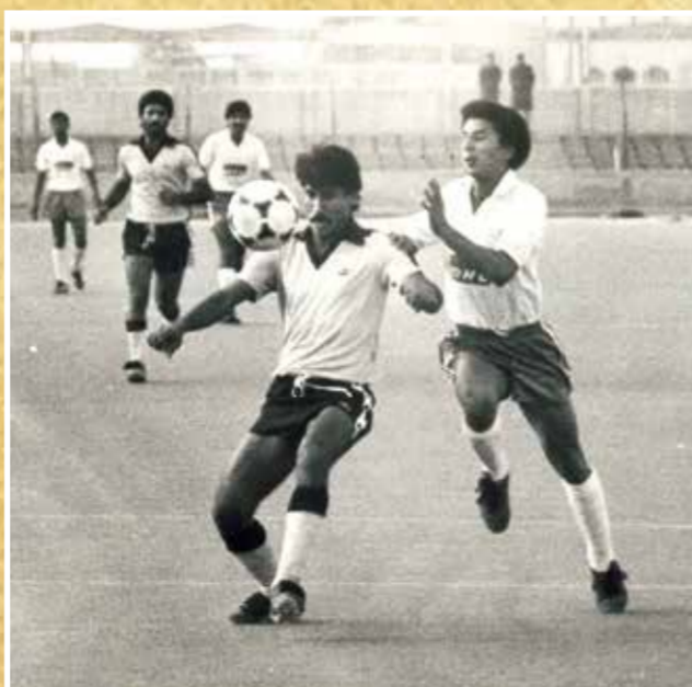
○ تعادل القادسية والوحدة في الدوري الممتاز 1983.