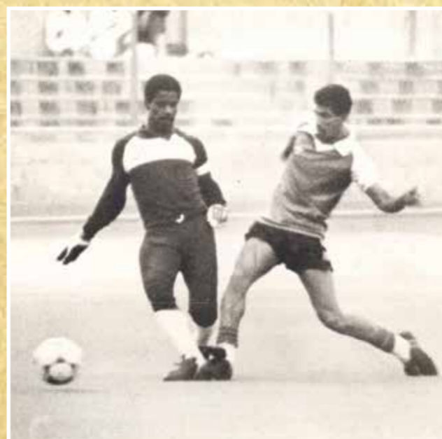
○ من لقاء المحرق والبديع في الدوري الممتاز 1983.