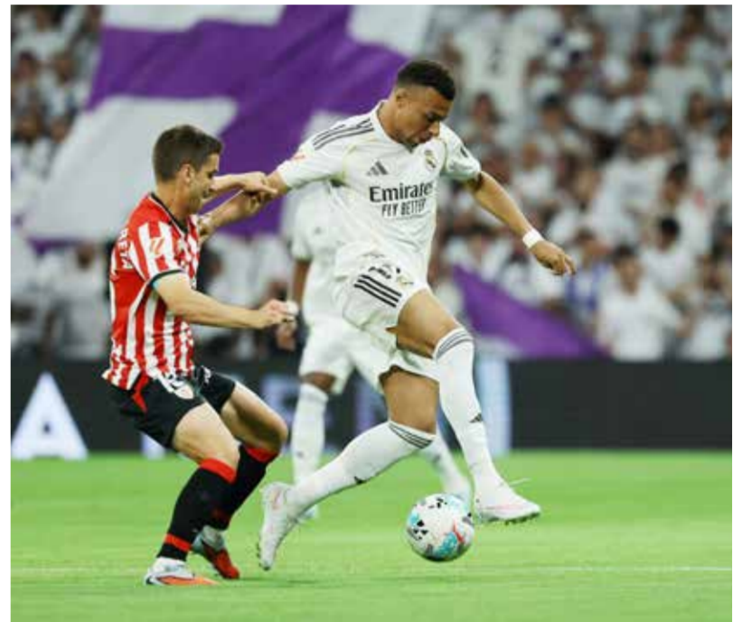
○ جانب من اللقاء.