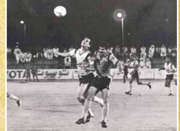
○ الأهلي يتغلب على القادسية في الدوري الممتاز 1985-1986.