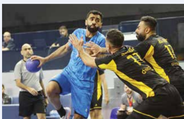
○ لقطة من منافسات الدور التمهيدي.