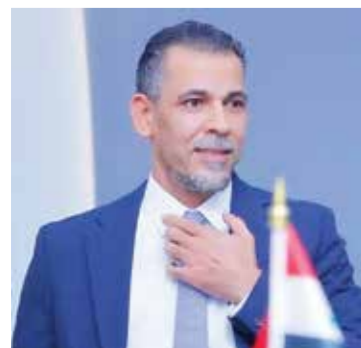
○ يونس محمود.

على 20 صوتا مقابل صوت وحيد لإياد بنيان. وأوضحت أن هذه الانتخابات شهدت أيضا تنافس خمسة مرشحين لمنصب النائب الأول، إضافة إلى خمسة مرشحين آخرين لمنصب النائب الثاني، إضافة إلى 27 مرشحا على مقعد العضوية. ويعد يونس محمود نجما بارزا في تاريخ العراق، حيث سجل هدف تويح بلاده بلقب كأس أمم آسيا 2007 بعد الفوز 1/ صفر على السعودية في المباراة النهائية. ويستعد المنتخب العراقي لأول مشاركة في كأس العالم منذ 40 عاما بالتواجد في مونديال 2026 الذي سيقام في الولايات المتحدة وكندا والمكسيك خلال الفترة من 11 يونيو إلى 19 يوليو. وينتظر أسود الرافدين اختبارات قوية في المجموعة التاسعة التي تضم أيضا فرنسا والسنغال والنرويج.