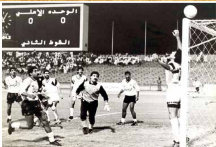
○ تعادل الأهلي والوحدة في الدوري 1990.