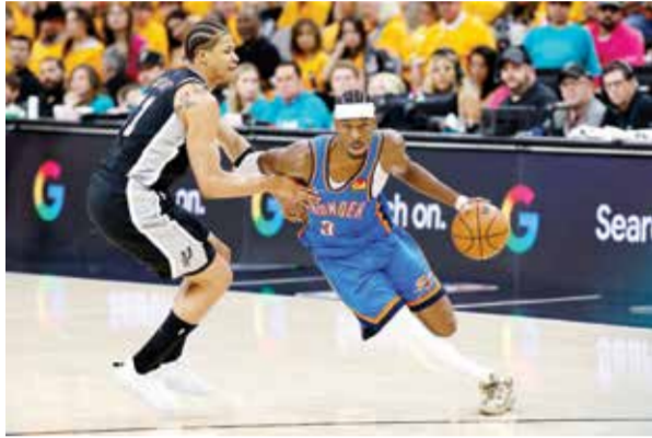
○ جانب من اللقاء.