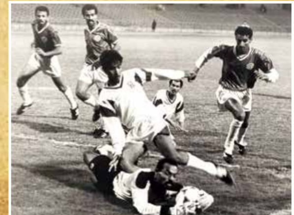
○ البحرين يتغلب على الوحدة في الدوري الممتاز 1989.