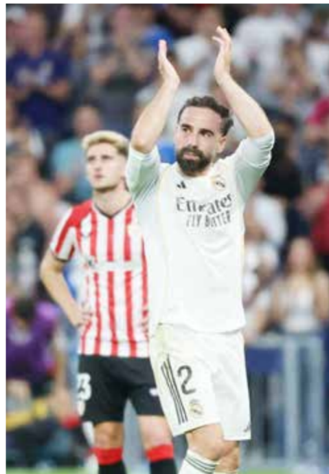
○ كارفخال (رويترز).