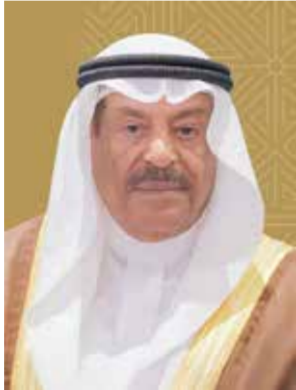
○ رئيس مجلس الشورى

وهذا رئيس مجلس الشورى، بهذه المناسبة، سمو الشيخ ناصر بن حمد آل خليفة، ممثل جلالته الملك للأعمال الإنسانية وشؤون الشباب رئيس المجلس الأعلى للشباب والرياضة، وسمو الشيخ خالد بن حمد آل خليفة، النائب الأول لرئيس المجلس الأعلى للشباب والرياضة رئيس اللجنة العامة للرياضة، رئيس اللجنة الأولمبية البحرينية، مؤكداً أن هذا الإنجاز الرياضي الكبير جاء نتيجاً للجهود المتواصلة والدعم