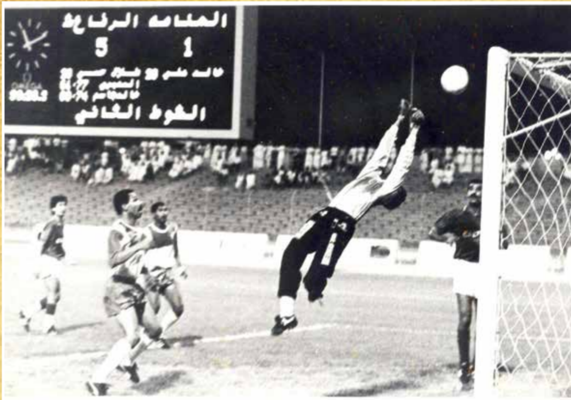
○ من مباراة الرفاع الشرقي والمنامة 1990.