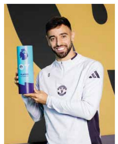
○ برونو فرنانديش

لندن - (أ ف ب): اختير صانع الألعاب البرتغالي في مانشستر يونايتد برونو فرنانديش أفضل لاعب لهذا الموسم في الدوري الإنجليزي لكرة القدم أمس السبت من قبل نظرائه اللاعبين. واستحق البرتغالي هذه الجائزة بعدما ساهم في انتفاضة يونايتد وحجز بطاقته في دوري أبطال أوروبا، بمعادلته الرقم القياسي لعدد التمريرات الحاسمة في موسم واحد من الدوري الممتاز (20)، ليصبح على المسافة نفسها من الفرنسي تيري هنري والبلجيكي كيفن دي بروين. كما سجل ابن الـ31 عاما ثمانية أهداف، ليسهم في ضمان يونايتد بقيادة مايكل كاريك إنهاء الدوري في المركز الثالث. وبات فرنانديش أول لاعب من يونايتد يحرز الجائزة منذ الصربي نيمانيا فيديتش موسم 2010-2011.