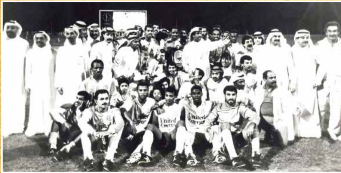
○ الرفاع الغربي بطل الدوري الممتاز 1990.