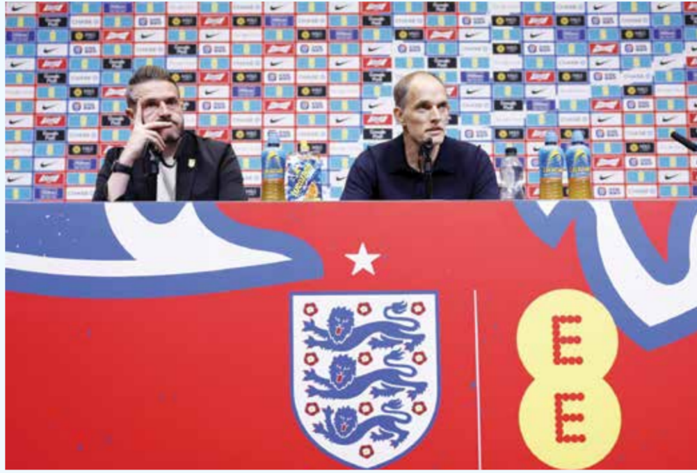
توخل في المؤتمر الصحفي.

وأضاف: «الفرق هي التي تقوّن بالبطولات، الأمر بهذه البساطة»، وأقر بأنه اضطر إلى اتخاذ قرارات صعبة، مؤكداً أنه لا يخشى خياراته. وتابع: «كان من البديهي أن نستبعد بعض المواهب الاستثنائية والشخصيات المميزة من بين 55 لاعباً (في التشكيلة الأولية)». وأردف: «أفضل هذا النوع من القرارات، حتى لو استغرق الأمر منا أسابيع، وأحياناً شهوراً،