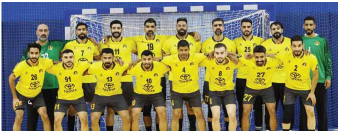
○ فريق الأهلي