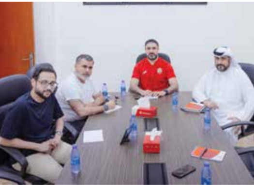
○ جانب من الاجتماع

ووجه بيجا شكره إلى اللاعبين على الجهود الكبيرة التي يقدمونها في التدريبات، لافتًا إلى أن الفريق يضم نخبة من أفضل اللاعبين في البحرين، وهو ما يمنح الأهلي قوة كبيرة وقدرة على المنافسة في المباريات الحاسمة. وأضاف أن كرة اليد البحرينية تشهد تطورًا كبيرًا خلال السنوات الماضية، موضحًا أن اللاعبين البحرينيين يمتلكون إمكانيات فنية مميزة وروحًا قتالية عالية داخل الملعب، وهو ما انعكس على النتائج