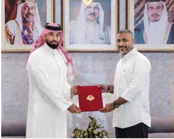
○ جانب من توقيع العقد.

لندن - (أ ف ب): وضع المدرب الإسباني بيب غوارديولا حدا لمسيرته الحافلة بالألقاب مع مانشستر سيتي التي امتدت إلى عقد كامل أحرز خلالها 20 لقباً منذ 2016، وذلك عقب نهاية الأسبوع الحالي، وفق ما أعلن أمس الجمعة ثاني الدوري الإنجليزي لكرة القدم. وقال غوارديولا (55 عاماً) الذي سيقود سيتي للمرة الأخيرة أمام أستون فيلا غدا الأحد: «في أعماقي، أعلم أن الوقت قد حان» للرحيل، مؤكداً أنه سيشتغل دور سفير لمجموعة سيتي لكرة القدم. وأضاف: «يا لها من فترة رائعة قضيناها معا». وتابع مدرب برشلونه وبايرن ميونخ الألماني السابق: «لا تسألوني عن أسباب رحيلي. لا يوجد سبب محدد، لكن في أعماقي أعلم أن الوقت قد حان». وأردف: «لا شيء يدوم إلى الأبد، ولو كان