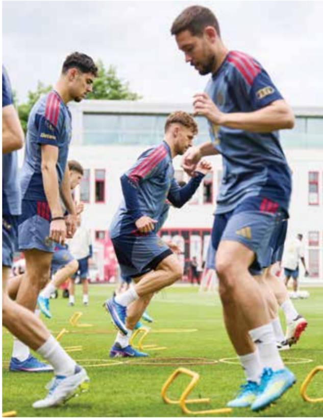
○ تدريبات بايرن.