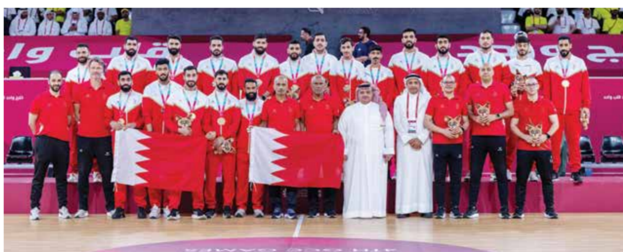
○ علم المملكة حاضر خلال التتويج