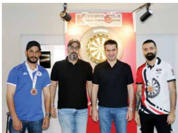
○ صاحبا المركزين الثالث مع رئيس الاتحاد وأمين السر