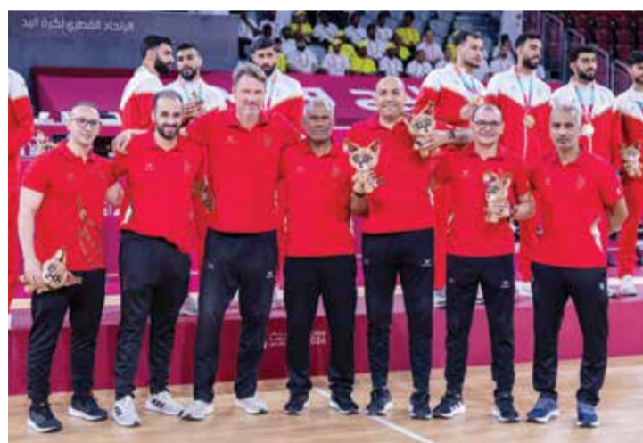
○ الجهازان الإداري والفني لمنتخبنا يعبران عن سعادتهما