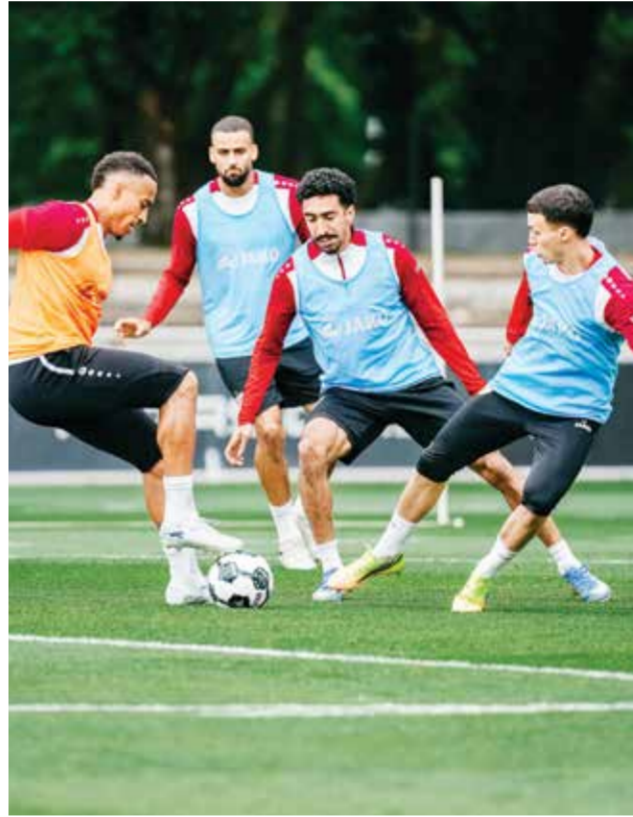
○ تدريبات شتوتغارت.

على بايرن، بينما يدخل فريقه النهائي بعقلية «لا شيء نخسره». وقال مهاجم المنتخب الألماني «إنها مباراة إضافية بالنسبة لنا. لا يوجد ما نخسره، نحن الطرف الأضعف بالكامل». وأضاف «هناك مرشح واضح للفوز... وهو بايرن ميونخ».