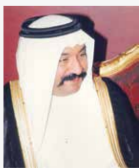
○ المغفور له سمو الشيخ أحمد بن محمد آل خليفة.

تختتم عند الساعة السادسة والنصف من مساء اليوم السبت منافسات بطولة المغفور له بإذن الله تعالى سمو الشيخ أحمد بن محمد بن سلمان آل خليفة للتنس، بإقامة المباراة النهائية والحفل الختامي للبطولة تحت الرعاية الكريمة من سمو الشيخ سلمان بن أحمد بن محمد بن سلمان آل خليفة، وذلك على ملاعب الاتحاد البحريني للتنس، وسط أجواء رياضية منقطرة وحضور لعدد من الشخصيات الرياضية وكبار المدعوين والمهتمين بلعبة التنس.