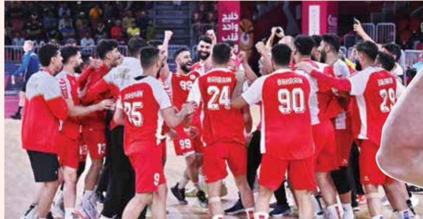
○ فرحة منتخب رجال اليد بتحقيق الميدالية الذهبية.