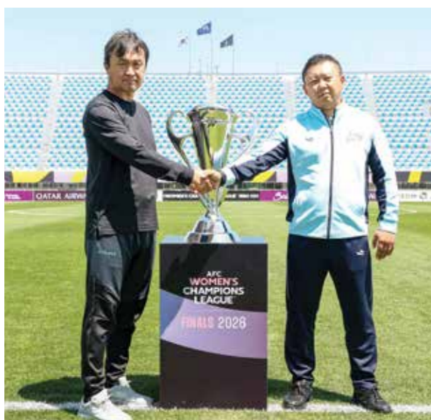
○ كوسونوزي ويو إيل

هذا العام سيكون مهما جداً بالنسبة إلى بيليزا، لكن أكثر من ذلك، فإنه يحمل أهمية كبيرة أيضاً لكرة القدم اليابانية ولدوري السيدات في اليابان». وقال ري إن فريقه سيخرج بمكاسب مهمة بغض النظر عن النتيجة التي ستحقق على استاد (مجمع) سوسون الرياضي، نظراً لما ستوفره المباراة من خبرات إضافية. وأكد مدرب الفريق