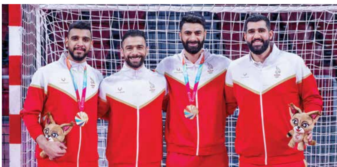
○ الفرحة على وجوه لاعبي المنتخب

إن هذا الحصاد الذهبي غير المسبوق يعكس النقلة النوعية للرياضة البحرينية، بفضل الدعم والرعاية الكريمة من لدن القيادة الرشيدة، والمتابعة الحثيثة من القيادة الرياضية، والتي أثمرت جيلاً من الأبطال قادراً على صعود منصات التتويج ورفع اسم البحرين عالياً. ومع انطفاء شعلة الدورة الخليجية الرابعة، تعود البعثة البحرينية إلى أرض الوطن برأس مرفوعة وحصيلة وافرة من الذهب والأرقام القياسية، واعدة ببذل المزيد من الجهود لمواصلة مسيرة جيل الذهب للرياضة البحرينية في الاستحقاقات المقبلة.