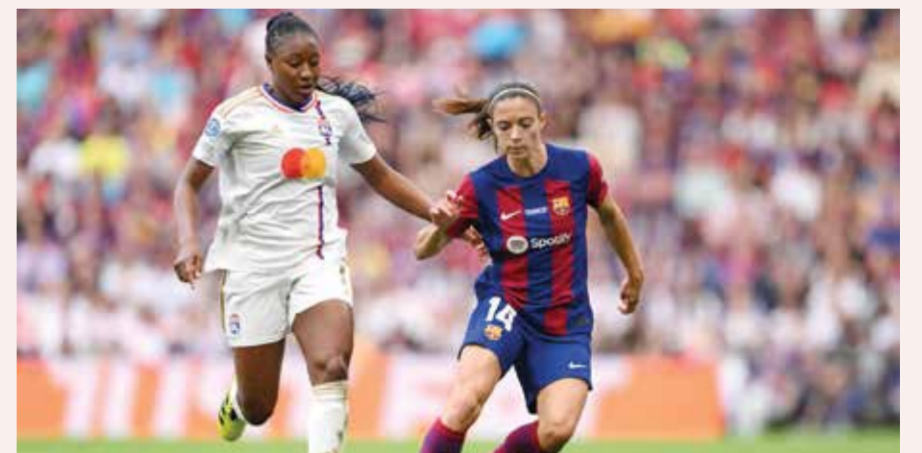
○ من لقاء سابق بين برشلونة وليون.

ويحمل النهائي حافزاً إضافياً للفريقين، إذ إن الفوز سيتمح صاحبه فرصة تمثيل آسيا في كأس العالم للأندية للسيدات العام المقبل. وقال كوسونوزي في تصريحات نقلها الموقع الإلكتروني الرسمي للاتحاد الآسيوي لكرة القدم: «نؤمن بأننا هنا من أجل أن نصبح أبطال آسيا. نحن هنا لتقديم أفضل ما لدينا من أجل الفوز، وغدا نحن مستعدون لخوض هذا التحدي». وتابح: «الفوز بالنهائي