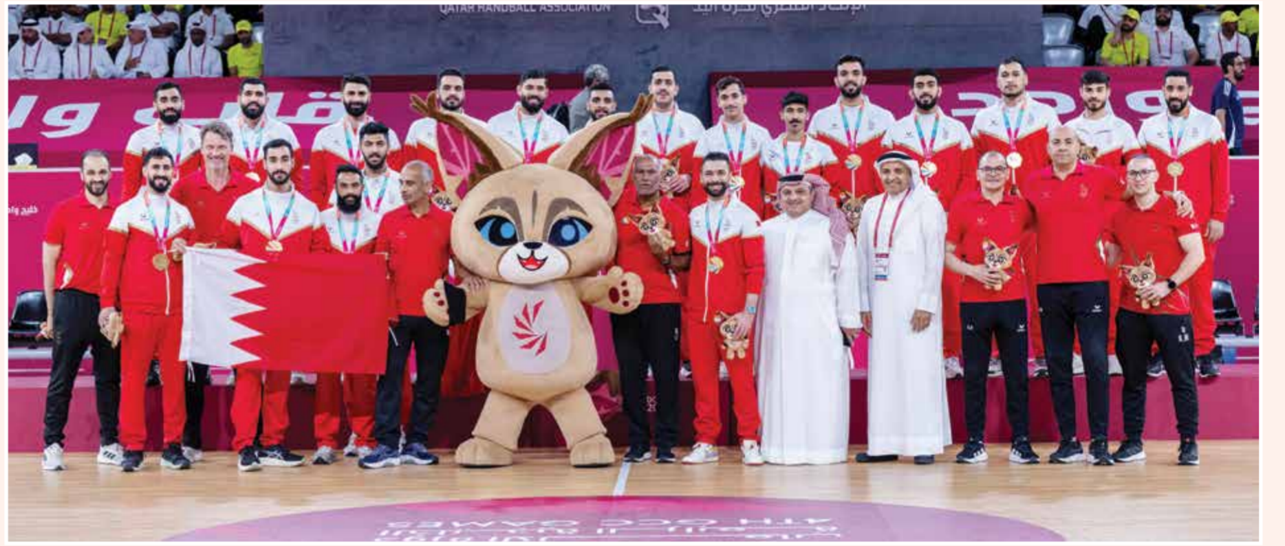
○ من تتويج منتخب اليد

جديدة في تاريخ الرياضة الخليجية، حيث يستند فريق البحرين في هذا التميز إلى سلسلة من الإنجازات المتصاعدة التي تحققت في النسخ 3 الماضية، والتي تعكس خططا استراتيجية ناجحة قادت للتطور المذهل في حصد الذهب.