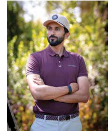
سمو الشيخ ناصر بن حمد آل خليفة.