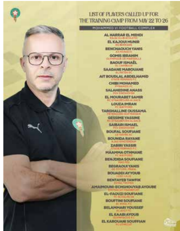
○ قائمة المغرب

سفيان بوفال (لوهافر الفرنسي)، بايسير الزايري (رين الفرنسي)، عثمان معما (اتفورد الإنجليزي)، سفيان بنجديدة (المغرب الفاسي)، نيس بكراوي (استوريل برايا البرتغالي)، توفيق بنظيب (تروا الفرنسي)، أيوب الكعبي (أولمبياكوس اليوناني). يشار إلى أن المنتخب المغربي، الذي كان أول فريق عربي وأفريقي يتأهل لكأس العالم الماضية بقطر عام 2022، يوجد في المجموعة الثالثة بمرحلة المجموعات لمونديال 2026 بالولايات المتحدة وكندا والمكسيك. وتضم المجموعة الثالثة بخلاف المنتخب المغربي كلا من منتخبات البرازيل واسكتلندا وهايتي.