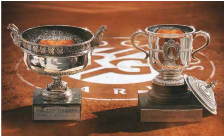
○ كأس رولان غاروس.

سينر مع الأمريكي بن شيلتون المصنّف خامسا في ربع النهائي، مع احتمال لقاء الروسي دانييل مدفيدف في نصف النهائي، بعدما تواجها قبل أيام معدودة في الدور ذاته في دورة روما لماسترز الألف نقطة حيث كان اللقب من نصيب الإيطالي.