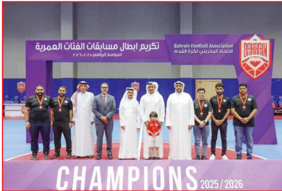
○ تتويج سترة.