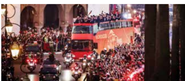
○ احتفال المغرب بالمرکز الرابع في مونديال قطر

بلدي مثلا. نملك لاعبين مذهلين مثل ساديو مانيه، إدريسا (غي) وإدوار (مينندي). يمكنهم مجارة نجوم أي بلد. (في كأس العالم 2026، إفريقيا ذاهبة للفوز بالبطولة».