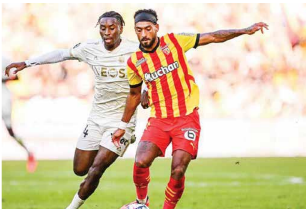
○ لقاء سابق بين نيس ونيس.