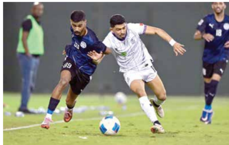
من لقاء النجمة والاتحاد.