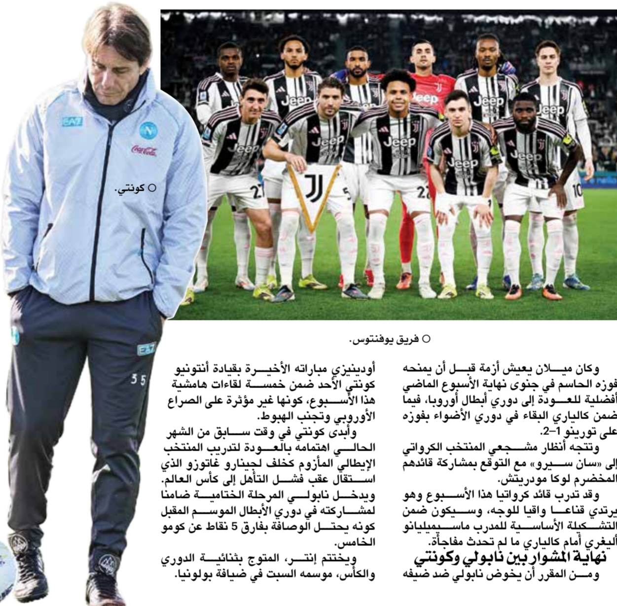
○ فريق يوفنتوس.

وحسم فيلا مشاركته في دوري أبطال أوروبا الموسم المقبل حتى قبل الفوز بلقب يوروبا ليغ نتيجة ضمائه إنهائه الدوري الممتاز بين الخمسة