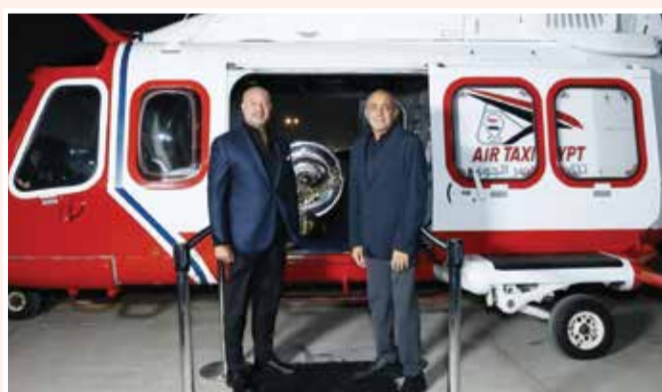
نقل درع الدوري المصري بمروحية