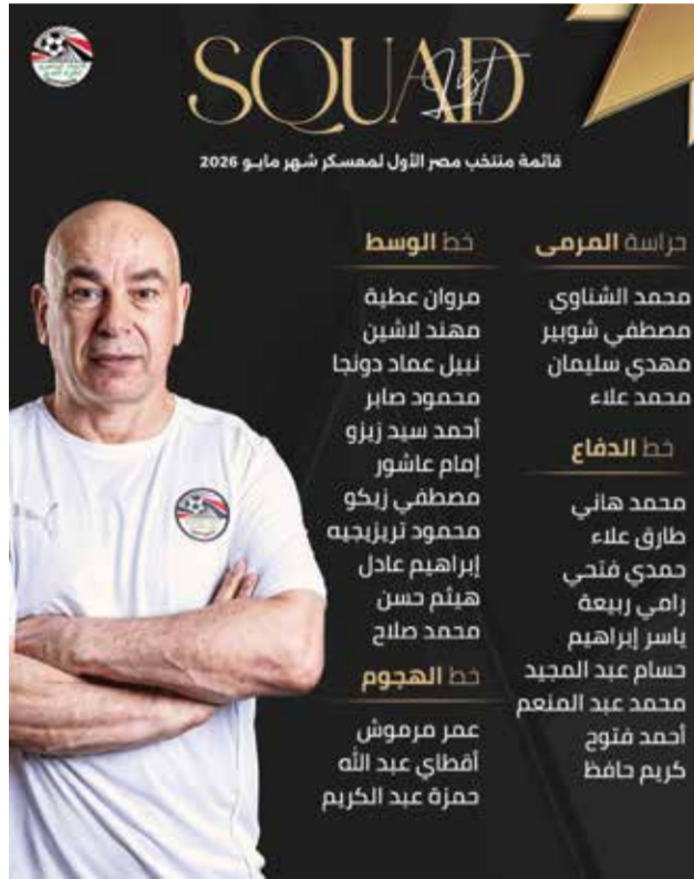
○ قائمة مصر.

حراسة المرمى: محمد الشناوي (الأهلي)، مصطفى شوبير (الأهلي)، المهدي سليمان (الزمالك)، محمد علاء (الجونة). خط الدفاع: محمد هاني (الأهلي)، طارق علاء (زد)، حمدي فتحي (الوكرة القطري)، رامي ربيعة (العين الإماراتي)، محمد