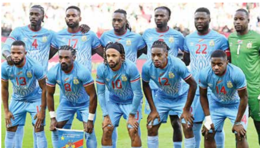
○ منتخب الكونغو.

في 17 يونيو ضد البرتغال. بعد ذلك، سيتوجه إلى غوادالاجارا لمواجهة كولومبيا في 24 منه، قبل أن يعود إلى الولايات المتحدة للعب أمام أوزبكستان في أتلانتا بعد 4 أيام.