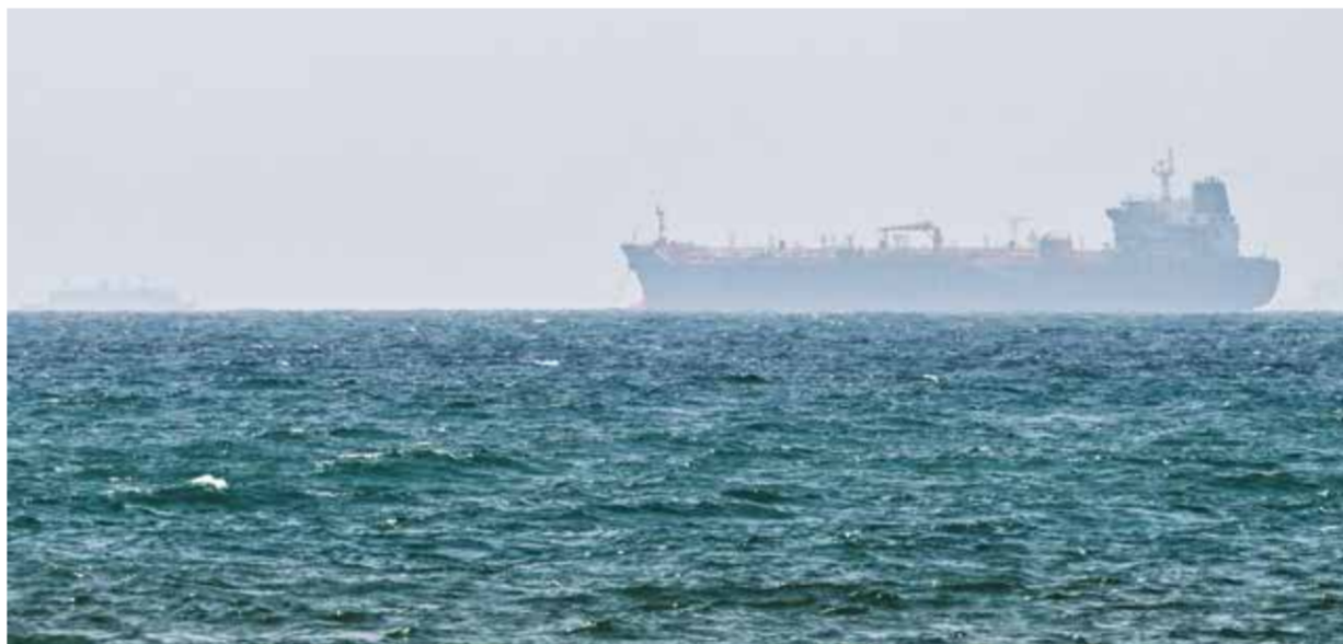
○ ناقلة نفط ترسو قبالة سواحل الفجيرة. (أ ف ب)

طهران - (أ ف ب): أعلنت الهيئة الإيرانية الجديدة المشرفة على مضيق هرمز أن نطاق السيطرة الذي تعلنه يمتد إلى المياه الواقعة جنوب ميناء الفجيرة الإماراتي، الذي يضم بنى تحتية نفطية مصممة لتجاوز الممر المائي الاستراتيجي، وهو ما انتقدته أبوظبي ووصفته بأنه «أضغاث أحلام». وتخضع حركة الملاحة عبر هرمز، وهو ممر حيوي للشحن العالمي، للسيطرة الإيرانية منذ اندلاع الحرب مع إسرائيل والولايات المتحدة في 28 فبراير.