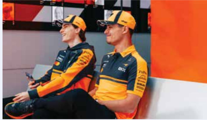
○ فريق ماكلارين

وقال فاسور، معلقا على إدخال ضوء التحذير الأزرق مدة 5 ثوان لضمان تشغيل الشواحن التوربينية «كان الأمر قاسيا بعض الشيء بالنسبة لنا». وأضاف: «أنتم ما فعلوه لأسباب تتعلق بالسلامة، لكن الخيار الآخر كان مطالبة الآخرين بالانطلاق من ممر الصيانة إذا اعتقدوا أن هذه الإجراءات غير آمنة».