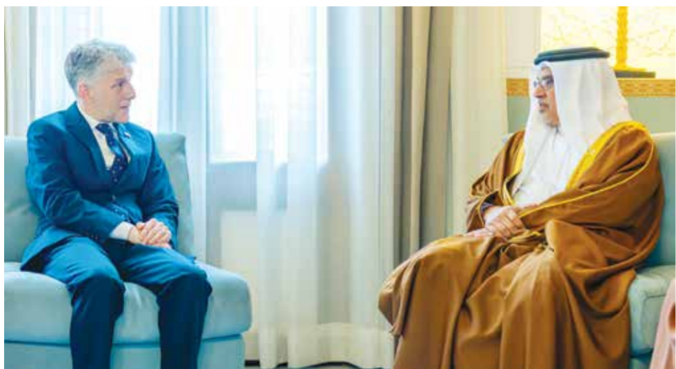
◊ سمو ولي العهد رئيس الوزراء خلال استقباله سفير المملكة المتحدة.