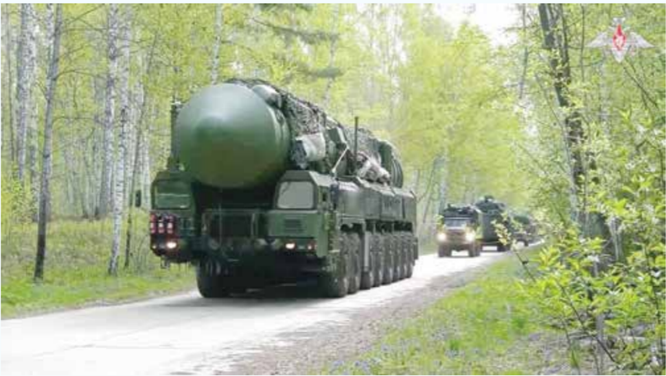
○ جانب من المناورات النووية الروسية.

بحر البلطيق بين ليتوانيا وبولندا، وكلاهما عضو في الحلف. ويبلغ عدد سكانها حوالي مليون نسمة، وهي مدينة عسكرية تعد مقر الأسطول الروسي في بحر البلطيق.