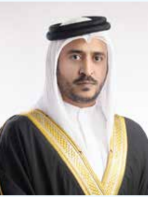
○ سمو الشيخ خالد بن حمد آل خليفة.

صدر عن سمو الشيخ خالد بن حمد آل خليفة النائب الأول لرئيس المجلس الأعلى للشباب والرياضة رئيس الهيئة العامة للرياضة رئيس اللجنة الأولمبية البحرينية، قرار رقم (5) لسنة 2026 بشأن تعيين مجلس إدارة مؤقت للنادي الأهلي الرياضي.