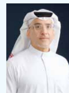
○ د. فيصل خالد كانو

سقط المنتخب الوطني للجودو إنجازاً رياضياً تاريخياً في السجلات الرياضية البحرينية، وذلك بتربُّعه على عرش الصدارة العربية في بطولة آسيا للجودو 2026، التي احتضنتها مدينة أوردوس الصينية، وسط مشاركة قوية ونوعية شهدت صراعا كبيرا بين 15 منتخبا يمثلون نخبة المنتخبات في القارة الآسيوية. وبهذه المناسبة، أكد نائب رئيس المجلس البحريني للألعاب القتالية رئيس الاتحاد البحريني للجودو د. فيصل خالد كانو أن هذا التميز الآسيوي جاء ثمرة للدعم اللامحدود والرعاية الكريمة التي تحظى بها الرياضة البحرينية من لدن القيادة الرشيدة، متمناً برعاية ودعم سمو الشيخ خالد بن حمد آل خليفة النائب الأول لرئيس المجلس الأعلى للشباب والرياضة رئيس الهيئة العامة للرياضة رئيس اللجنة الأولمبية البحرينية، والتي كان لها الأثر البالغ في رسم خارطة طريق واضحة لجميع الألعاب القتالية لبلوغ منصات التتويج القارية والدولية.