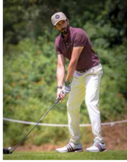
○ سموه خلال المنافسات.