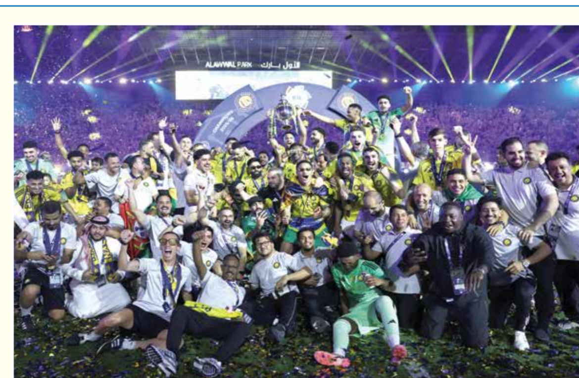
○ جانب من التتويج.

كانت مصر قد شهدت مساء الأربعاء منافسة حامية في الدوري، من خلال ثلاثة مباريات جرت في نفس التوقيت، حيث فاز الأهلي بهدفين مقابل لا شيء على النادي المصري في ستاد الجيش بمدينة برج العرب، ليحتل المركز الثالث في الدوري، فيما احتل المركز الثاني نادي بيراميدز بعد فوزه على نادي سموحة بهدفين مقابل هدف، وفاز الزمالك بالمركز الأول بعد فوزه على سيراميكا كليوباترا بهدف دون رد.