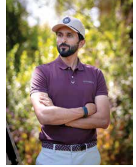
○ سمو الشيخ ناصر بن حمد آل خليفة.