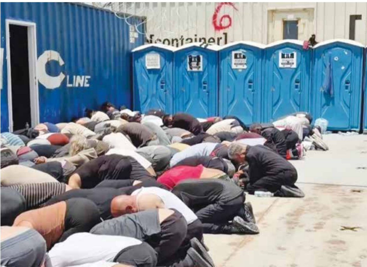
○ جانب من التكنيل البشع للاحتلال بحق نشطاء «أسطول الصمود».

يقول منظمو الأسطول إن هدفهم هو كسر الحصار الإسرائيلي على قطاع غزة عن طريق توصيل مساعدات إنسانية. وقال ناشط إيطالي آخر اسمه داريو كارتونوتسو، وهو نائب عن حركة (5-نجوم)، إنه تعرض للكلمات في عينه والركل خلال احتجاجه. ولم ترد الخارجية الإسرائيلية بعد على طلب التعليق على اتهامات النشطاء بالتعرض لسوء المعاملة بعد اعتراض الأسطول. وقال نشطاء شاركوا في أساطيل سابقة اعتراضها إسرائيل إنهم تعرضوا لسوء المعاملة على يد القوات الإسرائيلية، وهو ما نفته إسرائيل.