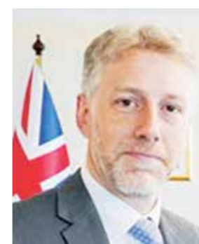
○ أليستر لونج.

بعد أمرًا مهمًا للغاية، مبيّنًا أن أثره سيشعر به الناس في جميع أنحاء دول مجلس التعاون الخليجي وعبر المملكة المتحدة. وأكد أن ذلك يأتي في لحظة شهدت فيها المنطقة اهتزازات، مشدداً على أهمية أن تكون المملكة المتحدة واضحة بشأن ثقتها في مستقبل دول مجلس التعاون الخليجي.