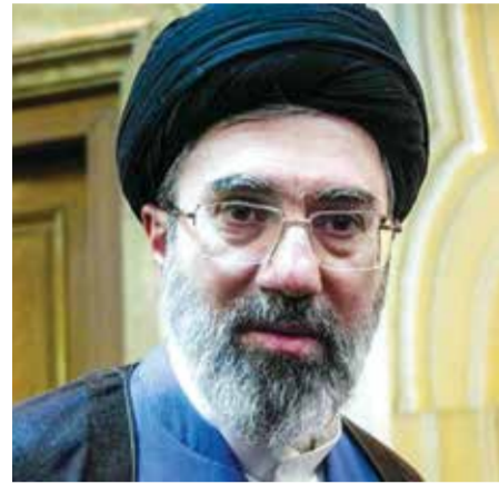
○ مجتبي خامنئي.

إن هذا الموقف تغير بعد تهديدات متكررة من ترامب بقصف إيران. ومع ذلك، قال مصدر: إن هناك «صيفاً مكنة» لحل هذه المسألة. وذكر أحد المصدرين الإيرانيين: «هناك حلول مثل تخفيف درجة تخصيب المخزون تحت إشراف الوكالة الدولية للطاقة الذرية.. وتقدر الوكالة أن إيران كانت تمتلك 440.9 كيلوجراماً من اليورانيوم المخصب بنسبة نقاء 60 بالمائة عندما هاجمت إسرائيل والولايات المتحدة المنشآت النووية الإيرانية في يونيو 2025. لكن من غير الواضح مقدار ما تبقى من تلك الكمية.