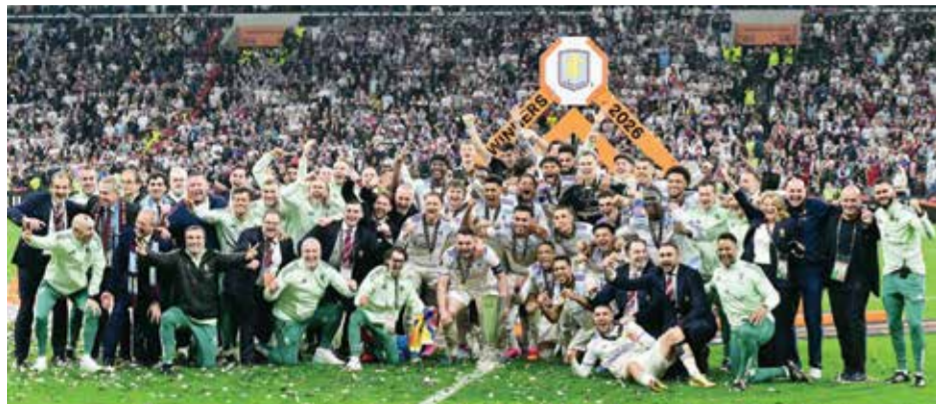
○ تتويج استون فيلا. (أ ف ب)