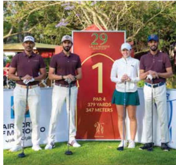
○ سموه يتوسط الفريق.