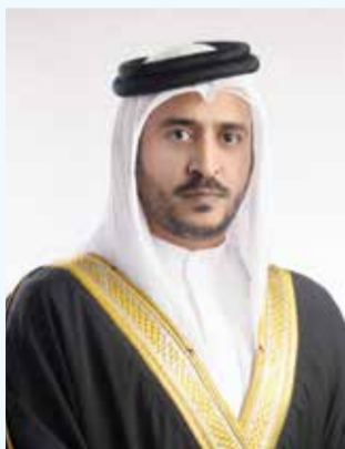
○ سمو الشيخ خالد بن حمد آل خليفة.

صدر عن سمو الشيخ خالد بن حمد آل خليفة النائب الأول لرئيس المجلس الأعلى للشباب والرياضة رئيس الهيئة العامة للرياضة رئيس اللجنة الأولمبية البحرينية، قرار رقم (5) لسنة 2026 بشأن تعيين مجلس إدارة مؤقت للنادي الأهلي الرياضي.