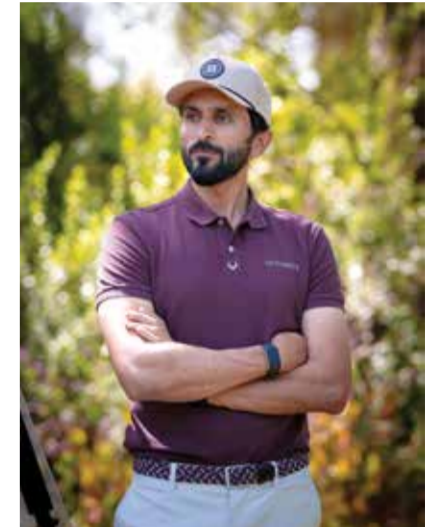
○ سمو الشيخ ناصر بن حمد آل خليفة.