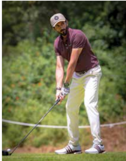
○ سموه خلال المنافسات.

○ سموه يتوسط الفريق. ○ سموه يلتقي الأمير مولاي رشيد. ○ سمو الشيخ ناصر بن حمد آل خليفة.