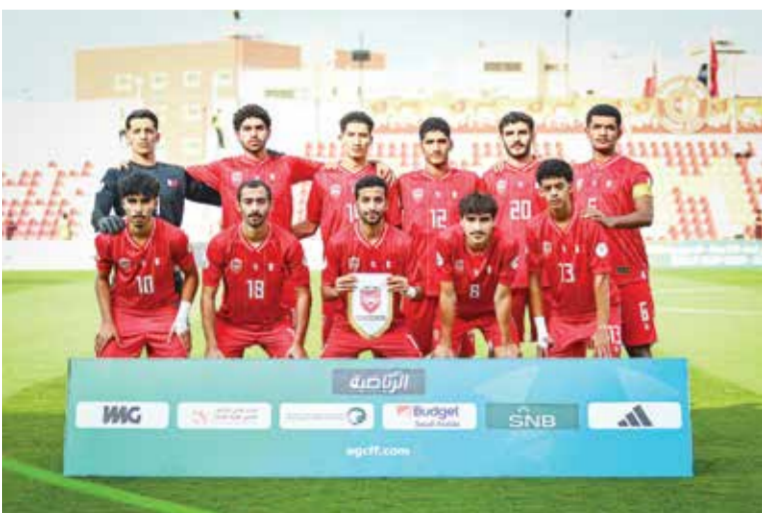
○ منتخبنا للشباب تحت 20 عاماً.

الشمالية وكامبوديا والبحرين والبرازيل والفلبين. أما المستوى الرابع فضم منتخبات بنغلاديش وتركمانستان والكويت ولبنان وفلسطين ولاوس وهونغ كونغ والصين وأفغانستان. وفي مرحلة التطوير، جاء في المستوى الأول منتخبات الصين تايبيه ومنغوليا وميانمار، فيما ضم المستوى الثاني منتخبات سنغافورة وغوام والمالديف. وجاء في المستوى الثالث منتخبات نيبال وبروناي دار السلام وبوتان، بينما ضم المستوى الرابع منتخبات مكاو وسريلانكا وجزر شمال ماريانا.