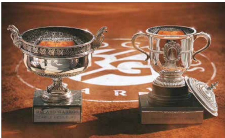
○ كأس رولان غاروس.

لسابالينكا في ثمن النهائي، رغم أن النجمة اليابانية لم تبلغ سابقا الأسبوع الثاني في باريس. وقد تنتظر لاعبة البيلاروسية في ربع النهائي الكندية الصاعدة ميوكو أو المصنفة الخامسة الأميركية جيسكا بيغولا.