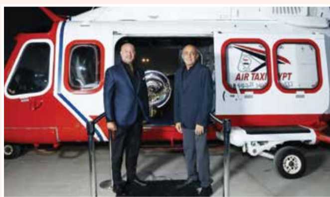
○ نقل درع الدوري المصري بمروحية