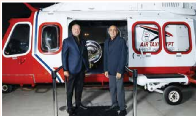
○ نقل درع الدوري المصري بمروحية