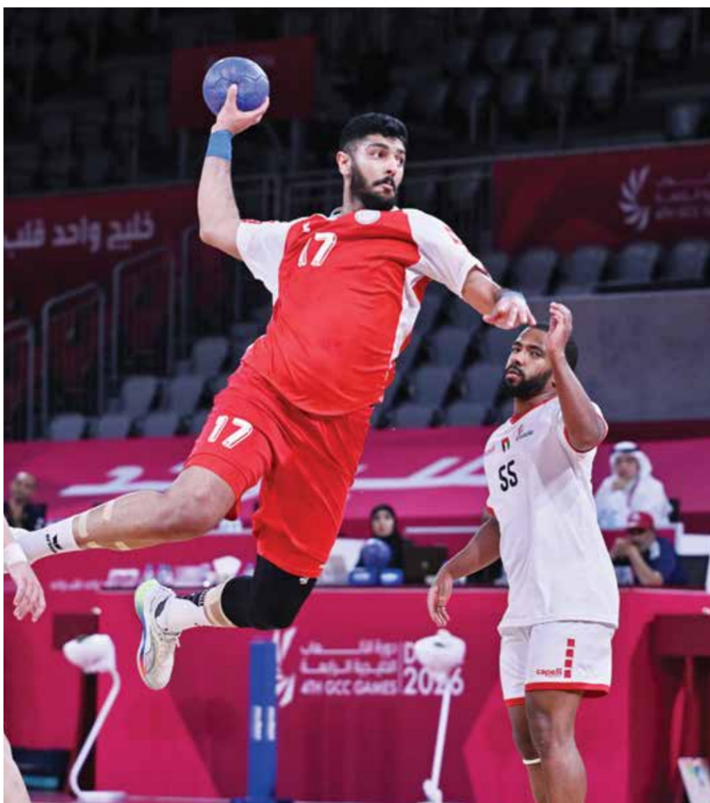
○ من لقاء منتخب رجال اليد والإمارات.

هذا الأداء المشرف والظهور البطولي يعكس المعدن الأصيل لرجال اليد البحرينية الذين لا يرضون بغير الصدارة بديلاً؛ ليرسموا بذلك لوحة فنية رائعة في حب الوطن، وينتظروا بشغف تتويجهم الرسمي والمستحق بالميدالية الذهبية الغالية، التي لا تمثل مجرد إنجاز جديد فحسب، بل تُسجل في التاريخ كالميدالية الذهبية رقم 25 «التاريخية» في مشوار فريق البحرين خلال هذه النسخة الاستثنائية من الدورة.