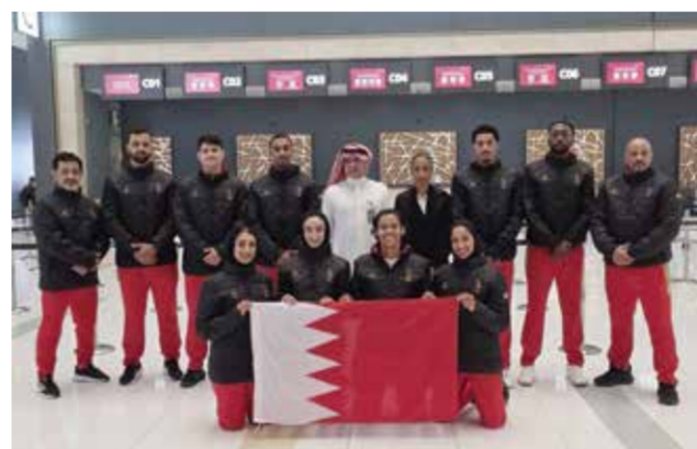
○ وفد المنتخب.

وأعرب عن ثقته الكبيرة في قدرة أفراد الوفد من جهازين فني وإداري ولاعبين على تقديم مستويات مشرفة تليق بسمعة الرياضة البحرينية والعودة بالإنجازات والبطاقات التأهيلية التي تترجم الرعاية المستمرة والدعم اللامحدود الذي تحظى به الرياضة من قبل القيادة الرياضية في المملكة.