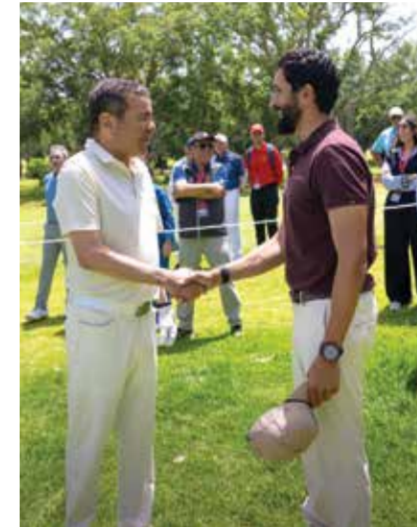
○ سموه يلتقي الأمير مولاي رشيد.