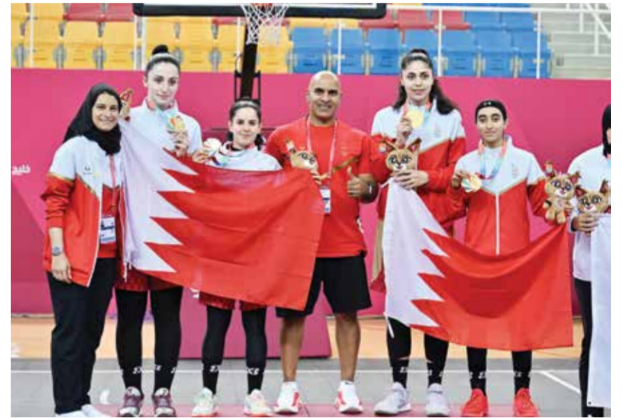
○ ذهبية 3x3 للسيدات.