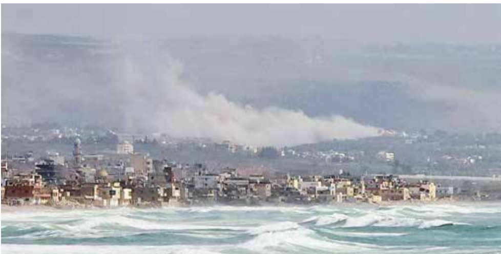
○ قصف إسرائيلي مستمر على مناطق الجنوب اللبناني.

وقشل وقف إطلاق النار الذي تم التوصل إليه بوساطة الرئيس الأمريكي دونالد ترامب في منع الهجمات الإسرائيلية على غزة، مع وصول إسرائيل وحركة حماس إلى طريق مسدود في المحادثات غير المباشرة حول نزع سلاح الجماعة. وترك وقف إطلاق النار إسرائيلي تسيطر على أكثر من