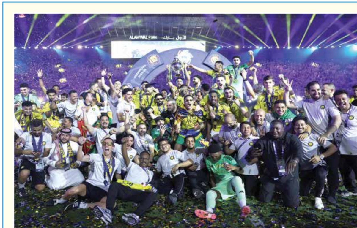
○ جانب من التتويج.

كانت مصر قد شهدت مساء الأربعاء منافسة حامية في الدوري، من خلال ثلاثة مباريات جرت في نفس التوقيت، حيث فاز الأهلي بهدفين مقابل لا شيء على النادي المصري في ستاد الجيش بمدينة برج العرب، ليحتل المركز الثالث في الدوري، فيما احتل المركز الثاني نادي بيراميدز بعد فوزه على نادي سموحة بهدفين مقابل هدف، وفاز الزمالك بالمركز الأول بعد فوزه على سيراميكا كليوباترا بهدف دون رد.