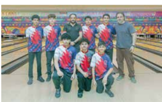
○ منتخب الناشئين.