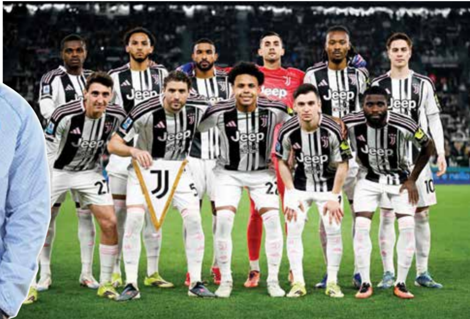
○ فريق يوفنتوس.