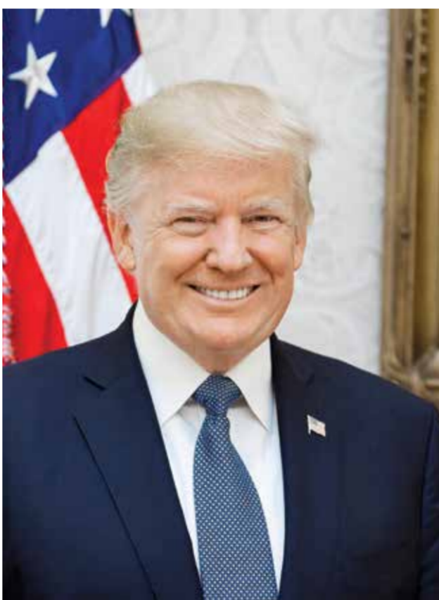
◊ الرئيس الأمريكي.