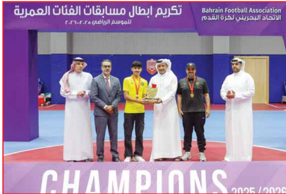
○ تتويج الخالدية.