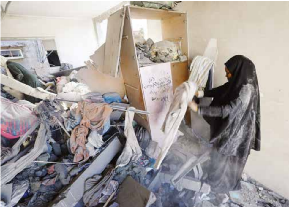
○ سيدة فلسطينية تبحث عما يمكن إنقاذه من متعلقات عائلتها بعد الغارة الإسرائيلية.

وقال إسماعيل «هاي 30 ستة بتشتغل.. وخمس دقائق كل حاجة بتروح ما تقوليش وقف إطلاق نار وهدنة فيش هيك.. كله كسذب هذا.. الحرب حرب والدمار دمار».