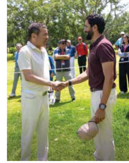
○ سموه يلتقي الأمير مولاي رشيد.