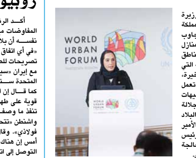
◊ وزيرة الإسكان خلال المنتدى.

أكدت أمينة بنت أحمد الرمحي وزيرة الإسكان والتخطيط العمراني أن مملكة البحرين قدمت نموذجاً في سرعة التجاوب مع الأضرار المدنية التي لحقت بالمنازل والبنية التحتية في عدد من مناطق المملكة إثر الاعتداءات الإيرانية التي تعرضت لها المملكة خلال الأونة الأخيرة، منوهة إلى أن حكومة مملكة البحرين تعمل وفق آلية عمل متكاملة لتنفيذ التوجيهات الملكية السامية لحضرة صاحب الجلالة الملك حمد بن عيسى آل خليفة ملك البلاد المعظم، وأمر صاحب السمو الملكي الأمير سلمان بن حمد آل خليفة ولي العهد رئيس مجلس الوزراء بتكفل الحكومة بمعالجة الأضرار التي لحقت بمنازل المواطنين.