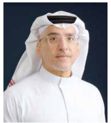
○ د. فيصل خالد كانو.

تهيئة الأجواء المثالية وتذليل كل العقبات أمام المنتخبات الوطنية للتميز الخارجي. وأوضح رئيس الاتحاد البحريني للجودو أن الاتحاد يمضي قدماً ويخطى ثابتة في تنفيذ خطته وبرامجه الاستراتيجية الرامية إلى تطوير اللعبة وتهيئة المناخ الملائم للأبطال من أجل تمثيل المملكة خير تمثيل في مختلف المحافل الدولية، مشيراً إلى أن هذه البطولة تعد محطة مهمة لقياس مدى تطور الجودو البحريني وتأكيد مكانته المتقدمة، معرباً عن بالغ شكره وتقديره لجميع اللاعبين وأعضاء الجهازين الفني والإداري على جهودهم الطيبة وعزيمتهم الكبيرة التي أظهرها طوال منافسات البطولة، والمسؤولية الكبيرة التي استشعرها الجميع لرفع علم مملكة البحرين عالياً في هذا المحفل الآسيوي المهم ومواصلة مسيرة حصد الإنجازات الذهبية.