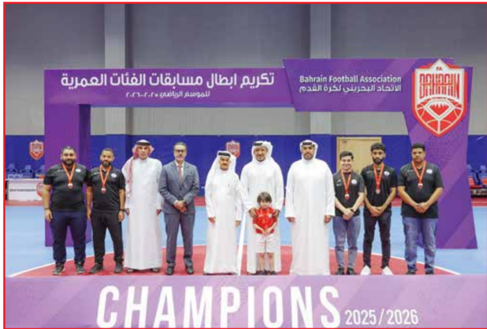
○ تتويج ستر.