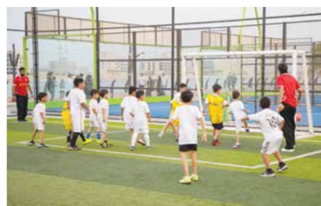
○ من فعاليات المدرسة.

كما تم خلال الحفل الإعلان عن إقامة المعسكر التربوي السنوي لمدريد، المقرر تنظيمه خلال الفترة من 22 أغسطس وحتى 31 أغسطس المقبل، والذي يُعد استثماراً تربوياً ورياضياً في الأبناء، من خلال صقل مواهبهم وتنمية قدراتهم في بيئة تعليمية وتربوية ثرية، بإشراف نخبة من المدربين المتخصصين وذوي الخبرة في هذا المجال.