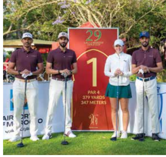
○ سموه يتوسط الفريق.