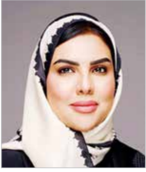
بقلم: عبير محمد طرار دهم

بعقلية الإنجاز، بينما يدخل المشخص بعقلية الترقب والتحليل والبحث عن «من يقصد من». ولهذا تكفر عنده الجمل من نوع: «أكيد يقصدني» و«ليش قالها رسالة وراء الكلام؟ وليش مجتمعين؟ وليش نجح؟». وفي هذه البيئات تتحول في نظرها المتابع إلى تسلط، والتنظيم إلى فرض رأي، والثقة إلى غرور، والإنجاز إلى استعراض. يصبح الشخص المبادر مصدر إزعاج، بينما يكافأ الصامت الذي لا يقول شيئاً ولا يفعل شيئاً لأنه لا يوقظ حساسيات أحد.