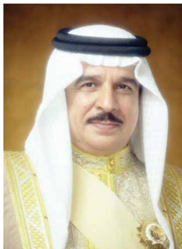
◊ جلالة الملك المعظم.

تلقى حضرة صاحب الجلالة الملك حمد بن عيسى آل خليفة ملك البلاد المعظم رسالة خطية من فخامة الرئيس دونالد ترامب رئيس الولايات المتحدة الأمريكية الصديقة، تضمنت الإشادة بعمق علاقات الصداقة التاريخية والشراكة الاستراتيجية الوثيقة التي تجمع بين مملكة البحرين والولايات المتحدة الأمريكية. وأكد فخامة الرئيس الأمريكي في رسالته أعجابه بالوحدة الوطنية في مملكة البحرين وتكاتف شعبيها، مشدداً على التزام بلاده الراسخ بدعم أمن واستقرار منطقة الخليج في ظل استمرار إيران في عدوانها وانتهاكاتها الصارخة للقانون الدولي. كما أعرب فخامته عن تمنياته لجلالة الملك المعظم دوام الصحة والسعادة ولمملكة البحرين وشعبها المزيد من التطور والأزدهار، ودوام الأمن والاستقرار.