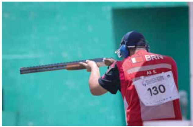
○ من منافسات الرماية