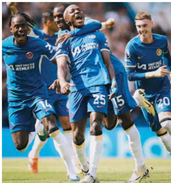
○ لاعبو تشيلسي.

في بلوغ المسابقات الأوروبية الموسم المقبل. ولم يحقق تشيلسي أي فوز في الدوري الإنجليزي منذ الرابع من مارس وقد حصل على نقطة واحدة فقط من آخر سبع مباريات. وقال مكفارلين: «لقد رأينا ما هم (اللاعبين) قادرين على تقديمه وعليهم أن يواصلوا على ذلك مع كل تلك الإصابات في فريقنا قدمنا مباراة جيدة أمام مانشستر سيتي، وكانت مباراة متكافئة».