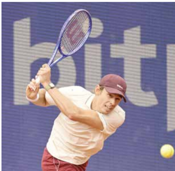
○ دي مينور.

لندن - (د ب أ): ابتعد الإيطالي يانك سينر بصدارة التصنيف العالمي الصادر عن رابطة لاعبي التنس المحترفين، أمس الإثنين. ووسع سينر الفارق مع منافسه الإسباني كارلوس ألكازار صاحب المركز الثاني في التصنيف مستفيداً من تنويجه بلقب جديد على مستوى بطولات الإسبانة «فئة 1000 نقطة»، بفوزه ببطولة روما، على حساب النرويجي كاسبر رود. وحقق رود قفزة أيضاً في تصنيفه بتقدمه 8 مراكز للأمام ليحتل المركز السابع عشر. وعلى مستوى العشرة الأوائل، تقدم الروسي دانييل ميديفيدف خطوتين ليحتل المركز السابع بعدما ودع بطولة روما المفتوحة بالخسارة أمام سينر في دور الثمانية، بينما تراجع خطوة واحدة كل من الأمريكي تايلور فريتز والأسترالي أليكس دي مينور، ليتواجد في المركزين الثامن والتاسع توالياً. ودخل الكازخي ألكسندر بوبليك قائمة العشرة الأوائل على حساب الإيطالي لورينزو موسيتي الذي تراجع للمركز الحادي عشر. كما تقدم الإسباني رافاييل خودار خمس خطوات، ليحتل المركز 29، بينما قفز الصربي ميومير كيسمانوفيتش 23 خطوة للأمام ليحتل المركز 47 ويتواجد بين أول 50 لاعبا في التصنيف.