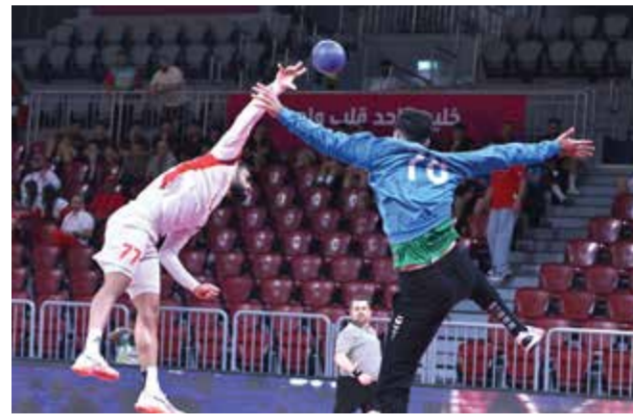
○ انتصار عريض لمحاربي اليد