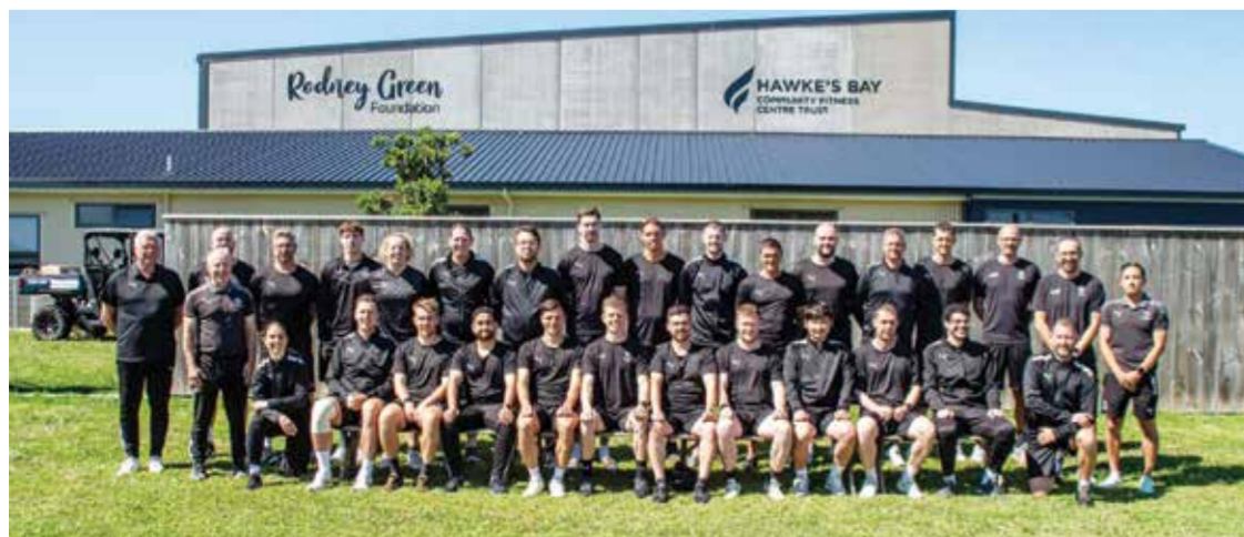
○ منتخب نيوزلندا.

ويلينجتون - (أ ب): شكلت مجموعة من مشجعي نيوزلندا يعيشون في مختلف أنحاء العالم رابطة تسمى «الكيوي الطائر» لتشجيع منتخب بلاده لكرة القدم في المناسبات المهمة، وغالبا ما يكون عددهم أقل من قوام المنتخب.