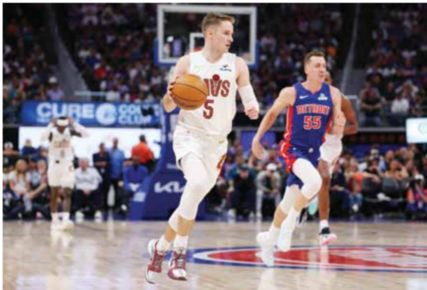
○ من مباراة كافاليرز وبيستونز

8 تمريرات حاسمة، واحداً من أربعة لاعبين في كافاليرز سجلوا 20 نقطة أو أكثر، إلى جانب جاريت ألن (23 مع 7 متابعات) وإيفان موبلي (21 مع 12 متابعات) و6 تمريرات حاسمة) وسام ميريل (23) الذي دخل من مقاعد البدلاء. وجاء الفوز العريض خارج الديار بعدما أضعاف كليفلاند فرصة حسم السلسلة على أرضه الجمعة، ليواصل