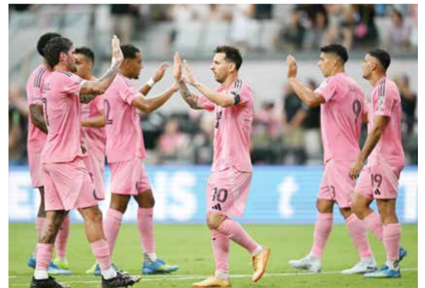
○ ميسي يحتفل بالفوز.

ومهد ميسي الكرة إلى الأوروغوياني لويس سواريس الذي مررها بدوره ببنية إلى الفنزويلي تيلاسكو سيجوفيا، فحضرها الأخير كعب القدم إلى النجم الأرجنتيني