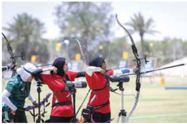
○ أداء لافت للاعبين ولاعبات السهم