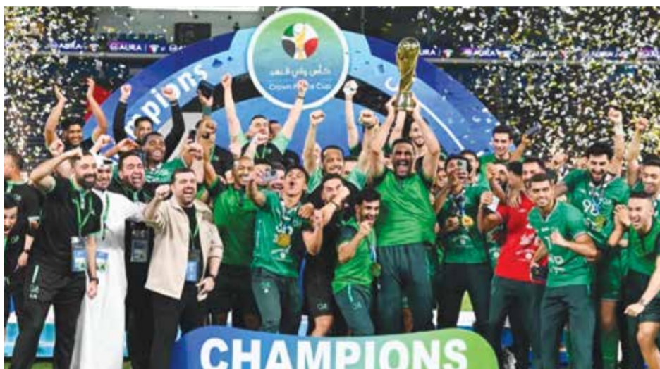
○ جانب من التتويج.