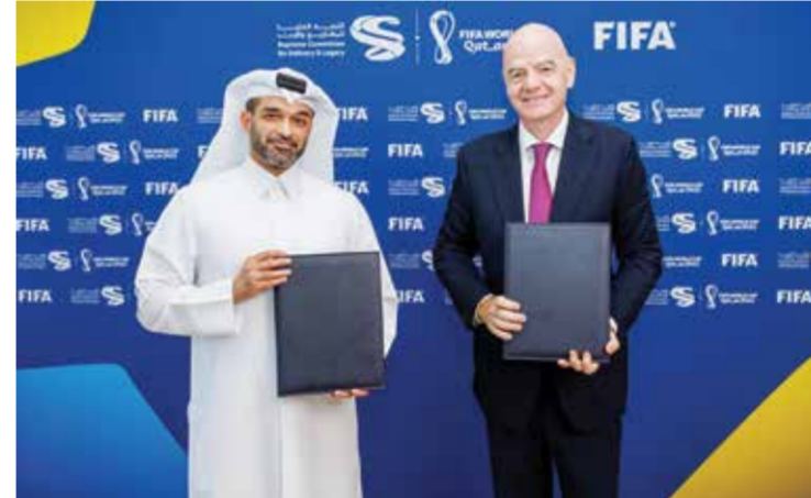
○ جانب من توقيع الاتفاقية.

وأضاف: «تجمع كرة القدم مختلف شعوب العالم تحت مظلة واحدة تمكنهم من الاحتفاء بشغفهم المشترك لهذه الرياضة، كما تساهم البطولات الكبرى مثل كأس العالم في تقديم تجارب رياضية وثقافية لا تنسى لملايين الأشخاص حول العالم، وذلك بفضل العمل الاستثنائي الذي تقدمه مختلف الكفاءات المتميزة العاملة على هذه الأحداث».