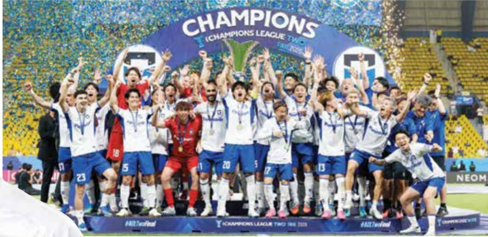
○ تتويج غامبا أوساكا.

مرتين فقط أسام النصر، وهو ثاني أقل معدل له في مباراة واحدة هذا الموسم. وتم إشهار البطاقة الحمراء 22 مرة، حيث حصل كل من نادي المحرق البحريني، ونادي بكين الصيني، ونادي جوا (الهند) عليها مرتين.