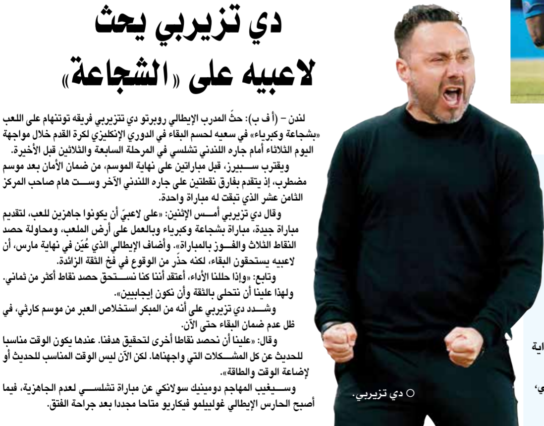
○ دي تزييري.

وسيفيغ المهاجم دومينيك سولانكي عن مباراة تشيلسي لعدم الجاهزية، فيما أصبح الحارس الإيطالي غوليليمو فيكارو متاحاً مجدداً بعد جراحة الفخذ.