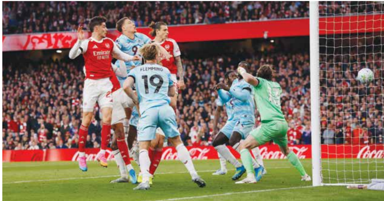
○ هدف أرسنال.

رايا طوال اللقاء. وهذه المباراة السابعة عشرة التي يخرج فيها أرسنال بشباك نظيفة في الدوري.