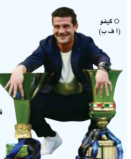
○ كيفو (أ ف ب)

وسيلتقي إنتر ميلان في الجولة الأخيرة من الموسم مع ضيفه بولونيا، كما أنه توج بلقب كأس إيطاليا بعد فوزه على لاتسيو 2/ صفر يوم الأربعاء الماضي في النهائي.