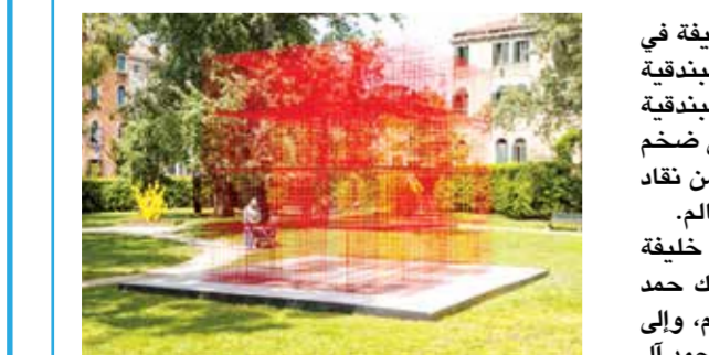
العمل الفني الذي قدمه الشيخ راشد آل خليفة. بوصفه جسراً حضارياً يربط بين الشرق والغرب.