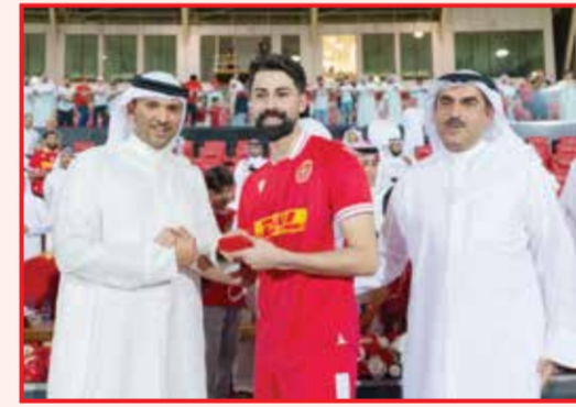
○ تتويج المحرق.