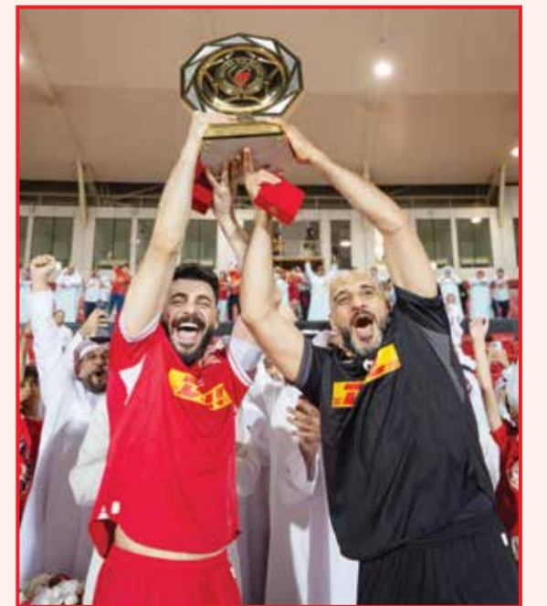
○ فرحة التتويج.