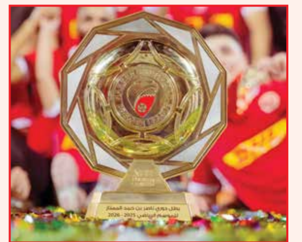
○ درع الدوري.