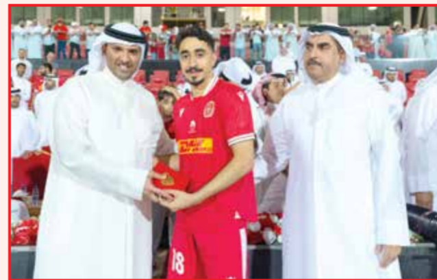
○ جانب آخر من التتويج.