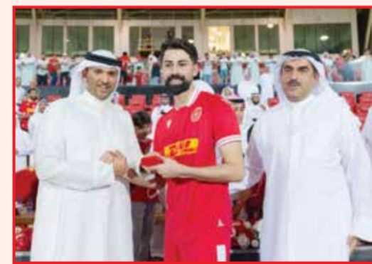
○ تتويج المحرق.