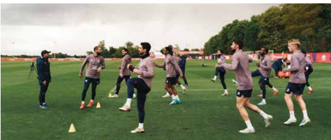
○ تدريبات ليل

وقال مدرب ليون البرتغالي باولو فونسيكا «عندما بدأنا الموسم، من كان يصدق أننا سننتهي في هذه المراكز؟». وأضاف: «عندما ترى الاستثمارات التي قامت بها الأندية الأخرى وبنا نحن، لم أكن أتصور أبداً أننا سنكون حيث نحن الآن». ويتأخر رين بدوره بنقطة واحدة عن ليون، ولا