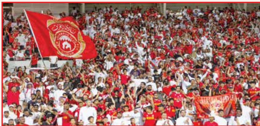
○ جماهير المحرق.