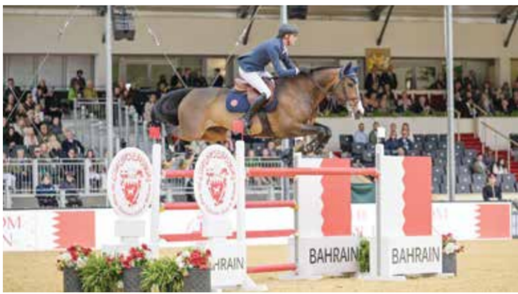
○ جانب من المنافسات.

تواصل مسيرتها على صعيد رياضة الفروسية وسباق الخيل عبر تسخير كافة الإمكانيات للتطوير المستمر والدفع بها نحو مستويات أكثر تقدماً، الأمر الذي أسهم في ترسيخ مكانة المملكة وتميزها في هذه