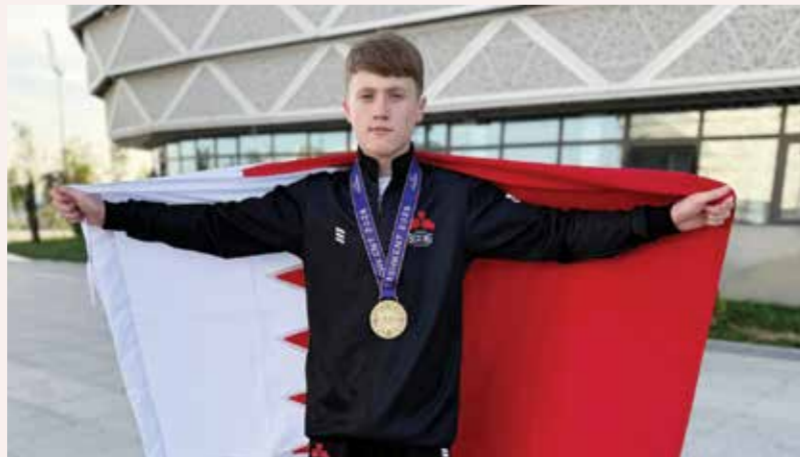
○ برايس يحتفل بالفوز

وأضاف سمو الشيخ سلمان بن محمد آل خليفة: «نعزز كثيراً بما قدمه الملاكم البطل جايدن برايس في هذا المحفل الفساري. لقد أظهر روحاً قتالية عالية وعزيمة صلبة مكنته من تحطى ملاكمي القارة في 4 مواجهات قوية. إن هذا الإنجاز يضع الملاكمة البحرينية في مكانة جديدة، ويؤكد أن الاستراتيجية التي رسمها سمو الشيخ خالد بن حمد آل خليفة، في دعم الفئات العمرية وصناعة الأبطال، تسير في الطريق الصحيح نحو مستقبل واعد للرياضات القتالية في المملكة».