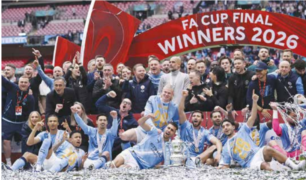
○ تتويج سيتي.

وفاز غوارديولا بالكأس مرتين عامي 2019 و2023، وبجرازه للمرة الثالثة، رفع رصيده إلى 20 لقباً بالمجمل منذ وصوله إلى سيتي قبل عقد من الزمن.