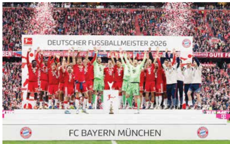
○ احتفالية بايرن