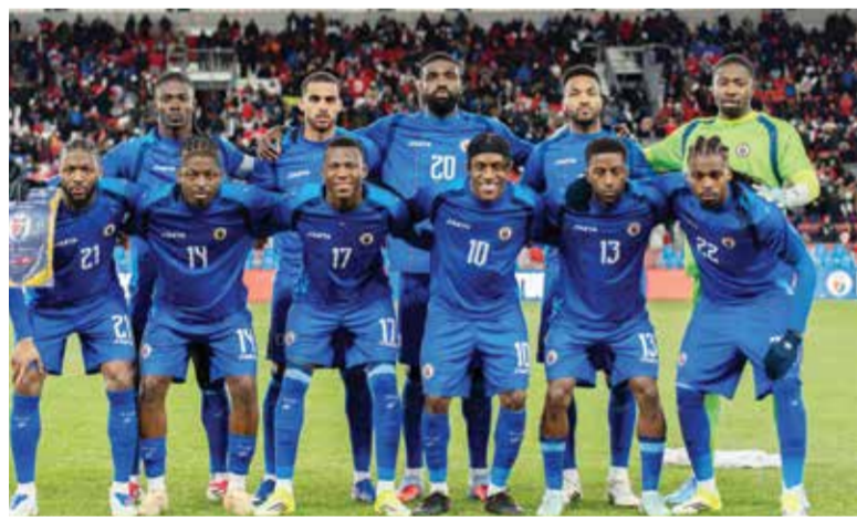
○ منتخب هايتي.