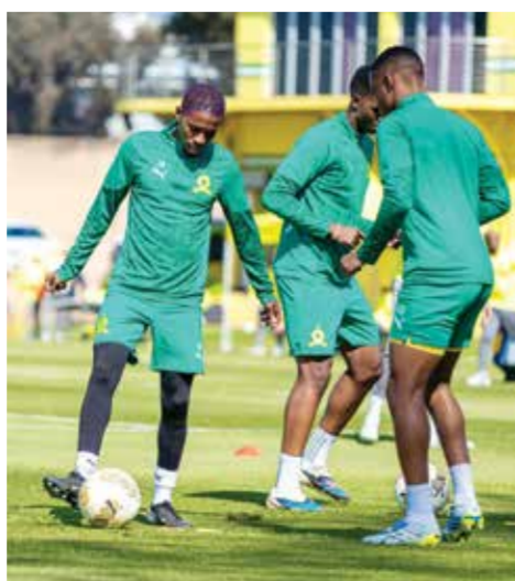
○ تحضيرات صنداوزن.

وعلى الصعيد التكتيكي، شدد البرتغالي على ضرورة التوازن بين الهجوم والدفاع، محذراً من خطورة قاعدة الهدف خارج الديار: «لن نغفل حماية مرمانا، لأن استقبال أي هدف في ملعبنا قد يخلط أوراقتنا تماماً».