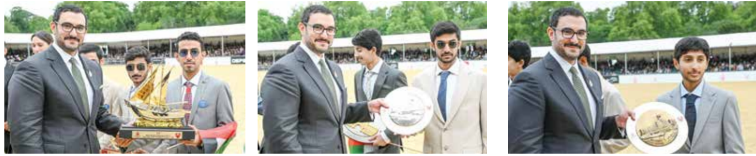
○ سمو الشيخ عيسى بن سلمان بن حمد يتوج الفائزين.