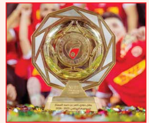
○ درع الدوري.