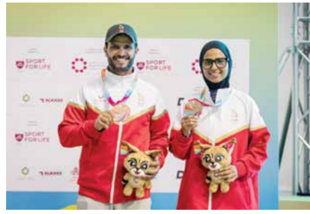
○ تتويج فنانا الرماية