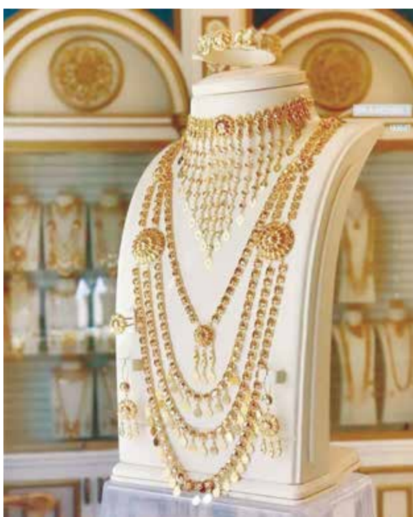
كتبت: نوال عباس

ليس فقط في أسعار عوائد السندات الأمريكية، بل في جميع عوائد السندات الدولية»، وارتفعت عوائد سندات الخزنة الأمريكية القياسية لأجل 10 سنوات إلى أعلى مستوى لها منذ عام تقريباً، مما زاد من تكلفة الفرصة البديلة للذهب الذي لا يدر عائداً. وكان الدولار على وشك تحقيق أعلى مكاسبه الأسبوعية في شهرين، مما جعل الذهب المسعر بالدولار أكثر تكلفة للمشتريين الأجانب. وارتفعت أسعار النفط الخام بأكثر من 40% منذ بدء الحرب على إيران في 28 فبراير، ما أدى إلى ارتفاع