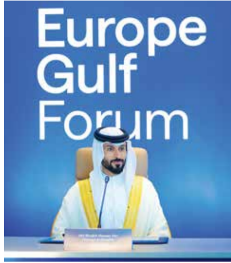
سمو الشيخ ناصر بن حمد مشاركاً في القمة.

والنمىة والأمن المشترك. وأشار سموه إلى أن القمة تمثل منصة دولية مهمة لتعزيز الحوار الاستراتيجي بين أوروبا ودول الخليج، خاصة في ظل المتغيرات العالمية المتسارعة، وما تتطلبه من تنسيق أكبر في ملفات الأمن والطاقة والاستثمار والتكنولوجيا والاقتصاد الرقمي.