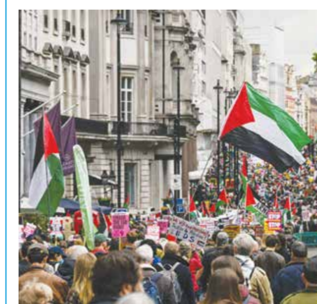
جانب من التظاهرات الحاشدة.

احتشد عشرات الآلاف في وسط لندن أمس في احتجاجين منفصلين، أحدهما على ارتفاع معدلات الهجرة والثاني تضامناً مع الفلسطينيين. ونشرت الشرطة أربعة آلاف فرد، منهم تعزيزات من خارج العاصمة، وتعدت «بأكبر قدر من الحزم» في استخدام السلطة، فيما وصفها بأنها أكبر عملية لحفظ النظام العام منذ سنوات. وتظاهر عشرات الآلاف من المؤيدين للقضية الفلسطينية في العاصمة البريطانية لندن، مرددين هتافات مؤيدة للفلسطينيين ومعارضة للاحتلال الإسرائيلي داخل شوارع لندن. وبحسب صحيفة الجارديان البريطانية، ردد المتظاهرون هتافات «من النهر إلى البحر فلسطين ستكون حرة»، وقد أثار هذا الهتاف جدلاً؛ إذ صرح كبير ستارمر سابقاً بأنه يعتقد أنه معاد للسامية. وتم تنظيم المظاهرات احتجاجاً إحياء