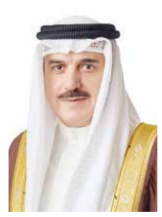
○ رئيس مجلس النواب

وهناك أحمد بن سلمان المسلم رئيس مجلس النواب، الرياضي، بمناسبة فوز فريقه الأول لكرة القدم ببطولة دوري ناصر بن حمد الممتاز لكرة القدم للموسم الرياضي 2026/2025. وأعرب عن