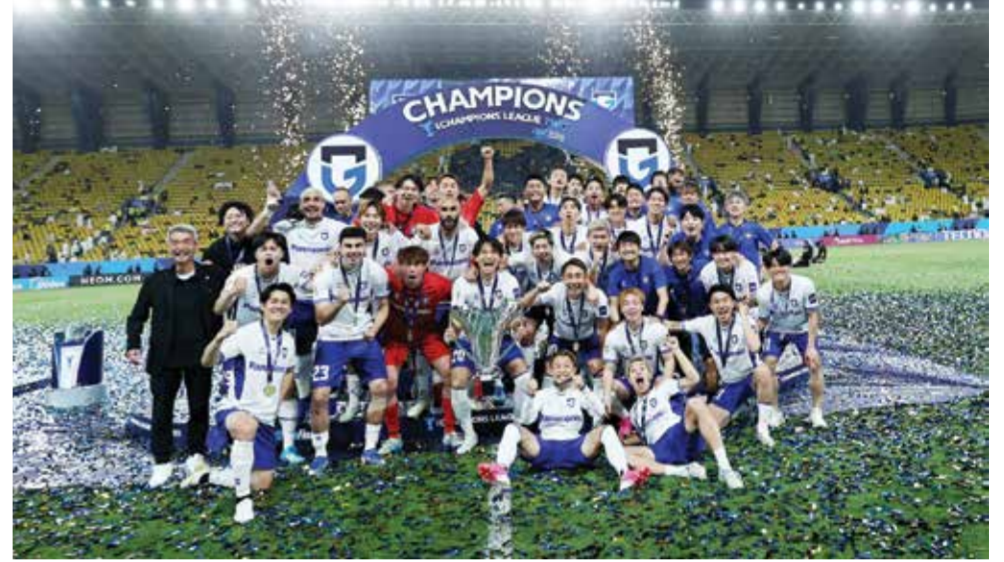
○ تتويج البطل