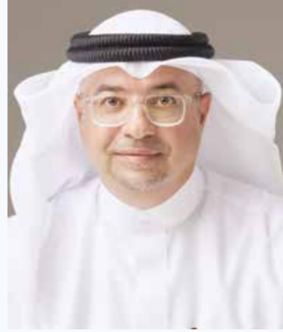
○ بقلم: عيسى بن عبدالرحمن الحمادي

وانظر إلى حال الشعوب إذا تمكن فيها الولاء للخارج، تجد الدولة تضعف وإن بقي أسماها، والسيادة تتآكل وإن بقي علمها، والمؤسسات تختطف وإن بقيت أبوابها مفتوحة. فهناك لا يعود القرائ الوطني صادراً عن مصلحة الناس، بل وإراداً من مكاتب التنظيم، ولا يعود المال العام والخاص طريقاً إلى مدرسة ومستشفى وفرصة عمل، ولا مورداً لعمران ورخاء وكرامة، بل معبراً إلى نفوذ وسلاح وشبكات تعبئة. تُجبي الأموال باسم العقيدة، وتستنزف الجيوب باسم الولاء، ثم تُصدّر إلى الخارج لتغذية سلطة التنظيم الخميني وأذرعته، بينما يبقى الناس في ضيق المعاش، وشخّ الخدمات، وانكسار الأمل. فلا إزدهار ينعكس على الفقير، ولا عمران ينتفع به المواطن، ولا كرامة يلمسها العامل والكادح، وإنما وكلاء ما يُسمى بالوليّ الفقيه يزادون غنى، والمنضوون تحتهم يزادون فقراً، وشعارات تعلق في المنابر، وبيوت تنث تحت الحاجة. وهكذا