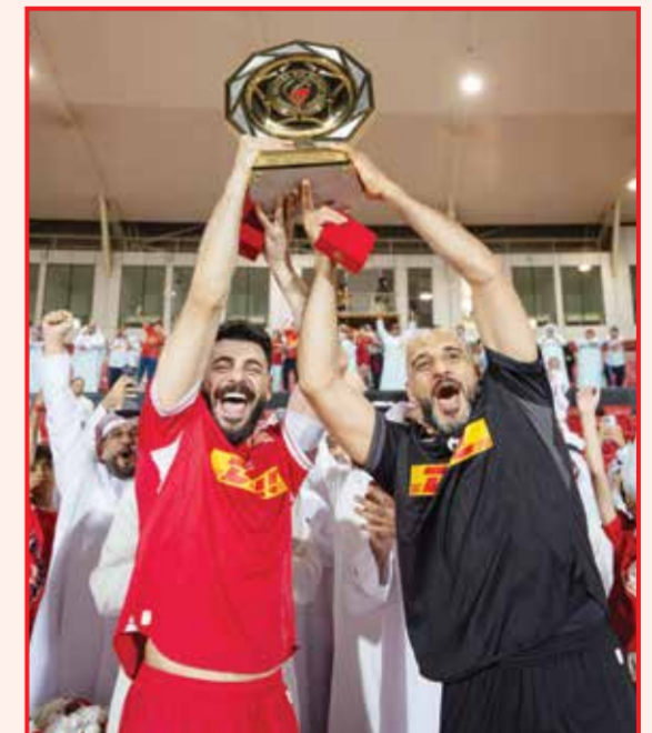
○ فرحة التتويج.