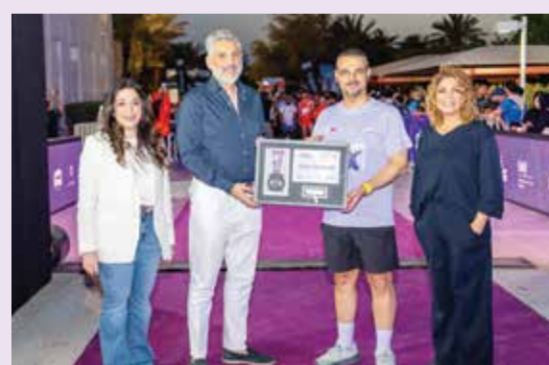
○ الرئيس مكرما الشريفي وعسكر.