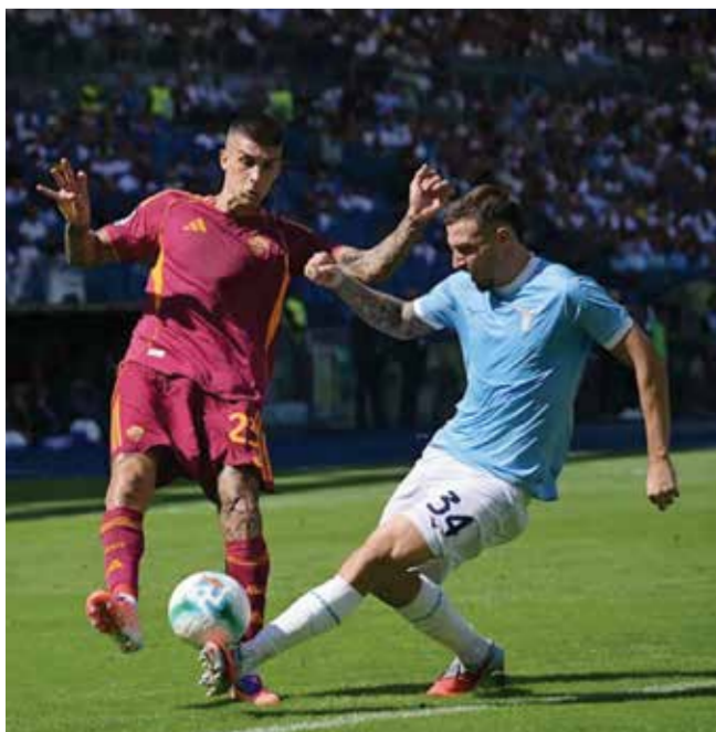
○ من مباراة سابقة بين روما ولاتسيو.

ويقع الملعب الأولمبي في الموقع ذاته لـ«فورو إيتاليكو» الذي يحتضن بطولة التنس، إحدى دورات ماسترز ألف المرموقة، وقد اتخذ القرار لتجنب أي اضطرابات جماهيرية محتملة بالقرب من جمهور رياضي أكثر هدوءا.