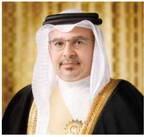
O سمو ولي العهد رئيس الوزراء.

قصيدة مهداة إلى مقام صاحب السمو الملك الأمير سلمان بن حمد آل خليفة ولي العهد ورئيس مجلس الوزراء حفظه الله تعالى.