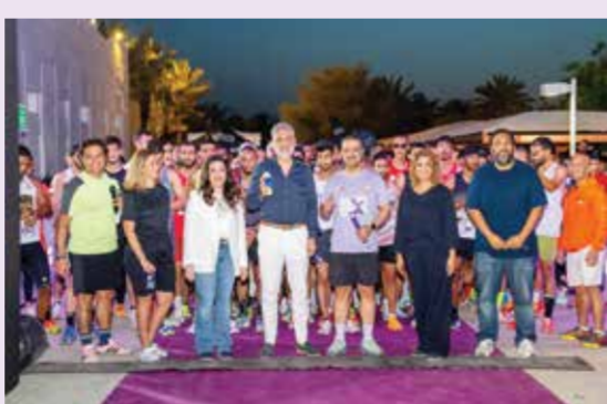
○ صورة جماعية.