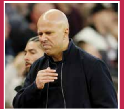
○ سلوت