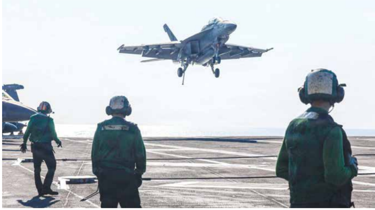
حاملة طائرات أمريكية في المنطقة.

رضاه تجاه المقترحات الإيرانية المتعلقة بخفض التصعيد. وفي المقابل، أعلن مسؤولون إيرانيون أن طهران تستعد هي الأخرى لاحتمال عودة المواجهة العسكرية.