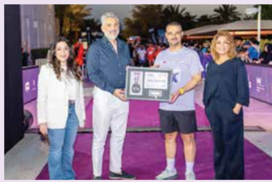
○ الرئيس مكرم الشريفي وعسكر.