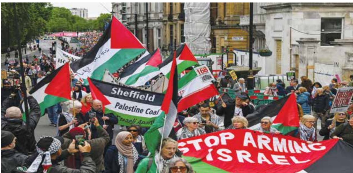
○ حشود المتظاهرين رفعوا العلم الفلسطيني في لندن.

سيواجه أقصى عقوبة ينص عليها القانون». واتهم منظمي مسيرة روينسون بـ«نشر الكراهية والانتقام». وحث روينسون الحضور على عدم وضع الكمامات أو الإفراط في شرب الكحول. والتحلّى بالهدوء والكرامات، متحدداً عن «ثورة ثقافية». وقبل الحدث، منعت الحكومة دخول 11 «محرّضاً أجنبياً من اليمين المتطرف» البلاد، من بينهم فالتنيتا غوميز المقبلة في الولايات المتحدة والمعروفة بخطابها المعادي للمسلمين وأيدت الشرطة محاوفاً من مشاركة مفترى الشعب من مشجعي كرة القدم، ممن سبق لهم دعم روينسون.