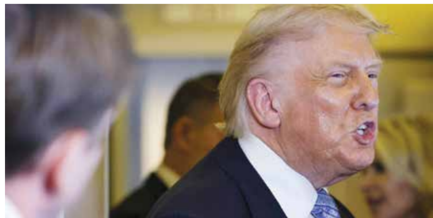
○ ترامب يتحدث إلى الصحفيين عقب عودته من بكين حيث بحث الملف الإيراني مع الزعامة الصينية.

واشنطن - (رويترز): خلال السنة الأولى منذ عودته إلى منصبه، نجح أسلوب الرئيس الأمريكي دونالد ترامب الجامع في التفاوض في انتزاع تنازلات من الدول بشأن قضايا تراوحت بين الرسوم الجمركية والزعماء المسلحة. لكن مع إيران، يبدو أن هذا النوع نفسه من الدبلوماسية القوية، المنتمية بالتهديدات العلنية والإهانات والإنذارات النهائية، وصل إلى طريق مسدود وربما يقوض جهود لإنهاء حرب عصفت بالاقتصاد العالمي. وفي ظل الجمود بين الطرفين، يشعر ترامب بإحباط متزايد إزاء الأزمة المستمرة منذ 11 أسبوعاً لكنه لم يبد رغبة في تخفيف نهج الدبلوماسي اللف تجاه قادة إيران. وهذا ينذر بعدم التوصل إلى تسوية سريعة عن طريق التفاوض مما يؤجج المخاوف من أن المواجهة الحالية - والصدمة الأكبر على الإطلاق في إمدادات الطاقة العالمية الناتجة عن ذلك - قد تستمر