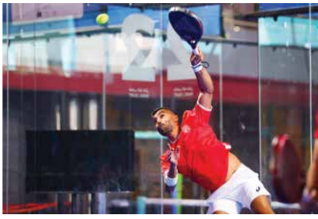
○ من منافسات البادل