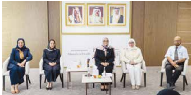
وزيرة الصحة خلال لقائها للجنة الطبية ببعثة الحج.

في إطار الاستعدادات المكثفة لموسم حج 1447هـ أكدت الدكتورة جليدة بنت السيد جواد حسن حرص وزارة الصحة على تسخير كل الإمكانيات لتوفير الرعاية الصحية المتكاملة لحجاج مملكة البحرين، بما يضمن سلامةهم الصحية ويمكنهم من أداء مناسكهم بكل يسر وطمأنينة، تنفيذاً لتوجيهات حضرة صاحب الجلالة الملك حمد بن عيسى آل خليفة ملك البلاد المعظم، ومتابعة صاحب السمو الملكي الأمير سلمان بن حمد آل خليفة ولي العهد رئيس مجلس الوزراء. جاء ذلك خلال لقائها أعضاء اللجنة الطبية ببعثة مملكة البحرين للحج، إذ أشادت بكفاءة الكوادر الطبية والتدريبية والفنية المشاركة في الموسم، مؤكدة مواصلة تطوير الخدمات الصحية الإلكترونية، من أبرزها إصدار «شهادة الحاج الصحية» إلكترونياً، بما يسهم في تسهيل الإجراءات وتعزيز جودة الخدمات المقدمة للحجاج. كما تُنمّت