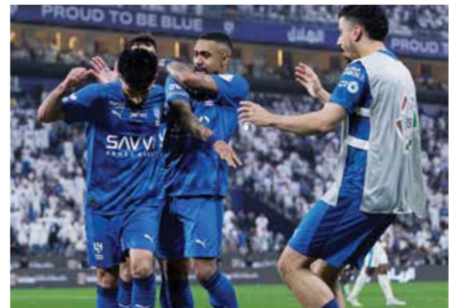
○ فرحة هلالية.

ورفع الهلال رصيده إلى 81 نقطة في المركز الثاني بفارق نقطتين عن النصر الذي يملك مصيره بين يديه، إذ عليه الفوز في المرحلة الختامية على ضمك في 21 الجاري ليحسم اللقب، بغض النظر عن نتيجة الهلال مع الفيحاء في اليوم ذاته.