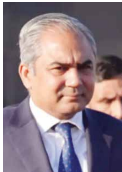
○ وزير الداخلية الباكستاني.

عراقجي الجمعة إن إيران تلقت رسائل من واشنطن مفادها أن إدارة الرئيس الأمريكي دونالد ترامب مستعدة لمواصلة المحادثات.