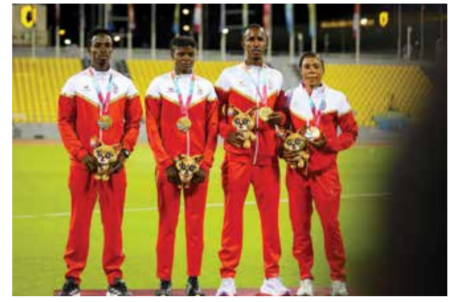
○ تتويج فريق التتابع المختلط