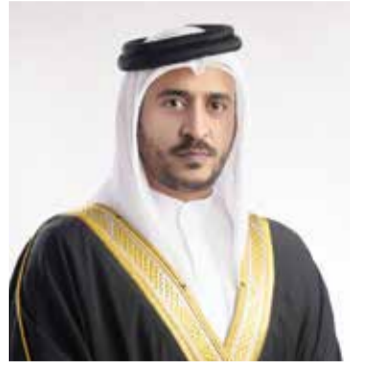
○ سمو الشيخ خالد بن حمد آل خليفة.

اللجنة الأولمبية تفوز بجائزة SPIA لصناعة الرياضة بالشرق الأوسط