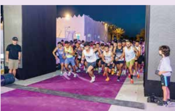
○ لحظة الانطلاق.

وأعرب عن خالص التهاني والتبريكات إلى الشيخ أحمد بن علي آل خليفة رئيس مجلس إدارة نادي المحرق الرياضي. وأشاد رئيس مجلس النواب بما تحظى به الرياضة البحرينية من رعاية سامية من حضرة صاحب الجلالة الملك حمد بن عيسى آل خليفة ملك البلاد المعظم حفظه الله ورعاه، ودعم صاحب السمو الملكي الأمير سلمان بن حمد آل خليفة ولي العهد رئيس مجلس الوزراء حفظه الله. وتمن رئيس مجلس النواب، جهود سمو الشيخ ناصر بن حمد آل خليفة ممثل جلالة الملك المعظم لشؤون الشباب والرياضة، رئيس المجلس الأعلى للشباب والرياضة،