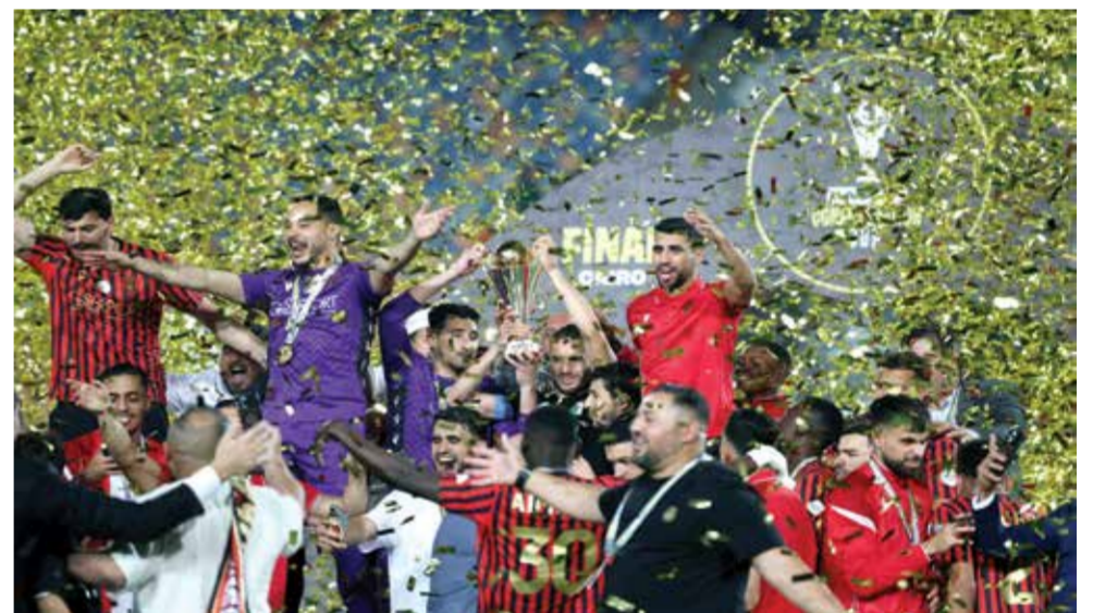
○ تتويج اتحاد العاصمة.

وسلم قائد بايرن وحارسه المخضرم مانويل نوير درع الدوري الألماني إلى ليون غوريتسكا الذي