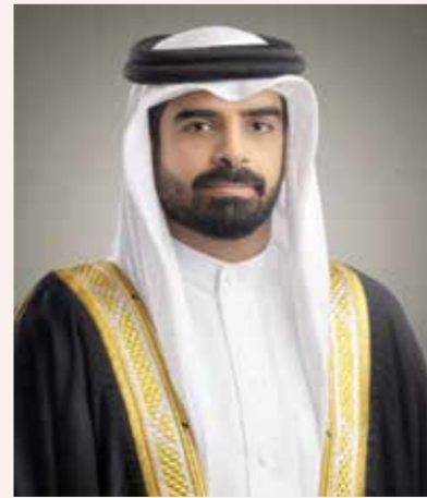
○ سمو الشيخ سلمان بن محمد آل خليفة

سلمان بن محمد آل خليفة، نائب رئيس الهيئة العامة للرياضة رئيس المجلس البحريني للألعاب القتالية، بهذا الإنجاز المشرف الذي حققه الملاكم جايدن برايس. وقال سموه: «إن هذا الإنجاز التاريخي غير المسبوق يعكس الرعاية الملكية