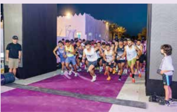
○ لحظة الانطلاق.

وهناك أحمد بن سلمان المسلم رئيس مجلس النواب، الرياضي، بمناسبة فوز فريقه الأول لكرة القدم ببطولة دوري ناصر بن حمد الممتاز لكرة القدم للموسم الرياضي 2026/2025. وأعرب عن خالص التهاني والتبريكات إلى الشيخ أحمد بن علي آل خليفة رئيس مجلس إدارة نادي المحرق الرياضي. وأشاد رئيس مجلس النواب بما تحظى به الرياضة البحرينية من رعاية سامية من حضرة صاحب الجلالة الملك حمد بن عيسى آل خليفة ملك البلاد المعظم حفظه الله ورعاه، ودعم صاحب السمو الملكي الأمير سلمان بن حمد آل خليفة ولي العهد رئيس مجلس الوزراء حفظه الله. وتمن رئيس مجلس النواب، جهود سمو الشيخ ناصر بن حمد آل خليفة ممثل جلالة الملك المعظم لشؤون الشباب والرياضة، رئيس المجلس الأعلى للشباب والرياضة،