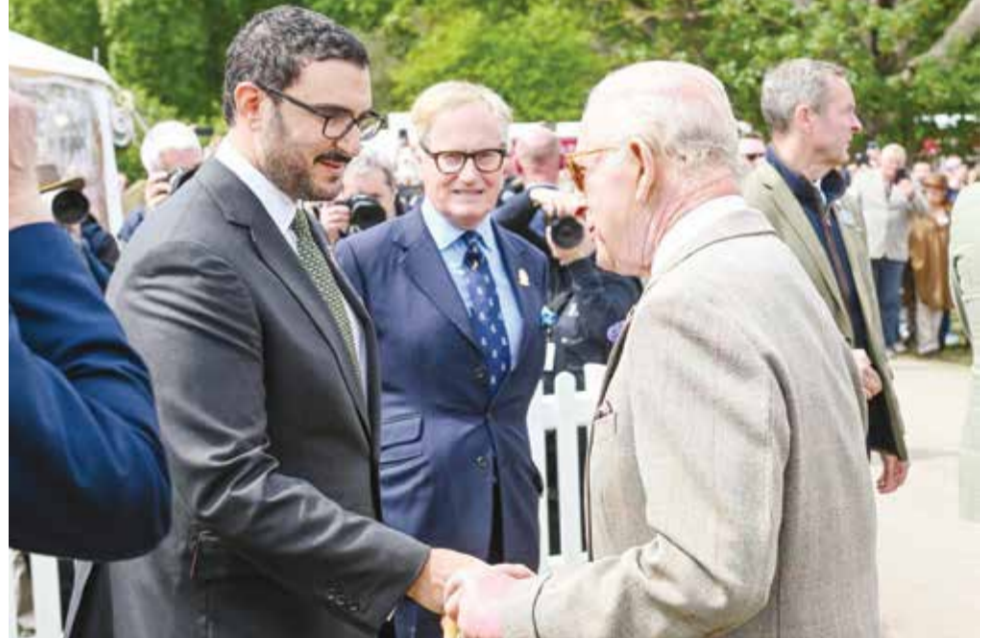
نيابة عن جلالة الملك المعظم سمو الشيخ عيسى بن سلمان لدى حضوره مهرجان ويندسور الملكي للفروسية.