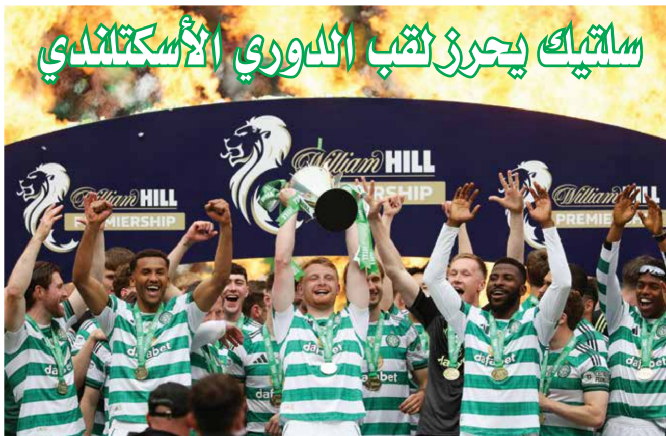
○ تتويج سلتيك،