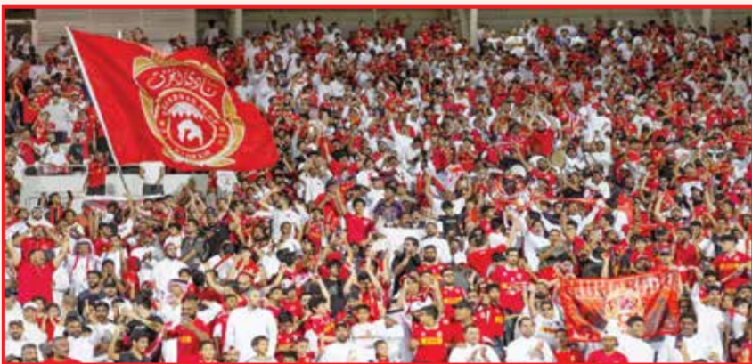
○ جماهير المحرق.