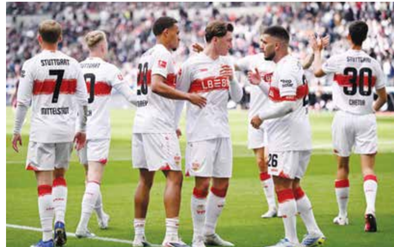
○ لاعبو شتوتغارت يحتفلون بالتأهل

في المرحلة الأخيرة على ضحك لحسم اللقب بمعزل عن نتيجة مطارده الهلال. ودخل النصر إلى المواجهة بعد أيام من حسارة عدم حسم لقب الدوري المحلي، بعدما كان متقدما حتى الدقيقة الثامنة من الوقت بدلا من الضائع أمام الهلال في مواجهة القمة، قبل أن تفلت الكرة من الحارس البرازيلي بينتو وترسو في الرمي معلنة التعادل (1-1)، حارمة «العالمي» من ضمان اللقب.