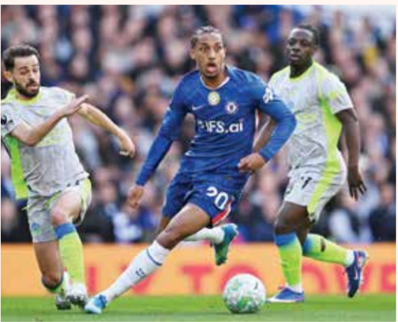
○ لقاء سابق بين سيتي وتشيلسي.

ويطمح عالي إلى تحقيق نتيجة إيجابية للظفر بالمركز الرابع الذي يحتله المالكية، ويتوقع أن تشهد المباراة منافسة قوية حتى الثواني الأخيرة بقيادة المدرب فينسيوس ايتروبيو،