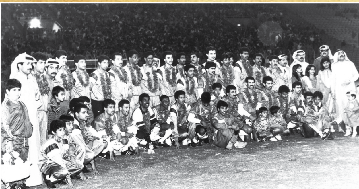
● المحرق بطل الدوري الممتاز لكرة القدم 1988