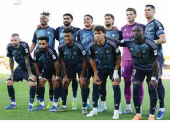
○ فريق النصر.

الرياض - (أ ف ب) - بعد أربعة أيام على خيبة عدم حسم لقب الدوري السعودي بهدف قاتل تلقاه أمام غريمه الهلال، يجد النصر بقيادة نجمه المخضرم البرتغالي كريستيانو رونالدو نفسه أمام نهائين للقبين قاري ومحلي، أولهما أمام غامبيا أوساكا الياباني اليوم السبت في دوري أبطال آسيا 2 على ملعب «الأول بارك» في الرياض. وستكون هذه المواجهة الأولى بين النصر وغامبيا أوساكا في دوري أبطال آسيا، ويتطلع الفريق السعودي إلى العودة إلى منصات التتويج بعدما سبق له الفوز بلقب كأس أبطال الكؤوس الآسيوية عام 1998، وفي العام ذاته توج بلقب كأس السوبر الآسيوية. وستكون الأضواء مسلطة على رونالدو الذي بدت عليه علامات الخيبة بعد التعادل القاتل مع الهلال وهو على دكة البدلاء. ووصل الفريق الياباني إلى الرياض الأربعاء وتدريب فور وصوله داخل مقر نادي النصر.