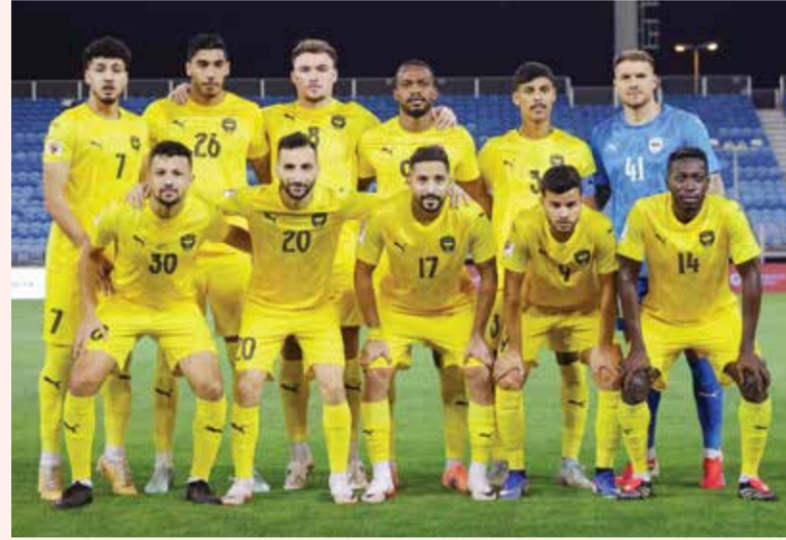
○ فريق الخالدية.