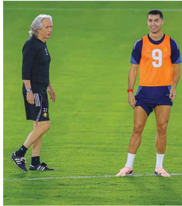
○ رونالدو وجيوز

ووصل الفريق الياباني إلى الرياض الأربعاء وتدريب فور وصوله داخل مقر نادي النصر. وأشار النادي عبر موقعه الإلكتروني إلى درجة الحرارة «الحارقة (...) وكأنها تضرب البشرة»، مشيراً إلى أن التمرين ساعد اللاعبين «على التأقلم مع البيئة المحلية».