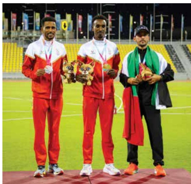
○ تتويج لاعبي ألعاب القوى