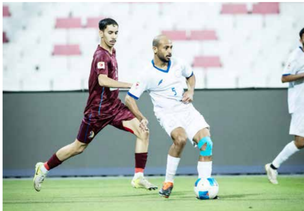
○ من لقاء الحد والشباب.