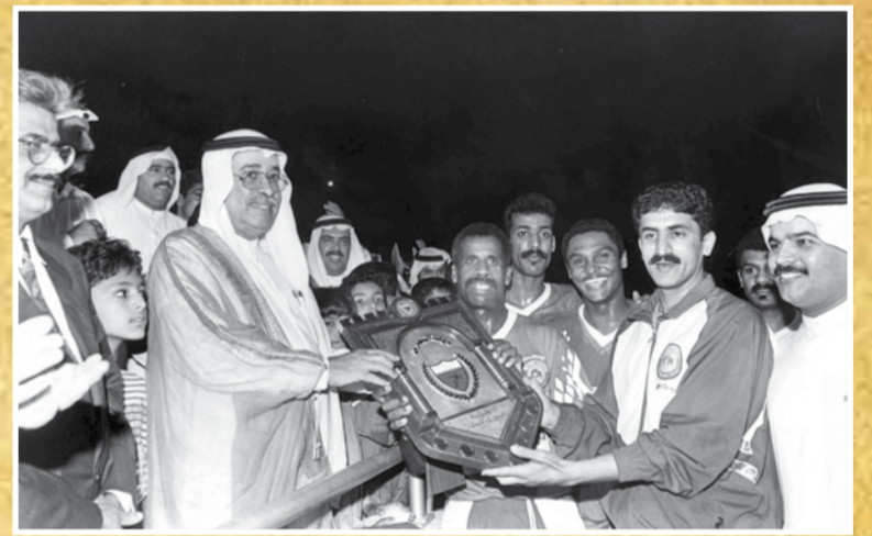
● عيسى بن راشد يتوج المحرق بطلا للدوري في موسم 1994-1995