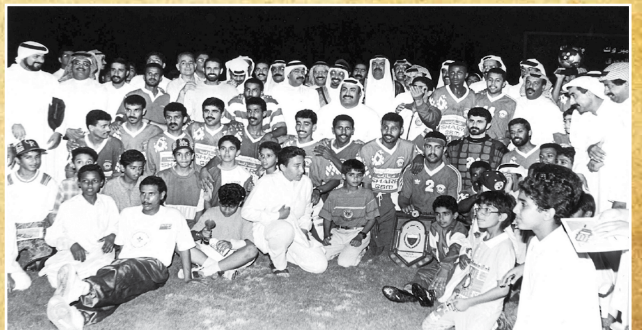
● فريق المحرق بطل الدوري الممتاز لموسم 1994-1995