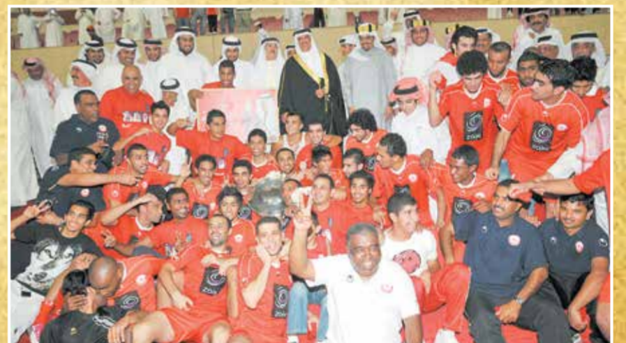
● المحرق يحتفل بدرع الدوري الممتاز لموسم 2003-2004