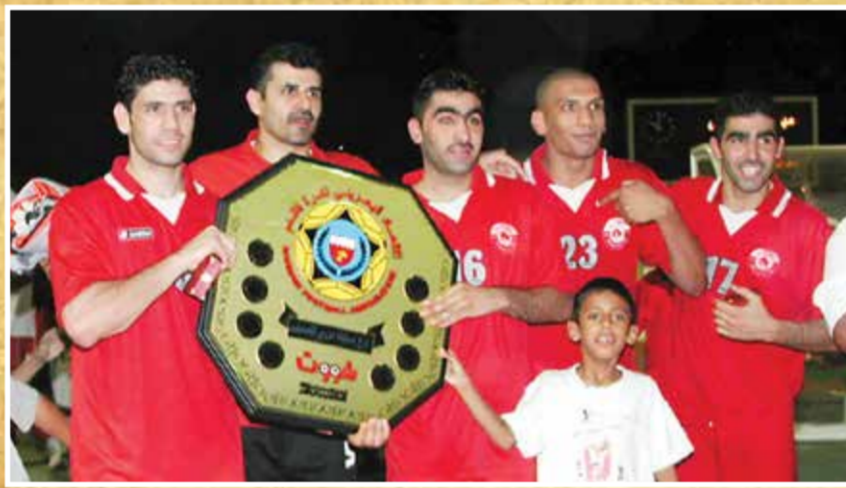
● المحرق يحرز بطولة دوري التصنيف لكرة القدم 2002