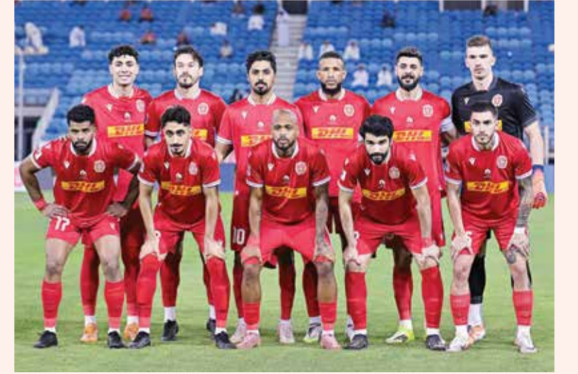
○ فريق المحرق.