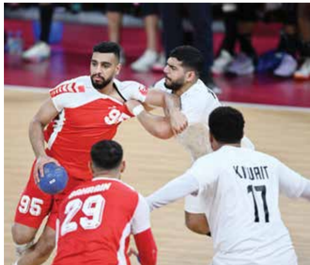
○ من مباراة منتخب اليد مع الكويت

رماة البحرين ينجحون في خطف الذهب.. و«مايكل» يدخل التاريخ بتحطيم رقمين قياسيين