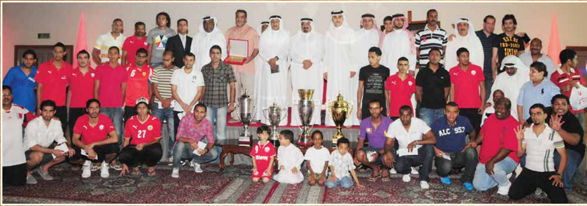
● إنجاز رباعي لنادي المحرق في موسم 2009

نستعرض في هذه الصفحة صورة متنوعة من أرشيف «أخبار الخليج» الضخم، تحمل في طياتها الكثير من الذكريات لشخصيات وفعاليات رياضية تاريخية تركت بصمتها وتأثيرها في رياضتنا المحلية، ومثلت منتخبنا في المحافل الدولية خير تمثيل.