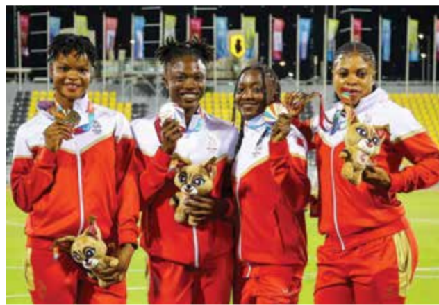
○ فريق التتابع