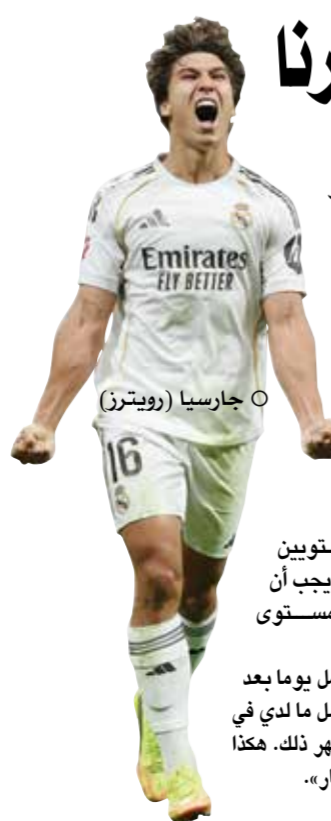
○ جارسيا (رويتزن)

هنا، أمام جماهيرنا، سعيد جدا بالهدف، ولكني أكثر سعادة بفوز الفريق». أوضح لاعب بالهدف الذي أحرزه خلال المباراة، التي انتهت بفوز الفريق الأبيض 2 / 0 صفر على ملعب (سانتياجو برنابيو)، ضمن منافسات المرحلة الـ36 لبطولة الدوري الإسباني لكرة القدم، وبقي الريال، الذي فشل رسميا في التتويج باللقب هذا الموسم بخسارته صفر / 2 أمام ضيفه وغريمه التقليدي برشلونة في المرحلة الماضية، بالمركز الثاني بترتيب المسابقة، برصيد 80 نقطة، في حين ظل أوفينيدو، الذي ودع المسابقة رسميا، في قاع الترتيب برصيد 29 نقطة.