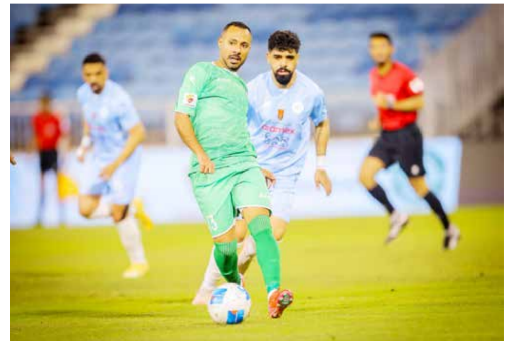
○ من لقاء الرفاع والبحرين.