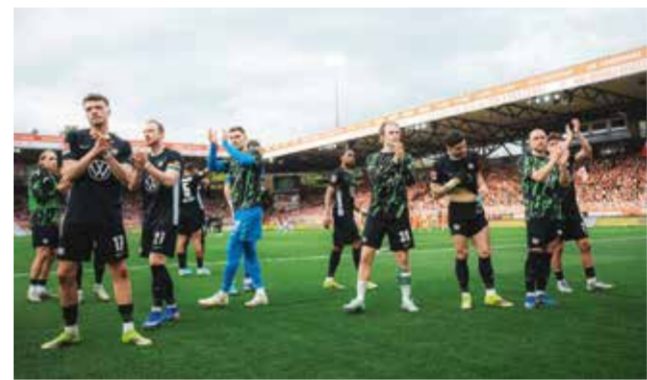
○ لاعبو فولفسبورغ

فولفسبورغ قد ينهي الموسم في المركز السادس عشر حتى في حال التعادل، لكن ذلك مشروط بعدم فوز هايدنهايم. وفي أعلى الترتيب، لا يزال مقعد واحد في دوري أبطال أوروبا متاحا بعدما ضمن كل من بايرن ميونخ البطل وبوروسيا دورتموند ولايبزيغ التأهل. ويتساوى شتوتغارت صاحب المركز الرابع مع هوفنهايم الخامس في عدد النقاط، لكنه