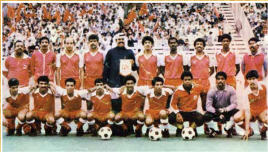
● خليفة بن سلمان يتوسط فريق المحرق بطل الدوري الممتاز لموسم 1982-1983