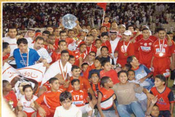
● المحرق يتوج بدرع الدوري الممتاز لموسم 2003-2004