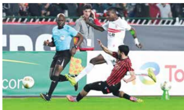
○ مباراة الذهاب بين الزمالك واتحاد الجزائر.