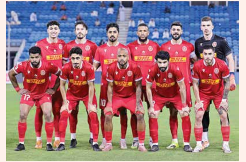
○ فريق المحرق.