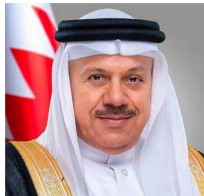
○ وزير الخارجية.

والقانون الدولي الإنساني وميثاق الأمم المتحدة ومبادئ حسن الجوار وقرارات الشرعية الدولية، وتهديدا لحقوق الإنسان في الأمن والحياة والتعايش السلمي والغذاء والتنمية المستدامة، وتعديا على الرسالة الإنسانية النبيلة التي يحملها اليوم الدولي للعيش معا في سلام، ودعوته إلى الحوار والنقطة والتفاهم من أجل خير البشرية. وعبر الوزير عن بالغ تقديره للرؤية الملكية السامية في تأكيد ما تحظى به مملكة البحرين من لحمه وطينة صادقة تحتضن مختلف الأديان والمعتقدات، وأنها أمانة في أعناق أبنائها جميعا، وأنها كانت وستظل دولة تراعي حق الجوار، ولم تبادر يوما إلى استعداء أحد، مستندة في ذلك إلى ثوابت راسخة وقيم أصيلة قائمة على نهج التعاون وحسن الجوار، وتغليب الحكمة والاعتدال، ومواقفها المنزلة في محيطها الإقليمي والدولي. كما ثمن المضمين الوطنية للقاء الفريق أول الشيخ راشد بن عبدالله آل خليفة وزير الداخلية، مع أبناء الوطن، في ترسيخ قيم المواطنة الصالحة والانتماء الصادق والولاء للقيادة الحكيمة، مشيدا