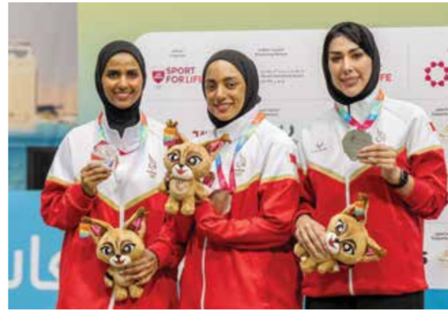
○ من تتويج منتخب الرماية