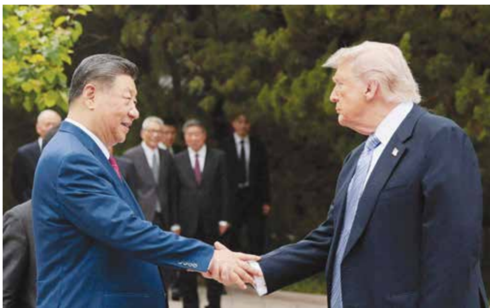
○ الرئيس الأمريكي والرئيس الصيني خلال لقائهما في بكين.

جدا». لكن شفي لم يعلق على هذا الشأن. وأضاف ترامب خلال رحلة العودة إلى الوطن أنه لم «يطلب أي خدمات» فيما يتعلق بإيران. ومع ذلك، حث وزير الخزانة الأمريكي سكوت بيسنت بكين على استخدام نفوذها لدى طهران للتوصل إلى اتفاق. لكن محللين شككوا في استعداد شي للضغط بشدة على طهران أو إنهاء الدعم لجيشها، نظراً إلى أهمية إيران بالنسبة إلى بكين باعتبارها ثقلًا استراتيجياً موازناً أمام الولايات المتحدة. وقالت باتريشيا كيم الزميلة المعنية بشؤون السياسة الخارجية في معهد بروكنغز: «اللافت للانتباه هو عدم تقديم التزام صيني بفعل أي شيء محدد فيما يتعلق بإيران». وقال الرئيس الأمريكي دونالد ترامب إن صبره تجاه إيران بدأ ينفذ، وإنه اتفق مع الرئيس الصيني شي جين بينغ خلال محادثتهما على أنه لا يمكن السماح لطهران بامتلاك سلاح نووي وأن عليها إعادة فتح مضيق هرمز.