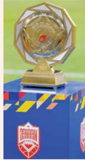
○ درع الدوري.