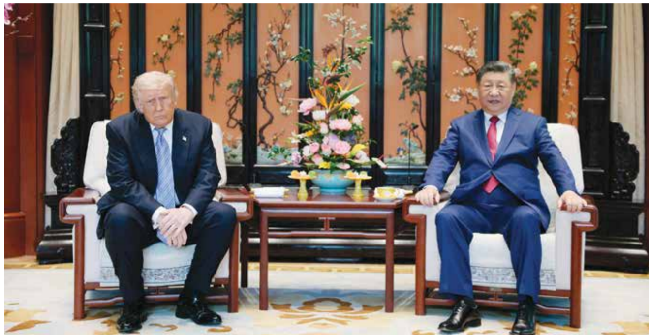
○ شي وترامب على هامش الجولة في حدائق تشونغنانهاي. (أ ف ب).

كان ينبغي أن يحدث أبدا، لا يوجد سبب لاستمراره... وقال ترامب رد على سؤال حول ما إذا كان قد طلب مساعدة «أنا لا أطلب أي خدمات... قد قضينا على قواتهم المسلحة (الإيرانية) بشكل شبه كامل. قد نضطر إلى القيام ببعض أعمال التنظيف».