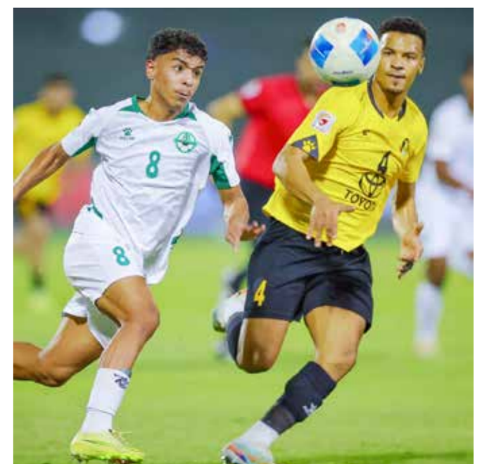
○ من لقاء الأهلي والبديع.