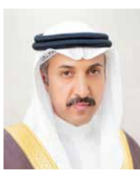
○ وزير المواصلات.

أكد الدكتور الشيخ عبدالله بن أحمد آل خليفة وزير المواصلات والاتصالات رئيس مجلس أمناء مركز الملك حمد العالمي للتعايش والتسامح أن مملكة البحرين بقيادة حضرة صاحب الجلالة الملك حمد بن عيسى آل خليفة ملك البلاد المعظم، وتوجهات صاحب السمو الملكي الأمير سلمان بن حمد آل خليفة ولي العهد رئيس مجلس الوزراء، تواصل جهودها الرائدة في رعاية التعايش السلمي وتعزيز الوئام الإنساني، مشدداً على أن صون السيادة الوطنية هي الركيزة الأساسية للسلام المستدام. وأعرب الدكتور الشيخ عبدالله بن أحمد آل خليفة،