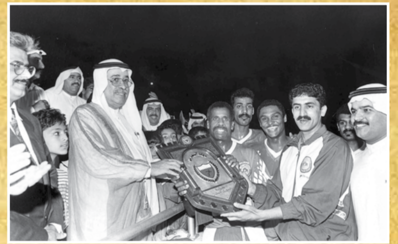
● عيسى بن راشد يتوج المحرق بطلا للدوري في موسم 1994-1995