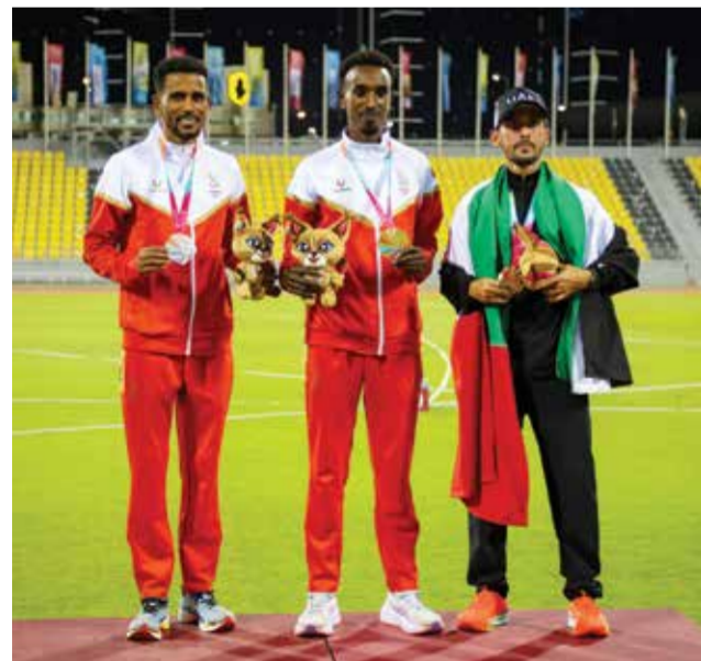
○ تتويج لاعبي ألعاب القوى