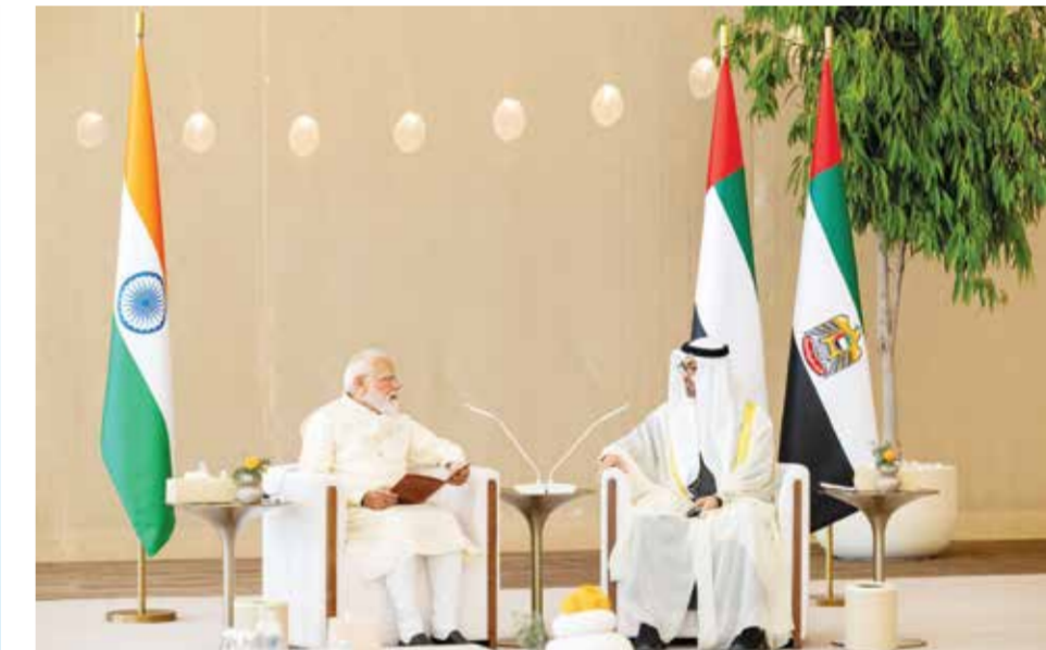
○ محادثات بين الشيخ محمد بن زايد آل نهيان ومودي في أبوظبي. (رويترز).

وقال مسؤول من الولايات المتحدة تشير إلى أن واشنطن مستعدة لمواصلة المحادثات والتواصل.