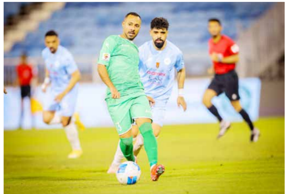
○ من لقاء الرفاع والبحرين.