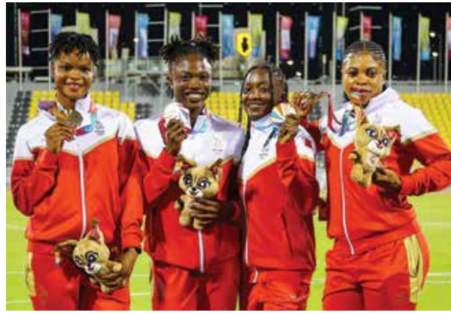
○ فريق التتابع