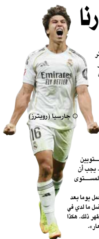
○ جارسيا (رويتز)

هنا، أمام جماهيرنا، سعيد جدا بالهدف، ولكني أكثر مسعادة بفوز الفريق». أوضح لاعب بالهدف الذي أحرزه خلال المباراة، التي انتهت بفوز الفريق الأبيض 2 / صفر على ملعب (سانتياجو برنابيو)، ضمن منافسات المرحلة الـ36 لبطولة الدوري الإسباني لكرة القدم، وبقي الريال، الذي فشل رسميا في التتويج باللقب هذا الموسم بخسارته صفر / 2 أمام ضيفه وغريمه التقليدي برشلونة في المرحلة الماضية، بالمركز الثاني بترتيب المسابقة، برصيد 80 نقطة، في حين ظل أوفينيدو، الذي ودع المسابقة رسميا، في قاع الترتيب برصيد 29 نقطة.