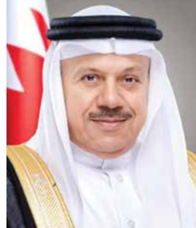
○ وزير الخارجية.

بهذه المناسبة يتزامن مع «عام عيسى الكبير»، وتسجيل البحرين في موسوعة غينيس للأرقام القياسية كأكثر دول العالم كثافة لدور العبادة قياساً إلى مساحتها، ما يعكس الإرث