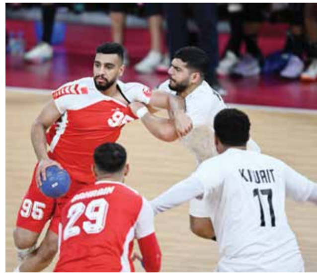
○ من مباراة منتخب اليد مع الكويت

رماة البحرين ينجحون في خطف الذهب.. و«مايكل» يدخل التاريخ بتحطيم رقمين قياسيين