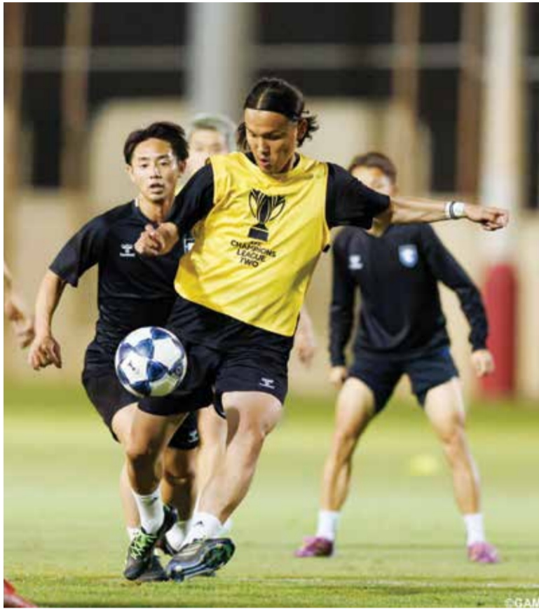
○ تحضيرات غامبا أوساكا

ولم تحصل القائمة التي أعلن عنها مدرب المنتخب الياباني هاجيمي مورياسو لمونديال أوساكا الغائبي عن العرس العالمي. وقال المهاجم غاكو ناواتا عبر موقع النادي «أنا متحمس جدا وأتطلع بشغف إلى النهائي».