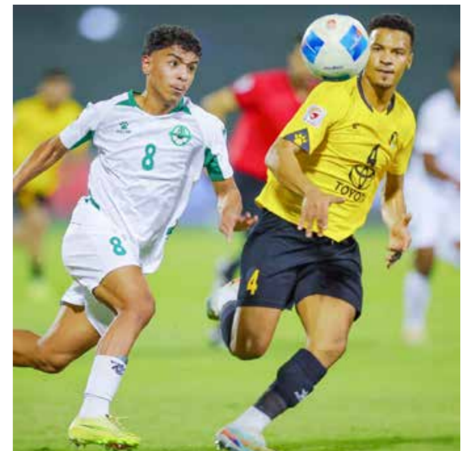
○ من لقاء الأهلي والبديع.

حقق فريق الرفاع فوزاً معنوياً على البحرين بنتيجة ثلاثة أهداف مقابل هدفين، في اللقاء الذي جمعهما على استاد مدينة خليفة الرياضية، ضمن الجولة الثانية والعشرين الأخيرة من دوري ناصر بن حمد الممتاز لكرة القدم للموسم الكروي 2025-2026. وتقدم البحرين بهدفين عبر سلطان السلطنة عند الدقيقة 32، وفهد بوشرار في الدقيقة 44، قبل أن يعود الرفاع في النتيجة بثلاثية حملت توقيع رودريغو يوري عند الدقيقة 53 من ركلة