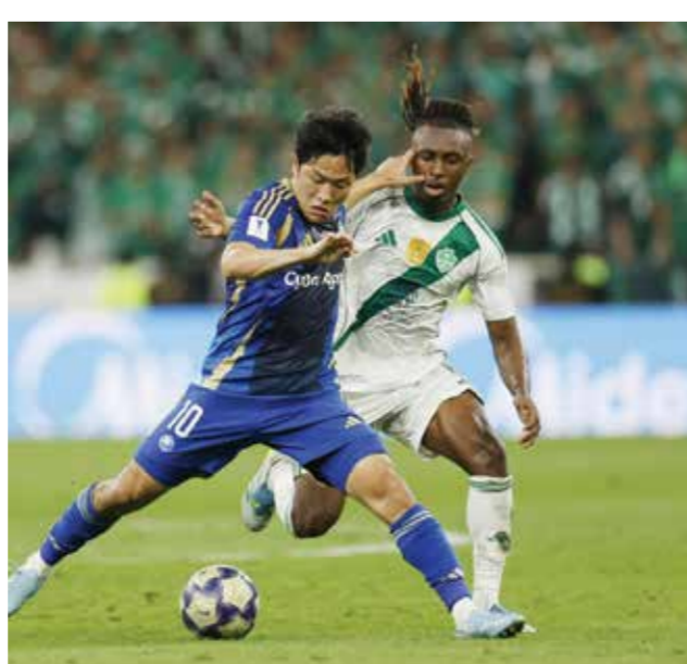
○ جانب من المباراة. (أ ف ب)

جدة - (أ ف ب): وعد غو كورودا مدرب مانشستر يونايتد بفرقة سيستفيد من خيبة الأمل التي رافقت الخسارة في نهائي دوري أبطال آسيا للدرجة.