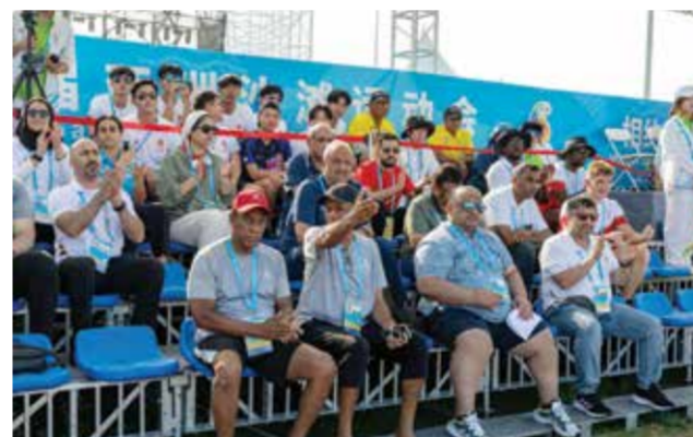
○ متابعة رسمية من اللجنة الأولمبية لمنتخب اليد