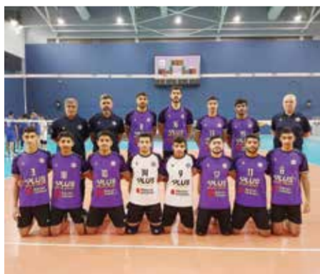
○ شباب داركليب