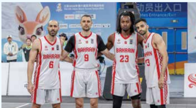
○ منتخب السلة 3x3

يخوض منتخبنا الوطني لكرة السلة 3x3، اليوم الإثنين، مواجهة حاسمة أمام منتخب كازاخستان عند الساعة 1:30 ظهرًا بتوقيت الصين (8:30 صباحًا بتوقيت البحرين)، ضمن ختام منافسات المجموعة الثالثة. ويسعى منتخبنا لتحقيق الفوز بعد خسارته أمام قطر والهند، حيث يدرك أهمية اللقاء في تحديد فرص التأهل إلى مرحلة الملحق، والتي تمثل بوابة العبور إلى الأدوار المتقدمة. وكان المنتخب قد خاض حصة تدريبية مكثفة يوم أمس، ركز خلالها على تصحيح الأخطاء ورفع الجاهزية، في محاولة للظهور بصورة أفضل وتحقيق نتيجة إيجابية.