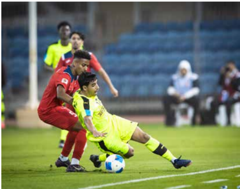
○ من لقاء سابق بين عالي وسترة.

وشملت الزيارة عدداً من المنشآت الرياضية حيث تم الوقوف على مواقع الحواجز الحالية ودراسة آلية إزالتها وفق معايير فنية وتنظيمية دقيقة،