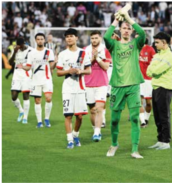
○ لاعبو سان جرمان يحيون الجماهير