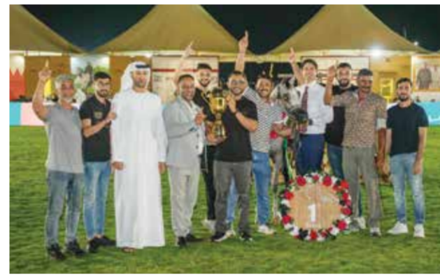
○ جانب من التتويج.