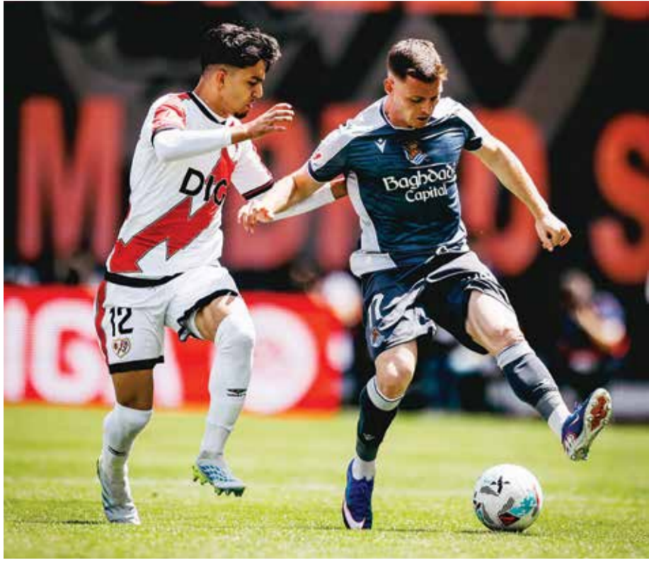
○ من لقاء سوسبيداد وفايكانو.