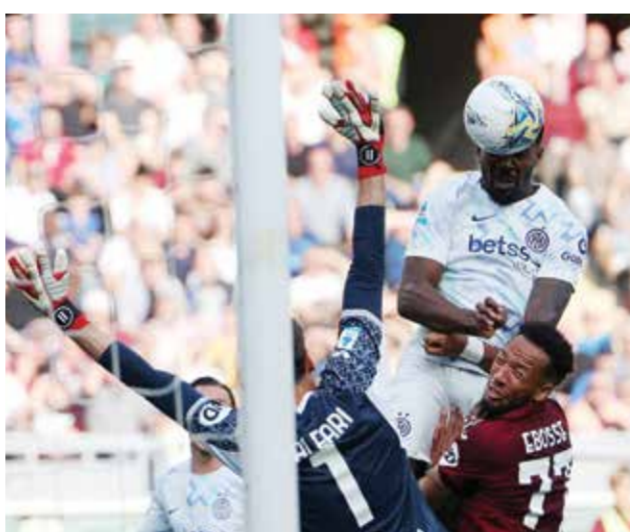
○ تورام يحرز هدف إنتر الأول.

كريستيان كييفو يملكون فرصة حسم اللقب على أرضهم عندما يستضيفون بارما يوم الأحد المقبل، فيما تنتظر رجال مدرب الفريق الجنوبي أنتونيو كونتي رحلة محفوفة بالمخاطر إلى كومو الخامس يوم السبت.