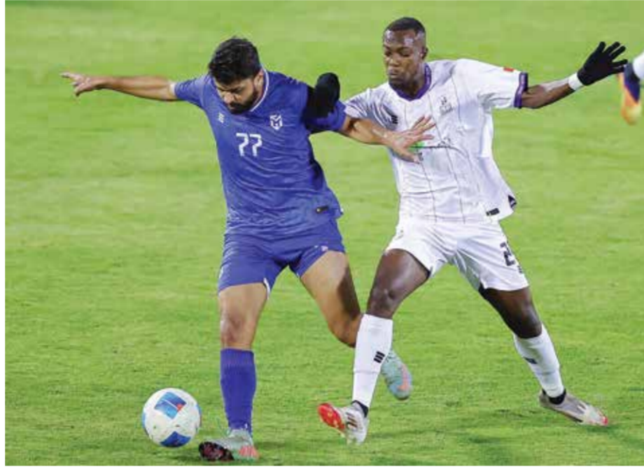
○ من لقاء الاتحاد والمنامة.