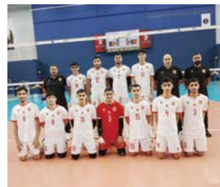
○ شباب المحرق