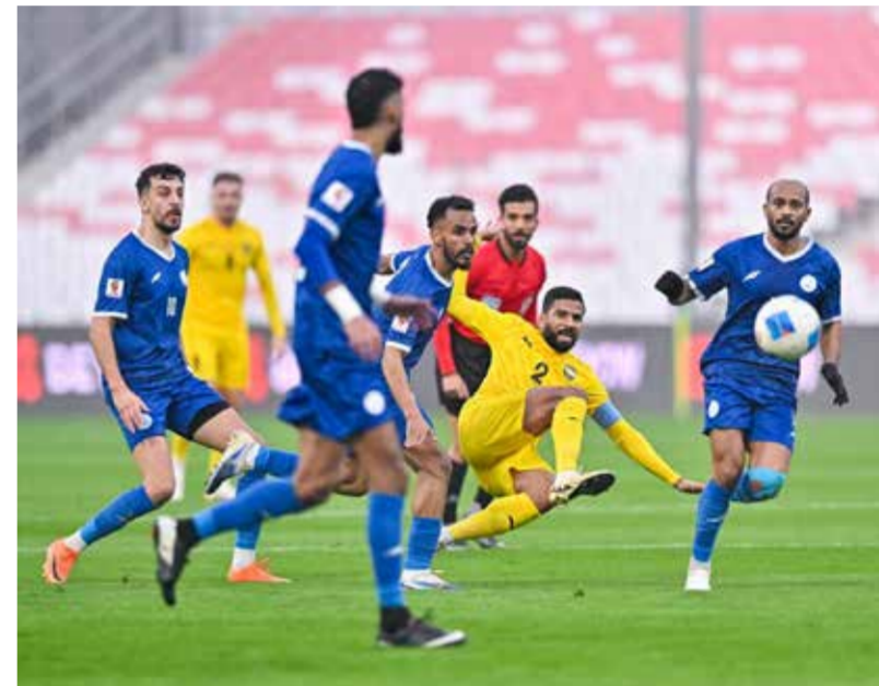
○ من لقاء سابق بين الخالدية والحد.