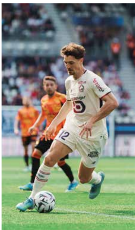
○ من لقاء ليل وباريس

باريس – (أ ف ب): اقترب ليل أكثر من حجز بطاقته إلى مسابقة دوري أبطال أوروبا الموسم المقبل بفوزه الثمين خارج قواعده على باريس أف سي 1-0 في المرحلة الحادية والثلاثين من الدوري الفرنسي لكرة القدم.