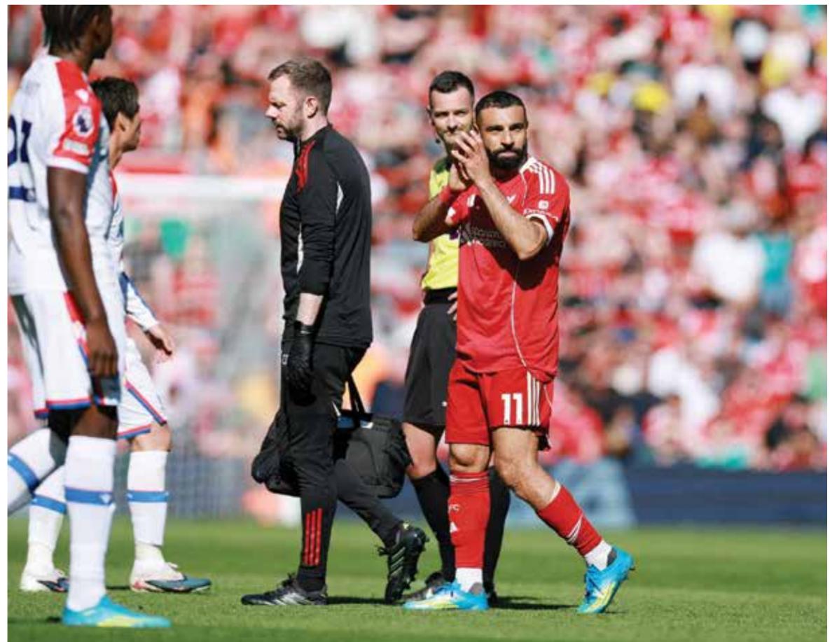
○ محمد صلاح.

ورغم قلة أهدافه هذا الموسم التي توقفت عند 7 أهداف، والتقارير التي أشارت إلى وجود خلافات مع سلوت بسبب استبعاده من التشكيل الأساسي في عدة مناسبات، أبدى المدرب الهولندي أمله في أن تساهم احترافية صلاح العالية واهتمامه بلياقته البدنية في تقليص مدة غيابه، بانتظار التشخيص النهائي الذي سيحدد فرصه في اللحاق بمباريات الموسم الأخيرة أو معسكرات المنتخب المصري القادمة.