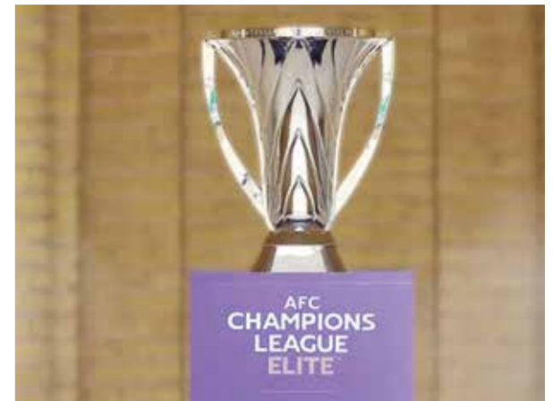
○ كأس أبطال آسيا للدرجة.