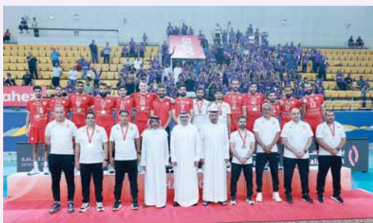
○ تتويج المحرق بالمركز الثاني