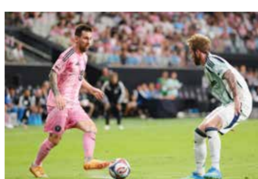
○ جانب من المباراة

ليضعها بسهولة في الشباك. وشهد اللقاء عدة محاولات من ليونيل ميسي، لكنه سددها ضعيفة بجوار القائم، كما حاول التسجيل مباشرة من ركلة ركنية وتصدى له تيرنر ببراعة، لينتهي الشوط الأول بالتعادل السلبي قبل إثارة الشوط الثاني.