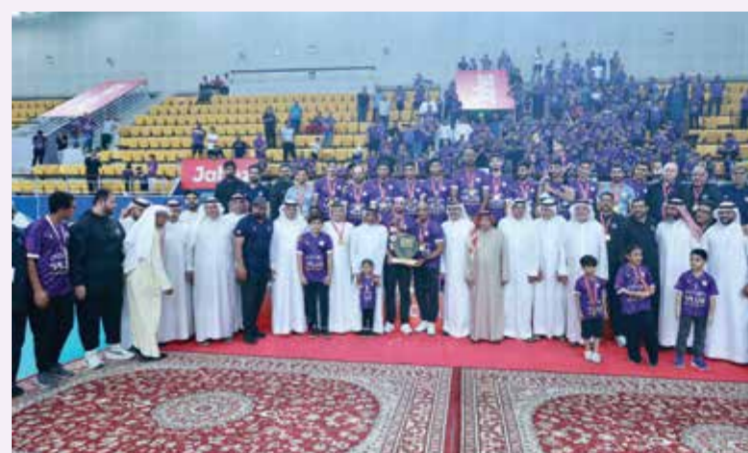
○ تتويج داركليب بالمركز الأول