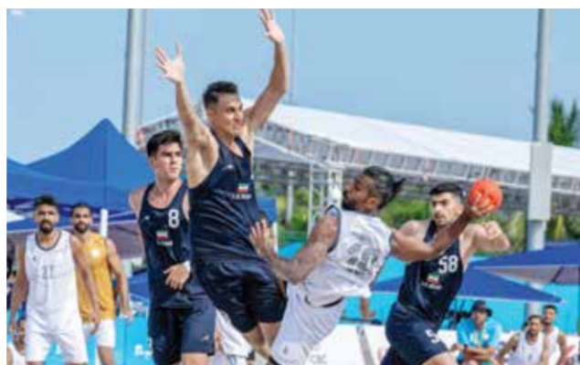
○ من لقاء منتخب اليد مع إيران