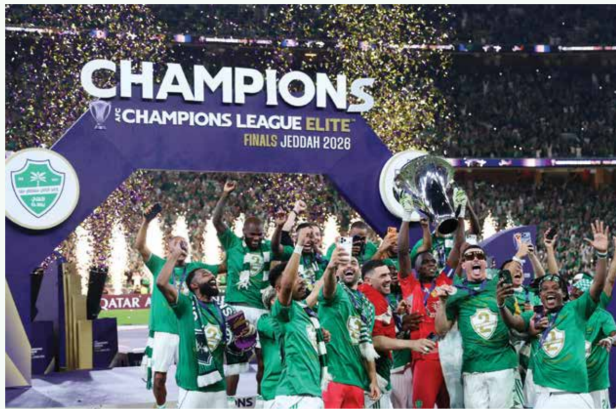
○ تتويج الأهلي (أ ف ب)

باريس - (د ب أ): بدأ لويس إنريكي مدرب باريس سان جرمان متفائلاً قبل مواجهة بايرن ميونخ في ذهاب قبل نهائي دوري أبطال أوروبا، وذلك بعد الفوز 3 / صفر على أنجيه، السبت، ضمن منافسات الدوري الفرنسي. ابتعد الفريق الباريسي في الصدارة موسمًا الفارق إلى ست نقاط، ومستفيدًا من تعثر منافسه لانس بالتعادل 3 / 3 مع بريست، مساء الجمعة. وأضاف المدرب الإسباني: «نحن في أفضل حالاتنا، ونقدم أداءً مميّزًا بروح عالية، ونعيش لحظة مثالية، ونتربح باستمتاع الأمتار الأخيرة لمشوارنا في الدوري ودوري أبطال أوروبا». وشدد «الوقت غير مناسب لمنح أي معلومات عن فريقنا لبايرن ميونخ، ولكن كل اللاعبين جاهزون». وختم لويس إنريكي: «نريد تقديم أداء قوي أمام أحد أفضل أندية أوروبا، ولكننا أبطال هذه المسابقة، ونريد أن نبدأ مواجهة بايرن ميونخ بكل قوة».