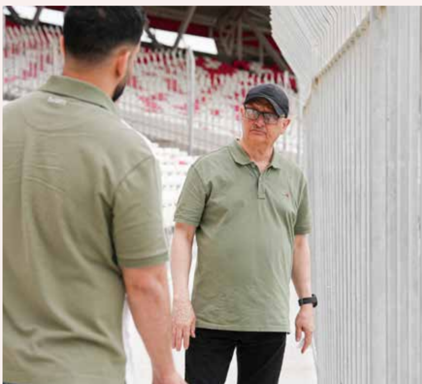
○ جانب من الزيارة

حيث من المقرر أن تشمل الأعمال التطويرية 7 منشآت في مختلف مناطق المملكة، بما يضمن تحقيق أعلى مستويات السلامة للجماهير، وتعزيز جاهزية الملاعب من الناحيتين الأمنية والتنظيمية، بما يتماشى مع أفضل الممارسات المعتمدة في إدارة المنشآت الرياضية.