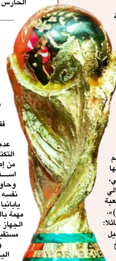
○ كأس العالم

وأضاف «نحن فريق صاعد حديثًا إلى الدوري الياباني الممتاز، لذا فإن الوصول إلى هذه المرحلة والمشاركة في هذه المباراة يُعد شرفًا كبيرًا».