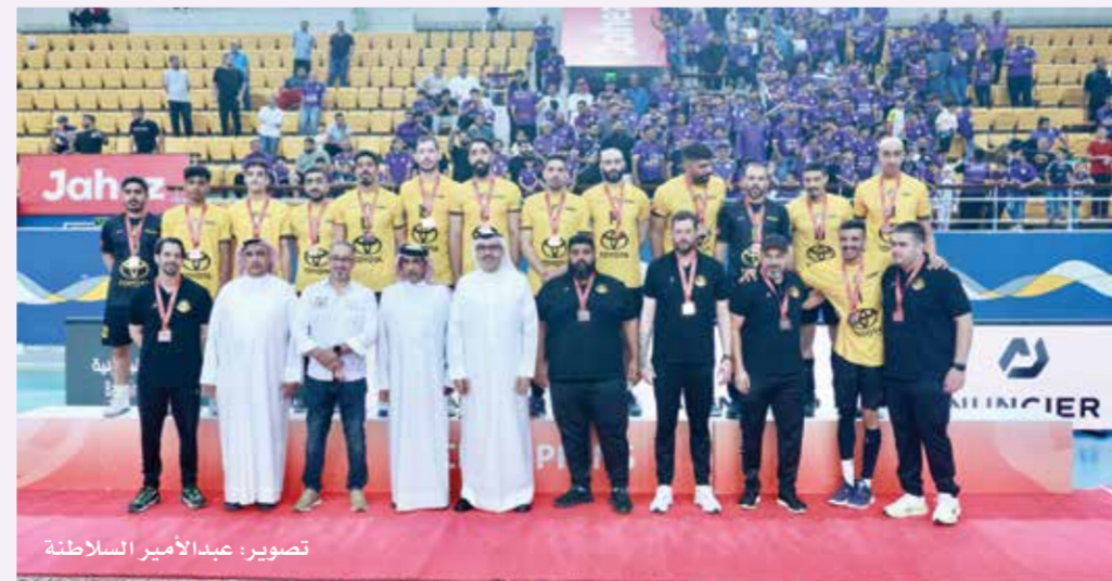
○ تتويج الأهلي بالمركز الثالث

وكان داركليب قد تفوق على فريق الدير أوس ضمن منافسات ختام الجولة 26 بثلاثة أشواط مقابل لا شيء 14-25، 13-25، 20-25، في المواجهة التي احتضنتها صالة عيسى بن راشد في الرفاع، وأدارها تحكيمياً أحمد محمد حكما أول والدولي أحمد القيم حكماً ثانياً، وقد أنهى داركليب الموسم بسجل مثالي، بعدما جمع 76 نقطة من 26 مباراة من دون أن يتعرض لأي خسارة، مؤكداً أفضليته المطلقة واستحقاقه للقب، وجاءت مواجهة التتويج لتجسد قوة الفريق وانسجامه، ليحسم اللقاء ويحتفل لاعبوه