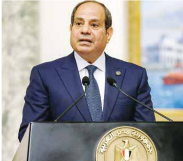
عبد الفتاح السيسي.

وأشار السيسي إلى إدانة مصر بكل وضوح وحزم، الاعتداءات التي تعرضت لها بعض الدول العربية مؤخراً، مؤكدا رفض بلاده القاطع، لأي مساس بسيادة تلك الدول، أو انتهاك سلامة أراضيها، معلنة