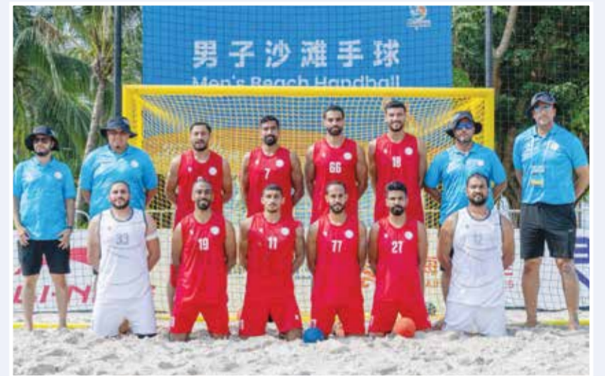
○ منتخب اليد الشاطئية.