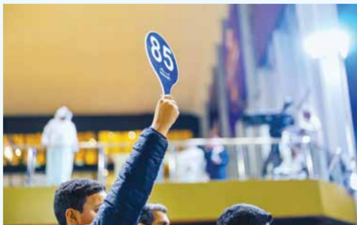
○ جانب من مزاد سابق.