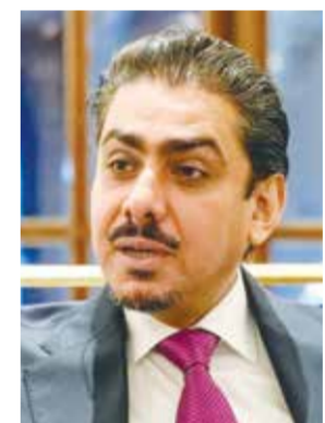
◉ علي أمر الله.