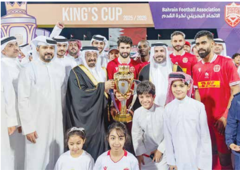
○ فرحة المحرق باللقب.

دعم كبير من قبل صاحب السمو الملكي الأمير سلمان بن حمد آل خليفة ولي العهد رئيس الوزراء حفظه الله، منوهاً بالدعم الكبير من قبل الحكومة الموقرة برئاسة سموه، عبر البرامج المتنوعة الهادفة للارتقاء بقطاعي الشباب والرياضة.