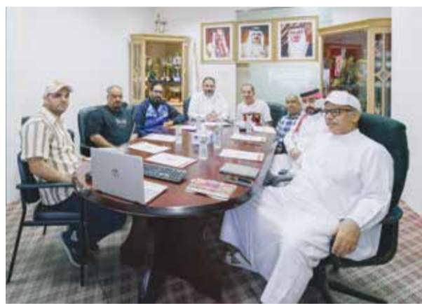
○ جانب من الاجتماع

الأهلي يدخل اللقاء بدافع رد الاعتبار بعد خسارته مواجهة الدور الأول، بينما يسعى المحرق لتأكيد تفوقه وإثبات أن انتصاره السابق لم يكن وليد ظروف عابرة. هذه الدوافع المتبادلة من الطرفين من شأنها أن ترفع من نسق المباراة وتمنحها طابعاً تنافسياً عالياً، خاصة في ظل رغبة كلا الفريقين في إنهاء الموسم بصورة إيجابية.