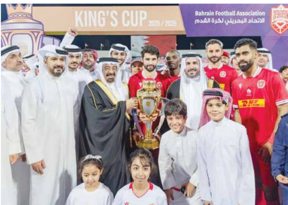
○ فرحة المحرق باللقب.

دعم كبير من قبل صاحب السمو الملكي الأمير سلمان بن حمد آل خليفة ولي العهد رئيس الوزراء حفظه الله، منوهاً بالدعم الكبير من قبل الحكومة الموقرة برئاسة سموه، عبر البرامج المتنوعة الهادفة للارتقاء بقطاعي الشباب والرياضة.