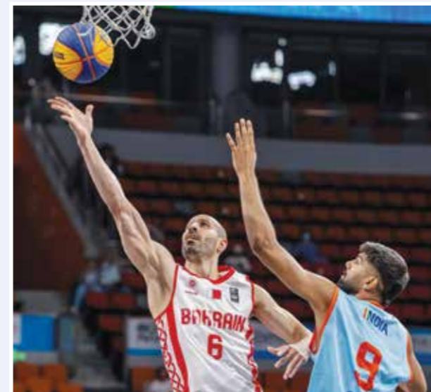
○ من لقاء منتخبنا أمام الهند.