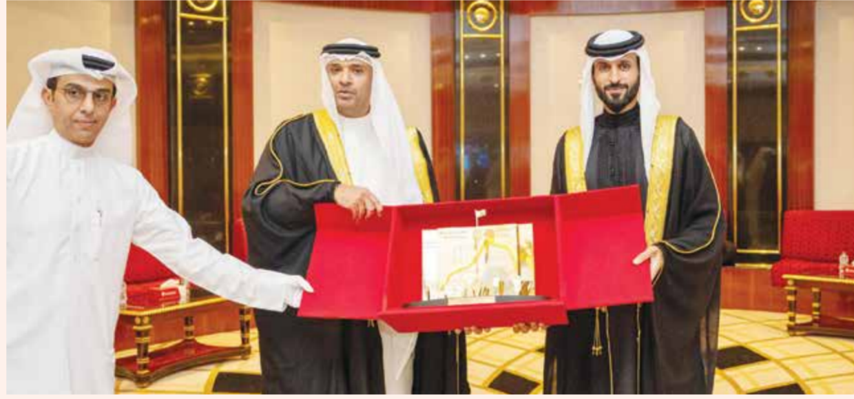
○ ناصر بن حمد يتسلم هدية تذكارية من رئيس اتحاد الكرة.

وأشار في ختام التصريح إلى أن الاتحاد البحريني لكرة القدم يولي المسابقة اهتماماً كبيراً وبالغاً؛ نظراً لمكانتها العالية في قلوب البحرينيين، مؤكداً أن الاتحاد سخر للبطولة جهوداً كافة لإنجاحها على جميع المستويات، وهو ما تجسد أيضاً في تميز الحضور الجماهيري والتغطية الإعلامية، في انعكاس للاعتزاز الكبير للاتحاد لتنظيم هذه المسابقة الغالية على الجميع.