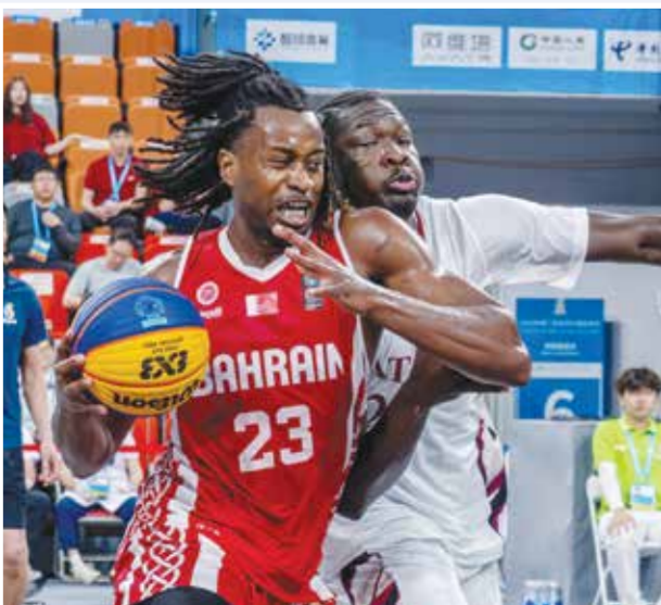
○ من لقاء منتخبنا أمام قطر.

على صعيد كرة السلة 3*3، تلقى منتخبنا الوطني خسارتين في مسهل مشواره، حيث خسر أمام منتخب قطر بنتيجة (21-11)، قبل أن يتلقى خسارة ثانية أمام المنتخب الهندي بنتيجة (20-12)، ضمن منافسات المجموعة الثالثة. ولم يظهر منتخبنا بالمستوى المطلوب في المباراتين، خاصة في ظل