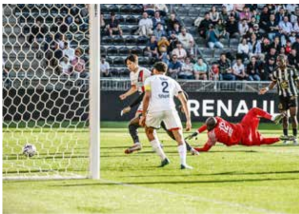
○ من لقاء سان جرمان وأنجيه.

عربية توليسو (71) ومن بعده يقص السويسري براين أوكوه الفارق (88).