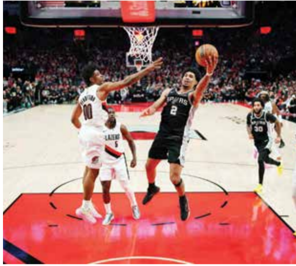
○ من مباراة سبيرز وبلابيرز.