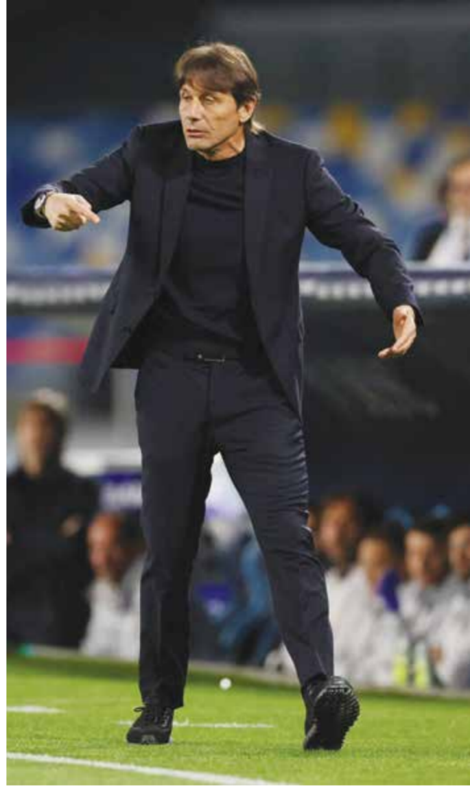
○ كونتي (روبيرتز)

روما - (د ب أ): يشعر أنطونيو كونتي، مدرب نابولي، بالارتياح بعد فوز فريقه الساحق 4 / صفر على كريمونيزي، عقب تعافيه من الهزيمة القاسية أمام لاتسيو في نهاية الأسبوع الماضي. وفي تصريحات مع شبكة «دازن» بعد المباراة، نقلها موقع «توتو ميركاتو ويب»، بدأ كونتي سعيدا بفضل أداء فريقه. وقال المدرب: «لم يكن لدي أي شك في ردة فعل الفريق، لم نوفق في التسجيل أمام لاتسيو، ولم يسر أي شيء على ما يرام. اليوم، كان هناك تصميم كبير ورغبة عارمة في الثأر». ويزعم كونتي أنه عقب مباراة لاتسيو، وجه انتقادات لاذعة لفريقه الذي فاز بالدوري وكأس السوبر، ولا يزال يحتل المركز الثاني. وأضاف: «على الرغم من أننا ما زلنا نفتقد أربعة لاعبين أساسيين مثل دي لورينزو، ونيريس، ولوكاتو، وفيرجارا». واعترف بأن الموسم كان صعبا، لكنه قال: «أخبرت اللاعبين أننا بحاجة إلى إنهاء الموسم بأقوى ما يمكن. والعمل على تحسين التواصل بيننا».