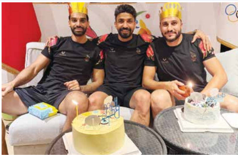
○ جانب من الاحتفال.