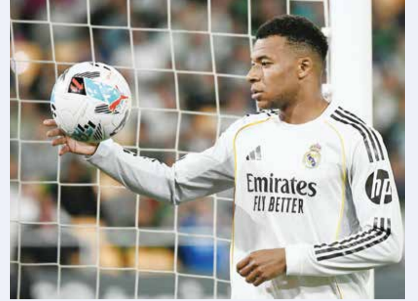
○ ميايبي (أ ف ب)

مريد - (أ ف ب): تعرّض مهاجم ريال مدريد كيليان ميايبي لـ«إجهاد عضلي» في العضلة الخلفية للفخذ الأيسر خلال تعادل فريقه 1-1 مع ريال بيتيس في الدوري الإسباني لكرة القدم، وفق ما أفاد مصدر في النادي لوكالة فرانس برس. وطلب ميايبي الاستبدال في الدقائق العشر الأخيرة من المباراة. ولا يبدو أن مشكلة قائد المنتخب الفرنسي خطيرة، بانتظار فحوص إضافية، ما يخفف أي مخاوف محتملة قبل كأس العالم هذا الصيف. وقال المدرب ألفارو أربيلوا عندما سئل من الصحفيين عن حالة هدافه بعد المباراة «لا أعرف شيئا (عن حالة ميايبي)، شعر ببعض الانزعاج وسنرى كيف ستتطور الأمور في الأيام المقبلة».