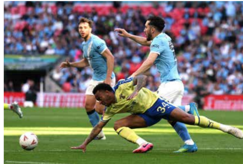
○ لحظة من المباراة.

الترجي إرلينغ هالاند والبرتغالي برناردو سيلفا والحارس الإيطالي جانلويجي دوناروما ودوكو والمدافع الأوزبي عبدالقادر خوسانوف.