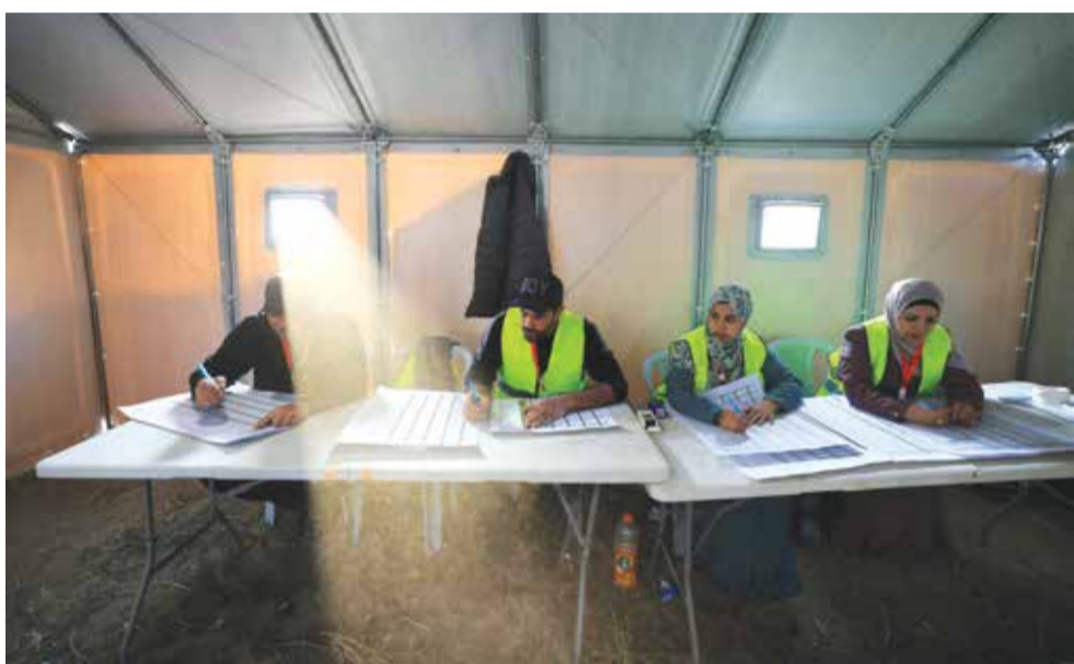
فرز أصوات الناخبين في دير البلح وسط قطاع غزة.

وقال فانس جولة أولى من المحادثات غير الناجحة مع إيران في إسلام آباد في وقت سابق من هذا الشهر.