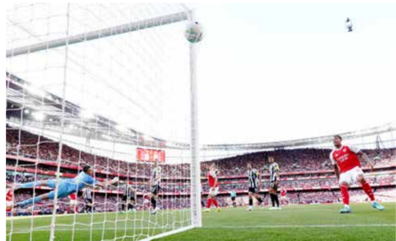
○ من لقاء أرسنال ونيوكاسل يونايتد.

من مواجهة مواطنه ومضيفه توتنهام فوربيست في ذهاب نصف نهائي مسابقة «يورولاغ».