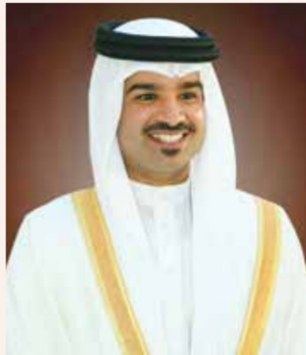
○ سمو الشيخ خليفة بن علي آل خليفة

به الجهاز بقيادة المدرب ناندينيو، والذي ترجمه اللاعبون على أرضية الملعب. وأوضح الشيخ علي بن خليفة بن أحمد آل خليفة أن النجاح الذي حققه فريق نادي المحرق هذا الموسم يأتي في سياق منظومة عمل متكاملة أسفرت عن نجاح كبير بالتتويج بأغلى البطولات المحلية مهنتاً وساعاته جميع منتسبي النادي بهذا الإنجاز الكبير. وأكد سمو الشيخ خليفة بن علي بن عيسى آل خليفة أن فوز نادي المحرق جاء بعد المستويات المميزة التي قدمها في مشواره طوال مسابقة كأس جلالة الملك المعظم، مؤكداً أن هذا التتويج جاء بفضل الدعم الكبير الذي لقيه الفريق من قبل مجلس