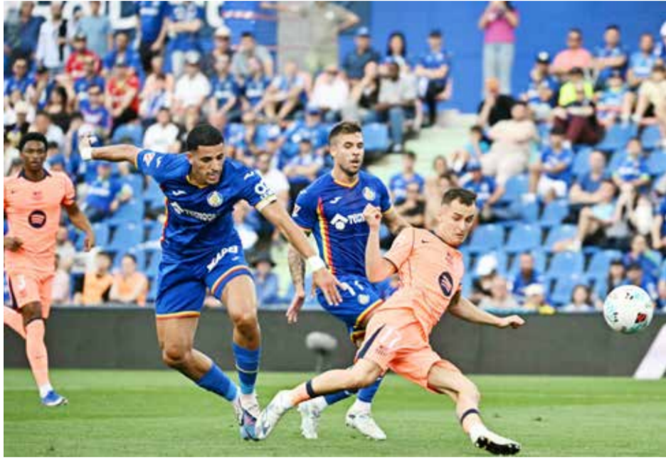
○ من لقاء برشلونة وخيتافي. (أ ف ب)