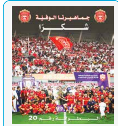
مع العدد بوستر من نادي المحرق

الواقع، بما يعزز من تنافسية القطاع الخاص وقدرته على التكيف مع المتغيرات الاقتصادية.