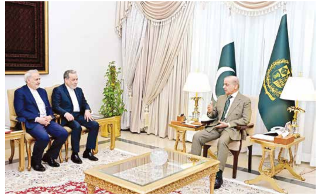
◉ الرئيس الباكستاني يستقبل وزير خارجية إيران.

وأنت تصريحات ترامب فيما كان من المرتقب أن يصل الوفد الأمريكي برئاسة المبعوث الخاص ستيف ويتكوف وجاريد