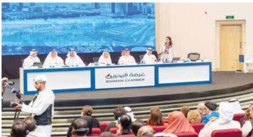
كتب: نوال عباس

عقدت غرفة تجارة وصناعة البحرين مساء أمس اجتماع الجمعية العمومية العادية في الدورة الحادية والثلاثين لمجلس إدارة، حيث أكد رئيس الغرفة نبيل خالد كانو مضي الغرفة في ترسيخ دورها كممثل رئيسي للقطاع الخاص وشريك استراتيجي في دعم الاقتصاد الوطني، من خلال تبني مبادرات عملية تستجيب لتطلعات مجتمع الأعمال وتعزز استدامة النمو الاقتصادي، وشهد الاجتماع حضور عدد من أعضاء الغرفة، حيث بلغ عدد العضويات الحاضرة 448 عضوية، بإجمالي أصوات بلغ 20134 صوتاً.