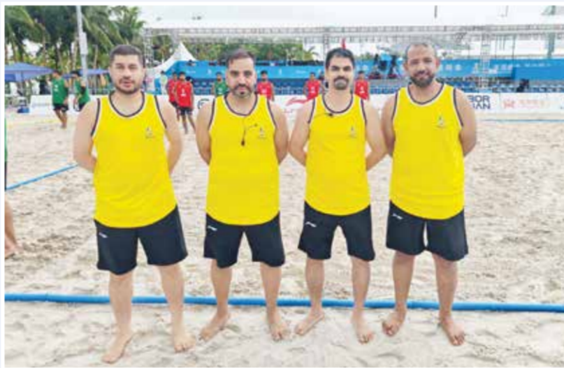
○ لقطة جماعية للحكام البحرينيين.