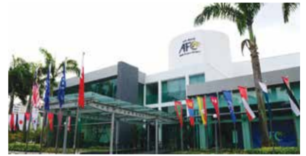
○ مقر الاتحاد الآسيوي

روما - (د ب أ): يشعر أنطونيو كونتي، مدرب نابولي، بالارتياح بعد فوز فريقه الساحق 4 / صفر على كريمونيزي، عقب تعافيه من الهزيمة القاسية أمام لاتسيو في نهاية الأسبوع الماضي. وفي تصريحات مع شبكة «دازن» بعد المباراة، نقلها موقع «توتو ميركاتو ويب»، بدأ كونتي سعيدا بفضل أداء فريقه. وقال المدرب: «لم يكن لدي أي شك في ردة فعل الفريق، لم نوفق في التسجيل أمام لاتسيو، ولم يسر أي شيء على ما يرام. اليوم، كان هناك تصميم كبير ورغبة عارمة في الثأر». ويزعم كونتي أنه عقب مباراة لاتسيو، وجه انتقادات لاذعة لفريقه الذي فاز بالدوري وكأس السوبر، ولا يزال يحتل المركز الثاني. وأضاف: «على الرغم من أننا ما زلنا نفتقد أربعة لاعبين أساسيين مثل دي لورينزو، ونيريس، ولوكاتو، وفيرجارا». واعترف بأن الموسم كان صعبا، لكنه قال: «أخبرت اللاعبين أننا بحاجة إلى إنهاء الموسم بأقوى ما يمكن. والعمل على تحسين التواصل بيننا».