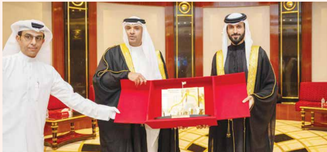
○ ناصر بن حمد يتسلم هدية تذكارية من رئيس اتحاد الكرة.

وأشار في ختام التصريح إلى أن الاتحاد البحريني لكرة القدم يولي المسابقة اهتماماً كبيراً وبالغاً نظراً لمكانتها العالية في قلوب البحرينيين، مؤكداً أن الاتحاد سخر للبطولة جهوداً كافة لإنجاحها على جميع المستويات، وهو ما تجسد أيضاً في تميز الحضور الجماهيري والتغطية الإعلامية، في انعكاس للاعتزاز الكبير للاتحاد لتنظيم هذه المسابقة الغالية على الجميع.