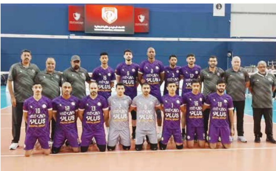
○ فريق دار كليب لكرة الطائرة.