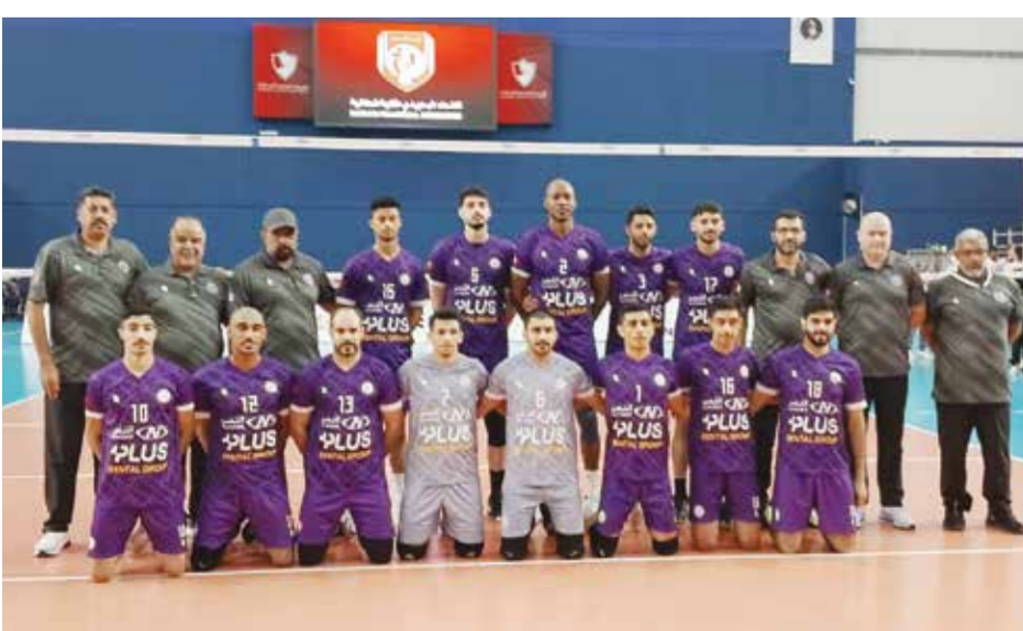
○ فريق دار كليب لكرة الطائرة.