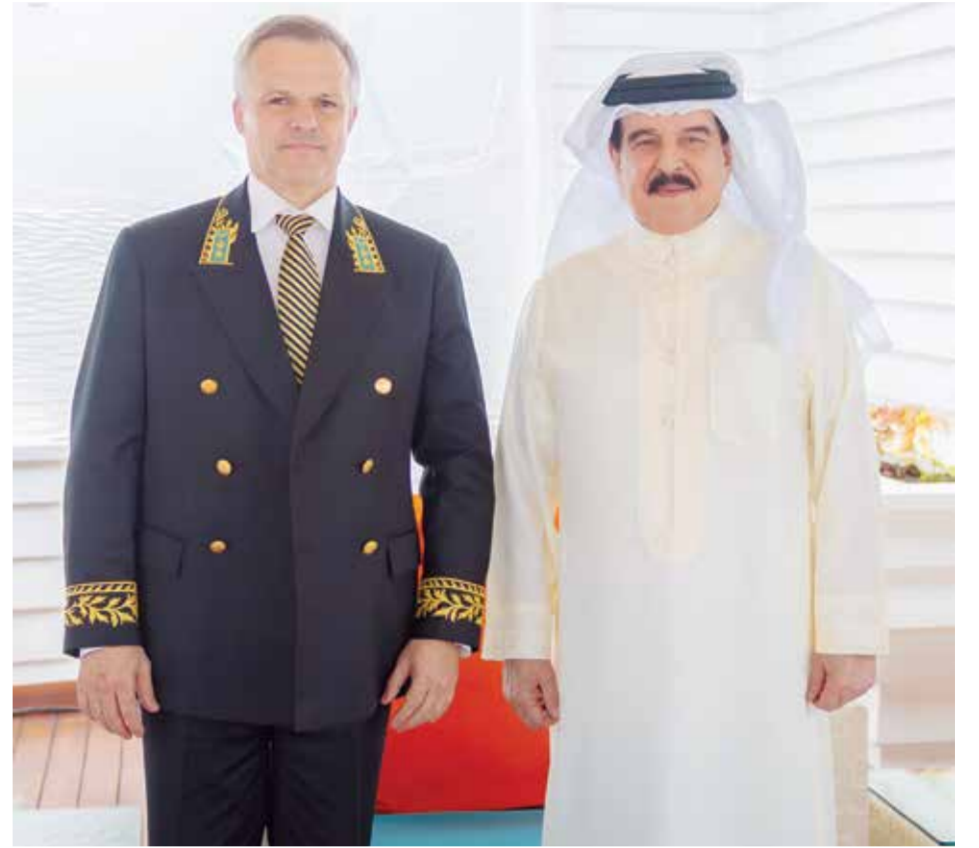
○ جلالة الملك المعظم خلال استقباله السفير الروسي.

استقبل حضرة صاحب الجلالة الملك حمد بن عيسى آل خليفة ملك البلاد المعظم أمس الدكتور أليكسي سكوسوريف سفير روسيا الاتحادية الصديقة لدى مملكة البحرين، بحضور سمو الشيخ عبدالله بن حمد آل خليفة الممثل الشخصي لجلالة الملك المعظم، وسمو الشيخ ناصر بن حمد آل خليفة ممثل جلالة الملك للأعمال الإنسانية وشؤون الشباب رئيس المجلس الأعلى للشباب والرياضة. وخلال الاستقبال نوه جلالته الملك المعظم بجهود فخامة الرئيس فلاديمير بوتين رئيس