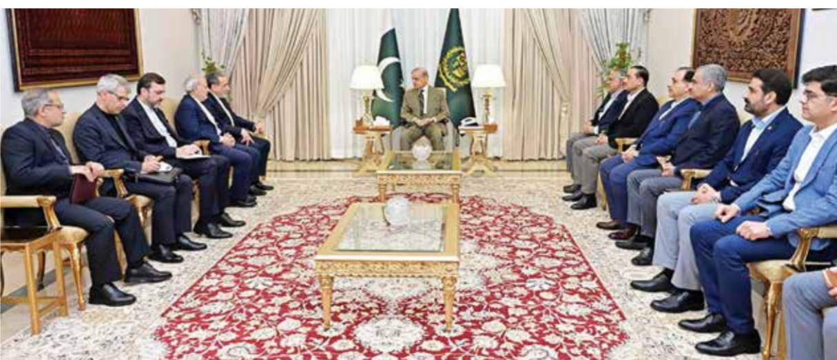
عراقي وبقية أعضاء الوفد التفاوضي الإيراني خلال مباحثاته مع شهباز شريف ومسؤولين كبار في إسلام آباد.

(الوكالات): تلاشت الآمال في عقد جولة جديدة من المباحثات بين الولايات المتحدة وإيران بعد مغادرة وزير الخارجية الإيراني عباس عراقجي إسلام آباد، وإعلان الرئيس الأمريكي دونالد ترامب إلغاء رحلة ويتكوف وكوشنر إلى باكستان لإجراء المحادثات.