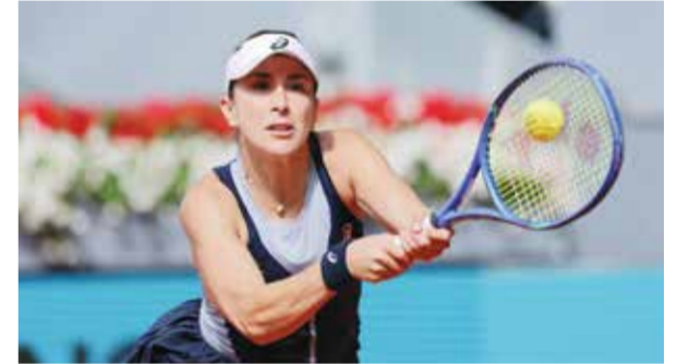
○ بنشيتش (أ ف ب)

وتبحث الروسية البالغة 18 عاما عن لقبها الثالث في دورات الألف نقطة، بعد تتويجها العام الماضي في دبي وإنديانا وبلز.