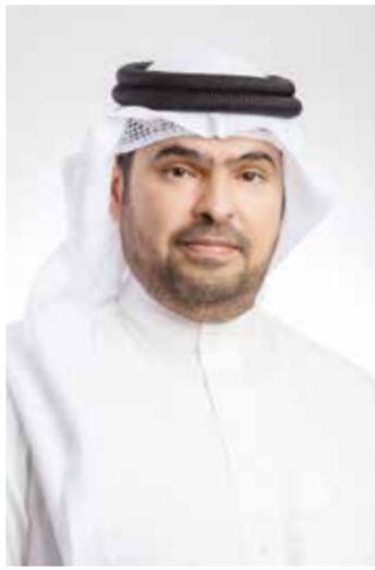
○ الشيخ مشعل آل خليفة.