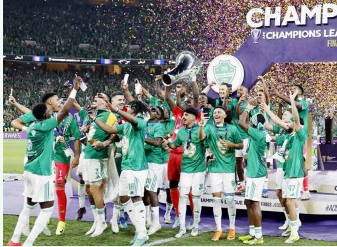
○ لحظة من التتويج.

الرياض (السعودية) - (أ ف ب): توج الأهلي السعودي بطلا لمسابقة دوري أبطال آسيا للعبة في كرة القدم للمرة الثانية تواليا، بفوزه منقوص العدد على ماتشيدا زيلفيا الياباني 0-1 بعد التمديد أمس السبت في النهائي الذي استضافه ملعب الإنماء في مدينة الملك عبدالله الرياضية في جدة.