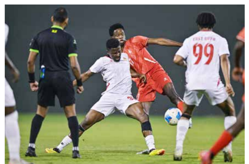
○ من لقاء الرفاع الشرقي والاتفاق.

خطف فريق الرفاع الشرقي صدارة دوري الدرجة الأولى لكرة القدم بعد فوزه على الاتفاق بهدف دون رد، في اللقاء الذي أقيم على استاد النادي الأهلي، ضمن منافسات الجولة التاسعة عشرة من المسابقة. وبهذا الفوز، رفع الرفاع الشرقي رصيده إلى 45 نقطة في المركز الأول، متقدماً بفارق نقطة واحدة عن الاتفاق الذي تجدد رصيده عند 44 نقطة في المركز الثاني. وفي المواجهة الثانية التي احتضنها ملعب فيفا، تفوق فريق الحالة على نظيره التضامن بنتيجة ثلاثة أهداف مقابل هدفين. وفي المواجهة الأخيرة، حقق فريق مدينة عيسى فوزاً مثيراً على حساب اتحاد الريف بنتيجة هدفين مقابل هدف.