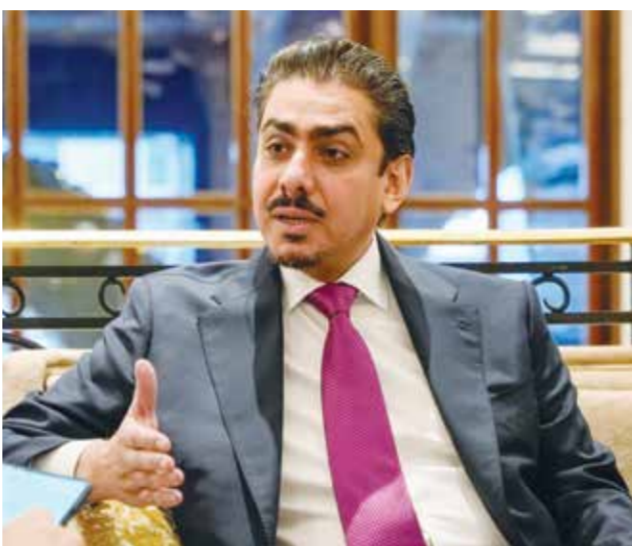
أن «Visit Bahrain» تواصل تنفيذ استراتيجيتها الهادفة إلى ترسيخ مكانة المملكة كوجهة سياحية متنوعة ومستدامة لتبلي تطلعات مختلف الأسواق الإقليمية والدولية.

وأضاف أن استقرار أسعار النفط يساهم في دعم استقرار أسعار التذاكر إلى جانب التوسع في الرحلات المباشرة واستمرار الجهود الترويجية وهو ما يعزز من تنافسية البحرين كوجهة سياحية إقليمية. واختتم تصريحه بالتأكيد