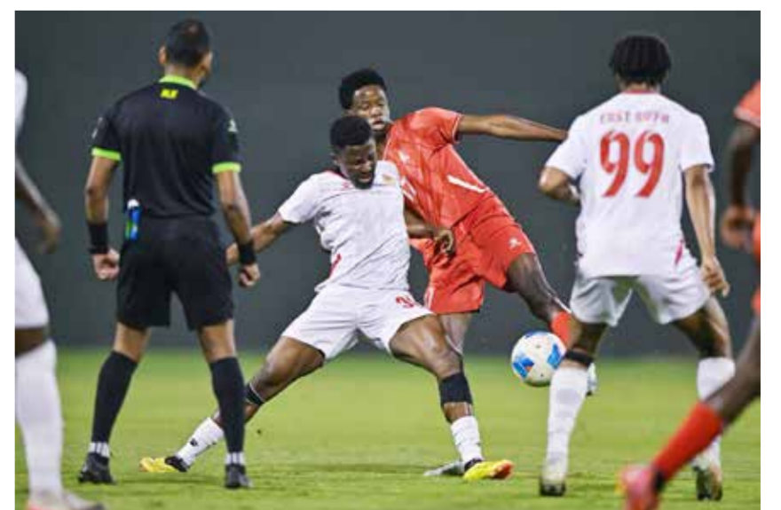
○ من لقاء الرفاع الشرقي والاتفاق.

وفي المواجهة الثانية التي احتضنها ملعب فيفا، تفوق فريق الحالة على نظيره التضامن بنتيجة ثلاثة أهداف مقابل هدفين. وفي المواجهة الأخيرة، حقق فريق مدينة عيسى فوزاً مثيراً على حساب اتحاد الريف بنتيجة هدفين مقابل هدف.