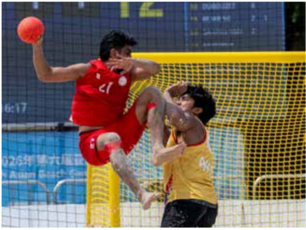
○ من لقاء منتخب اليد مع الفلبين