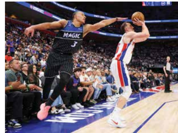
○ من لقاء بيستونز وماجيك.

وأضاف: «ينطبق هذا على أي كان وعلى الجميع، على فرق «أ-ب»، وعلى أي شكل من أشكال الملكية المشتركة»، في إشارة إلى إمكانية امتلاك مالك واحد في الفورمولا واحد فريقا كبيرا «أ»، وآخر أصغر «ب»، على غرار شركة ريد بول النمساوية التي تملك فريق ريد بول ريسينغ (الذي يقود له الهولندي ماكس فيرستابن