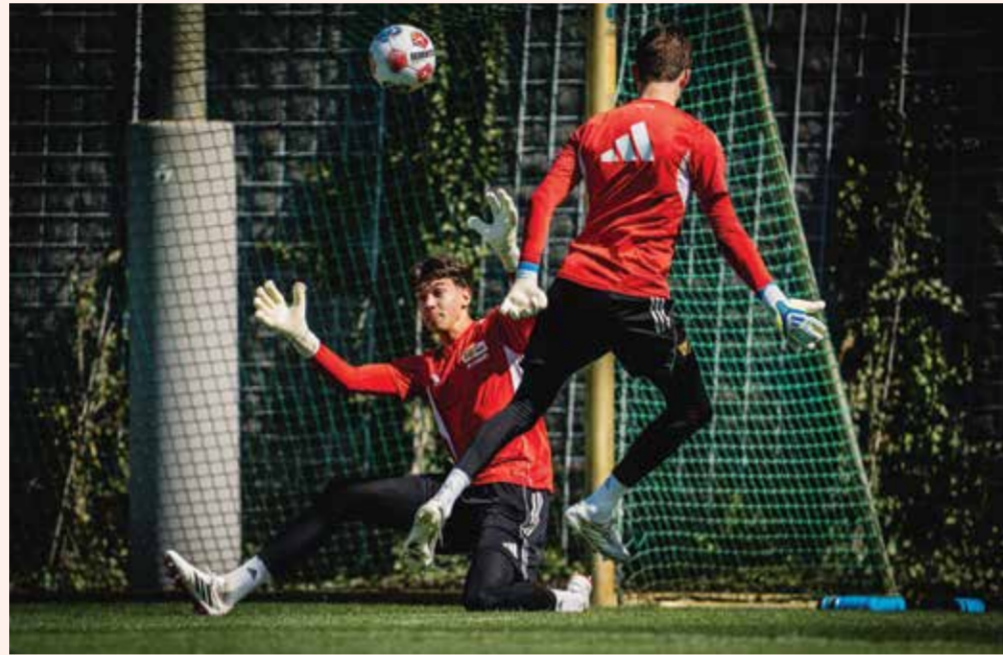
○ تدريبات أونيون برلين.

شيء محسوم، فهو ليس كذلك. هذا هو الوضع. وسيخوض فريق المدرب البلجيكي فنانسان كومباني مباراته المقبلة مع مضيفه ماينتس السبت، سعياً إلى استكمال سلسلة انتصاراته، وإضافة المزيد من الأهداف إلى سجله القياسي، لكنه يلعب من دون مهاجمه سيرج غنابري الذي أعلن غيابه عن مونديال 2026 للإصابة. بدوره، يلعب بوروسيا دورتموند (64) مع ضيفه فرايبورغ لحسم المركز الثاني الذي يبتعد فيه عن لايبزيغ بخمس نقاط حالياً.