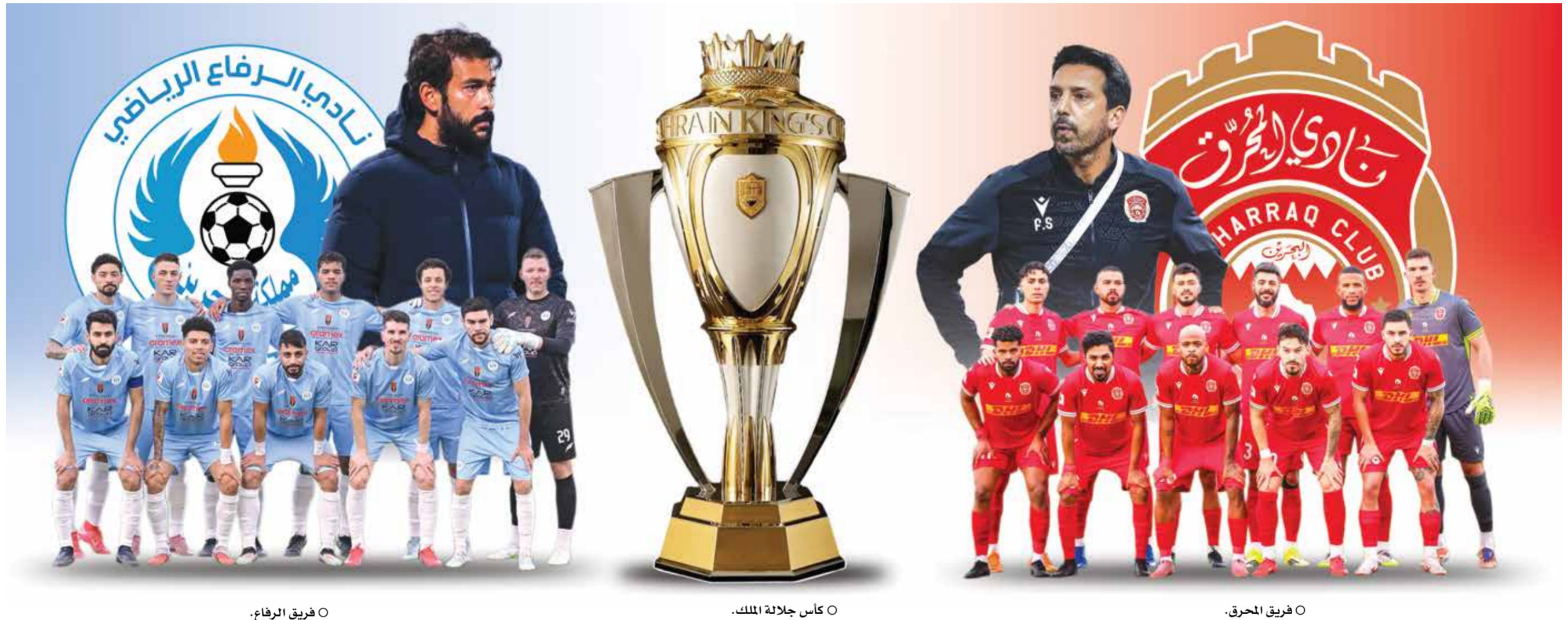
○ فريق الرفاع.