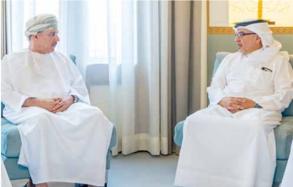
○ سمو ولي العهد رئيس الوزراء خلال استقباله رئيس مجلس الإدارة التنفيذي لبنك إنفستكورب.