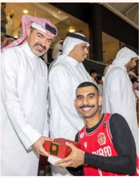
○ محمود عباس.