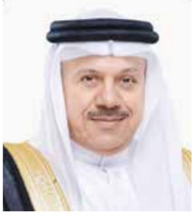
○ وزير الخارجية.

مملكة البحرين الدورة الحالية لمجلس التعاون لدول الخليج العربية، ومجلس جامعة الدول العربية على المستوى الوزاري، وعضويتها غير الدائمة في مجلس الأمن.