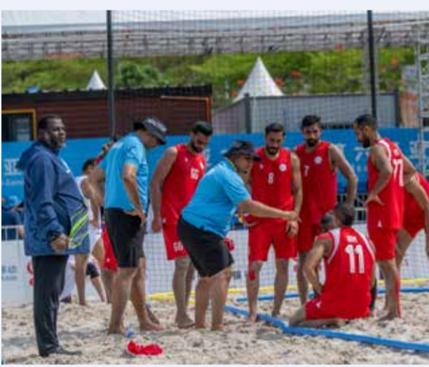
○ منتخبنا الوطني لكرة اليد الشاطئية