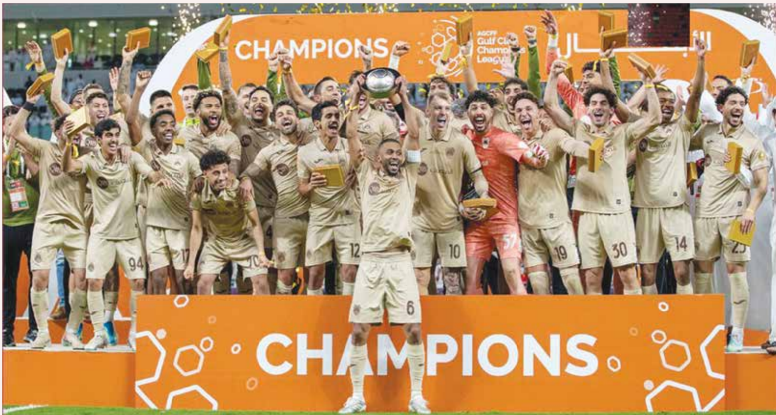
○ جانب من التتويج.

وفي المقابل، اقترح الاتحاد المغربي إقامة المباراة في 2 يونيو في الرباط، مع تحمل كل تكاليف سفر بعثة السلفادور إلى القارة الإفريقية. وجاء في مراسلة الاتحاد المغربي التي أرسلها إلى الاتحاد الإسباني في 25 مايو، إضافة إلى ارتباط عدد من لاعبينا الدوليين بأنديةهم، والتعديلات التي طرأت على روتاتنا المسابقات المحلية في المغرب والسعودية، فضلاً عن إصابات في صفوف بعض اللاعبين الأساسيين، جعلت المنتخب غير قادر على الاعتماد على ما لا يقل عن ثلث قائمته المرشحة للتواجد في اللائحة النهائية المقدمة إلى الاتحاد الدولي لكرة القدم». وأضافت الرسالة أن السفر إلى الولايات المتحدة في 29 مايو بقائمة مقنونة «لا يبدو منطقياً»، مؤكداً عدم القدرة على خوض المباراة التي كانت مقررة في واشنطن. من جهته، أعرب الاتحاد السلفادوري عن تقديره للمباراة المغربية، لكنه أكد عدم إمكانية تلبيتها، موضحاً أن لوائح «فيفا» تمنع خوض مباريات في قارتين مختلفتين خلال نفس النافذة الدولية، إضافة إلى التزام المنتخب ببرنامجه فني محدد مسبقاً يتضمن خوض مباراتين وديتين.