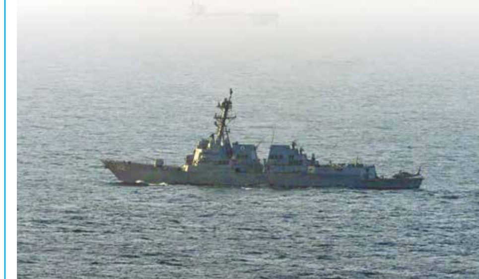
○ مدمرة أمريكية في بحر العرب خلال مشاركتها في الحصار البحري على إيران.