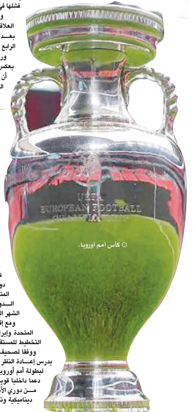
○ كأس أمم أوروبا.

من جانبه أصدر (فيفا) بياناً قال فيه إنه تم إبلاغه بتأسيس ذلك الاتحاد الجديد، مؤكداً أنه ملتزم، كمبدأ عام، بالمشاركة المفتوحة والبناءة مع جميع الأطراف المعنية في عالم كرة القدم وذلك من أجل دعم المبادئ الأساسية للاتحاد بما في ذلك تمثيل اللاعبين.