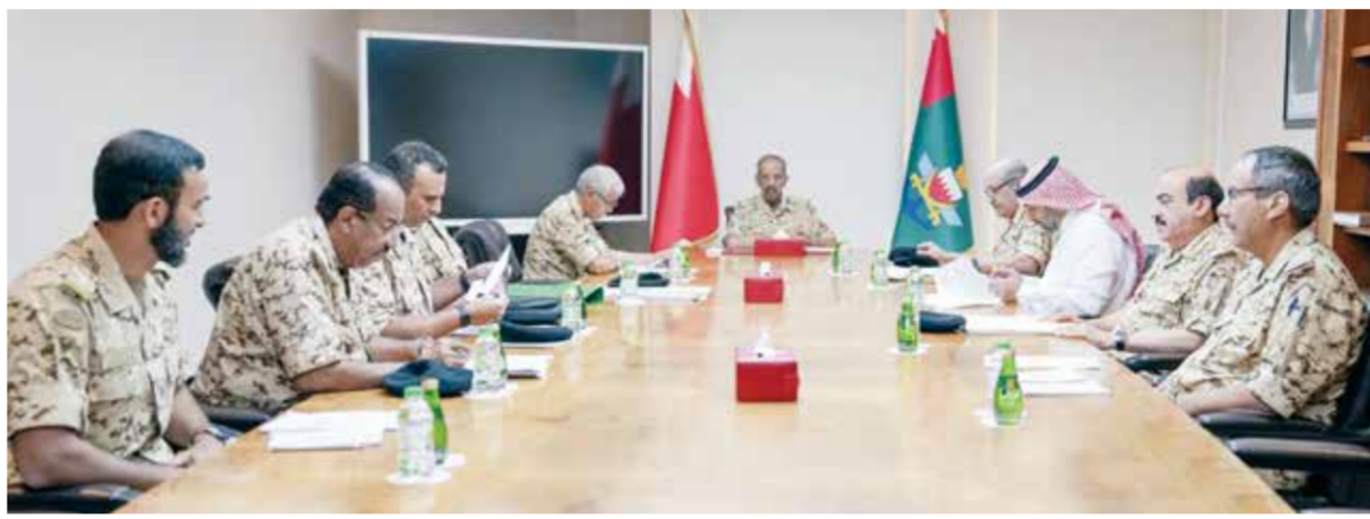
○ القائد العام خلال اجتماعه مع عدد من كبار الضباط.

الجلالة ملك البلاد المعظم القائد الأعلى للقوات المسلحة، والمساندة الكبيرة من صاحب السمو الملكي ولي العهد نائب القائد الأعلى للقوات المسلحة رئيس مجلس الوزراء، تحقق لقوة دفاع البحرين النجاح، وغدت ميدانا للبطولة والتضحية والفداء.