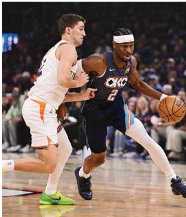
○ ألكسندر (أ ف ب)