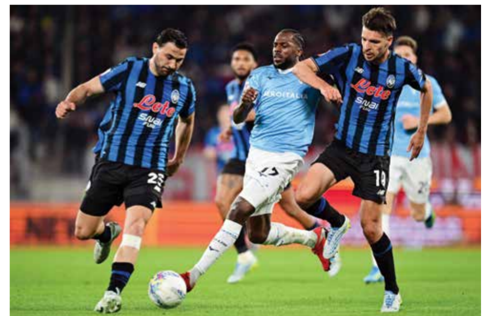
○ من مباراة أتالانتا ولاتسيو

وسيكون التتويج قبل أربع مباريات من الختام إنجازاً لافتاً، لا سيما أن إنتر كان يعاني من تذبذب في المستوى قبل فترة التوقف الدولي الأخيرة، فيما بدأ