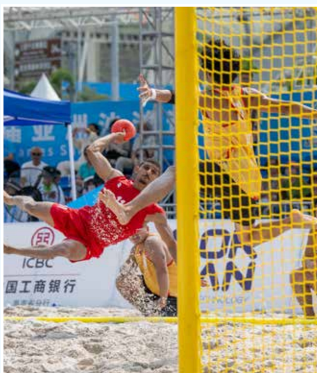
○ من لقاء منتخبنا مع الفلبين.