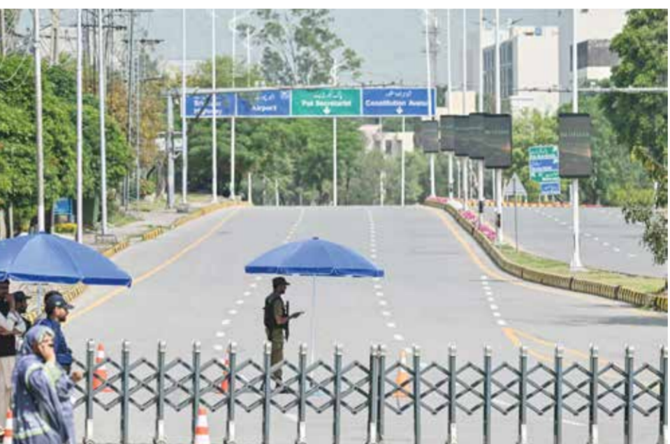
○ دبلوماسي إيراني؛ لا حديث عن إلغاء المحادثات بين أمريكا وإيران. (أ ف ب)

في حين أكدت واشنطن أن لا رفع للحصار قبل التوصل إلى اتفاق إقليمي مع الجانب الإيراني.