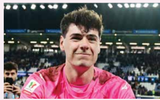
○ موتا (رويترز)