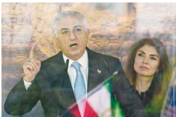
○ نجل الشاه يخطب في تجمع في برلين.

وجاءت زيارة بهلوي لألمانيا في الوقت الذي يبدو أن الجهود الرامية إلى إنهاء الصراع توقفت مع استمرار إيران والولايات المتحدة في فرض السيطرة على مضيق هرمز الحيوي الذي يمر عبره نحو خمس إنتاج النفط العالمي.