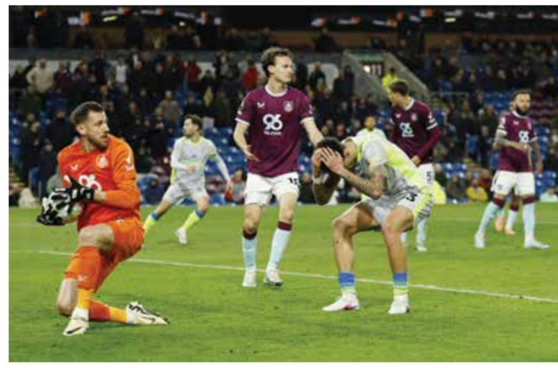
○ من لقاء سيتي وبيرنلي.

وقال جيبي: «أعتقد أن أولويتنا حالياً هي التركيز على أنفسنا، لا نستطيع التحكم إلا فيما هو تحت سيطرتنا، وخصنا مباراة أرسنال وتمكننا من التحكم فيها، والآن الأمر متروك لنا للتأكد من أننا نقدم أفضل ما لدينا في المباريات المتبقية».