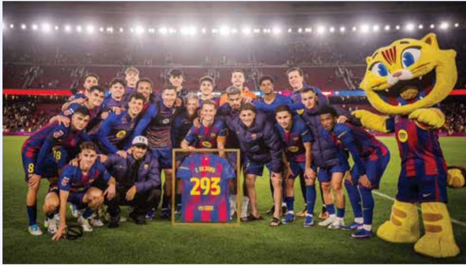
○ فريق برشلونة.