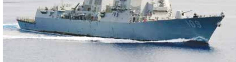
○ مدمرة أمريكية خلال مشاركتها في الحصار البحري على إيران.

إلى حوالي 3.43 ملايين برميل يوميا، في انعكاس لـ«الأثر الأوسع لاضطرابات التصدير والقيود على التكرير المرتبطة بالنزاع المستمر»، وفق فلكشايف. لكن ليمان يؤكد أنه باستثناء الأثر النفسي للحصار، فإن «الأثر المادي الحقيقي ظل محدوداً حتى الآن».