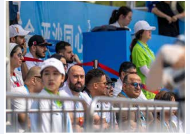
○ الكوهجي يشهد انتصار منتخب اليد.