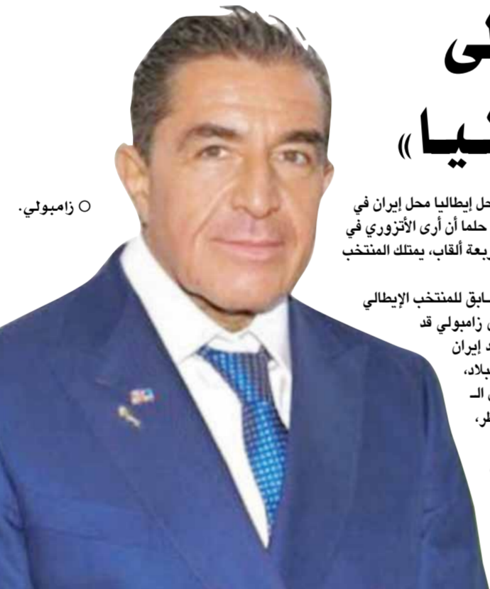
○ زامبوني .

الدوحة - (د ب أ) توج فريق الريان القطري بطلاً لدوري أبطال الخليج العربي لكرة القدم، لأول مرة، بعد فوزه على نظيره الشباب السعودي في المباراة النهائية أمس الخميس بنتيجة 3/0 صفر، التي أقيمت على ملعب أحمد بن علي. سجل الإسباني ديفيد جارسيا هدف تقدم الريان في الدقيقة 61، ثم أضاف الصربي ألكسندر ميتروفيتش الهدف الثاني في الدقيقة 78، قبل أن يحتتم الثلاثية البرازيلي روجر جيديس في الدقيقة 81.