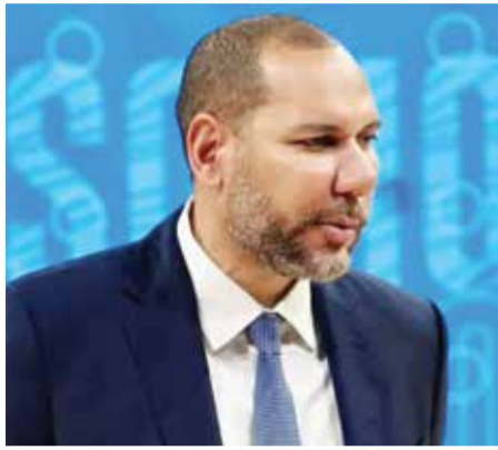
○ بوكيلي .