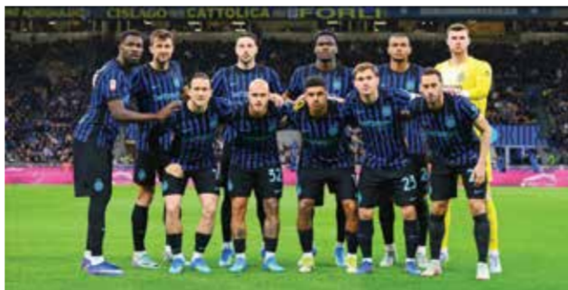
○ فريق إنتر.

اللقب لغريمه المحلي، وإن كان ذلك لن يكون أسوأ مما حدث قبل عامين، حين سمح لإنتر بالتتويج بعد خسارته دربي ميلانو. لكن فريق المدرب ماسيميليانو ألغيري بات قريباً من ضمان العودة إلى دوري أبطال أوروبا، بعدما قلّب خلفه المركز الرابع ويتقدم بخمس نقاط فقط على كومانو وروما السادس.