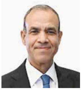
○ وزير الخارجية المصري.