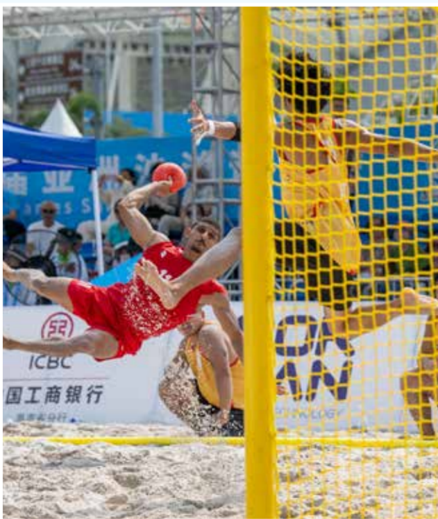
○ من لقاء منتخبنا مع الفلبين.