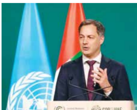
○ الكسندر دي كرو.

يقدر بنحو 0.5 بالمائة إلى 0.8 بالمائة من الناتج المحلي الإجمالي العالمي. وأضاف «الأمور التي تستغرق عقوداً لبنائها، لا تتطلب سوى ثمانية أسابيع من الحرب لتدميرها»، وتزيد الأزمة من الضغوط على الجهود الإنسانية مع تقلص التمويل وزيادة الاحتياجات في الأماكن التي تواجه بالفعل حالات طوارئ خطيرة، بما في ذلك السودان وقطاع غزة وأوكرانيا. وقال دي كرو «سنستعين علينا أن نقول لبعض الناس، نعتذر بشدة، لكننا لا نستطيع مساعدتكم». وأضاف «من كانوا سيعيشون بفضل المساعدة لن يحصلوا عليها وسيصبحون في وضع أكثر ضعفاً».