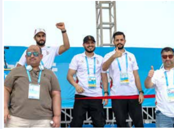
○ تفاعل إيجابي لأعضاء البعثة البحرينية.