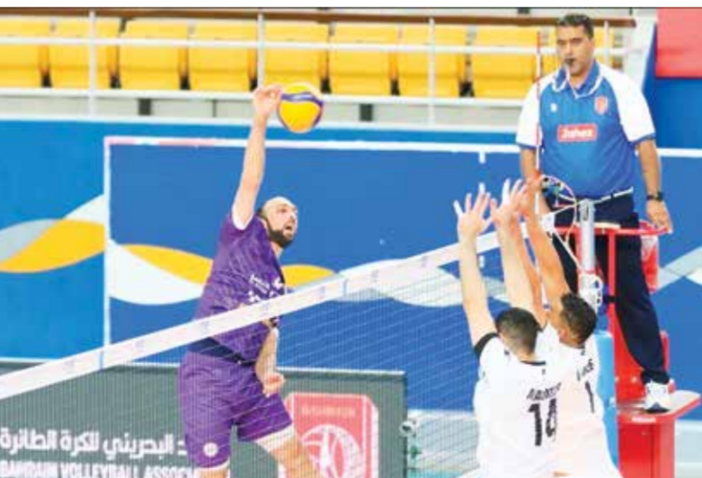
○ جانب من لقاء الفريقين

بروفة احتفالية، إذ لم يتبق له سوى مباراة واحدة أمام فريق الديبر، والمقررة يوم الأحد المقبل، والتي سينتج بعدها رسمياً بلقب الدوري.