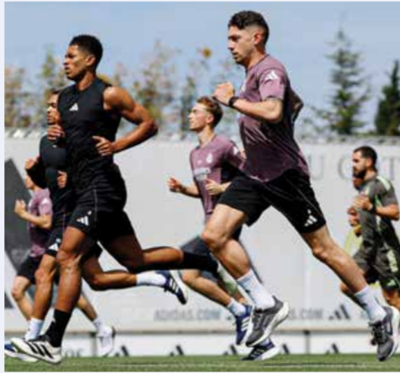
○ تدريبات ريال مدريد.