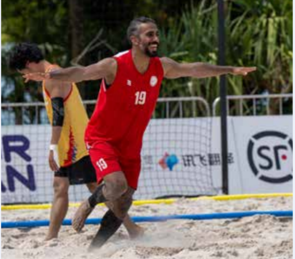
○ فرحة الفوز.