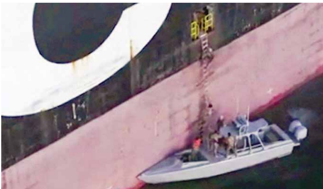
○ عناصر من الحرس الثوري تعتلج إحدى السفن في مضيق هرمز.

الإسرائيلي يسرائيل كاتس من أن إسرائيل تستعد لاستئناف الحرب، وتنتظر الضوء الأخضر الأمريكي لتنفيذ ضربات «تعيد إيران إلى العصر الحجري».