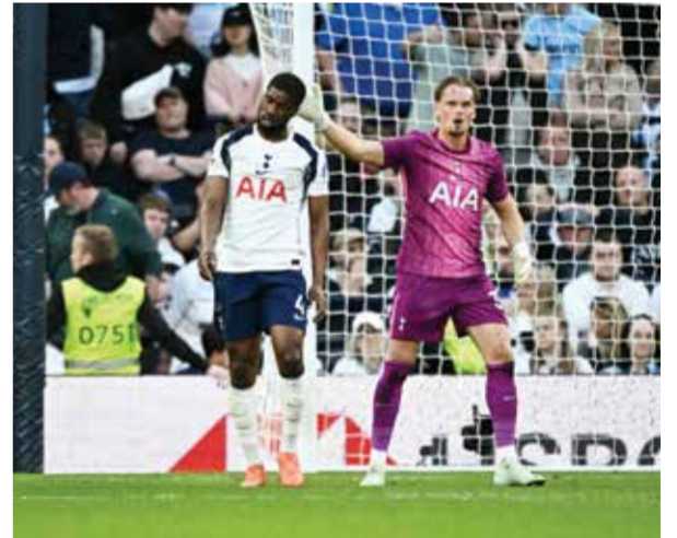
○ أنتوني يواسي دانسو.

بهذا الهدف، حطم بارينيتشيا الرقم القياسي المسجل في تاريخ النهائيات، متجاوزاً هدف مهاجم بلنسية بادينيس الذي سُجل بعد 18 ثانية في نهائي عام 1952 أمام برشلونة، وهدف أونامونو لاعب أتلتيك بيلباو في مرمى ريال مدريد عام 1930 الذي جاء أيضاً في الدقيقة الأولى.