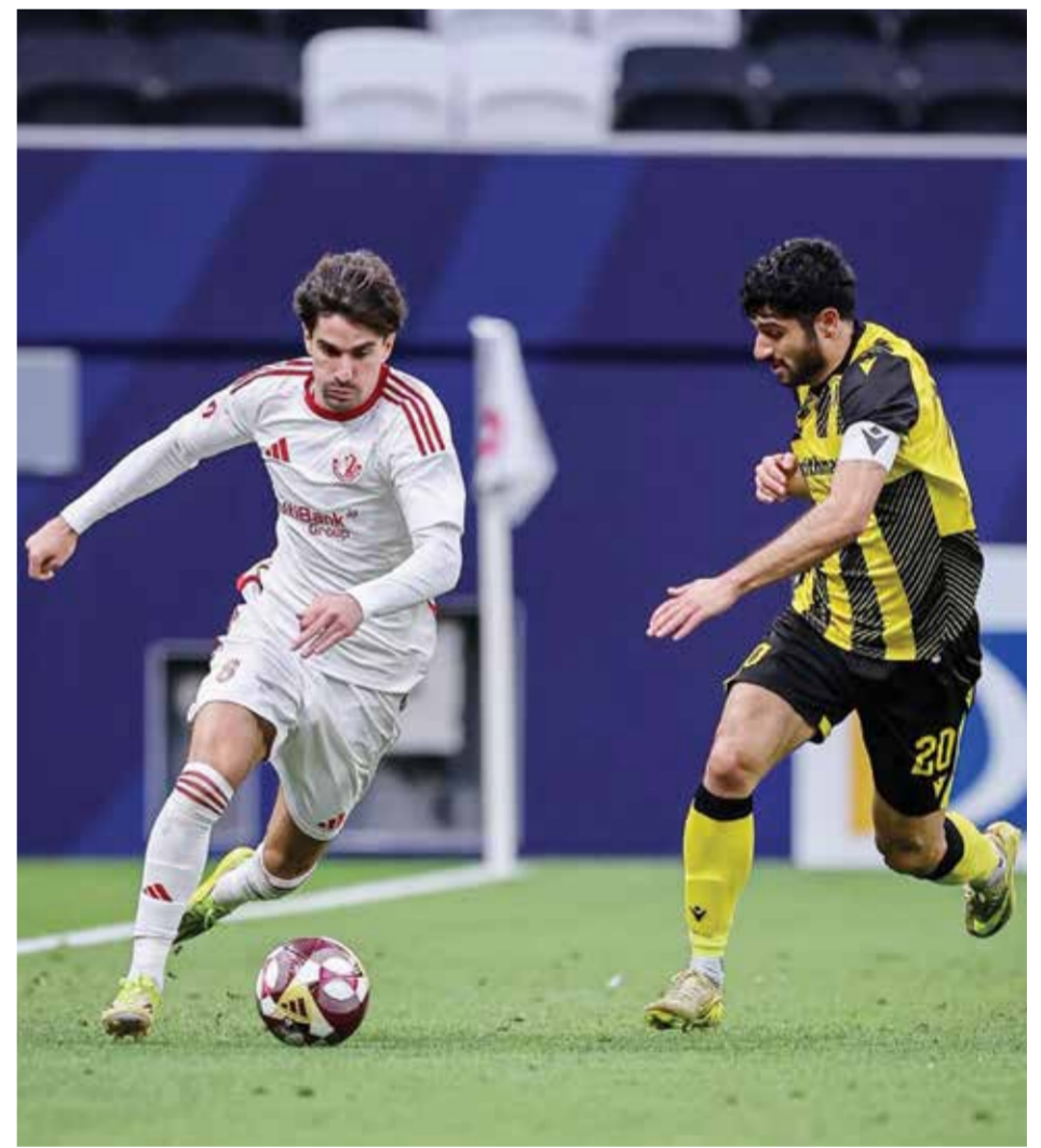
○ من مباراة الشمال وقطر.