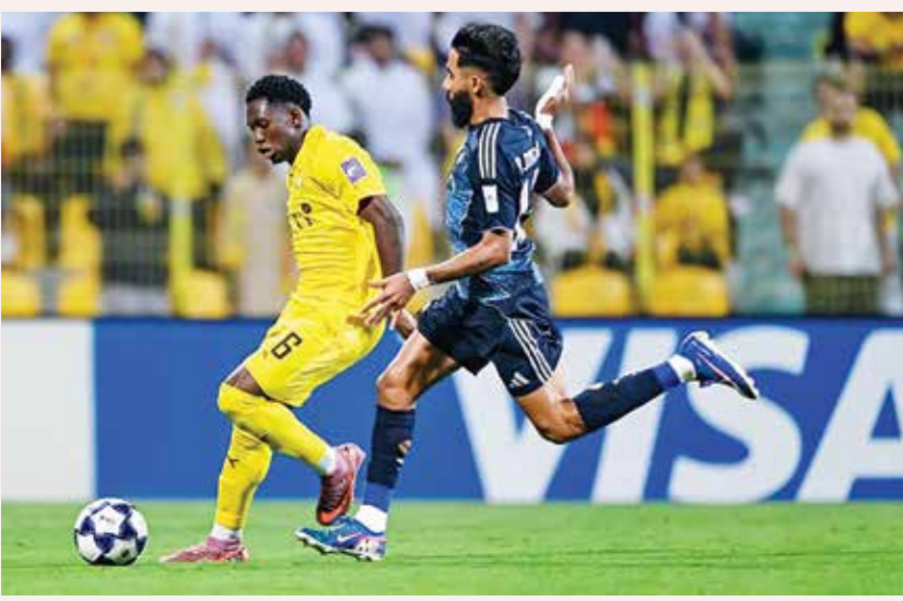
○ من لقاء النصر والوصل.

ورفع الفريق البافاري رصيده إلى 79 نقطة في المركز الأول، بعيداً بـ15 نقطة عن بوروسيا دورتموند الثاني الذي سقط أمام مضيئه هوفنهايم 2-1 السبت. وفي الموسم الماضي، توج الفريق