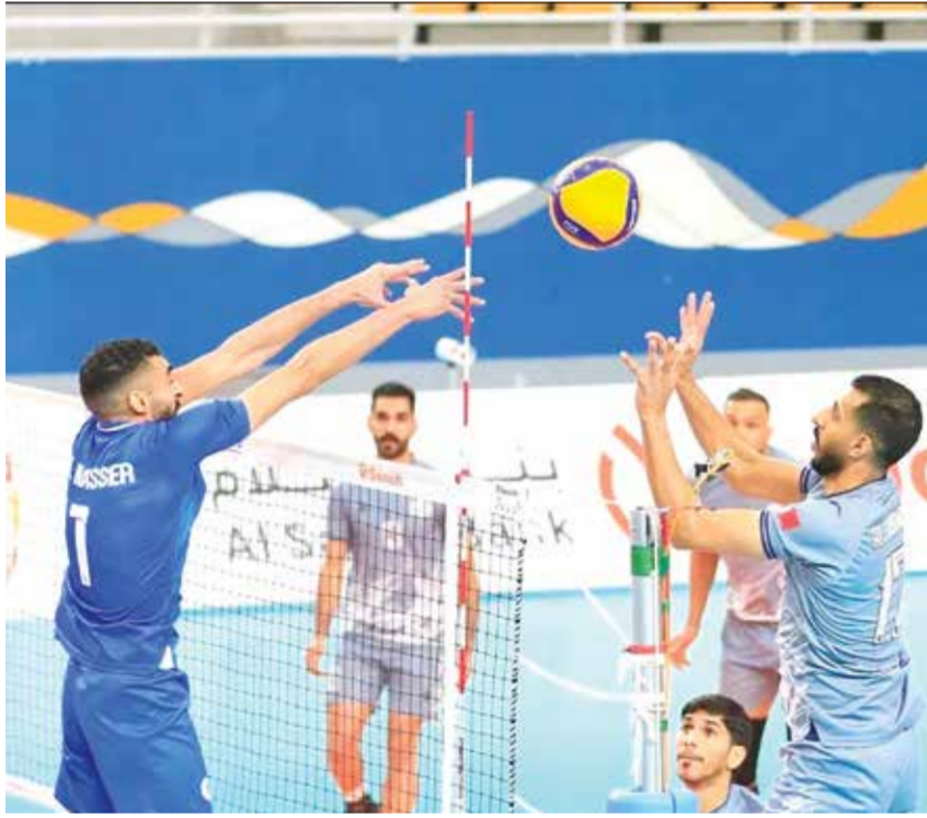
○ من لقاء التضامن والنصر.