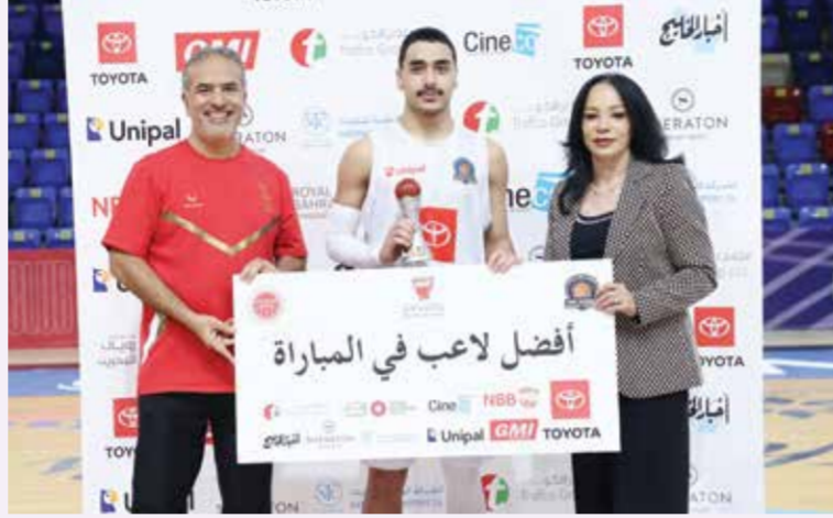
○ جانب من تكريم أفضل لاعب.