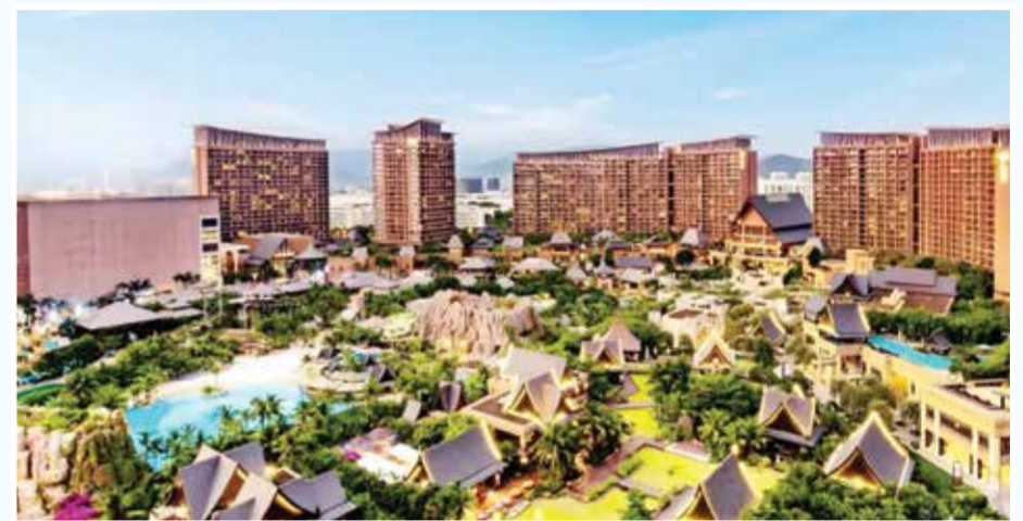
○ القرية الرياضية.