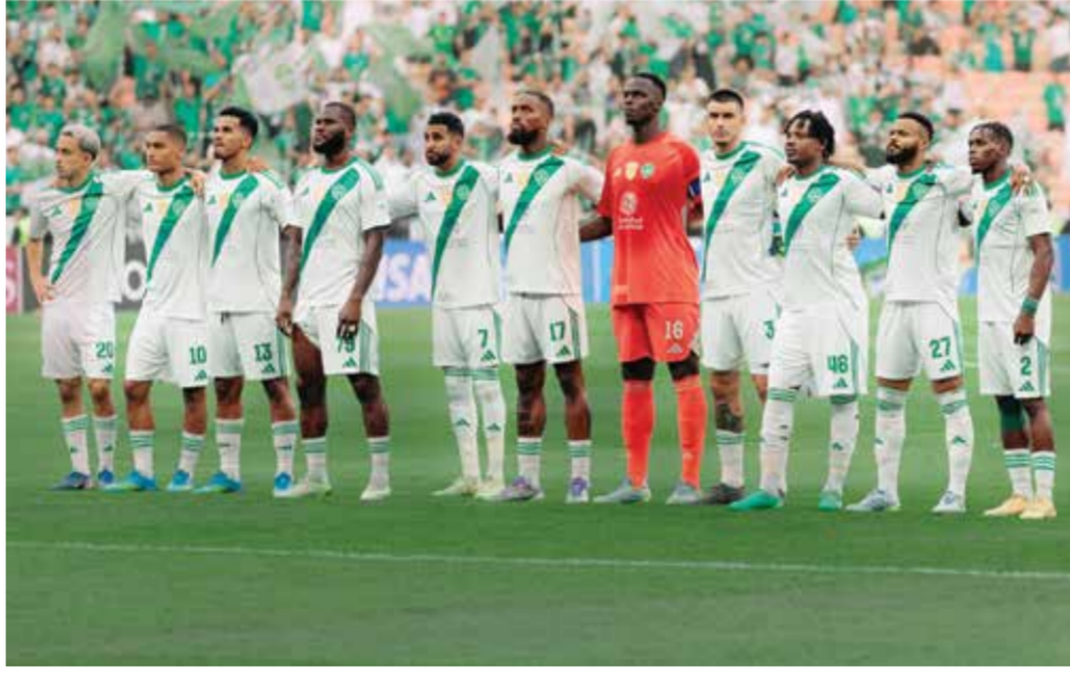
○ فريق الأهلي.