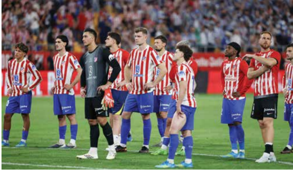
○ حسرة لاعبي أتلتيكو.

علينا، لكن علينا أن ننهض، الآن يأتي الجزء الجيد».