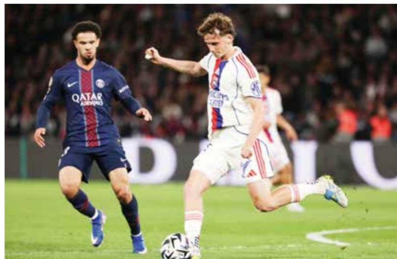
○ من لقاء ليون وسان جرمان.

والأمريكي فولارين بالوغان (59) من ركلة جزاء). وفاز رين على مضيئه ستراسبورغ بثلاثية نظيفة تناوب على تسجيلها إستيبان لوبول (20) والسويسري بريل إمبولو (50) والأردني موسى التعمري (52) الذي سجل هدفه الخامس في البطولة، معادلاً رقم ترميراته الحاسمة أيضاً هذا الموسم. ورفع رين رصيده بهذا الانتصار الثالث تواليها إلى 53 نقطة في المركز