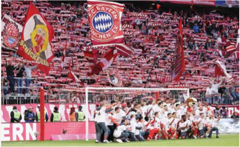
○ بايرن يحقق اللقب الـ35 في تاريخه. (رويترز).

ومنذ ثنائية بوروسيا دورتموند في عامي 2011 و2012، أحرز بايرن 13 من أصل 14 لقباً للدوري. أما اللقب الوحيد الذي أفلت منه، فكان من نصيب باير ليفركوزن، بعد موسم استثنائي أنهاه من دون أي هزيمة خلال 34 مرحلة من البوندسليغا، وهو إنجاز لم يحققه أي ناد ألماني آخر، بما في ذلك بايرن.