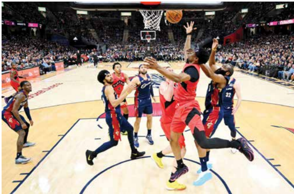
○ من مباراة كليفلاند وتورونتو