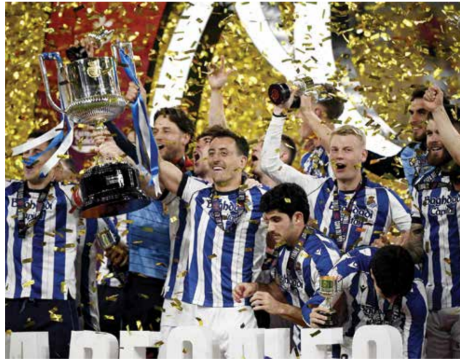
○ تتويج سوسيداد.

أضاف «قدمنا أداء جيداً، ولكن الاكتفاء بنقطة واحدة يجعلني أشعر بخيبة أمل، لأنني كنت أطمح في المزيد، ولكننا لعبنا بروح قتالية عالية». واصل «للأسف لم نستغل الفرص التي أتاحت لنا، وسجل توتنهام هدفاً