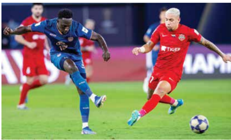
○ من مباراة شباب الأهلي وبورييرام يونبايتد.

جيدة. ربما بسبب مشاركة بعض اللاعبين الشبان فقدنا بعض التركيز بعد استقبال الهدف الأول، لكننا كنا دائماً نمتلك الثقة والرغبة، وكان من الرائع أن نتتمكن من إظهار ذلك».