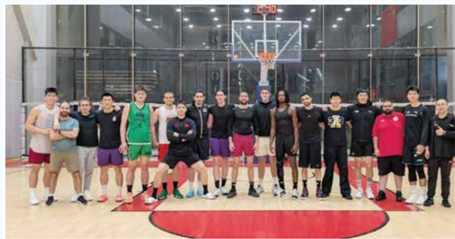
○ صورة جماعية.