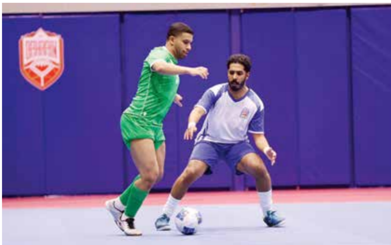
○ جانب من المنافسات.

وتتواصل الإثارة ببقاء الاتفاق مع المرخ عند الساعة 7:30 مساءً، قبل أن تحتتم الجولة بقمة مرتقبة تجمع الحرس الوطني مع المتصدر بنك البحرين الإسلامي عند الساعة 9:30 مساءً، في اختبار حقيقي لقدرة المتصدر على الحفاظ على هيمنته وسط مطاردة شرسة.