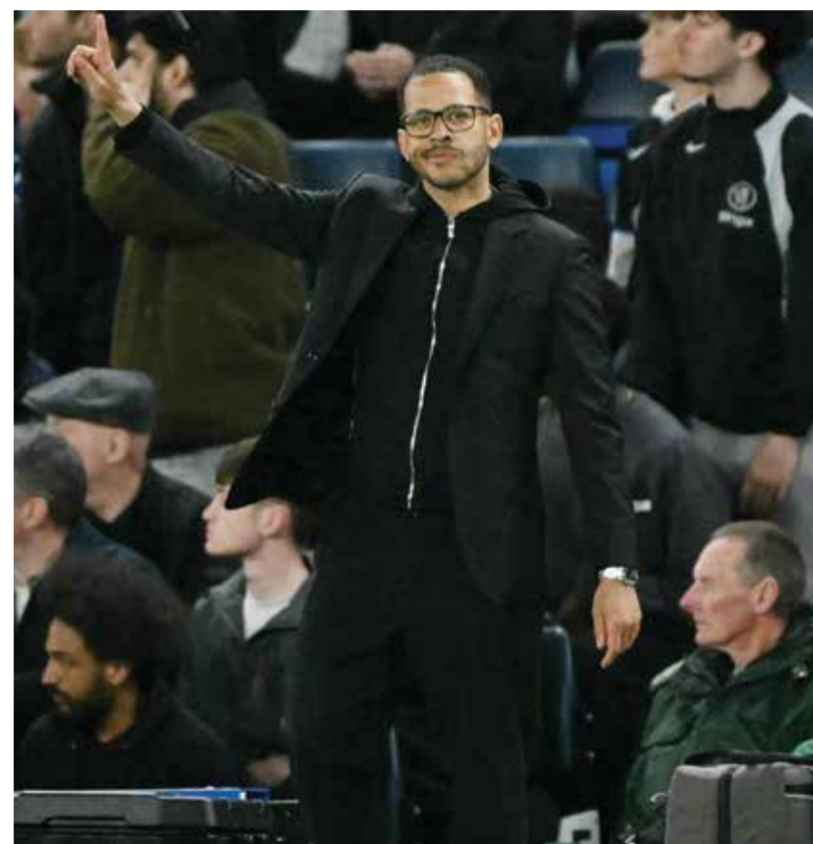
○ روسينور (أ ف ب)

بي سي) «الأمر صعب، لقد فازوا بتسديدة واحدة فقط على مرمانا عندما كنا نلعب بعشرة لاعبين». وأضاف «لقد هددنا مرماه بالعديد من الهجمات، وتصدى القائم والعارضة لأربع محاولات تقريبا، ولا أريد أن يشعر اللاعبون بأن الظروف تعاكسنا، بل علينا مواصلة القتال». وبشأن هدف مانشستر يونايتد، قال مدرب تشيلسي أيضا «كان علينا التعامل دفاعيا بشكل أفضل، ولكننا لم نفعل ذلك، ودفعنا الثمن، ففي الفترة الحالية، نستقبل هدفا مباشرة بعد أي خطأ ترتكبه، ويجب أن يتغير ذلك». وختم روسينور تصريحاته «لم نحقق النتيجة المأمولة، وهناك تفاصيل صغيرة تترام علينا، ولكن علينا مواصلة العمل بجدية، ولا أشعر بأي ضغوط، بل أضغط نفسي بنفسي، ويجب أن نواصل العمل مع الجهاز المعاون واللاعبين لتحسين الأداء والنتائج».