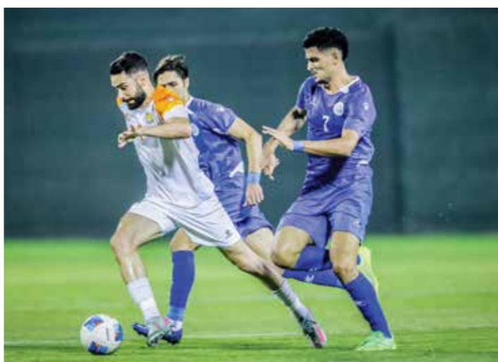
○ من لقاء الحالة وأم الحصم.