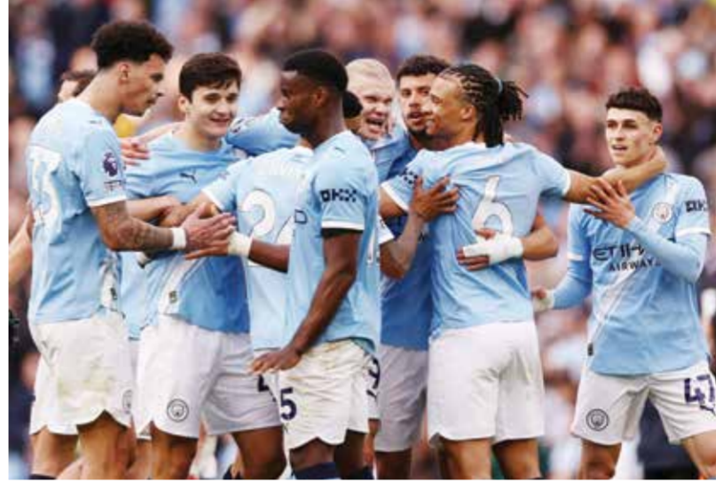
○ فرحة لاعبي سيتي.

لندن - (أ ف ب): شدد مانشستر سيتي الخناق على أرسنال متصدراً الدوري الإنكليزي لكرة القدم، بعدما أسقطه 2-1 بهدي الفرنسي ريان شرقي والنرويجي إرلينغ هالاند، أمس الأحد ضمن المرحلة الثالثة والثلاثين، ليقلص الفارق معه إلى ثلاث نقاط، علماً أن فريق المدرب الإسباني بيب غوارديولا مباراة مؤجلة.