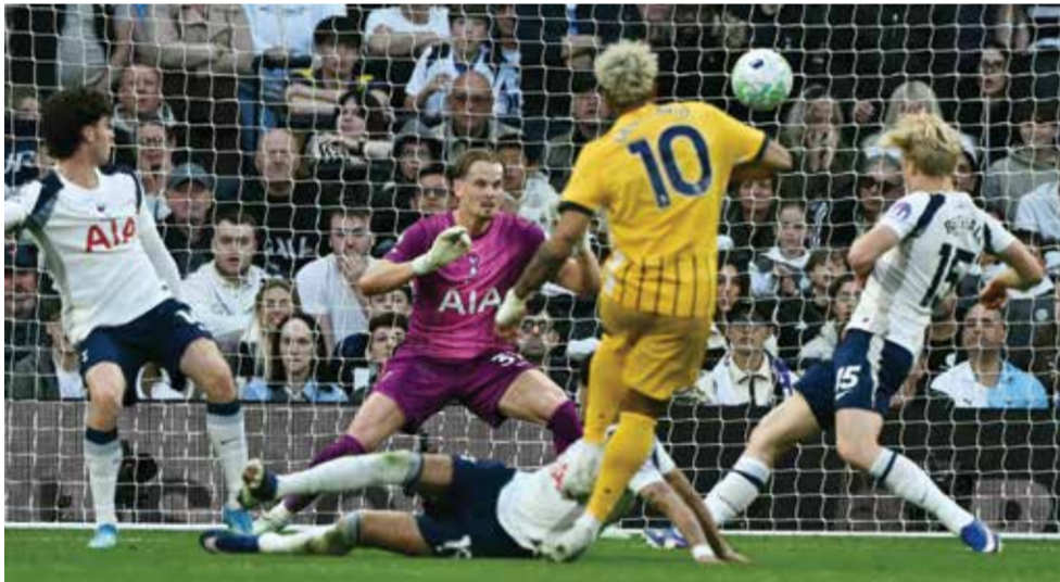
○ من مباراة برايتون وتوتنهام.

وأضاف توتنهام «سنسعى لاتخاذ أقوى إجراء ممكن ضد كل شخص نحدد هويته. يحظى كيفن بدعمنا الكامل وغير المشروط كلاعب وكشخص. لن يفقد أي شخص في هذا النادي بمفرده في مواجهة هذا الأمر. لا شيء يتعلق بالأداء أو ترتيب الفريق في الدوري يمكن أن يبرر أو يفسر الإساءة العنصرية». وقال دانسو إنه شاهد التعليقات الموجهة له خلال الجولة التي كان الدوري الإنجليزي الممتاز يسرح فيها لمبارته «لا مكان للعنصرية»، وأضاف عبر حسابه على تطبيق إنستغرام «لا مكان للإساءات العنصرية في هذه الرياضة أو في أي مكان آخر. لكنها لا تحدد هويتي ولن تصرف انتباهي عما هو مهم. أعرف من أنا وما أؤمن به، ولماذا لعبت. الآن يتعلق الأمر بالحفاظ على تركيزي والعمل بجديّة أكبر والعودة أقوى في المباريات القادمة».