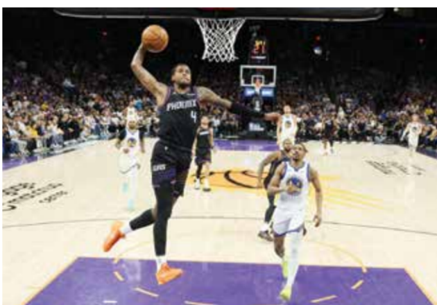
○ من مباراة صنز مع ووريزن.

وأمر واحد كان كبيراً متأكداً منه «بالتأكيد لن أذهب لتدريب فريق آخر في الدوري الموسم المقبل».