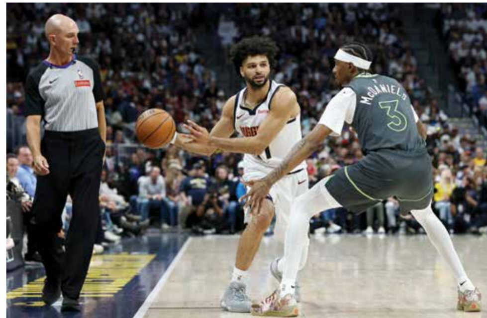
○ من مباراة ناغتش مع وولفز