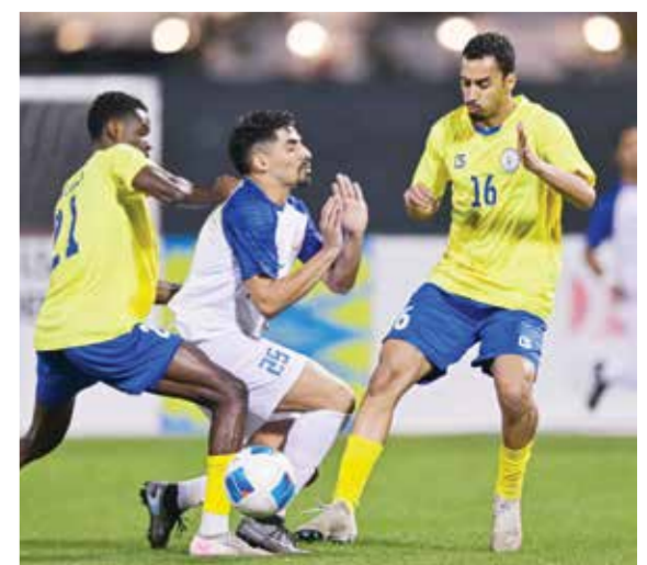
○ من لقاء قلالي ومدينة عيسى.