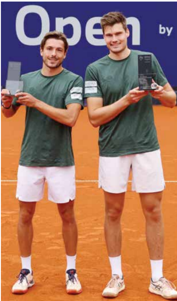
○ شنائير وفالنتر.