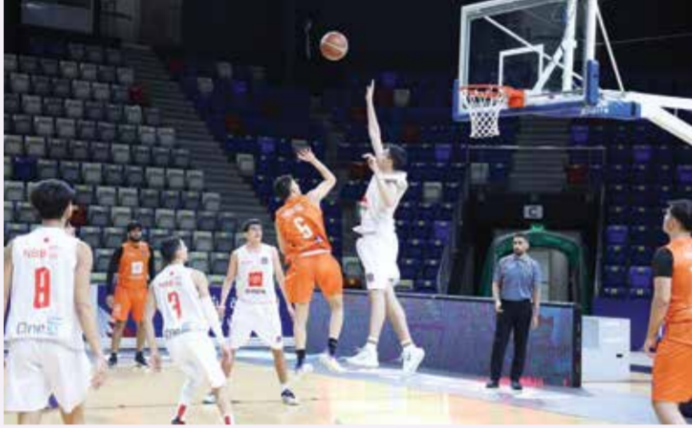
○ من لقاء مدرستي الهداية الخليفية والمحرق.