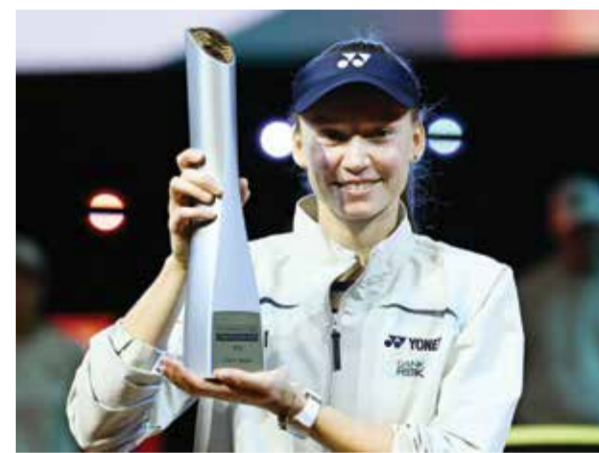
○ ريباكيينا (أ ف ب)