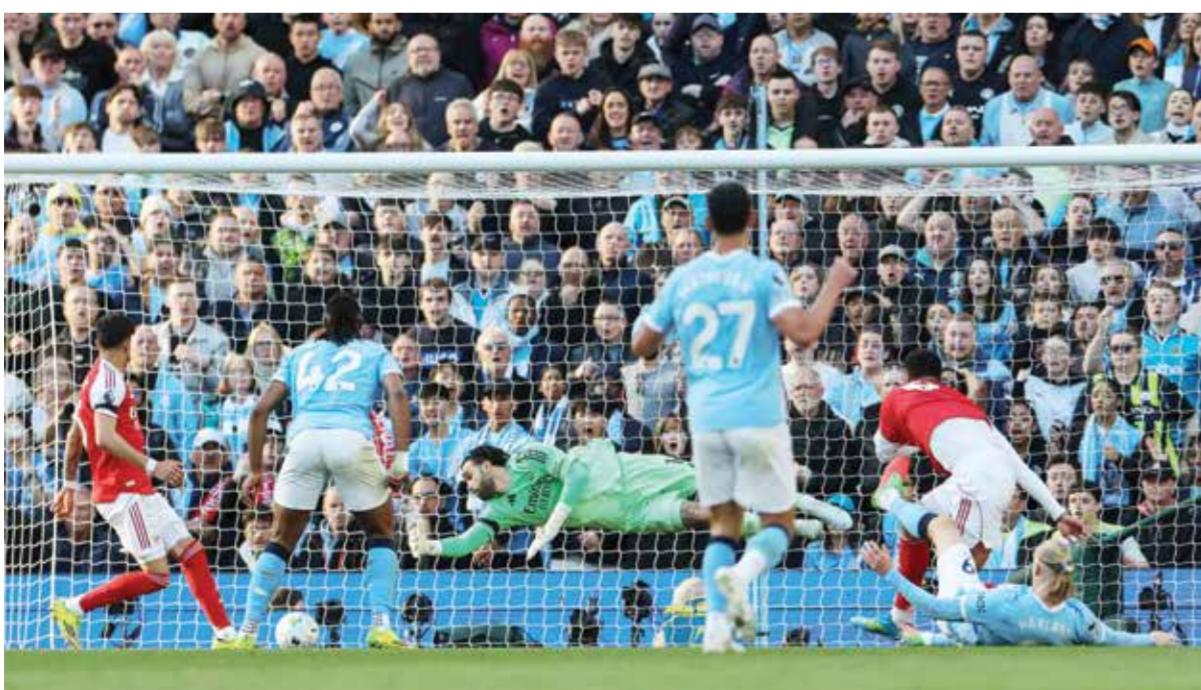
○ هالاند يحرز الهدف الثاني.