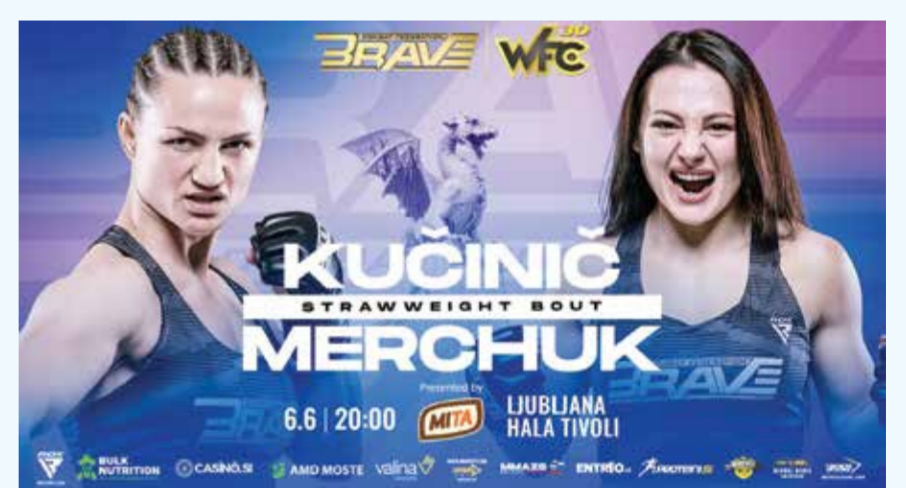
○ إعلان البطولة.