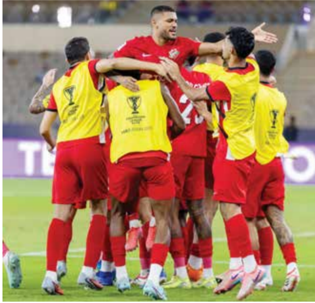
○ فرحة لاعبي شباب الأهلي.