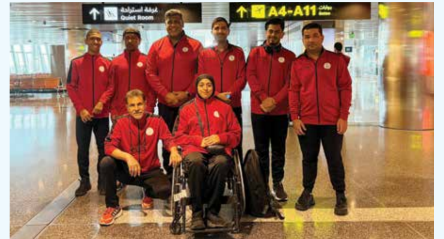
○ صورة جماعية.

اكتمل عقد المربع الذهبي في بطولة خالد بن حمد لكرة السلة للمدارس الثانوية في نسختها الأولى، بعد تأهل مدرسة الهداية الخليفية الثانوية ومركز ناصر العلمي والتقني إلى الدور نصف النهائي، وذلك ضمن منافسات الدور ربع النهائي، حيث فاز مركز ناصر على المدرسة الأمريكية بنتيجة (20-0) بعد انسحاب الأخير، فيما تغلبت الهداية الخليفية على مدرسة المحرق الثانوية بنتيجة (100-38). وفرضت مدرسة الهداية الخليفية أفضليتها على مجريات مواجهتها بفضل التوازن بين الأداءين الهجومي والدفاعي، إلى جانب دقة التصويب من