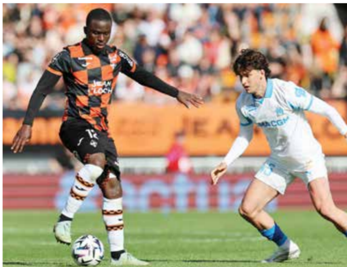
○ من لقاء توربان ومارسيليا

وأكد فيرله أن هونيس يشعّر بالراحة في شتوتغارت ويدرك قيمة المشروع الرياضي للنادي، مشدداً على أن المحادثات الحالية تدور حول مستقبل الفريق والأهداف المشتركة وليس حول الرحيل، علماً بأن عقد المدرّب مستمر حتى يونيو 2028.