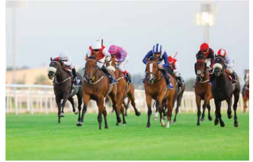
○ منافسات قوية يشهدها السباق.