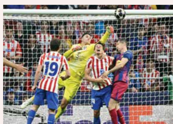
○ من مباراة أتلتيكو مدريد وبرشلونة.

الزاوية العليا للمرمى، ثم سجل أيمولا لوكمان هدف أتلتيكو في الدقيقة 31. وتفوق برشلونة في الاستحواذ بعد الاستراحة وحرمه تسلي تورييس من إضافة الهدف الثالث، بينما سيطر بيدري وجابي على خط الوسط. وأنهى برشلونة المباراة بعشرة لاعبين بعد طرد المدافع أريك جارسيا في وقت متأخر من المواجهة.