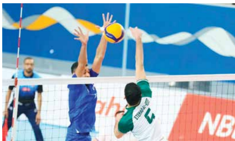
○ من لقاء النصر واتحاد الريف في الدور الأول