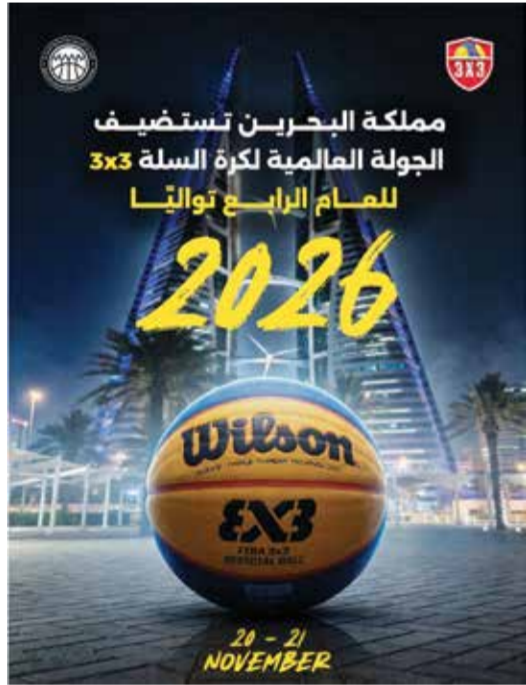
○ إعلان الاستضافة.

البطولات العالمية. وشكلت النسخة الختامية للجولة العالمية التي احتضنتها المنامة في نوفمبر الماضي، نموذجًا واضحًا لحجم التأثير الذي تحققه هذه الفعالية، إذ استقطبت نحو 7,500 زائر، وبُعثت إلى 234 دولة حول العالم، وسجلت أكثر من 3 ملايين دقيقة مشاهدة تلفزيونية، إضافة إلى 1.3 مليون دقيقة مشاهدة عبر يوتيوب، فيما بلغت القيمة الاقتصادية والإعلامية الإجمالية المنولدة للبحرين نحو 8.6 ملايين دولار أمريكي، منها 2.6 مليون دولار كأثر اقتصادي مباشر وغير مباشر. وتعكس هذه الأرقام بوضوح حجم العمل المؤسسي المتكامل الذي تبذله المملكة في سبيل إنجاح الحدث، سواء على صعيد البنية التحتية أو الجوانب التنظيمية والإعلامية، بما يعكس استمارةً طويلة الأمد في الاقتصاد الرياضي والسياحي. يأتي ذلك ضمن إطار ما تشهده لعبة كرة السلة 3x3 من توسع عالمي متسارع، إذ أصبحت جزءًا رسميًا من البرنامج الأولمبي، ما يعزز من أهميتها وقيمتها التنافسية والتسويقية، ويمنح الدول المستضيفة فرصة استثنائية للظهور على منصة رياضية عالمية ذات جماهيرية متنامية.