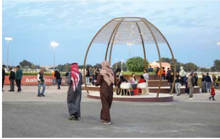
○ قرية الفعاليات تحتضن الجماهير.