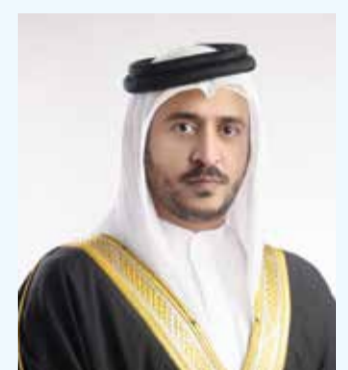
○ سمو الشيخ خالد بن حمد آل خليفة.

صدر عن سمو الشيخ خالد بن حمد آل خليفة النائب الأول لرئيس المجلس الأعلى للشباب والرياضة رئيس الهيئة العامة للرياضة رئيس اللجنة الأولمبية البحرينية قرار رقم (4) لسنة 2026 بشأن تعيين عضو بمجلس إدارة الاتحاد البحريني لرجبى كرة القدم. وجاء في القرار أنه بعد الاطلاع على قانون الجمعيات والأندية الاجتماعية والثقافية والهيات الخاصة العاملة في ميدان الشباب والرياضة والمؤسسات الخاصة الصادر بالمرسوم بقانون رقم (21) لسنة 1989 وتعديلاته وعلى النظام الأساسي الموحد للاتحادات الرياضية البحرينية