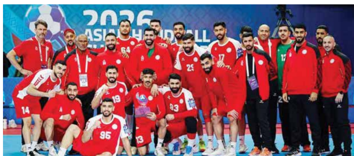
◦ منتخبنا الوطني الأول لكرة اليد.

◀ كسرنا قاعدة التراجع بعد الإحلال.. والعناصر الشابّة مكسب