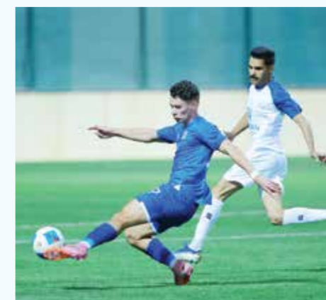
○ من لقاء المنامة ومدينة عيسى.

تغلب فريق الاتفاق على نظيره أم الحصم بنتيجة ثلاثة أهداف مقابل هدف، في اللقاء الذي جمعهما على استاد النادي الأهلي، ضمن منافسات الجولة السابعة عشرة من دوري الدرجة الأولى لكرة القدم للموسم 2026-2025. وبهذا الانتصار، حُضِن الاتفاق صدارته رافعاً رصيده إلى 43 نقطة، فيما توقف رصيد أم الحصم عند 24 نقطة. وفي المواجهة الثانية، خرج فريق المنامة بانتصار مثير على حساب مدينة عيسى بنتيجة أربعة أهداف مقابل هدفين، في اللقاء الذي أقيم على ملعب نادي الرفاع، ليرفع المنامة رصيده إلى 34 نقطة، بينما بقي رصيد مدينة عيسى عند 13 نقطة.