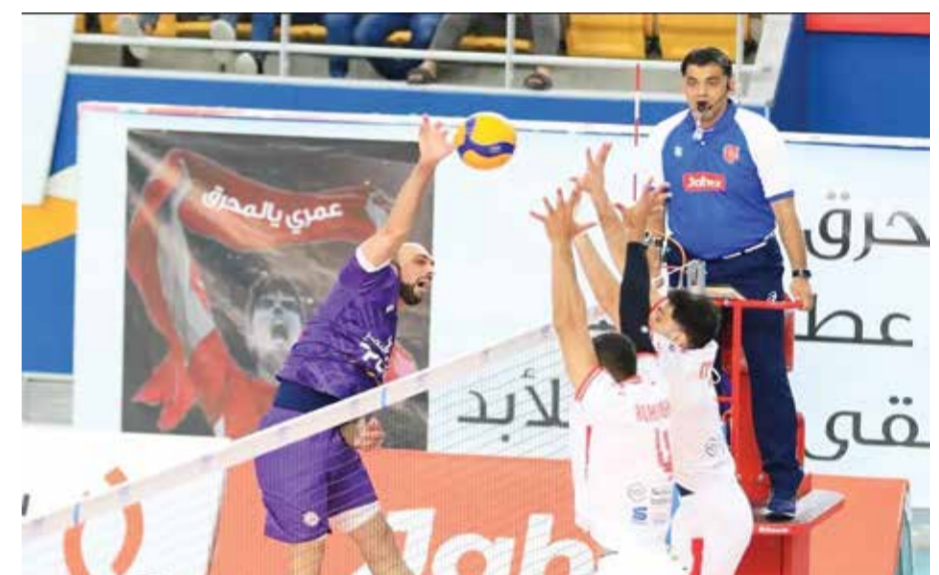
○ من لقاء دار كليب والمحرق.