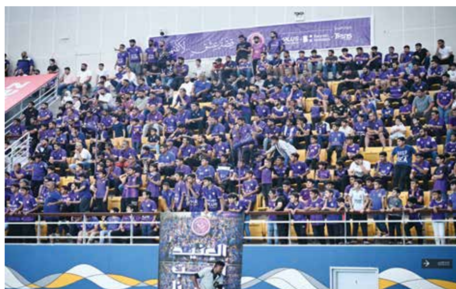
○ حضور جماهيري كبير.