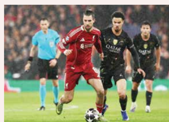
○ من مباراة سان جرمان وليفربول.

الزاوية العليا للمرمى، ثم سجل أيمولا لوكمان هدف أتلتيكو في الدقيقة 31. وتفوق برشلونة في الاستحواذ بعد الاستراحة وحرمه تسلي تورييس من إضافة الهدف الثالث، بينما سيطر بيدري وجابي على خط الوسط. وأنهى برشلونة المباراة بعشرة لاعبين بعد طرد المدافع أريك جارسيا في وقت متأخر من المواجهة.