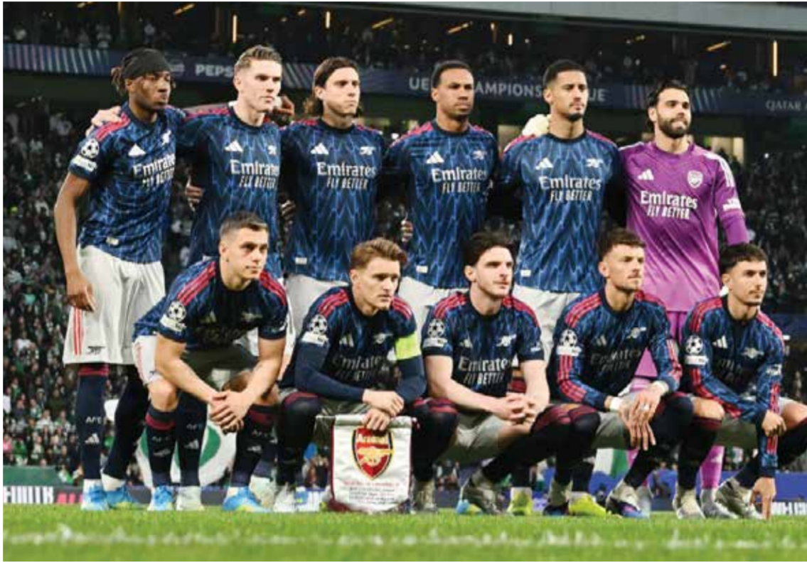
○ فريق أرسنال.