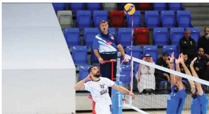
○ من لقاء المعامير والبستين في الدور الأول

وفي اللقاء الثالث، أطر فريق الاتحاد شبك بوري بأربعة أهداف مقابل هدف، في المباراة التي أقيمت على ملعب فيفا، ليرفع الاتحاد رصيده إلى 34 نقطة، فيما تجمد رصيد بوري عند 19 نقطة. وتعكس نتائج الجولة استمرار قوة الاتفاق في سباق الصدارة، في الوقت الذي يواصل فيه الرفاع الشرقي والمنامة ضغطهما في مراكز المقدمة، إلى جانب الاتحاد، ما يندرج بمنافسة محتدمة خلال الجولات المقبلة من المسابقة.