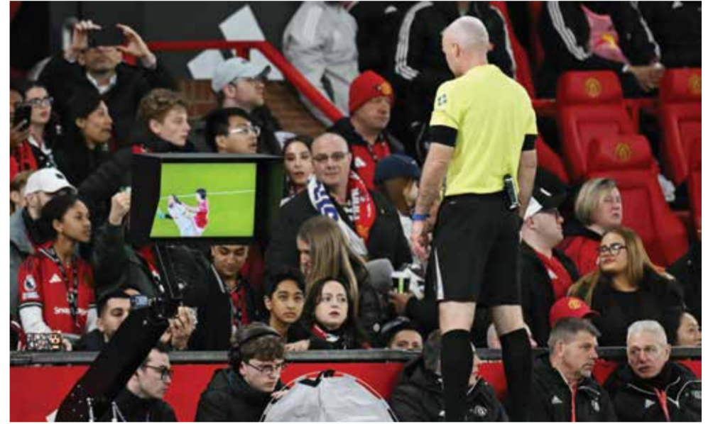
○ الحكم يستعين بتقنية فار.