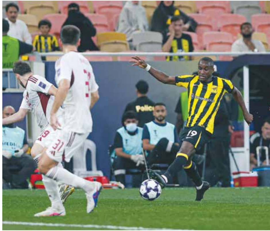
○ من مباراة الاتحاد والوحدة.