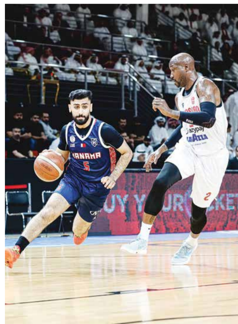
○ جانب من اللقاء.