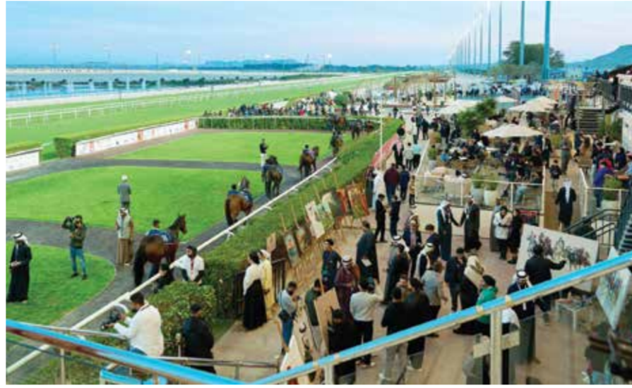
○ عودة الجماهير لسباق الخيل.