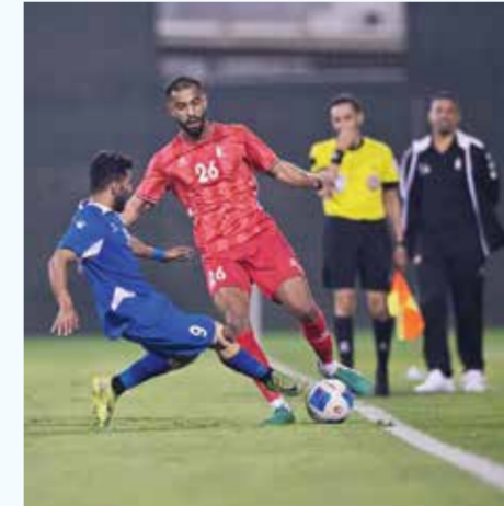
○ من لقاء الاتفاق وأم الحصم.