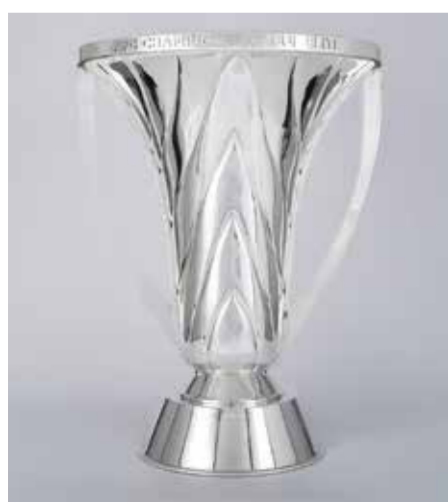
○ كأس أبطال آسيا للنخبة.

وقال الاتحاد في بيان: «يعزز هذا التوسيع الأخير التزام الاتحاد الآسيوي لكرة القدم بتقديم منصة قارية أكثر شمولية وقابلية للنمو التجاري، حيث يسهم في توسيع نطاق تمثيل نخبة كرة القدم في القارة، بما يضمن بقاء دوري أبطال آسيا للنخبة في طليعة المشهد الكروي العالمي، وتقديم تجربة رياضية مميزة للجماهير وكل المعنيين».