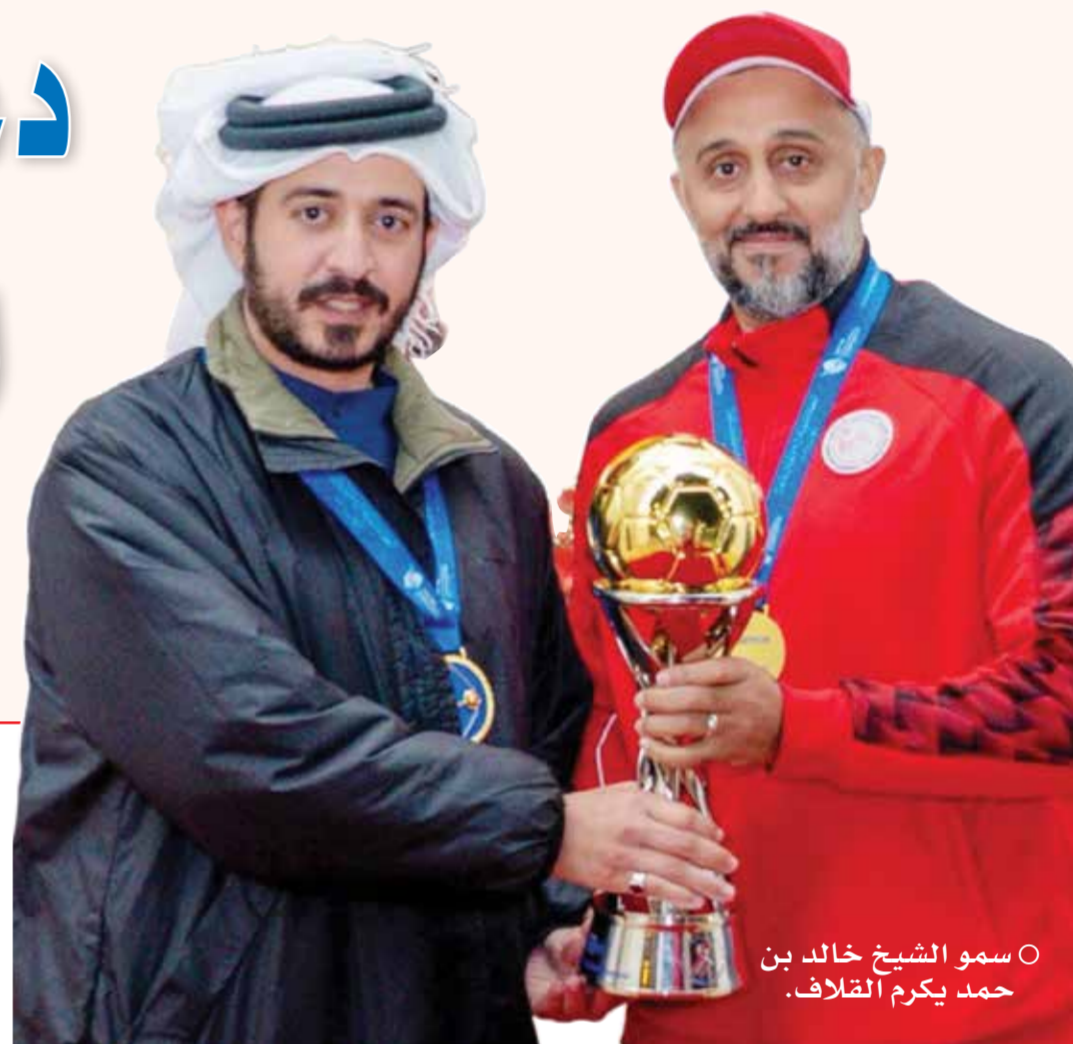
◦ سمو الشيخ خالد بن حمد يكرم القلاف.

◀ روح قتالية عالية وانضباط قادنا إلى التتويج المستحق