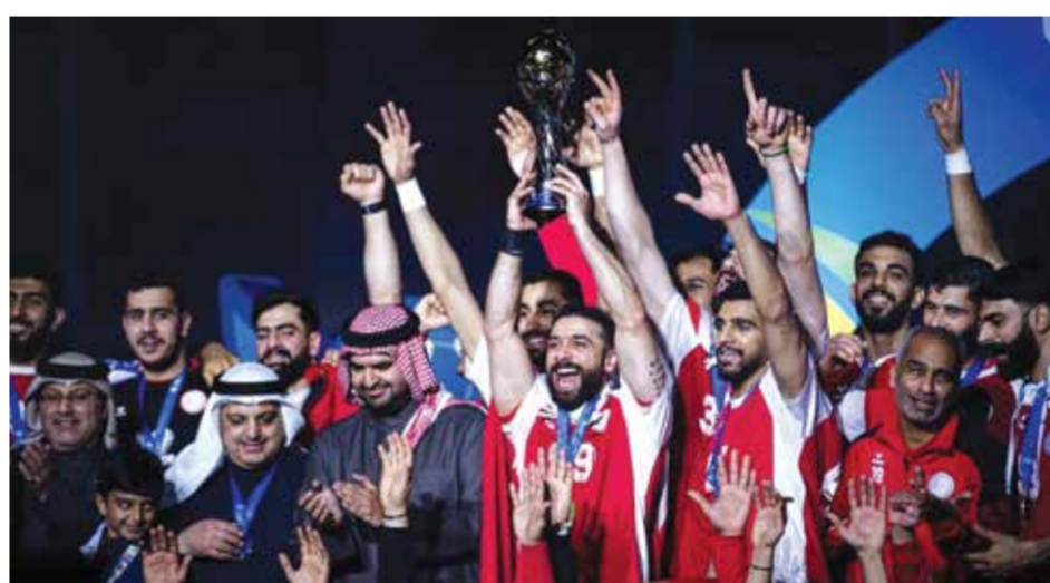
◦ من تتويج منتخبنا باللقب الآسيوي.