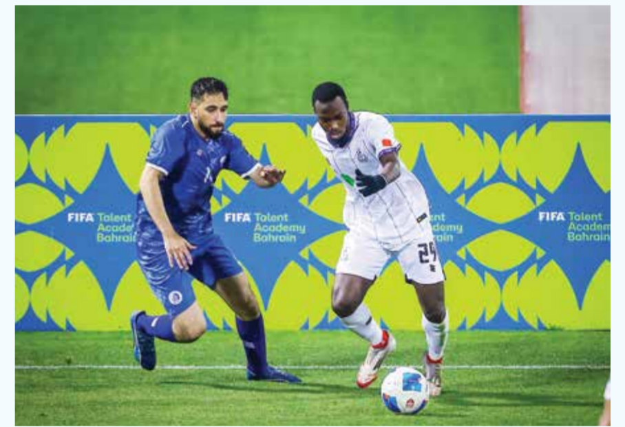
○ من لقاء الاتحاد وبوري.

أعلن الاتحاد البحريني لكرة السلة توقيع اتفاقية مع الاتحاد الدولي لكرة السلة (FIBA) تستضيف بموجبها مملكة البحرين الجولة العالمية لكرة السلة 3x3 للعام الرابع على التوالي وذلك خلال يومي 20 و21 نوفمبر المقبل، في خطوة تعكس الثقة الدولية المتنامية في قدرات المملكة التنظيمية، ومكانتها المتقدمة على خارطة استضافة الفعاليات الرياضية الكبرى. وتأتي استضافة هذا الحدث العالمي فمرة شراكة استراتيجية مثمرة بين اللجنة الأولمبية البحرينية ووزارة السياحة، ضمن رؤية وطنية متكاملة تهدف إلى استقطاب التظاهرات الرياضية العالمية، بما يسهم في تنشيط الحركة السياحية وتعزيز العوائد الاقتصادية، وترسيخ اسم البحرين كوجهة مفضلة للرياضة العالمية. كما أن تجديد الثقة بمملكة البحرين لاستضافة الجولة العالمية لكرة السلة 3x3 للعام الرابع على التوالي يعكس النجاح الذي حققته المنامة في تقديم نموذج تنظيمي احترافي يواكب أعلى المعايير الدولية، حيث ينظر إلى هذا الحدث باعتباره منصة رياضية واقتصادية وسياحية متكاملة، تعكس ما وصلت إليه البحرين من جاهزية وقدرة على استضافة كبرى