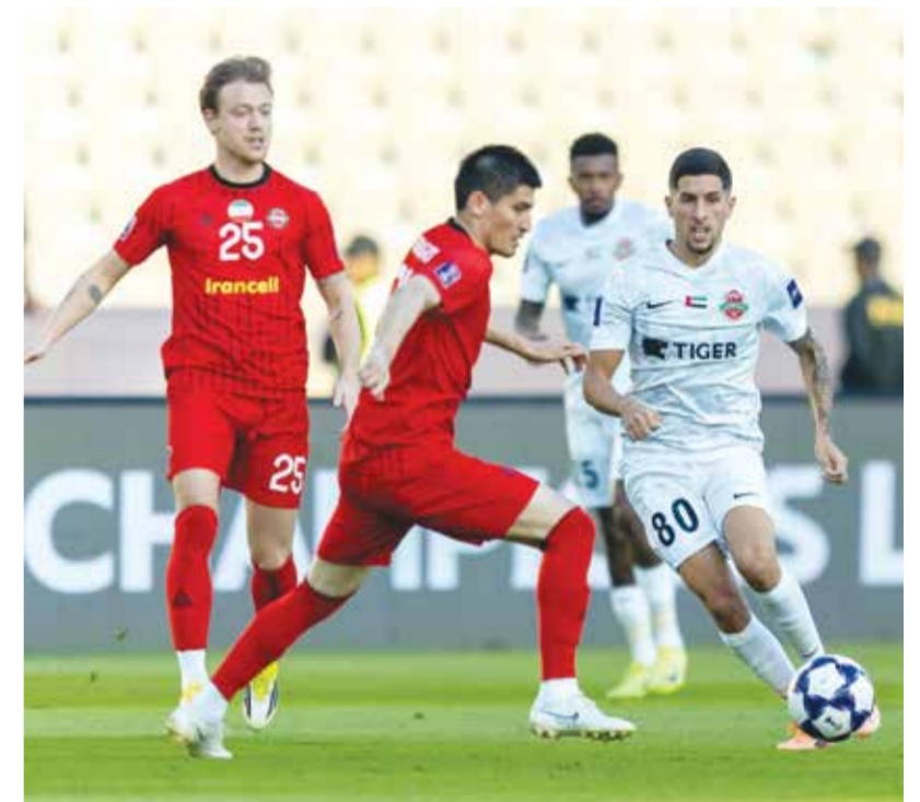
○ من مباراة شباب الأهلي وتراكتور.