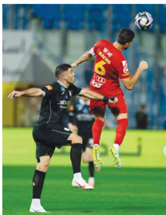
○ من مباراة القادسية والشباب.

الرياض - (أ ف ب): واصل القادسية هدر النقاط للمباراة الثالثة تواليًا بعدما سقط في فخ التعادل أمام ضيفه الشباب المنقوص عدديا 2-2 على أرضية ملعب الأمير محمد بن فهد أمس الثلاثاء، في المرحلة التاسعة والعشرين من الدوري السعودي لكرة القدم. وسجل الغاني بونسو بواه (16) والإيطالي ماتيو ريتيغي (75) هدفي القادسية، والأردني علي العزايزة (35 و54) ثنائية الشباب. وشهدت المباراة طرد الهولندي ويسلي هوديت مدافع الشباب بالبطاقة حمراء بسبب قيامه بحركة غير أخلاقية في الدقيقة 76.