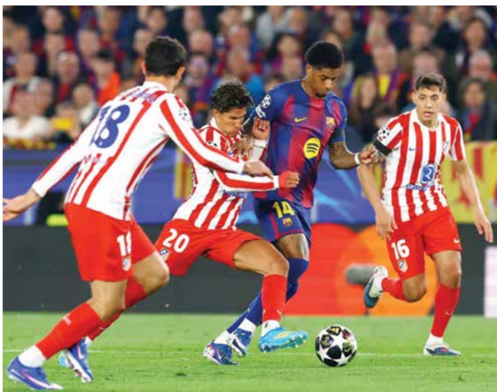
○ من لقاء برشلونة وأتلتيكو في الذهاب.

وغاب ساكا عن مباريات أرسنال الثلاث الأخيرة، في حين لم يكن القائد أوديجارد الذي عانى من إصابات متكررة هذا الموسم، جاهزا للمشاركة في خسارة أرسنال أمام بورنموث نهاية الأسبوع الماضي. أما تيمير، وهو أحد أفضل لاعبي أرسنال هذا الموسم، فكانت آخر مشاركة له قبل شهر في الفوز 0-2 على إيفرتون. ويدخل أرسنال لمواجهة اليوم الأربعاء على ملعب الإمارات متقدما بفارق ضئيل 1-0 على سبورتنغ بفضل انتصاره ذهابا الأسبوع الماضي بهدف متأخر للألماني كاي هافيرتس.