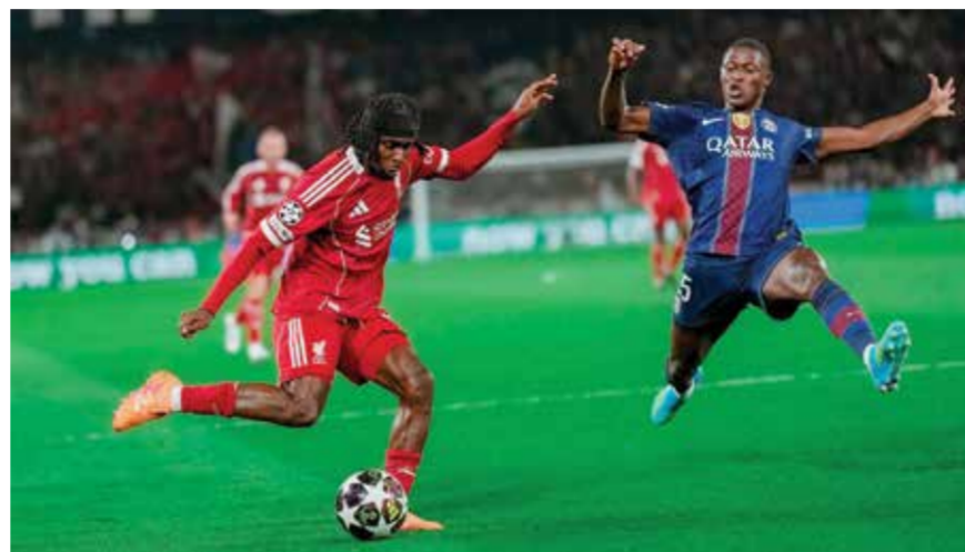
○ من لقاء سان جرمان وليفربول.