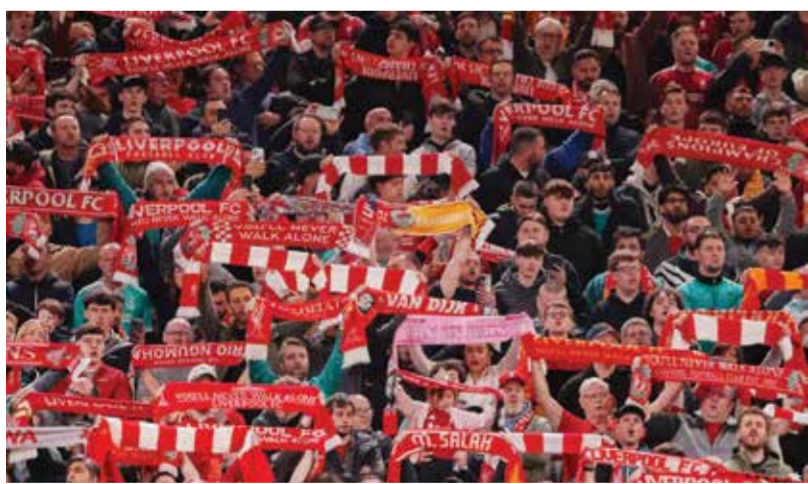
○ جماهير ليفربول.

وجّه المدرب الهولندي نداء حماسيا بعد الفوز على فولهام، في محاولة لاستعادة دعم الجماهير قبل مواجهة القارية، قائلا: «كان هذا فوزا هائلا. ليس فقط للنادي، بل أيضا لمباراة الثلاثاء. ليس فقط للاعبين، بل للجماهير أيضا. بعد خسارتين متتاليتين بنتيجة 4-0 و2-0، كان الجمع بحاجة ماسة لهذا الفوز».