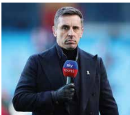
○ جاري نيفيل.

يشم رائحة اللقب ويمك أسبوعا للإعداد لهذه المواجهة المرتقبة».