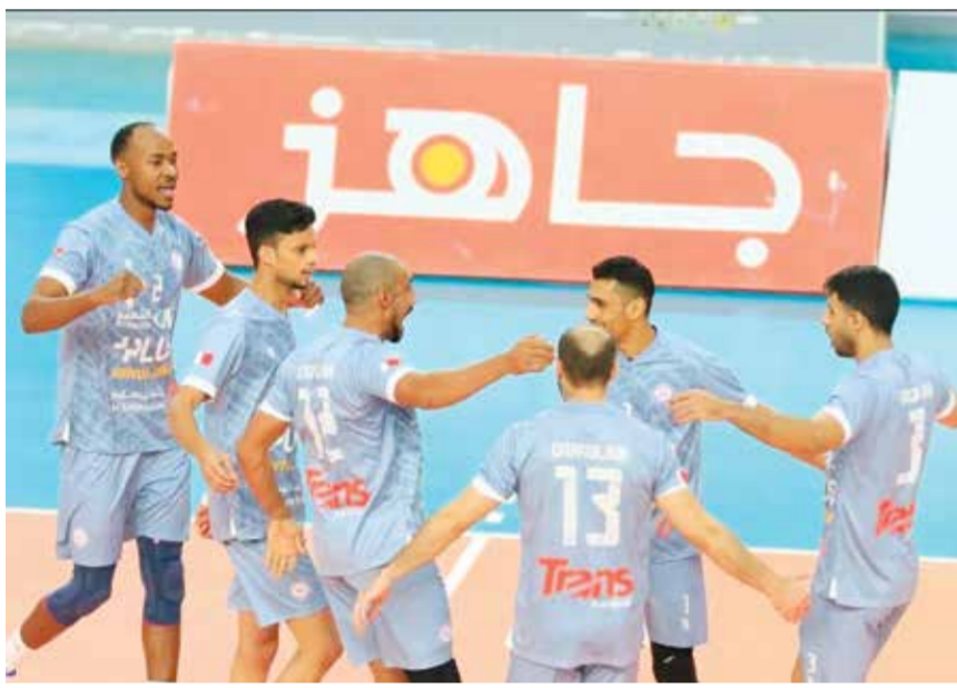
○ فريق دار كليب.