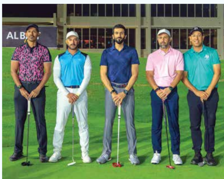
○ صورة جماعية.