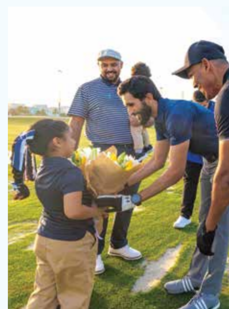
○ سموه يتسلم باقة ورد.