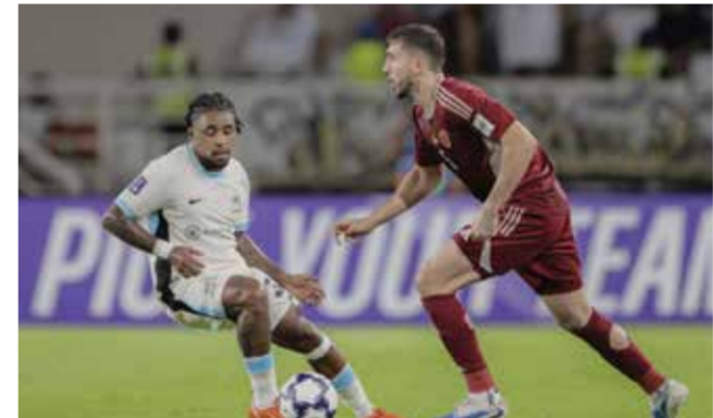
○ من لقاء سابق بين الاتحاد والوحدة.

جدة - (د ب أ): تحتضن مدينة جدة بالمملكة العربية السعودية اليوم الثلاثاء مواجهتين من العيار الثقيل ضمن منافسات دور الـ 16 من دوري أبطال آسيا للخبعة لمنطقة الغرب. ويلتقي الاتحاد السعودي مع الوحدة الإماراتي، كما يلتقي شباب الأهلي الإماراتي مع تراكتور الإيراني، تحت شعار «لا بديل عن الفوز»، لمواصلة المشوار نحو اللقب القاري.