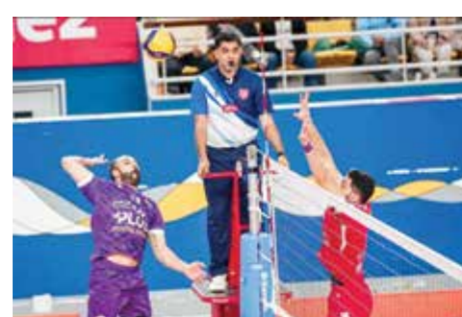
○ لقطة فنية من لقاء الدور الأول بين الفريقين.