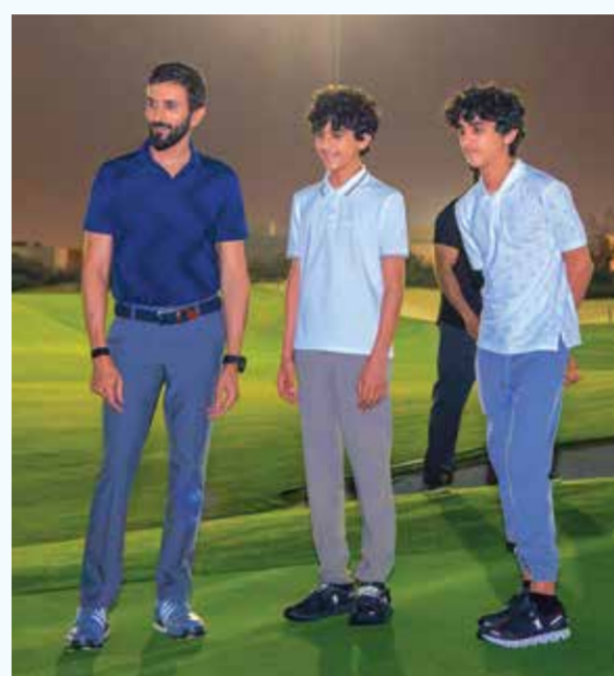
○ سموه مع الأبناء.