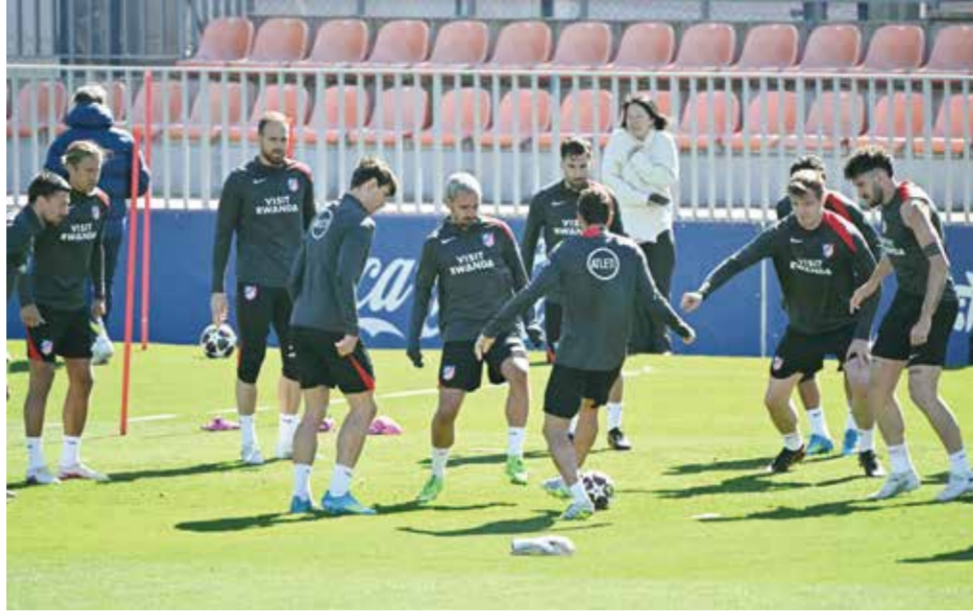
○ تدريبات أتلتيكو مدريد