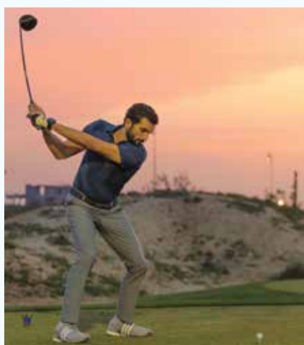
○ من مشاركة سموه في البطولة.