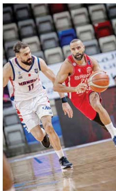
○ جانب من اللقاء الثاني بين المحرق والمنامة.