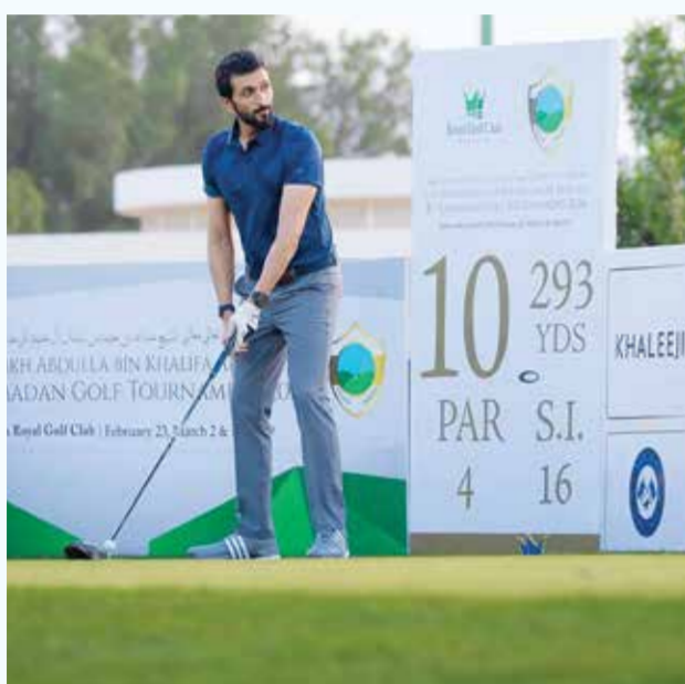
○ سموه يشيد بأجواء التنظيم للبطولة.