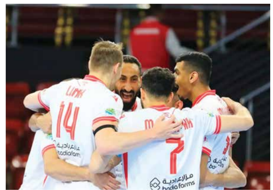
○ فريق المحرق.