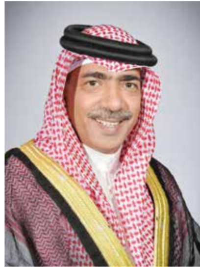
الشيخ علي بن محمد آل خليفة.

المجتمع بشكل عام والقطاع الرياضي بشكل خاص، مشيراً إلى أن الرياضة تعد منصة مهمة لتعزيز القيم الإيجابية وبناء جيل واع وطموح. وأضاف أن شركة جاهز الدولية حريصة على الوجود في مختلف الفعاليات الوطنية التي تعكس روح التنافس والتميز، مؤكداً تمنياته لجميع الفرق المشاركة بكأس سمو ولي العهد بالتحقيق وتقديم مستويات مشرفة تليق باسم البطولة ومكانتها.