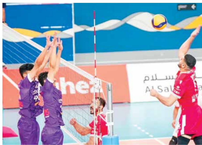
○ لحظة فنية من لقاء الدور الأول بين الفريقين.