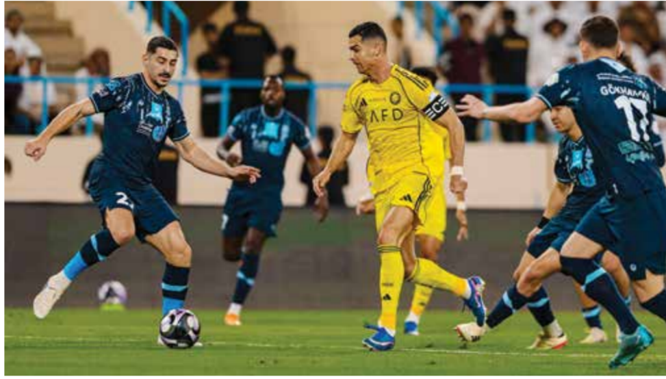
○ من مباراة النصر والأخدود.