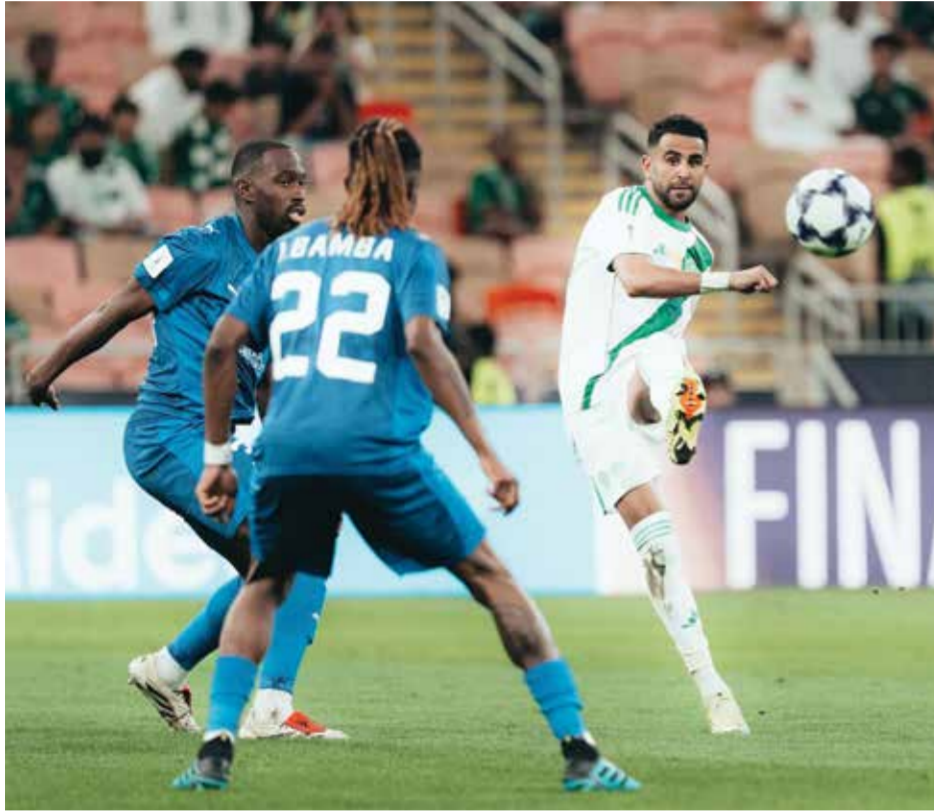
○ من لقاء الأهلي والدحيل.