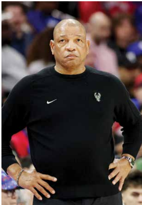
○ ريفرز (أ ف ب)