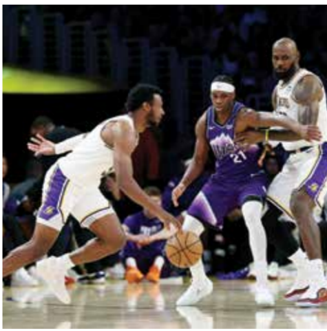
○ من مباراة ليكرز وجاز

أفضل سجل في الدوري، أمام فينكس 135-103 في ختام الموسم، في مباراة أشرك فيها الفريقان لاعبي الاحتياط.