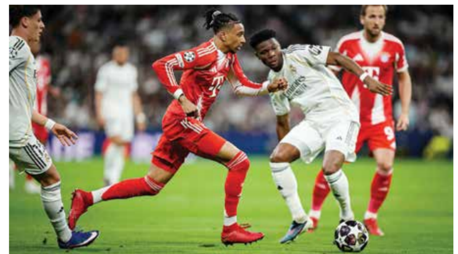
○ من لقاء ريال مدريد وبايرن.