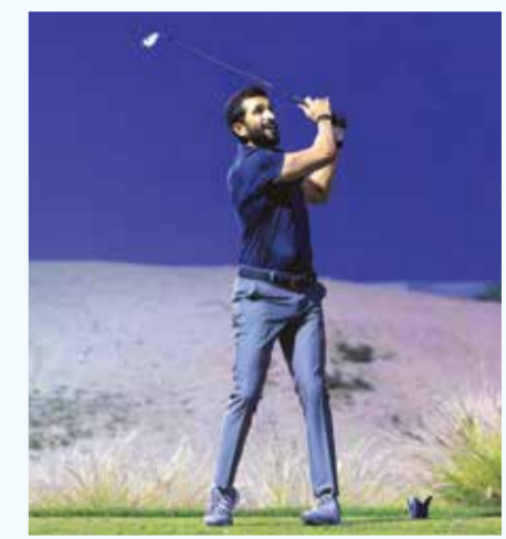
○ سمو الشيخ ناصر بن حمد آل خليفة.

شارك سمو الشيخ ناصر بن حمد آل خليفة ممثل جلالته الملك للأعمال الإنسانية وشؤون الشباب، في الجولة الأولى لبطولة المغفور له بإذن الله تعالى الشيخ عبدالله بن خليفة بن سلمان آل خليفة الخامسة للجولف، التي أقيمت على ملاعب النادي الملكي للجولف. وجاءت مشاركة سموه تأكيداً لحرصه المستمر على موازاة رياضة الجولف، ودعمًا للمشاركين وتشجيعاً لهم على تقديم أفضل مستوياتهم. وبهذه المناسبة، أكد سمو الشيخ ناصر بن حمد آل خليفة أن إقامة النسخة الخامسة من البطولة تحمل دلالات وقاء وعرفان لما قدمه