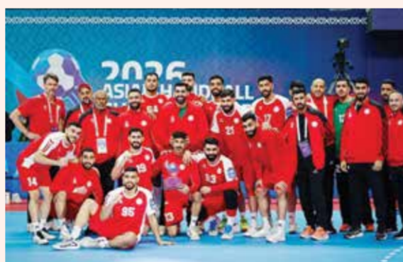
○ منتخب رجال اليد.

في المقابل يسعى فريق المنامة إلى فك عقدة منافسه المحرق، الذي تفوق عليه في سبع مواجهات هذا الموسم، ويدخل اللقاء بشعار الفوز فقط من أجل تمديد السلسلة وإنعاش آماله في المنافسة على اللقب، وقدم المنامة مستويات مميزة فسي المواجهتين السابقتين، وكان قريباً من تحقيق الفوز في إحداهما على أقل تقدير، إلا أن تماسك المحرق في اللحظات الأخيرة حال دون ذلك، ويعول الفريق على عناصره المميزة لتقديم أداء متكامل دفاعياً وهجومياً، بما يمنحه فرصة خطف الانتصار وفرض مواجهة رابعة.