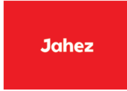
شعار شركة جاهز الدولية.