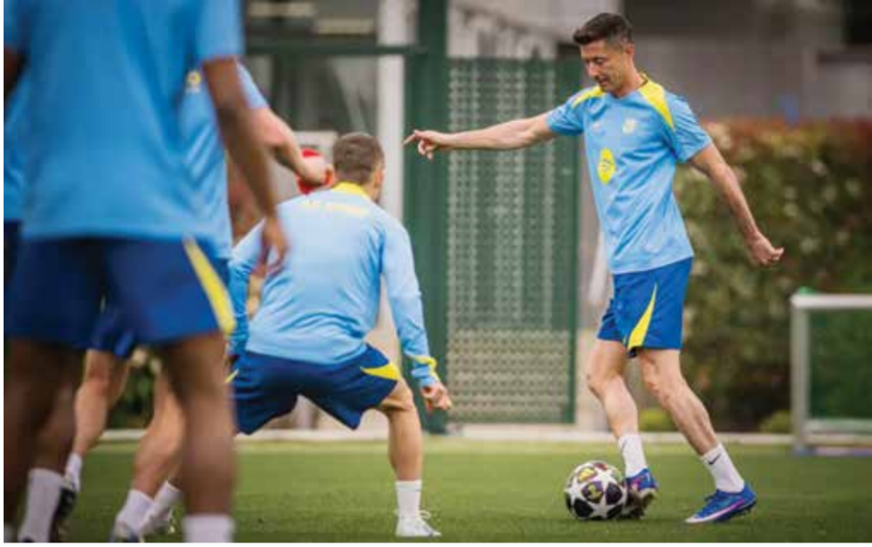
○ تحضيرات برشلونة.