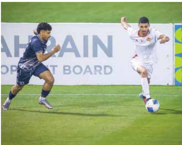
من لقاء الرفاع الشرقي والتضامن.