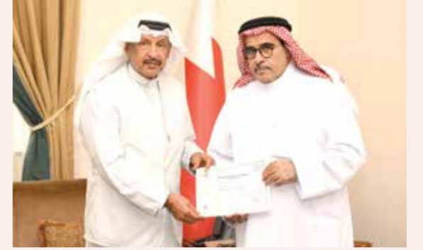
بن هندي يستقبل المناعي.

أشاد اللواء الركن الشيخ علي بن محمد آل خليفة رئيس الاتحاد البحريني لكرة الطائرة بالدور الفاعل الذي تضطلع به شركة جاهز الدولية في دعم الرياضة البحرينية، متمنياً رعايتها لمسابقة كأس سمو ولي العهد للكرة الطائرة للموسم الرياضي 2025-2026 وذلك في إطار الشركة المستمرة بين الطرفين، مؤكداً أن هذه الشراكة تعزز من نجاح البطولات وترتقي بمستوى التنظيم والمنافسة. وأكد رئيس الاتحاد أن دخول شركات رائدة مثل جاهز الدولية في دعم الفعاليات الرياضية يعكس الثقة الكبيرة في المسابقات المحلية، ويسهم في تحقيق تطورات الاتحاد نحو تطوير اللعبة وتوسيع قاعدة انتشارها، موجهاً الشكر إلى إدارة الشركة على دعمها واهتمامها بالحركة الرياضية