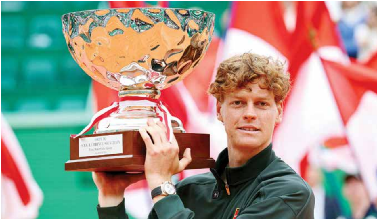
○ سينر. (أ ف ب)

لكن وبعد خروجين متتاليين من الدور الأول للأدوار الإقصائية، لم يتمكن الفريق هذا الموسم من حجز مقعد ولو في الملحق.