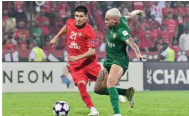
○ من لقاء سابق بين شباب الأهلي وتراكتور.