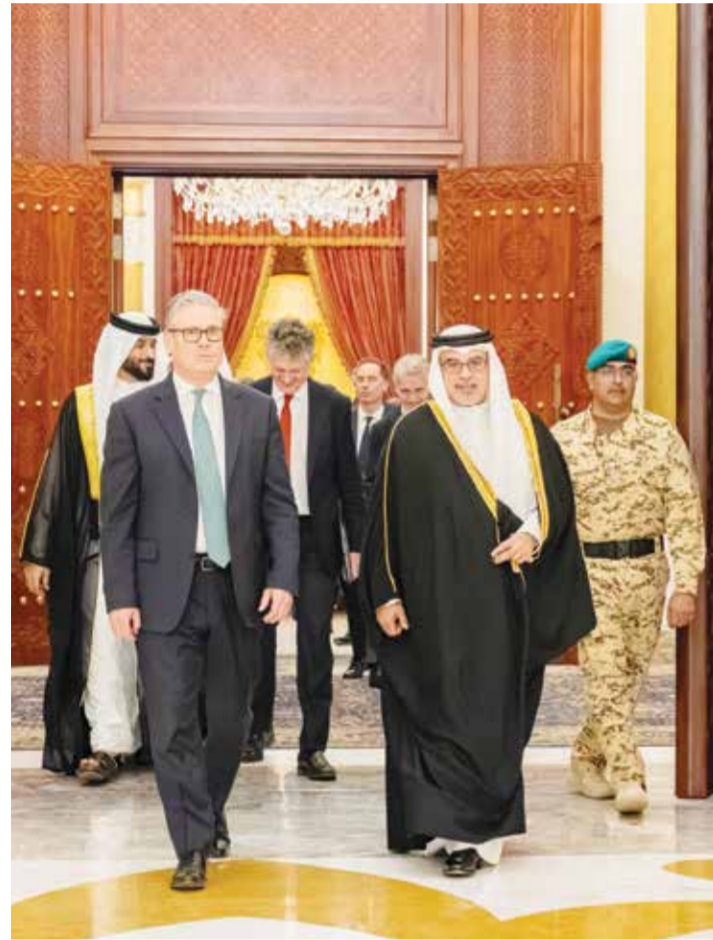
○ سمو ولي العهد رئيس الوزراء خلال استقبال رئيس الوزراء البريطاني.

الملك ورئيس الوزراء البريطاني يبحثان التطورات في المنطقة وتداعياتها الأمنية والاقتصادية