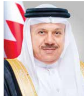
○ وزير الخارجية.

وأكد ضرورة استمرار التنسيق والتشاور وإزاء الأوضاع الراهنة، والعمل على حشد التأييد الدولي لإلزام إيران بالامتثال للقانون الدولي ومراعاة مصالح دول العالم، وإعادة فتح المضيق أمام الملاحة الدولية باعتباره ممرًا مائيًا دوليًا، وفقا لمعاهدة الأمم المتحدة لقانون البحار. من جانبه، أعرب وزير الخارجية عن بالغ الشكر والتقدير للوزراء والأميين العام على ما أبدوه من مواقف أخوية صادقة ودعم