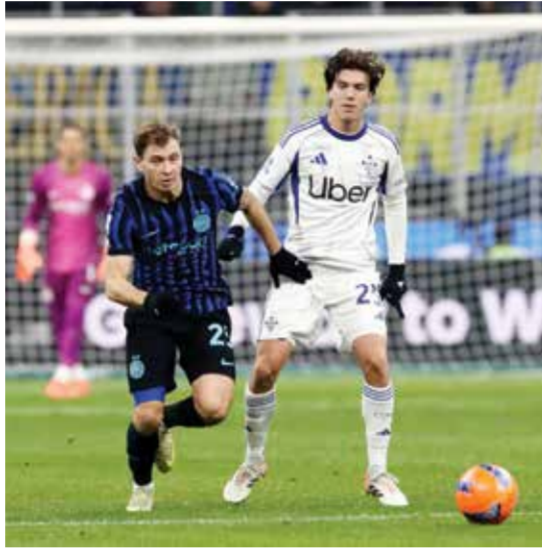
○ من لقاء سابق بين كومو وانتر.