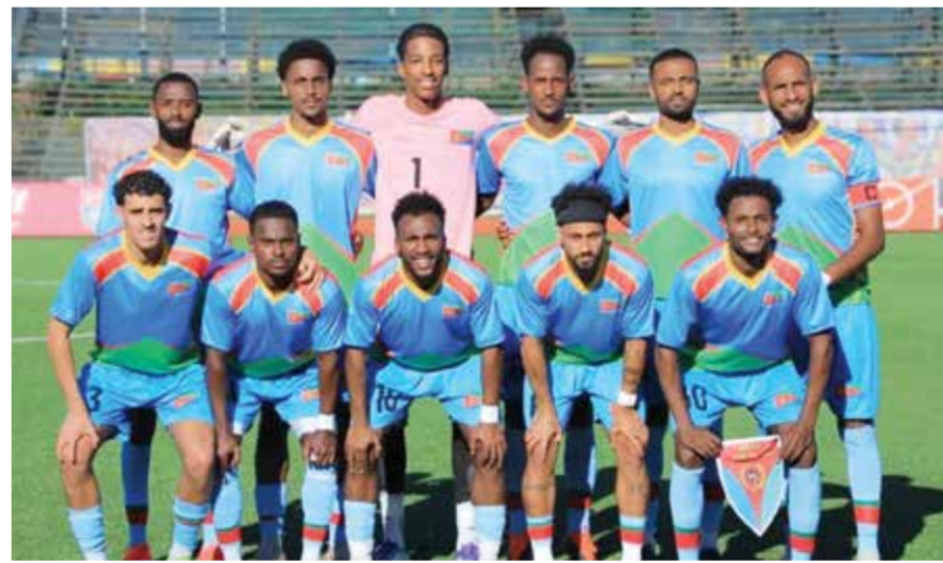
○ منتخب إريتريا.

أحد الأسباب الرئيسية لهذه الانشقاقات. وكان هؤلاء اللاعبون السبعة من بين 10 لاعبين دوليين ينشطون داخل إريتريا وجرى استدعائهم لهذه المباراة، في حين ينشط اللاعبون الـ14 الآخرون المدرجون ضمن قائمة الـ24 لاعبا المستدعين لها، في دوريات خارجية.