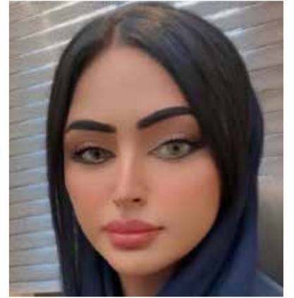
○ بقلم: فاطمة اليوسف.

الفقر والثراء في السينما.. لماذا تؤثر فينا الأعمال الفنية ولماذا نرى أنفسنا فيها؟ الفن هو المساحة التي نرى فيها أثر التغيرات الاقتصادية والاجتماعية على الإنسان الثراء المتآكل و الفقر المتصاعد لا يلتقيان في «عمارة يعقوبيان» في «حين ميسرة» لا مساحة للتجميل فالفقر ليس خلفية بل هو البطل الحقيقي