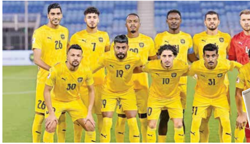
○ فريق الخالدية.