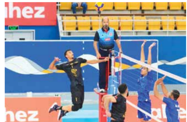
○ من لقاء الدور الأول بين الأهلي والنصر

فريق النجمة يأمل في قلب المعادلة وتقديم أداء قوي يربك حسابات منافسه. بشكل عام، تمثل مواجهتا اليوم محطة مهمة في مشوار الفرق الأربعة، سواء لتعزيز المواقع أو الإبقاء على آمال المنافسة، في ظل احتدام الصراع واقترب الدوري من مرحله الحاسمة.