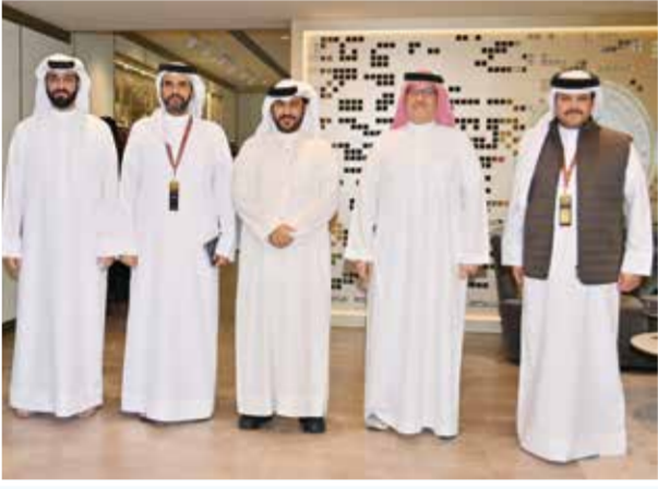
○ حضور رسمي كبير.