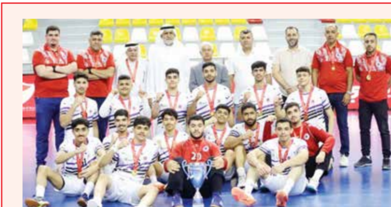
○ من تتويج ناشئي باربار بالكأس.

في المباراة الأولى، يلتقي فريقا النصر والأهلي عند الساعة 6:45 مساءً، وكانت مواجهة الدور الأول قد انتهت بفوز الأهلي بثلاثة أشواط دون مقابل، ما يمنحه أفضلية معنوية نسبية. ومع ذلك، يدخل الفريقان لقاء اليوم بطموحات مختلفة؛ فالنصر ضمن بالفعل وجوده ضمن الثمانية الأوائل، ويسعى إلى تثبيت أقدامه والخروج