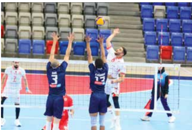
○ من لقاء الدور الأول بين المرخ والنجمة