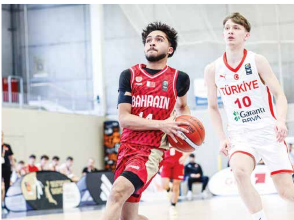
○ جانب من اللقاء.

وسيخوض منتخبنا مواجهة تحديد المركزين الحادي عشر والثاني عشر اليوم أمام المنتخب الصيني عند الساعة 2:15 ظهراً، في ختام مشاركته بالبطولة.