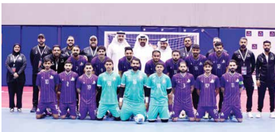
○ فريق بنك البحرين الإسلامي.

كما شملت القائمة البرازيلي كارلوس شوانكي، بعد موسم مميز مع نادي الريان القطري، توج خلاله بلقب البطولة الآسيوية للأندية في اليابان، فضلاً عن حصول فريقه على لقب غرب آسيا في المنامة. وضمت الترشيحات أيضاً الصيني تشاو يونغ، الذي يقود مشروعاً لتطويراً طموحاً مع منتخب الصين للسيدات، والذي حقق المركز الخامس