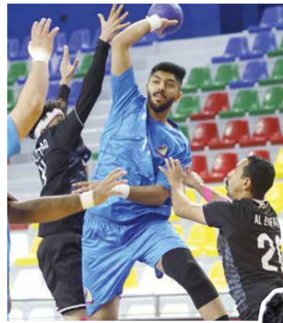
○ من لقاء الشباب والاتفاق