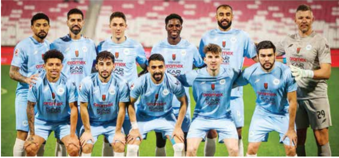
○ فريق الرفاع.