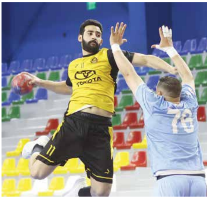
○ من لقاء الأهلي وسماهيج