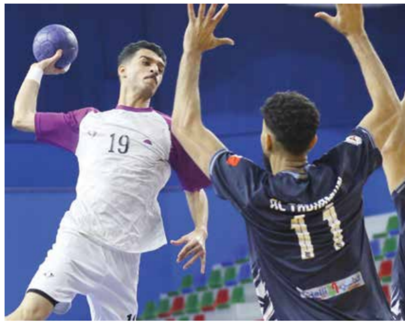
○ من لقاء باربار والتضامن