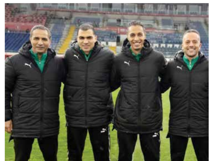
○ طاقم التحكيم.