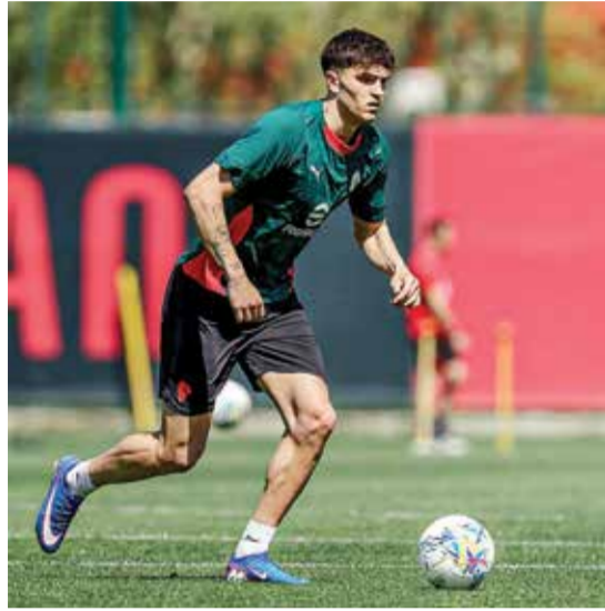
○ تدريبات ميلان.