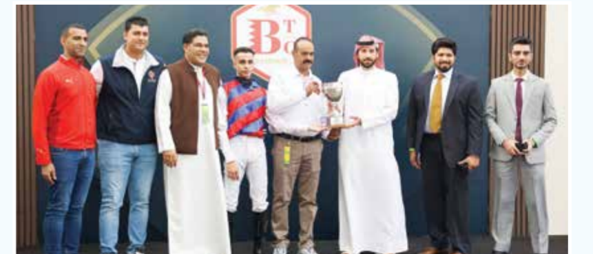
○ جانب من التتويج.