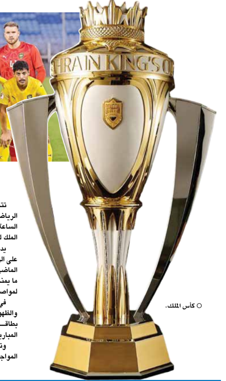
○ كأس الملك.