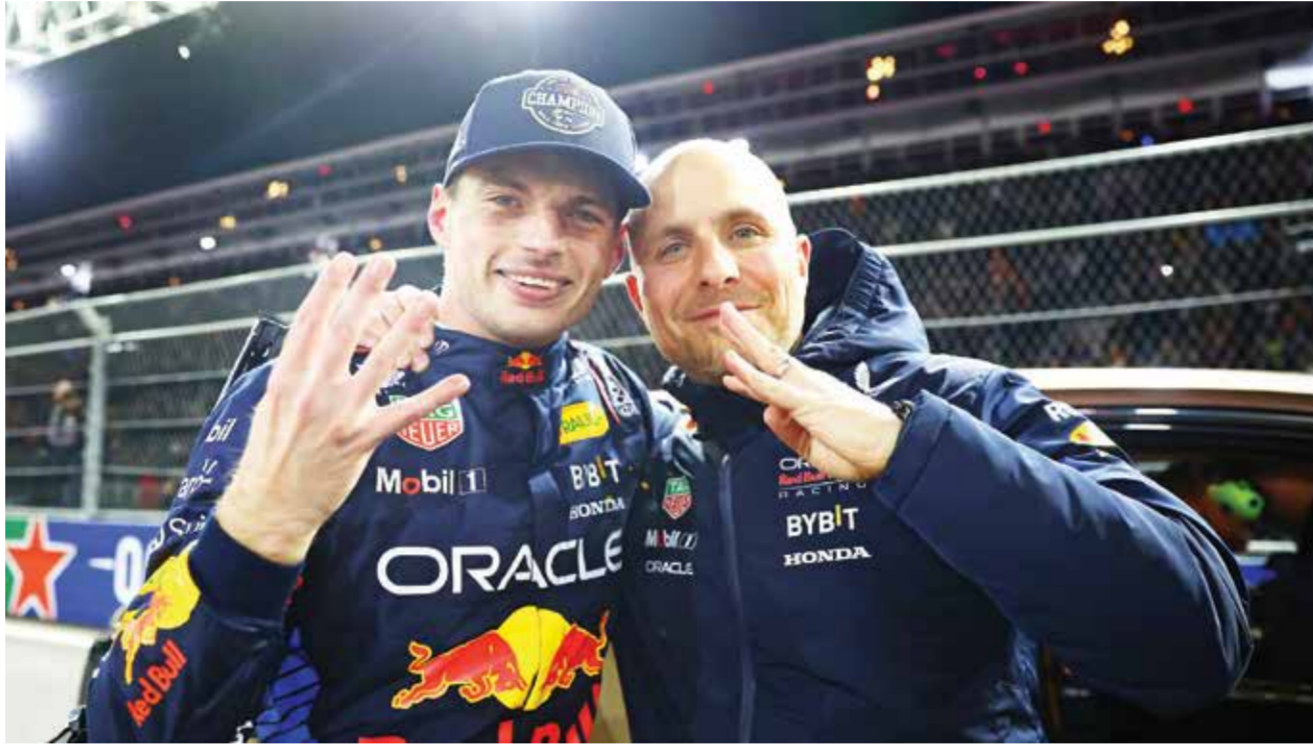
○ فيرستابن ولامبيازي.

ولدى سينر فرصة لاستعادة صدارة التصنيف، من غريمه الإسباني كارلوس ألكاراس.