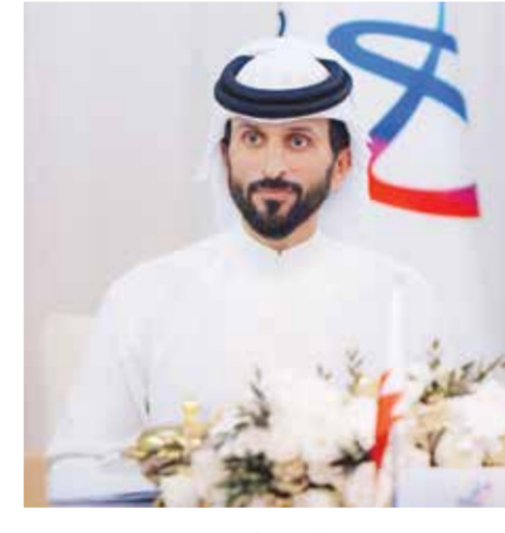
○ سمو الشيخ ناصر بن حمد.

مواصلة التركيز على التميز التشغيلي وسلامة العاملين في جميع مرافق المجموعة، بالإضافة إلى مواكبة المستجدات الإقليمية لضمان جاهزية الخطط التشغيلية.