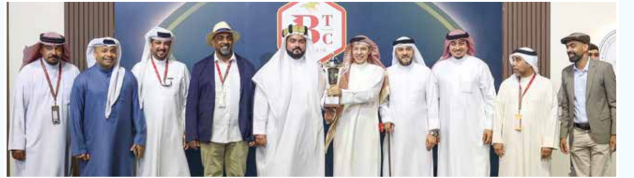
○ تتويج الفائزين.