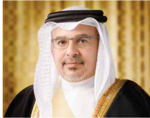
○ سمو ولي العهد رئيس الوزراء.

ترأس صاحب السمو الملكي الأمير سلمان بن حمد آل خليفة ولي العهد رئيس مجلس الوزراء اجتماع اللجنة التنسيقية الـ528 الذي عقد عبر الاتصال المرئي. وذكر حساب «أخبار سمو ولي العهد» على موقع التواصل الاجتماعي «إكس» أن اللجنة التنسيقية تابعت الخطط الاستباقية التي يتم تنفيذها والإجراءات المتخذة للتعامل مع تداعيات الاعتداءات الإيرانية العدائية الآتية على مملكة البحرين. واستعرضت اللجنة التنسيقية مستجدات مشاريع القوانين التي تتابعها اللجنة.