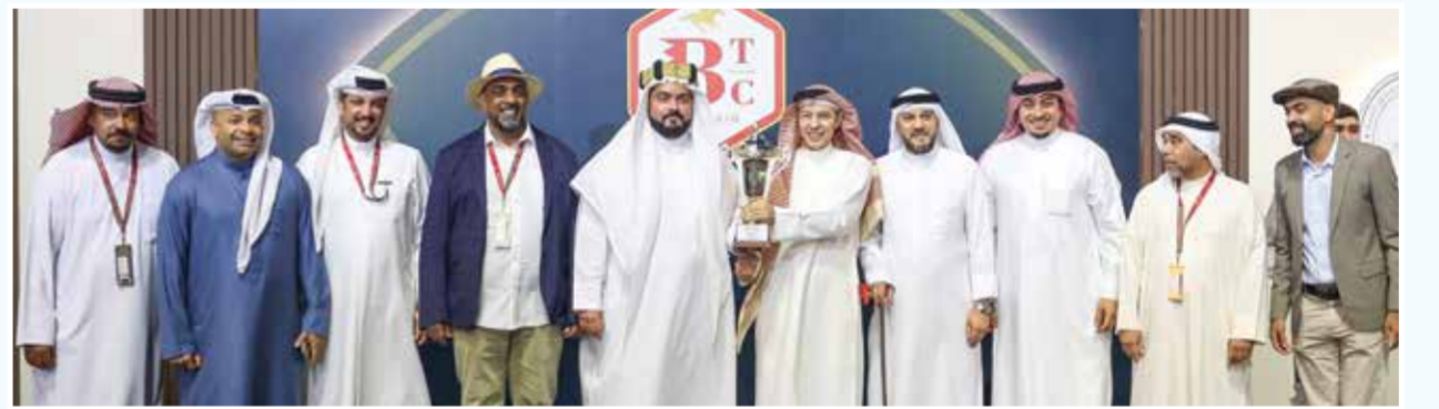
○ تتويج الفائزين.