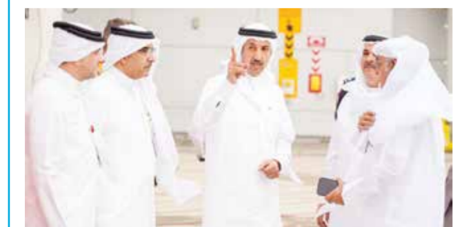
○ وزير المواصلات يتفقد سير العمل في مطار البحرين الدولي.

العربية السعودية، التي أسهمت في تمكين طيران الخليج من مواصلة عملياتها في ظل الاعتداءات الإيرانية الآتية. بدوره قام د. الشيخ عبدالله بن أحمد آل خليفة وزير المواصلات والاتصالات بزيارة تفقدية لمطار البحرين الدولي للاطلاع على سير منظومة العمل المتكاملة، والوقوف على جاهزية الاستعدادات والإجراءات في المطار بالتزامن مع مغادرة أولى رحلات الناقل الوطنية «طيران الخليج».