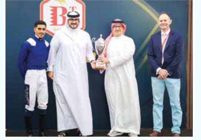
○ سمو الشيخ عيسى بن سلمان يتسلم كأس الميل من نبيل خالد كانو.