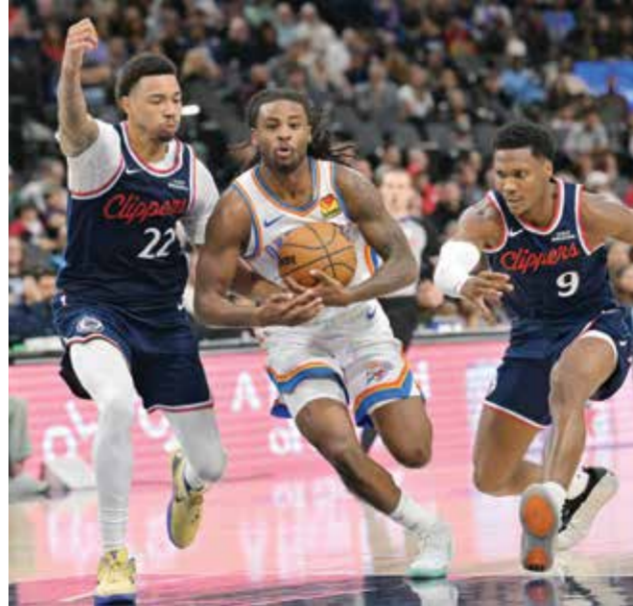
○ من لقاء ثاندر وكليبرز

ويعني فوز حامل اللقب أن سان أنتونيو سبيرز سيتألق حسم المركز الثاني في الغرب.