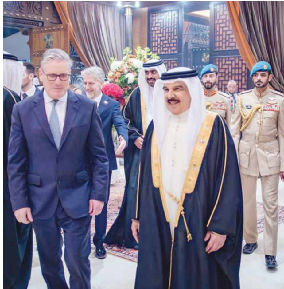
○ جلالة الملك المعظم يستقبل رئيس الوزراء البريطاني.

الإشادة بتضامن المملكة المتحدة ودعمها للبحرين