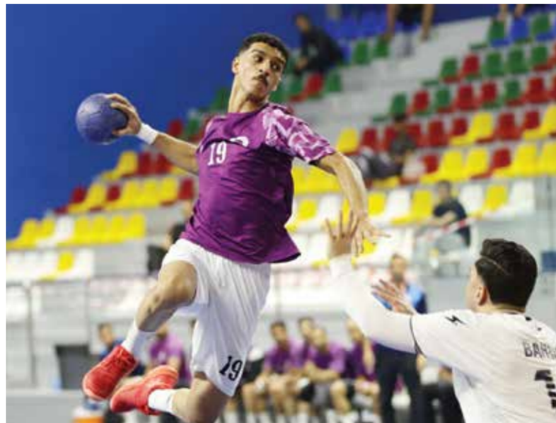
○ من لقاء باربار والبحرين في القسم الأول.

في المواجهة الأولى، يدخل باربار للقاء وهو في المركز الرابع برصيد (43 نقطة)، بعدما ضمن تأهله رسمياً إلى الدور الربعي، حيث يسعى إلى إنهاء مشواره في الدور التمهيدي بانتصار يعزز جاهزيته قبل الدخول في الأدوار الحاسمة، مع الحفاظ على نسقته التصاعدي. في المقابل، يخوض البحرين المباراة وهو في المركز الأخير