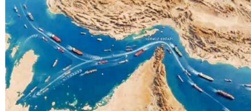
○ مضيق هرمز.

للدول المطلة على المضائق عرقلة هذا الحق أو تعليق المرور».