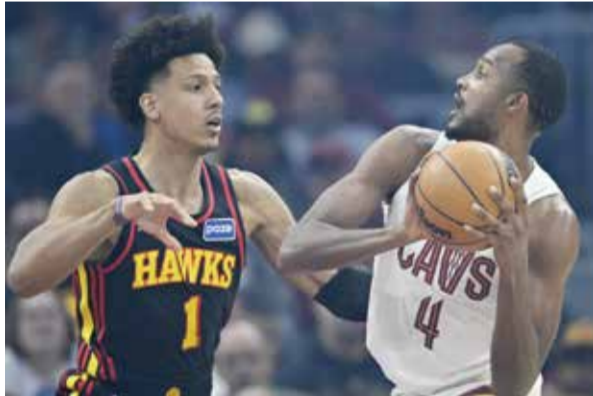
○ من لقاء كافاليري و هوكس.

وعمل لامبيازي مع فيرستابن منذ انضمام السائق الهولندي إلى ريد بول قبل عشرة أعوام، علماً بأن الأخير توج بلقبه العالمي الرابع