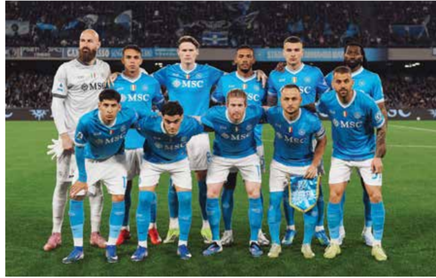
○ فريق نابولي.