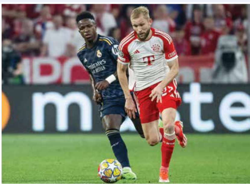
○ من لقاء سابق بين ريال مدريد وبايرن.

في الدوري حيث تضاعفت حظوظه في الظفر باللقب، بعدما بات يتخلف بفارق سبع نقاط عن غريمه التقليدي برشلونة المتصدر، فمات بالتالي المسابقة القارية العريقة الوحيدة أمامه لإنقاذ موسمه. ولم تكن الاستعدادات مثالية لحامل لقب دوري أبطال أوروبا 15 مرة قياسية، قبل خوض ربع النهائي الـ22، لكن سجله الملكي لا يُجادل فيه، إذ بلغ نصف النهائي 17 مرة (رقم قياسي). ويعد بايرن النادي الوحيد الذي شارك في ربع نهائي دوري أبطال أوروبا أكثر من ريال مدريد (24 مرة)، لكن ذلك لا يضمن شيئاً، إذ إن بطل أوروبا ست مرات هو أيضاً الأكثر خروجاً من هذا الدور (10 مرات).