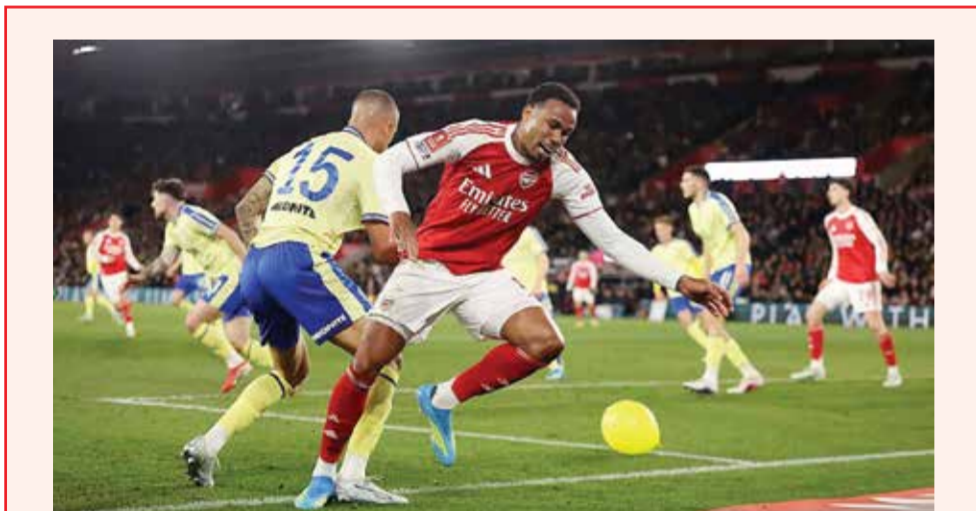
○ من لقاء سابق بين أرسنال وسبورتينغ.

مدريد – (أ ف ب): يزور بايرن ميونخ الألماني العاصمة الإسبانية لمواجهة ريال مدريد اليوم الثلاثاء في ذهاب الدور ربع النهائي من دوري أبطال أوروبا لكرة القدم، مع جرعات ثقة عالية، حيث يبدو أكثر الأندية تكاملاً ومدعوماً بعودة محتملة لهدافه الإنجليزي هاري كاين. عاني ريال، حامل الرقم القياسي بعدد الألقاب في دوري الأبطال (15)، من موسم صعب مليء بالتقلبات، لكنه اعتمد على تحقيق نتائج غير متوقعة في المسابقة القارية الأم. وفي وقت بدأ أن سحر النادي الملكي في دوري الأبطال قد بدأ يتلاشى، قدم ريال أفضل أداء له هذا الموسم ليسحق مانشستر سيتي الإنجليزي بقيادة مدربه الإسباني بيب غوارديولا في ثمن النهائي (5-1 باجمالي المباراتين).