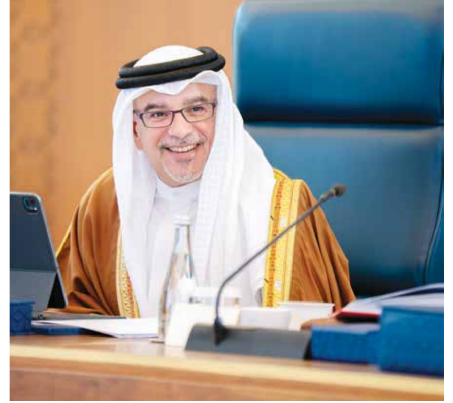
○ سمو ولي العهد رئيس الوزراء يتراش جلسة مجلس الوزراء.

أشاد مجلس الوزراء بالكفاءة العالية التي يتحلى بها جميع رجال قوة دفاع البحرين والحرس الوطني ووزارة الداخلية وجميع الأجهزة العسكرية والأمنية والمدنية، كما أثنى المجلس على الدور الإيراني الأتم، الذي أدى إلى إصابة مواطنين وتأثر منازلهم وكذلك تأثر مصالح المدنيين وسلامتهم، وجدد المجلس تأكيد أهمية الالتزام بقرار مجلس الأمن الدولي التابع للأمم المتحدة رقم 2817، الذي أدين الاعتداءات الإيرانية الأتمة، التي تمثل انتهاكاً صارخاً للقوانين الدولية، وطالب إيران بالوقف الفوري لهذه الهجمات وأي أعمال عنائية أخرى تستهدف الأعيان المدنية في دول المنطقة. جاء ذلك خلال ترؤس صاحب السمو الملكي الأمير سلمان بن حمد آل خليفة ولي العهد رئيس مجلس الوزراء الاجتماع الاعتيادي الأسبوعي لمجلس الوزراء الذي عقد أمس بقصر القضيبة. كما تابع المجلس ما تم بشأن تنفيذ التوجيهات الملكية السامية لحضرة صاحب الجلالة الملك حمد بن عيسى آل خليفة ملك البلاد المعظم، وأمر صاحب السمو الملكي ولي العهد رئيس مجلس الوزراء بتعويض المواطنين جراء الاعتداءات الإيرانية الأتمة التي أسفرت عن تضرر عدد من المنازل والمركبات.