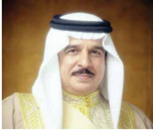
○ جلالة الملك المعظم.