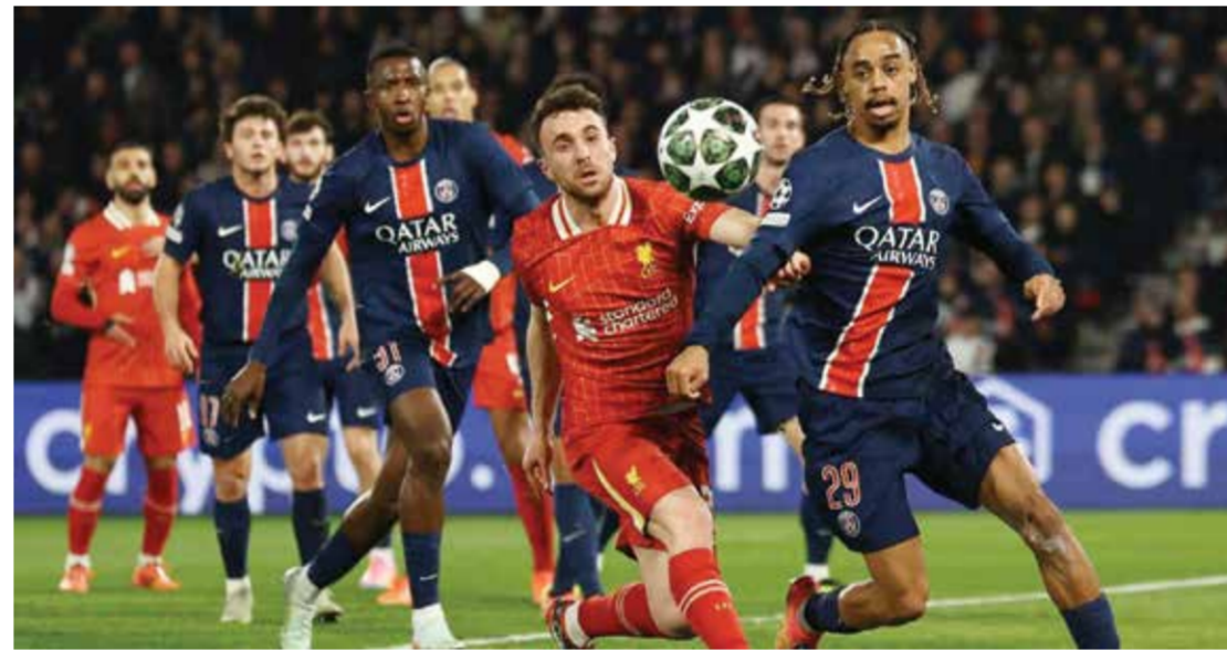
○ لقاء سابق بين ليفربول وسان جرمان.

الباريسي ليفربول، بطل أوروبا ست مرات والذي سيسعى إلى تضميد جراحه بعد هزيمة قاسية تلقاها نهاية الأسبوع أمام مانشستر سيتي (4-0) في ربع نهائي كأس إنجلترا، فضلاً عن رد الاعتبار من سان جرمان الذي أخرجه من ثمن نهائي المسابقة الموسم الماضي في طريقه إلى اللقب. في المقابل، يدخل رجال المدرب الإسباني لويس أنريكي المباراة بمعنويات عالية عقب فوزه الكبير على تولوز 3-1 الجمعة، وسيضعون نصب أعينهم إقصاء ناد إنكليزي جديد في دوري الأبطال، بعدما سحقوا تشلسي 2-8 في مجموع مباريات ثمن النهائي.