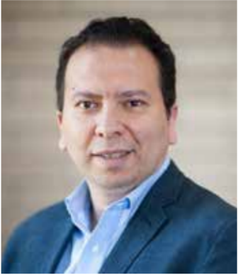
بقلم: د. أحمد عبد ربه ○

يمكن احتواؤها بسهولة، بل كبدائية محتملة لفوضى إقليمية أكبر. أما عن الفئات التي مازالت أكثر تأييدا للحرب، فالجمهوريون يتأتون في المقدمة، لكن حتى هنا يجب توخي الحذر من التبسيط المخل لقراءة هذا التأييد؛ فيحسب بيانات مركز «بيو» للأبحاث المنشورة في 52 مارس 2026، وافق 96% من الجمهوريين وهؤلاء المبالين للحزب الجمهوري على الضربات الأمريكية ضد إيران، مقابل 21% فقط من الديمقراطيين وهؤلاء المبالين لهم.