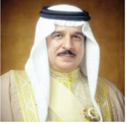
○ جلالة الملك المعظم.

قصيدة مرفوعة إلى مقام سيدي حضرة صاحب جلاله الملك حمد بن عيسى آل خليفة ملك مملكة البحرين المعظم حفظه الله ورعاه، وأيده على كل من عاداه: