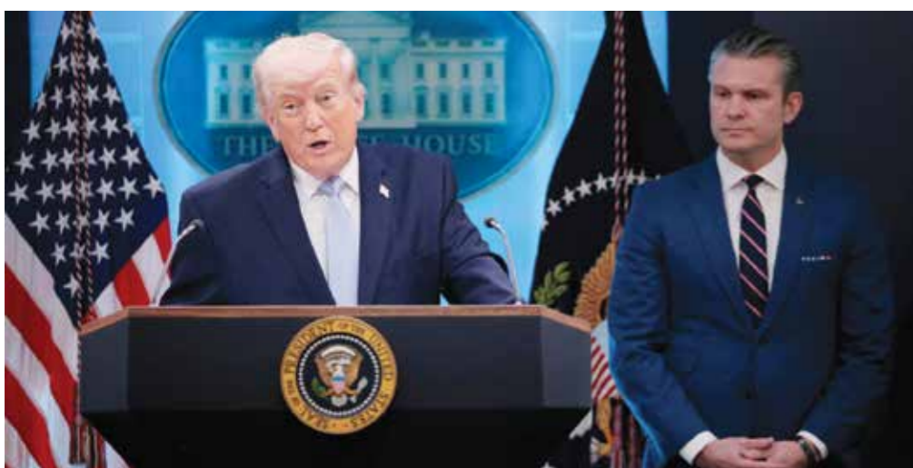
○ ترامب متحدثاً في المؤتمر الصحفي بالبيت الأبيض والى جانبه وزير حربه.

” يجب التوصل إلى اتفاق مقبول قبل انتهاء مهلة الثلاثاء