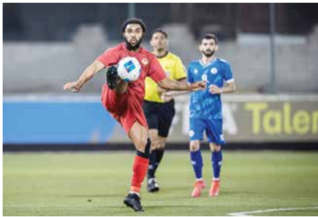
○ من لقاء الرفاع الشرقي وبوري.

وبهذا الانتصار، رفع الحالة رصيده إلى 29 نقطة مواصلًا تقدمه في سلم الترتيب، بينما بقي قلالي عند 6 نقاط في المركز الأخير.