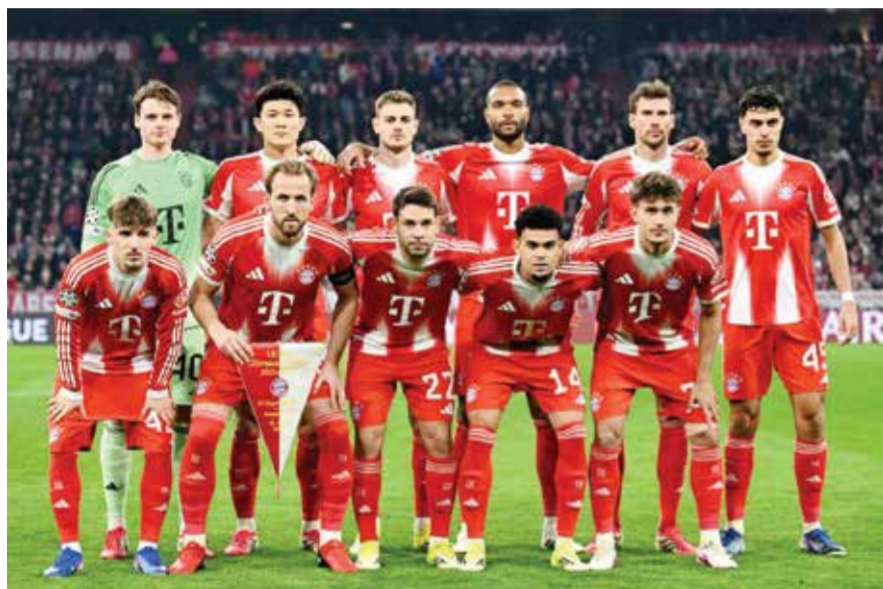
○ فريق بايرن.