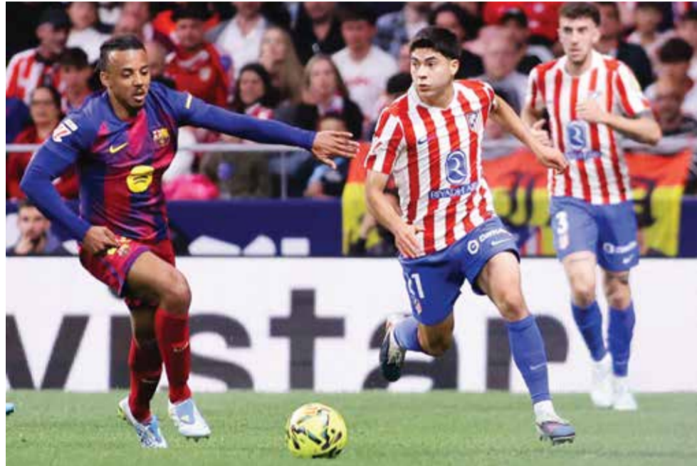
○ لقاء سابق بين برشلونة وأتلتيكو مدريد.