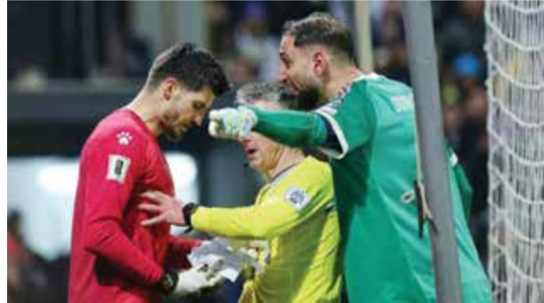
○ دوناروما غاضب من فاسيل.