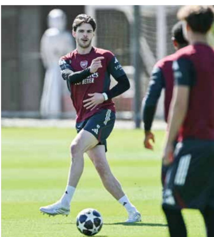
○ رايس. (أ ف ب)

لندن – (أ ف ب): دعا المدرب الإسباني لنادي أرسنال الإنجليزي ميكيل أرتيتا فريقه المتعثر إلى اختبار شخصيته، في مسعى للتعافي من هزيمتين قاسيتين، عندما يواجه سبورتينغ البرتغالي اليوم الثلاثاء في ذهاب ربع نهائي مسابقة دوري أبطال أوروبا لكرة القدم. وتعرّض فريق أرتيتا إلى خسارة مفاجئة أمام ساوثهامبتون، أحد أندية الدرجة الثانية، 2-1 في ربع نهائي مسابقة كأس إنجلترا السبت، وذلك بعد أسبوعين من سقوطه أمام مانشستر سيتي 2-0 في المباراة النهائية لمسابقة كأس الرابطة. وكان «المدفعية» يطاردون رباعية غير مسبوقه، قبل أن تتحطم أحلامهم في المسابقات المحلية بطريقة مؤلمة. وشكلت الخسارة القاسية أمام ساوثامبتون الهزيمة الخامسة فقط لأرسنال هذا الموسم، كما كانت المرة الأولى التي يخسر فيها الفريق مباراتين متتاليتين خلال هذه الحملة. وأدخل هذا التراجع أرسنال وجماهيره التي طال انتظارها للألقاب في حالة من المراجعة الذاتية. ويبدو أرتيتا قناعة بأن أرسنال قادر على التعامل مع الضغوط المتزايدة في سعيه إلى الفوز بدوري أبطال أوروبا للمرة الأولى، بالتوازي مع محاولة إنهاء انتظار دام 22 عاماً للتتويج بلقب الدوري الإنجليزي الممتاز. وقال أرتيتا: «خلال الموسم، تمر دائماً بحلقات صعبة، عادة اثنتين أو ثلاث. هذه هي اللحظة الأولى التي تواجه فيها مستوى معيناً من الصعوبة». وأضاف «نصف الأمر بالصعب ونحن مقبلون على ربع نهائي دوري أبطال أوروبا، وعلى المرحلة الحاسمة في الدوري».