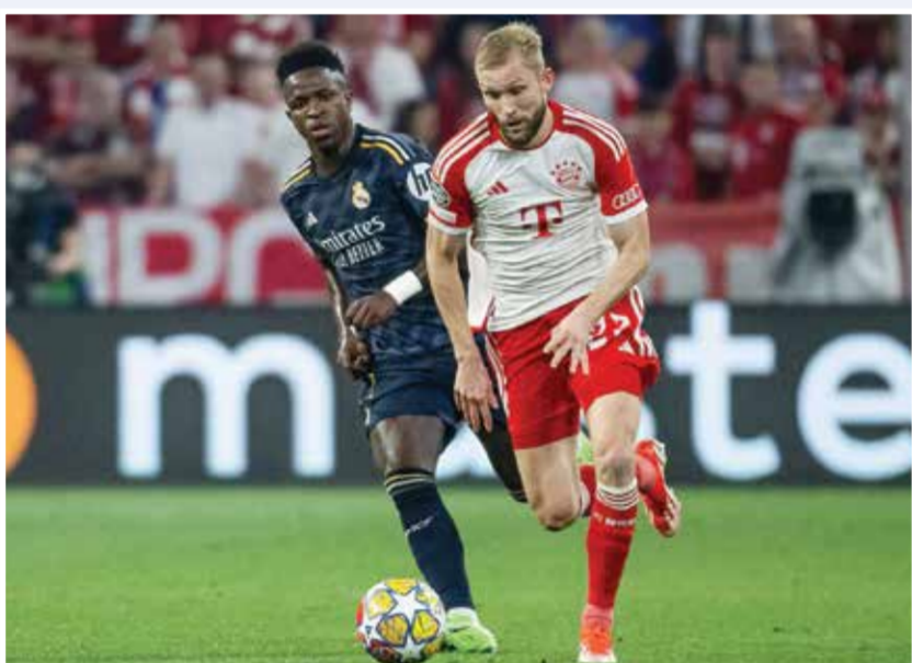
○ من لقاء سابق بين ريال مدريد وبايرن.

في الدوري حيث تضاءلت حظوظه في الظفر باللقب، بعدما بات يتخلف بفارق سبع نقاط عن غريمه التقليدي برشلونة المتصدر، فمات بالتالي المسابقة القارية العربية الوحيدة أمامه لإنقاذ موسمه. ولم تكن الاستعدادات مثالية لحامل لقب دوري أبطال أوروبا 15 مرة قياسية، قبل خوض ربع النهائي الـ22، لكن سجله الملكي لا يجادل فيه، إذ بلغ نصف النهائي 17 مرة (رقم قياسي). ويعد بايرن النادي الوحيد الذي شارك في ربع نهائي دوري أبطال أوروبا أكثر من ريال مدريد (24 مرة)، لكن ذلك لا يضمن شيئاً، إذ إن بطل أوروبا ست مرات هو أيضاً الأكثر خروجاً من هذا الدور (10 مرات).