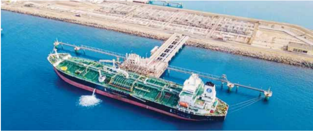
○ تحميل ناقلة بالنفط في ميناء ينبع السعودي.

يجري التعامل مع نحو 46 في المئة من خلال إعادة توجيه الصادرات عبر البحر الأحمر، و54 في المئة عبر الشراء الفوري»، مشيراً إلى صادرات النفط التي تعطلت بسبب النزاع. وتابع «بشكل عام، ومن خلال هذه الجهود، فإن مخزوننا الاستراتيجي الآمن يتجاوز حالياً 140 يوماً». وأضاف أن الحكومة «واثقة» من أنها ستحصل على إمدادات كافية من الغاز الطبيعي المسال حتى نهاية يونيو.