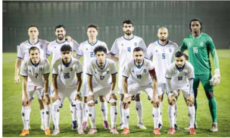
○ فريق المنامة.