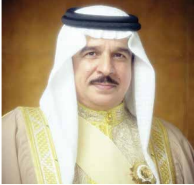
○ جلالة الملك المعظم.