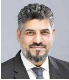
○ محمود فردان.

عقدت لجنة الشؤون التشريعية والقانونية بمجلس النواب برئاسة النائب محمود فردان رئيس اللجنة، اجتماعها السادس عشر أمس، وذلك بحضور النواب أعضاء اللجنة. وصرح رئيس اللجنة النائب محمود فردان بأن اللجنة بدأت اجتماعها باستعراض سبعة إخطارات، حيث أقرت دستورية ستة منها وهي: 1- قرار مجلس الشورى بشأن ما انتهى إليه مجلس النواب بخصوص مشروع قانون بتعديل بعض أحكام المرسوم بقانون رقم (25) لسنة 1998 بشأن المؤسسات التعليمية والتدريبية الخاصة (المعد بناء على الاقتراح بقانون المقدم من مجلس النواب). 2- قرار مجلس الشورى بشأن ما انتهى إليه مجلس النواب بخصوص مشروع قانون بتعديل المادة (10) من المرسوم بقانون رقم (39) لسنة 2002 بشأن الميزانية العامة (المعد المقدم من مجلس النواب). 3- مشروع قانون رقم ( ) لسنة بتعديل المادة (23) من المرسوم بقانون رقم (2) لسنة 1987 في شأن مزاولة غير الأطباء والصيادلة للمهن الطبية المعاونة، المرافق للمرسوم رقم (9) لسنة 2026م. 4- مشروع قانون رقم ( ) لسنة بتعديل المادة (29) من المرسوم بقانون رقم (7) لسنة 1989 بشأن مزاولة مهنة الطب البشري وطب الأسنان المرافق للمرسوم رقم (8) لسنة 2026م. 5- مشروع قانون رقم ( ) لسنة بالتصديق على تعديل بعض أحكام اتفاقية منظمة الأقطار العربية المصدرة للبترول، المرافق للمرسوم رقم (6) لسنة 2026م. 6- مشروع قانون رقم ( ) لسنة بالموافقة على انضمام مملكة البحرين إلى المرفق السادس للاتفاقية الدولية لمنع التلوث من السفن لعام 1973، المرافق للمرسوم رقم (7) لسنة 2026م. أما الإخطار السابع، وهو مشروع قانون رقم ( ) لسنة بإصدار قانون تنظيم قطاع الكهرباء والماء، المرافق للمرسوم رقم (37) لسنة 2025م، فلقد قررت اللجنة شبهة عدم دستورية مشروع القانون.