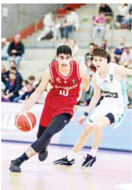
○ جانب من اللقاء.

القوية التي يخوضها منتخبنا أمام منتخبات تمتلك مدارس سلاوية متقدمة، إذ يسعى الجهاز الفني إلى تحقيق الاستفادة الفنية من هذه المشاركة، والعمل على صقل قدرات اللاعبين على المستويين الفني والبدني، في ظل فارق الخبرة والإعداد. وسيخضع منتخبنا إلى راحة اليوم، على أن يستأنف مشواره غدا الأربعاء بملاقاة المنتخب الياباني عند الساعة 2:15 ظهراً، في رابع مبارياته ضمن منافسات البطولة، حيث يتطلع إلى الظهور بصورة أفضل وتحقيق أول انتصاراته، إلى جانب مواصلة اكتساب الخبرة الدولية.