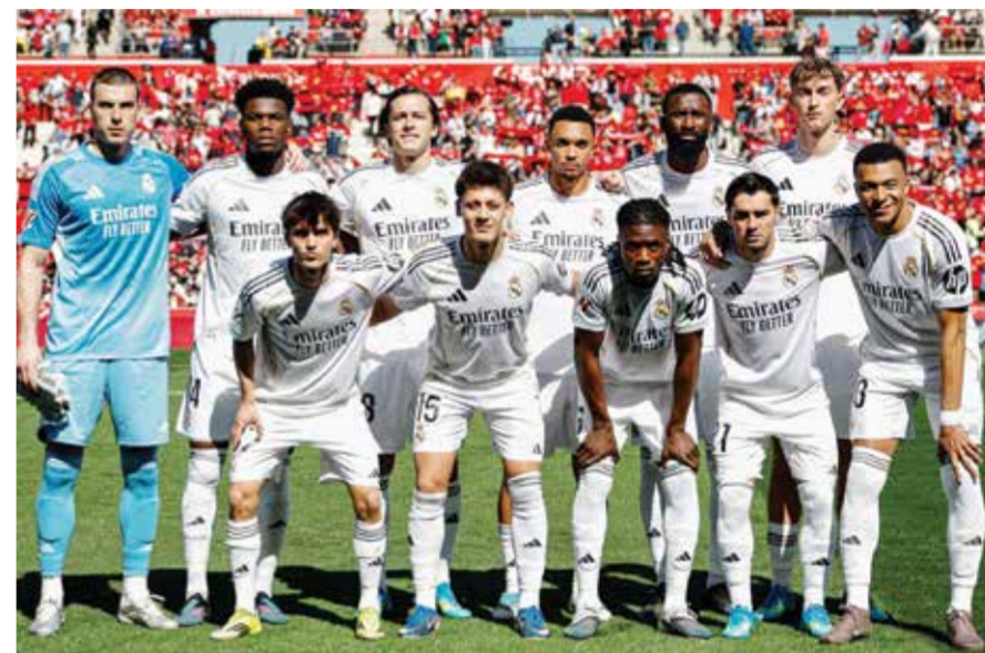
○ فريق ريال مدريد.