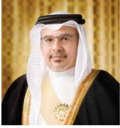
○ ولي العهد رئيس مجلس الوزراء.