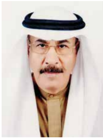
○ مبارك بن عمرو العماري.

والتراث والتاريخ والفنون، حيث شكّلت هذه الاهتمامات ملامح مسيرته الثقافية والإبداعية. كرّس العماري جهوده لتأليف وتوثيق أحداث وشخصيات بارزة في تاريخ مملكة البحرين والدول الخليجية الشقيقة، حتى أصبحت مؤلفاته مراجع أساسية لا غنى عنها للباحثين في مجالات التراث البحريني والخليجي. وقد حاز العديد من الجوائز والدروع التكريمية وشهادات التقدير، تقديراً لِعطاءه العلمي والأدبي. وتنوّعت مجالات عطائه بين الشعر والبحث والتوثيق، حيث تناول بالدراسة أبرز الشخصيات الفكرية في المنطقة، باعتبارها مرآة تعكس تراثنا العربي وثقافتنا الأصيلة. ومن أبرز إنجازاته كتابه عن سيرة المطرب محمد بن فارس، الذي نال جائزة ولي العهد للبحوث والدراسات، وأضفى مرجحاً مهماً للمهتمين بفنون الغناء الشعبي. إلى جانب ذلك، أصدر العماري العديد من الكتب والبحوث ودواوين الشعر، مؤكداً حضوره البارز في المشهد الثقافي ومرسّخاً مكانته كأحد أعلام التوثيق والأدب في المنطقة. وقد شارك في العديد من المحاضرات والندوات والأمسيات الشعرية، كما تألق في اللقاءات التلفزيونية والإذاعية، وأسهم بحضوره في مختلف المناسبات الوطنية.