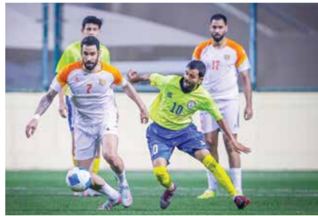
○ من لقاء الحالة وقلالي.