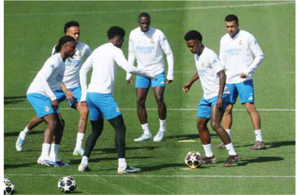
○ تدريبات ريال مدريد.