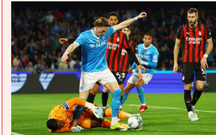
○ من لقاء نابولي وميلان.