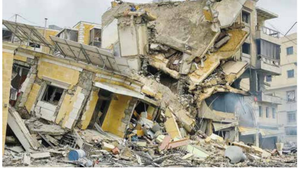
○ مبان سكنية في قضاء النبطية دُمرت في قصف إسرائيلي. (أ ف ب)

بيروت - (أ ف ب): استهدفت غارة إسرائيلية أمس الإثنين ضاحية بيروت الجنوبية بعد إنذار للسكان بإخلاء أحياء منها، فيما أعلن الجيش الإسرائيلي قصفه «أهدافاً» تابعة لحزب الله. جاء ذلك غداة سلسلة غارات كثيفة شنتها الدولة العبرية يوم الأحد على الضاحية ومناطق أخرى تقع جنوب العاصمة وشرقها، وأوقعت قتلى. وأظهر البث المباشر لوكالة فرانس برس تصاعد سحابة دخان عقب الغارة التي استهدفت، وفق الوكالة الوطنية للإعلام، منطقة بئر العبد في الضاحية الجنوبية التي تعُد معقلاً رئيسياً لحزب الله.