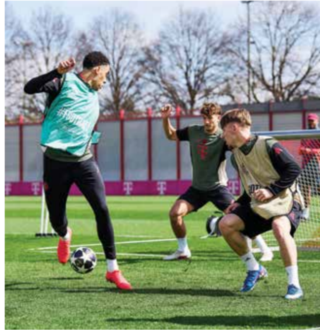
○ تحضيرات بايرن.