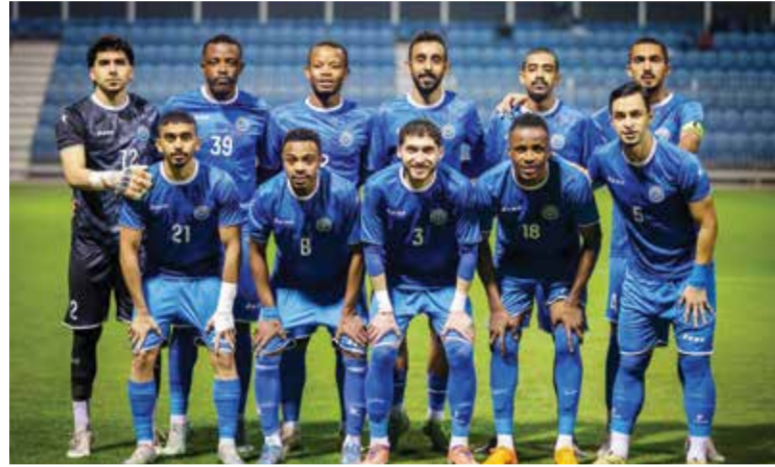
○ فريق البسيتين.