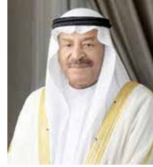
○ علي الصالح.

مسيرة التنمية الاقتصادية، وتعزيز التنافسية والإنتاجية التي يضطلع بها القطاع الخاص. وأعرب رئيس مجلس الشورى عن تطلع المجلس إلى مواصلة التعاون البناء، والتنسيق المثمر مع غرفة تجارة وصناعة البحرين، بما يسهم في دعم منظومة التشريعات الاقتصادية والمالية وترسيخ الشراكة المهمة والفاعلة بين المجلس والقطاع التجاري، وتعزيز مسارات التنمية والتطور والازدهار التي تشهدها مملكة البحرين في ظل القيادة الحكيمة لجلالة الملك المعظم. كما هنا رئيس مجلس الشورى أعضاء مجلس إدارة الغرفة تجارة وصناعة البحرين، متمنياً لهم المزيد من التوفيق والنجاح في أداء مسؤولياتهم وواجباتهم الوطنية.