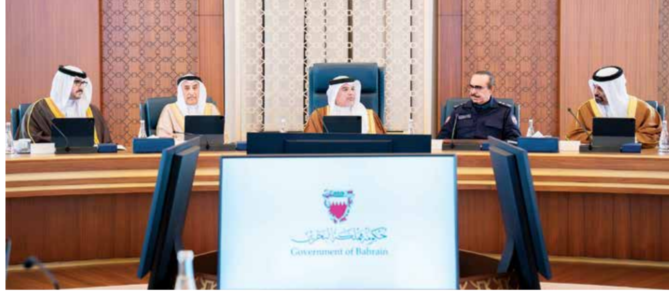
○ سمو ولي العهد رئيس الوزراء يترأس جلسة مجلس الوزراء.