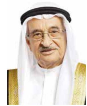
○ رئيس المجلس الأعلى للصحة.

أكد الفريق طبيب الشيخ محمد بن عبدالله بن خالد آل خليفة رئيس المجلس الأعلى للصحة أن القطاع الصحي في مملكة البحرين يتميز بكفاءة عالية وجاهزية تامة، وهو على أهبة الاستعداد لخدمة الوطن في جميع الظروف والتحديات، عبر توفير الخدمات الصحية بأعلى مستويات الجودة. وبمناسبة يوم الصحة العالمي الذي يصادف السابع