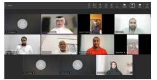
○ جانب من الاجتماع المرئي.

وبأمل البديع أن يساهم هذا التغيير في تحسين نتائج الفريق خلال المرحلة المقبلة، خصوصاً مع تبقي خمس جولات حاسمة على ختام المسابقة. ويحتل البديع حالياً المركز العاشر برصيد 18 نقطة، وهو المركز الذي يضعه في دائرة ملحق الصعود والهبوط، حيث يسعى المدرب الجديد إلى تحقيق نتائج إيجابية تعيد الفريق عن أي حسابات غير مرغوبة في الجولات المتبقية.