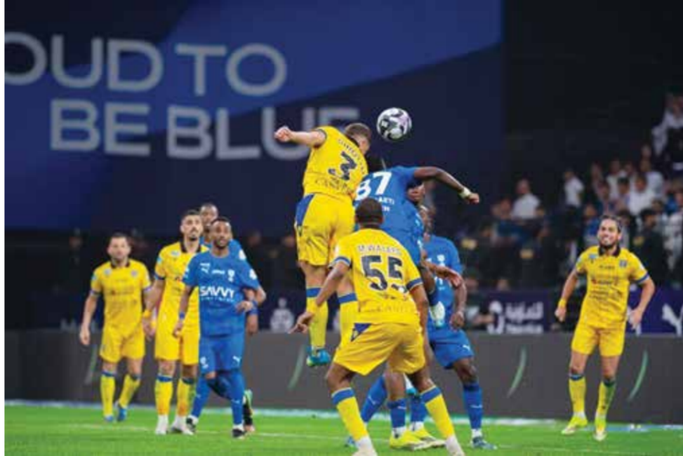
○ من مباراة الهلال والتعاون.

وصعد المنتخب الإيطالي بعشرة لاعبين بعد طرد أليساندرو باستوني في الدقيقة 41، ما تسبب بعودة أصحاب الأرض وإدراكهم التعادل قبل قرابة 10 دقائق