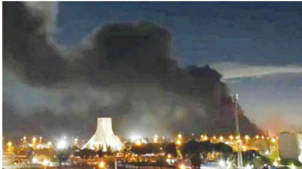
دخان يتصاعد فوق ساحة آزدي بطهران بعد ضربة أمريكية إسرائيلية.

رئيس الوزراء بنيامين نتانياهو وأعضاء الجيش الإسرائيلي بمواصلة ضرب البنية التحتية الوطنية الإيرانية بكل قوة».