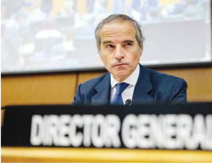
○ رافايل غروسي في صورة أرشيفية. (أ ف ب)

فيينا - (أ ف ب): حذّر المدير العام للوكالة الدولية للطاقة الذرية رافايل غروسي أمس الاثنين من أن الهجمات التي تقع بالقرب من محطة بوشهر الإيرانية «تشكل خطراً حقيقياً على السلامة النووية ويجب إيقافها». واستهدف محيط المحطة الواقعة في جنوب إيران وتضم مفاعلاً بقدرة 1000 ميغاواط، أربع مرات منذ بدء الحرب الأمريكية الإسرائيلية على إيران. ووقع الهجوم الأخير السبت، بحسب وسائل إعلام رسمية. وقال غروسي على إنكس إن الهجمات «قد تسبب حادثة إشعاعياً خطيرة إذا عواقب وخيمة على الناس والبيئة في إيران وخارجها». وحلّت الوكالة صوراً للموقع التقطتها الأقمار الاصطناعية، أكدت على إثرها وقوع الهجوم الأخير الذي لم يُلحق أي ضرر بالمنشآت. وأضاف غروسي أن إحدى الضربات الأخيرة وقعت على