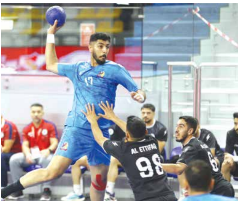
○ من لقاء الشباب والاتفاق في القسم الأول