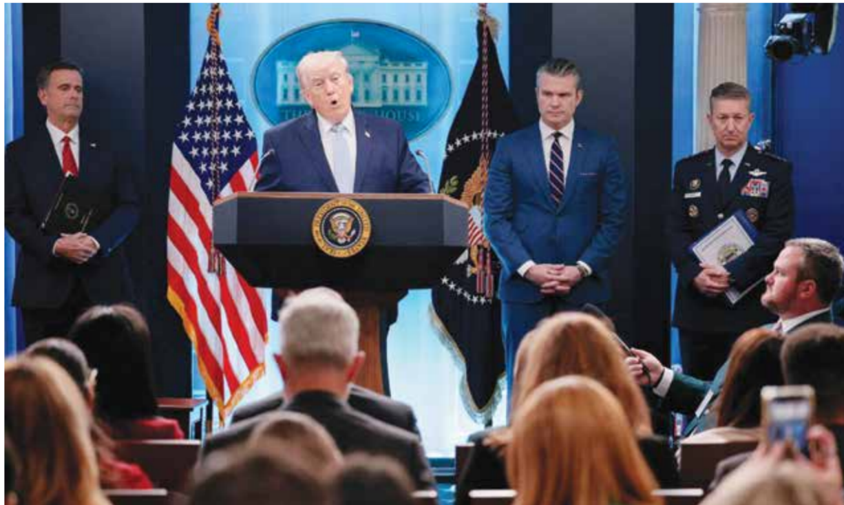
ترامب خلال مؤتمره الصحفي بالبيت الأبيض في واشنطن.

عنها، والإفراج عن أصولها المجمدة، مقابل فتح الممر الملاحي الحيوي. وأوضح أن التفاهم الأولي سيصاغ في شكل مذكرة تفاهم تُستكمل نهائياً عبر باكستان، وهي قناة الاتصال الوحيدة في المحادثات.