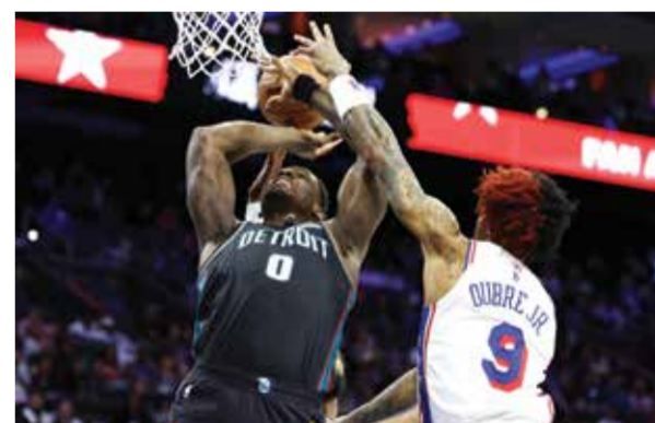
○ من لقاء بيستونز وسيكسرز

وفي حين تطمح بيغولا إلى لقبها الثاني هذا العام الأحد، ستسعى ستارودوبتسيفا إلى إحراز أول لقب في مسيرتها.