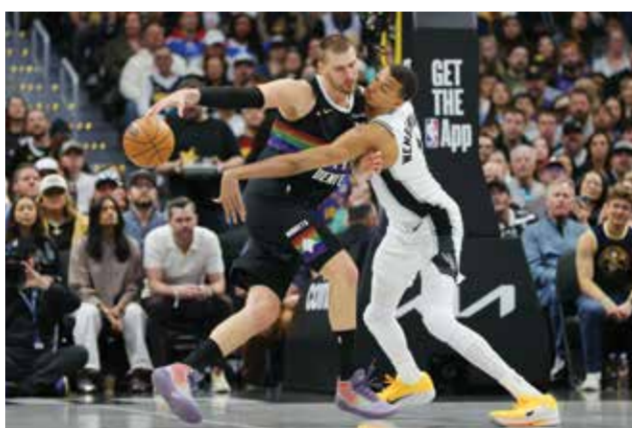
○ من لقاء ناغس وسبيرز.

حاسمة لناغس في مباراة اتسمت بشدة تضاهي أجواء الأدوار الإقصائية. وقال: «إنه فوز كبير. أريد فقط أن نكون جاهزين عندما يحين الوقت، كانت هذه خطوة جيدة في هذا الاتجاه».