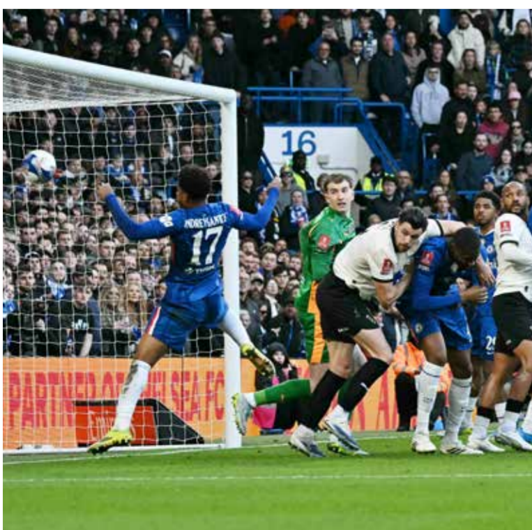
○ ستون يسجل الهدف الخامس لتشيلسي.

لندن - (د ب أ): كشف ليام روزينيور مدرب تشيلسي أسباب الفوز الكاسح لفريقه على بورت فايل بنتيجة 7 / 0 صفر، في كأس الاتحاد الإنجليزي لكرة القدم. صرح روزينيور عبر هيئة الإذاعة البريطانية (بي بي سي) عقب اللقاء: «إنه فوز رائع، وأحد أسباب أن ينضم اللاعبين إلى هذا النادي هو أنه يتطلع إلى الفوز بالألقاب، وخوض المباريات الكبيرة». أضاف: «كنت سعيداً للغاية بمستوى اللاعبين، لقد أدوا بروح عالية، وسجلنا سبعة أهداف بفضل طاقتهم وحماسهم». وكشف المدرب الشاب عما قاله للاعب تشيلسي بين الشوطين، قائلاً: «نهبنا عليهم بضرورة التعامل مع المباراة وكأنها في بدايتها، والنتيجة تشير إلى التعادل السلبي، وكان اللاعبون رائعين في تنفيذ التعليمات بشكل مثالي».