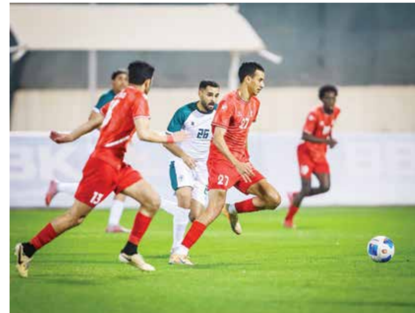
○ من لقاء الاتفاق واتحاد الريف.