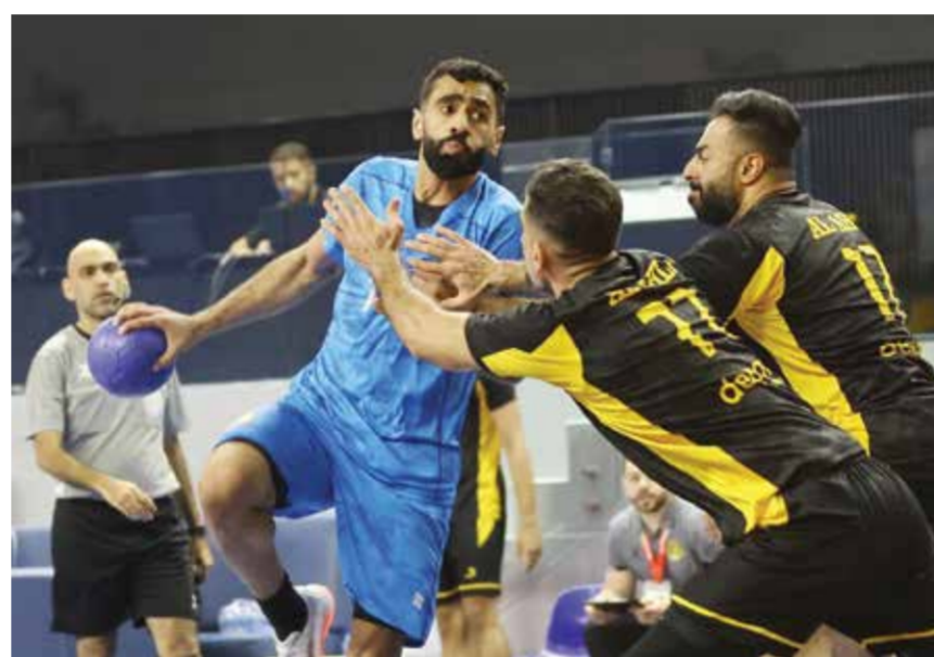
○ من لقاء الشباب والأهلي.