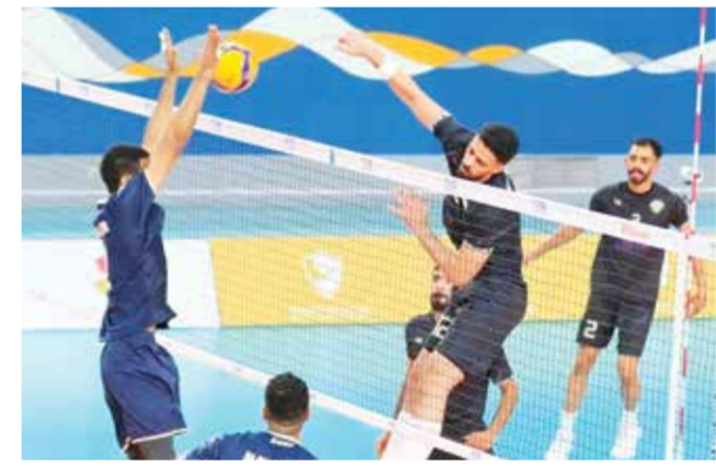
○ جانب من لقاء بني جمرة والمعالمير.

الأفضل، رجحت الفاعلية الهجومية كفته بقيادة أحمد عيسى. في المقابل افتقد الشباب استقرار الكرة الأولى مما انعكس على غياب فاعلية ضاربييه، إذ كان مركز 3 مشلولاً مما شكل ضغطاً على ضاربي الأطراف التي وقفت لها حائط صد التضامن بالميات.