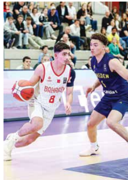
○ جانب من اللقاء.

مباراته الثالثة مساء اليوم أمام منتخب سلوفينيا عند الساعة 6:15 مساءً ضمن مشواره في البطولة، حيث يسعى للظهور بصورة أفضل ومواصلة الاستفادة من هذه المشاركة الدولية.