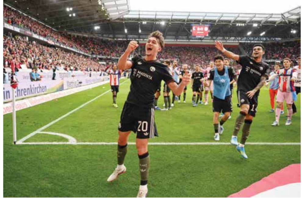
○ بيشوف (أ ف ب)

ريال مدريد «اتخاذ خطوة أخرى وربما ثلاث أو أربع خطوات».