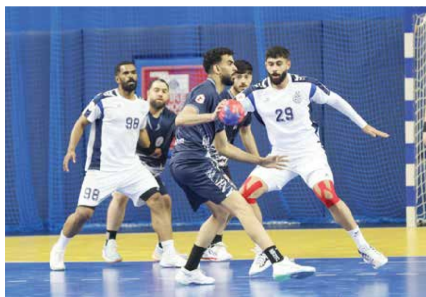
○ من لقاء النجمة والتضامن.