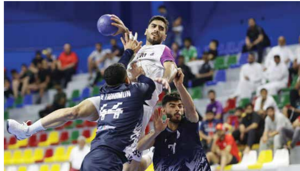
○ من لقاء باربار والتضامن في القسم الأول.

وتتواصل منافسات الجولة يوم غد الثلاثاء بإقامة مواجهتين بارزتين، حيث يلتقي في المباراة الأولى فريقا الشباب والاتفاق، فيما تشهد المباراة الثانية مواجهة النجمة مع توبلي، على أن تختتم جدول الجولة يوم الأربعاء بمواجهتين مهمتين، الأولى تجمع الأهلي بسماهيح في لقاء يسعى فيه الأهلي لتأكيد حضوره، بينما يلتقي في الثانية فريقا الاتحاد والدير.