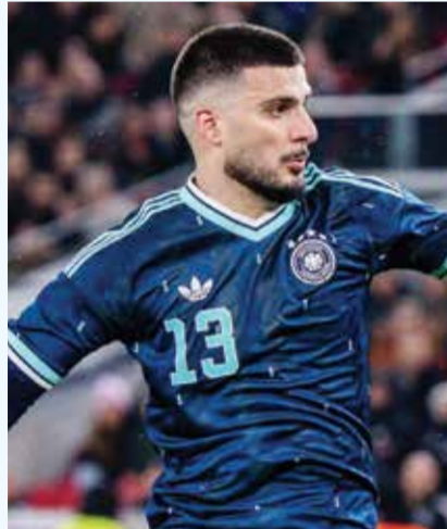
○ أوندا ف.

وأكد ناغلسمان أنه تم إبلاغ اللاعبين بوضوح بالأدوار التي سيلعبونها في المونديال مشيراً إلى أنه من «غير المرجح» أن يتحول أوندا ف من لاعب بديل إلى أساسي.