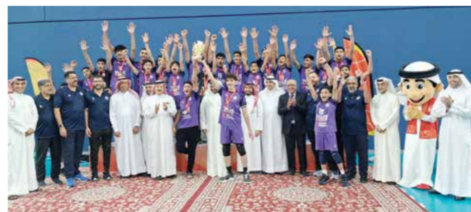
○ جانب من تتويج أشبال دار كليب

وفي المباراة الثانية حسم التضامن موقعه أمام الشباب وهزمه بثلاثة أشواط مقابل لا شيء 25-18، 25-23، 25-16، وقادها