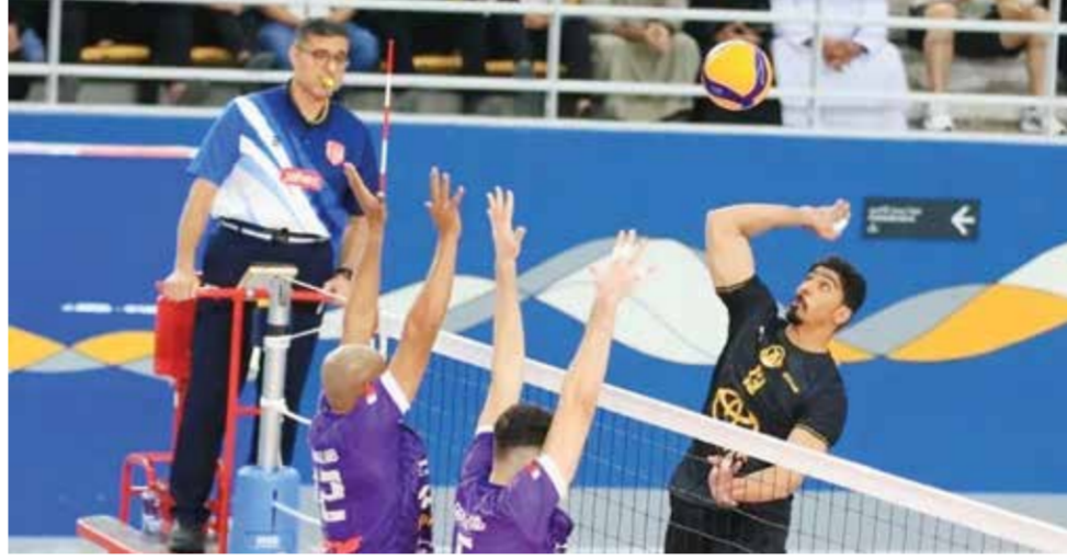
○ من لقاء الدور الأول بين دار كليب والأهلي.

هذه الجولة ليست عادية، قمة قد تحدد ملامح البطل، مواجهة تحمل أبعاداً نفسية وتكتيكية عميقة تفاصيل صغيرة قد تصنع الفارق الكبير.