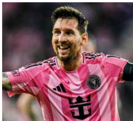
○ ميسي (أ ف ب)

ميامي - (أ ف ب): بصم الأرجنتيني ليونيل ميسي على أول أهدافه في افتتاح ملعب ناديه إنتر ميامي الجديد، في مباراة انتهت بالتعادل مع أوستن أف سي 2-2، في دوري كرة القدم الأميركي لكرة القدم (أم أل أس). وكان المالك الشريك في إنتر ميامي الإنجليزي ديفيد بيكهام بين الحضور من النجوم، مع الظهور الأول لملاعب «نو ستاديوم» الذي يتسع لـ 26 ألف متفرج، ليضع حداً لرحلة استمرت أكثر من عقد من الزمن بحثاً عن مقر دائم للنادي.