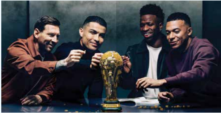
○ إعلان مجسمات المونديال.