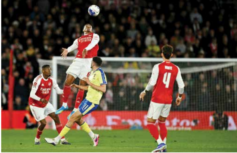
○ من مباراة أرسنال وساوثمبتون.