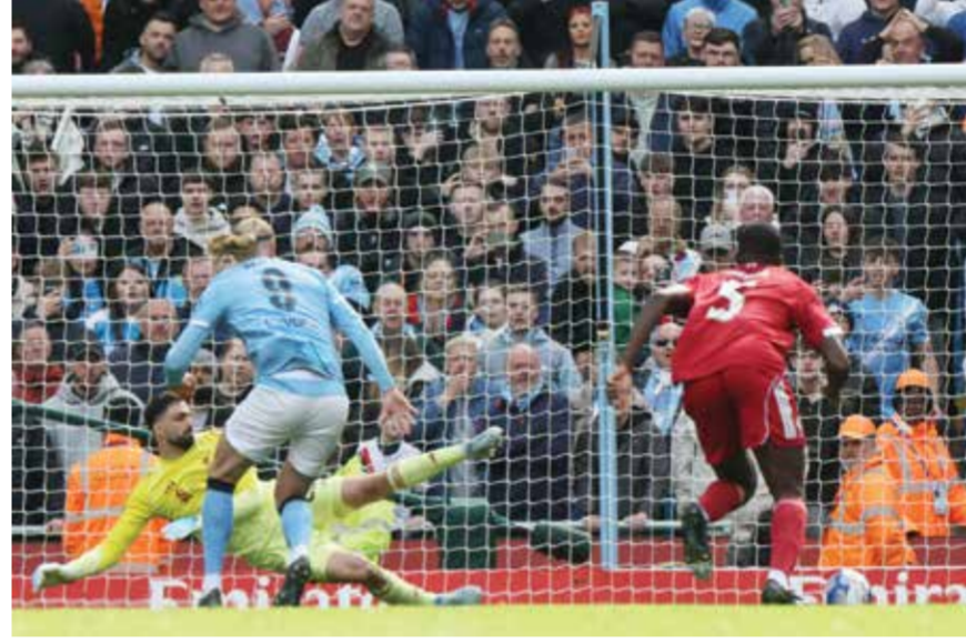
○ هالاند يسجل هدفه الأول

واحدة عن المهاجم الإنكليزي لبايرن ميونيخ الألماني هاري كاين (11)، وفق «أوبتا» للإحصاءات. وعلق الترويجي على ذلك بالقول: «مرّ بعض الوقت منذ آخر مرة سجلت فيها ثلاثية بقميص سيتي، ومن ثم حان الوقت للقيام بذلك مجدداً! إنه أمر مميز وأنا سعيد جداً». بتمريرة من شرقي حررت سيمينيو الذي سجل بسهولة (50)، ثم ازداد الوضع حرجاً للليفربول، بعد تمريرة حاسمة من أورابلي فتحت باب الهاتريك لهالاند (57). وهذه الثلاثية الثانية عشرة لهالاند مع سيتي في كل المسابقات منذ انضمامه إليه في صيف 2022، ليصبح اللاعب الأكثر تسجيلاً للثلاثيات بين اللاعبين الحاليين في الدوريات الخمس الكبرى، بفارق