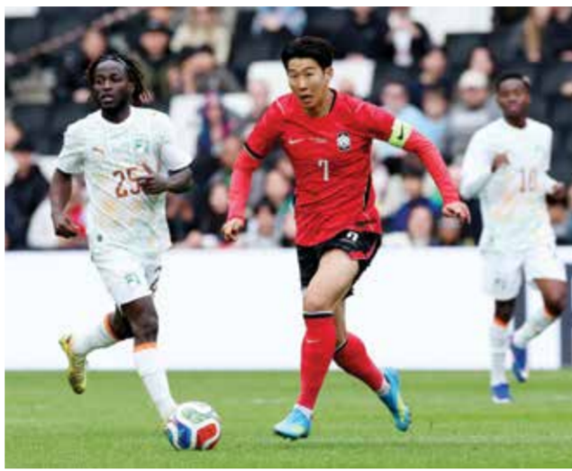
○ من مباراة كوريا الجنوبية وساحل العاج.