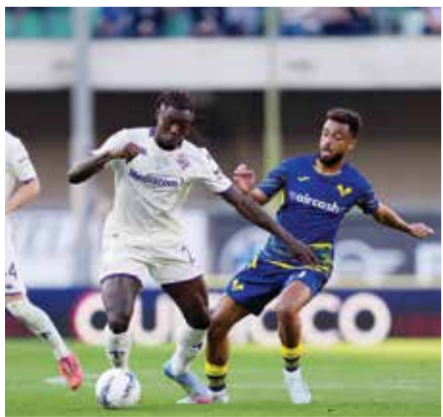
○ من مباراة فيورنتينا وفيرونا.

منذ سبتمبر 2009، بعدما تخلف منذ الدقيقة 15 حتى الدقيقة 74 بهدف إريكي ديل براتو قبل أن ينقذ نقطة التعادل عبر البديل الهولندي تيجاني نوسلين. ويتعادله الحادي عشر للموسم رفع نادي العاصمة رصيده إلى 44 نقطة في المركز الثامن الذي بات مهدداً من بولونيا، فيما بات رصيده بارما 35 نقطة في المركز الثاني عشر.