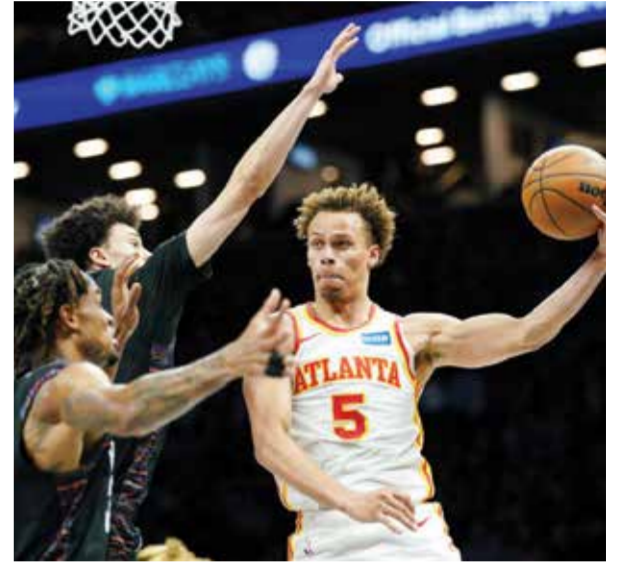
○ من لقاء هوكس ومنتس. (أ ف ب)