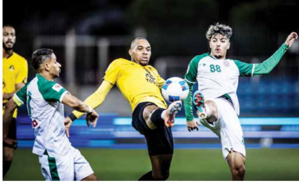
○ من لقاء المالكية والأهلي.

وسيخوض منتخبنا مباراته الثانية مساء اليوم أمام منتخب السويد عند الساعة 6:15 مساءً، في لقاء يسعى من خلاله إلى الظهور بصورة أفضل والاستفادة من دروس المواجهة الافتتاحية.