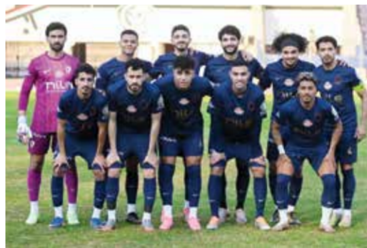
○ فريق الزمالك.