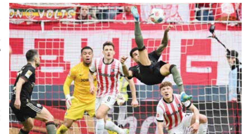
○ من لقاء بايرن وفرايبورغ

و حقق بايرن فوزه السادس في الدوري الألماني هذا الموسم يوم السبت بعد أن نجح في قلب تأخره (حصد 22 نقطة، منها أربعة تعادلات)، وبفضل هجومه الأقوى في الدوريات الخمسة الكبرى في أوروبا، ووصل إلى حاجز المئة هدف للمرة الثالثة في تاريخه في «بونديسليغا»، بعد موسمي