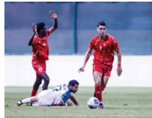
○ من لقاء سابق بين الاتفاق واتحاد الريف.

والاتحاد 28 نقطة، والحالة 26 نقطة، وأم الحصم 21 نقطة، وبوري 19 نقطة، والبسيتين 14 نقطة، ومدينة عيسى 13 نقطة، واتحاد الريف 10 نقاط، والتضامن 8 نقاط، وأخيراً قلالي برصيد 6 نقاط.