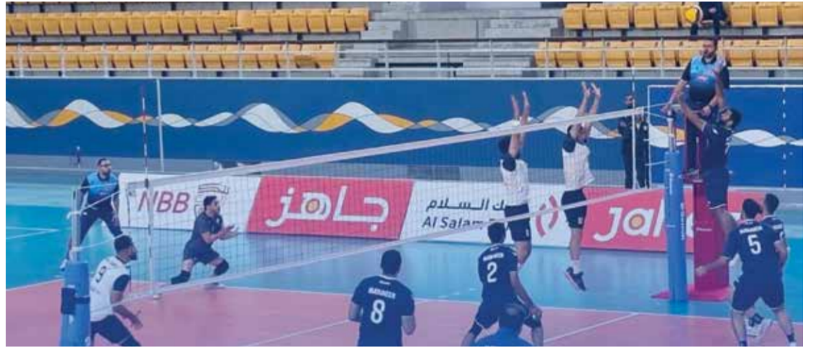
○ من لقاء الدور الأول بين المعامير وبنو جمره.