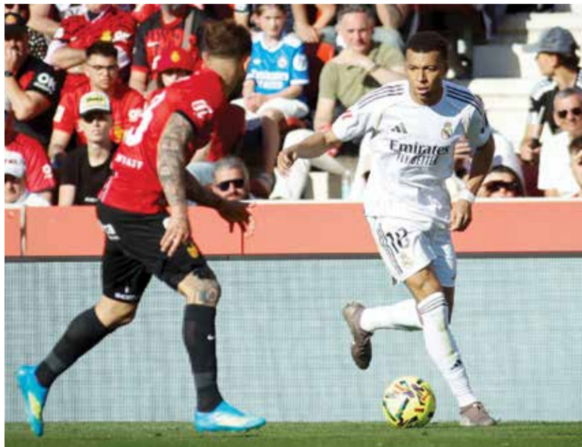
○ من مباراة مايوركا وريال مدريد

وعلى الملعب الأولمبي في العاصمة، تجنب لاتسيو هزيمة أولى على أرضه أمام بارما (1-2)