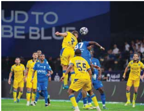
○ من لقاء الهلال والتعاون.

نقاط عن النصر المتصدر، ويتقدم بفارق نقطة عن الهلال صاحب المركز الثالث والذي يلعب لاحقاً اليوم مع التعاون. وفي المباراة الثالثة فاز فريق نيوم على ضيفه الفيحاء بنتيجة 1 / 3 ضمن منافسات الجولة السابعة والعشرين من الدوري السعودي للمحترفين لكرة القدم.