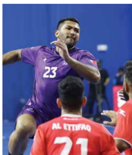
○ من لقاء الفريقين في القسم الأول.

تختتم مساء اليوم الأحد منافسات الجولة العشرين (التاسعة من القسم الثاني) للدور التمهيدي لسدوري خالد بن حمد لكرة اليد، بإقامة مواجهة على صالة الاتحاد البحريني لكرة اليد بأم الحصم، حيث يلتقي فريقا الاتفاق والاتحاد عند الساعة (7:00 مساءً).