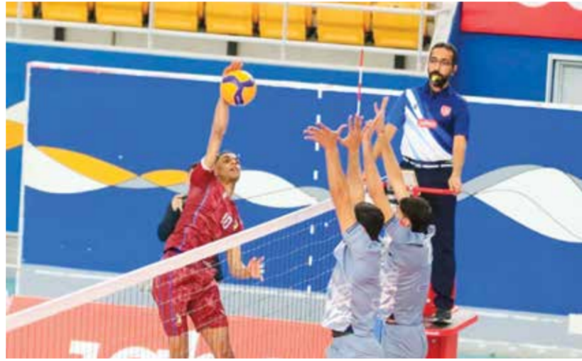
○ من لقاء الدور الأول بين الشباب والتضامن.