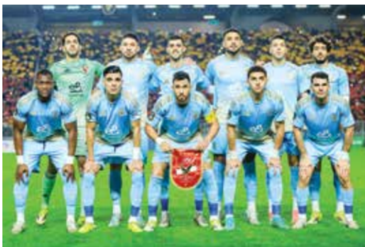
○ فريق الأهلي.