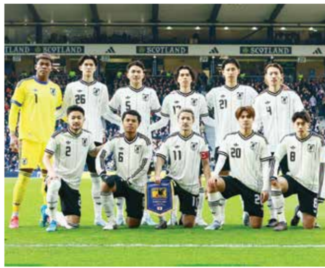
○ منتخب اليابان.

على الجابون قبل أن تحقق فوزاً بركلات الترجيح على فنزويلا. أما الأردن، الذي يشترك لأول مرة أيضاً في البطولة، فقد حقق تعادلاً معنويين 2-2 أمام كوستاريكا ونيجيريا، وخسرت إيران 2-1 أمام نيجيريا قبل أن تفوز 5-0 صفر على كوستاريكا. ويتعرض الفرنسي هيرفي رينار مدرب السعودية لضغوط متجددة عقب الخسارة 4-0 صفر أمام مصر ثم الهزيمة 1-2 أمام صربيا يوم الثلاثاء الماضي بينما أُلغيت مباريات قطر الودية بسبب الصراع الدائر في الخليج.