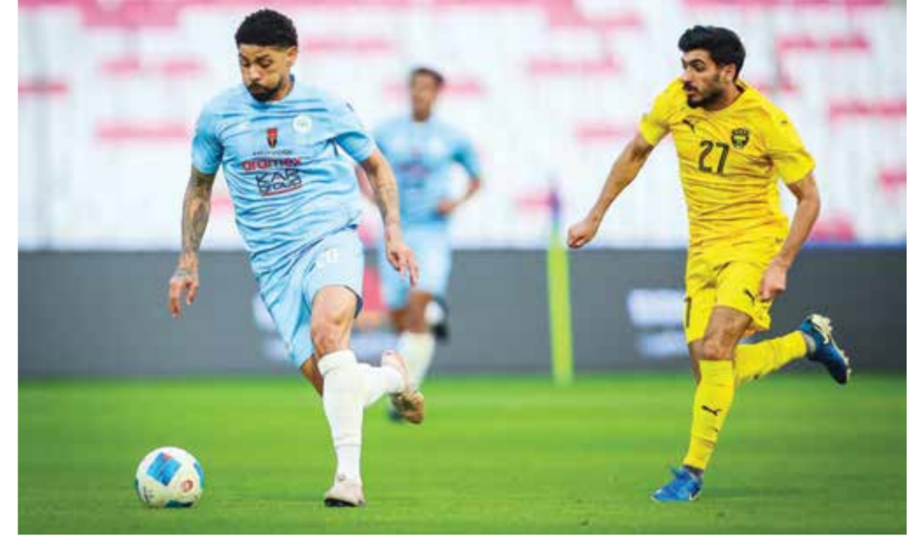
○ من لقاء الخالدية والرفاع.