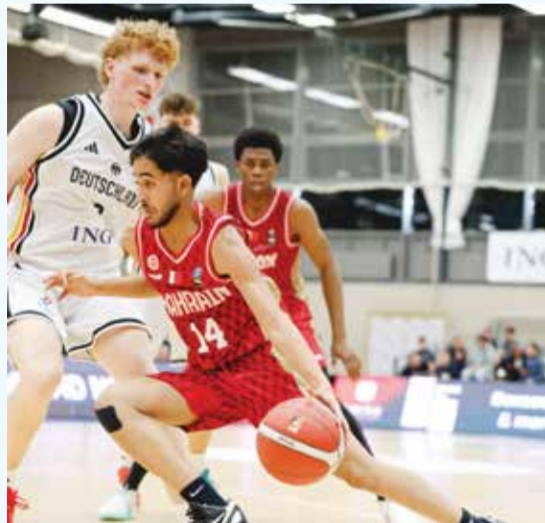
○ جانب من اللقاء.

وسيقام نهائي دوري زين بنظام 5 Best، حيث يتوج باللقب الفريق الذي يحقق ثلاثة انتصارات من أصل خمس مواجهات.