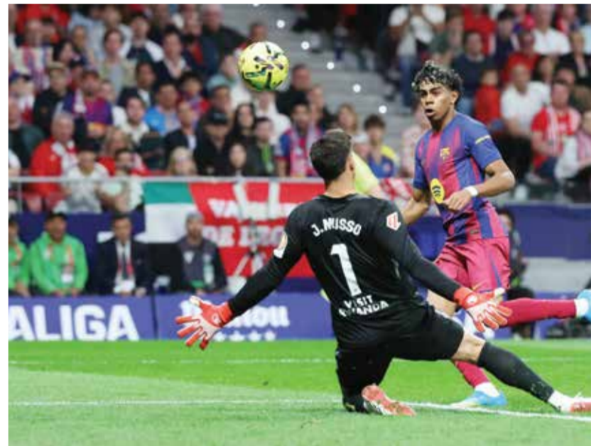
○ من مباراة برشلونة وأتلتيكو مدريد

وفاز ريال سوسيداد على ضيفه ليفانتي 2-0، وتعادل ريال بيتيس مع إسبانيول سلباً.