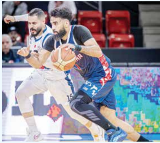
○ جانب من اللقاء.