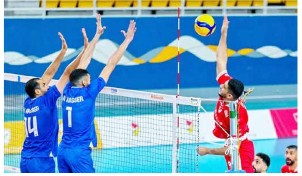
○ من مباراة المحرق والنصر.

حقق فريق النبية صالح فوزاً جديداً رفع به رصيده إلى 41 نقطة بعد تفوقه على منافسه فريق اتحاد الريف بثلاثة أشواط لا شيء 25-15، 25-13، 25-20، في لقاء الأمس الذي جاء ضمن المباريات المؤجلة من الجولة التاسعة عشرة لدوري عيسى بن راشد للكرة الطائرة، وأقيم في صالة عيسى بن راشد في