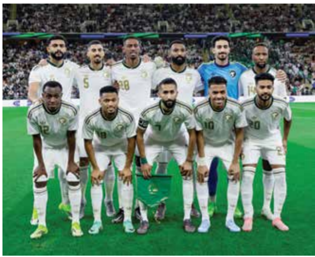
○ منتخب السعودية.