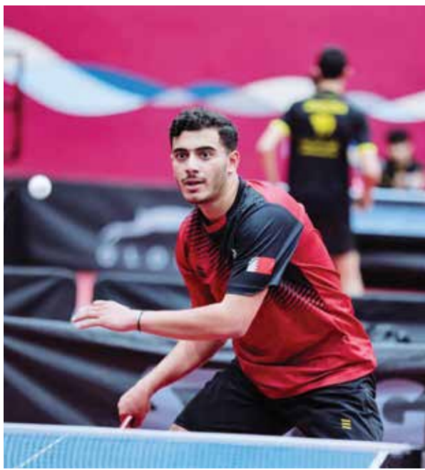
○ جانب من المنافسات.

باختصار، التعليق الرياضي مع معلق متملق، تتحول أي قمة رياضية إلى متعة حقيقية، إذ يلتقي الأداء الفني المتميز بالتحليل الخبير، ليصبح المشاهد على موعد دائم مع متعة تعليمية وترفيهية في الوقت نفسه.