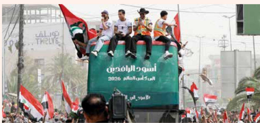
○ احتفال المنتخب العراقي

وتعد مباراة الزمالك والمصري هي الرابعة بين الفريقين في الموسم الحالي حيث لم يخسر الزمالك نهائياً حيث فاز أولاً بالدوري بثلاثية نظيفة ثم التقى مرتين مع المصري البورسعيد ضمن منافسات