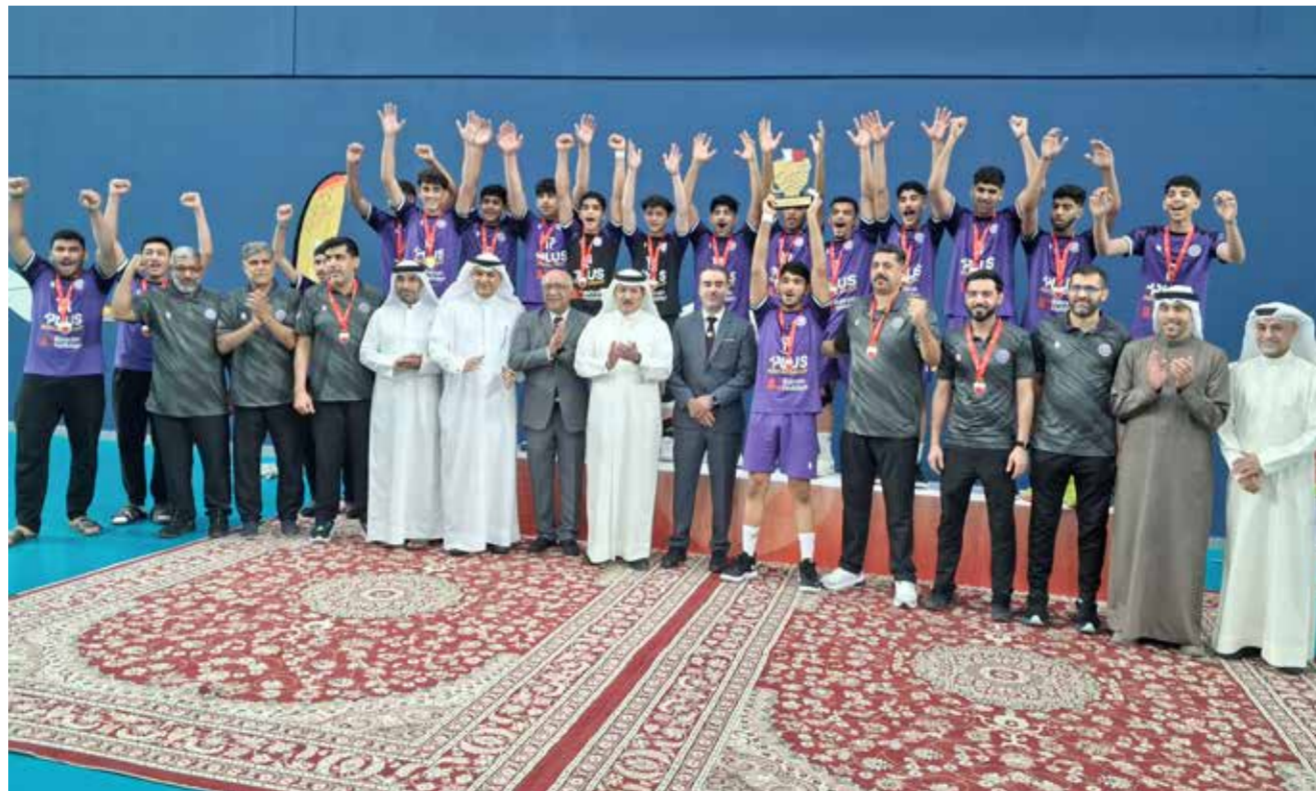
○ خلال تتويج ناشئي دار كليب.