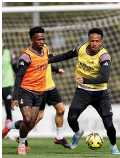
○ تدريبات ريال مدريد.