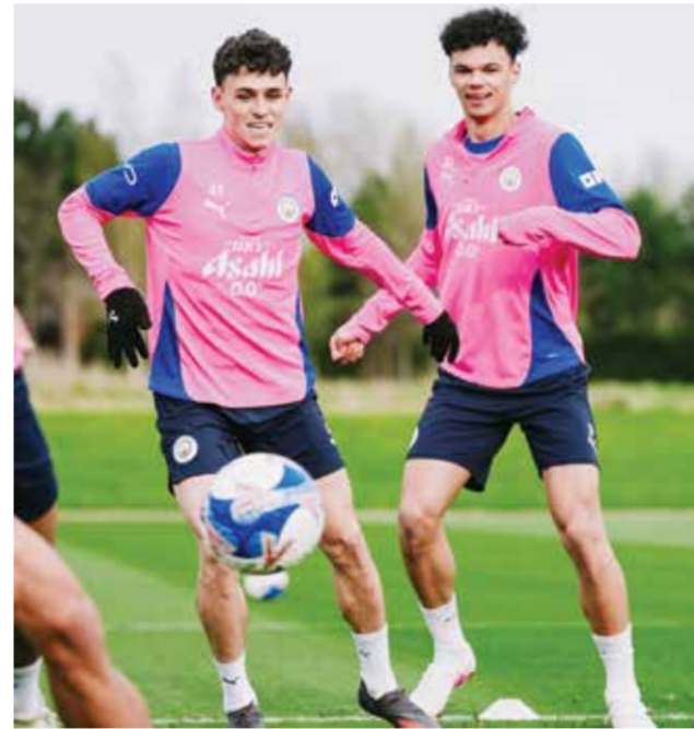
○ استعدادات سيتي.

قد تكون أولوية الفريقين هي البقاء في الدوري الممتاز، لكن القرعة منحتهما فرصة نادرة لبلوغ نصف النهائي. لم يصل ليدز إلى نصف نهائي كأس إنكلترا منذ عام 1987، فيما يعود آخر ظهور لوست هام في هذا الدور إلى قبل 20 عاما. ويحتل وست هام منطقة الهبوط في الدوري الممتاز (المركز الثامن عشر)، متأخرا بأربع نقاط عن ليدز الخامس عشر، لكنه استثمر الزخم الإيجابي لمسيرته في كأس لقب مسار موسم. فمفد إنهاء سلسلة من عشر مباريات من دون فوز أمام كوينز بارك رينجرز في الدور الثالث، خسر فريق المدرب البرتغالي نونو إشبيريرو سانتو ثلاث مباريات فقط من أصل 13.