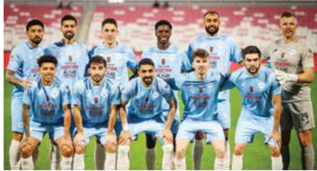
○ فريق الرفع.

وتحمل المواجهة طابعاً تنافسياً خاصاً في ظل تقارب المستويات