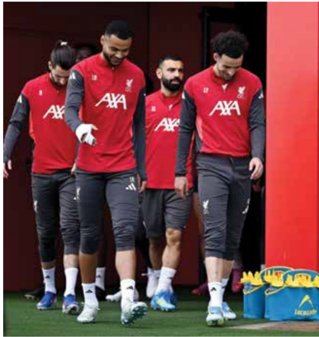
○ تدريبات ليفربول.

كما قد يكون المهاجم السويدي ألكسندر أيزاك جاهزا أيضا لمواجهة حامل اللقب، بعد غياب استمر عدة أشهر لإصابته، وكذلك الحال بالنسبة لتظهير الهولندي جيريمي فريمبونج.