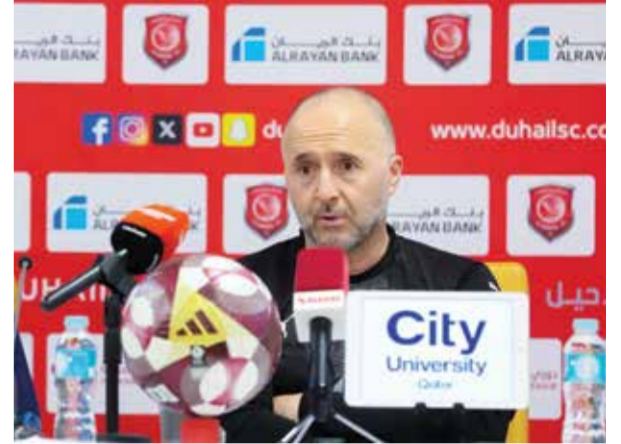
○ جمال بلماضي.

وفي مباراة أخرى بالجولة نفسها، تعادل الخليج مع مضيفه الخلود 2/2، وتقدم الخلود عن طريق جوجا في الدقيقة التاسعة، فيما سجل كوستاس فورتونيس هدف التعادل للخليج من ضربة جزاء في الدقيقة 18. وفي الدقيقة 37 سجل عبد العزيز العلوي الهدف الثاني للخلود، فيما أدرك الخليج التعادل مجدداً في الدقيقة 85 عن طريق يورجوس ماسوراس، ورفع الخليج رصيده إلى 31 نقطة في المركز العاشر، فيما رفع الخلود رصيده إلى 26 نقطة في المركز الرابع عشر. وقاد النجم البرتغالي كريستيانو رونالدو فريقه النصر إلى الفوز على ضيفه النجمة 4/2، ورفع النصر رصيده إلى 70 نقطة في المركز الأول، بفارق ست نقاط عن الهلال صاحب المركز الثاني، فيما تجدد رصيد النجمة عند ثمانين نقطة في المركز الثامن عشر والأخير. وتقدم النجمة في الدقيقة 44 عن طريق راكان الطليحي، ثم أدرك النصر التعادل في الدقيقة الثامنة من الوقت بدل الضائع للشوط الأول عن طريق عبد الله الحمدان.