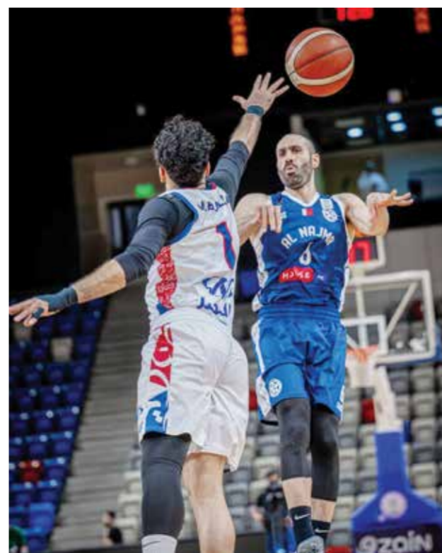
○ من المواجهة الأخيرة بين الفريقين.