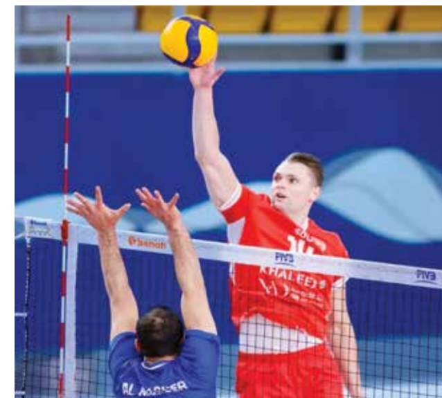
○ من لقاء الدور الأول بين النصر والمحرق.