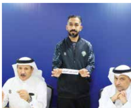
○ جانب من القرعة.

الفريق الحاصل على المركز الأول في الدوري على رأس المجموعة الأولى ويتأهل مباشرة للدور ربع النهائي أسفل المجموعة الأولى.