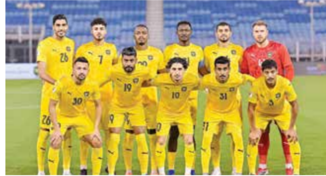
○ فريق الخالدية.

بين الفريقين، مما يجعلها مفتوحة على مختلف الاحتمالات، خصوصاً مع رغبة كل طرف في تحقيق نتيجة معنوية قبل الاستحقاق القادم في أعلى الكؤوس.