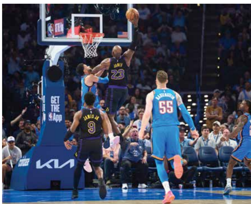
○ من لقاء ثاندر وليكرز.