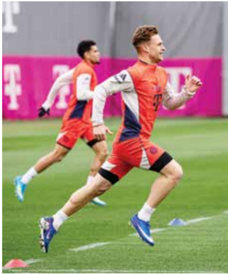
○ استعدادات بايرن