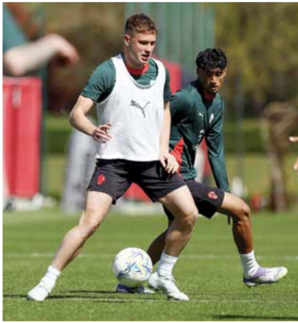
○ استعدادات ميلان.

يستضيف جنوى الإنئين أيضا، مهدد بالابتعاد أكثر عن مراكز المقدمة.