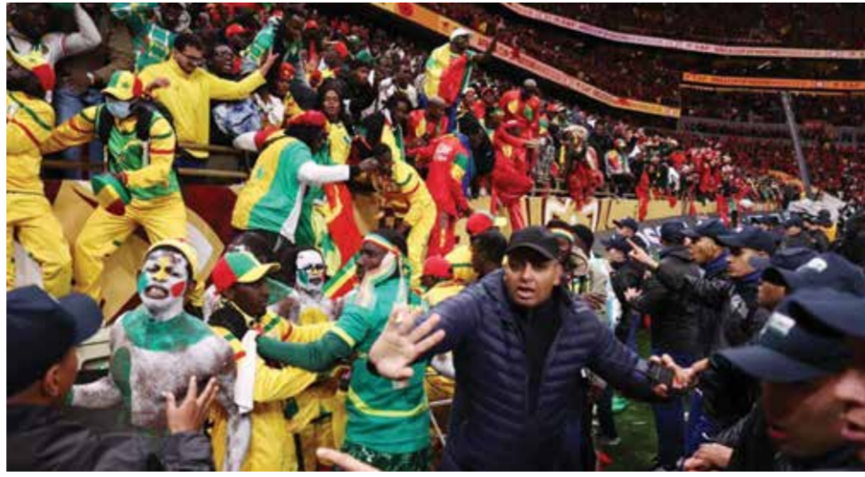
○ لقطة أرشيفية لأحداث النهائي.

أما وزير الخارجية السنغالي الأسبق شيخ تيديان غايو، فكتب في مطلع فبراير أن «مائة دقيقة من كرة القدم لن تسيء أبداً إلى ألف عام من العلاقات... بين السنغال والمغرب».