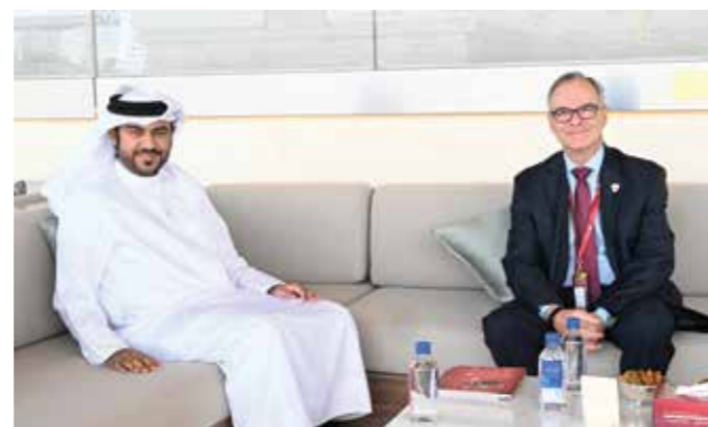
○ حضور رسمي كبير