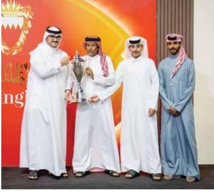
○ سموه يتوج الفائزين