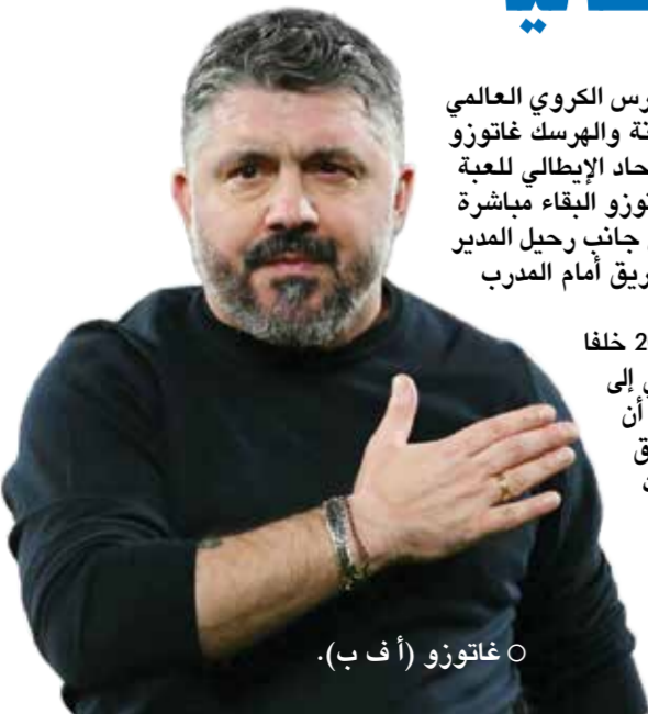
○ غاتوزو (أ ف ب).

روما - (أ ف ب) قَدّم مدرب المنتخب الإيطالي لكرة القدم جينارو غاتوزو استقالته من منصبه بعد ثلاثة أيام من فشله في قيادة المنتخب الإيطالي، إلى مودينا، وفقا لما أعلنه الاتحاد المحلي للعبة في بيان له أمس الجمعة. وقال الاتحاد الإيطالي في بيانه: «أنهى غاتوزو إيفان غاتوزو بالتراضي العقد الذي كان يربطه المدرب القادم من كالابريا بالمنتخب الوطني الإيطالي». وتابع «يشكر الاتحاد الإيطالي غاتوزو وكامل طاقمه على الجدية والتفاني والشغف الذي أظهره خلال الأشهر التسعة الماضية، ويتمنى لهم كامل التوفيق في مسيرتهم المستقبلية».