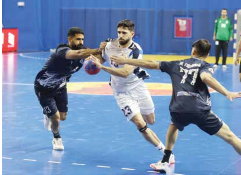
○ من لقاء النجمة والتضامن.