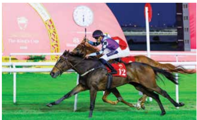
○ جانب من السباق

أناب حضرة صاحب الجلالة الملك حمد بن عيسى آل خليفة ملك البلاد المعظم، سمو الشيخ عيسى بن سلمان بن حمد آل خليفة وزير ديوان رئيس مجلس الوزراء رئيس الهيئة العليا لنادي راشد للفروسية وسباق الخيل، لحضور ختام منافسات مهرجان كأس جلالة الملك المعظم، الذي أقيم على مدار يومي الخميس والجمعة، 2 و3 أبريل الجاري، وذلك على مضمار نادي راشد للفروسية وسباق الخيل بمنطقة الرفقة. وشهد اليوم الختامي لمهرجان كأس جلالة الملك المعظم أجواء تنافسية مميزة حيث تنافست نخبة الجواد على الفوز بكؤوس جلالة الملك المعظم للخيول العربية والمستوردة وإنتاج البحرين، إضافة إلى بقية كؤوس أشواط كبرى سباقات الموسم. وبهذه المناسبة أكد سمو الشيخ عيسى بن سلمان بن حمد آل خليفة وزير ديوان رئيس مجلس الوزراء رئيس الهيئة العليا لنادي راشد للفروسية وسباق الخيل، أن الرعاية والاهتمام الذي يوليه حضرة صاحب الجلالة الملك حمد بن عيسى آل خليفة ملك البلاد المعظم، بقطاع سباقات الخيل حافظاً للحفظ على المستويات المتقدمة وبلوغ آفاق أرحب من التميز والتطوير، منوهاً سموه بما يحظى به القطاع من متابعة مستمرة من صاحب السمو الملكي الأمير سلمان بن حمد آل خليفة ولي العهد رئيس مجلس الوزراء ما يعكس الحرص الدائم على صون الإرث العريق لمملكة البحرين وتعزيز حضوره على مختلف الأصعدة، مؤكداً أن ما تحققة المملكة من نجاحات في تنظيم واستضافة سباقات الخيل يجسد ما تتمتع به المملكة من مقومات وإمكانيات متقدمة إلى جانب كوادر وطنية مؤهلة، يسهم في ترسيخ مكانتها على خارطة سباقات الخيل الإقليمية والدولية.