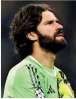
○ أليسون بيكر.

باريس (فرنسا) - (أ ف ب) - سيغيب حارس المرمى الدولي البرازيلي أليسون بيكر عن فريقه ليفربول الإنجليزي في ذهاب وإياب ربع نهائي دوري أبطال أوروبا لكرة القدم أمام حامل اللقب باريس سان جرمان الفرنسي، وفقا لما أعلنه مديره الهولندي أنه سلتو أمس الجمعة وتعرض الحارس البرازيلي الذي قدم أداء استثنائيا أمام سان جرمان بالذات في ذهاب ثمن النهائي الموسم الماضي، لإصابة عضلية خلال الانتصار 4-0 في إياب ثمن النهائي على غلطة سراي التركي قبل أكثر من أسبوعين.