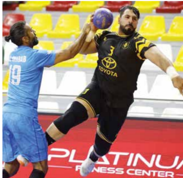
○ من لقاء سابق بين الفريقين.

إلى القمة المرتقبة التي تجمع الشباب بالأهلي، في لقاء يحمل أهمية كبيرة في سياق المراكز المتقدمة. يدخل الشباب المواجهة وهو في المركز الثاني برصيد (49 نقطة)، واضعًا هدفه في مواصلة الانتصارات والضغط على المتصدر، مستندًا إلى استقراره الفني وتألق عدد من لاعبيه في الجولات الأخيرة.