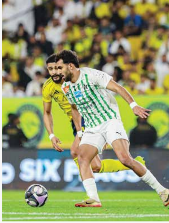
○ من لقاء النصر والنجمة.

في الدقيقة 56، قبل أن يضيف الهدف الرابع في الدقيقة 73. وعاد النصر للتسجيل مجدداً في الدقيقة الخامسة من الوقت بدل الضائع للشوط الثاني، عن طريق ساديو ماني الذي سجل الهدف الثاني له في المباراة.