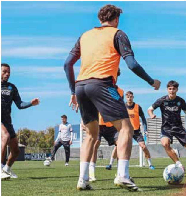
○ تدريبات نابولي.