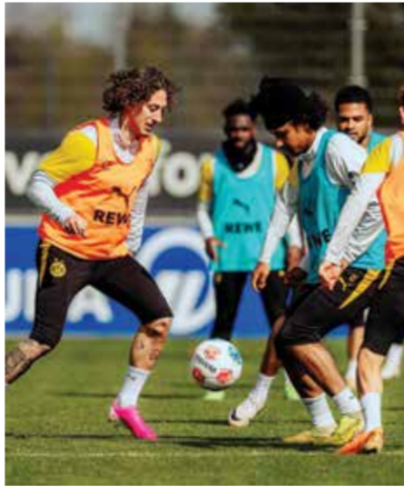
○ تدريبات دورتموند

فرايبورغ، لكن قد يفقد خدمات هدافه هاري كاين الذي غاب عن الخسارة الدولية الودية لإنتكرا أمام اليابان (0-1) في ويمبلي بسبب إصابة في الكاحل وصفها المدرب الألماني للـ«أسود الثلاثة» توماس توخل بـ«الطفيفة».