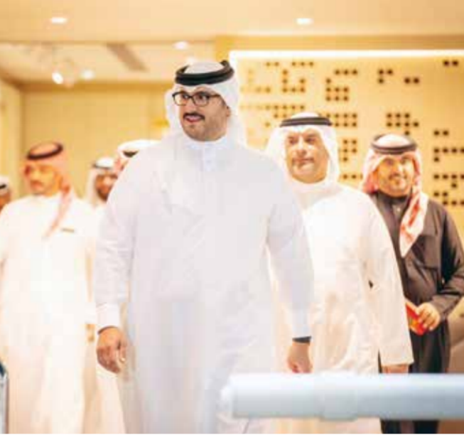
○ سموه يحضر ختام مهرجان كأس جلالة الملك المعظم