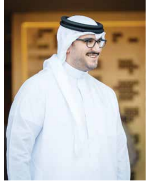
○ سمو الشيخ عيسى بن سلمان بن حمد آل خليفة