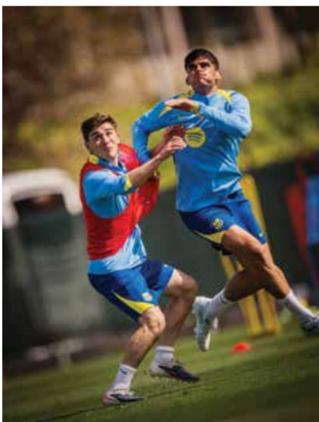
○ تحضيرات برشلونة.