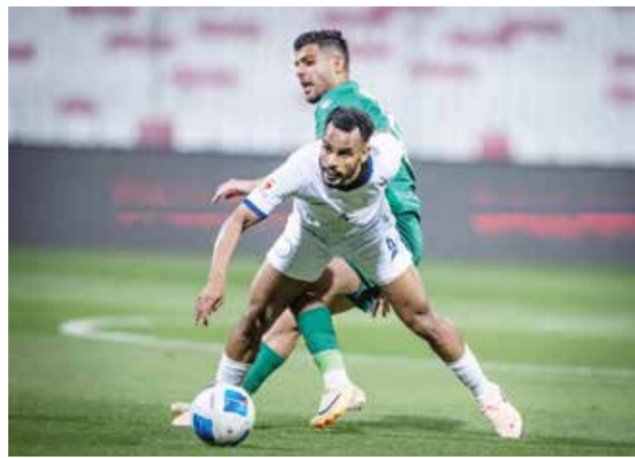
○ من لقاء الحد والبديع.

في المقابل، يدخل الأهلي المباراة برصيد 19 نقطة، ونتائجته متباينة في الجولات الأخيرة، ولا شك أن المدرب محمد النصف يسعى إلى تصحيح وضعية الفريق في سلم الترتيب والتقدم للأمام، لالابتعاد عن حسابات غير مرغوبة في الجولات الأخيرة. وقد انتهت مواجهة الفريقين في القسم الأول بالتعادل بهدف لكل منهما.