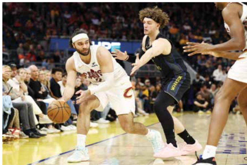
○ من لقاء كافاليرز مع ووريترز.

أما نجم تمبرولفسز أنتوني إدواردز، العائد حديثاً من غياب دام سست مباريات بسبب الإصابة، فقد خرج من التشكيلة في اللحظات الأخيرة بسبب آلام في الركبة.