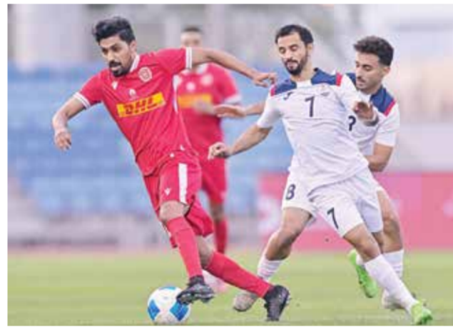
○ من لقاء المحرق وسترة.