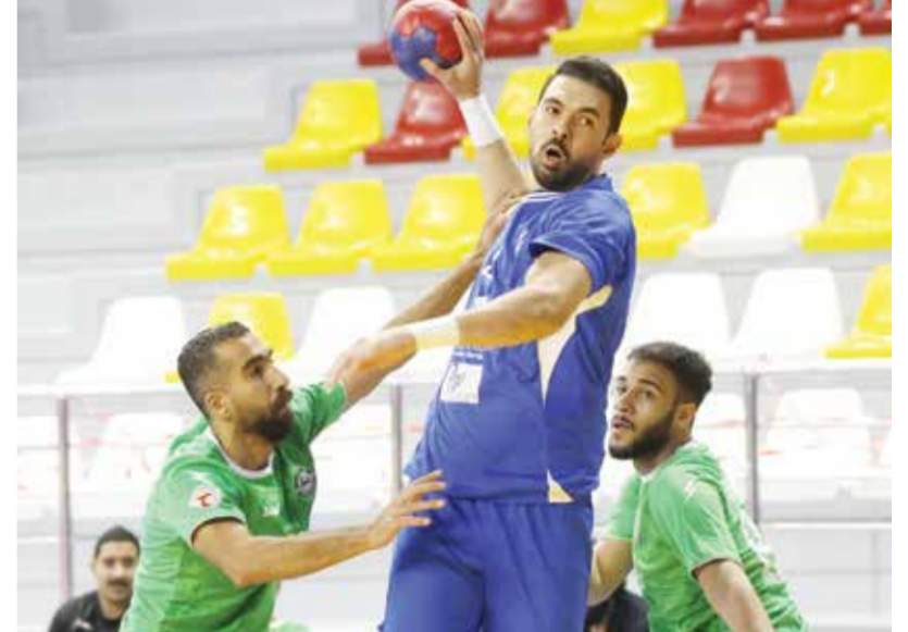
○ من لقاء الديبر والبحرين.