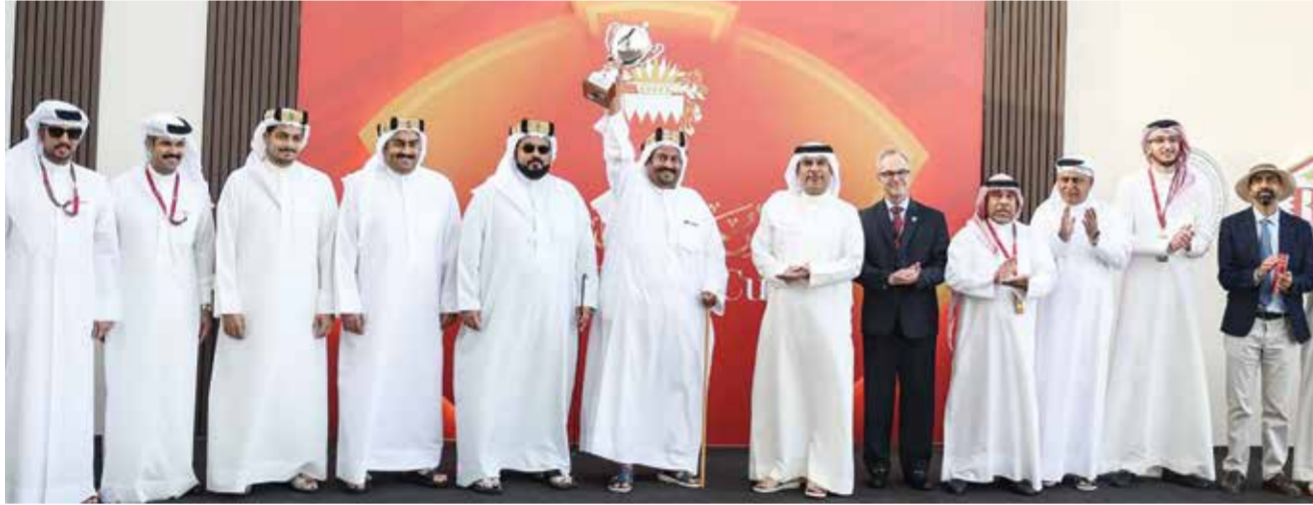
○ جانب آخر من التتويج