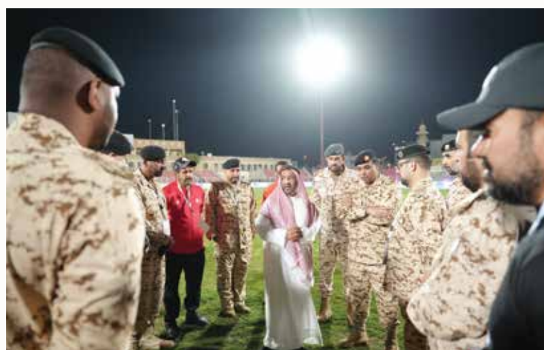
○ بن جلال ومتابعة مستمرة ودعم للكوادر المنظمة.