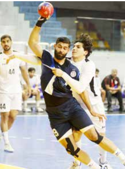
○ من لقاء النجمة وتوبلي.

منافسات الجولة العاشرة بإقامة مواجهة مرتقبة على صالة أم الحصم، حيث يلتقي الأهلي مع الاتحاد عند الساعة 7:00 مساءً.