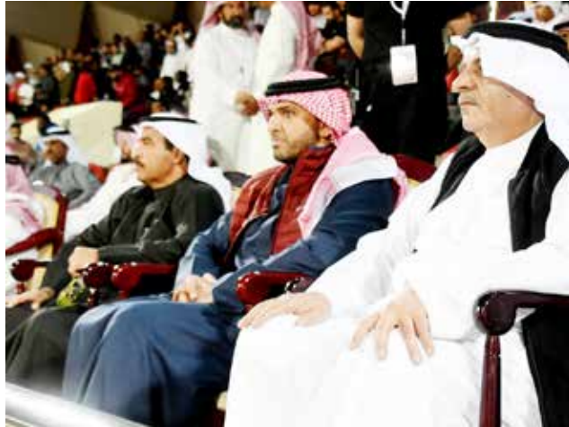
○ حضور رسمي كبير.