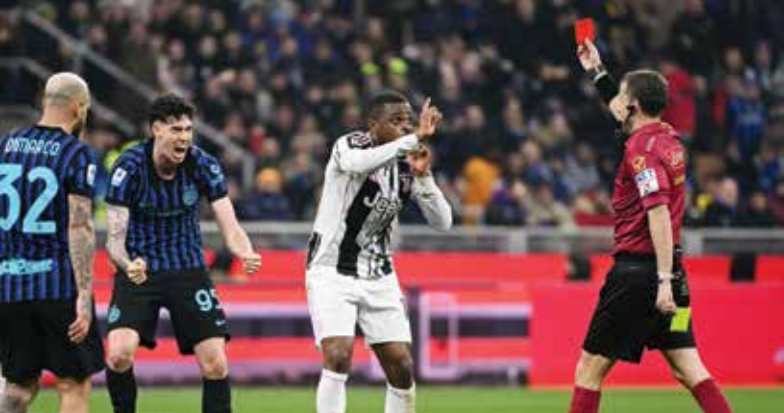
○ لحظة طرد كالولو

وقال روكسي إن لايبنا منزعج جدا من الخطأ الذي ارتكبه، موجها في الوقت نفسه انتقادا إلى باستوني لأن «الحكم لم يكن الوحيد الذي ارتكب خطأ، لقد حصل هناك تمثيل واضح أمس (السبت)». ويموازاة ما اعتبرته وسائل الإعلام خطأ تحكيميا «لطخ» الموقعة بين الفريقين، طالب كثر بعدم استععاء باستوني إلى المنتخب الإيطالي، بينهم الصحفي موقع «توتوميركاتسو» لسوكا كالاماي والصحفي المتخصص بأخبار ميلان، جار إنتر، ألساندرو جاكوبوني الذي كتب على أكس أن مدرب المنتخب جينارو «غاتوزو يحتاج حقبا إلى التفكير في استبعاده وتركه في المنزل. ما فعله باستوني من تصرف ينافي الروح الرياضية ولا ينسجم مع قيم +أثروري+».