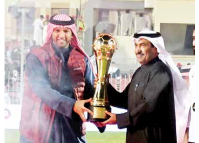
○ نائب قائد الحرس الملكي يتسلم الكأس.