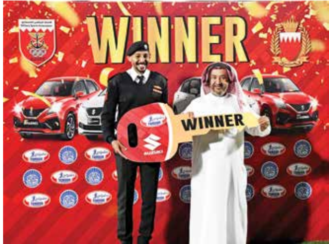
○ مدير الاتحاد الرياضي العسكري يسلم جائزة السيارة.