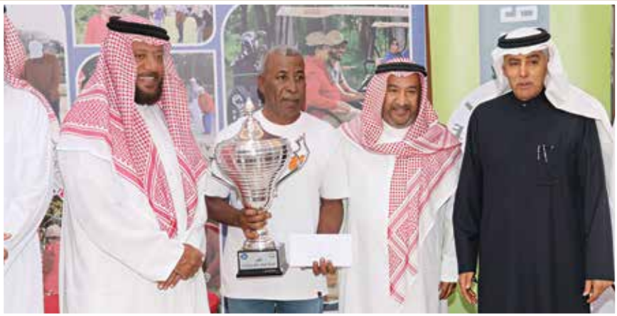
○ جانب من التتويج.