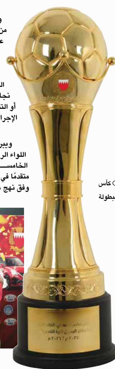
○ كأس البطولة

ويبرز الدور المحوري والمؤثر لرئيس الاتحاد الرياضي العسكري اللواء الركن محمد عبداللطيف بن جلال كأحد أبرز عوامل نجاح النسخة الخامسة، لما يمثله من قيادة إدارية واعية تمتلك رؤية واضحة وفكرًا متقدمًا في إدارة المنظومة الرياضية العسكرية، فقد واصل بن جلال العمل وفق نهج مؤسسي قائم على التخطيط المسبق، والمتابعة الدقيقة، وتوزيع