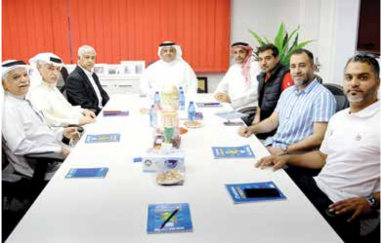
○ جانب من الاجتماع.

وقدم رئيس نادي باربار نبذة عنه وعن أعضاء مجلس الإدارة خالص التهانى والتبريكات بالإنجاز الذي حققه منتخبنا الوطني للرجال لكرة اليد بفوزه ببطولة كأس آسيا 22 والتي أقيمت مؤخراً في دولة الكويت الشقيقة وتأهل المنتخب إلى نهائيات كأس العالم للمرة الثامنة في تاريخه، منوها بالجهود