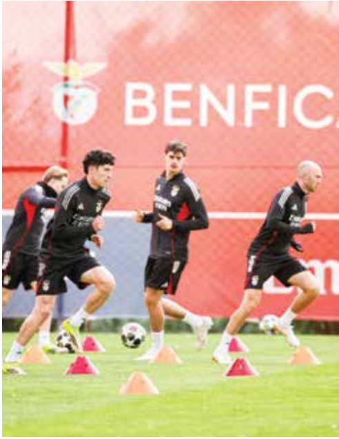
○ تحضيرات بنفيكا.

وعندما جلس مبابي بدلا أمام ريال سوسبيداد السبت