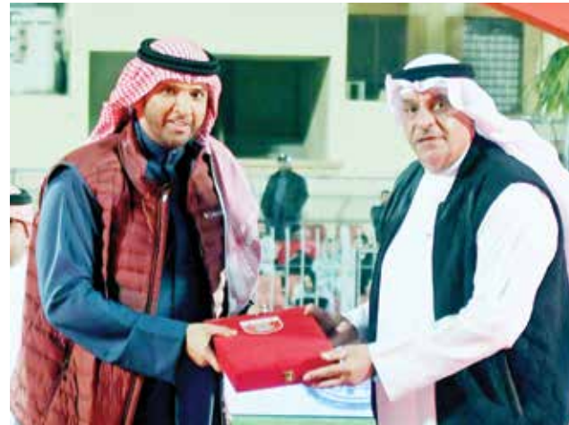
○ قائد سلاح البحرية الملكي يتسلم ميداليات المركز الثاني