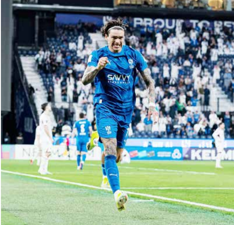
○ احتفالية نونيز.

وكان الشارقة يحتاج إلى الفوز لإحياء آماله في التأهل، لكن خسارته أبقته تاسعا بفارق