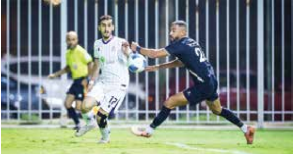
○ من لقاء سابق بين الاتفاق والاتحاد.

في لقاء يأمل من خلاله تكرار النتيجة وإشعال الصراع على الصدارة.