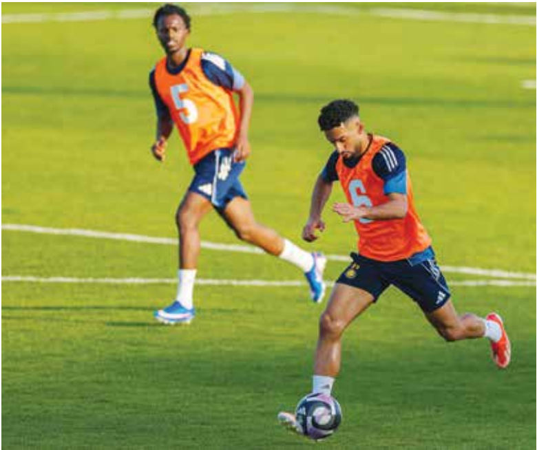
○ تحضيرات النصر.

وفي عمان، يسعى الحسين إربد الأردني إلى استنمار فوزه الثمين