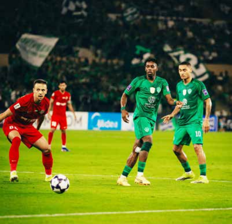
○ من لقاء الأهلي وشباب الأهلي.

وفي بغداد، تخلى الدحيل عن تقدمه 1-2 في غضون أقل من دقيقتين ليمنى بالهزيمة