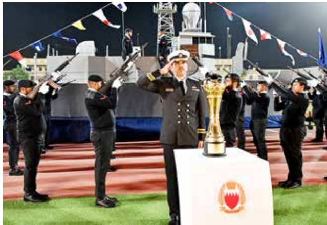
○ كأس البطولة.