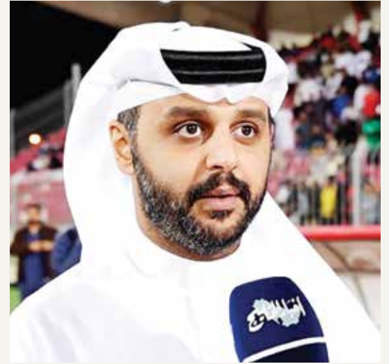
○ الشيخ حمد بن عبدالرحمن آل خليفة.

استهل مدرب الفريق أحمد حسان حديثه بالإشادة باللاعبين على التزامهم وروحهم العالية داخل الملعب، موجِّهًا الشكر الخاص لسمو الشيخ ناصر بن حمد آل خليفة على الدعم المستمر الذي يقدمه للفريق. وأشار حسان إلى أن الفوز بالبطولة يمثل إنجازًا شخصيًا مهمًا له، مؤكدًا أن العمل الجاد والتحضير المكثف ساهم في تحقيق هذا اللقب رغم صعوبته، مشددًا على أن القيادة الملهمة والدعم المتواصل كان لهما دور كبير في استمرار الفريق في حصد الألقاب