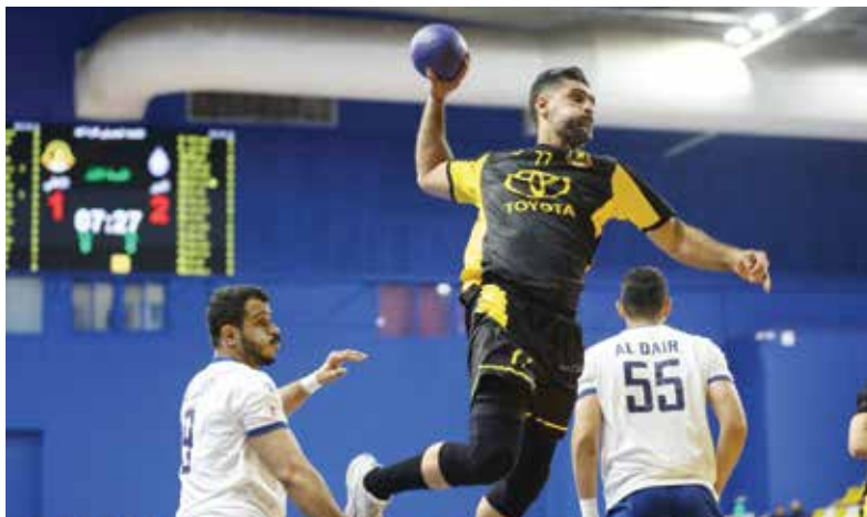
○ من لقاء الأهلي والدير.

يتصدر النجمة الترتيب برصيد (24 نقطة)، يليه الأهلي بـ(23 نقطة)، ثم الشباب ثالثاً بـ(20 نقطة)، ويأتي باربار رابعاً بـ(16 نقطة)، يليه الاتحاد خامساً بـ(16 نقطة)، ثم توبلي سادساً بالرصيد ذاته، والدير سابغاً بـ(16 نقطة)، ويحتل التضامن المركز الثامن بـ(14 نقطة)، ثم سماهيج تاسعاً بـ(13 نقطة)، والاتفاق عاشراً بـ(12 نقطة)، وأخيراً البحرين في المركز الحادي عشر بـ(10 نقاط).