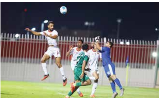
○ من لقاء القسم الأول بين الرفاع الشرقي واتحاد الريف.