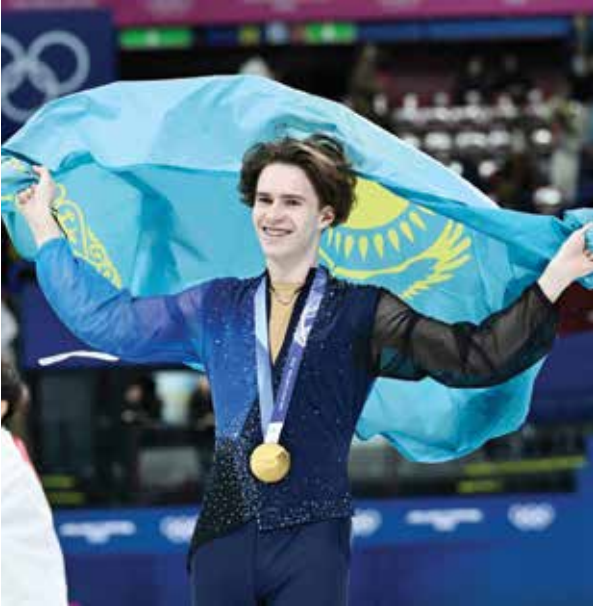
○ شايدوروف. (أ ف ب)

لوس أنجلوس – (أ ف ب): تغلب الأمريكي تايلور فريتس، المصنّف أول في دورة دالاس للتنس (500)، على مواطنه سيباستيان كوردا بعد انتزاع آخر خمس نقاط في شوط كسر التعادل الحاسم، ليلعب الدور نصف النهائي. وبعد مباراة قوية، نجح فريتس، المصنّف سابعاً عالمياً، في قلب تأخره والفوز على كوردا (53) بنتيجة 7-6، 4-6، 7-5 (7/5)، ليحجز موعداً في نصف النهائي السبّبت أمام الكرواتي المخضرم مارين تشيليبتش، الفائز بلقب فلاشينغ ميدوز عام 2014. ولبات فريتس متقدماً 1-4 في سجل مواجهاته مع كوردا، بعدما ضرب 22