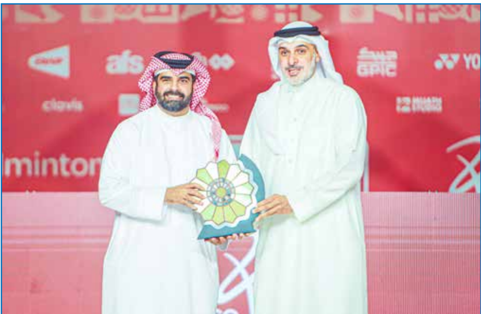
○ تكريم سمو راعي الحفل.