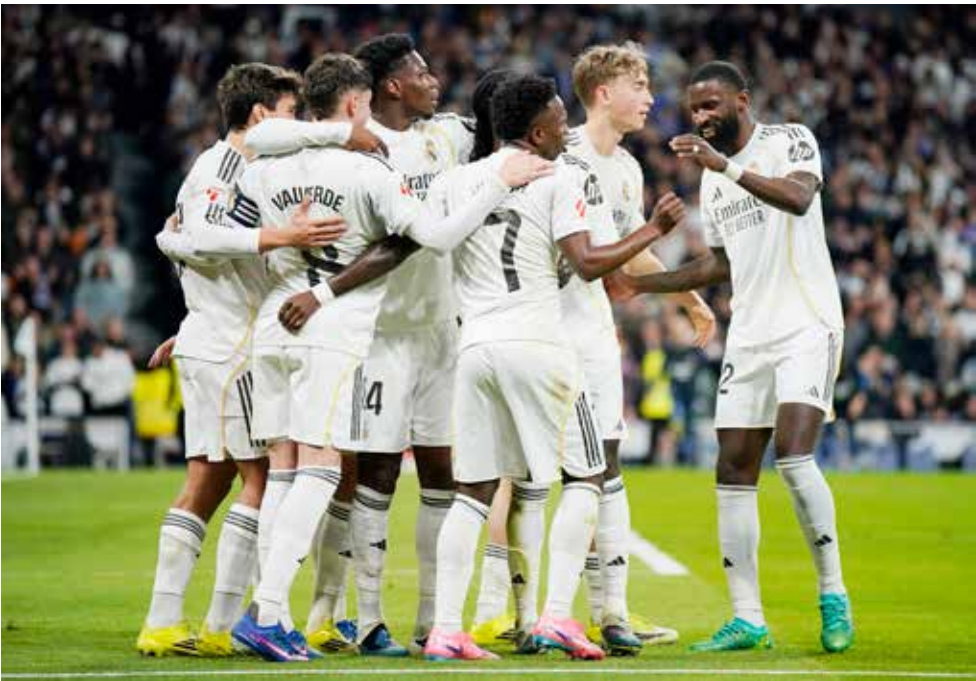
○ فرحة لاعبي ريال مدريد بالهدف الثالث.