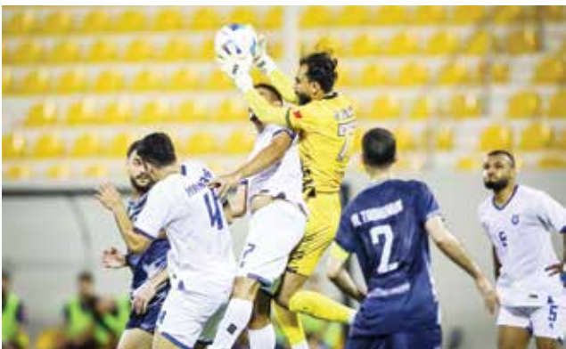
○ من لقاء القسم الأول بين المنامة والتضامن.