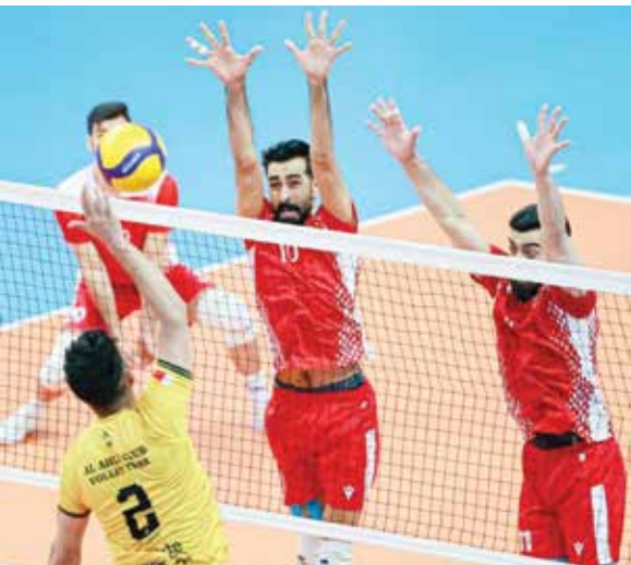
○ من لقاء الفريقين.

تخطى فريق عالي منافسه فريق الدير بثلاثة أشواط مقابل شوطين 25-20، 25-19، 25-22، 25-21، في لقاء ختام الجولة الخامسة عشرة من دوري عيسى بن راشد للكرة الطائرة، الذي أقيم في صالة خليفة الرياضية، وقاده الدوليان