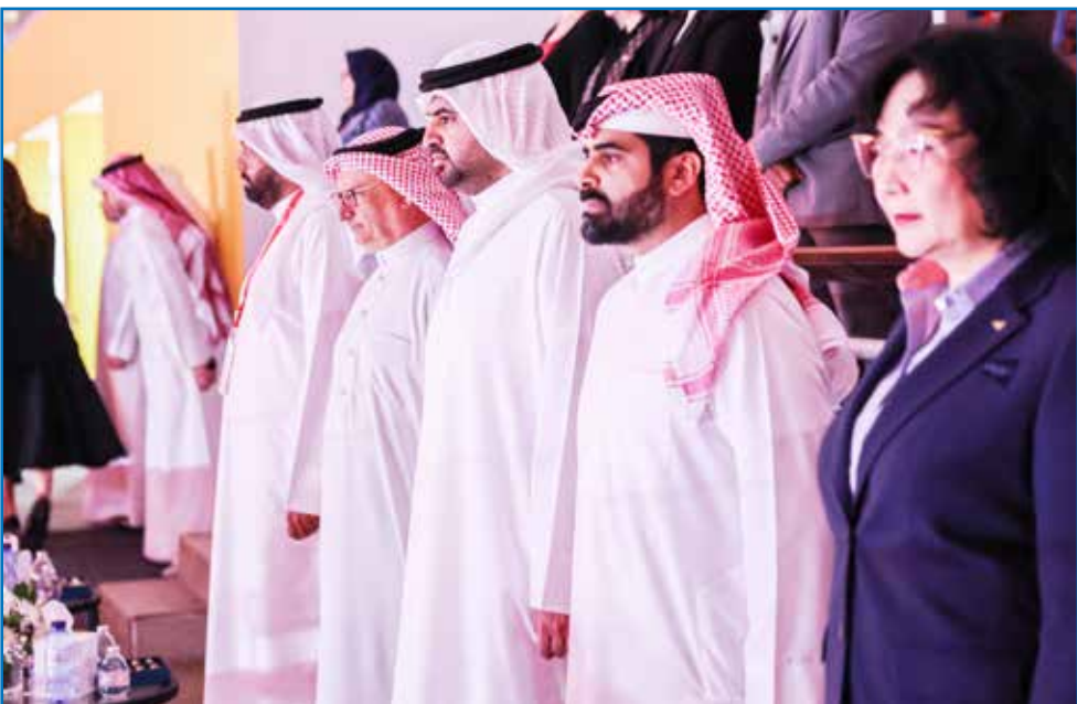
○ حضور رسمي كبير.