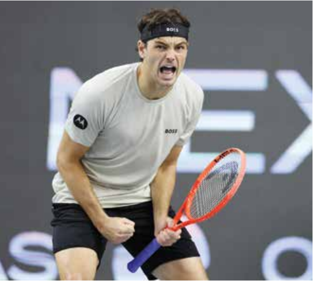
○ فريتس. (أ ف ب)

في التزلج الحر على المنحدرات المزدوجة الوعرة يتسابق متزلجان جنباً إلى جنب على نفس المسار، ويتم تقييمهما على ثلاثة عناصر رئيسية الوقت الانعطافات على المنحدرات والقفزات.