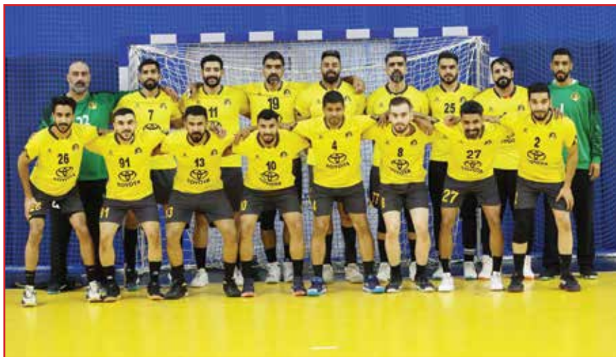
○ فريق الأهلي.