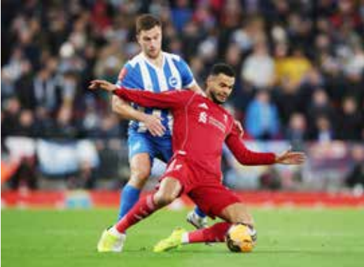
○ من لقاء ليفربول وبرايوتون.

وافتح جوش لورنت التسجيل لأصحاب الأرض (21)، وردّ الضيوف بهدفي ريز أوتس (53) ولويس ريد (80). وعبر ساوثمبتون عقبة ضيفه ليلستر سيتي 2-1 بعد الاحتكام إلى شوتين إضافيين. وافتتح سايل لارين التسجيل للمضيف (1+45 من ركلة جزاء)، وأدرك أوليفر سكيك التعادل للضيوف (52)، قبل منح البديل جيمس بري بطاقة التأهل لساوثمبتون في الدقيقة 109. وتخطى نوريتش سيتي من المستوى الثاني ضيفه وست بروميتش ألبيون من المستوى الثاني أيضًا 3-1.