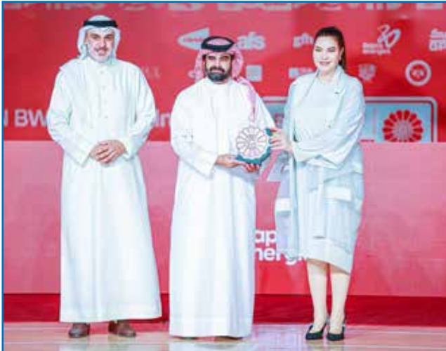
○ جانب من التكريم.

مختلف المحافل. وأوضح رئيس اللجنة البارالمبية البحرينية أن تنظيم هذه البطولة يعكس رؤية استراتيجيّة لترسيخ مكانة البحرين كوجهة رائدة لاستضافة الفعاليات الرياضية الكبرى، لا سيما في مجال الرياضة البارالمبية، بما يعزز حضورها الدولي ويدعم جهود نشر ثقافة الدمج والتكّين الرياضي، ويسهم في دعم الاقتصاد الوطني وتحقيق مستهدفات رؤية البحرين الاقتصادية 2030. ومن جانب آخر، ألقت كوينين باتاما ليسواوتراول، رئيسة الاتحاد الدولي للريشة الطائرة، كلمة أكدت فيها أن استضافة مملكة البحرين لبطولة العالم البارالمبية للريشة الطائرة 2026 تمثل محطة تاريخية ومفصلية في مسيرة هذه الرياضة على المستوى الدولي، باعتبارها أول بطولة عالمية ينظمها الاتحاد الدولي للريشة الطائرة في منطقة الشرق الأوسط، ما يعكس الثقة الدولية الكبيرة في القدرات التنظيمية للمملكة ومكانتها المتقدمة على خارطة الرياضة العالمية. وأوضحت أن البطولة تُعد تنويجاً للنمو المتسارع الذي تشهده رياضة الريشة الطائرة البارالمبية عالمياً، في ظل الارتفاع الملحوظ في أعداد اللاعبين المصنفين دولياً من مختلف القارات، مؤكدة أن هذا التطور يعكس نجاح برامج التطوير والالتزام المشترك بجعل الرياضة أكثر شمولاً وإتاحة للجميع. وتم خلال الحفل عرض فيديو يتضمن مقتطفات من منافسات البطولة، أعقبه عرض مرئي باستخدام تقنيات الإضاءة الحديثة، ثم جرى تكريم سمو راعي الحفل، إلى جانب تكريم الاتحاد الدولي للريشة الطائرة، والراعي الذهبي، والرعاة الفضيين. كما شهد الحفل تتويج اللاعبين الفائزين في مختلف الفئات، وتكريم الرعاة البرونزيين، إضافة إلى تكريم الطاقم الفني للاتحاد الدولي للريشة الطائرة، تقديرًا لجهودهم في إنجاح البطولة.