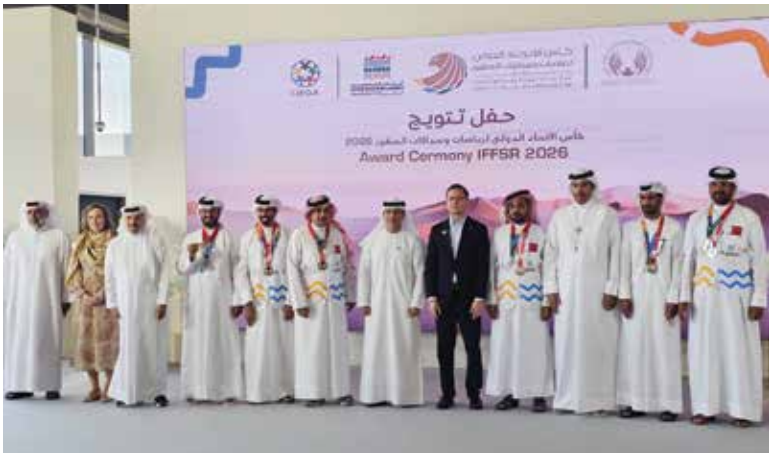
○ جانب من التتويج.