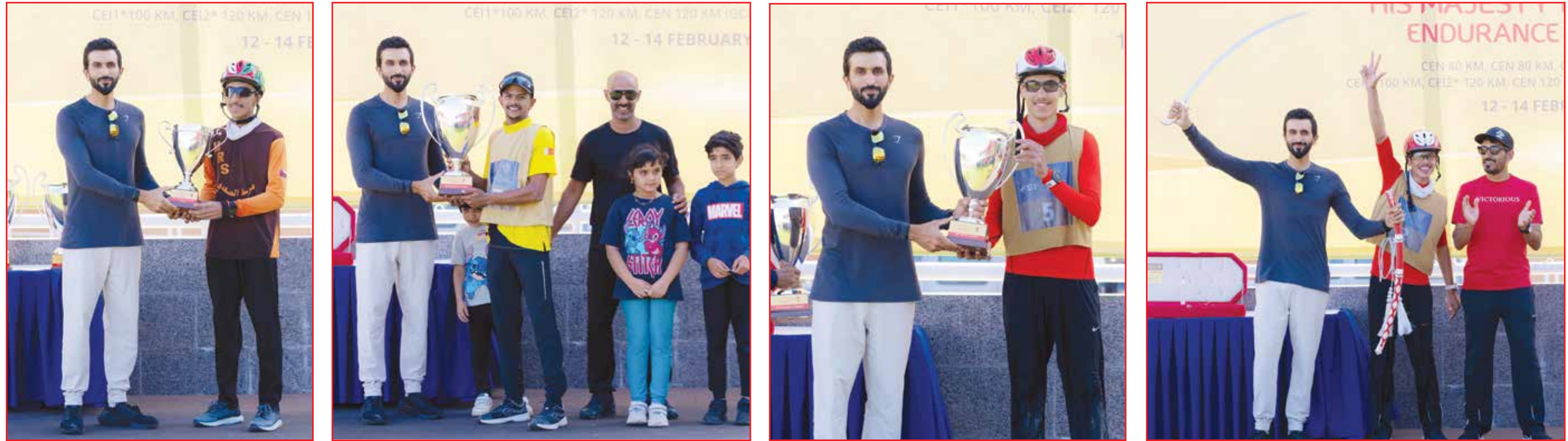
○ سموه يتوج الفائزين.