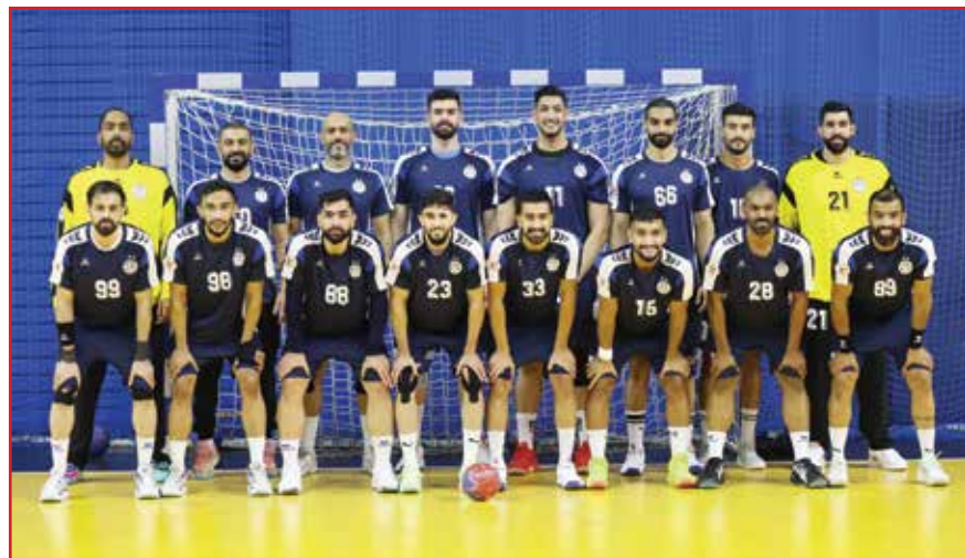
○ فريق النجمة.