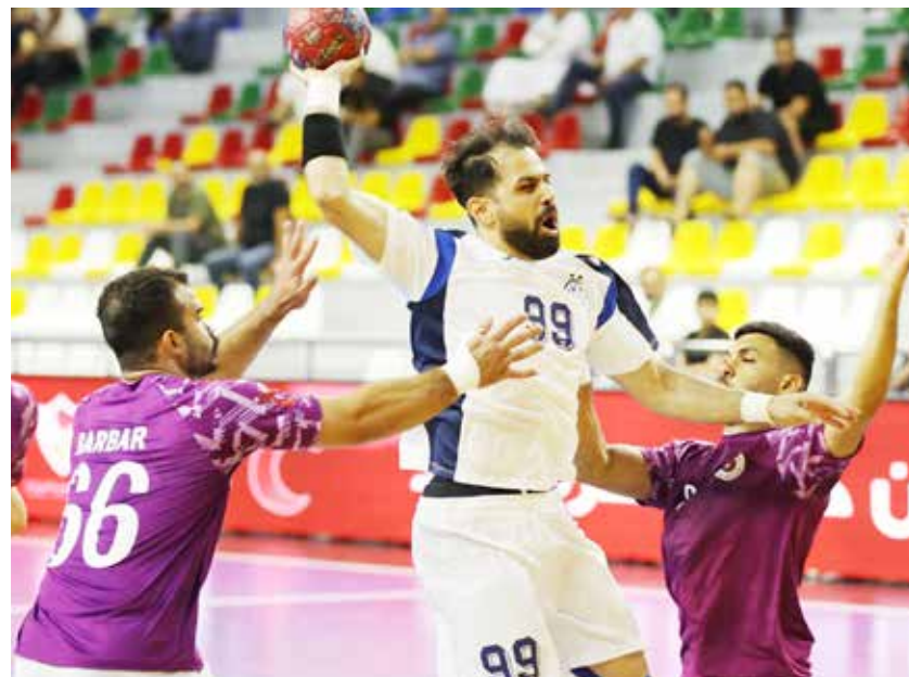
○ من منافسات دوري خالد بن حمد.