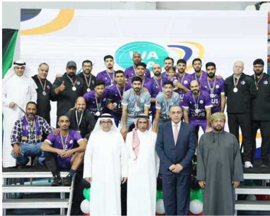
○ تتويج دار كليب.