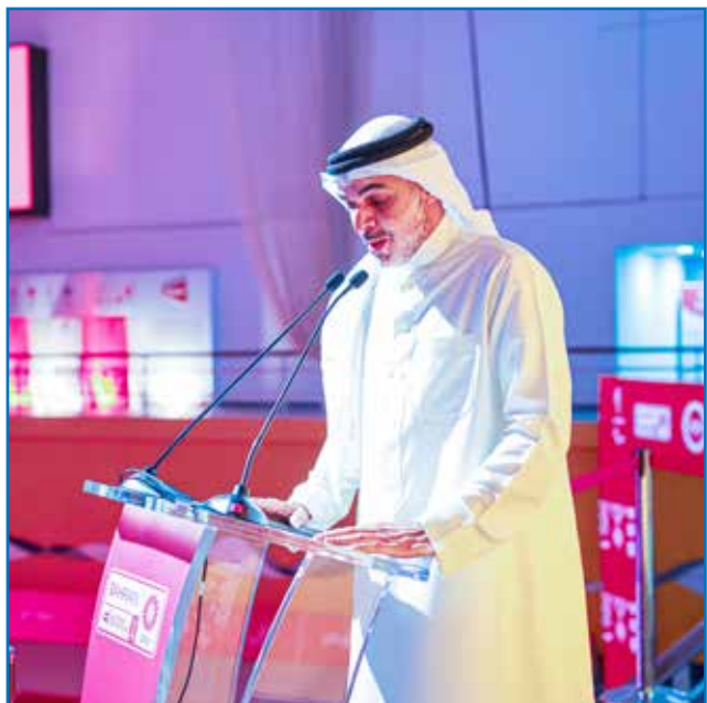
○ الشيخ محمد بن دعيج آل خليفة.