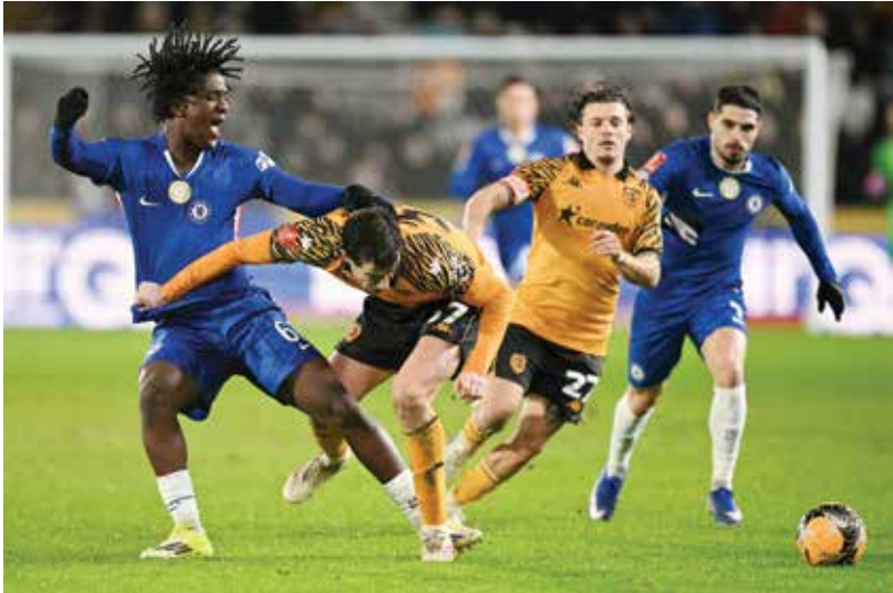
○ من لقاء تشيلسي وهال سيتي

أنهم ليسوا لاعبين جيدين فقط، بل محترفين متميزين. شعرت أن الأداء كان احترافيا للغاية ضد فريق قوي جدا يسعى لل صعود للدوري الإنجليزي الممتاز». وأكد: «لم تكن هذه المباراة سهلة، والأداء الذي قدمه الفريق كان كل ما كنت أريد أن أراه، لكن قبل ذلك، القيم التي يمثلها الفريق الليلة جعلتني مدربا سعيدا جدا». وأكد روسينور أن مارك كوكوريل لم يوجد في قائمة الفريق أمام هال، بسبب إصابة في الفخذ، والتي تعرض لها في مباراة ليدز. ولم يسافر بالمرّة مع الفريق لأن وقت مشاركته لا يزال يدار بعناية.