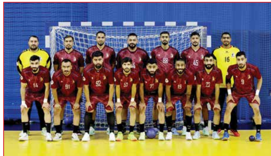
○ فريق الشباب.