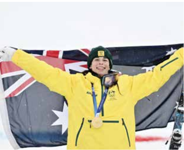
○ أنتوني (أ ف ب)

وحصدت اليابان الميداليتين الفضية والبرونزية عن طريق يوما كاجياما وشون ساتو على الترتيب.