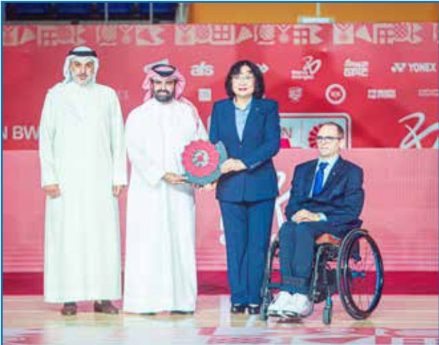
○ تكريم الاتحاد الدولي للريشة الطائرة.

لسياسات وأهداف المجلس الأعلى للشباب والرياضة والهيئة العامة للرياضة، الرامية إلى الارتقاء بالقطاع الرياضي وتعزيز مكانة المملكة على الساحة الدولية، وأشاد بالدعم المتواصل والجهود الكبيرة التي يبذلها سمو الشيخ خالد بن حمد آل خليفة في تطوير الرياضة البارالمبية، وتمكين رياضيي ذوي العزيمة، وتهيئة البيئة المناسبة لهم لتحقيق الإنجازات ورفع اسم البحرين عالياً في