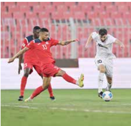
○ من لقاء النجمة وسترة.

وشهدت مواجهات القسم الأول تفوق فرق الرفاع الشرقي والمنامة وأم الحصم، إذ نجح الرفاع الشرقي في الفوز على اتحاد الريف بهدف دون