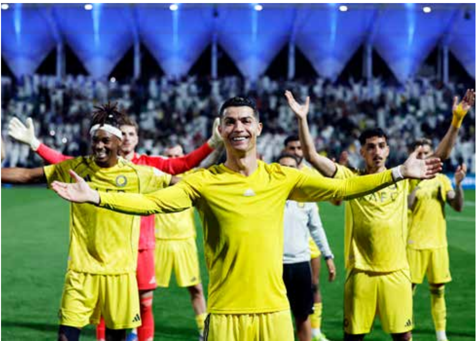
○ احتفالية لاعبي النصر نهاية اللقاء.

وهذا الفوز الثاني تواليا لبايرن بعد خسارته أمام أوغسبورغ 2-1 وتعادله مع هامبورغ 2-2، والـ18 هذا الموسم، فرغ رصيده إلى 57 نقطة، معيدا الفارق إلى ست نقاط بينه وبين مطارده المباشر بوروسيا دورتموند الفائز على ضيفه مانيتس برباعية نظيفة الجمعة في افتتاح المرحلة. ففي المقابل، واصل بريمن نتائجته المخيبة بتلقيه الخسارة الحادية عشرة