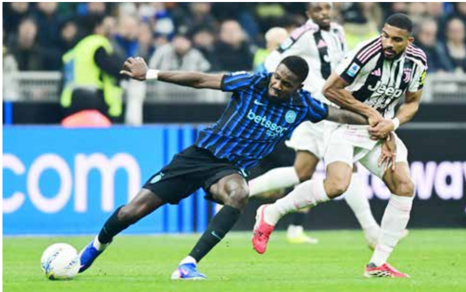
○ من لقاء إنتر ويوفنتوس.

ومن هجمة منسقة ونتويجا لسيطرته، افتتح النصر التسجيل عندما لعب السنغالي ساديو مانيه كرة عرضية وجدت رونالدو