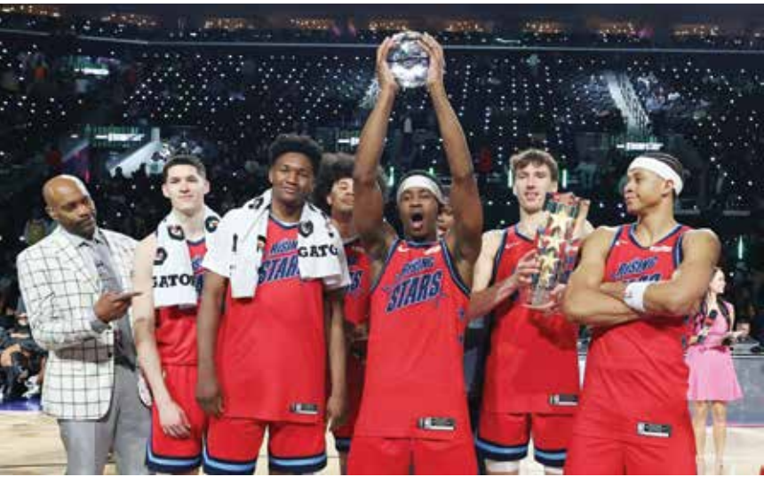
○ فريق فنس كارتر يحتفل باللقب

المباراة بسلسلة من 2-12 ليتغلب على فريق «جي ليغ» بقيادة أوستن ريفرز 34-40.