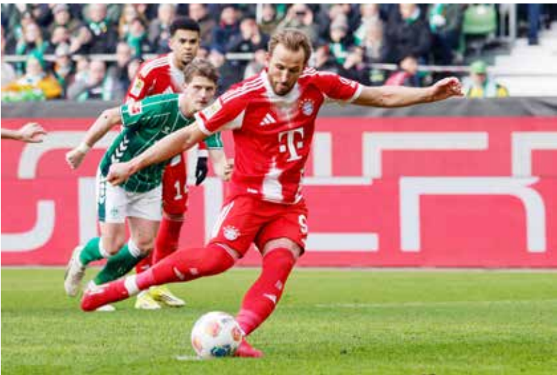
○ كاين يفتتح التسجيل من علامة الجزاء.

هذا الموسم، علما أنه لم يحقق أي فوز في الدوري منذ السابع من نوفمبر الماضي، وخاض 11 مباراة متتالية بلا انتصار حصد خلالها أربع نقاط فقط من أصل 33 ممكنة. كما هي الخسارة الثانية تواليا لبريمن بقيادة مدربه الجديد دانيال ثيون خليفة هورست شستيفن المقال من منصبه الأحد