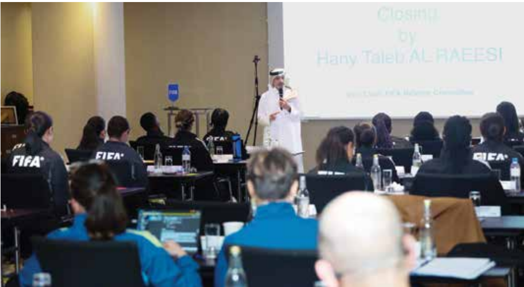
○ جانب من الندوة.

الدوحة – (د ب أ): اختتمت في العاصمة القطرية الدوحة فعاليات ندوة الاتحاد الدولي لكرة القدم (فيفا) لحكام النخبة، المرشحات لإدارة مباريات كأس العالم للسيدات 2027، التي نظّمها الاتحاد الدولي لكرة القدم خلال الفترة من 9 إلى 13 فبراير 2026، بمشاركة متميزة من حكّام يمثلن الاتحادات القارية الآسيوي والإفريقي والأوقيانوسي. وذكر الموقع الرسمي للاتحاد القطري لكرة القدم أن الندوة شهدت مشاركة 16 حكمة دولية، بواقع 7 حكمات من قارة آسيا، و8 حكمات من قارة أفريقيا، وحكمة واحدة من قارة أوقيانوسيا، حيث خضعن لبرنامج متكامل يجمع بين الجوانب النظرية والتطبيقية، بهدف تعزيز الكفاءة الفنية والبدنية، وصقل المهارات التحكيمية وفق أحدث المعايير المعتمدة لدى الفيفا.