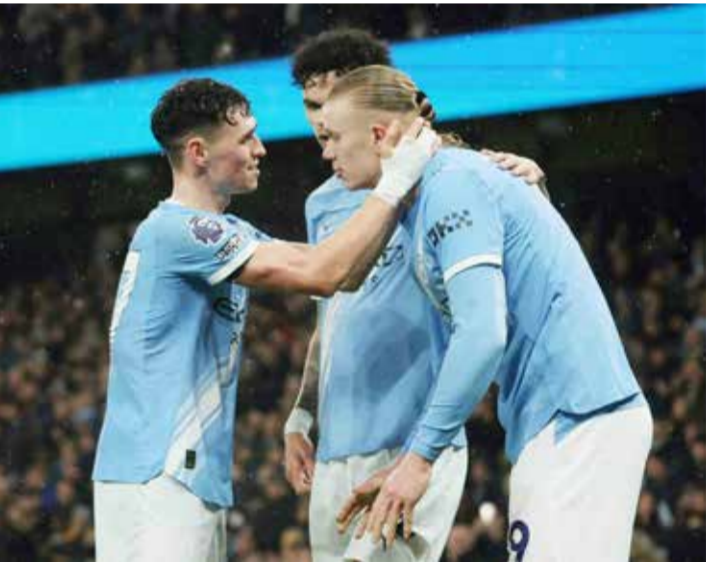
○ هالاند يحتفل مع زملائه

مانشستر – (أ ف ب): يأمل المدرب الإسباني بيب غوارديولا أن يسهم حصول فريقه مانشستر سيتي على توقف نادر دون مباريات منتصف الأسبوعين المقبلين، في إنعاش لاعبيه «المرهقين» قبل المنعطف الأخير من سباق لقب الدوري الإنكليزي لكرة القدم، وذلك بعد الفوز على فولهام 3-0.