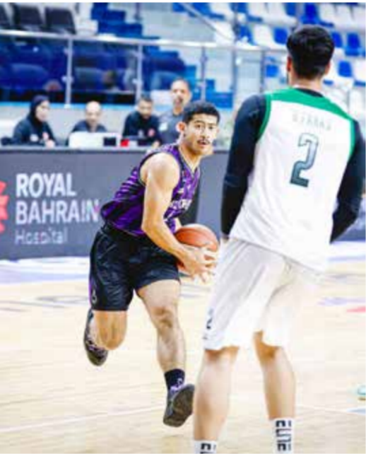
○ من لقاء الاتحاد والبحرين.