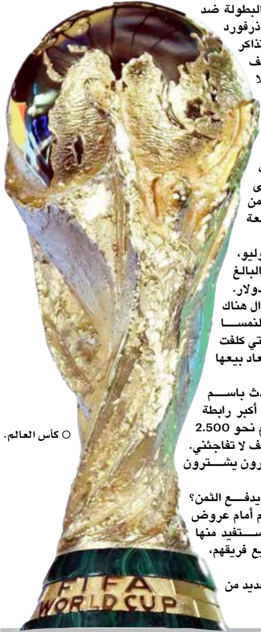
○ كأس العالم.

وبرغم الأسعار المرتفعة، فإن العديد من التذاكر تجد من يشتريها.