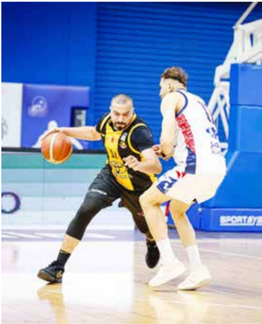
○ من لقاء الأهلي والمنامة.

كما تتواصل منافسات الجولة الثالثة عشرة من دوري الدرجة الأولى بمواجهة قوية تجمع المتصدر المحرق بالنجمة عند الساعة 8:00 مساء.