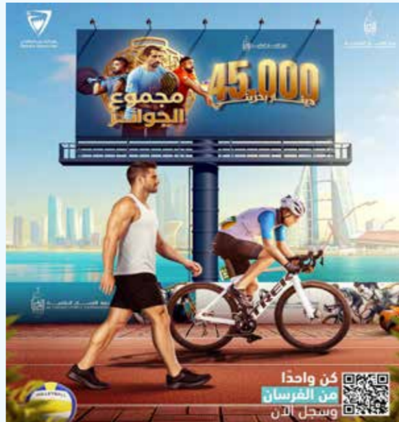
○ إعلان الجوائز.

ومجتمعية تساهم في نشر الثقافة الرياضية وروح التحدي، وتعزز من مشاركة الشباب والفرق في أجواء تنظيمية متميزة.