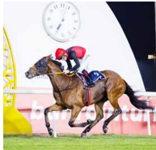
○ الجياد البحرينية المشاركة.