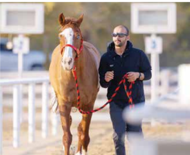
○ جانب من الفحص البيطري.