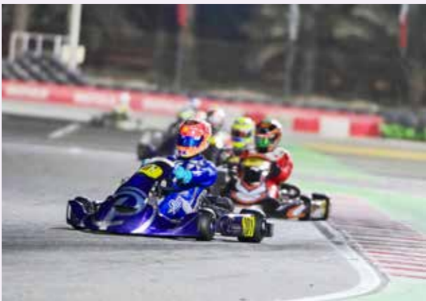
○ جانب من منافسات سابقة.

والسابعة يُمهد لختام البطولة المقرر إقامتها في 18 أبريل. وتدعو حلبة البحرين الدولية للكارتنج الجماهير ومحبي رياضة السيارات إلى المشاركة ضمن بطولات الكارتنج إلى جانب الدخول المجاني لمتابعة إثارة ومنافسات جولات الكارتنج. وجدير بالذكر أن المواسم الماضية لبطولتي الكارتنج المحلية شهدت مشاركة كبيرة وواسعة.