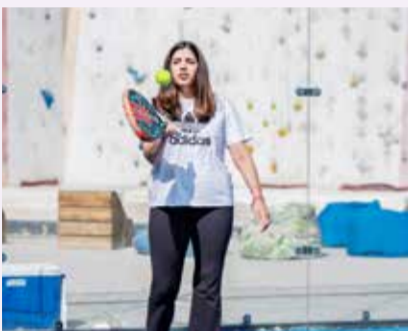
○ من فعالية يوم البحرين الرياضي.

بسن حمد آل خليفة، النائب الأول لرئيس المجلس الأعلى للشباب والرياضة، رئيس الهيئة العامة للرياضة، رئيس اللجنة الأولمبية البحرينية.