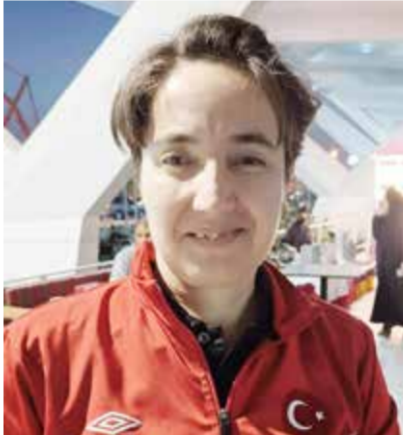
○ هاليمه بلدن.

أشادت لاعبة الترقية هاليمه بلدن، لاعبة الريشة الطائرة البارالمبية وبطلة أوروبا، بالأجواء المميزة التي تشهدها بطولة العالم البارالمبية للريشة الطائرة - البحرين 2026، مؤكدة أن المنافسات تتسم بمستوى عالٍ من القوة والاحترافية بين نخبة لاعبي العالم. وقالت بلدن: إن التنظيم يتميز بالدقة والاحترافية، سواء من حيث تجهيز الملاعب أو انسيابية الجداول والدعم الفني والطبي، مشيرة إلى أن ذلك يوفر بيئة مثالية تساعد اللاعبين على التركيز وتقديم أفضل أداء. وأضافت أن ما لفت انتباهها أيضاً هو الحضور الواضح للثلاثاء البحريني والثقافة المحلية في أجواء البطولة، سواء من خلال اللاعبين على التركيز وتقديم أفضل أداء. وأضافت أن ما لفت انتباهها أيضاً هو الحضور الواضح للثلاثاء البحريني والثقافة المحلية في أجواء البطولة، سواء من خلال اللاعبين على التركيز وتقديم أفضل أداء.