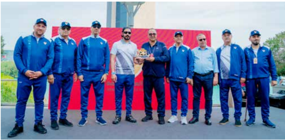
○ جانب من التكرم.

الرياضة كركيزة أساسية في بناء الإنسان البحريني صحباً وبدنياً ونفسياً، ويعزز من توجهاتنا نحو مجتمع أكثر حيوية وإنتاجية. إن ما شهدناه اليوم من مشاركة رسمية وشعبية واسعة يعكس الوعي المتنامي بأهمية الرياضة كأسلوب حياة، ويؤكد أن يوم البحرين الرياضي أصبح محطة وطنية مهمة لتعزيز الترابط المجتمعي ونشر ثقافة النشاط البدني بين جميع أفراد المجتمع. وأشاد سموه بالمشاركة الفاعلة من مختلف الوزارات والهيئات والمؤسسات، إلى جانب الحضور الجماهيري الكبير، مؤكداً أن تكاتف الجهود الرسمية والمجتمعية يسهم في إنجاح مثل هذه المبادرات الوطنية التي تعزز من مكانة البحرين كنموذج رياضي في دعم الحركة الرياضية. واختتم سمو الشيخ خالد بن حمد آل خليفة تصريحه بتأكيد مواصلة دعم البرامج والمبادرات التي تهدف إلى توسيع قاعدة الممارسة الرياضية، انطلاقاً من التوجهات الملكية السامية، وبما يسهم في تحقيق مستهدفات رؤية البحرين في بناء مجتمع صحي ونشط.