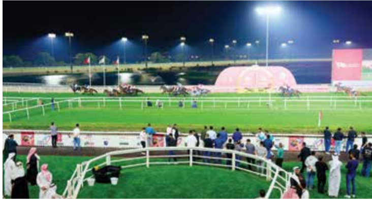
○ جانب من المنافسات.