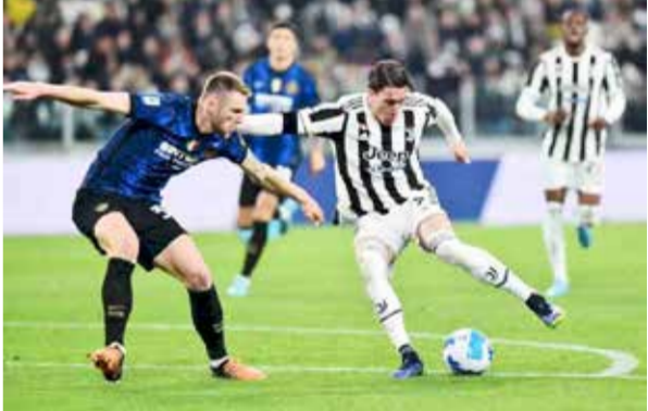
○ من لقاء سابق بين إنتر ويوفنتوس.

وأشار إلى أن بوقرة الذي توج مع منتخب الجزائر الريدف بكأس العرب 2021، يمتلك علاقات كثيرة ويمكن أن يفتح لعابين من أصول لبنانية للعب مع المنتخب.