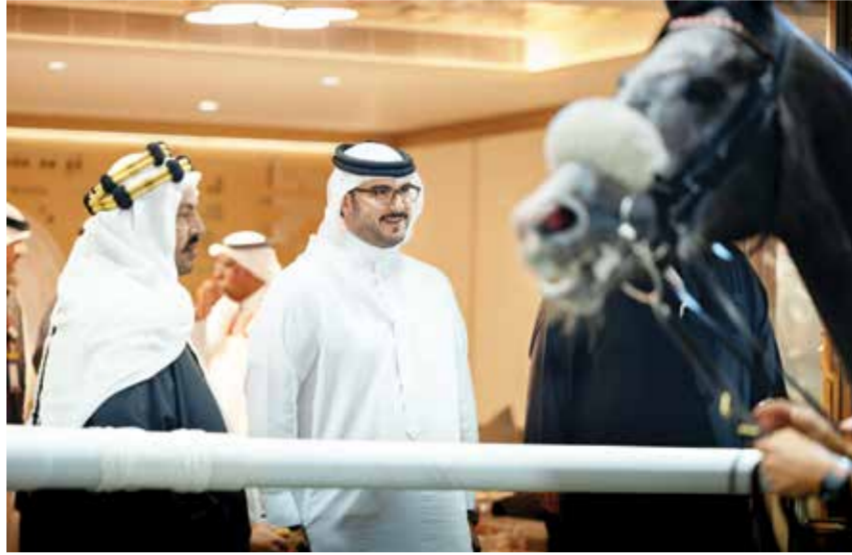
○ سموه يتابع السباق.