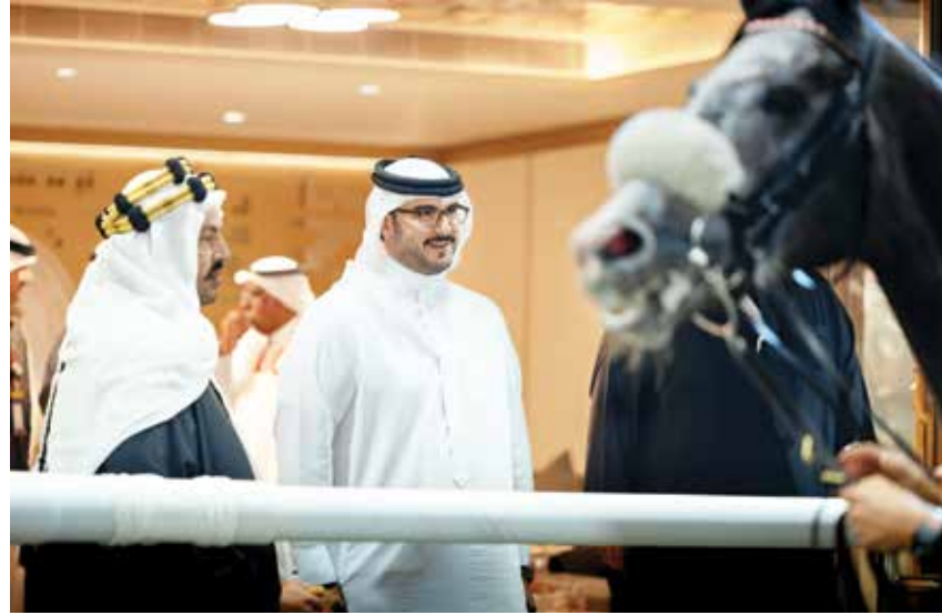
○ سموه يتابع السباق.