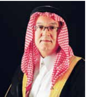
○ الأمير عمرو الفيصل.

نجم بنك الإثمار في تحقيق أداء قوي خلال العام، ليؤكد على التزامه بتحقيق نمو مستدام، بالإضافة إلى التميز والكفاءة في العمليات. وقد ظهر تقدم البنك المتواصل في الارتفاع الملحوظ للحسابات الاستثمارية للعملاء، حيث بلغ إجمالي كل من الحسابات الجارية وشبه حقوق الملكية 2.25 مليار دينار بحريني كما في 31 ديسمبر 2025، أي ارتفاع بنسبة 31.1 في المائة من 1.71 مليار دينار بحريني سجل في العام السابق. وقد ساهم هذا النمو في تحسين وضع السيولة، حيث نمت الأرصدة النقدية ودائع السلع بنسبة 15.7 في المائة لتصل إلى 237.45 مليون دينار بحريني من 205.21 ملايين دينار بحريني في العام السابق». وأضاف المسقطي: «إن إدارتنا الحذرة لتكاليف التمويل، والتي انخفضت بنسبة 30.6 في المائة من الأرباح المدفوعة إلى حاملي شبه حقوق الملكية، قد ساعدت البنك في التعامل مع تحديات بيئة السوق الصعبة المتقلبة في ارتفاع معدلات الأرباح المتوقعة