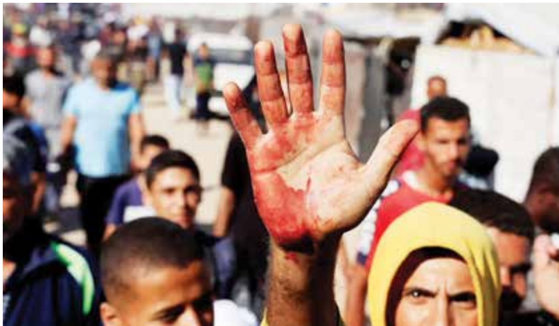
○ فلسطيني يعرض كفه المخبضة بدماء أحد متطوعي المساعدات في غزة.

دولية أخرى بسبب مقتل فلسطينيين لدى محاولتهم الوصول إلى مواقع المساعدات التابعة لها، في مناطق ينتشر بها الجيش الإسرائيلي حيث كان يفتح النار مما أسفر عن مقتل المئات، وزعم الجيش الإسرائيلي أن جنوده كانوا يطلقون النار رداً على تهديدات ولتفريق حشود. وقال المتحدث باسم يو.جي سوليوشنز يوم الأربعاء إن الشركة «قدمت معلومات ومقترحات