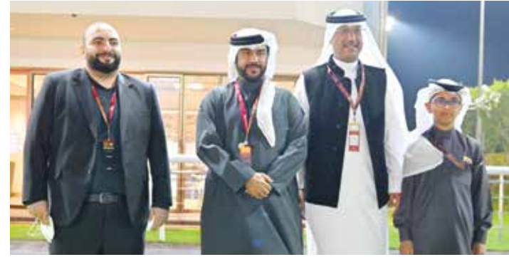
○ جانب من الحضور.