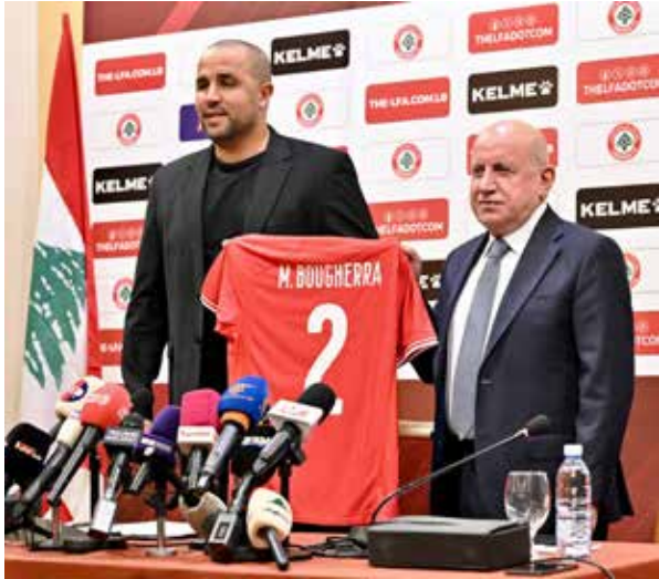
○ بوقرة مدبرا لبنان.

ويصّب تاريخ المواجهات المباشرة في مصلحة العملاق البافاري، حيث فاز بايرن ميونخ في آخر ثلاثة لقاءات جمعت الفريقين وسجل خلال تلك المباريات 12 هدفا دون أن تتلقى شباكه أي أهداف، جاءت تلك الانتصارات بنتيجة 4 / صفر و 3 / صفر و 5 / صفر. ويفتتح بوروسيا دورتموند