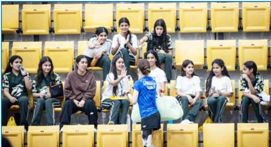
○ حضور طلبة المدارس.