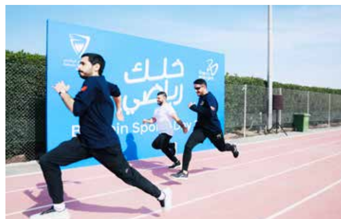
○ جانب من الفعاليات.

المجموعة بتعزيز قيم الرياضة والصحة والرفاه، وبما ينسجم مع توجهات القيادة الرشيدة في جعل هذه المناسبة الوطنية يوماً للاحتفاء بالرياضة كأسلوب حياة، وتعزيز الوعي بأهميتها في دعم جودة الحياة والصحة العامة. وتحرص بابكو إنرجيز على تعزيز صحة الموظفين ورفاههم، ودعم بيئة العمل، وتكريس ثقافة النشاط البدني وجودة الحياة، باعتبارها إحدى الركائز المهمة التي تؤمن بها المجموعة في إطار مسؤوليتها الاجتماعية ودورها الوطني.