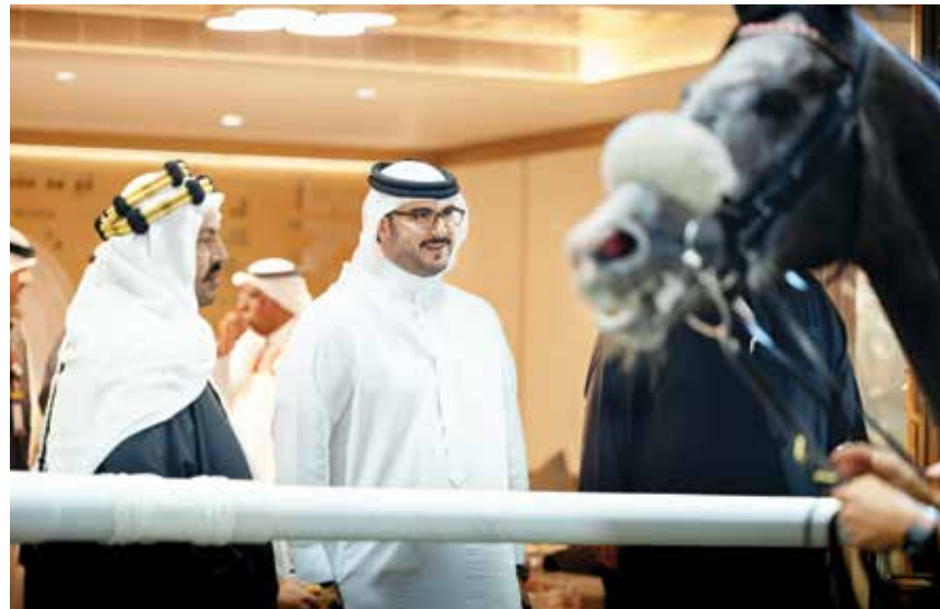
○ سموه يتابع السباق.