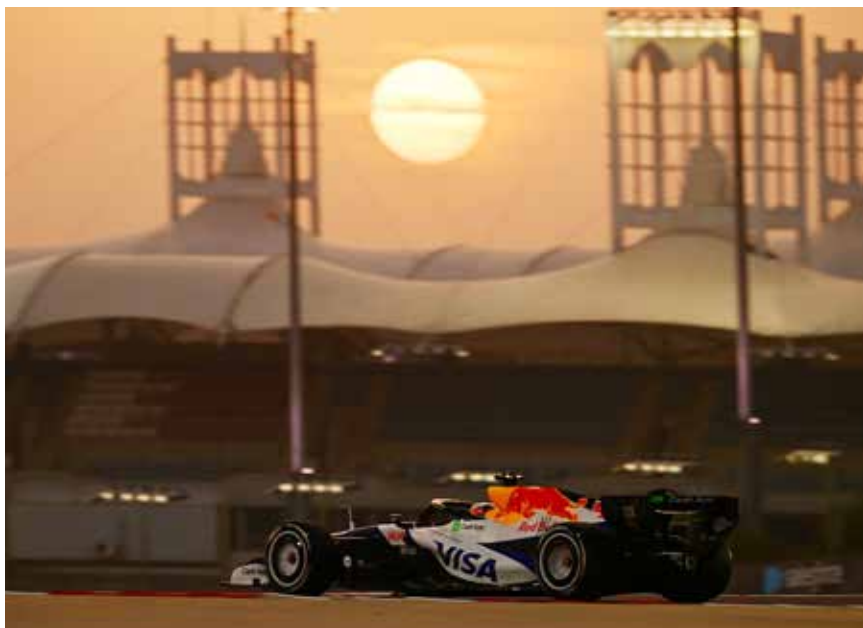
○ من التجارب