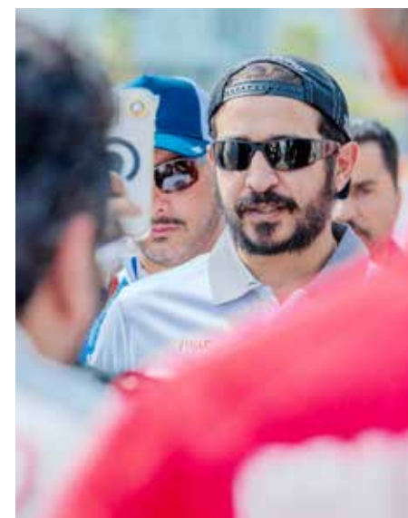
○ سمو الشيخ خالد بن حمد آل خليفة.