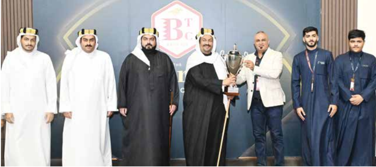
○ جانب من التتويج.