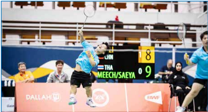
○ جانب من المنافسات.