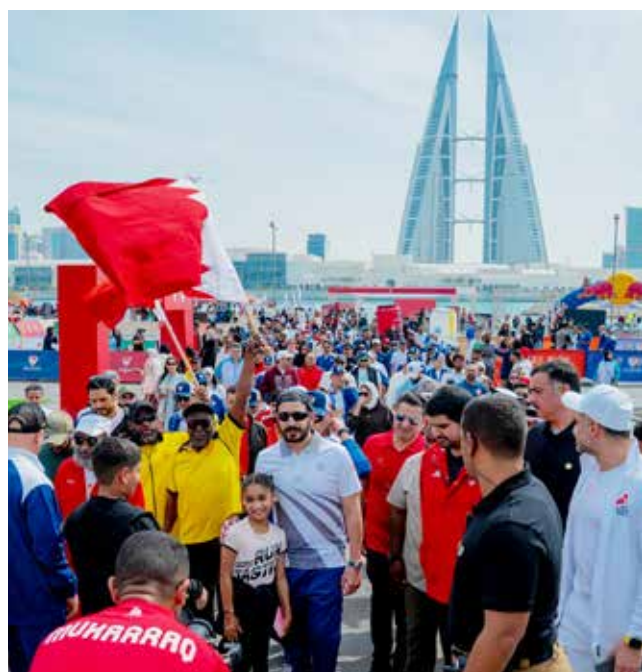
○ سموه يتقدم المشاركين في الفعاليات.

الرياضة كركيزة أساسية في بناء الإنسان البحريني صحباً وبدنياً ونفسياً، ويعزز من توجهاتنا نحو مجتمع أكثر حيوية وإنتاجية. إن ما شهدناه اليوم من مشاركة رسمية وشعبية واسعة يعكس الوعي المتنامي بأهمية الرياضة كأسلوب حياة، ويؤكد أن يوم البحرين الرياضي أصبح محطة وطنية مهمة لتعزيز الترابط المجتمعي ونشر ثقافة النشاط البدني بين جميع أفراد المجتمع. وأشاد سموه بالمشاركة الفاعلة من مختلف الوزارات والهيئات والمؤسسات، إلى جانب الحضور الجماهيري الكبير، مؤكداً أن تكاتف الجهود الرسمية والمجتمعية يساهم في إنجاح مثل هذه المبادرات الوطنية التي تعزز من مكانة البحرين كنموذج رياضي في دعم الحركة الرياضية. واختتم سمو الشيخ خالد بن حمد آل خليفة تصريحه بتأكيد مواصلة دعم البرامج والمبادرات التي تهدف إلى توسيع قاعدة الممارسة الرياضية، انطلاقاً من التوجهات الملكية السامية، وبما يساهم في تحقيق مستهدفات رؤية البحرين في بناء مجتمع صحي ونشط.