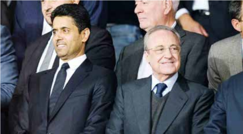
○ بيريز مع الخلفي.

«خلافاتهم القانونية المتعلقة بالدوري السوبر ليغ الأوروبي»، ما وضع نهاية لنزاع سُمّ العلاقات بين النادي الإسباني العريق، المتوجّ 15 مرة بدوري الأبطال، والاتحاد القاري. وكان مشروع «السوبر ليغ»، الذي هدّف إلى منافسة دوري الأبطال، قد أطلق عام 2021 بقيادة ريال مدريد وبرشلونة ويوفنتوس وستة أندية إنكليزيّة، لكنه انهار سريعا بفعل المعارضة الشرسة من المشجعين في إنكلترا وعدد من قادة الدول الأوروبية. وكان يوفنتوس قد انسحب من المشروع عام 2024، قبل أن ينسحب برشلونة أيضا السبت الماضي، تاركا ريال مدريد وحيدا في الواجهة. وقال تشيفرين مؤكدا: «لا يمكن شراء كرة القدم ولا بيعها لأنها ملك للجميع».