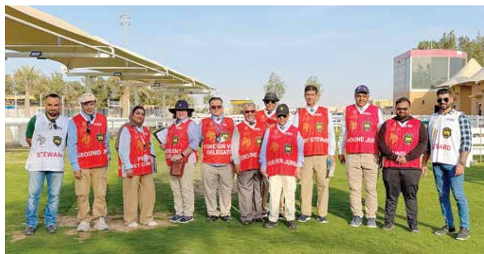
○ صورة جماعية.