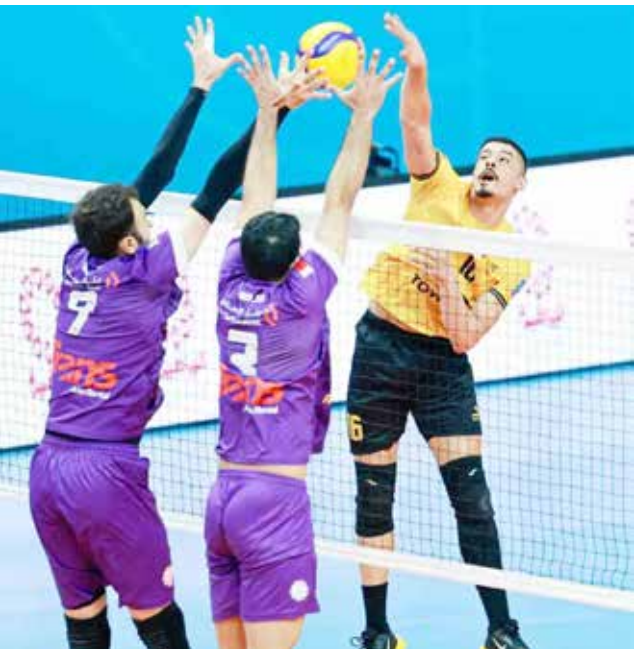
○ من لقاء داركليب والأهلي في نصف النهائي.