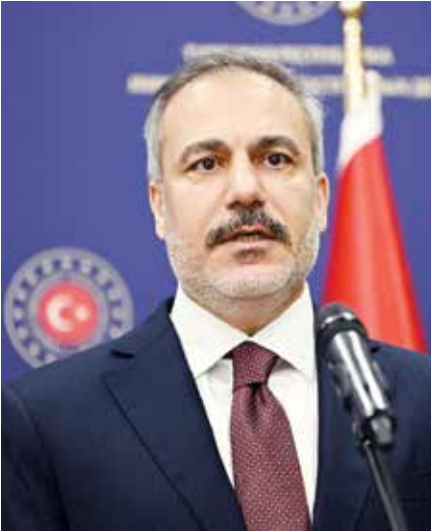
◌ هاكان فيدان.

وقال ترامب يوم الثلاثاء إنه يدرس إرسال حاملة طائرات ثانية إلى الشرق الأوسط إذا لم يتم التوصل إلى اتفاق مع إيران، في وقت تستعد فيه واشنطن وطهران لاستئناف المحادثات.