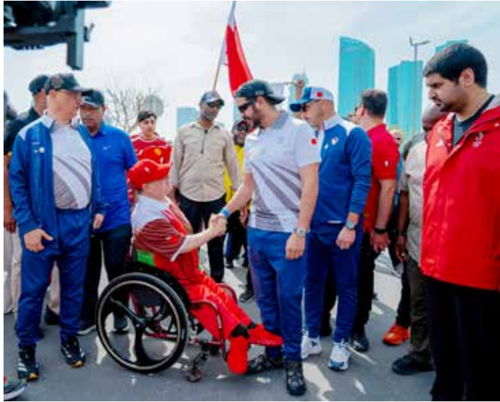
○ سموه يصافح أحد المشاركين.