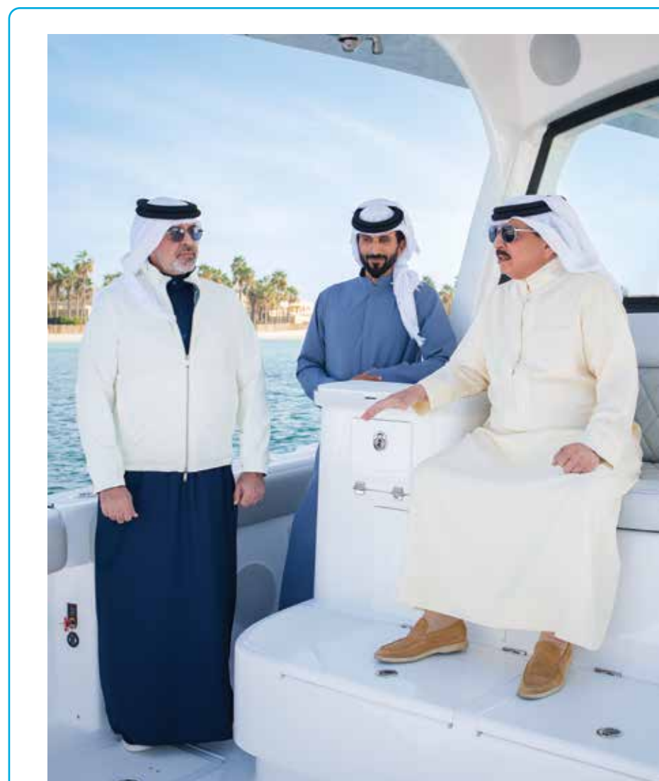
○ جلالة الملك المعظم خلال مشاركته في الرياضة البحرية.

ولفت صاحب السمو الملكي ولي العهد رئيس مجلس الوزراء إلى الحرص المشترك على مواصلة تعزيز