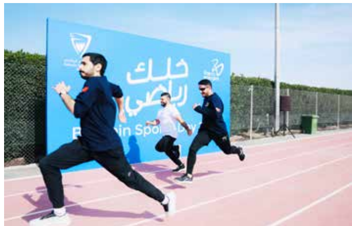
○ جانب من الفعاليات.

المجموعة بتعزيز قيم الرياضة والصحة والرفاء، وبما ينسجم مع توجهات القيادة الرشيدة في جعل هذه المناسبة الوطنية يوماً للاحتفاء بالرياضة كأسلوب حياة، وتعزيز الوعي بأهميتها في دعم جودة الحياة والصحة العامة. وتحرص بابكو إنرجيز على تعزيز صحة الموظفين ورفاههم، ودعم بيئة العمل، وتكريس ثقافة النشاط البدني وجودة الحياة، باعتبارها إحدى الركائز المهمة التي تؤمن بها المجموعة في إطار مسؤوليتها الاجتماعية ودورها الوطني.