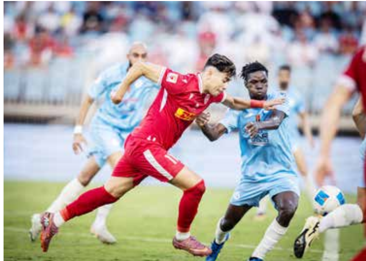
○ من لقاء سابق بين المحرق والرفاع.

شاركت بابكو إنرجيز- مجموعة الطاقة المتكاملة التي تقود أمن الطاقة واستدامتها للأجيال القادمة في مملكة البحرين، في فعاليات النسخة العاشرة من يوم البحرين الرياضي، استجابة لقرار مجلس الوزراء المؤقر، برئاسة صاحب السمو الملكي الأمير سلمان بن حمد آل خليفة، ولي العهد رئيس مجلس الوزراء، حفظه الله، بتخصيص نصف يوم عمل لممارسة النشاط الرياضي، إنفاذاً لقرار أصحاب السمو والمعالين والسعادة رؤساء اللجان الأولمبية بدول مجلس التعاون الخليجي، بتنظيم «يوم رياضي» في كل دول