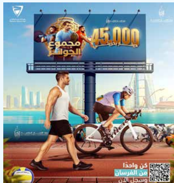
○ إعلان الجوائز.

ومجتمعية تساهم في نشر الثقافة الرياضية وروح التحدي، وتعزز من مشاركة الشباب والفرق في أجواء تنظيمية متميزة.