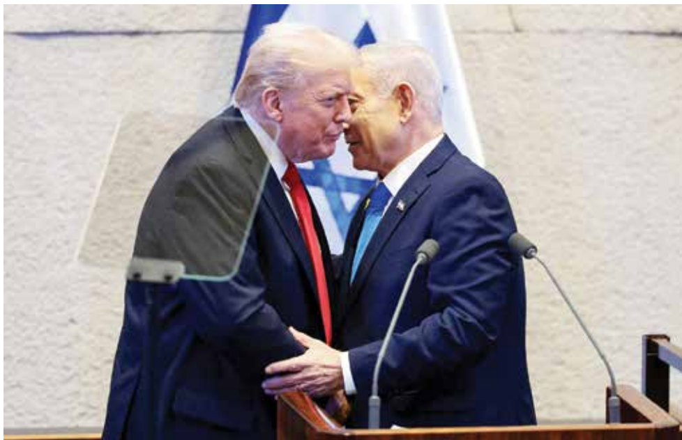
○ ننتياهو وترامب في لقاء سابق.