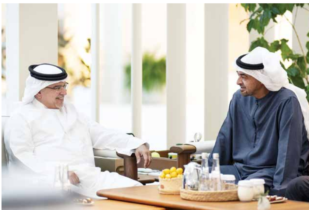
○ سمو ولي العهد رئيس الوزراء خلال لقائه سمو رئيس دولة الإمارات.

كما جرى بحث سبل تعزيز أوجه التعاون المشترك بين البلدين الشقيقين، والقضايا ذات الاهتمام المشترك.