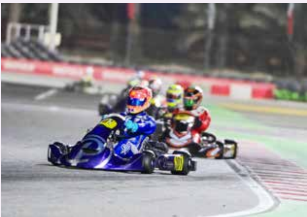
○ جانب من منافسات سابقة.