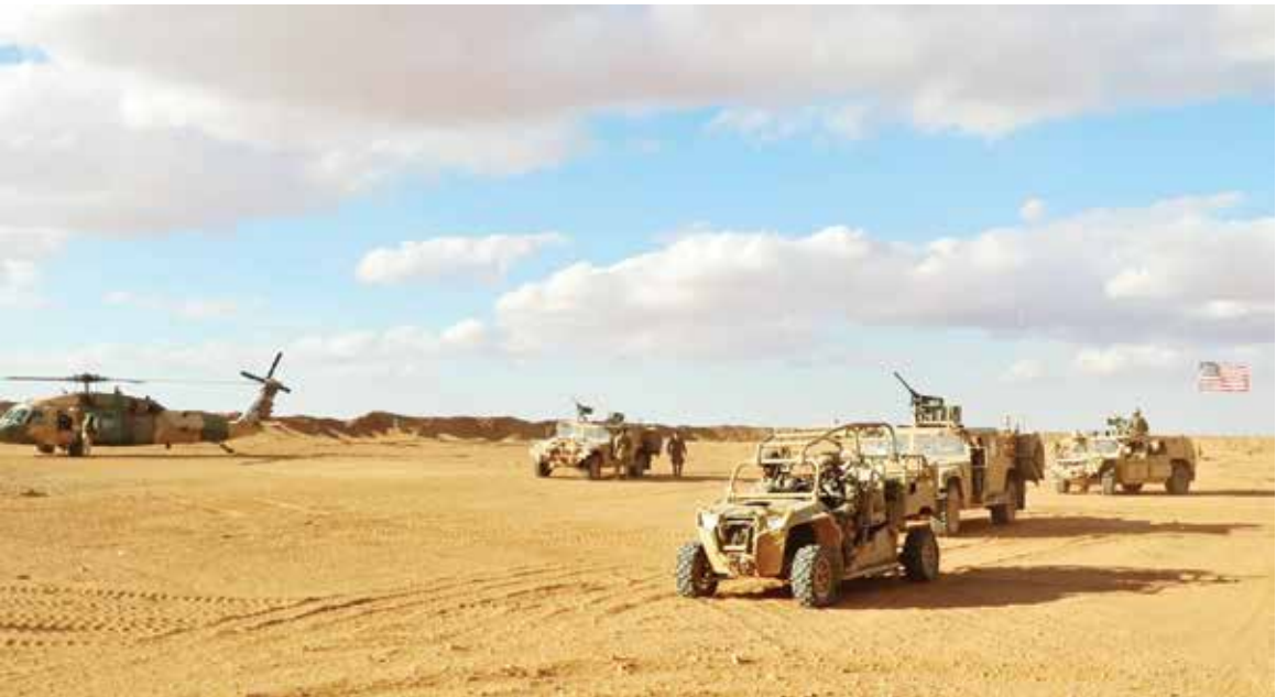
◌ قوات أمريكية تتسحب من قاعدة التنف.

دمشق – (أ ف ب) أعلنت وزارة الدفاع السورية أمس تسلمها قاعدة التنف الواقعة على الحدود مع الأردن والعراق في جنوب شرق البلاد، بعيد انسحاب القوات الأمريكية التي كانت منتشرة فيها في إطار التحالف الدولي لمكافحة تنظيم الدولة الإسلامية. وتنشر الولايات المتحدة جنودا في سوريا والعراق في إطار التحالف الدولي لمكافحة تنظيم الدولة الإسلامية الذي شكلته في العام 2014، بعدما سيطر التنظيم على مساحات شاسعة من البلدين إلى حين دحره من آخر معاقله العراق في العام 2017 وفي سوريا في العام 2019.