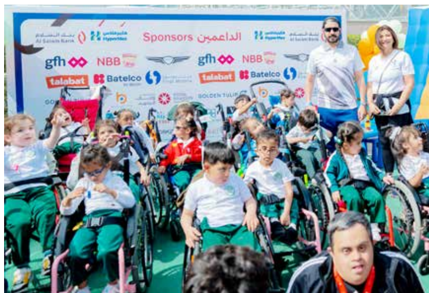
○ سموه مع الأطفال.