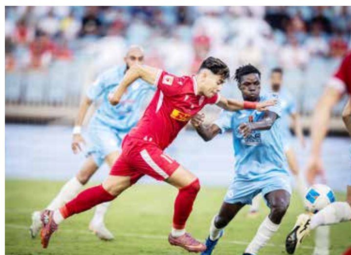
○ من لقاء سابق بين المحرق والرفاع.

ومن المتوقع أن تشهد المباراة حضوراً جماهيرياً لافتاً في ظل الشعبية الكبيرة التي يتمتع بها الناديان، ما يمنح اللقاء أجواء خاصة تليق بنهاية يحمل اسم سمو الشيخ خالد بن حمد آل خليفة. وتبقى جميع الاحتمالات واردة في قمة كروية ينتظر أن تحسم بتفاصيل صغيرة بين فريقين يعرف كل منهما الآخر جيداً.