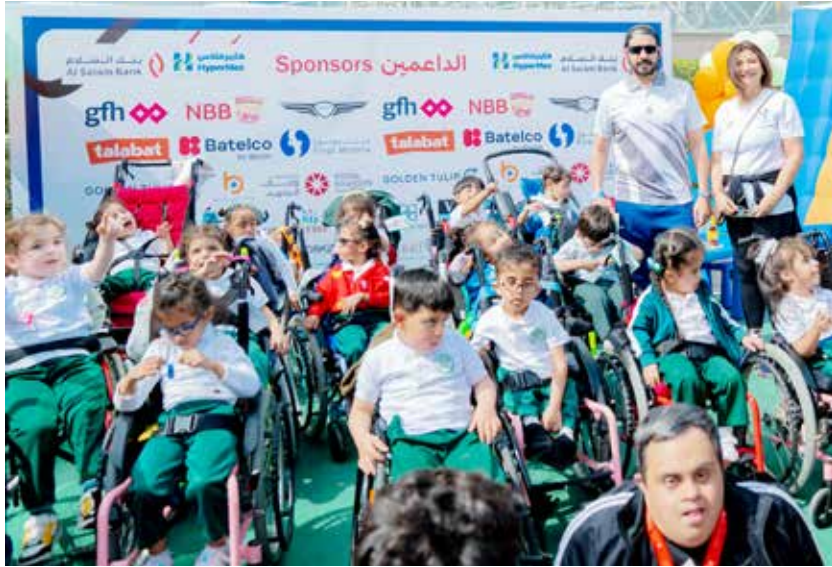
○ سموه مع الأطفال.