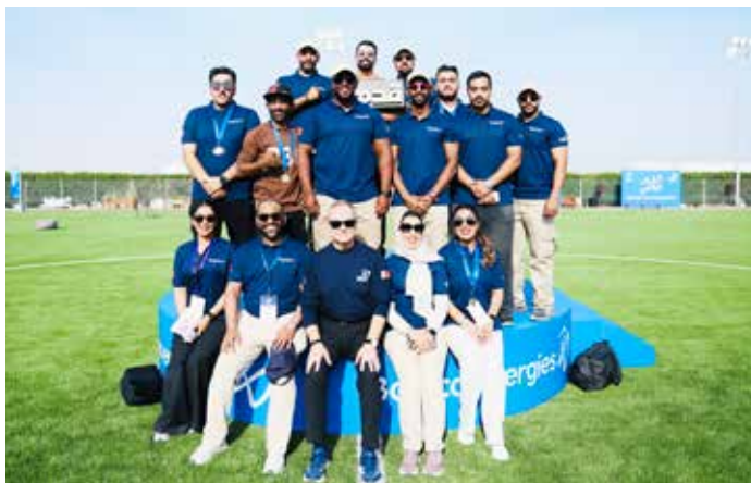
○ صورة جماعية.

شاركت بابكو إنرجيز- مجموعة الطاقة المتكاملة التي تقود أمن الطاقة واستدامتها للأجيال القادمة في مملكة البحرين، في فعاليات النسخة العاشرة من يوم البحرين الرياضي، استجابة لقرار مجلس الوزراء المؤقر، برئاسة صاحب السمو الملكي الأمير سلمان بن حمد آل خليفة، ولي العهد رئيس مجلس الوزراء، حفظه الله، بتخصيص نصف يوم عمل لممارسة النشاط الرياضي، إنفاذاً لقرار أصحاب السمو والمعالين والسعادة رؤساء اللجان الأولمبية بدول مجلس التعاون الخليجي، بتنظيم «يوم رياضي» في كل دول