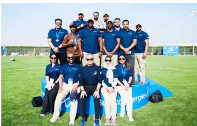
○ صورة جماعية.

المجلس خلال شهر فبراير من كل عام، ونظمت بابكو إنرجيز فعالية رياضية على مستوى كل أنحاء المجموعة في مدينة العوالي، شهدت مشاركة واسعة من عدد من موظفي ومنتسبي المجموعة وتضمنت مجموعة من الأنشطة الرياضية والترفيهية الموجهة لكل الفئات العمرية، من بينها رياضة المشي، والألعاب الجماعية، وجلسات اللياقة البدنية، بالإضافة إلى محطات تعريفية تبرز مبادرات المجموعة المتعلقة بالصحة والسلامة والرفاه المؤسسي. وتأتي هذه المشاركة تجسيداً لالتزام