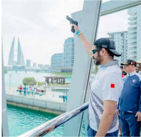
○ سموه يعلن بدء الفعاليات.