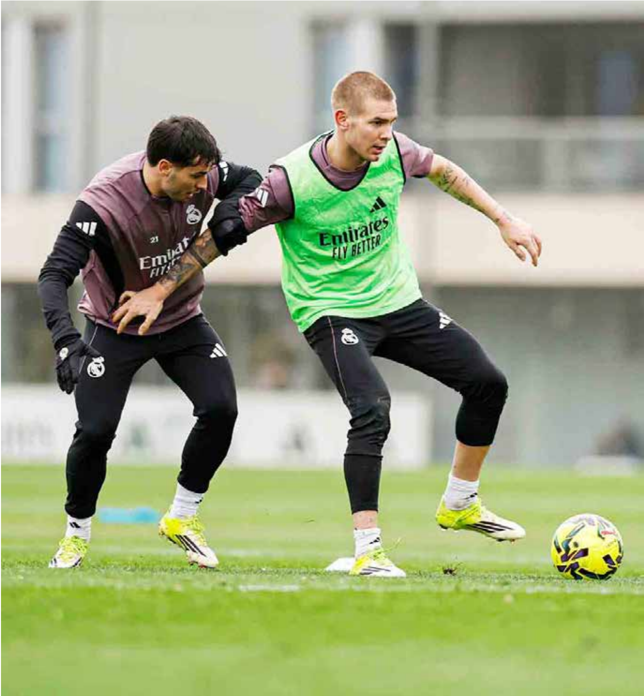
○ تدريبات ريال مدريد.