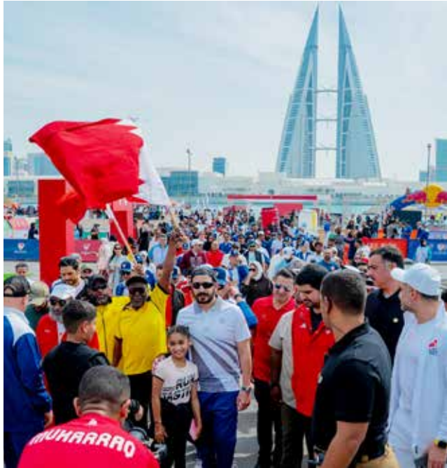
○ سموه يتقدم المشاركين في الفعاليات.

الرياضة كركيزة أساسية في بناء الإنسان البحريني صحباً وبدنياً ونفسياً، ويعزز من توجهاتنا نحو مجتمع أكثر حيوية وإنتاجية. إن ما شهدناه اليوم من مشاركة رسمية وشعبية واسعة يعكس الوعي المتنامي بأهمية الرياضة كأسلوب حياة، ويؤكد أن يوم البحرين الرياضي أصبح محطة وطنية مهمة لتعزيز الترابط المجتمعي ونشر ثقافة النشاط البدني بين جميع أفراد المجتمع. وأشاد سموه بالمشاركة الفاعلة من مختلف الوزارات والهيئات والمؤسسات، إلى جانب الحضور الجماهيري الكبير، مؤكداً أن تكاتف الجهود الرسمية والمجتمعية يسهم في إنجاح مثل هذه المبادرات الوطنية التي تعزز من مكانة البحرين كنموذج رياضي في دعم الحركة الرياضية. واختتم سمو الشيخ خالد بن حمد آل خليفة تصريحه بتأكيد مواصلة دعم البرامج والمبادرات التي تهدف إلى توسيع قاعدة الممارسة الرياضية، انطلاقاً من التوجهات الملكية السامية، وبما يسهم في تحقيق مستهدفات رؤية البحرين في بناء مجتمع صحي ونشط.