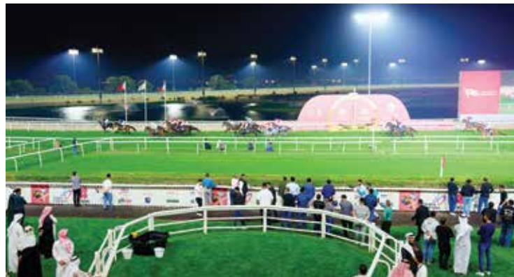
○ جانب من المنافسات.