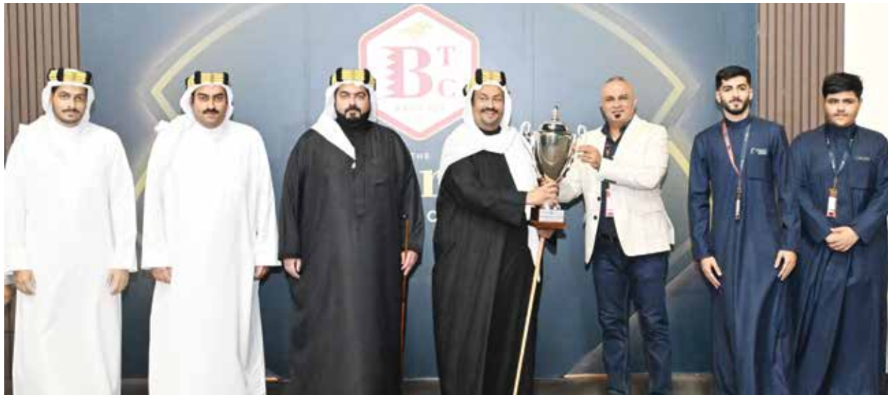
○ جانب من التتويج.