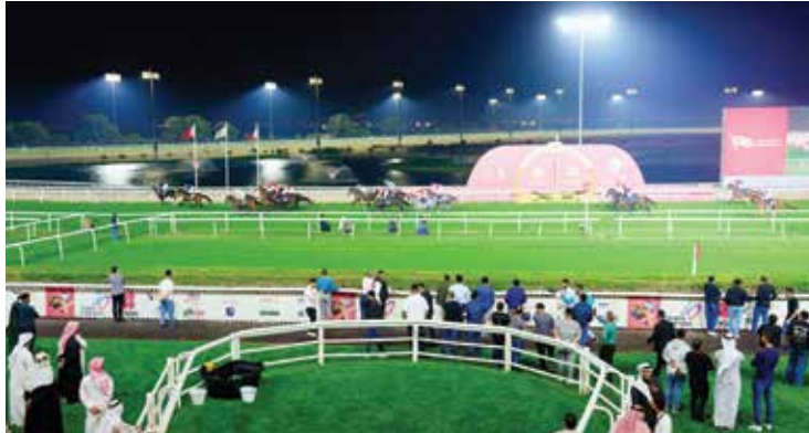
○ جانب من المنافسات.