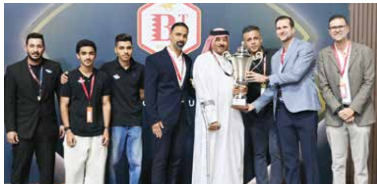
○ جانب من التتويج.