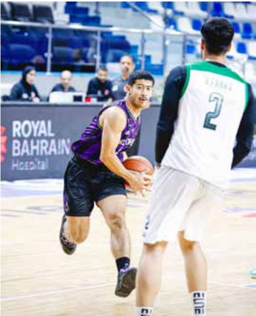
○ من لقاء الاتحاد والبحرين.

واختتم الدكتور الشيخ خالد بن حمد بن أحمد آل خليفة حديثه مبيناً مدى النجاح الذي تحقق قائلاً: «لقد أثمرت الاجتماعات عن تبلور قرارات غاية في الأهمية على أرض الواقع، وهناك الكثير من المستجدات التي تصبّ حقيقة في صالح الدراجة الآسيوية ومن المؤكد أننا أمام مرحلة تطوّر نوعية وسنرى النتائج قريباً، كما