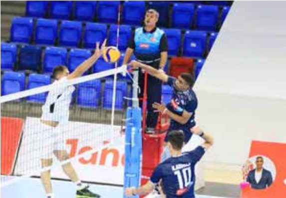
○ جانب من المباراة.

وكان لقاء الفريقين في الدور الأول انتهى لصالح المحرق بثلاثة أشواط مقابل لا شيء، يعقبها مباشرة مباراة النصر والشباب، وكانت مباراة الدور الأول قد صبت في صالح النصر بثلاثة أشواط مقابل شوطين.