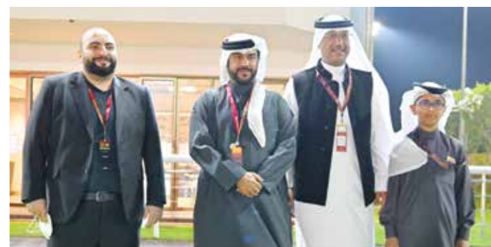
○ جانب من الحضور.