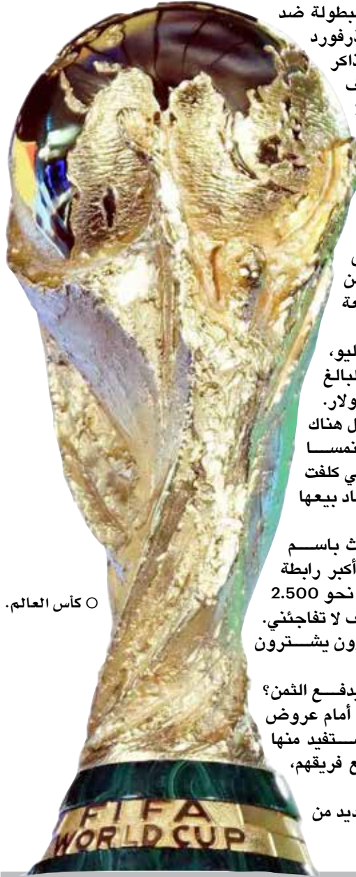
○ كأس العالم.

واعترف دايش الذي بدا متجهمًا بعد المباراة، بأن