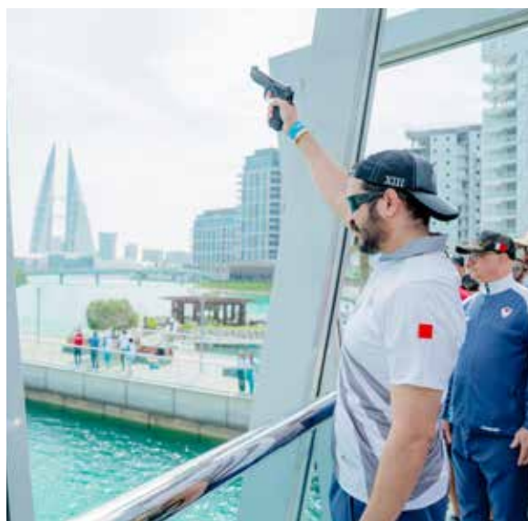
○ سموه يعلن بدء الفعاليات.