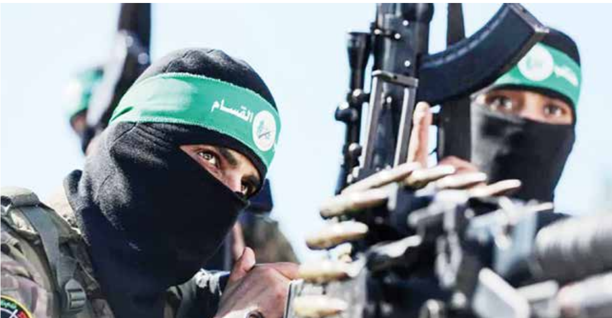
○ عناصر من مقاتلي كتائب القسام.