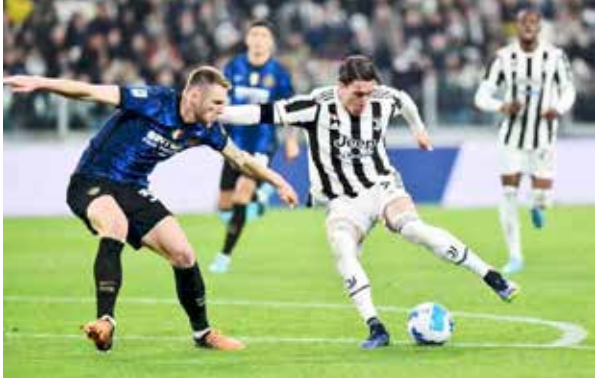
○ من لقاء سابق بين إنتر ويوفنتوس.

وأشار إلى أن بوقرة الذي توج مع منتخب الجزائر الريدف بكأس العرب 2021، يمتلك علاقات كثيرة ويمكن أن يفتح لعابين من أصول لبنانية للعب مع المنتخب.