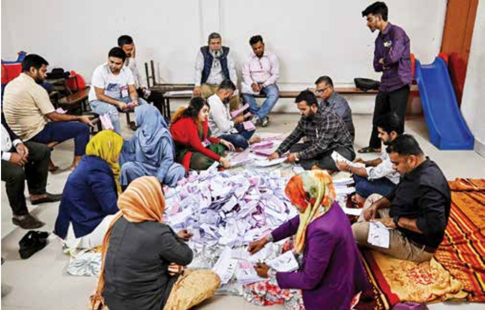
◌ فرز الأصوات في أحد مراكز الاقتراع في دكا. (أ ف ب)

دكا – (أ ف ب): بدأ فرز الأصوات في أول انتخابات تشهدها بنجلاديش منذ انتفاضة عام 2024 التي أسقطت رئيسة الوزراء الشّيخة حسينة، فيما أبدى المرشح البارز طارق رحمن تقاؤلا بشأن إحاق الهزيمة بانتلاف يقوده الإسلاميون. وقال طارق رحمن البالغ 60 عاما، المرشح الأبرز لرئاسة الوزراء: إنه «يحق» في قدرة الحزب الوطني البنجلاديشي الذي ينتمي إليه والذي تعرض لقمع خلال 15 عاما من الحكم الاستبدادي لرئيسة الوزراء المخلوعة الشّيخة حسينة، على استعادة السلطة في الدولة الواقعة في جنوب آسيا وتعد 170 مليون نسمة. لكنه يواجه منافسة قوية من الجماعة الإسلامية، أكبر حزب إسلامي في البلاد. وأقسام مسؤولو لجنة الانتخابات بوقوع «بعض الاضطرابات الطفيفة»، لكن كبار قادة الأحزاب من كلا الجانبين عبروا عن مخاوفهم من وجود «تهديدات»، ودعا طارق رحمن الناخبين إلى التصويت «لإفشال أي مؤامرات». وخاض زعيم الجماعة الإسلامية شفيق الرحمن البالغ 67 عاما حملة انتخابية شعبية