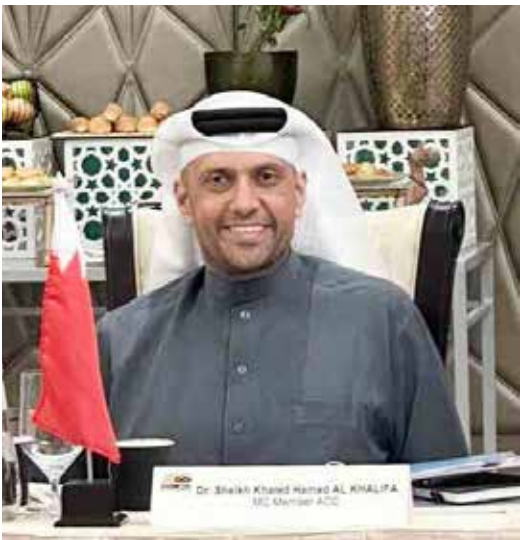
○ جانب من الاجتماع.

مناقشة العديد من النقاط وأبرزها رسم خارطة البطولات والاستحقاقات القادمة والتأكيد على الروزنامة الآسيوية، وكما تسم التأكيد على التعديلات الجديدة باللوائح والأنظمة المعمول بها في الاتحاد الآسيوي، مؤكدًا على أن وجود هذه الاجتماعات في السعودية يدلّ على اهتمام الأشقاء بريادة الدراجات الهوائية وفي الوقت الذي كان هناك انعكاس نجاح باهر للبطولة الآسيوية المقامة حالياً في القصيم..