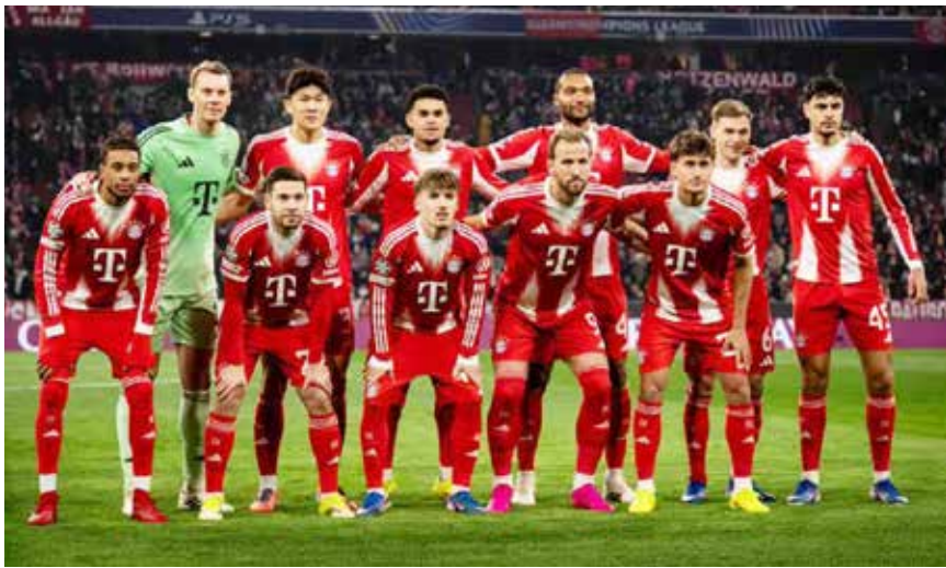
○ فريق بايرن.

الوصيف الجولة الثانية والعشرين للوندسليغا اليوم الجمعة باستضافة ماينز على ملعب سيجنال إيدونا بارك، في مواجهة تجمع بين طموح دورتموند في ملاحقة صدارة بايرن ميونخ ورغبة ماينز في مواصلة صحوته الأخيرة والابتعاد عن مناطق الهبوط.