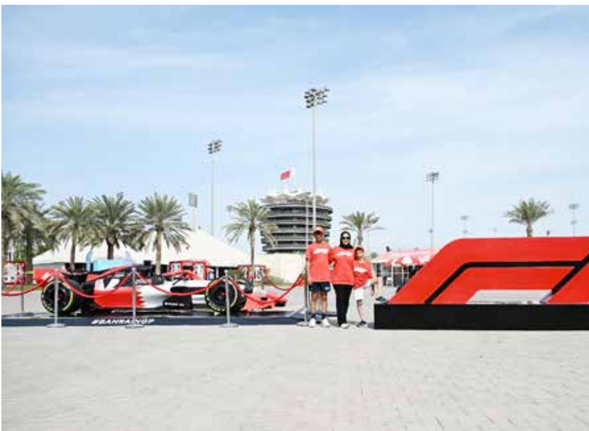
○ جانب من الحضور