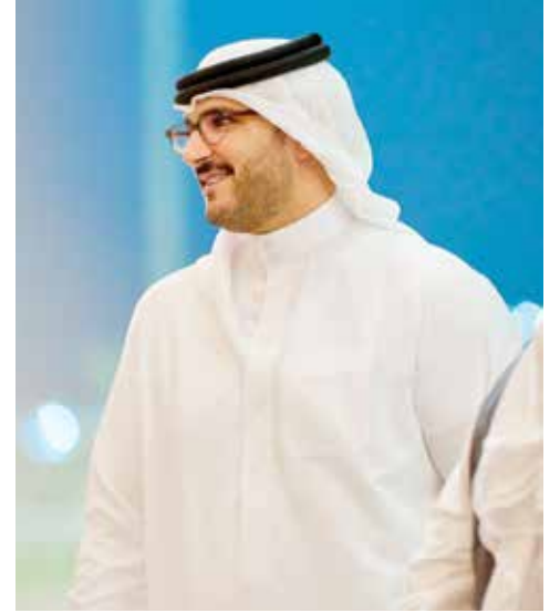
○ سمو الشيخ عيسى بن سلمان بن حمد آل خليفة.