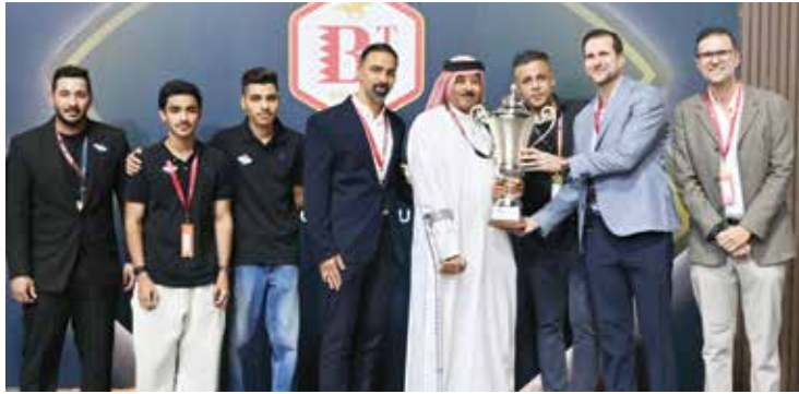
○ جانب من التتويج.