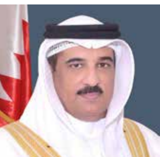
○ الشيخ خالد بن عبدالله.

ولي العهد رئيس مجلس الوزراء، لدولة الإمارات العربية المتحدة الشقيقة، والمباحثات التي أجراها سموه مع أخيه رئيس دولة الإمارات العربية المتحدة، مؤكداً أنها تمثل محطة مهمة تعكس عمق الشراكة الاستراتيجية والحرص المتبادل على الدفع بالتعاون الثنائي نحو مستويات أكثر تقدماً، لاسيما في المجالات التي تخدم أولويات التنمية في البلدين الشقيقين وتعزيز تطلعاتهما نحو مستقبل أكثر نماءً وازدهاراً.