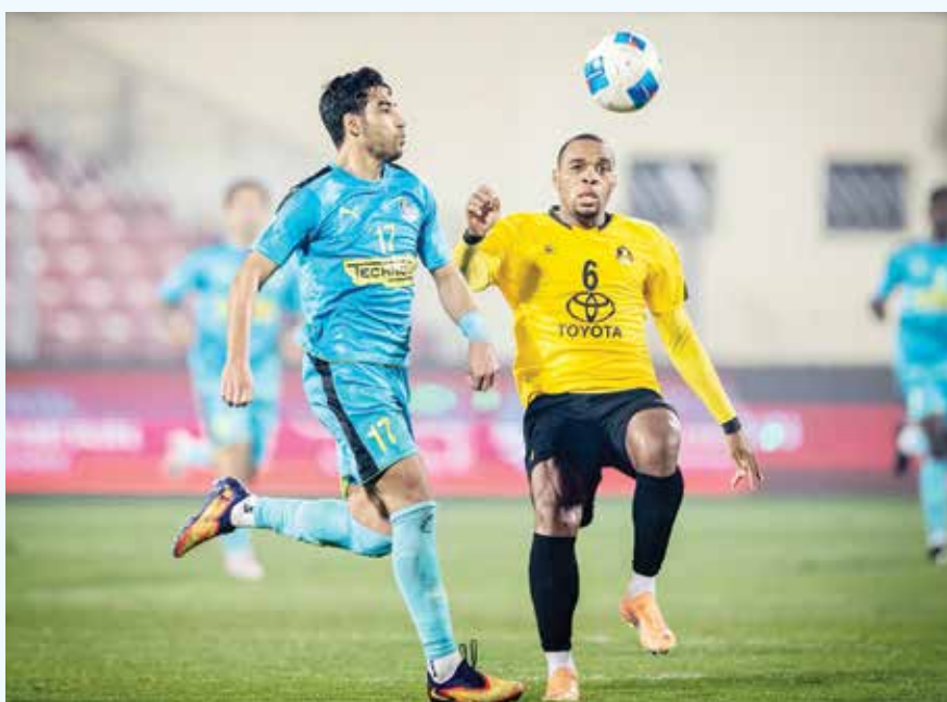
○ لحظة من المباراة.