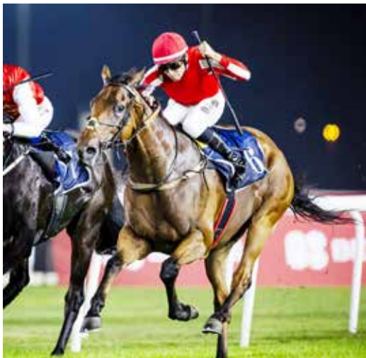
○ الجياد البحرينية المشاركة.

وأشار بوحجي إلى ما حققه القطاع الرياضي في مملكة البحرين من تطور ملحوظ وإنجازات على مختلف الأصعدة، بما يعكس الجهود الكبيرة والدعم المستمر من سمو الشيخ ناصر بن حمد آل خليفة، ممثل جلالة الملك للأعمال الإنسانية وشؤون الشباب، رئيس المجلس الأعلى للشباب والرياضة، وسمو الشيخ خالد