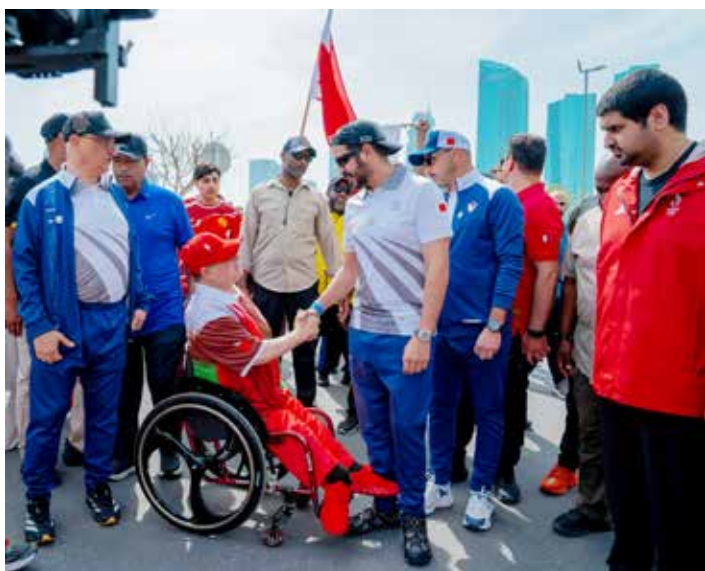
○ سموه يصافح أحد المشاركين.