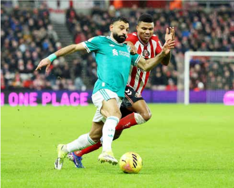
○ محمد صلاح