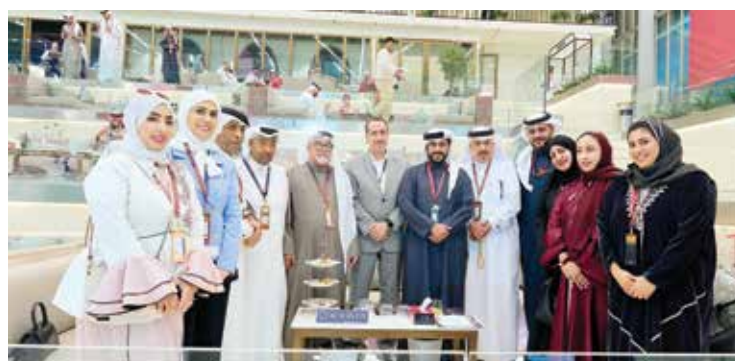
○ صورة جماعية.