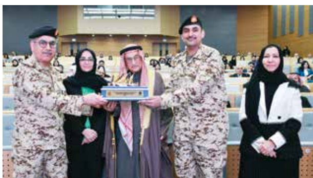
○ رئيس المجلس الأعلى للصحة خلال المؤتمر الدولي لطب الأطفال.

تتطلب تعزيز التكامل بين التخصصات، ودعم الكوادر الصحية، وضمان العدالة في إتاحة الخدمات الصحية للأطفال.