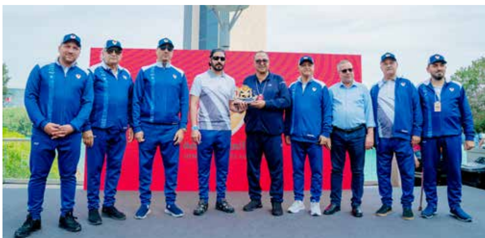
○ جانب من التكرم.

الرياضة كركيزة أساسية في بناء الإنسان البحريني صحباً وبدنياً ونفسياً، ويعزز من توجهاتنا نحو مجتمع أكثر حيوية وإنتاجية. إن ما شهدناه اليوم من مشاركة رسمية وشعبية واسعة يعكس الوعي المتنامي بأهمية الرياضة كأسلوب حياة، ويؤكد أن يوم البحرين الرياضي أصبح محطة وطنية مهمة لتعزيز الترابط المجتمعي ونشر ثقافة النشاط البدني بين جميع أفراد المجتمع. وأشاد سموه بالمشاركة الفاعلة من مختلف الوزارات والهيئات والمؤسسات، إلى جانب الحضور الجماهيري الكبير، مؤكداً أن تكاتف الجهود الرسمية والمجتمعية يساهم في إنجاح مثل هذه المبادرات الوطنية التي تعزز من مكانة البحرين كنموذج رياضي في دعم الحركة الرياضية. واختتم سمو الشيخ خالد بن حمد آل خليفة تصريحه بتأكيد مواصلة دعم البرامج والمبادرات التي تهدف إلى توسيع قاعدة الممارسة الرياضية، انطلاقاً من التوجهات الملكية السامية، وبما يساهم في تحقيق مستهدفات رؤية البحرين في بناء مجتمع صحي ونشط.