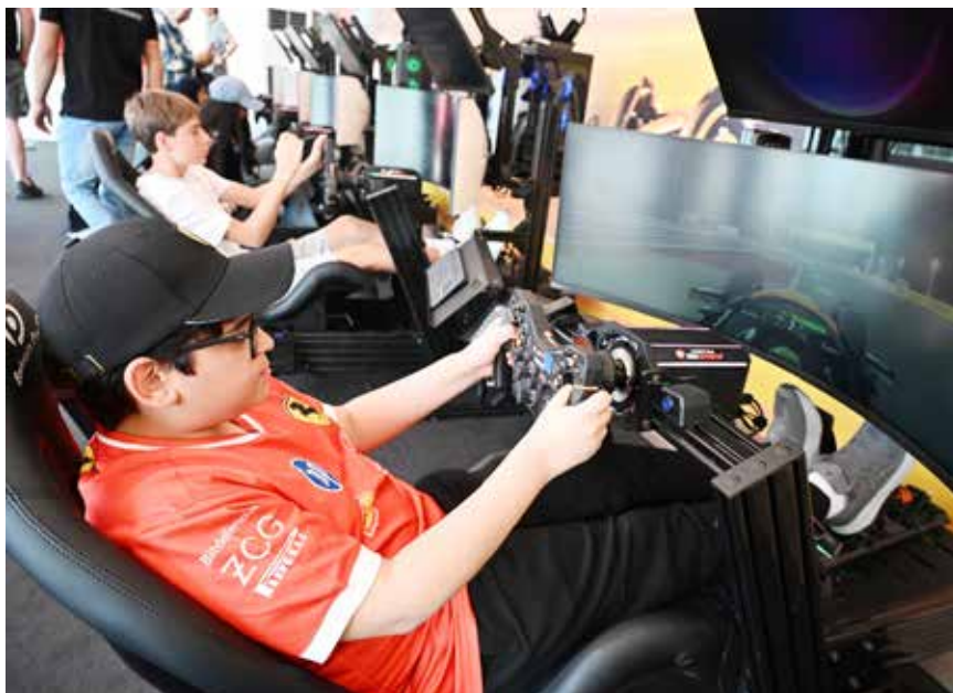
○ من الفعاليات الترفيهية