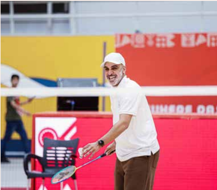
○ جانب من الفعالية.

تنظمت للجنة البارالمبية البحرينية فعالية رياضية بمناسبة يوم البحرين الرياضي، وذلك في مواقع صالات الشيخ عيسى بن راشد الرياضية، على هامش بطولة العالم البارالمبية للريشة الطائرة - البحرين 2026* بمشاركة لاعبي ولاعبات ذوي العزيمة وأسرهم ومنتسبي اللجنة. وشهدت الفعالية أجواءً حماسية وتفاعلاً إيجابياً من اللاعبين مع أهاليهم، حيث تضمن البرنامج إقامة مباريات في كرة السلة على