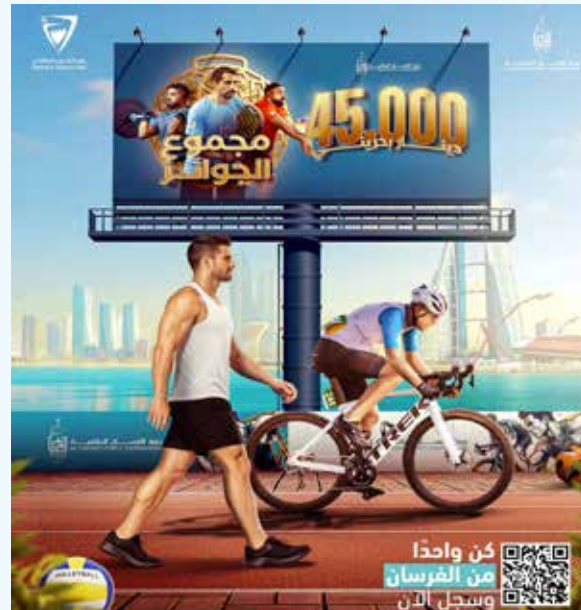
○ إعلان الجوائز.

ومجتمعية تساهم في نشر الثقافة الرياضية وروح التحدي، وتعزز من مشاركة الشباب والفرق في أجواء تنظيمية متميزة.