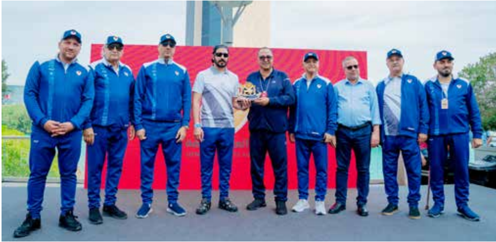
○ جانب من التكريم.

الرياضة كركيزة أساسية في بناء الإنسان البحريني صحباً وبدنياً ونفسياً، ويعزز من توجهاتنا نحو مجتمع أكثر حيوية وإنتاجية. إن ما شهدناه اليوم من مشاركة رسمية وشعبية واسعة يعكس الوعي المتنامي بأهمية الرياضة كأسلوب حياة، ويؤكد أن يوم البحرين الرياضي أصبح محطة وطنية مهمة لتعزيز الترابط المجتمعي ونشر ثقافة النشاط البدني بين جميع أفراد المجتمع. وأشاد سموه بالمشاركة الفاعلة من مختلف الوزارات والهيئات والمؤسسات، إلى جانب الحضور الجماهيري الكبير، مؤكداً أن تكاتف الجهود الرسمية والمجتمعية يسهم في إنجاح مثل هذه المبادرات الوطنية التي تعزز من مكانة البحرين كنموذج رياضي في دعم الحركة الرياضية. واختتم سمو الشيخ خالد بن حمد آل خليفة تصريحه بتأكيد مواصلة دعم البرامج والمبادرات التي تهدف إلى توسيع قاعدة الممارسة الرياضية، انطلاقاً من التوجهات الملكية السامية، وبما يسهم في تحقيق مستهدفات رؤية البحرين في بناء مجتمع صحي ونشط.