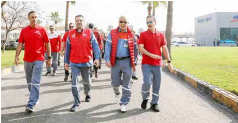
○ جانب من الفعالية.