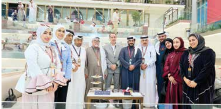
○ صورة جماعية.