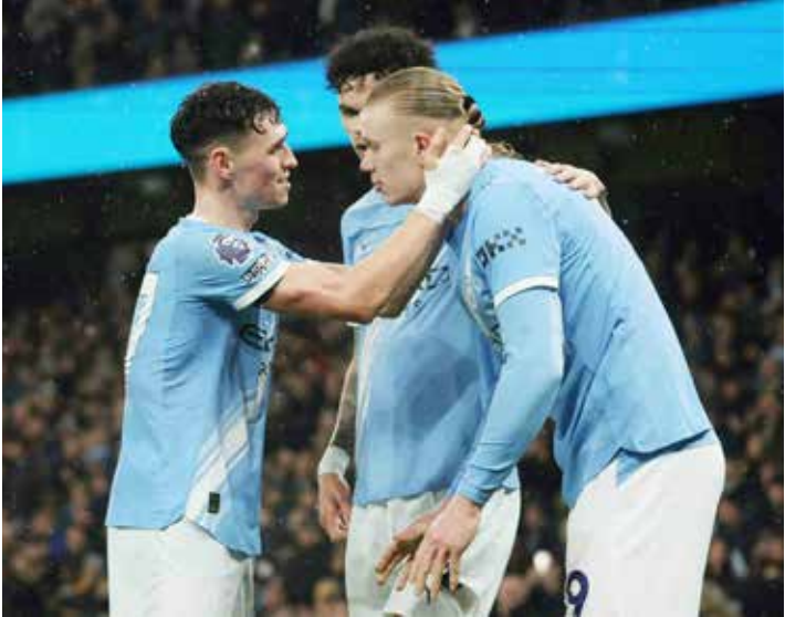
○ هالاند يحتفل مع زملائه