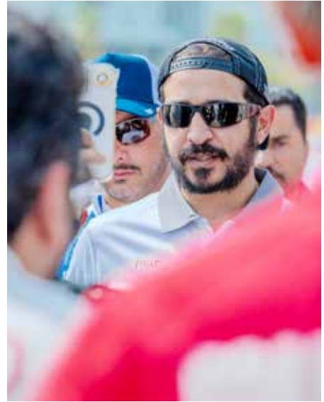
○ سمو الشيخ خالد بن حمد آل خليفة.