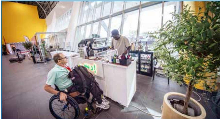
○ المنطقة الترفيهية.