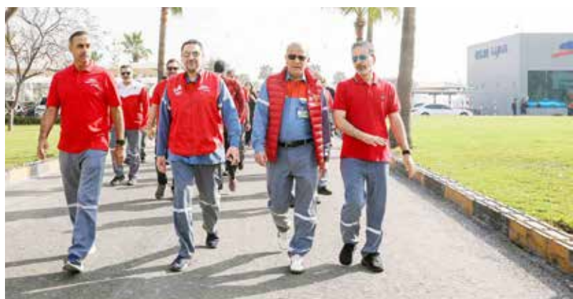
○ جانب من الفعالية.