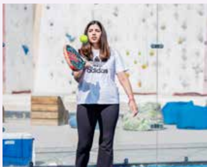
○ من فعالية يوم البحرين الرياضي.

بسن حمد آل خليفة، النائب الأول لرئيس المجلس الأعلى للشباب والرياضة، رئيس الهيئة العامة للرياضة، رئيس اللجنة الأولمبية البحرينية.