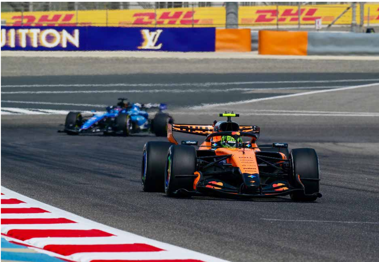
○ من التجارب

كما تقدم حلبة البحرين الدولية باقات ضيافة حصريّة خلال فترة التجارب، تتميز بأفضل إطلاقات على السباق، بالإضافة إلى تشكيلة رائعة من الضيافة الفاخرة طوال اليوم، وتقع قاعة الضيافة مباشرة فوق منطقة الصيانة الخاصة بسباقات الفورمولا وان. للحصول على معلومات حول باقات الضيافة عبر الاتصال على الرقم +973-97310861745 أو من خلال الموقع الإلكتروني bah-raingp.com.