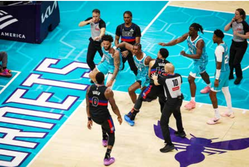
○ لحظة من حالة الاشتباك.

بيستونز أيزياه ستیوارت، إلى جانب ثنائي شارلوت دياباتييه ومايلز بريدجز.