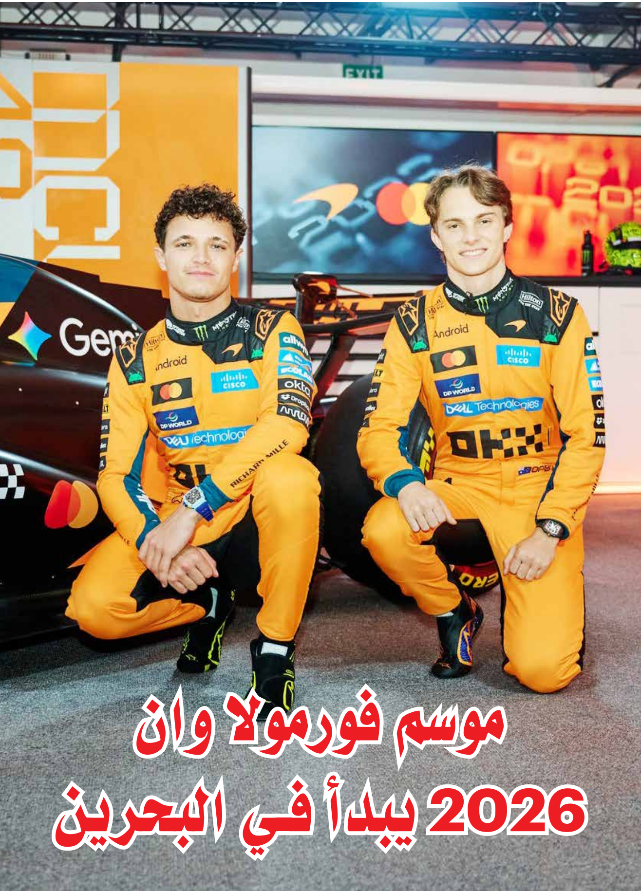
○ بياستري ونوريس.

باريس – (أ ف ب): تنطلق اليوم الأربعاء في البحرين التجارب الرسمية لموسم 2026 من بطولة العالم للفورمولا ١، بمشاركة 11 فريقا، في موسم يوصف بأنه «انطلاقة من الصفر» بسبب التغييرات الجذرية في القواعد التقنية للمحركات والهياكل، والتي أعادت رسم معالم البطولة بالكامل.