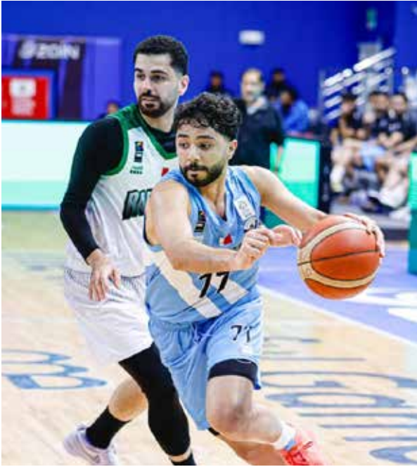
○ من لقاء سماهيج والبحرين