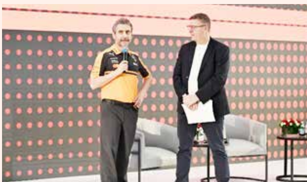
○ ستيتلا ضيف المؤتمر.

لن تكتمل تجربة سباق جائزة البحرين الكبرى للفورمولا وان بدون الحفلات الغنائية التي تقام احتفالاً بهذه المناسبة المميزة، حيث تم بالأمس إعلان أول حفل غنائي للدي جي المنتج الموسيقي الحائز على عدة جوائز بلاتينية، مارتن غاريكس، في حفل مباشر مساء الجمعة الموافق 10 أبريل خلال سباق جائزة البحرين الكبرى للفورمولا وان لعام 2026. وستتمكن الجماهير حاملو تذاكر السباق من حضور حفله دون دفع أي رسوم إضافية. الفنان مارتن غاريكس أحد أصغر وأنجح الدي جي عالمياً والمنتجين الموسيقيين في عالم موسيقى البوب الإلكترونية.