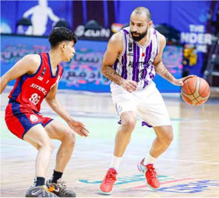
○ من لقاء الاتحاد وستر