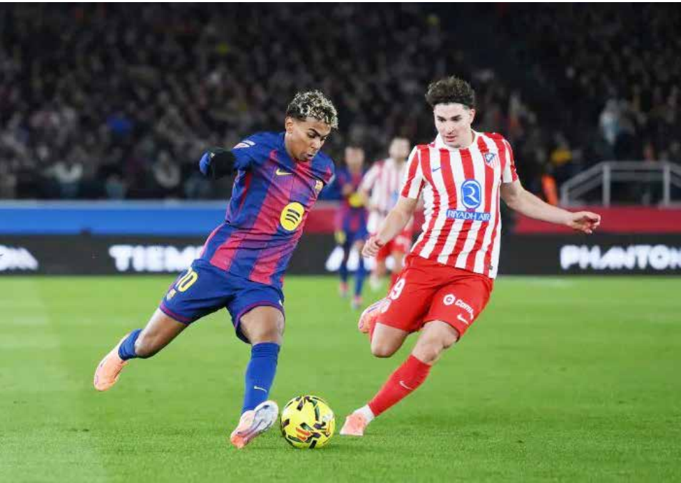
○ لقاء سابق بين برشلونة وأتلتيكو مدريد.

وسيحول برشلونة على لامين يامال كأحد العناصر الأساسية في الهجوم، حيث سجل خمسة أهداف في آخر خمس مباريات للفريق في جميع البطولات، بما في ذلك أهدافه في دور ال16 ودور الثمانية من كأس الملك، ما