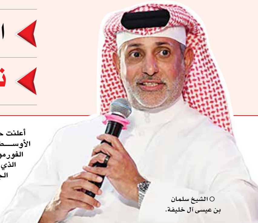
○ الشيخ سلمان بن عيسى آل خليفة.

نفاد تذاكر منصة المنعطف الأول و98% للمنصة الرئيسية