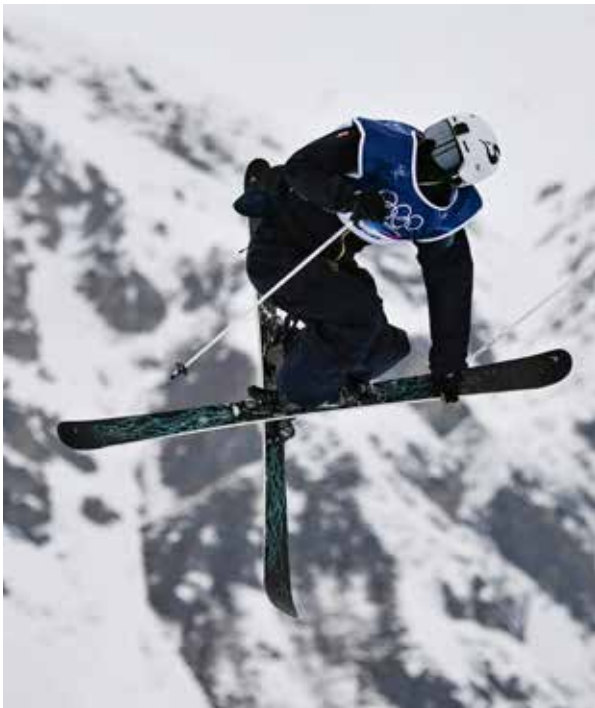
○ من مسابقات التزلج