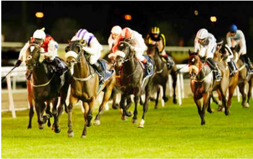
○ لقطة من السباقات الأسبوعية

يتربق جمهور وعشاق سباقات الخيل أمسية متجددة من الإثارة والتحدي، وذلك من خلال السباق التاسع عشر لموسم السباقات 2025/2026، والذي سيقام مساء يوم الخميس 12 فبراير الجاري، على كؤوس مجموعة آل شريف، وشركة كراون اندستريز، وكأس سافرة، وذلك على مضمار نادي راشد للفروسية وسباق الخيل بمنطقة الرفة.