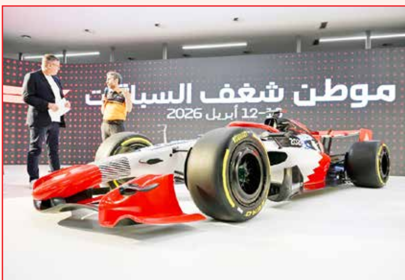
○ الكشف عن نسخة طبق الأصل من سيارة الفورمولا وان.