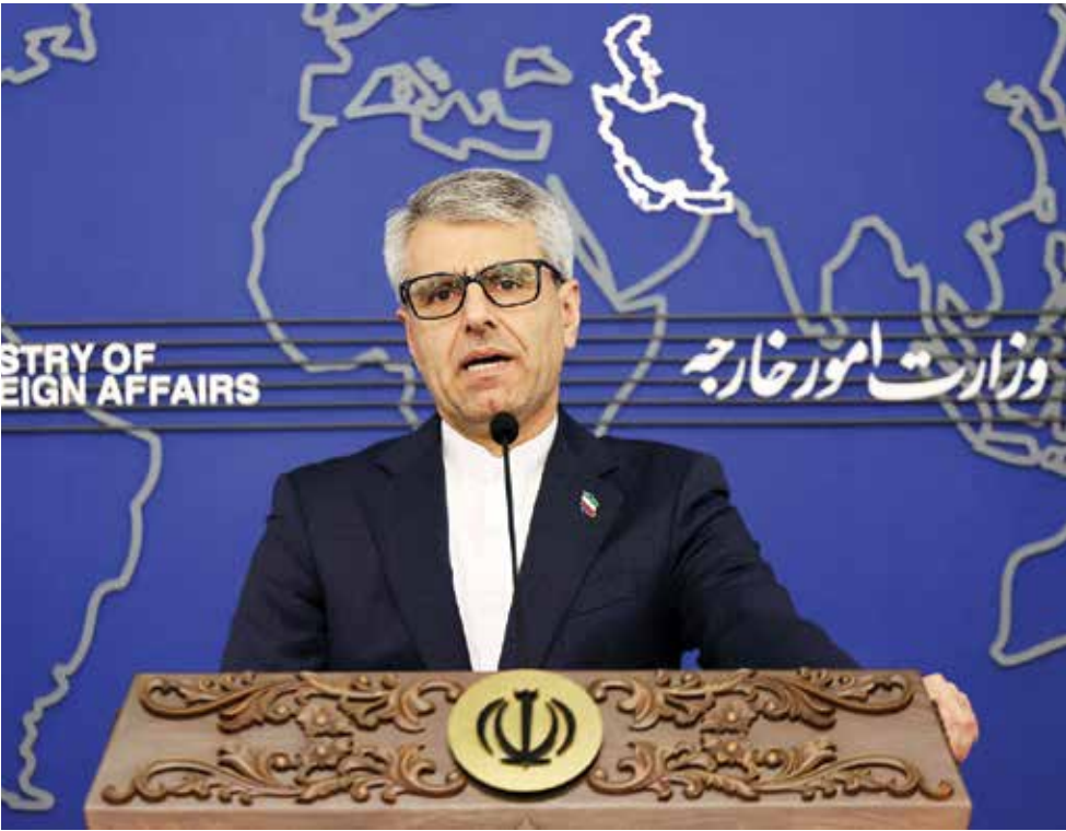
○ الخارجية الإيرانية حذرت من الضغوط الإسرائيلية المدمرة على المفاوضات.

القدس المحتلة – الوكالات: قبل يوم من لقائه دونالد ترامب في واشنطن، قال رئيس الوزراء الإسرائيلي بنيامين نتنياهو أمس: إن مباحثاته مع الرئيس الأمريكي ستتركز حول المفاوضات مع إيران، وذلك في إطار سعيه إلى حمل واشنطن على تبني موقف أكثر تشددا تجاه برنامج طهران للصواريخ الباليستية. ويأتي اللقاء بعد أيام من مفاوضات جرت بين إيران والولايات المتحدة في سلطنة عمان، وأعلن ترامب بعدها جولة ثانية ستعقبها. ويتزامن اللقاء أيضا مع تصاعد ردود الفعل الدولية إزاء الإجراءات الإسرائيلية الرامية إلى تعميق السيطرة على الضفة الغربية المحتلة، ولا سيما عبر السماح لإسرائيليين بشراء أراض في الضفة الغربية وإضعاف السلطة الفلسطينية. إلا أنه من غير الواضح ما إذا كانت هذه المسألة ستطرح خلال المحادثات، رغم معارضة ترامب سابقا لأي ضمّ للضفة الغربية. وقال نتنياهو قبل توجهه إلى الولايات المتحدة: «سنناقش خلال هذه الزيارة مجموعة من القضايا: غزة، والمنطقة، ولكن بالطبع أولا وقبل كل شيء المفاوضات مع إيران» مضيفا: «سأعرض على الرئيس وجهات نظرنا بشأن المبادئ التي ينبغي أن تقوم عليها هذه