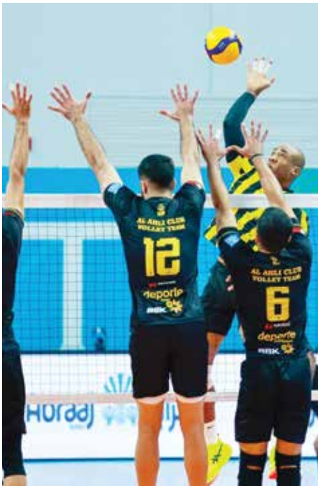
○ من لقاء الأهلي والاتحاد السعودي.