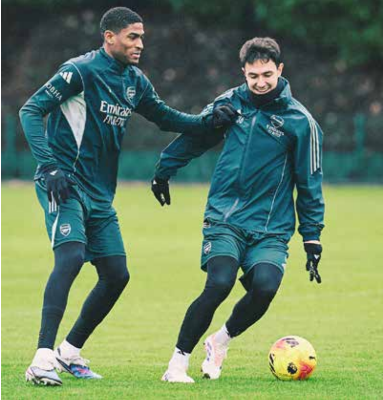
○ تحضيرات أرسنال

وعلى ملعب «فيلا بارك»، يسعى أستون فيلا إلى البقاء في صراع اللقب والتمسك بمركزه الثالث حين يلتقي الأربعاء مع ضيفه برايتون الرابع عشر، باحثا عن استعادة توازنه بعد سقوط أمام برنتفورد على أرضه 0-1 وتعادل خارج الديار مع بورنموث 1-1.