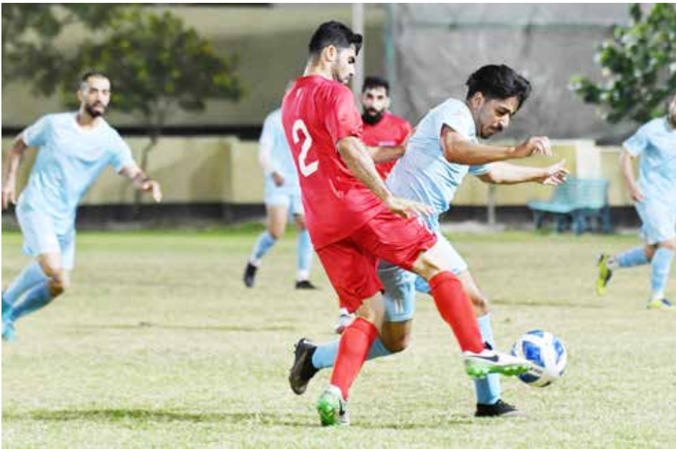
○ لقطة من منافسات سابقة.

– الشوط السابع: سباق التوازن «مستورد» – مسافة 2000 متر. الجيات المشاركة: «ليز غايد، لازاروس دريم، محروسة، مسافر، كنغ أوف ذا ثرون، غلين سافاج، وات هابنيس فيغاس، كوسمو غود سبيد، جارهام، كريبتو برنسس، هاربور سيربت، فورث تايم لاي، ليدي لينكس، نجم الدار». – الشوط الثامن والأخير: كأس مجموعة آل شريف لسباق التوازن «مستورد» – مسافة 2200 متر مستقيم. الجيات المشاركة: «ترتان شيف، بورغلر، نايت أوف هونور، أركا، موعود، رايان بور، باتيفورد بوي، سكاى أفوكات، جيمي شيلتر».