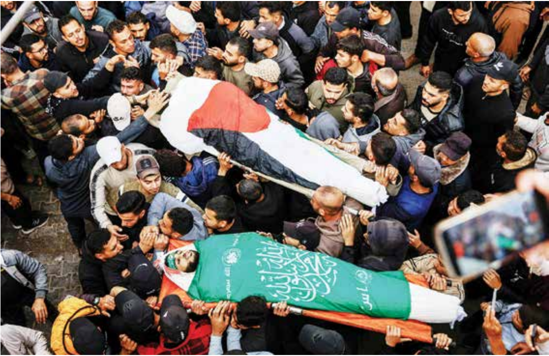
○ تشييع اثنين من الشهداء الخمسة في مدينة غزة.

سلاح حماس، وانسحاب إسرائيل من غزة، ونشر قوة دولية لحفظ السلام. وترفض حماس منذ فترة طويلة الدعوات إلى إلقاء سلاحتها، ويقول المسؤولون الإسرائيليون إنهم يستعدون للعودة إلى حرب شاملة. وقالت وزارة الصحة في غزة: إن ما لا يقل عن 580 فلسطينيا استشهدوا بنيران إسرائيلية منذ إبرام اتفاق وقف إطلاق النار في أكتوبر. وتقول إسرائيل: إن أربعة جنود قتلوا على يد مسلحين في غزة خلال الفترة نفسها. في غضون ذلك قال المتحدث باسم الرئيس الإندونيسي برابو سوبيانتو أمس: إن قوة حفظ السلام متعددة الجنسيات المقترحة لغزة قد يبلغ