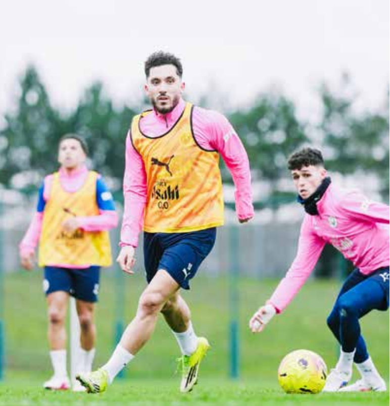
○ تدريبات سيتي

قبل أن يحل أرسنال ضيفا على ملعب الاتحاد في منتصف أبريل، يمتلك سيتي فرصة حقيقية لاختبار صلابته منافسه هذا الموسم وإذا كان سيكرز فريق المدرب الإسباني ميكل أرتيتا سيناريو المواسم الثلاثة الماضية حين خسر معركة اللقب في