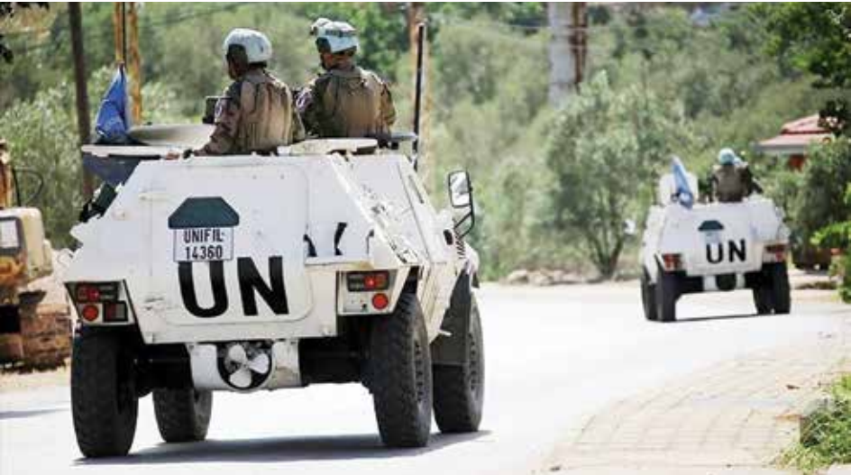
○ عناصر من قوة يونيفيل.

الخارجية الفرنسي جان-نويل بارو على هامش زيارته بيروت الأسبوع الماضي: إنه يتعين أن يحل الجيش اللبناني مكان القوة الدولية. وتطبيقا لوقف إطلاق النار، عزّز الجيش اللبناني خلال الأشهر الماضية انتشاره في منطقة