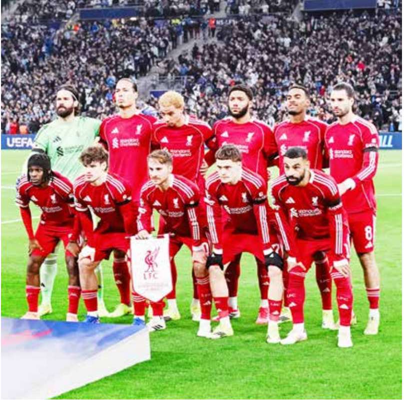
○ فريق ليفربول.

وقال سلوت في المؤتمر الصحفي الذي يسبق مباراة اليوم الأربعاء أمام سندرلاند «اللاعبون يعرفون ماذا تعني معايير ليفربول، ونحن حاليا لا نقدم أداء يرقى إلى تلك المعايير، وهم يشعرون بخيبة الأمل».