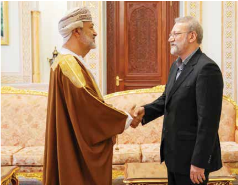
○ سلطان عمان لدى استقباله لاريجاني في مسقط.

طهران/دبي – (أ ب): أكدت سلطنة عمان وإيران، أمس، أهمية العودة إلى طاولة الحوار والتفاوض وتقريب وجهات النظر وحل الخلافات بطرق سلمية، لإحلال السلام والأمن في المنطقة والعالم. جاء ذلك خلال استقبال سلطان عمان هيثم بن طارق صباح أمس على لاريجاني أمين المجلس الأعلى للأمن القومي الإيراني، وفق وكالة الأنباء العمانية. وجرى خلال المقابلة بحث آخر المستجدات المتصلة بالمفاوضات الإيرانية الأمريكية، وسبل التوصل الى اتفاق متوازن وعادل بين الجانبين. والتقى لاريجاني كذلك وزير الخارجية بدر البوسعيدي الذي تولى الوساطة في المفاوضات