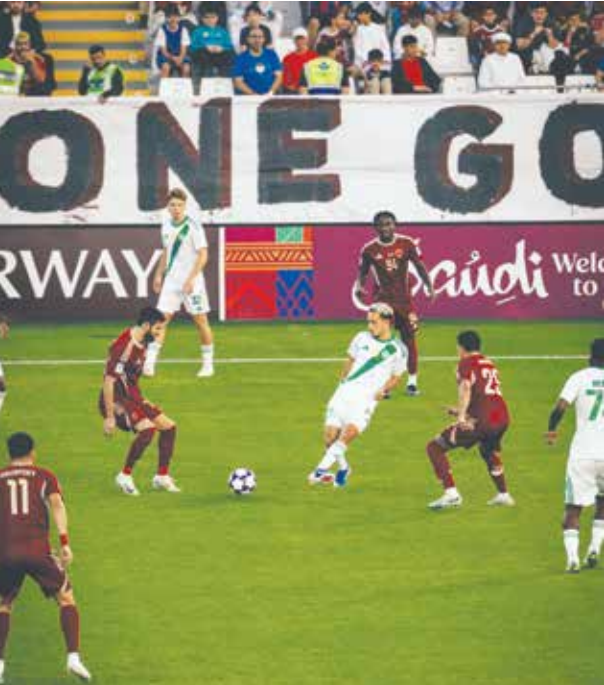
○ لحظة من المباراة.

وأضاف: «لم نسجل اليوم، لكننا كنا قريبين من ذلك، وحتى في الدقائق الأخيرة سنحت