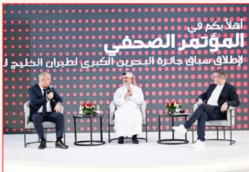
○ جانب من المؤتمر الصحفي.

انطلاق السباق الذي يمثل الحقبة الجديدة من 10 حتى 12 أبريل المقبل