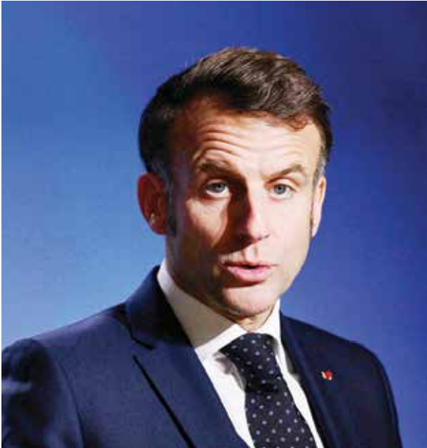
○ الرئيس الفرنسي إيمانويل ماكرون.

لمساعدة التكتل المؤلف من 27 دولة على الاستثمار على نطاق واسع وتحدي هيمنة الدولار الأمريكي. واستخدم الاتحاد الأوروبي الديون المشتركة في عام 2020 لإعادة تنشيط الاقتصاد الأوروبي بعد جائحة كوفيد-19، لكن محاولات فرنسا لجعل هذه الأدوات دائمة واجهت مقاومة شديدة من ألمانيا ودول أعضاء أخرى في الشمال. وستشمل قمة قادة الاتحاد الأوروبي في بروكسل غدا الخميس مناقشات حول الخطط التي تقودها فرنسا لوضع استراتيجية «صنع في أوروبا»، لتحديد المتطلبات الدنيا للمحتوى الأوروبي في السلع المصنعة محليا. وقد أدى هذا النهج إلى انقسام دول الاتحاد الأوروبي وإثارة قلق شركات صناعة السيارات.