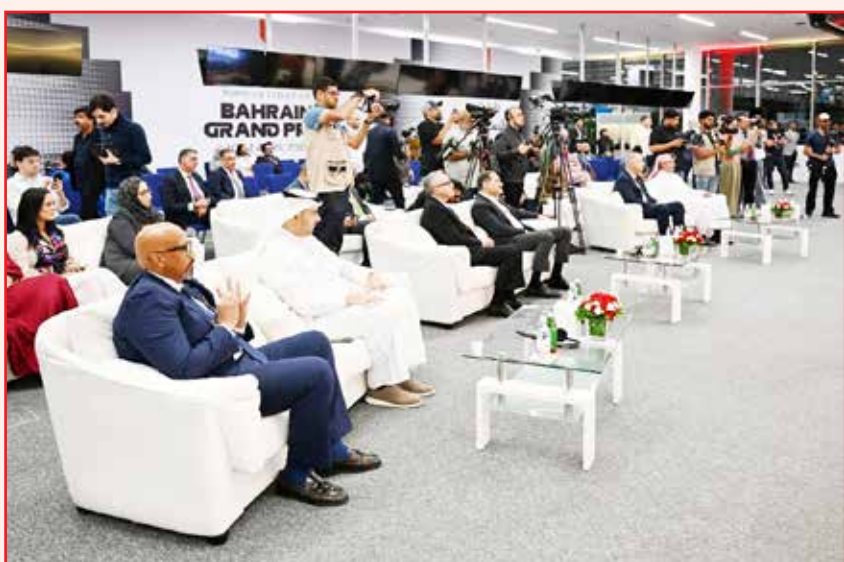
○ جانب من الحضور.