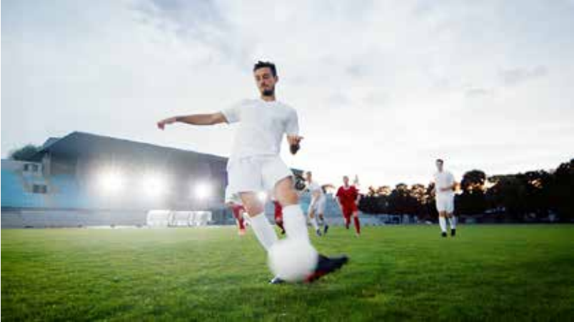
○ من منافسات كرة القدم.

أدلة علمية ترفع من معايير السلامة وتضمن حماية الرياضيين. وأوضح رئيس جامعة كاوست