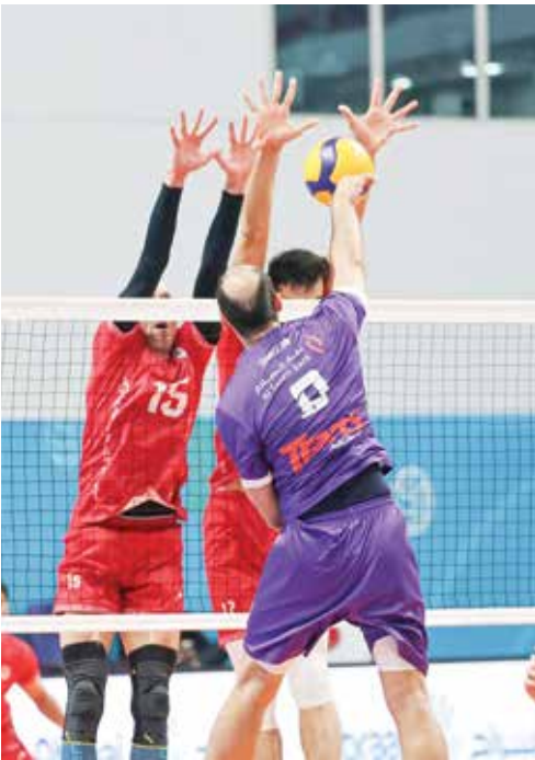
○ من لقاء دار كليب وغاز الجنوب.

وكان الشوط الثاني أكثر أشواط المباراة تكافئاً، وكان بإمكان الشباب أن يعيد المباراة إلى مربيعها الأول عندما