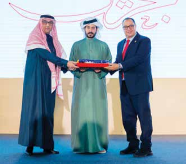
○ سموه يتسلم علم فوز البحرين بلقب عاصمة الثقافة الرياضية العربية.

وشهدت الجلسة الافتتاحية للقمة مشاركة رفيعة المستوى من القيادات والشخصيات الرياضية والفكرية، يتقدمهم صاحب السمو الملكي الأمير عبدالله بن مساعد آل سعود، رجل الأعمال والقيادي الرياضي، والدكتور محمد بن مبارك جمعة وزير التربية والتعليم، والدكتور رمان بن عبدالله النعيمي وزير الإعلام وستيفاني هاليت سفير الولايات المتحدة الأمريكية المعيّنة لدى مملكة البحرين، فيما تولى إدارة الجلسة الإعلامي والمذيع الرياضي لطفي الزعبي. وناقشت الجلسة الافتتاحية عدداً من القضايا الاستراتيجية المرتبطة بمستقبل الرياضة ودورها في دعم التنمية الاقتصادية والاجتماعية، إلى جانب بحث سبل التكامل بين السياسات الرياضية والاستثمار، وتعزيز الشراكات الدولية، وتبادل الخبرات بما يسهم