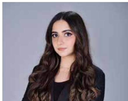
○ نداء جهرومي.

مثاليًا للطلبة الطامحين إلى بناء مسيرة مهنية دولية في مجال الضيافة، حيث يفتح أمامهم آفاقاً واسعة للعمل في الفنادق العالمية والمنشآت، والسياسة وإدارة الفعاليات وغيرها من المجالات المرتبطة بالضيافة، مشيرة إلى أن 100% من خريجي جميع أفواج «فاتيل البحرين» حصلوا على عروض توظيف قبل تخرجهم. وأوضحت أن برنامج ماجستير إدارة الأعمال في إدارة الفنادق الدولية يركز على إعداد قيادات قادرة على إدارة مؤسسات الضيافة بكفاءة واحترافية، واتخاذ قرارات استراتيجية في بيئات العمل، من خلال تزويد الطلبة بالمعرفة الاحترافية والمهارات المطلوبة والقدرة القيادية، ضمن إطار أكاديمي دولي متخصص يركز على واقع الصناعة وتحدياتها المستقبلية.