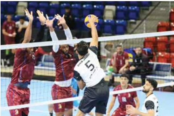
○ من لقاء بني جمرة والشباب.