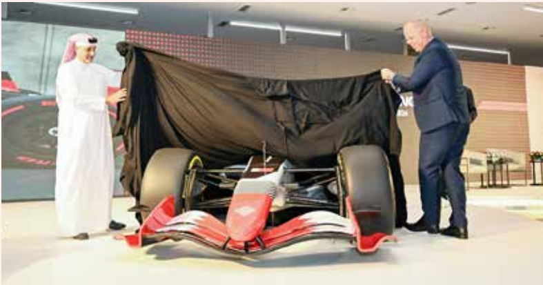
○ الكشف عن نسخة طبق الأصل من سيارة الفورمولا وان.

أعلنت حلبة البحرين الدولية «موطن رياضة السيارات في الشرق الأوسط» وطيّران الخليج أمس آخر الاستعدادات لاستضافة سباق الفورمولا وان جائزة البحرين الكبرى لطيران الخليج 2026، السباق الذي يُعد جزءاً من الموسم الأول المرتقب للفورمولا وان في «الحلبة الجديدة». وسينطلق سباق جائزة البحرين الكبرى في الفترة من 10 حتى 12 أبريل المقبل، وذلك كجولة رابعة لموسم الفورمولا وان 2026، مع إعلان شعار السباق تحت مسمى «موطن شغف السباقات»، حيث ستكون عطلة نهاية أسبوع مليئة بإثارة السباقات الدولية والفعاليات الترفيهية العائلية والحفلات الغنائية. وتم الكشف عن هذه التفاصيل