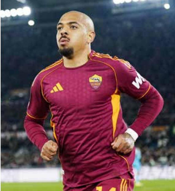
○ مالين (رويترز).

تعرف كيف نوفر له التمريرات المناسبة لخصائصه. لدينا جودة عالية في الهجوم يصعب إيقافها الآن، فهو يمتلك مهارات متنوعة». وأشار مدرب روما «نسعى دائما للحاق بمنافسينا. لقد لحقنا بيوفنتوس، بينما لا يزال نابولي وميلان في الصدارة، وأعتقد أن إنتر قد تفوق علينا الآن، وأتألنا وكومو ليسا بعيدين عنا. إذا كنا في مراكز المقدمة بعد 24 جولة، فهذا أمر مهم، لكننا نريد مواصلة التطور هجوميا».