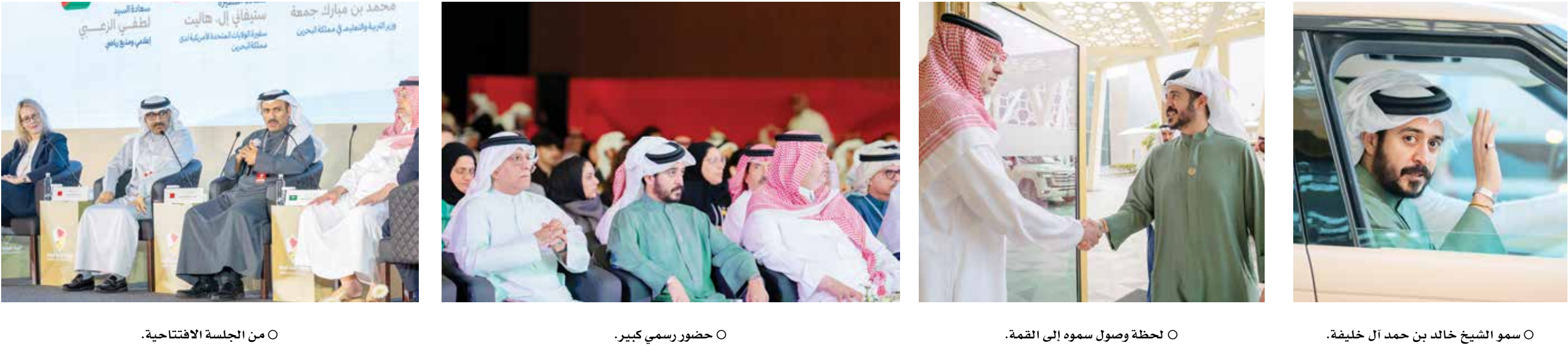
○ من الجلسة الافتتاحية.