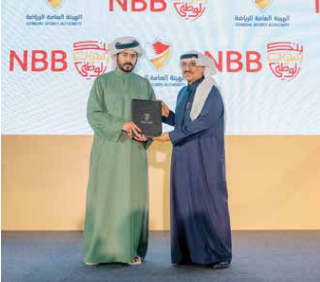
○ اتفاقية شراكة بين الهيئة العامة للرياضة وبنك البحرين الوطني.