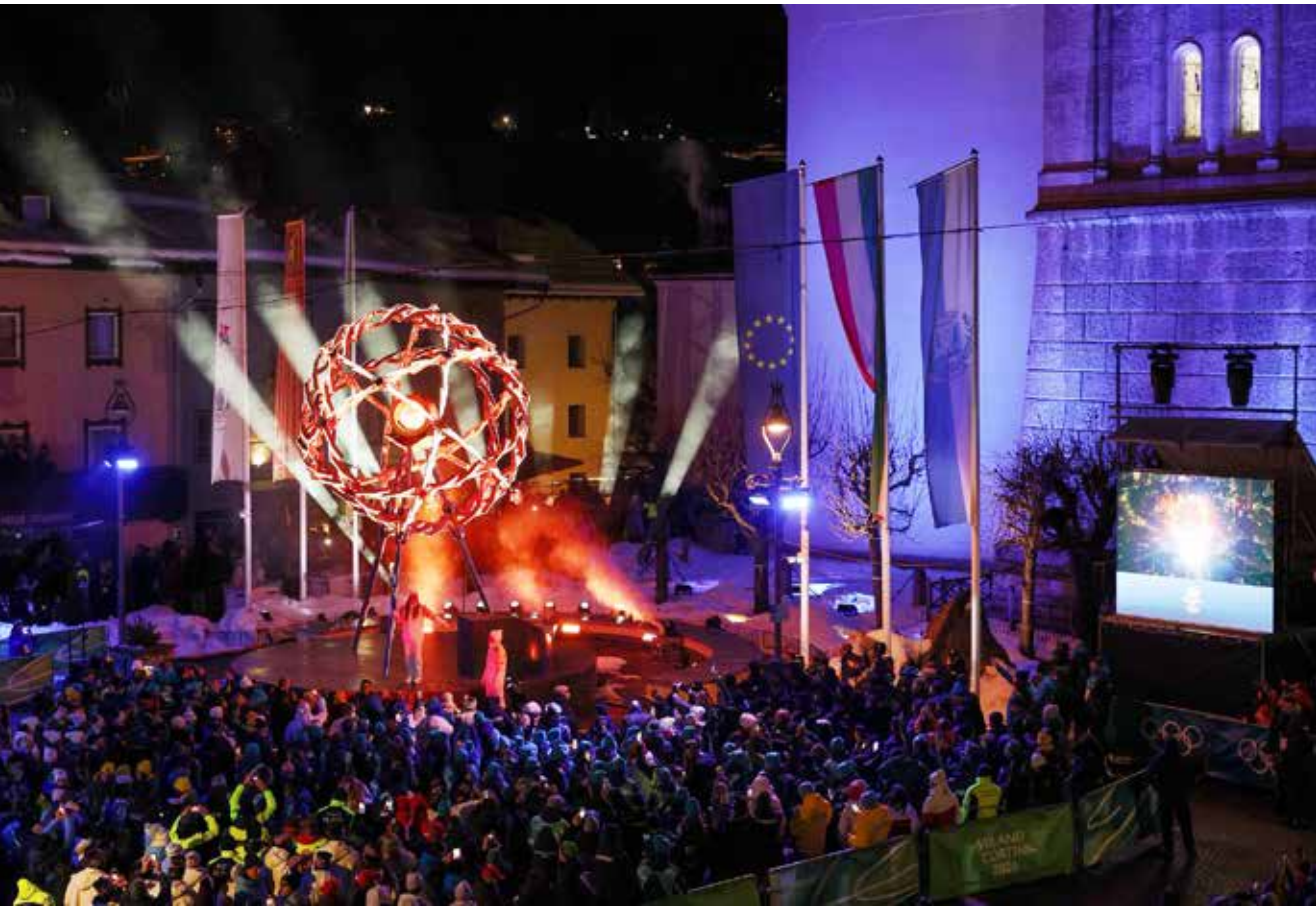
○ جانب من حفل الافتتاح.