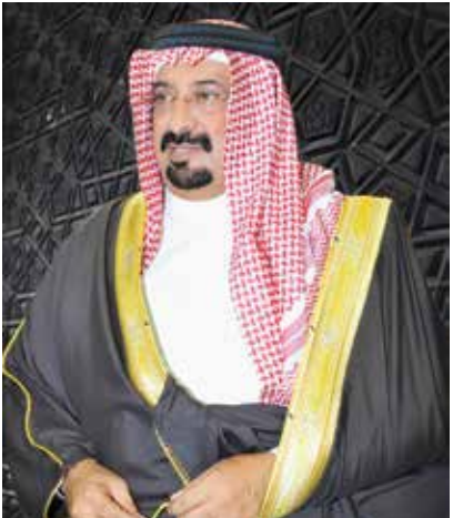
○ الشيخ أحمد بن علي آل خليفة.

★ بلغت الأرباح الصافية الموحدة العائدة إلى مساهمي الشركة الأم 257 مليون دولار أمريكي، بانخفاض قدره 10% مقارنة