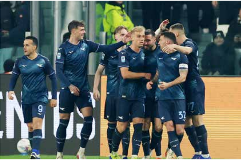
○ فرحة لاعبي لانتسيو بالهدف الثاني.

ورفع سيتي رصيده إلى 50 نقطة في المركز الثاني خلف أرسنال المتصدر برصيد 56 نقطة، فيما تجمد رصيد ليفربول عند 39 نقطة في المركز السادس، فتلقّت بذلك آماله ببلوغ دوري أبطال أوروبا ضربة