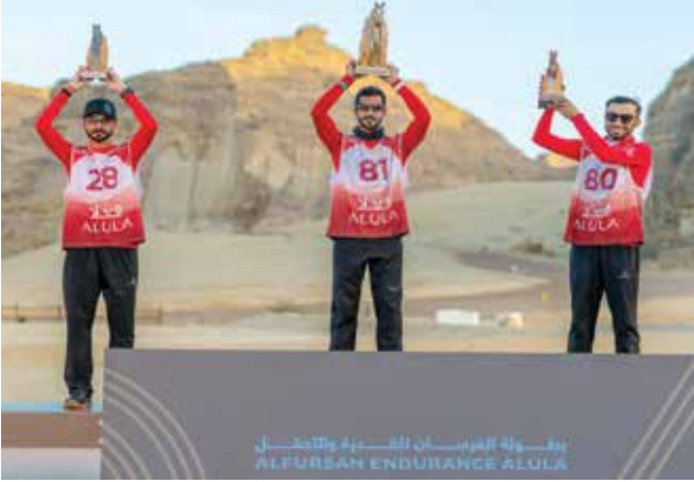
○ جانب من التنويع