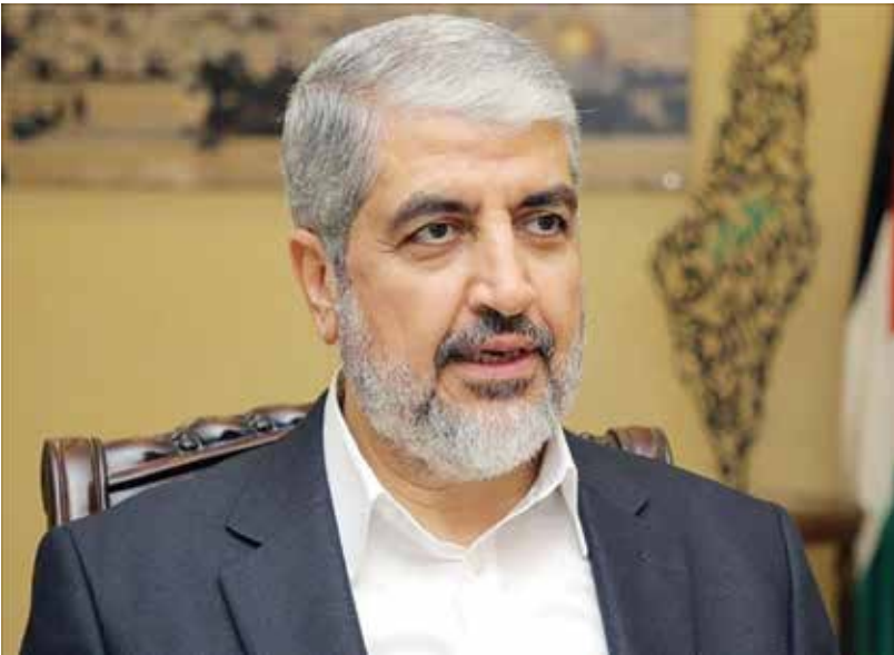
○ خالد مشعل.

اللجنة الوطنية المكلفة بإدارة قطاع غزة إلى القطاع رغم إعادة فتح معبر رفح، مشيرا إلى أن هذا المنع يقترن بعدم وجود مؤشرات على استعداد إسرائيل للانتقال إلى المرحلة الثانية من الاتفاق. وأضاف في تصريح صحفي، أن الجيش الإسرائيلي يواصل فرض سيطرته على مساحات واسعة من قطاع غزة، ما يعرقل أي خطوات عملية لبدء ترتيبات إدارية جديدة على الأرض. في الأثناء استشهد ثلاثة مواطنين فلسطينيين أمس بنيران الاحتلال وسط وجنوب القطاع غزة. ونقلت وكالة الأنباء والمعلومات الفلسطينية (وفا) عن مصادر طبية قولها: إن «شبابا (20 عاما) استشهد برصاص آليات الاحتلال في منطقة أبو العجين شرق دير البلح». وأضافت المصادر أن «شابة استشهدت صباح (اليوم) متأثرة بإصابتها بقصف الاحتلال منزل عائلتها بشارع الداخلية وسط مدينة رفح، خلال الحرب، لتلتحق بأطفالها الشهداء الأربعة».