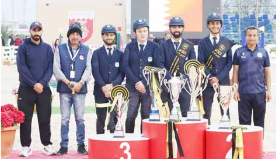
○ صورة جماعية.

وتواصل الحلبة طرح التذاكر لحضور التجارب وذلك بـ 10 دنانير بحرينية للكبّار لليوم الواحد و5 دنانير بحرينية للأطفال لليوم الواحد، ويتاح الدخول المجاني خلال يومي التجارب المفتوحة الثانية 19 و20 فبراير لجميع حاملي تذاكر سباق جائزة البحرين الكبرى لطيران الخليج للفورمولا وان 2026، ضمن عرض الحز المبكر الذي أطلّته الحلبة وذلك لحاملي التذاكر الذين قاموا بشراء تذاكرهم قبل 8 سبتمبر من