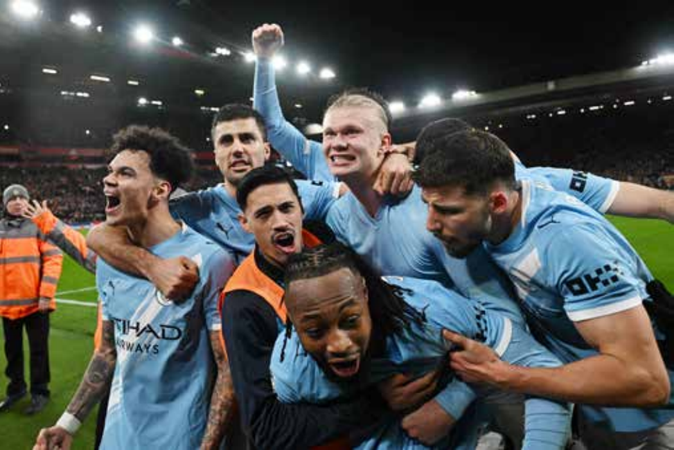
○ فرحة لاعبي سيتي بالهدف الثاني.

ورفع فريق المدرب النمساوي أوليفر غلاسنر رصيده إلى 32 نقطة في المركز الثالث عشر، محققا انتصاره الأول بعد سلسلة سلبية من ست هزائم وثلاثة تعادلات تواليا في الدوري. في المقابل، تجمد رصيد برايتون عند 31 نقطة في المركز الرابع عشر.