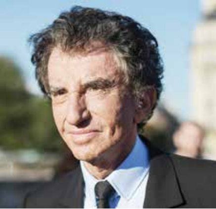
○ جاك لانغ.

واقترح السبت الاستقالة من رئاسة معهد العالم العربي في باريس، في خطوة قبلها وزير الخارجية جان نويل بارو وأعلن بدء البحث عن خلف له. وجاء ذلك بعد ساعات من إصداره بيانا دافع فيه عن «شرفه»، مؤكدا أن الاتهامات الموجهة إليه «لا أساس لها»، وذلك غداة استدعائه إلى وزارة الخارجية وقّعت النيابة العامة المالية تحقيقا في حقه وفي حق ابنته على خلفية صلته برجل الأعمال الأمريكي الراحل.