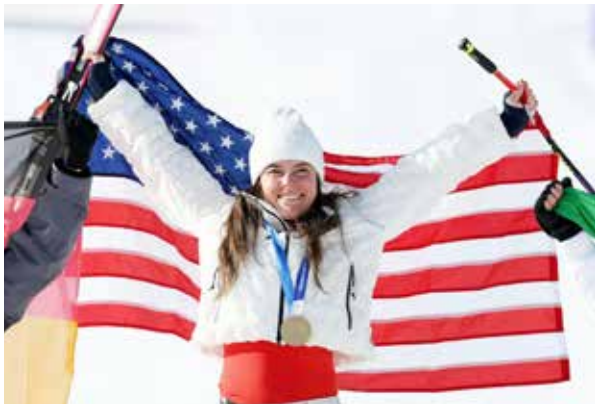
○ جونسون (رويترز)

وانهى دورانت المباراة بـ20 نقطة بعدما نجح 6 من محاولاته العشر، بعدما اكتفى بثلاث محاولات فقط في الشوط الأول.