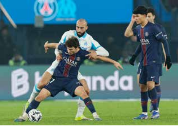
○ من لقاء سان جرمان ومارسيليا.

في مرمي فريقه عندما تابع برأسه كرة ساقطة للدولي البرتغالي الآخر نيفيش (64). وأضاف البديل الدولي كفارتسخيليا، العائد من الإصابة، الرابع بعد أربع دقائق من دخوله مكان الواعد ديزيريه دويه، إثر تمريرة من ديمبيلييه (66). واختتم البديل الآخر لي المهرجان بعد ست دقائق من دخوله مكان برادلي باركولا، بالهدف الخامس بتسديدة قوية من داخل المنطقة إثر تمريرة من مايولو (74). وتعادل نيس مع موناكو بنتيجة 0-0. وتغلب انجبه على تولوز 0-1. وفاز لوهارف على ستراسبورغ 2-1. وخيم التعادل السلبي على مباراة اوكسير وباريس. تواليا لباريس سان جرمان في الدوري والسادس عشر هذا الموسم فرغ رصيده إلى 51 نقطة مستعدا الصدارة بفارق نقطتين أمام لنس الفائز على رين 3-1 يوم السبت، فيما مني مرسيليا بخسارته السادسة هذا الموسم فتجمد رصيده عند 39 نقطة في المركز الرابع. وحسم النادي الباريسي نتيجة المباراة في شوطها الأول بثلاثية لهاجمه الدولي ديمبيلييه، أفضل لاعب في العالم العام الماضي، بتسديدتين قويتين من داخل المنطقة، الأولى إثر تمريرة من الواعد سيني مايولو (37). وتابع فريق العاصمة تفوقه في الشوط الثاني وعزز بهدف ثالث سجله المدافع مبدينا بالخطأ