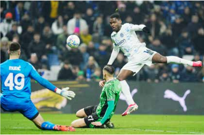
○ من لقاء إنتر وساسوولو.