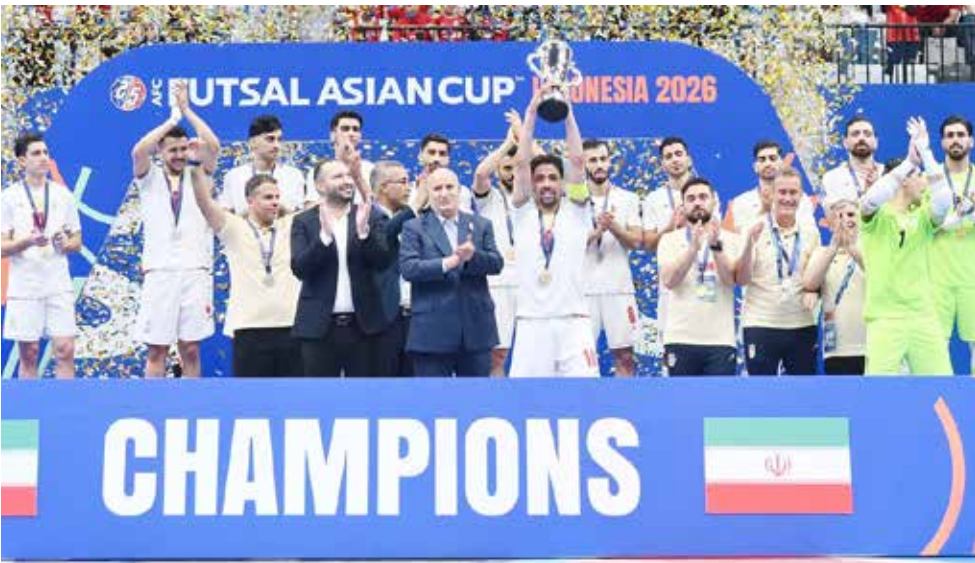
○ لحظة من التتويج.

وما يزيد من صعوبة شباب الأهلي أن الهلال لم يتعرض للخسارة في آخر 20 مباراة له في دور