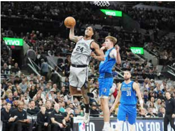
○ من لقاء سبيرز ومافريكس (رويترز)