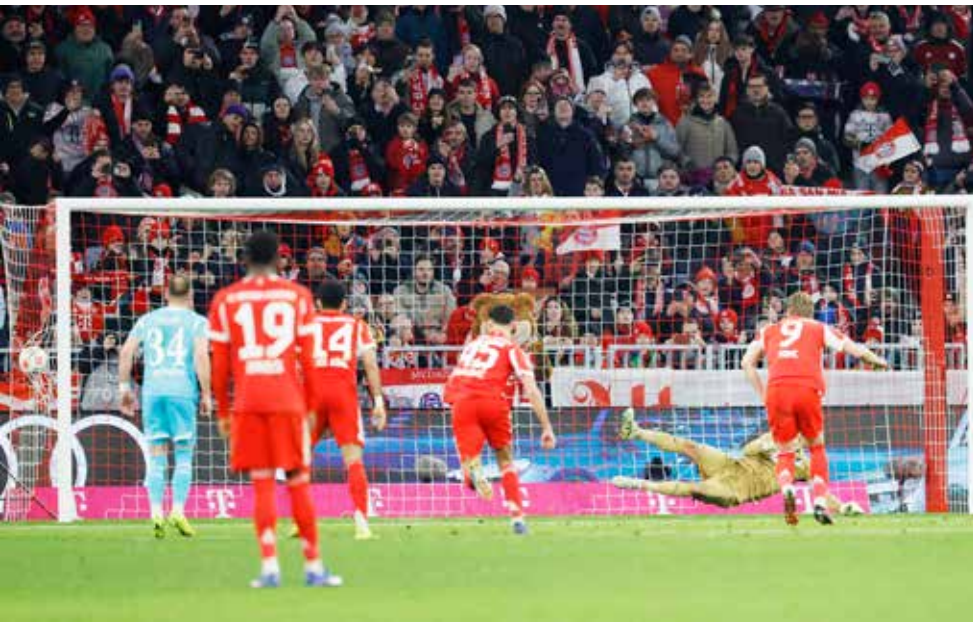
○ كين يعزز النتيجة من ركلة الجزاء.