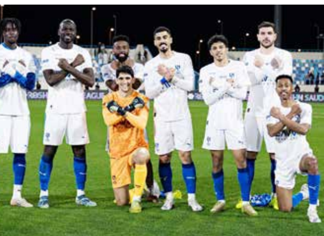
○ لاعبو الهلال.

وفي حين اكتسب الغموض مصير «دون» بعد تغيبه عن كلاسيكو الاتحاد الذي حسمه النصر بثنائية نظيفة، قدم النجم الفرنسي كريم بنزيمة أوراق اعتماده باكراً، بـ«هاتريك» قاد من خلاله «الزعيم» لاكتساح الأخدود بسداسية نظيفة خارج ملعبه في نجران.