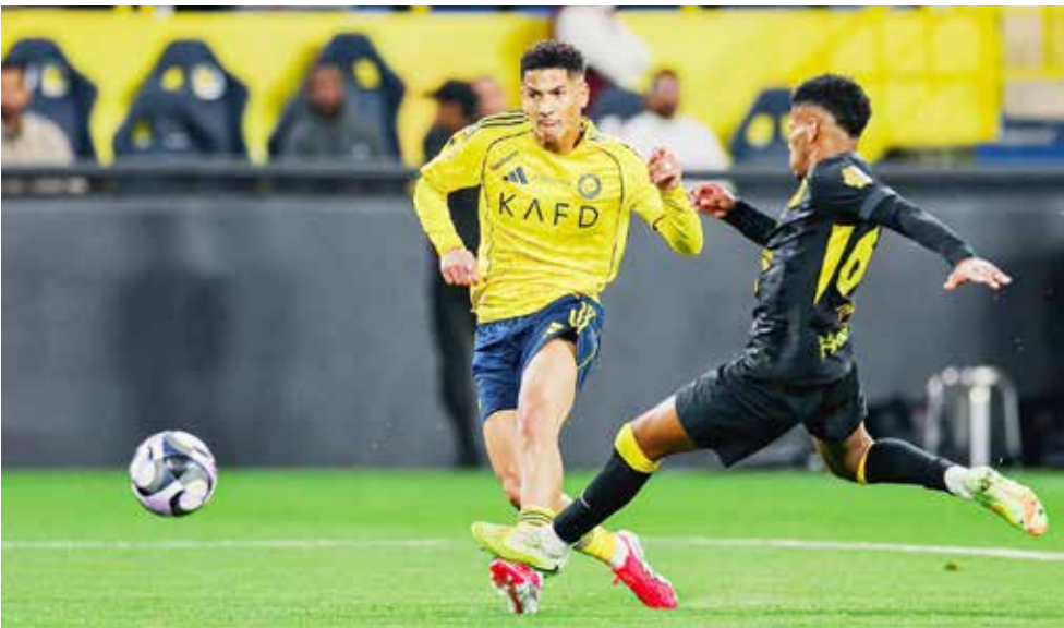
○ من لقاء النصر والاتحاد.

وتشير «ذي ميرور» إلى أن غياب رونالدو عن المشاركة في آخر مباراتين للنصر لم يكن مجرد