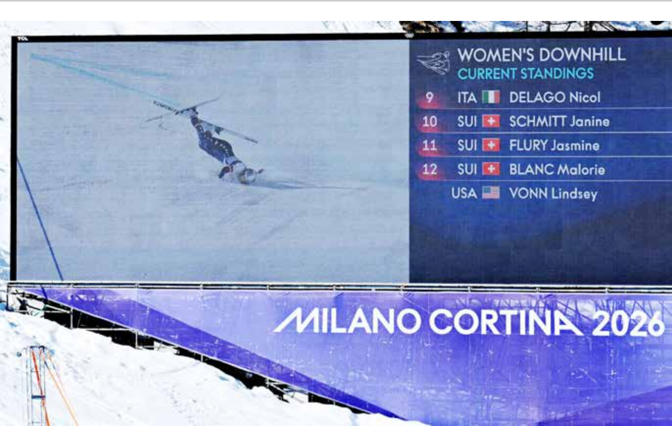
○ الشاشة تعرض سقوط فون

تمثل ميلانو–كورتينا 2026 فرصة فريدة لإعادة تأكيد هوية إيطاليا وقيمتها الأساسية. ومن خلال هذه الألعاب الأولمبية الشتوية، تسعى إيطاليا إلى مخاطبة العالم كصانعة للسلام والنمو والتعاون الدولي. وستكون «ألعاب السلام» التزامًا مشتركًا يَحْتضن جماعيا.