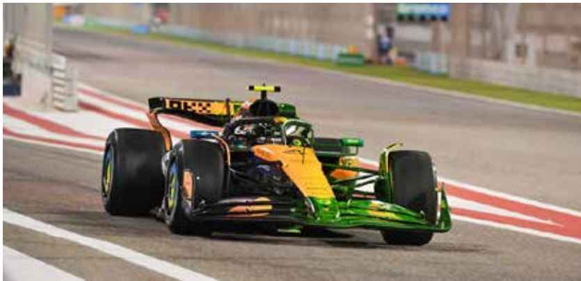
○ لحظة من تجارب سابقة.

العام الماضي، حيث سيتمكنون من الدخول مجاناً خلال يومي التجارب الحرة للفترة الثانية. كما تُقدّم حلبة البحرين الدولية باقات