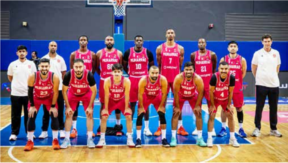
○ فريق المحرق.