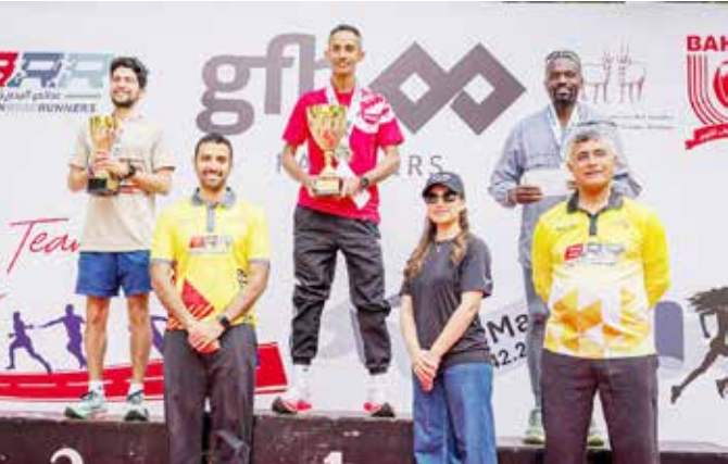
○ جانب من التتويج.

تخلّت لجنة عدائي البحرين التابعة للاتحاد البحريني لألعاب القوى سباق الماراثون السنوي لمسافة 42.2 كيلومترا، وقد انطلق السباق من محمية محمد بن زايد الطبيعية، سرورا بمنطقة الزلاق، وصولاً إلى منتجع جيميرا خليج البحرين ثم العودة إلى خط النهاية في محمية محمد بن زايد الطبيعية. وأعربت لجنة عدائي البحرين عن تقديرها لشركه GFH Partners على رعايتهم لسباق الماراثون السنوي والذي أسهم بتحقيق أجواء مميزة للمشاركين في السباق.