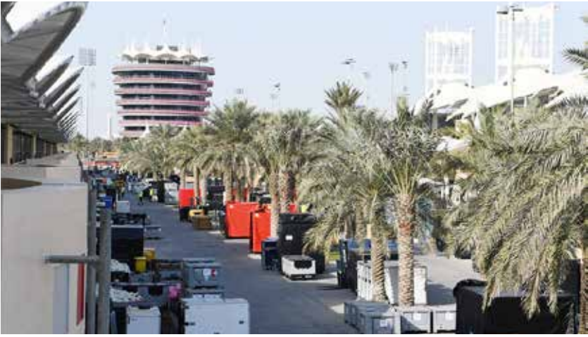
○ حلبة البحرين الدولية

العام الماضي، حيث سيتمكنون من الدخول مجاناً خلال يومي التجارب الحرة للفترة الثانية. كما تُقدّم حلبة البحرين الدولية باقات