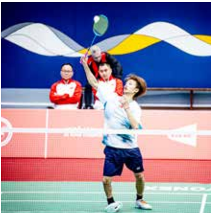
○ جانب من المنافسات.