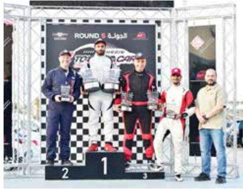
○ جانب من التتويج.