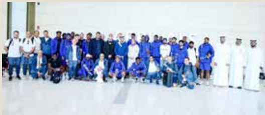
○ جانب من وصول فريق العين الإماراتي.

الإنجازات ثمرة دعم مؤسسي أعربت الدكتورة الشبيخة حصة بنت خالد آل خليفة، عضو مجلس إدارة اللجنة الأولمبية البحرينية ورئيسة لجنة تكافؤ الفرص والتوازن بين الجنسين في المجال الرياضي، عن فخرها واعتزازها الكبيرين بالمشاركة البحرينية في النسخة