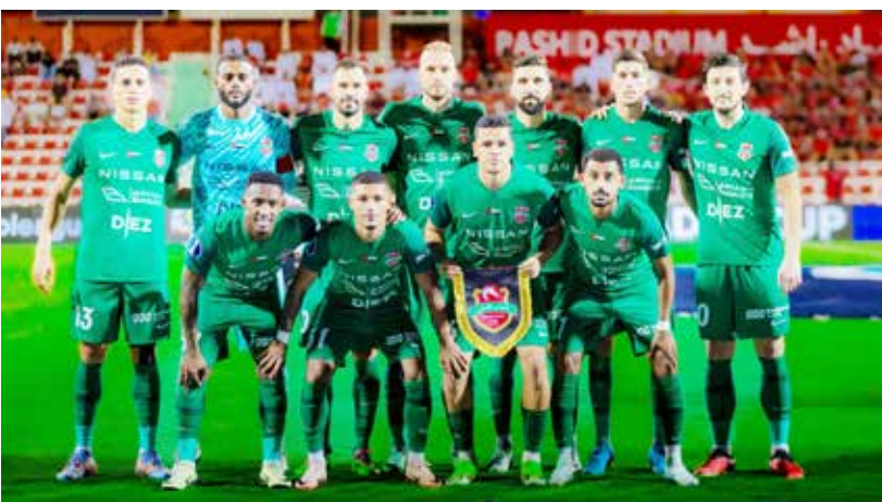
○ فريق شباب الأهلي.