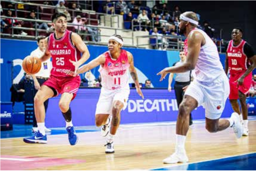
○ لقطة من المواجهة السابقة بين الفريقين.