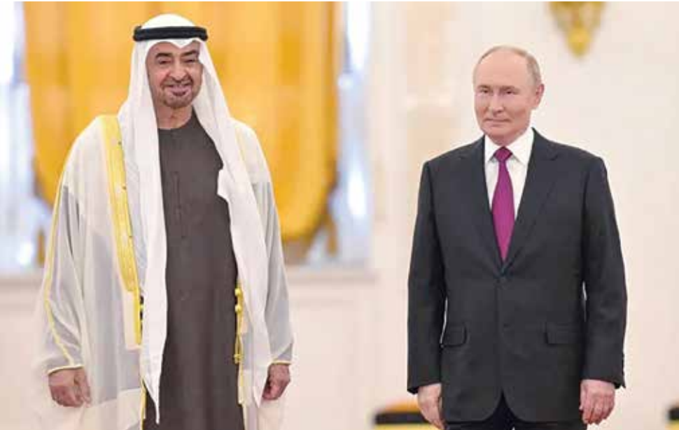
○ الرئيسان الإماراتي والروسي. (أرشيفية)

واتهم وزير الخارجية الروسي سيرغي لافروف بتهمة بالوقوف خلف محاولة اغتيال أليكسييف، والسعي عبر ذلك إلى إفشال المباحثات الجارية بوساطة أمريكية للتوصل إلى حل للنزاع في أوكرانيا.