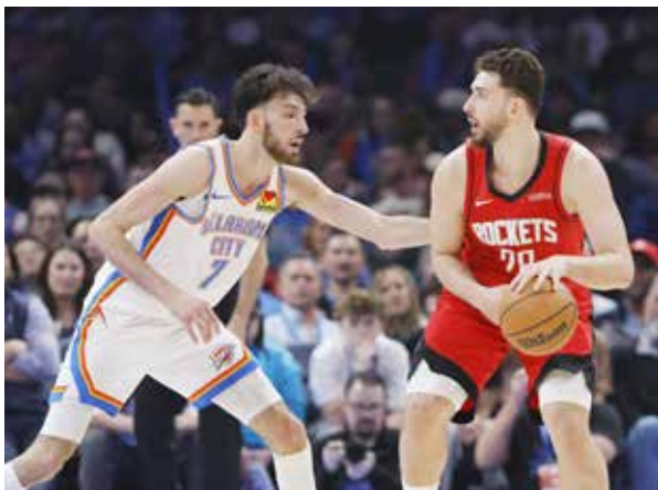
○ من لقاء روكتس وشاندر.