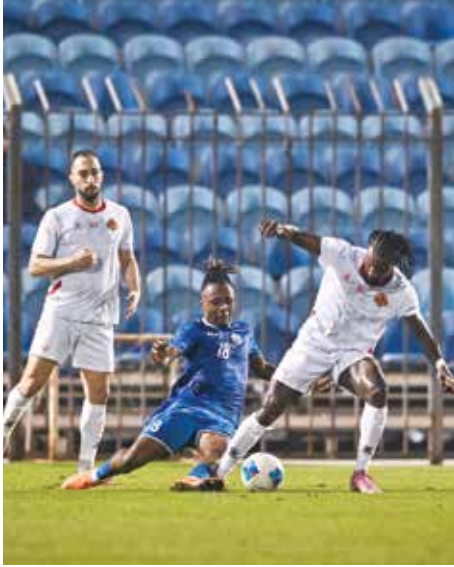
○ من لقاء الرفاع الشرقي والبسيتين.

ويتصدر ترتيب المجموعة الأولى فريق زاخو العراقي برصيد 10 نقاط، يليه العين الإماراتي في المركز الثاني برصيد 6 نقاط، ثم القادسية الكويتي ثالثاً برصيد 4 نقاط، فيما يتبدل فريق سترة الترتيب برصيد نقطتين، حيث ينتقل إلى تحقيق نتيجة إيجابية تعيد أماله في المنافسة وتمنحه دفعة معنوية في مشواره بالبطولة. وتحظى المباراة بأهمية كبيرة لكلا الفريقين، إذ يسعى العين لمواصلة مشاركته للصدارة، بينما يأمل سترة في استثمار عامل الأرض والجمهور لتحقيق فوزه الأول في البطولة.