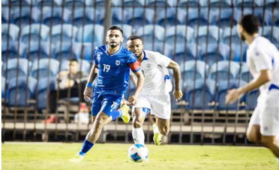
○ من لقاء سابق بين النمامة وأم الحصم.