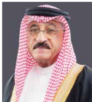
○ البروفيسور عبدالله الحواج.