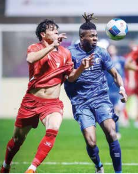
○ من لقاء الاتفاق وبورى.