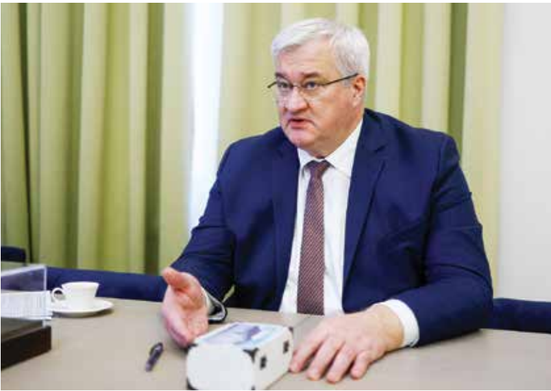
○ وزير الخارجية الأوكراني متحدثا خلال المقابلة.

الجانين ما زالا متباعدين في مواقفهما. وتصر روسيا على مطلبها بأن تتنازل أوكرانيا عن 20 بالمائة المتبقية من منطقة دونيتسك بشرق البلاد، والتي لم تتمكّن من احتلالها خلال سنوات من الحرب الطاحنة والمستنزفة، وهو أمر رفضته كييف بشدة. وتريد أوكرانيا أيضا