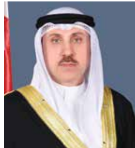
○ سفير مملكة البحرين لدى الجمهورية الفرنسية.

من الخبرات الفرنسية في عدد من المجالات الحيوية، بما يخدم المصالح المشتركة ويعزز من مسيرة التنمية والازدهار في البلدين الصديقين.