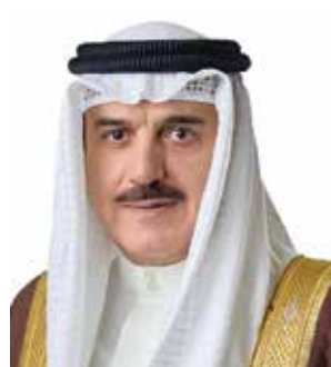
○ رئيس مجلس النواب.

ويأتي انعقاد المؤتمر هذا العام في إطار التزام الجامعة الأهلية بتعزيز اقتصاد المعرفة ومواكبة رؤية البحرين 2030 في دعم المساواة وتمكين المرأة. ومن المتوقع أن تساهم توصيات المؤتمر في تقديم حلول عملية لعمليات لصناعي القرار والمؤسسات الأكاديمية، بما يعزز التنمية المستدامة ويكرس مبدأ تكافؤ الفرص في مختلف القطاعات.