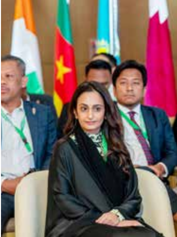
○ د. الشبيخة حصة بنت خالد آل خليفة

وتمنّت الشبيخة حصة بنت خالد في هذا السياق الدعم الكبير الذي تحظى به لجنة تكافؤ الفرص والتوازن بين الجنسين في المجال الرياضي من اللجنة الأولمبية البحرينية برئاسة سمو الشيخ خالد بن حمد آل خليفة، مشيرة إلى أن هذا