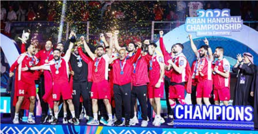
○ من تتويج منتخبنا لكرة اليد.