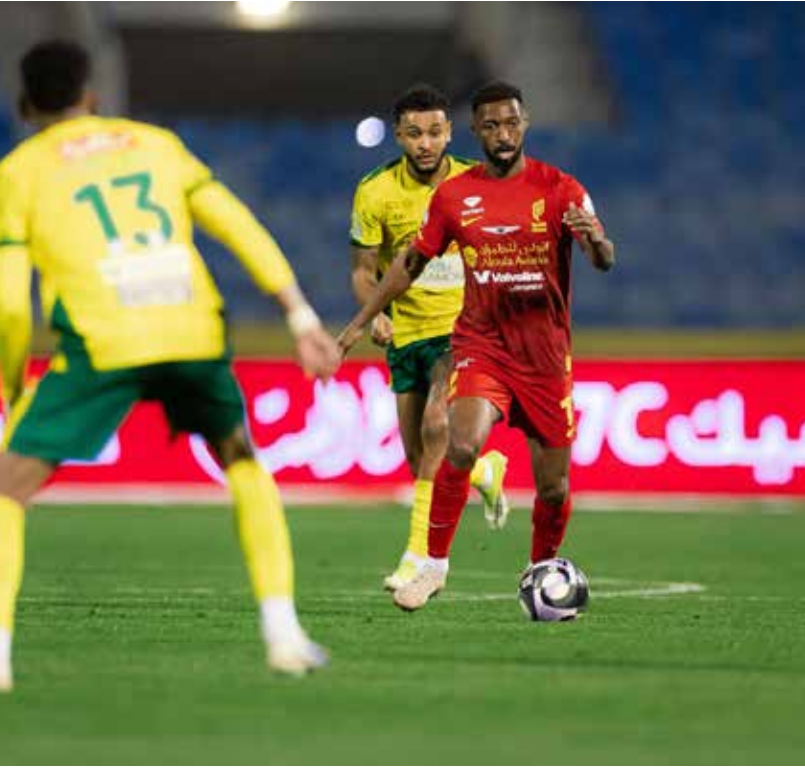
من لقاء القادسية والخليج.