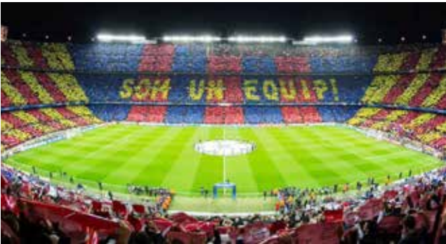
○ كامب نو.

وذكر برشلونة في بيان نشره على موقعه الإلكتروني: «يشكل هذا الإجراء جزءا من مرحلة أولية من التحليل والتقييم. وقدم النادي والجهات المعنية الوثائق الأولية المطلوبة بهدف دفع الإجراءات قدما وتمكين الاتحاد الأوروبي لكرة القدم (يويفا) من تقييم مدى ملاءمة ملف الترشح، وذلك وفق للبروتوكولات المعمدة». وأكد البيان: «من المقرر تقديم الملف النهائي للترشح بشكل رسمي وتسليم الملف المتكامل، الذي يشمل جميع الوثائق المطلوبة للنظر إلى استضافة المباراة النهائية، مطلع شهر يونيو المقبل».