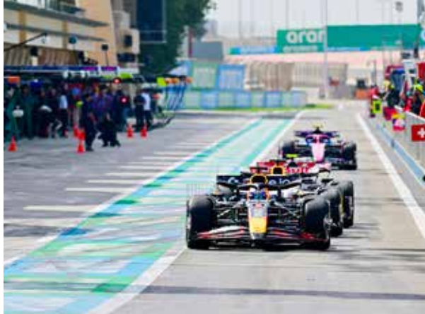
○ من منافسات سابقة.

أسبوع واحد فقط يفصل عن انطلاق تجارب أرامكو التحضيرية لموسم الفورمولا وان 2026 على مضمار حلبة البحرين الدولية «موطن رياضة السيارات في الشرق الأوسط» وتواصل الحلبة طرح التذاكر لفترتي التجارب الحرة للبطولة العالمية.