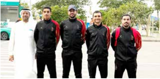
○ منتخب الدراجات

يشارك البحرين الوطني للدراجات الهوائية في بطولة آسيا لدراجات الطريق 2026، النسخة الخامسة والأربعين لفئة العموم، الثانية والثلاثين للشباب والرابعة عشر لفئة الدراجات البارالمبية، والتي تقام في القصيم بالمملكة العربية السعودية خلال الفترة من 5 - 13 فبراير الجاري.