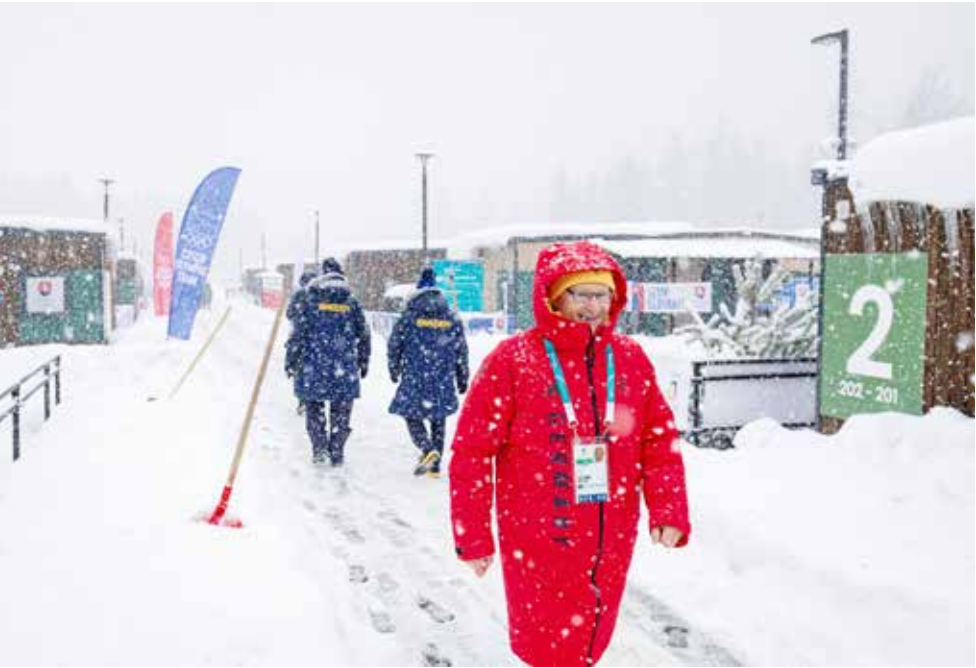
○ من التحضيرات لأولمبياد ميلانو كورتينا. (أ ف ب)

وتتصدر فون قائمة متسابقات التزلج هذا الموسم، بعد عودتها الموسم الماضي عقب خضوعها لعملية استبدال جزئي لركبتها اليمنى بالتيتانيوم.