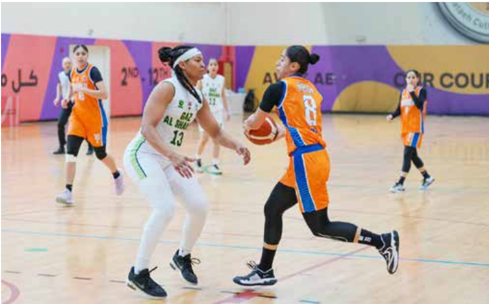
○ خسارة الحالة في مستهل المشوار العربي.