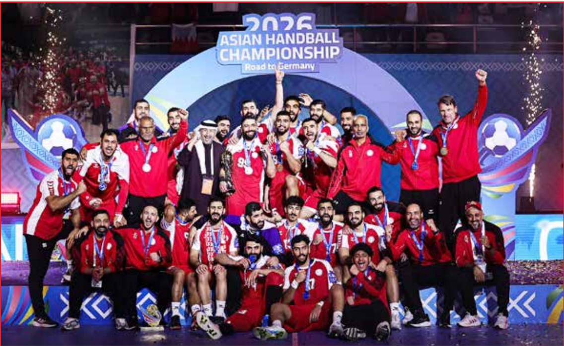
○ منتخبنا الوطني لكرة اليد بطل آسيا.

ولفت المدربين والخبراء الرياضيون والإعلاميون إلى أن هذا الإنجاز جاء نتيجة للروح القتالية العالية، والانضباط الفني، والتنسيق بين لاعبي الخبرة والشباب، الذين أسهموا بخبراتهم في قيادة المنتخب خلال المنافسات القارية، مؤكداً أن جاهزية المنتخب للمواجهة الكبرى أملتة لحجز مقعده في نهائيات كأس العالم 2027، وتحقيق اللقب الآسيوي، ورفع اسم مملكة البحرين عالياً على صعيد البطولات الدولية.