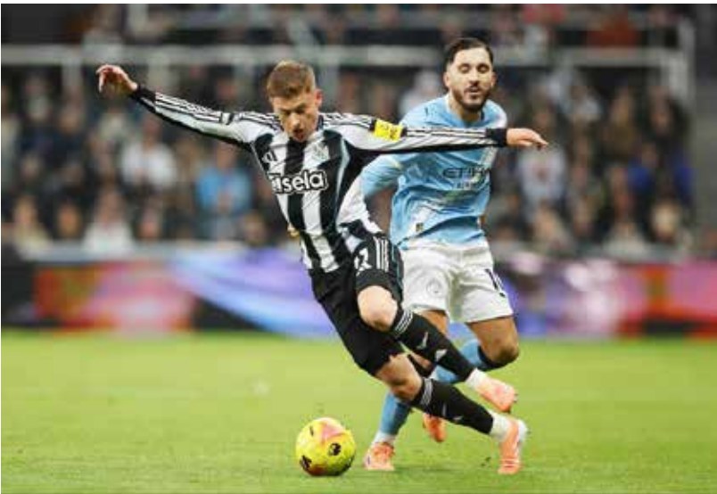
○ من لقاء سابق بين سيتي ونيوكاسل.

ب(المكابيث)، وشهدت تسجيل لاعبيه 37 هدفا، مقابل 3 أهداف فقط منيت بها شباك الفريق، بما في ذلك الفوز الساحق بنتيجة 4 / 0 صفر بالدوري الإنجليزي الممتاز في فبراير 2025.