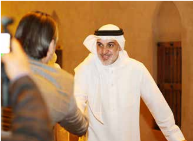
○ الشيخ محمد بن دعيج آل خليفة.