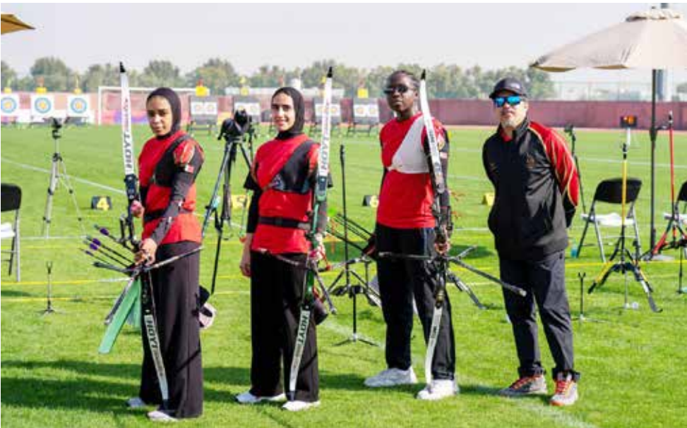
○ فريق الرقاع للقبوس والسهم.