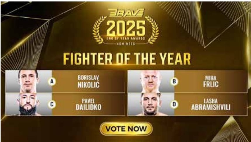
○ قائمة المرشحين.

كشفت منظمة بريف البحرينية، عن قائمة المرشحين لجائزة مقاتل عام 2025، في عام سيظل محفورًا كإحدى أهم المحطات في تاريخ المنظمة العالمية، بعدما شهد تغير حامي الألقاب، وصعود أسماء فرضت نفسها بقوة، وهيمنة أبطال أكدوا مكانتهم على قمة المشهد القتالي عبر نزالات خالدة وحسم لا يُنسى.