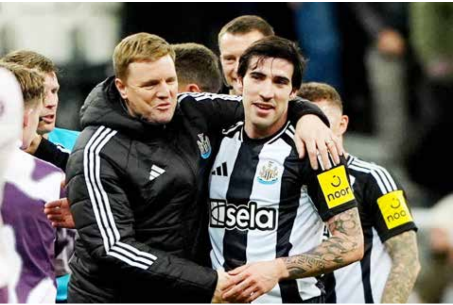
○ هاو مع تونالي.

ويتطلع الآن فريق المدرب الإسباني جوسيب غوارديولا، الذي يمتلك 8 ألقاب في المسابقة، إلى تحقيق لقبه الأول بكأس الرابطة منذ موسم 2020 / 2021، حيث لا يتفوق عليه في عدد مرات الفوز بالبطولة، سوى ليفربول،