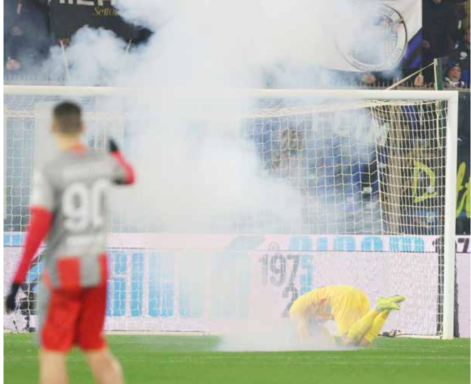
لحظة إصابة حارس كريمونيزي.

وأفادت صحيفة «أبولا» البرتغالية بأن غياب ابن الأربعين عاما، لا يرتبط بأي إعداد بدني تمهيدا لمواجهة الاتحاد الجمعة، فيما يحارب النصر بضراوة لنيل اللقب الذي لا يزال غائبا عن خزائنه منذ قدوم رونالدو. وقالت «بحسب معلومات حصلت عليها صحيفتنا من مصدر داخل نادي النصر، فإن كريستيانو رونالدو غير راض عن الطريقة التي يدير