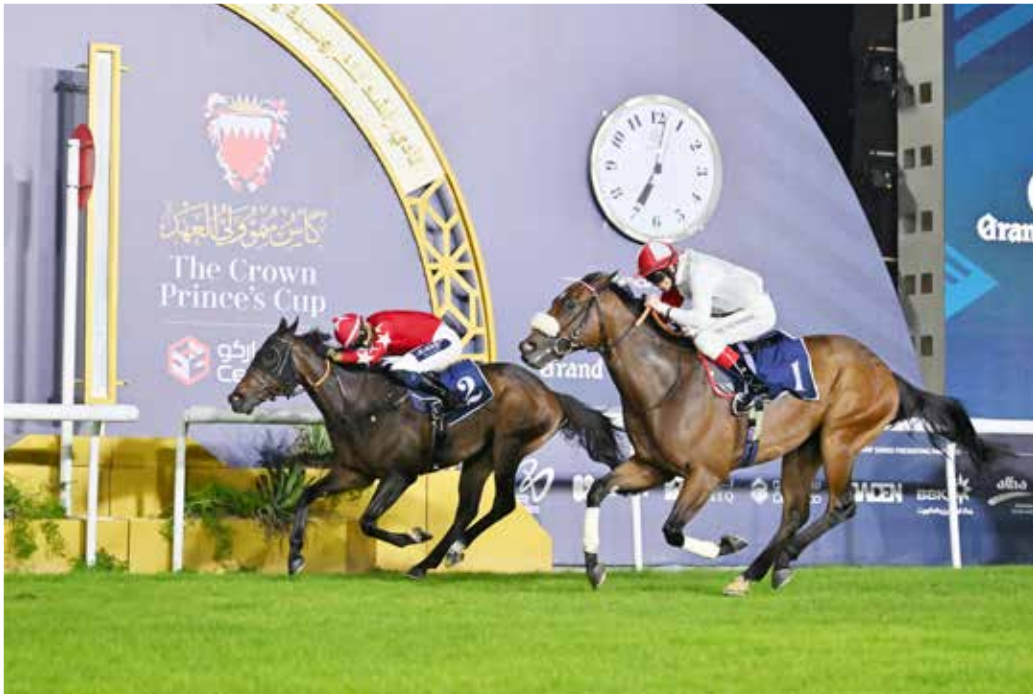
○ لقطة من السباقات الأسبوعية.

مهمتسو، غولمارغ، إكو سيستم، بورديت، كومبيتزيون، أذان، واين فور غلوري، مستر أيرلفتن، لوف إن ذا لاو، أسيموف.. الشوط السابع: كأس نادي الفرسان البريطاني لسباق التوازن «مستورد»، مسافة 1200 متر مستقيم، الجياد المشاركة: «إيغت أفنيو، سهارا سبير، ناين بيلو زيرو، حد الرأس، شبلد وال، كوليكورد، جينا، مجتهد، هوتيست وود، غالبونغ أون، أفيانسو، ووجتيك، ماكس كرايز، روزا مايسنيكا، سبراير، سينغ، كوين إفي».