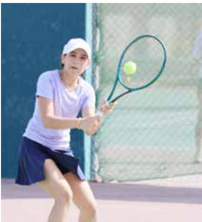
○ جانب من منافسات الفتيات.

ستُشهد تجارب ما قبل الموسم الطريق لانطلاق الموسم الجديد، الذي سيبدأ بعد أسبوعين من التجارب مع سباق جائزة أستراليا الكبرى، المقرر إقامته في الفترة من 6 إلى 8 مارس. ويستمر الموسم بسباقات في الصين واليابان، قبل العودة إلى سباق جائزة البحرين الكبرى للفورمولا وان لعام 2026، الذي يُقام في الفترة من 10 إلى 12 أبريل، وهو الجولة الرابعة من بطولة العالم المكونة من 24 سباقاً.