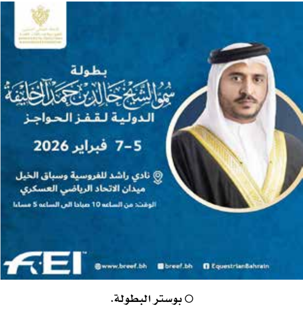
○ بوستر البطولة.