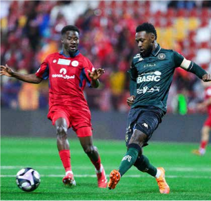
من لقاء ضمك والخلود.

(رويترز): فرضت وزارة الداخلية الإيطالية أمس الثلاثاء حظرا على سفر مشجعي إنتر ميلان حتى 23 مارس بعد سقوط ألعاب نارية أقيمت من المدرجات بالقرب من إميل أوديرو حارس مرمرى كريمونيزي صاحب الضيافة يوم الأحد. كما يحظر القرار بيع تذاكر مباريات إنتر أمام ساسولو وليتشي وفورنتينا في الدوري لسكان لومبارديا المنطقة الشمالية التي يقع