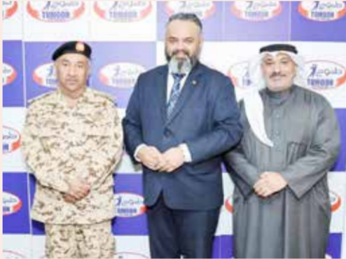
○ صورة جماعية.

والاتحاد البحريني لألعاب القوى، مؤكداً أن هذه المبادرة تأتي امتداداً لجهود المجموعة في دعم البرامج الوطنية المختلفة، التي تعكس رؤيتها في تعزيز التكافل والمساهمة في التنمية المستدامة، مشيدا بالجهود الطبية للشركة والاتحاد في المجال الرياضي بمملكة البحرين ودورها الفاعل في تحقيق النجاحات والمكاسب المتميزة والإنجازات الالفة.