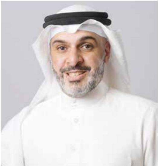
○ الشيخ محمد بن دعيج آل خليفة.

أشاد سعادة الشيخ محمد بن دعيج آل خليفة، رئيس اللجنة البارالمبية البحرينية، بالرعاية الكريمة من سمو الشيخ خالد بن حمد آل خليفة، النائب الأول لرئيس المجلس الأعلى للشباب والرياضة، رئيس الهيئة العامة للرياضة، رئيس اللجنة الأولمبية البحرينية، لبطولة العالم البارالمبية للريشة الطائرة 2026، والتي تنظمها اللجنة البارالمبية البحرينية بالتعاون مع الاتحاد البحريني للريشة الطائرة، خلال الفترة من 8 إلى 14 فبراير 2026. وأكد الشيخ محمد بن دعيج أن هذه البطولة، التي تقام للمرة الأولى في منطقة الشرق الأوسط، تمثل علامة فارقة في مسيرة الرياضة البارالمبية على المستويين الإقليمي والدولي، وتعكس الثقة الكبيرة التي تحظى بها مملكة البحرين من قبل الاتحادات الرياضية العالمية. وقال: «إن استضافة البحرين لهذا الحدث العالمي يُعد تنويجًا للرؤية الوطنية الهادفة