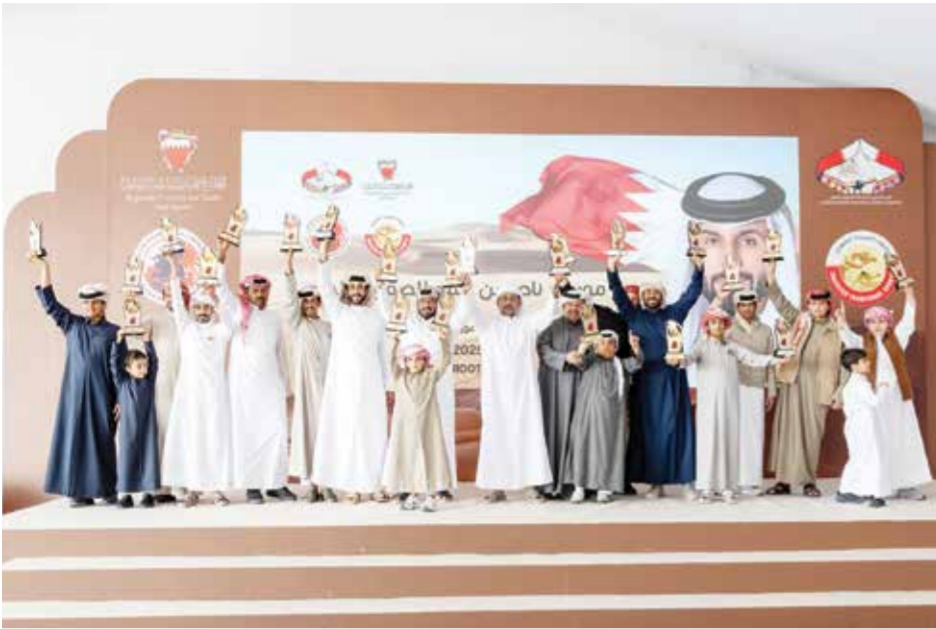
○ صورة جماعية.