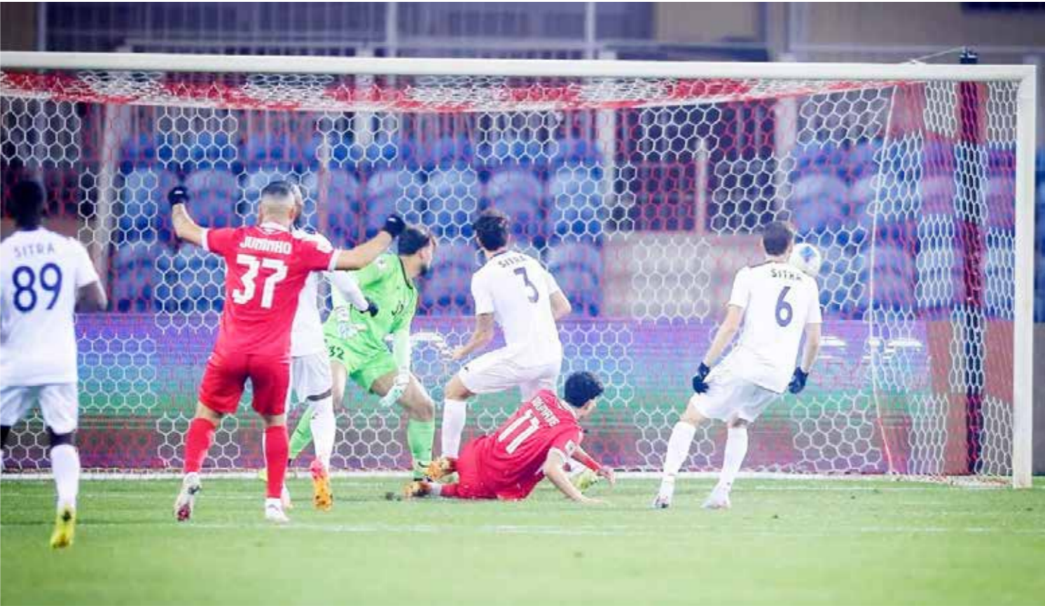
○ لحظة من المباراة.