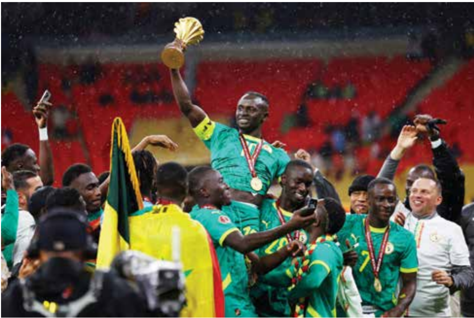
○ من تتويج منتخب السنغال.

هدف منتخب اليابان الوحيد في الدقيقة 36، في حين عجز لاعبو منتخب كوريا الجنوبية عن تسجيل هدف التعادل والدفع باللقاء للوقت الإضافي، في الفترة المتبقية من اللقاء. بتلك النتيجة، ضرب منتخب اليابان موعدا في المباراة النهائية، مع الفائز من لقاء المربع الذهبي الآخر بين منتخب فيتنام والصين، الذي أقيم في وقت لاحق من مساء أمس.