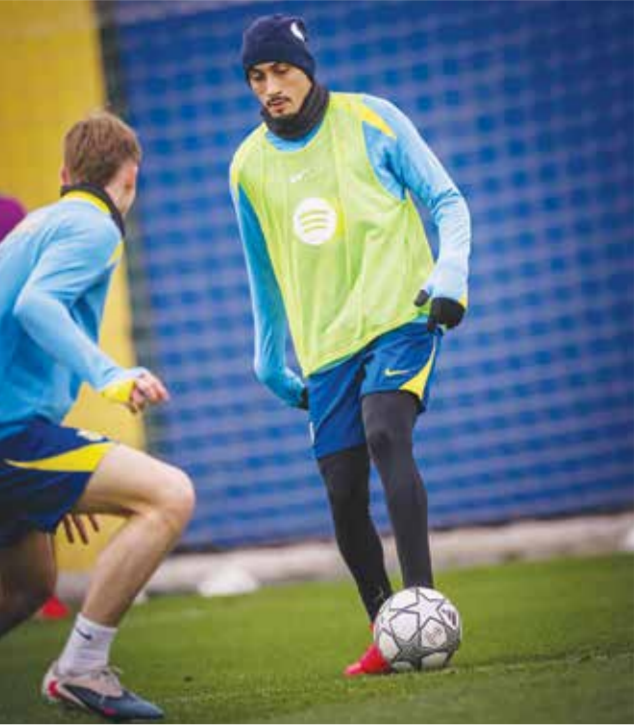
○ تدريبات برشلونة.