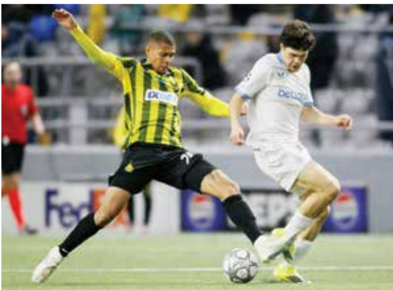
○ من لقاء كلوب البلجيكي ضد كايرات الماتي الكازاخي.

المرتقب مع نادي مارسيليا الفرنسي. ورفع كلوب بروج رصيده إلى سبع نقاط في المركز الثالث والعشرين وظل كايرات ألماتي في المركز الأخير بنقطة واحدة.