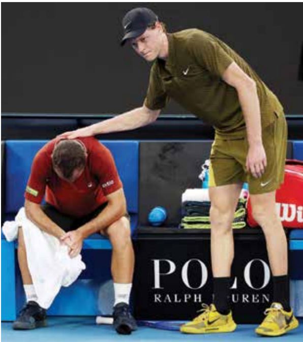
○ سينر يواسي غاستون.