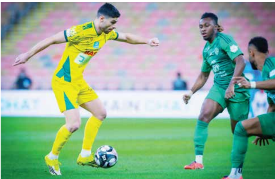
○ من لقاء الأهلي والخليج.