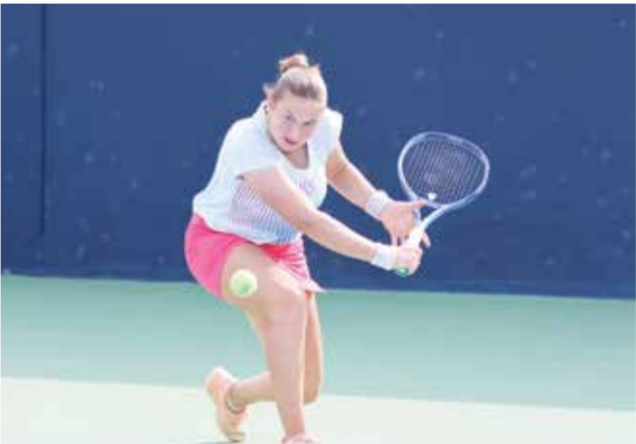
○ جانب من المنافسات.

واستقرار أدائها. وشهدت المواجهة التي جمعت البلغارية إيزابيل شينيكوفا والاعبة ماريسا كاليابينا واحدة من أكثر مباريات يوم أمس إثارة، حيث قلبت كاليابينا تأخرها في المجموعة الأولى إلى فوز ثمين بنتيجة 2-3، 6-3، لتقصي إحدى المرشحات وتواصل مشوارها بنقطة. وفي السياق ذاته، تمكنت الفرنسية فيونا فيرو المصنفة الخامسة من تجاوز الأمريكية جينا دي فالكو المصنفة الثالثة عشرة بنتيجة 4-6، 3-6، في مباراة اتسمت بالقوة في التبادلات من الخط الخلفي. أما الألمانية أنتونيا شميت المصنفة السادسة، فقد ودعت المنافسات بعد خسارتها أمام