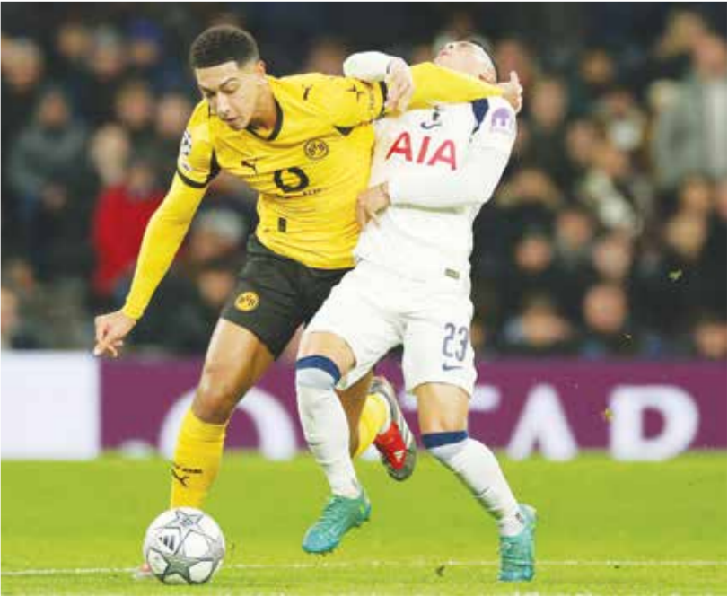
○ من لقاء توتنهام وبوروسيا دورتموند

وضرب ريال من البداية مفتحًا التسجيل بعد خمس دقائق فقط