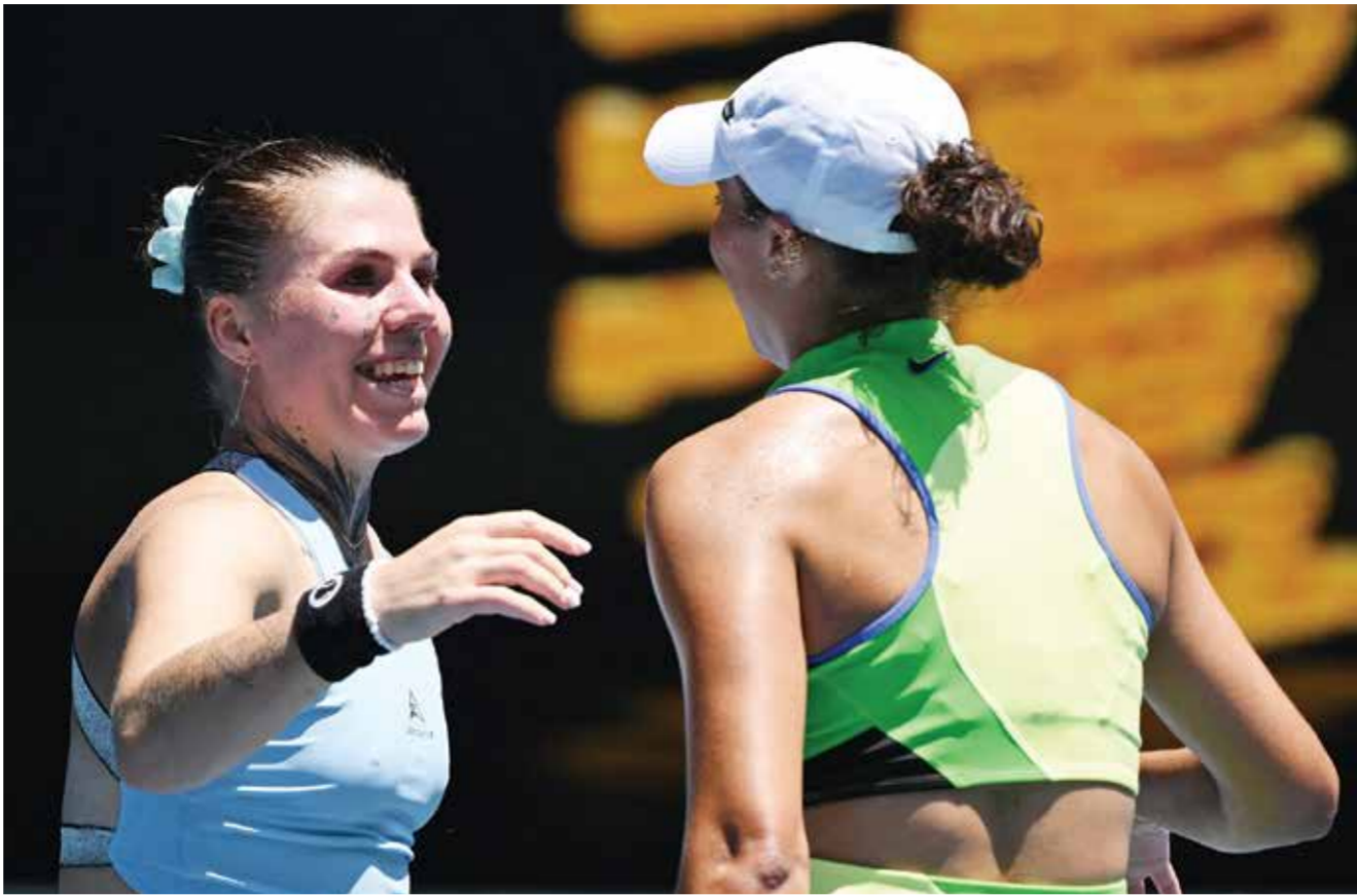
○ كيز تصافح أولينيوكوفا. (رويترز).

وفاز الإيطالي لورنتسو سونيغو بسهولة على الإسباني كارلوس تابيرنير 6-4 و0-6 و3-6، بخلاف التشيكي ياكوب منتشيك السادس عشر الذي عانى للفوز على الإسباني بابلو كارينيو بوسا 5-7 و6-4 و6-2 و7-6 (7-1 و3-6).