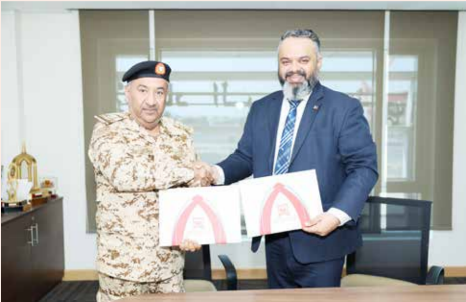
○ من توقيع اتفاقية الشراكة مع اتحاد ألعاب القوى.

ويؤكد نادي الخالدية أنه لن يقبل أن يكون طرفاً متضرراً أو كيش فداء لأي تجاوزات من لجنة الحكام ناجمة عن قرارات عشوائية أو ضغوطات خارجية، مشدداً في الوقت نفسه على دعمه الكامل للحكم البحريني، مع عدم ممانعته الاستعانة بطواقم خارجية شريطة أن تقوم على معايير واضحة وشفافة، قائمة على الكفاءة والخبرة، بما يضمن نزاهة المنافسات ويحفظ حقوق جميع الأندية على حد سواء.