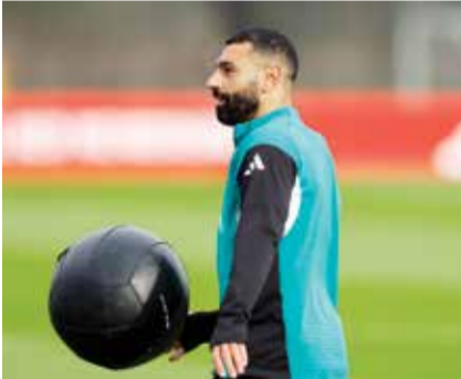
○ محمد صلاح.

مشاركة المهاجم أمام مرسيليا في فرنسا اليوم الأربعاء. ويحتل ليفربول حاليا المركز التاسع في دوري أبطال أوروبا. ويتأهل أصحاب المراكز الثمانية الأولى مباشرة إلى دور الـ16، فيما تخوض الفرق من التاسع إلى الـ24 الملحق. وكان صلاح قد سجل 29 هدفا في الدوري الموسم الماضي ليتوج بجائزة الحذاء الذهبي، خلال مسيرة ليفربول نحو لقبه العشرين في الدوري الإنكليزي، لكنه اكتفى بأربعة أهداف فقط في الموسم الحالي.