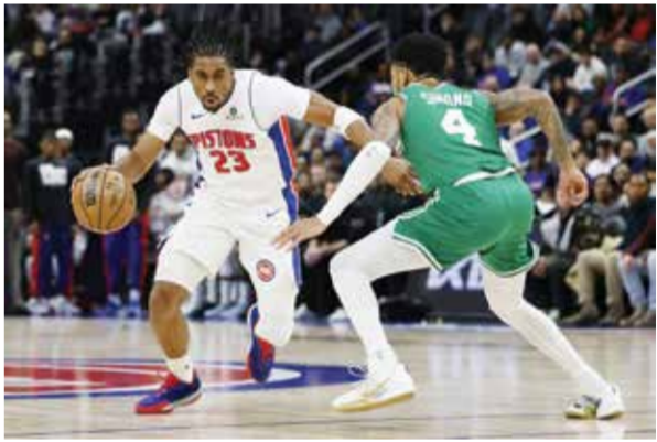
○ من لقاء بيستونز وسلتيكس.

وكان هذا فوزها الـ 70 في الجدول الرئيس للبطولات الكبرى، لتصبح ثاني يابانية تحقق هذا الإنجاز بعد آي سوغياما.