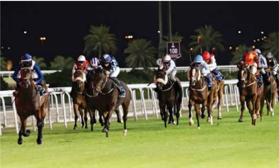
○ لقطة من السباقات الأسبوعية.

الشوط الخامس: كأس المجلس الأعلى للمرأة لسباق التوازن «مستورد» – مسافة 1600 متر، الجباد المشاركة: «واين فور غلوري، بينتوت، مستر إيرلغت، ذا بارنت، لوف، إز ذا لاو، مدمن، أسيموف، لورد مونتي أغو، تشيمغان، هارنتيل، دارك جايد».