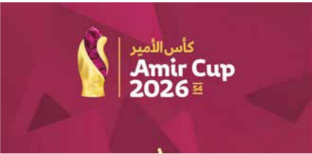
○ شعار البطولة.