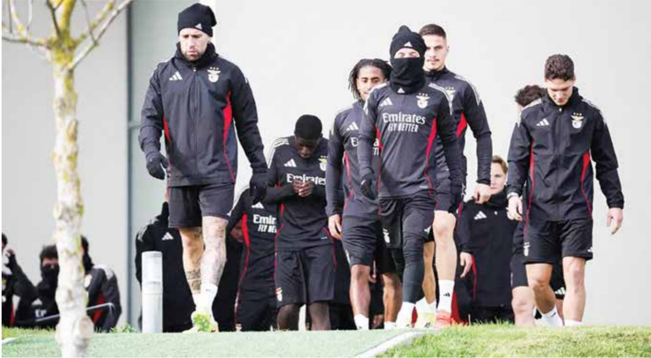
○ تدريبات بنفيكا.