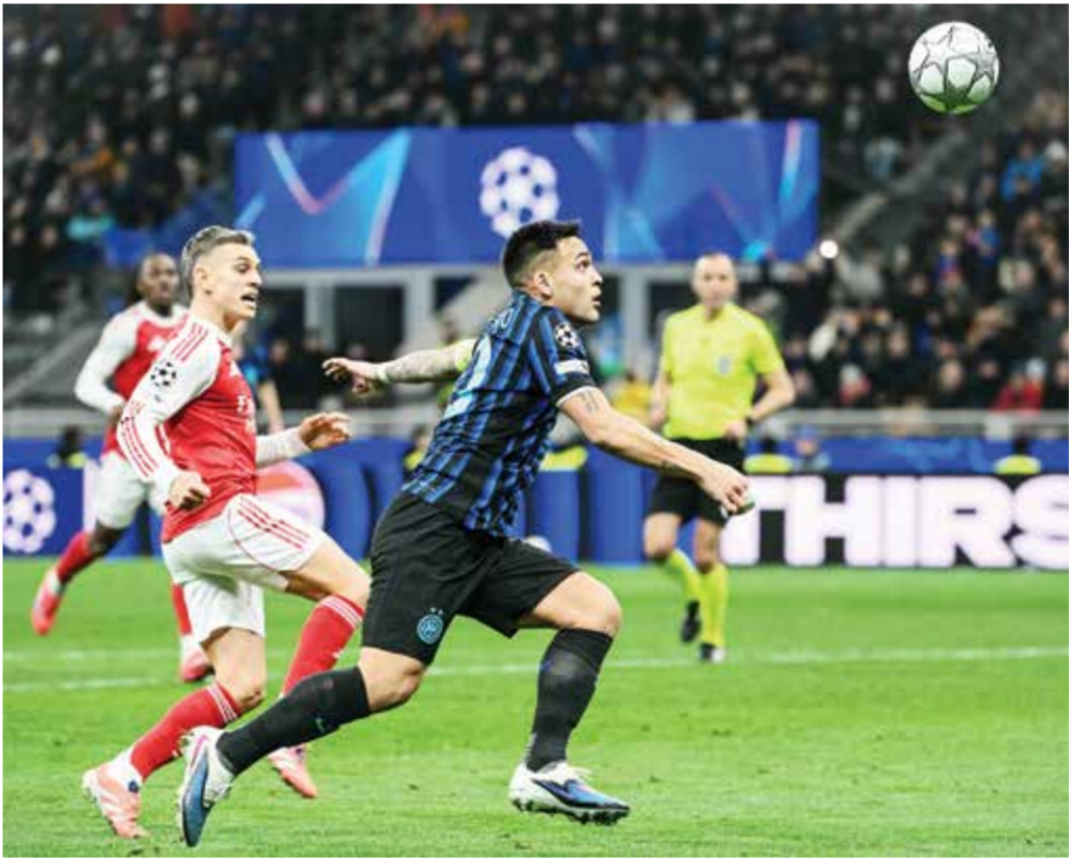
○ من لقاء أرسنال أمام إنتر ميلان.

حيث انتهوا في الأول، إذ أضاف الأرجنتيني فرانكو ماستاتانتوونو الهدف الثالث بعد تمريرة حاسمة ثانية لفينيسوس (51). وتحت ضغط مستمر من العملاق المديري، وتحديدا من خلال تحركات فينيسوس، سجّل الألماني تيلو كيهير هدفا في مرماه عن طريق الخطأ (55)، قبل أن يتوجّ البرازيلي أمسيته الرائعة بتسجيل هدف رائع من تسديدة صاروخية في أعلى المرمى (63). وبعد ان قلص