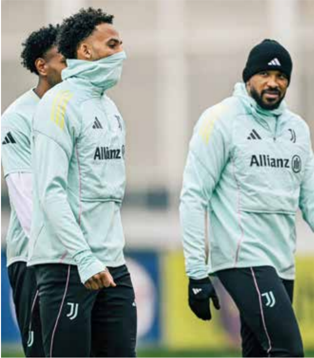
○ استعدادات يوفنتوس.