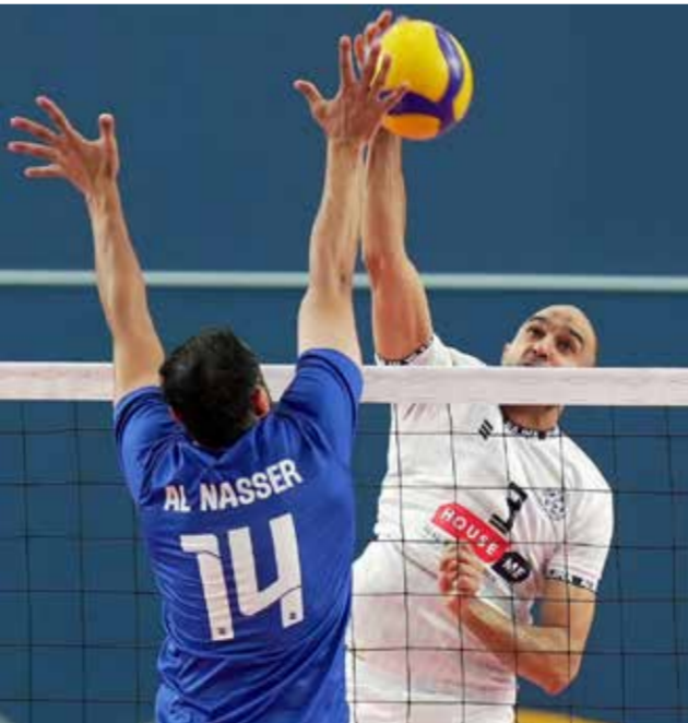
○ من لقاء النجمة والنصر.

الانتصار الثمين رفع النجمة رصيده إلى 21 نقطة، بينما بقي النصر على نقاطه الـ17. وتتواصل اليوم منافسات الجولة بإقامة لقاء واحد، يجتمع فريقين البسيطين 6 نقاط والدير بدون رصيد في الساعة السادسة والنصف مساء.