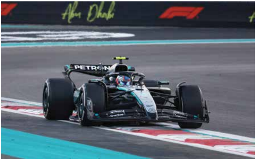
○ سيارة فريق براون جي بي.