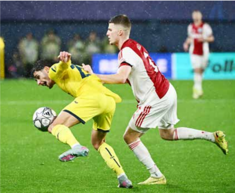
○ من لقاء فياريال وإياكس.