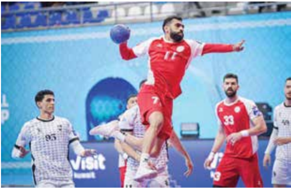
○ جانب من اللقاء.