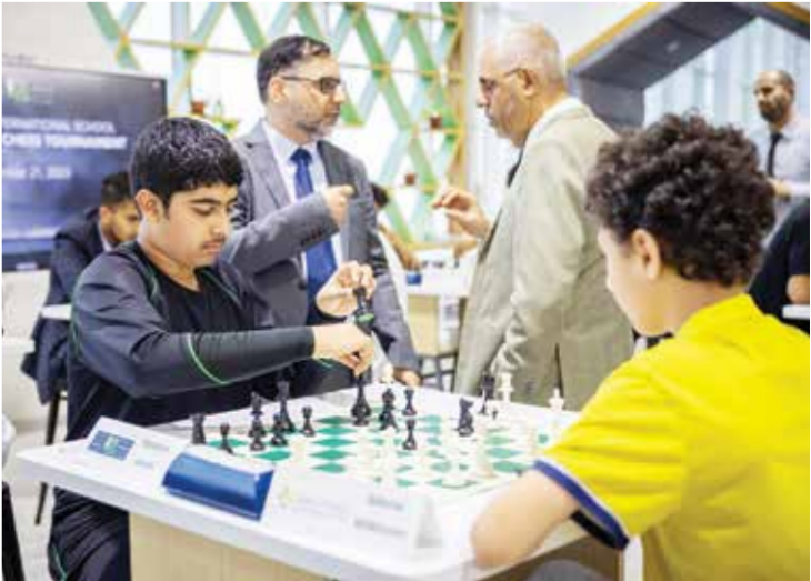
○ جانب من المنافسات.

أسفرت نتائج الجولة الثالثة لبطولة المدارس الخاصة الفرعية للشطرنج والتي تستضيفها مدرسة الرفاع فيوز الدولية عن فوز مدرسة الإبداع الخاصة على المدرسة الكندية بنتيجة 3-1 وتعادل مدرسة القلب المقدس من المدرسة الفرنسية بنتيجة 2-2 وفوز مدرسة المعارف الحديثة على مدرسة ابن خلدون بنتيجة 1-3 وفوز مدرسة النسيم على مدرسة الرفاع فيوز بنتيجة 1.5-2.5 وفوز مدرسة نيو ميلانيوم على المدرسة الهندية بنتيجة 1.5-3.5 وفوز مدرسة كرستوفر على مدرسة بيان البحرين بنتيجة 1-3 فيما حصلت مدرسة الرجاء على نظطتين. ويأتي هذا النشاط بالتعاون مع لجنة متميزة من اللاعبين الدوليين البحرينيين المخضرمين والحكام المتمرسين تتواصل