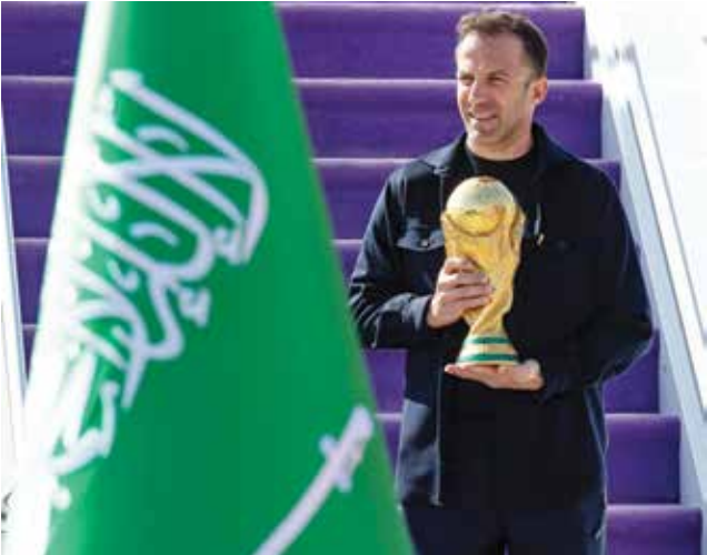
○ كأس العالم.

والثقافة، في أجواء احتفالية تعكس شغف الشعب السعودي باللعبة. ولا تقتصر الفعالية على عرض الكأس فقط، بل تتضمن برنامجاً غنياً بالتجارب التفاعلية المصممة خصيصاً للمشجعين من مختلف الأعمار. ومن المقرر أن تجوب الجولة العالمية، التي تطلقها «كوكاكولا» بالتعاون مع الاتحاد الدولي لكرة القدم «فيفا»، 30 دولة عبر 75 محطة مختلفة حول العالم، حاملة معها كأس العالم الأصلي. يذكر أن المنتخب السعودي يشارك في كأس العالم للمرة السابعة في تاريخه والثالثة على التوالي، حيث وضعت القرعة رفقة منتخبات إسبانيا، وأوروغواي و«الرأس الأخضر».