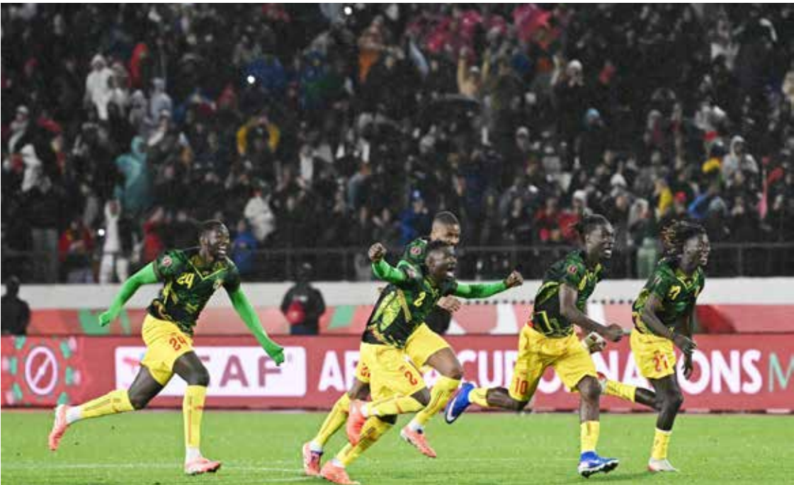
○ فرحة لاعبي مالي بالتأهل.