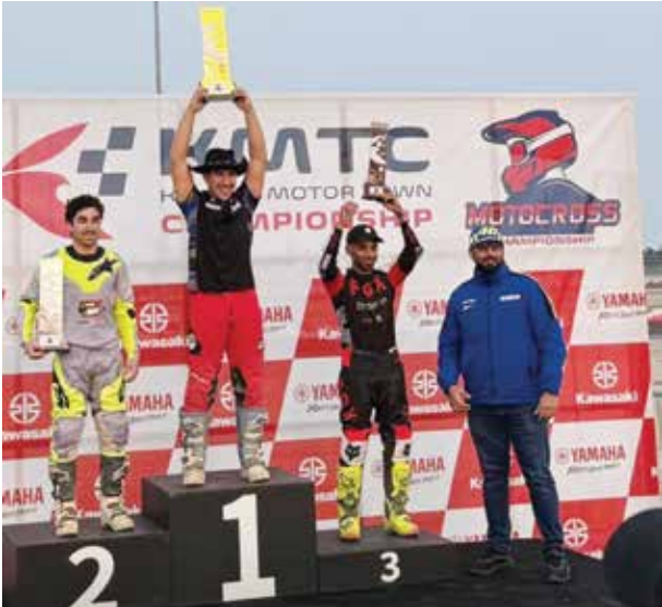
○ المتسابقون على منصة التتويج.

السباقات والبطولات، مشيدا في الوقت نفسه بالجهود التي بذلوها والتزامهم بالتوجيهات والبرامج التدريبية التي أسهمت في تحقيق هذه النتائج، متطلعا الى مزيد من الإنجازات والمراكز في السباقات والبطولات القادمة.