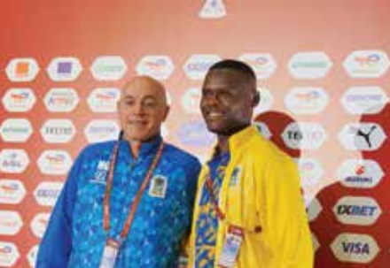
○ غاموندي وساماتا.

موهبة خارقة وإذا بحثت في تاريخ المغرب ستجدون الكثير من اللاعبين الموهوبين». وأوضح «نتميزون بالموهبة والفنيات العالية ويمكنهم الفوز بالمباراة بحركة فنية واحدة». وأشار مدرب سينغيدا بلاك ستنارز التنزاني السذي لجأ الاتحاد المحلي الى خدماته قبل شهرين من انطلاق العرس القاري بعد اقالة المحلي حامد سليمان «موروكو» من منصبه، إلى أن «لاعبي فريق لا يحتاجون إلى أي تحقيق في ظل هذه المعطيات وقوة أسود الأطلس، فهم يريدون تقديم أفضل ما لديهم من أجل بلادهم، وجاؤوا إلى هنا لتحقيق نتيجة إيجابية». ونجح غاموندي في مهمته بقيادة تنزانيا الى تأهل غير مسبوق إلى ثمن النهائي وهي التي لا زالت تلهث وراء فوزها الأول في العرس القاري.