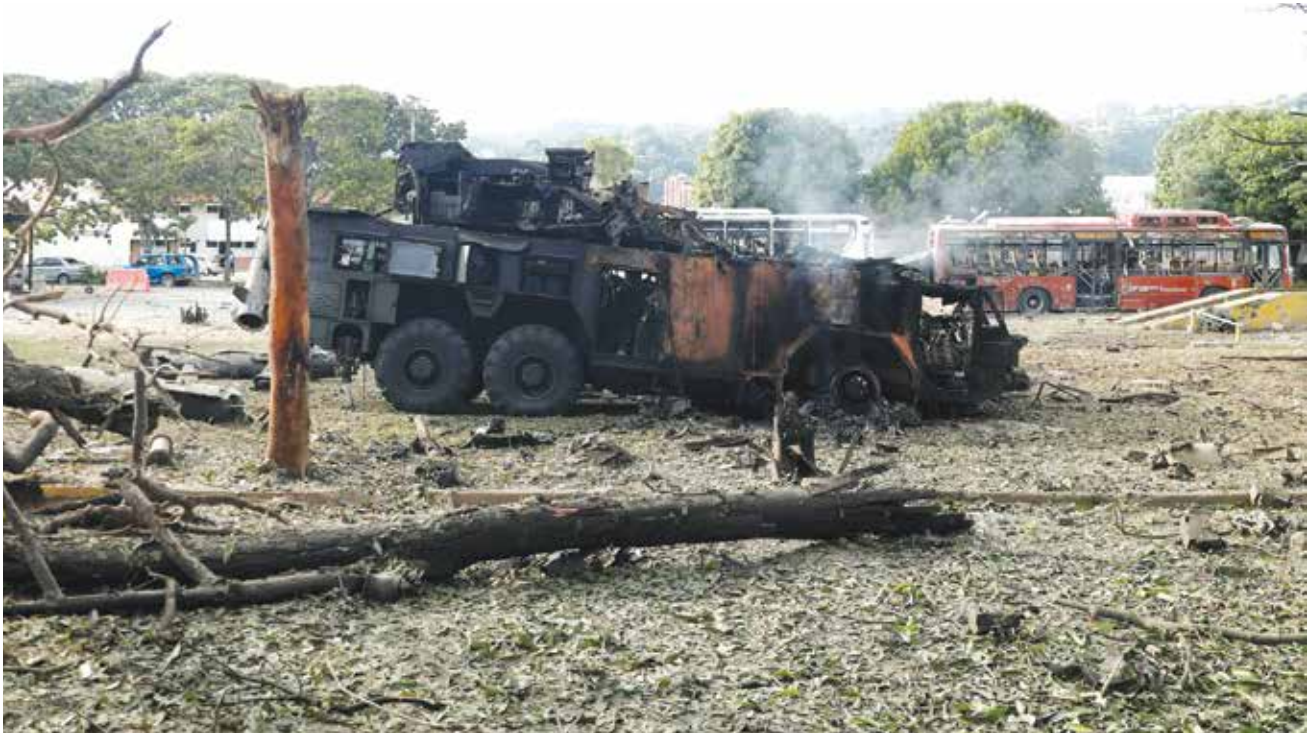
○ قاعدة عسكرية تابعة للجيش الفنزويلي بعد تعرضها لضربات أمريكية.