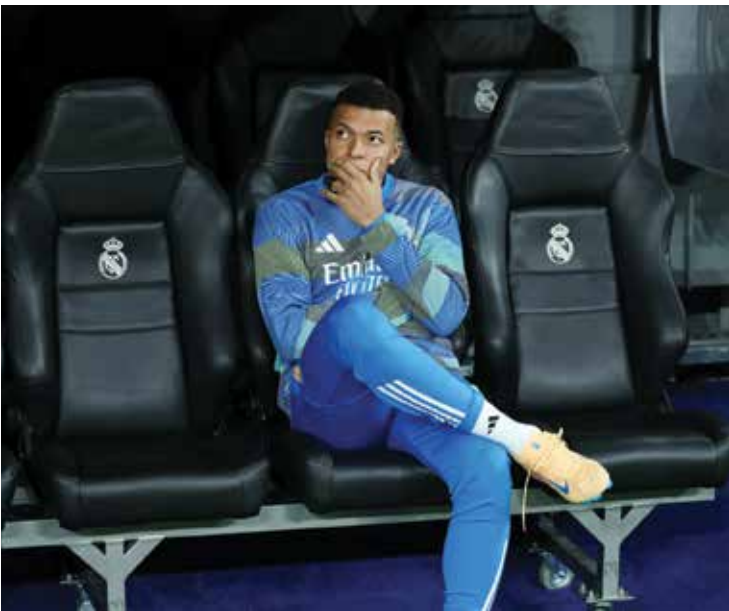
○ مبابي. (أ ف ب)

مدريد – (أ ف ب): أقر مدرب ريال مدريد الإسباني شابي ألونسو أمس السبت بأنه لا يعرف المدة التي سيقب فيها النجم المصاب الفرنسي كيليان مبابي. وشخص المهاجم الفرنسي بإصابة في الركبة الأربعة، ومن المتوقع أن تبعده عن الملاعب مدة لا تقل عن ثلاثة أسابيع. وقال ألونسو في مؤتمر صحفي: «سنحاول أن يحدث ذلك بسرعة، الأمر يعتمد كثيراً على شعوره، لكننا سنحاول استعادته في أقرب وقت ممكن. متى يكون ذلك؟ هذا هو السؤال. لا أعرف». وأضاف المدرب أنه يأمل في عودة مبابي للمشاركة في كأس السوبر الإسبانية لكرة القدم، حيث يواجه ريال مدريد غريمه أتلتيكو مدريد في نصف