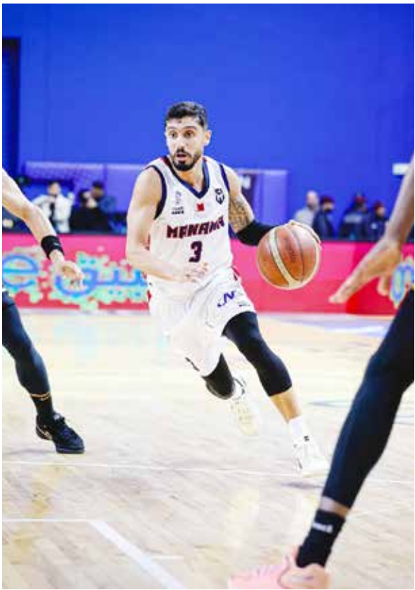
○ من مباراة المنامة والأهلي.

سماهيج رصيده إلى 10 نقاط، متساوياً مع الاتحاد المتصدر وسترة صاحب المركز الثاني، فيما أصبح رصيد البحرين 9 نقاط في المركز الرابع.