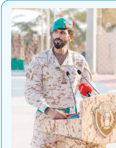
قصيدة الفريق الركن سمو الشيخ ناصر بن حمد آل خليفة