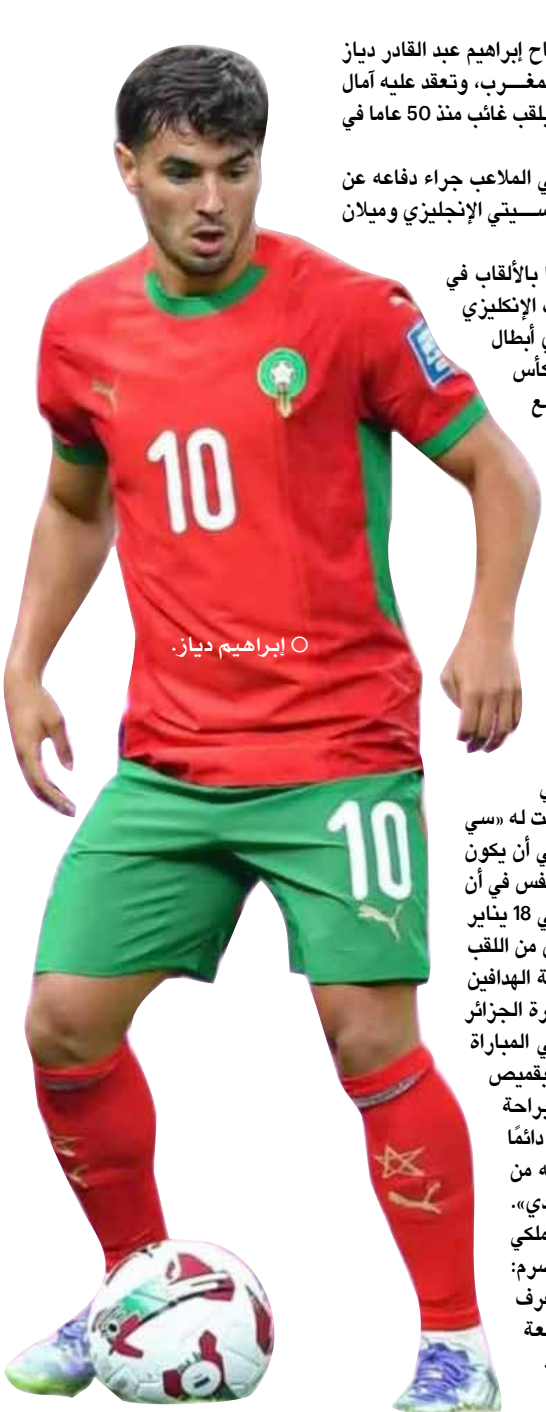
○ إبراهيم دياز.

الرباط –(أ ف ب): يعد المهاجم والجناح إبراهيم عبد القادر دياز بمثابة بيضة القبان في صفوف منتخب المغرب، وتعتقد عليه آمال كبيرة في قيادته إلى تحقيق حلم التتويج بلقب غائب منذ 50 عاما في كأس أمم إفريقيا لكرة القدم.