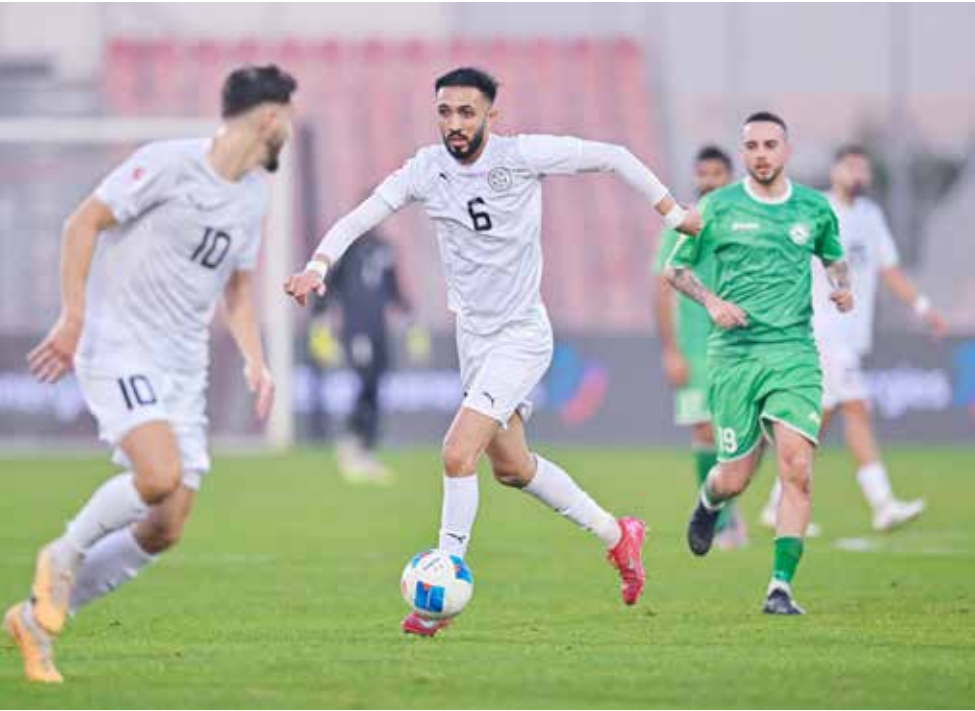
○ من لقاء النجمة والبحرين.

تفتتح اليوم الأحد منافسات الجولة التاسعة من مسابقة دوري الدرجة الأولى لكرة القدم للموسم الرياضي 2026-2025، بإقامة ثلاث مواجهات تقام في توقيت واحد عند الساعة السابعة مساءً، حيث يحتضن استاد النادي الأهلي مواجهة المنامة أمام الرفاع الشرقي، فيما يستضيف ملعب نادي الرفاع لقاء أم الحصم مع مدينة عيسى، ويلتقي بوري مع اتحاد الريف على ملعب مدينة حمد. ويتصدر فريق الاتفاق جدول ترتيب الدوري برصيد 19 نقطة، يليه المنامة في المركز الثاني برصيد 17 نقطة، متساوياً مع الرفاع الشرقي صاحب المركز الثالث، ثم الاتحاد رابعاً برصيد 15 نقطة، والحالة خامساً برصيد 14 نقطة، وأم الحصم سادساً برصيد 12 نقطة، ومدينة عيسى سابعاً برصيد 10 نقاط، وبوري ثامناً برصيد 9 نقاط، والبسيتين تاسعاً برصيد 8 نقاط، واتحاد الريف عاشراً برصيد 6 نقاط، وفي المركز الحادي عشر التضامن برصيد 4 نقاط، فيما يتذيل قلالي جدول الترتيب برصيد نقطة واحدة.