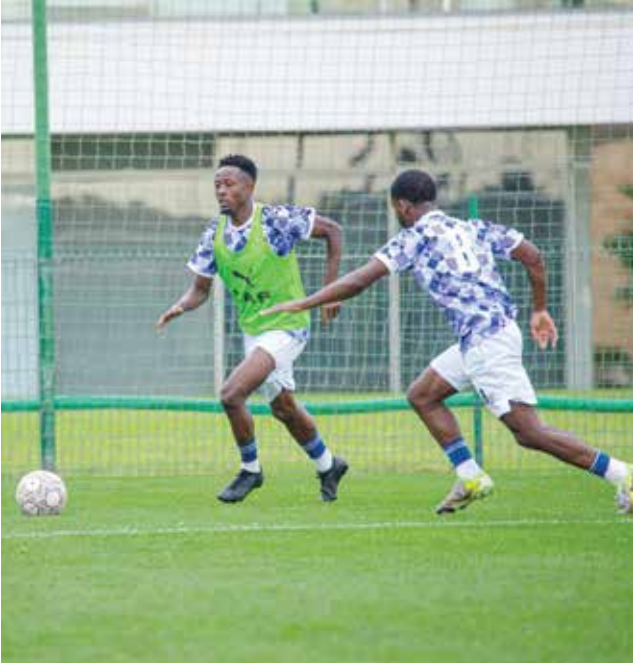
○ تحضيرات تنزانيا.

وقال غاموندي: «سعداء وفخورون بوجودنا في هذا