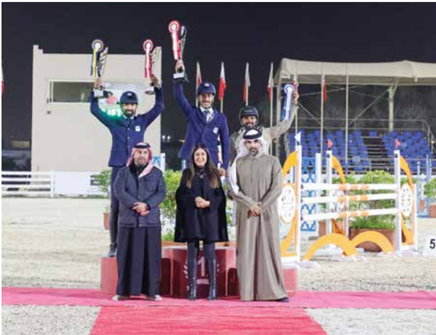
○ من تتويج أبطال مسابقات العموم.