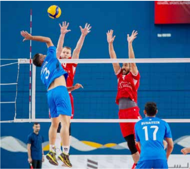
○ من مباراة المحرق والبسيتين.

كتب: علي ميرزا عزز فريق بني جمرة رصيده بثلاث نقاط جديدة ليصبح 13 نقطة بفوزه على منافسه فريق المعامير الذي ظل على نقاطه الـ3 بثلاثة أشواط مقابل شوط 22-25، 26-28، 28-26 في لقاء افتتاح الجولة الخامسة من دوري عيسى بن راشد للكرة الطائرة الذي أقيم في صالة عيسى بن راشد في