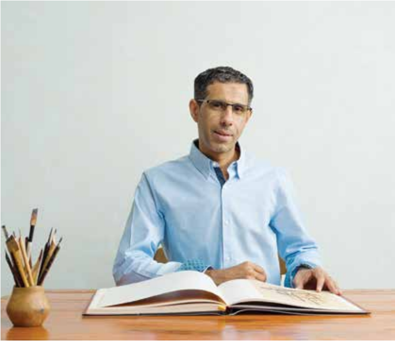
بقلم: الخطاط والمصمم ومطور الخطوط قاسم حيدر.

خطوط AXT ، والخطوط التي تعمل بنظام «Unicode» حتى جاء الوقت الذي أوقفت فيه شركة «Adobe»