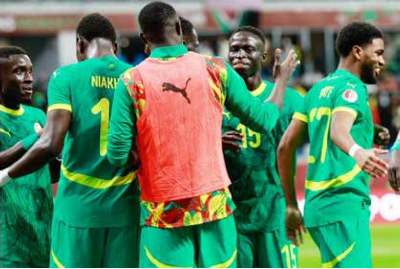
○ فرحة سنغالية بالتأهل.

في المقابل، توقف مشوار السودان، بطـل 1970، عند الدور الثاني في أول مرة يتخلى فيها دور المجموعات منذ 2012 في الغابون عندما بلغ ربع النهائي.