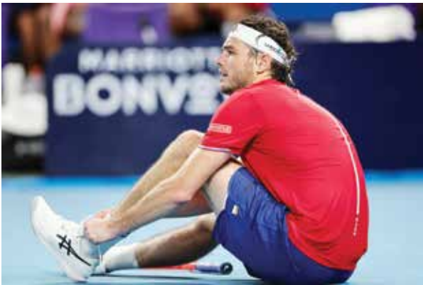
○ فريتس (أ ف ب)