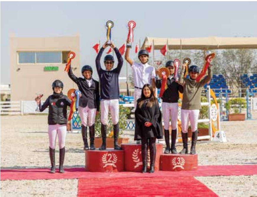
○ تتويج أبطال مسابقات الناشئين.