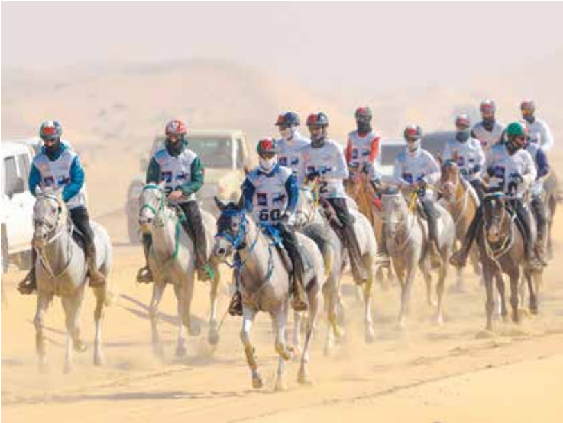
○ جانب من المنافسات.