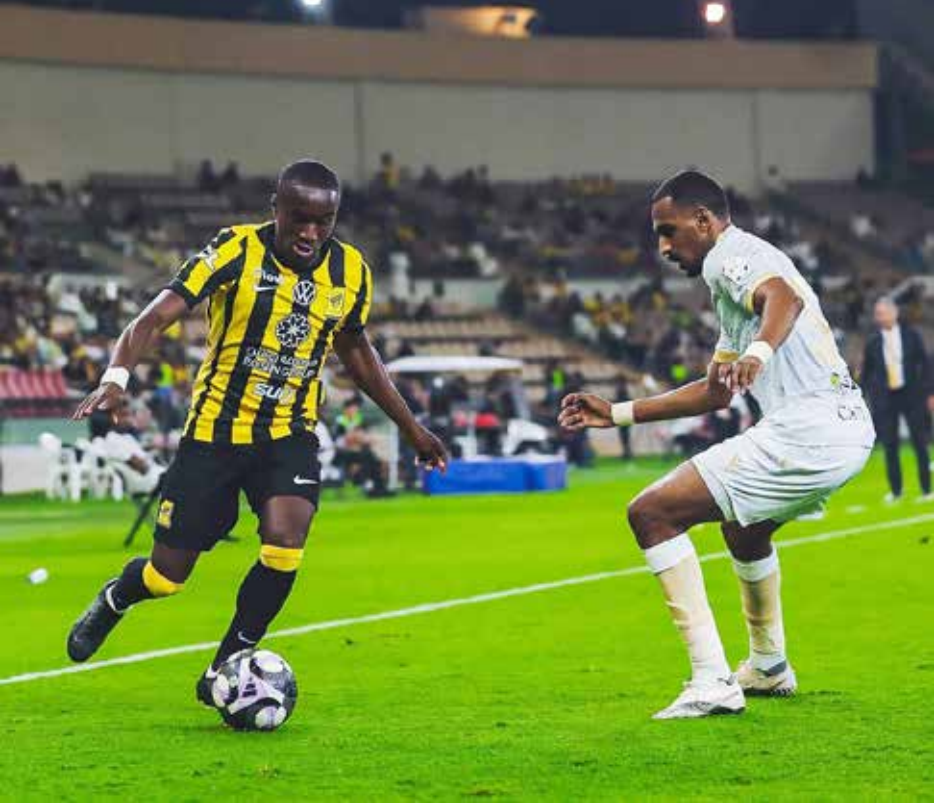
○ من لقاء الاتحاد والتعاون.

وعاد برايتون إلى سكة الانتصارات بعد سلسلة من 6 مباريات لم يذق خلالها طعم الفوز (3 تعادلات وثلاث هزائم) بإسقاطه ضيفه بيرنلي 2-0. ورفع برايتون رصيده إلى 28 نقطة في المركز الثامن، فيما تجدد رصيد بيرنلي وصيف القاع عند 12 نقطة في المركز التاسع عشر.