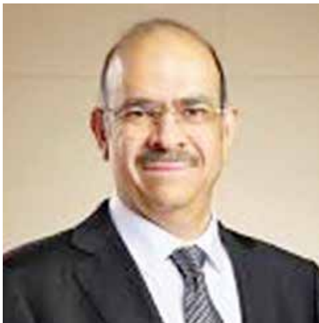
○ وزير العمل.