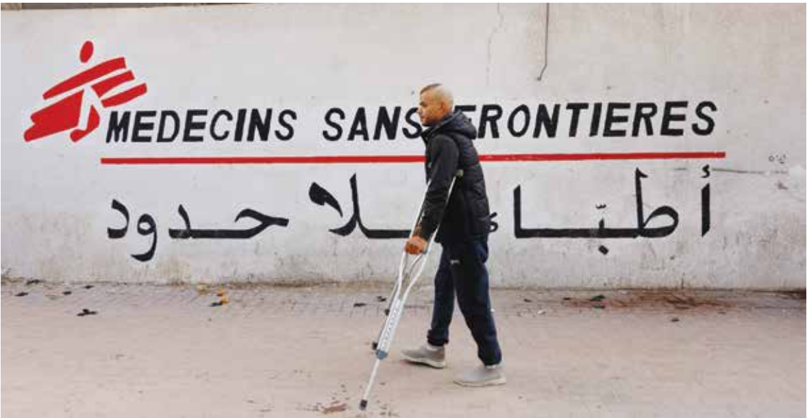
○ قرار إسرائيل بشأن منظمات الإغاثة سيفاقم الأزمة الإنسانية التي يعاني منها الفلسطينيون.

باريس – (أ ف ب): حذرت رئيسة «أطباء بلا حدود» إيزابيل دوفورني أمس من أن المنظمة قد تنهي عملياتها في قطاع غزة خلال مارس المقبل إذا لم تتراجع إسرائيل عن قرارها حظر عملياتها وأنشطة 36 منظمة أخرى.