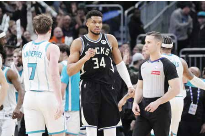
○ يانيس (رويترز)

بعد، لكننا نسير في الاتجاه الصحيح». وسجل للفائز أيضا راين رولينز 29 نقطة (11 من 13 محاولة ميدانية)، فيما كان كون كنيل وميكال بريدجز أفضل مسجلين لدى الخاسر مع 26 و25 نقطة تواليا.