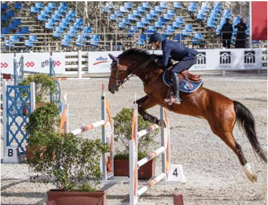
○ جانب من المنافسات.