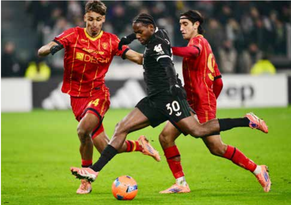
○ من لقاء يوفنتوس وليتشي

وواصل الاتحاد محاولاته الهجومية عبر رأسية الفرنسي كريم بنزيمة (19) وتسديدة البرازيلي فابيينو (31) لكن من دون النجاح في هز الشباك. وفي الشوط الثاني افتتح الشنقيطي التسجيل بعد عرضية من ديابي (50).