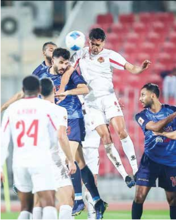
○ من لقاء سابق جمع المنامة والرفاع الشرقي.