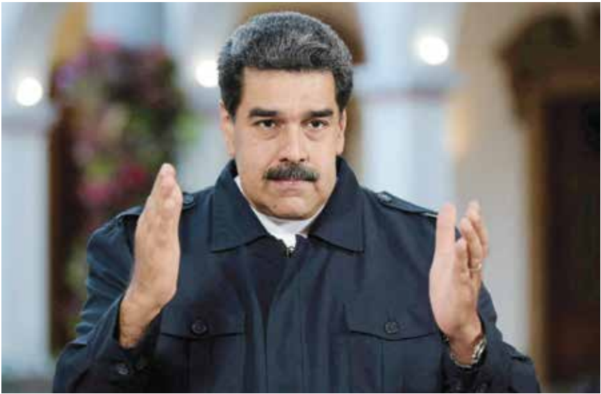
○ الرئيس الفنزويلي المختطف.

وقال في مؤتمره الصحفي: «سنقوم بإشراك شركات النفط الأمريكية الكبيرة جدا، وهي الأكبر في العالم، لإنفاق مليارات الدولارات، لإصلاح البنية التحتية المتهالفة بشدة». وتابع: «سنبيع كميات كبيرة من النفط». وقد سارع العديد من أعضاء الكونغرس للشكيك في قانونية العملية. لكن رئيس مجلس النواب مايك جونسون، الحليف الرئيسي لترامب، اعتبرها «حاسمة ومبررة».