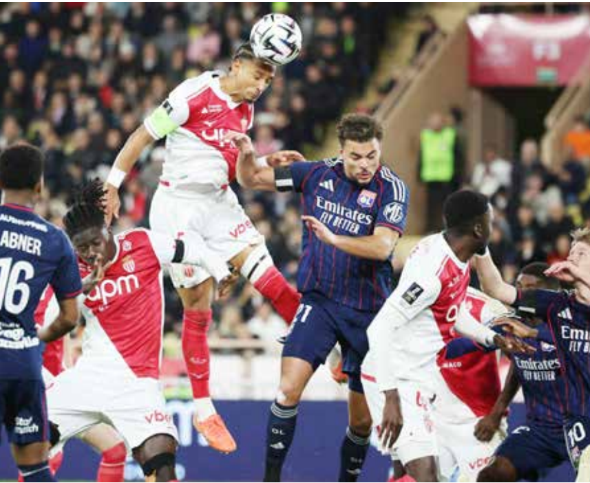
○ جانب من اللقاء.

وسجل التشيكي بافل شولتس (38 و57) والبرازيلي أبنر فينيسيوس (79) أهداف ليون، ومامادو كوليبالي (45+4) هدف موناكو قبل أن يطرد بالبطاقة الحمراء في الدقيقة 70. وشهدت المباراة ارتكاب 26 خطأ وإصابة لاعبين من فريق الإمارة. وبانتظار إمكانية إشراك مهاجمه الجديد البرازيلي إندريك القادم على سبيل الإعارة من ريال مدريد الإسباني وربما بعض الأسماء الجديدة من سوق الانتقالات الشتوي أنهى ليون الذي حقق فوزه الثاني تواليا مرحلة الذهاب بسجل إيجابي. وبحصدهم النقاط الثلاث على ملعب «لويس الثاني» في الإمارة