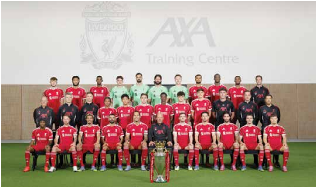
○ فريق ليفربول .