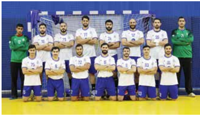
○ فريق الدير