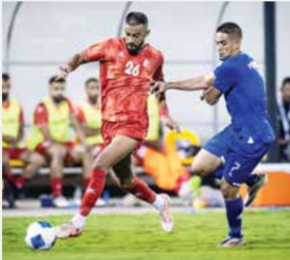
○ من لقاء الاتفاق أمام المنامة.

حقق الاتفاق فوزاً ثميناً على حساب المنامة بهدفين من دون رد، وذلك في اللقاء الذي جمعهما على استاد النادي الأهلي بالماحوز، في ختام الجولة الثالثة من دوري الدرجة الأولى لكرة القدم للموسم الرياضي ٢٠٢٥-٢٠٢٦. وبهذا الانتصار رفع الاتفاق رصيده إلى ٦ نقاط، بينما تجدد رصيد المنامة عند ٦ نقاط. وفي المواجهة الثانية التي احتضنها ملعب نادي الرفاع، تمكن أم الحصم من الفوز