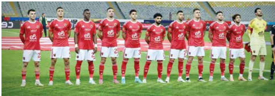
○ فريق الأهلي