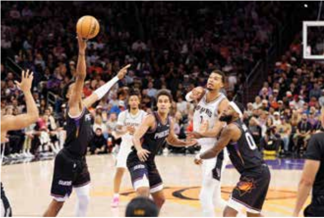
O من لقاء سبيرز وصنز.

حتى الدقيقة الأخيرة تقريبا من الشوط الأول. وأضاف اللاعب الفارع الطول (٢,٢٤ م) إلى رصيده التهديفي ٩ متابعات وتمريرتين حاسمتين