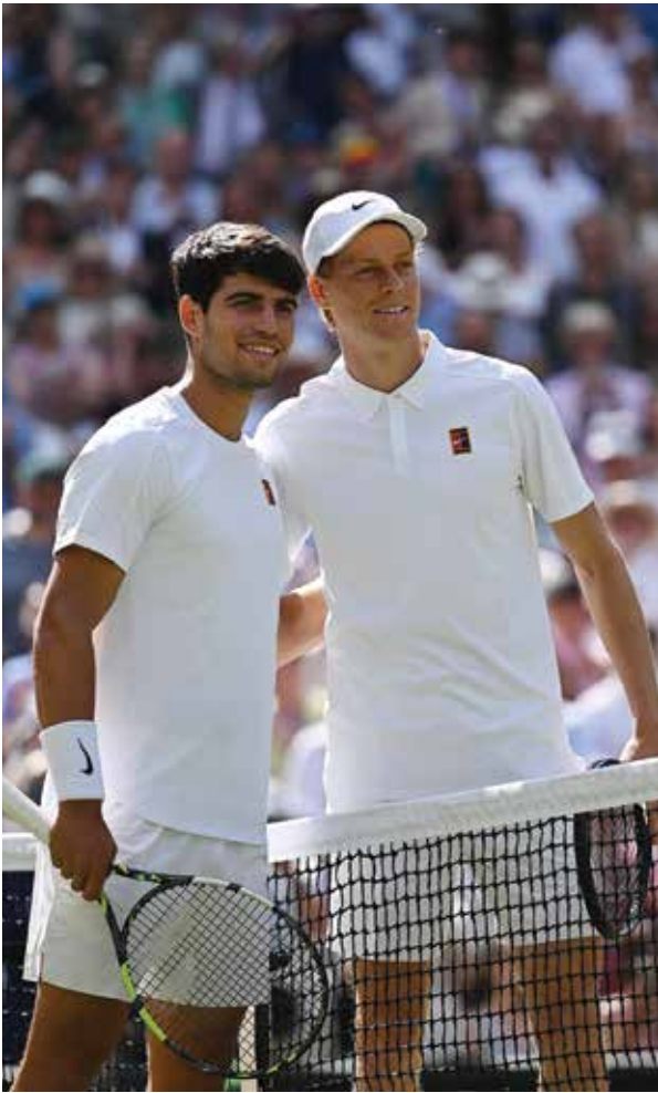
O سينر وألكاراس.

سيول – (أ ف ب): سيخوض نجما كرة المضرب الإيطالي يانيك سينر، المصنف أول عالميا، ووصيفه الإسباني كارلوس ألكاراس مباراة استعراضية في كوريا الجنوبية في يناير المقبل قبل انطلاق بطولة أستراليا المفتوحة، أولى البطولات الأربع الكبرى، وفق ما أفاد المنظمون أمس الإثنين.