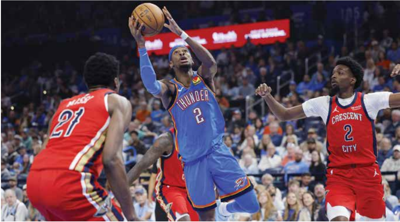
O من لقاء ثاندر وبيليكانز

وقالت شركة هيونداي الكورية لصناعة السيارات، راعية الحدث، في بيان: «بالنسبة لعشاق كرة المضرب الكوريين، ستكون هذه أول فرصة لهم لمشاهدة أفضل لاعبين في مواجهة بعضهما البعض». واستعاد سينر صدارة التصنيف العالمي من ألكاراس عقب فوزه بدورة باريس لماسترز الألف نقطة الأحد، في حين خرج الإسباني من الدور الأول.