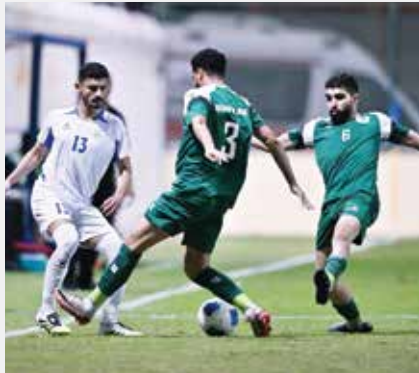
○ من لقاء أم الحصم أمام اتحاد الريف.

وبهذا الفوز حصد التضامن أول ٣ نقاط له، بينما توقف رصيد قلالي عند نقطة واحدة.