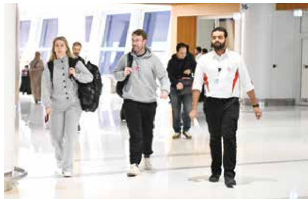
○ جانب من وصول الفرق