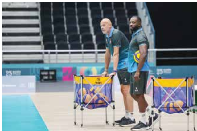
○ الجهاز الفني.