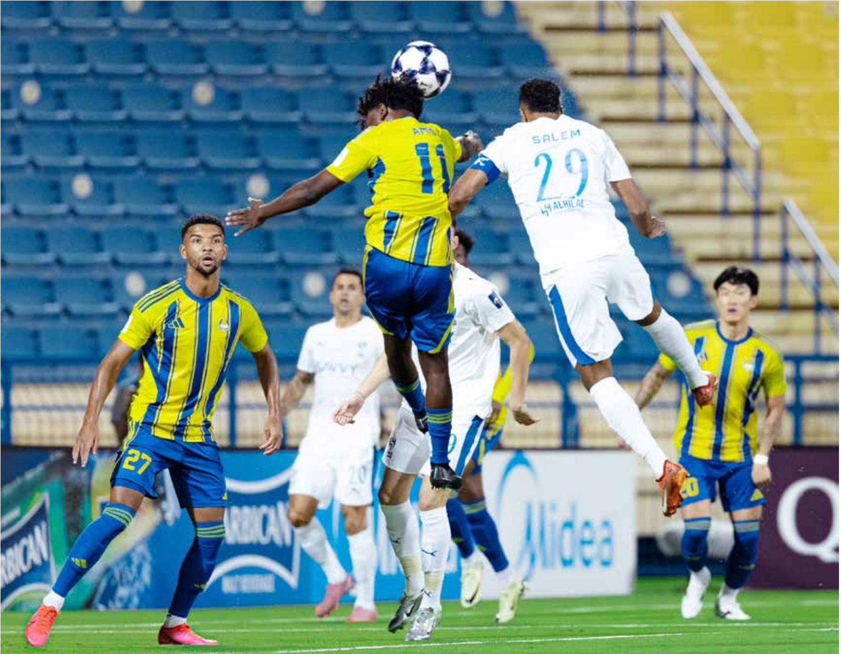
○ لحظة من مباراة الهلال والغرافة.