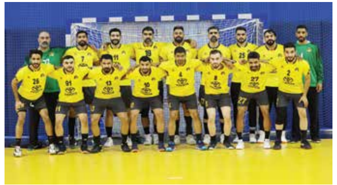
○ فريق الأهلي