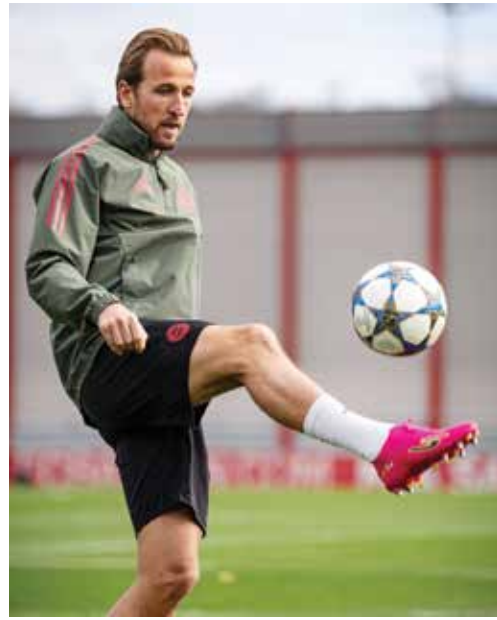
○ كاين .

كليان مبابي صاحب ١٨ هدفا هذا الموسم، فيما استعداد الإنكليزي جود بيلينغهام بريقه. في المقابل، فاز ليفربول على أستون فيلا ٢-٠، ليضع فريق المدرب الهولندي أرثه سلوت حدا لسلسلة مخيبة من ٤ هزائم متتالية في برميلينغ، فصعد إلى المركز الثالث. وتفتتح الجولة بمباراة أرسنال متصدر الدوري الإنكليزي بفارق ست نقاط عن أقرب منافسيه، مع مضيفه سلافيا براغ التشيكي، حيث سيحاول ابقاء رصيده خاليا من الهزائم والتعادلات.