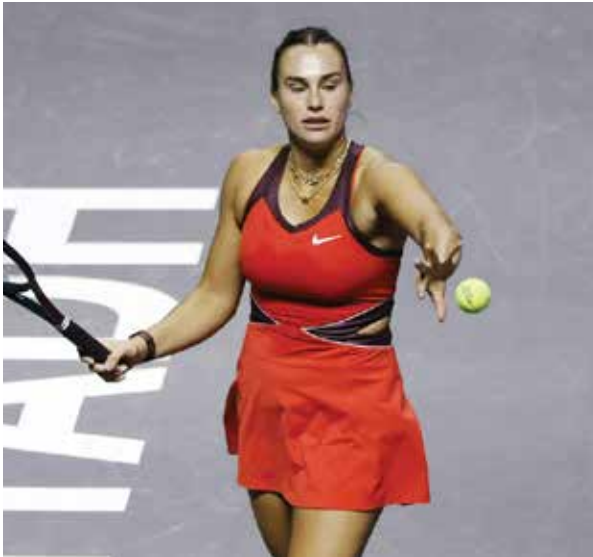
O سابالينكا

ولدى السيدات، حافظت البياروسية أرينا سابالينكا على صدارة التصنيف متقدمة على البولندية إيفا شفيونتيك والأمريكية كوكو غوف من دون أي تغيير في ضوء مشاركة الللاعبات الثماني الأوليات في دورة «بليو تي إيه» الختامية التي تُلعب حاليا في الرياض. وتقدمت الكندية فيكتوريا ميبوكو (١٩ عاما) ثلاثة مراكز في التصنيف بعد فوزها بلقب دورة هونغ كونغ، لتصبح في المرتبة الثامنة عشرة.