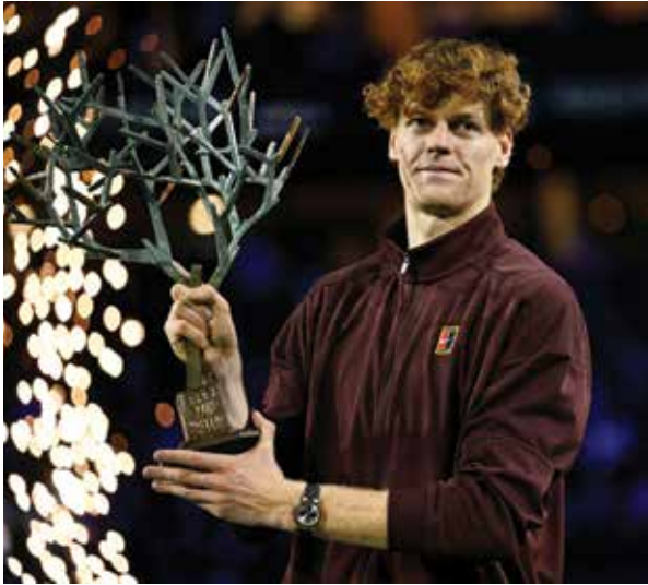
O سينر.

المنجز. وأضاف آل حسن «نولي اهتماما كبيرا بالفئات السنية، وفقا لأهداف الاتحاد المتزامنة مع استراتيجية اللجنة الأولمبية والبارالمبية السعودية، كونها