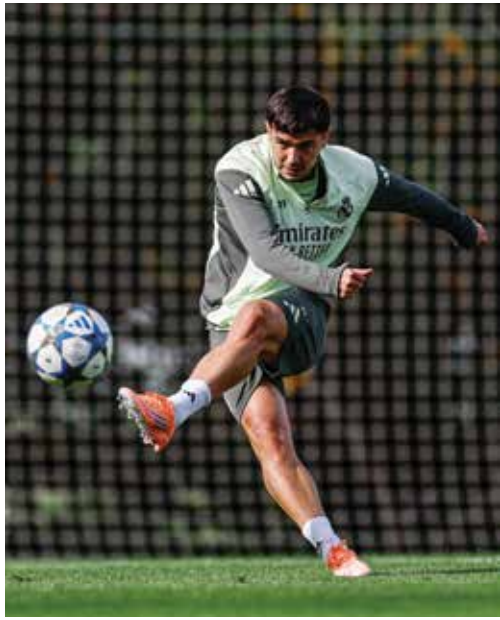
○ استعدادات ريال مدريد .