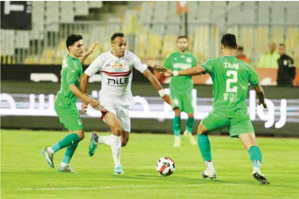
○ لقاء سابق بين الزمالك والبورسعيد.

ستنطلق مباريات دور المجموعات في ٢٣ نوفمبر الحالي وتستمر حتى ١٥ فبراير ٢٠٢٦، حيث يتأهل الأول والثاني من كل مجموعة إلى ربع النهائي الذي يقام بين ١٥ و ٢٢ مارس، فيما تقام مواجهات نصف النهائي بين ١٢ و ١٩ أبريل، أما مباراتي الدور النهائي فتقامان في ٢٦ و ١٣ مايو.