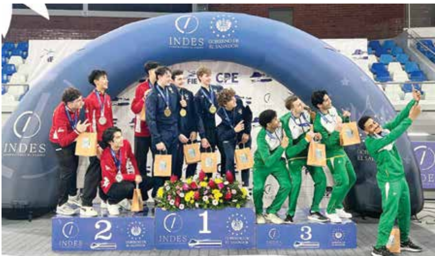
O المنتخب السعودي على منصة التتويج.

القاعدة الأساسية لصناعة جبل جديد من الأبطال القادرين على رفع راية الوطن في استحقاقات المقبلة، ومنها دورة الألعاب الآسيوية ٢٠٣٤ التي تستضيفها المملكة العربية السعودية».