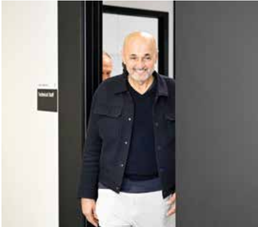
○ سباليتي .

قال مدرب منتخب إيطاليا السابق السبت «الفريق هو الأهم، وليس الفرد. إذا بنيت علاقة جيدة مع الجميع، وكانوا جميعا يشعرون بالأحاسيس ذاتها، فستتقبط يوما ما وتشعر بأنك قد ارتقيت إلى مستوى أعلى». وأضاف: «عليك أن تتحلى بالشجاعة، فتحن لسنّا في وضع لا يراقبنا فيه أحد. إما أن تلعب بالطريقة الصحيحة، أو أن تتنحى جانبا». رأى البعض أن تسلم سباليتي مهمة تدريب يوفنتوس هي فرصة نادرة من أجل تلميع صورته مجددا بعد الفضل الذي رافقه مع منتخب بلاده والذي وصفه بالـ «ندبة» بعد إقالته في يونيو. وتأمّل جماهير «بيانكونيري» أن يعيد سباليتي مجددا السحر الذي قام به خلال عامين مع نابولي، عندما أنهى فترة عجاف النادي الجنوبي التي استمرت ٣٣ عاما وقاده للفوز بلقب «سييري أ»، ما شرع أمامه باب تدريب الـ «أتزوري».