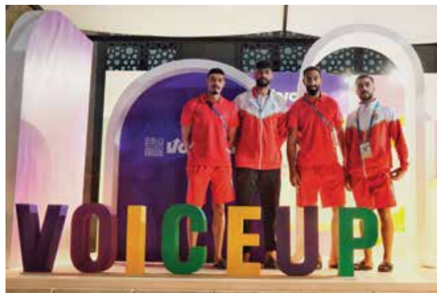
○ لاعبو المنتخب خلال جولة في القرية الرياضية.

بقية الوفود الرياضية خلال الأيام المقبلة. وفور وصوله، شارك الوفد الإداري البحريني في اجتماع تسجيل البعثات الرياضية تمهيداً لانطلاق المنافسات، وسط جاهزية تامة وروح معنوية عالية تمثل تطلعات البحرين لتحقيق نتائج مشرفة في هذا الحدث الرياضي الإسلامي الكبير. ويقام حفل افتتاح الدورة التي يشارك فيها أكثر من ٥ آلاف رياضي يمثلون ٥٧ دولة ويتنافسون في ٢٣ رياضة، في السابع من نوفمبر بمضمار الجنادرية.