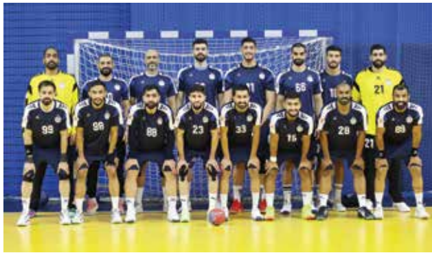
○ فريق النجمة