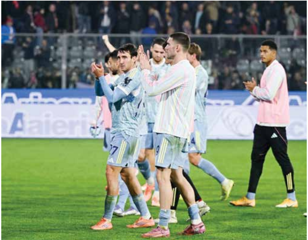
○ لاعبو يوفنتوس .

ميلانو - (أ ف ب): يستهل لوتشانو سباليتي مهامه الفنية كمدرّب جديد ليوفنتوس الإيطالي في دوري أبطال أوروبا لكرة القدم وعلى عاتقه مهمة إعادة هبة وسمعة فريق «السيدة العجوز» وإحراز باكورة انتصاراته في المسابقة القارية الأم بمواجهة ضيفه سبورتنغ البرتغالي اليوم الثلاثاء. ككل سباليتي (٦٦ عاما) بدايته مع النادي الإيطالي الجريح بفوز خارج الديار على كريمونيزي ٢-١ في المرحلة العاشرة السبت، حين بدا واضحا للمسات التي أدخلها على تشكيلة فريق تورينو بعد أقل من يومين على جلوسه على دكة البدلاء. بدا يوفنتوس أكثر تهديدا في الشوط الأول في كريمونا مما كان عليه جميع مبارياته بإشراف مدربه السابق الكرواتي إيفو تودور المقال من منصبه بسبب سوء النتائج الأسبوع الماضي، كما نجح سباليتي في سد الفجوة الدفاعية الهائلة بالزج بلاعب خط الوسط الهولندي تون كويمائيرس في خط دفاعه المكون من ثلاثة لاعبين. اعتبرت هذه الخطوات غير التقليدية في عالم الكرة المستديرة السمة المميزة لمسيرة سباليتي التدريبية الطويلة والحافلة بالأحداث، إذ كان سبق أن