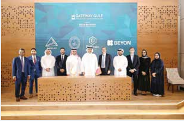
○ صورة جماعية.

ويدعو نادي راشد للفروسية وسباق الخيل جميع عشاق سباقات الخيل والألعاب إلى الانضمام إلى تجربة «فانتاسي سباق الخيل»، والاستمتاع بمستوى جديد من التفاعل مع هذه الرياضة. واللعبة متاحة الآن للتحميل عبر متجر تطبيقات Apple ومتجر Google Play لأجهزة Android.