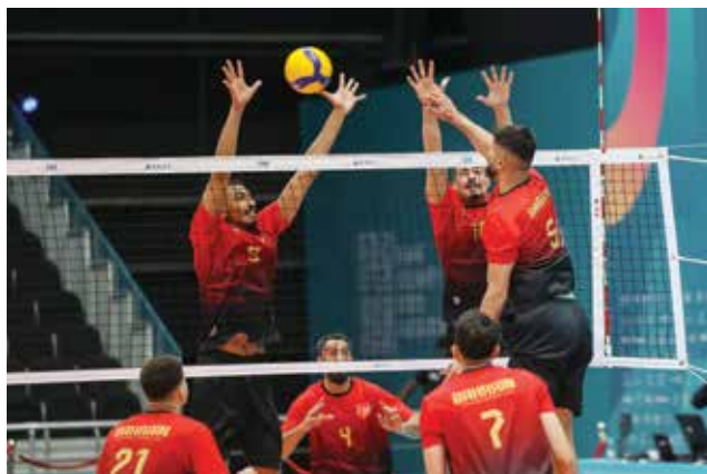
○ من تدريبات المنتخب.