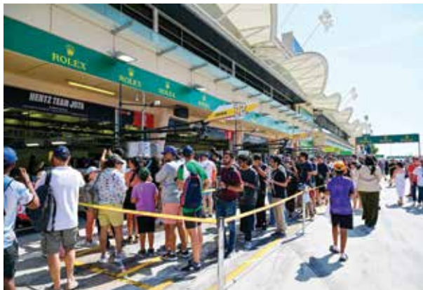
○ من فعالية توقيع سائقي البطولة