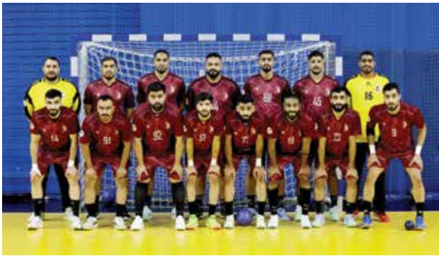
○ فريق الشباب