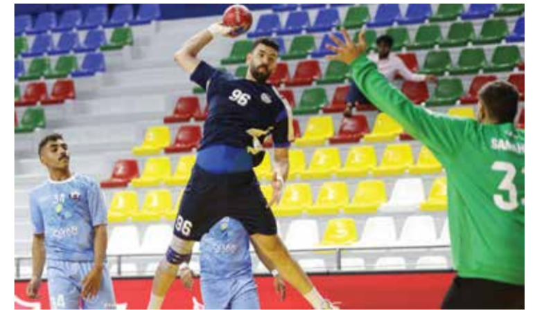
○ من لقاء النجمة وسماهيح

شهدت الجولة الخامسة من الدور التمهيدي لدوري خالد بن حمد لكرة اليد خمس مواجهات، حيث واصل النجمة عروضه المميزة بفوزه على سماهيح (٢٢-٣٨)، فيما نجح الأهلي في اكتساح الاتفاق بنتيجة (٣٢-٢١)، وقلب المدير الطاولة على الاتحاد (٣٣-٢٩)، بينما خطف توبلي فوزاً مستحقاً على التضامن (٣٢-٢٧)، أما الشباب فقد فرض تفوقه على باربار (٣١-٢٦).