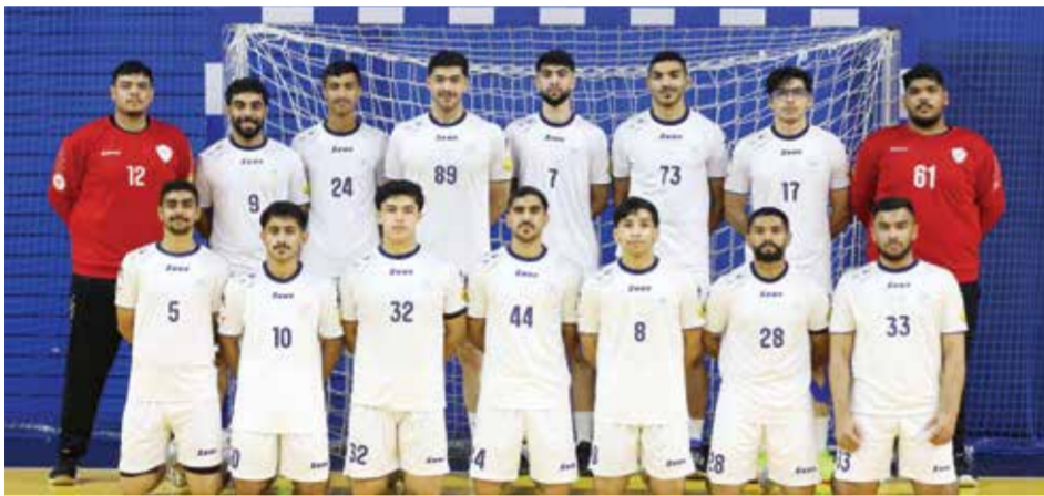
○ فريق توبلي