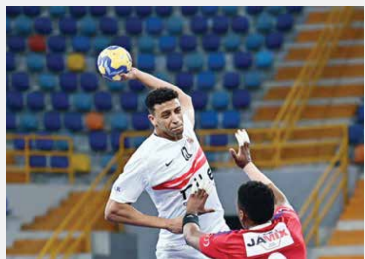
○ لحظة من المباراة.

القاهرة - (د ب أ): فاز الزمالك المصري بالمركز الخامس في بطولة كأس العالم لأندية لكرة اليد، المقامة حاليا في مصر، عقب تعادله ٢٨ / ٢٨ مع الشارقة الإماراتي، أمس الخميس. واستفاد الزمالك من فوزه ٢٩ / ٢٦ على الفريق الإماراتي في لقاء الناديين الأول، الذي جرى ضمن مواجهات تحديد المركزين الخامس والسادس في المسابقة. وكان الزمالك قد حصل على المركز الثاني في ترتيب المجموعة الثالثة بدور المجموعات في البطولة، التي ضمت برشلونة الإسباني وتاوياتي البرازيلي، فيما حل الشارقة وصيفا في المجموعة الأولى، التي شهدت وجود فريقي ماجديبرج الألماني وكاليفورنيا إيجلز الأمريكي.