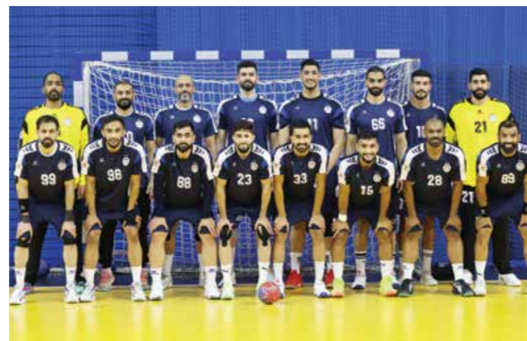
○ فريق النجمة