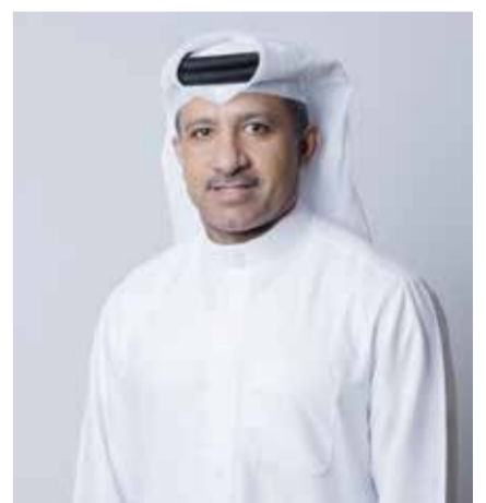
○ نايف الماجد

ولفت إلى أن تغيير مسمى دوري الدرجة الثانية سيرتّب عليه إجراء بعض التعديلات على لوائح الاتحاد وانظمته، وإلغاء ما يتعارض مع هذا الإطار، وذلك على النحو الذي يتناسب مع المسميات الجديدة. وأشار الماجد إلى أن هذا القرار سيُنفذ اعتباراً من الموسم الكروي الحالي ٢٠٢٥-٢٠٢٦، إذ من المقرر أن ينطلق دوري الدرجة الأولى يوم ١٥ أكتوبر ٢٠٢٥.