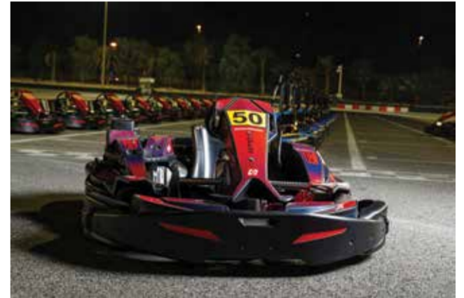
○ السيارة الجديدة