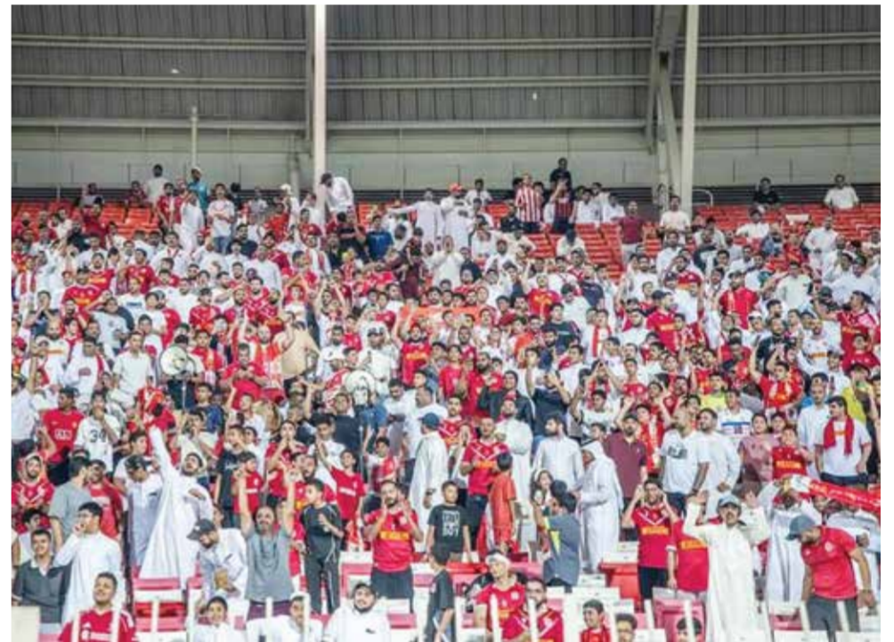
○ جمهور المحرق

◀ الرفاع يبحث عن الثبات وإنهاء معاناته في استثمار الفرص