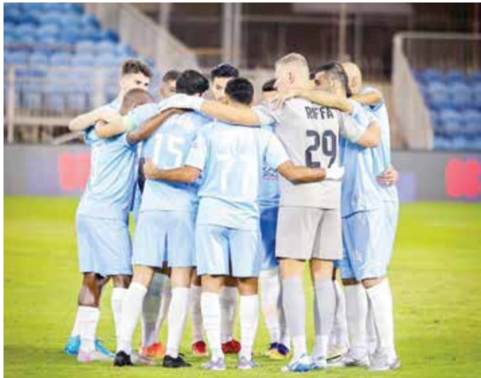
○ فريق الرفاع

◀ المالكية فرض التعادل على المحرق بقراءة ذكية وأداء بطولي