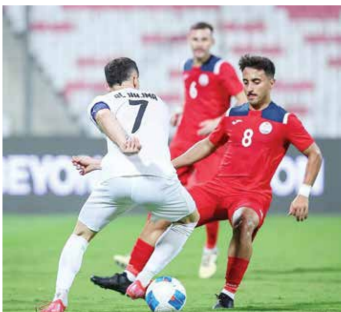
○ لقطة من مواجهة سترة والنجمة