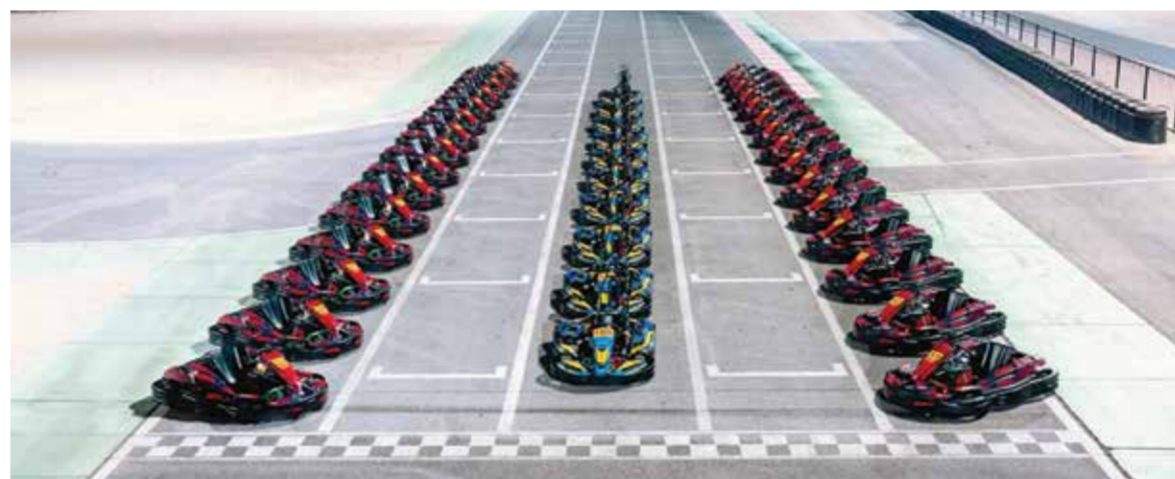
○ الأسطول الجديد

تفتتح حلبة البحرين الدولية للكارتنج أبوابها يومياً من الساعة ١٠ صباحاً حتى ١١:٣٠ مساءً من الثلاثاء إلى السبت، ومن الساعة ٤ مساءً حتى ١١:٣٠ يومياً الأحد والإثنين. يُنصح المشاركون بحجز حصصهم مسبقاً عبر الموقع الإلكتروني bahraingp.com أو الاتصال بحلبة البحرين الدولية للكارتنج على الرقم ٩٧٣-١٧٤٥١٧٤٥+.