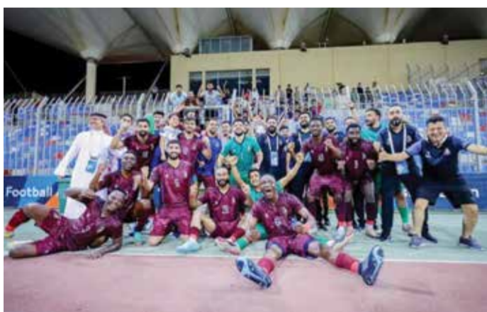
○ فرحة الشباب بتحقيق الفوز