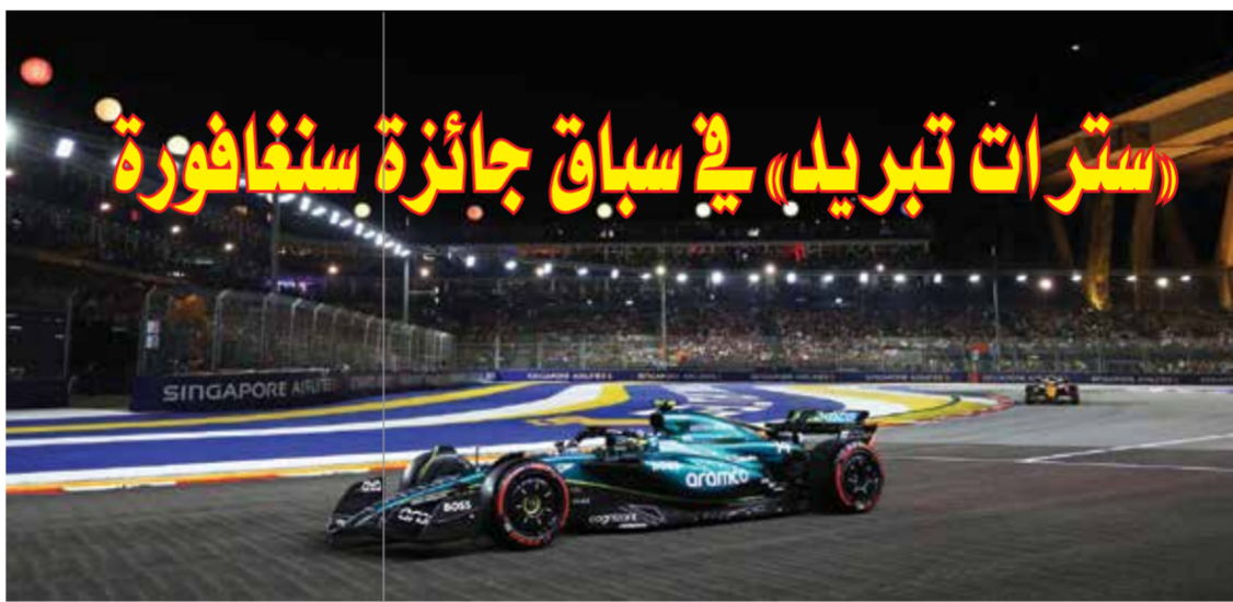
○ من سباقات فورمولا ١

وتحدث نوريس عن فيرستابن قائلا: «إنه منافس حقيقي. إذا