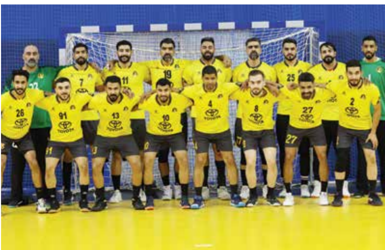
○ فريق الأهلي