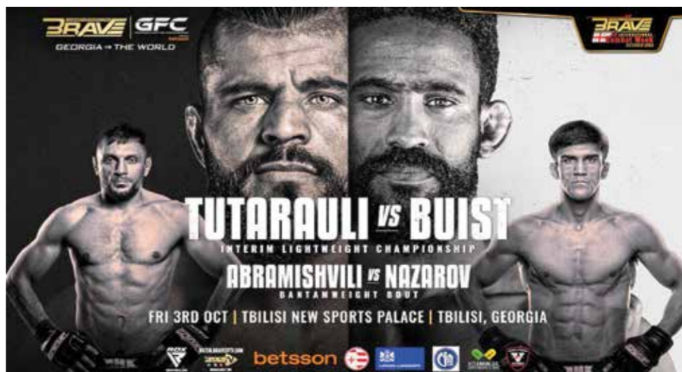
○ إعلان البطولة

واليوم، ستحول تيليسي إلى عاصمة فنون القتال المختلطة، حيث تلتنق جورجيا مع العالم في أمسية استثنائية.