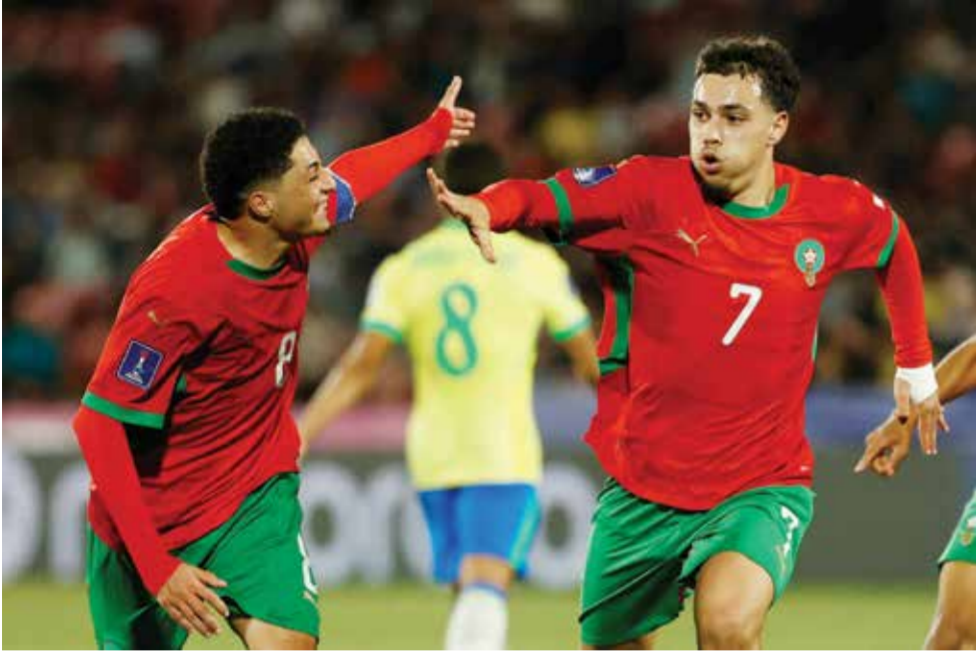
○ احتفالية لاعبي المغرب

الإنجازات سوية.. في المقابل، قال مدرب البرازيل رامون مينيزيس الذي أشرف على المنتخب البرازيلي الأول موقتا عام ٢٠٢٣ «إنها نتيجة مؤلمة كثيرا. حصلنا على فرص لإنهاء المباراة، لكن مباراة كرة القدم تستمر ٩٠، ٩٥، ١٠٠ دقيقة. كنا نعرف صعوبات هذه المباراة. أعتقد أننا كنا أفضل، لكن لم نسجل».