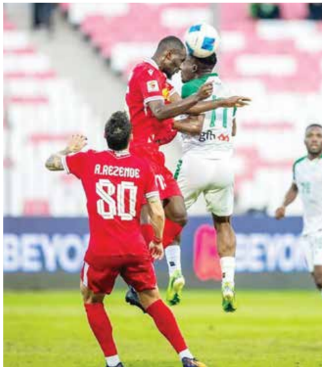
○ من لقاء المحرق والمالكية