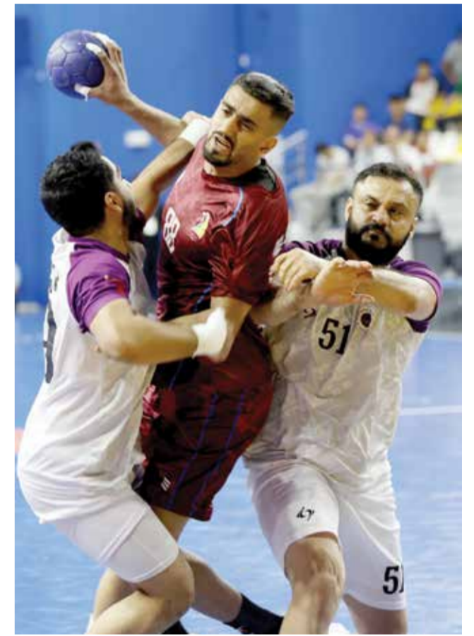
○ من لقاء الشباب وباربار