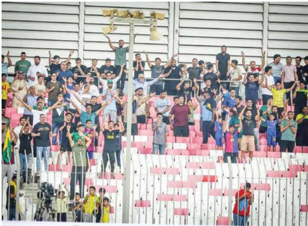
○ جماهير المالكية