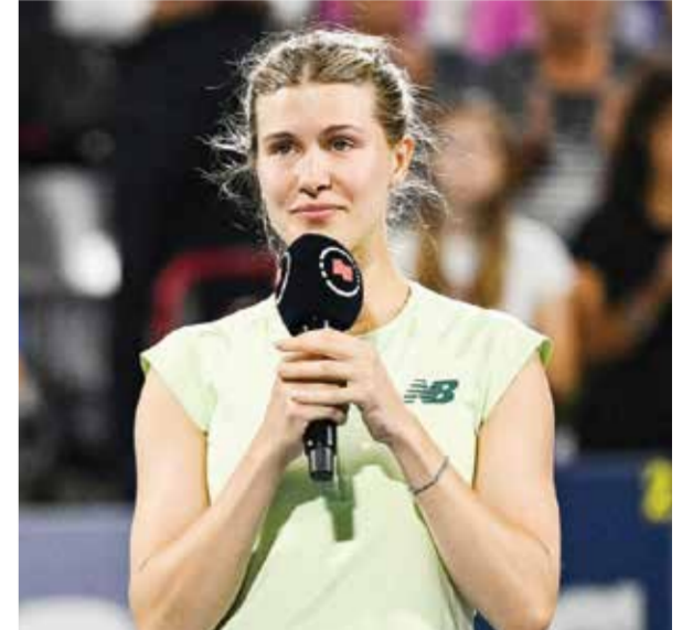
○ بوشار (رويترز)

مونتريال - (أ ف ب): تأهلت البولندية ايغا شفيونتيك المصنفة ثالثة عالميا الى الدور الثالث من دورة مونتريال الالف نقطة لكرة المضرب بتغلبها على الصينية غو هانيو ٣-٦ و ١-٦ في الدور الثاني، وخاضت شفيونتيك مباراتها الأولى منذ تنويعها بلقب بطولة ويمبلدون الانجليزية، ثالثة البطولات الأربع الكبرى، للمرة الأولى في مسيرتها. ولم تنتظر البولندية التي أعضيت من خوض الدور الاول على غرار المصنفات ال٣٢ الأولى، طويلا لفرض هيمنتها كاسرة إرسال منافستها مرتين في الشوطين الثاني والرابع وتقدمت ٤-٤ في المجموعة الأولى، ورغم أن اللاعبة الصينية ردت بكسر إرسالها في الشوط الخامس، لكن شفيونتيك