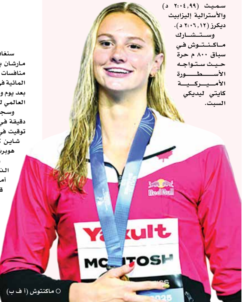
O ماكنوتش

وكان مارشان أخذ استراحة طويلة من السباحة بعد تألقه في أولمبياد باريس وعاد إلى المنافسات في مايو. يركز حاليا في