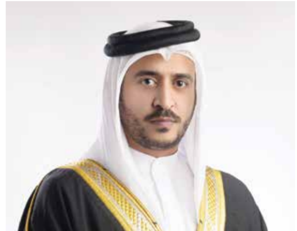
○ سمو الشيخ خالد بن حمد آل خليفة.

أصدر سمو الشيخ خالد بن حمد آل خليفة النائب الأول لرئيس المجلس الأعلى للشباب والرياضة رئيس الهيئة العامة للرياضة رئيس اللجنة الأولمبية البحرينية، القرار رقم (٢٧) لسنة ٢٠٢٥ بشأن تعيين مجلس إدارة مؤقت لنادي النجمة الرياضي.