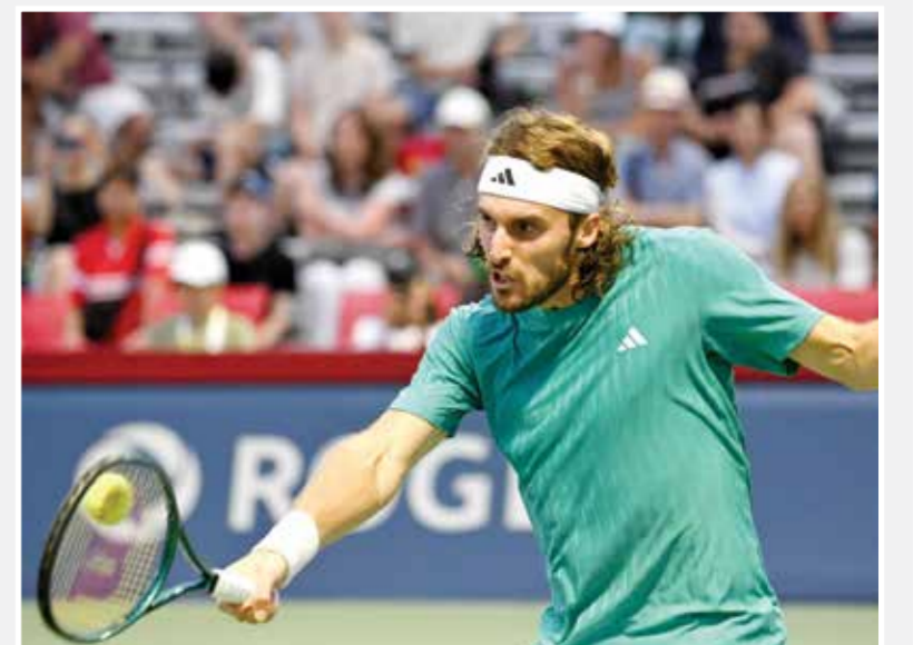
○ تيتيباس.

أشاهد قط لاعبا غير جاهز أكثر منه في حياتي». وكان فوز اليوناني باللقب في دبي في فبراير الماضي هو النهائي الوحيد الذي وصل إليه في عام ٢٠٢٥. وكتب تيتيباس الذي خسّر أمام كريستوفر أوكونيل في الدور الثاني من بطولة كندا المفتوحة للتنس أمس الأربعاء، على وسائل التواصل الاجتماعي «بعض الرحلات لها طريقة للعودة إلى حيث بدأت». وأضاف «بعد فترة من الفراغ، اجتمعت من جديد مع الشخص الذي آمن بي في البداية، والدي». وتابع «أنا ممتن لمشاركة الملعب والطريق معه مرة أخرى. لقد مررتنا بكل فصل من هذه الرحلة معا، وهذا الفصل التالي يبدو صحيحا». وأكمل «في بعض الأحيان، العودة من حيث بدأت هي أجرا خطوة إلى الأمام».