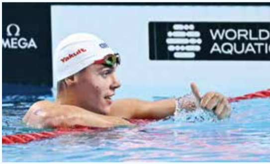
O بوبوفيتشي.