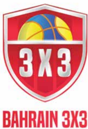
○ شعار لعبة ٣x٣.