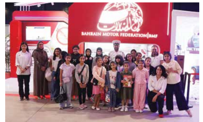
○ جانب من المشاركين في الأسبوع الثالث

وكان اتحاد السيارات البحريني وفي أولى مشاركاته في مدينة شباب ٢٠٣٠ قد قدم تجربة فريدة في الأسبوع الثاني من خلال جهاز محاكاة قيادة سيارات الفورمولا واحد وجهاز اختبار رد الفعل والاستجابة، حيث حظي المشاركون والحضور والزوار بتجربة فريدة ومميزة تحاكي أجواء سباقات الفورمولا واحد بدقة عالية، وعاش المشاركون والزوار لحظات التحدي والمنافسة كما لو أنه