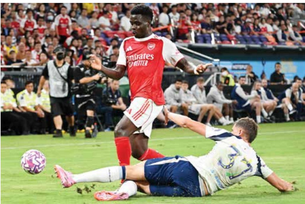
○ جانب من اللقاء.

ويبدأ أرسنال المباراة طامحا للتسجيل، لكن توتنهام