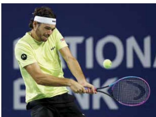
○ فريتس (أ ف ب)