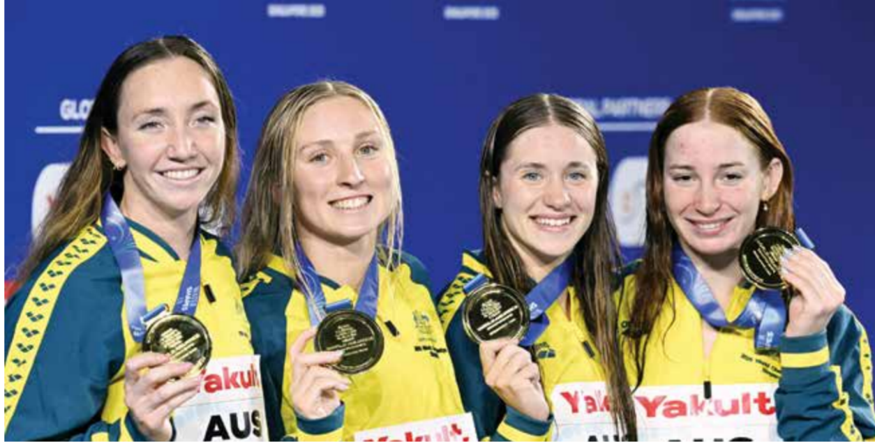
O الفريق الأسترالي.

لم تأخذ الأميركية جريتشن والش، التي كانت مرشحة للفوز بميدالية والتي حصلت بالفعل على ذهبية سباق ١٠٠ متر فراشة في اليوم الثاني من المنافسات، مكانها على منصة الإطلاق، وهي واحدة من عدة سباحين لم يشاركوا في منافسات اليوم الخامس.