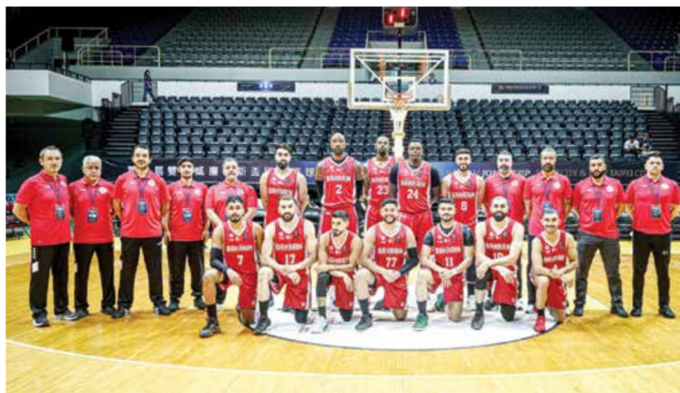
○ منتخبنا الأول لكرة السلة.