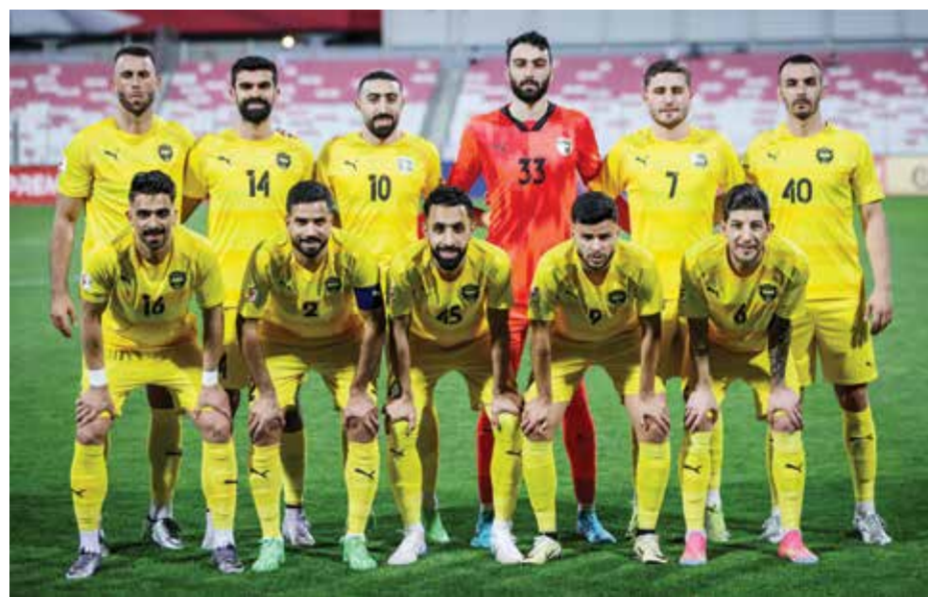
○ فريق الخالدية.

ويأتي هذا المعسكر ضمن خطط الإدارة الفنية بالنادي لتجهيز الفريق بأفضل صورة ممكنة، في ظل الطموحات الكبيرة التي يحملها الخالدية هذا الموسم للمنافسة على الألقاب المحلية والمشاركة القوية في بطولة دوري أبطال آسيا ٢٠٢٦.