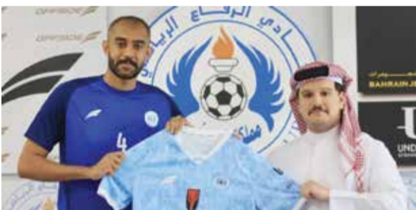
○ جانب من توقيع العقد.

ودعا المجلس الأولمبي الآسيوي إلى إجراء انتخابات لمنصب الرئيس بسبب استمرار اعتلال صحة الرئيس الحالي، الهندي راجا رانديسر سينغ، وقد حدد موعداً للجمعية العمومية لهذه الانتخابات في ٢٦ يناير ٢٠٢٦ في العاصمة الأوزبكستانية طشقند.