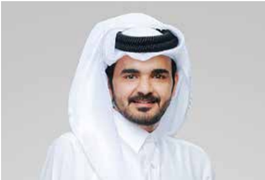
○ الشيخ جوعان بن حمد آل ثاني.