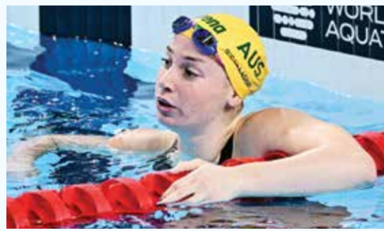
O أوكالاها.

وأضاف «إذا تمكنت من تخيل وجود جدران علي جانبي الممر الذي أصبح فيه، فقد أتصور أنني وحدي وأنفذ ما تدربت عليه».