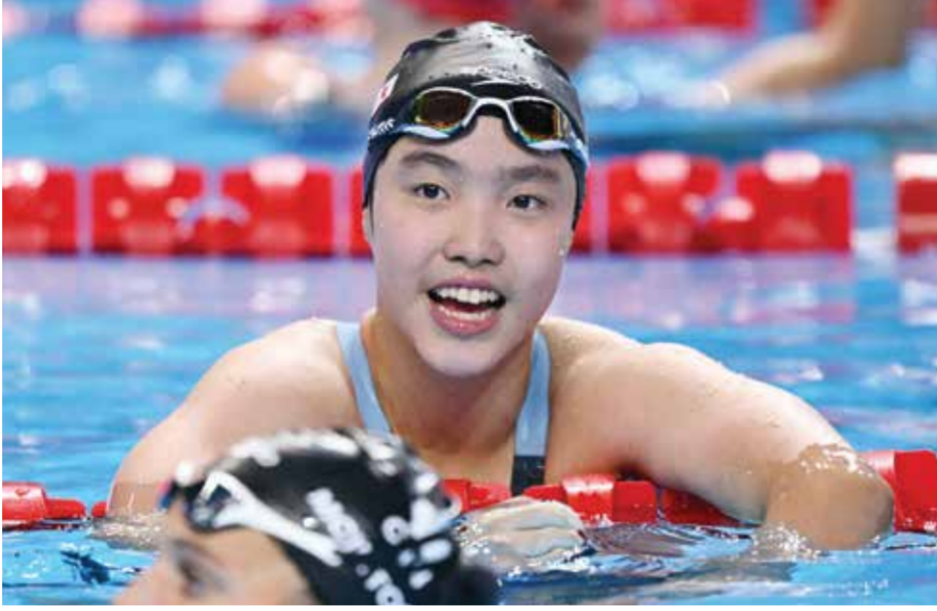
O يو (أ ف ب)

بعمر الثانية عشرة، كانت الدنماركية أصغر متوجة بميدالية في السباحة الأولمبية، عندما نالت برونزية في نسخة برلين ١٩٣٦. هذا الأسبوع، كلا، ليس حقا. كل هذا نتيجة التمارين المضنية..