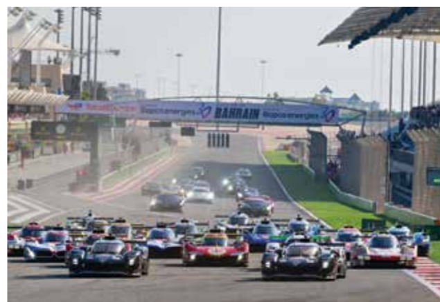
○ من سباق بابكو إنرجيز للتحمل.

الدولي للسيارات، وتعتبر من أبرز البطولات العالمية الرائدة لسباقات التحمل، حيث تمثل أشهر العلامات التجارية في عالم السيارات ضمن فئتي البطولة - فئة السيارات الخارقة من الدرجة الأولى وفئة LMGTY من الدرجة الأدنى وأبرزهم ماكلارين، ألباين، أستون مارتن، بي إم دبليو، كاديلاك، كورفيت، فيراري، فورد، كرنس، مرسيدس، بيجو، بورش وتويوتا.