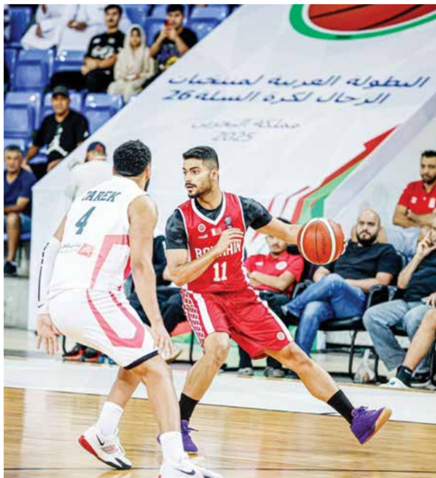
○ لقطة من لقاء منتخبنا أمام مصر.

ويسبق لقاء منتخبنا عند الساعة الرابعة مواجهة تجمع بين المنتخبين المصري والإماراتي، وتليها عند الساعة السادسة مساء مواجهة تجمع بين المنتخبين الكويتي والقطري.