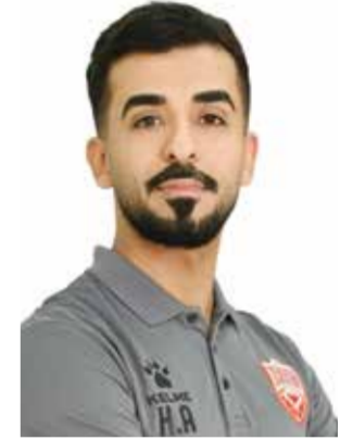
○ حسين الشويخ.

اعتمد الاتحاد الآسيوي لكرة القدم، الحكم البحريني الدولي حسين الشويخ، ضمن قائمة النخبة للحكام الآسيويين للعام (٢٠٢٥) بعد اجتيازه المتطلبات الخاصة ببرنامج أكاديمية الحكام بالاتحاد القاري. ويعتبر حسين الشويخ من الحكام الدوليين الواعدين الشباب الذين برزوا خلال الفترة الأخيرة، وهو حاصل على الشارة الدولية في العام (٢٠٢٤)، ونال ثقة الاتحاد الآسيوي