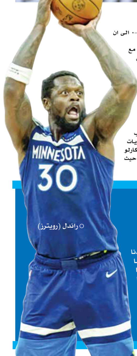
O راندل