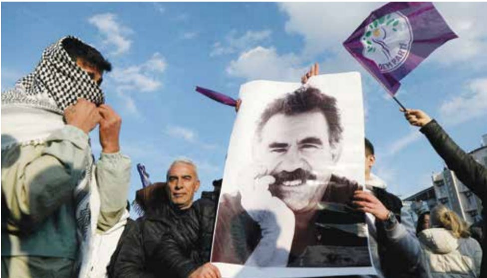
○ تجمع لمناصري أوجلان في ديار بكر.