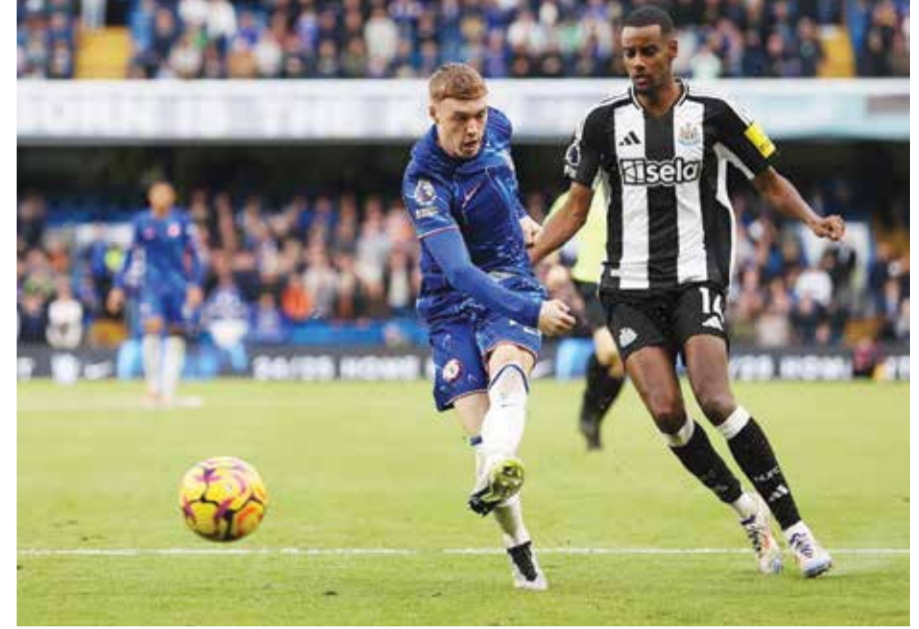
○ لقاء سابق بين نيوكاسل وتشلسي.