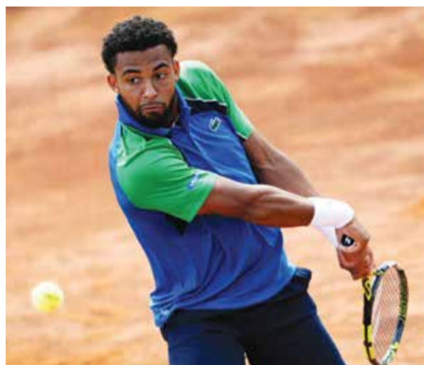
O فيلس