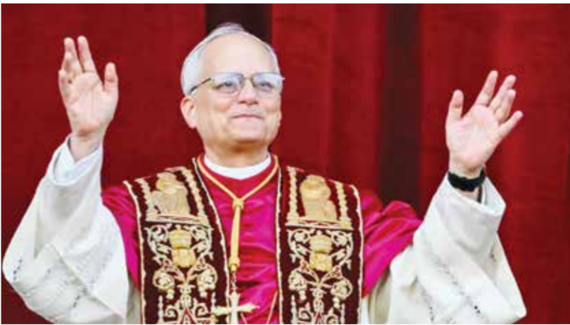
○ ليو الرابع عشر يعل من شرفة كاتدرائية القديس بطرس بعد انتخابه على رأس الكنيسة الكاثوليكية.

ولا يتوانى بعض الصحفيين كذلك من المقارنة بين أتيلادونالد ترامب في حين يرون أن البابا لاوون الرابع عشر سيكون الشخص الذي سيتمكن من ضبط الرئيس الأمريكي الذي لا يمكن توقع تصرفاته، إلا أن غالبية المرشحين يرون أنه اختار هذا