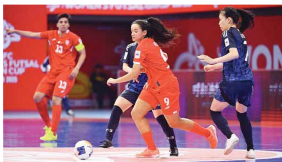
○ جانب من اللقاء.

تلقى المنتخب الوطني للسيدات لكرة الصالات خسارته الثانية في بطولة كأس آسيا، بعد أن خسر أمام نظيره الياباني بنتيجة (٣-٢)، في المواجهة التي