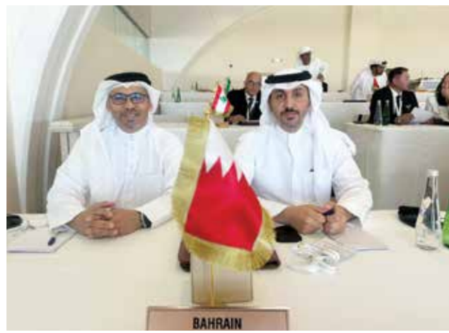
○ البحرين تشارك في عمومية الاتحاد الآسيوي لسباقات الهجن.

الحفاظ على الرياضات التراثية وتعزيز حضورها في الفعاليات الرياضية الكبرى، مشيداً بجهود اللجنة البحرينية لرياضات الموروث الشعبي في تنظيم البطولات المحلية والإقليمية بكفاءة عالية. ومن المتوقع أن تشهد رياضة الهجن في القارة الآسيوية نقلة نوعية خلال الفترة المقبلة، في ظل التعاون المشترك بين الدول الأعضاء، والتوجه العام لتوسيع رقعة المشاركات وزيادة عدد البطولات، ما يعزز من شعبية هذه الرياضة المتجددة في ثقافات شعوب المنطقة.