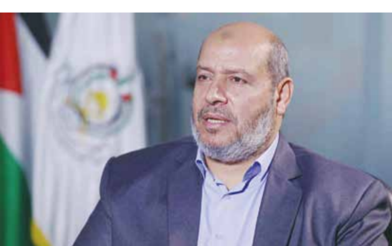
القيادي في حماس خليل الحية.

طهران - (أ ف ب): يتوجه وزير خارجية إيران عباس عراقجي اليوم السبت إلى المملكة العربية السعودية وقطر قبيل جولة الرئيس الأمريكي دونالد ترامب في المقررة هذا الأسبوع في المنطقة، على ما أعلنت الخارجية الإيرانية أمس. وجاء في بيان نشر على موقع وزارة الخارجية الإلكتروني أن عراقجي سيتوجه أولا إلى الرياض للقاء مسؤولين سعوديين كبار وإجراء مباحثات معهم، ثم إلى الدوحة «للمشاركة في مؤتمر الحوار العربي-الإيراني». ومن المقرر أن يقوم ترامب بجولة تشمل السعودية وقطر والامارات العربية المتحدة بين ١٣ مايو و١٦ منه. ويعمرزل عن زيارته