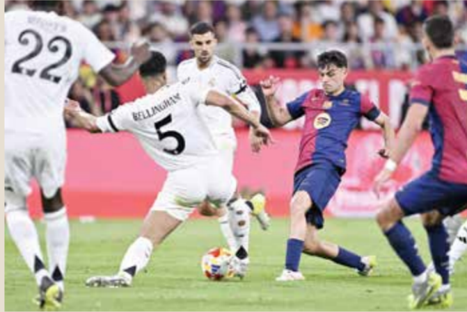
○ لقاء سابق بين برشلونة وريال مدريد

وستكون استعادة لقب الدوري من مدريد بداية جيدة. قال فليك، واثقا من أن فريقه الشاب الذي يضم جمال والمدافع باو كوبراسي (١٨ عاما) وللاعب الوسط بيدري (٢٢ عاما)، بدأ للتو في إظهار قدراته.