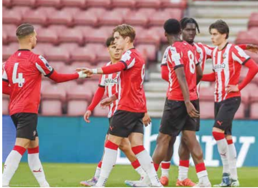
○ ساوثمبتون يبحث عن خروج مشرف.