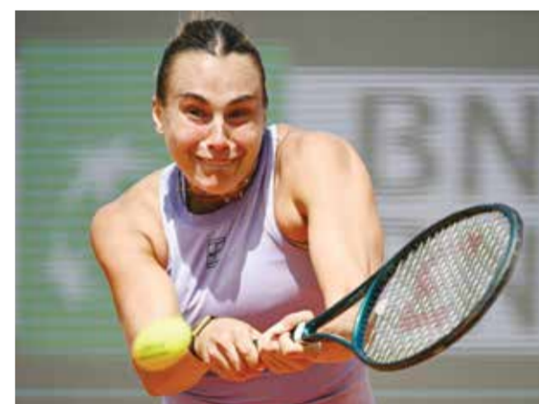
O سابالينكا