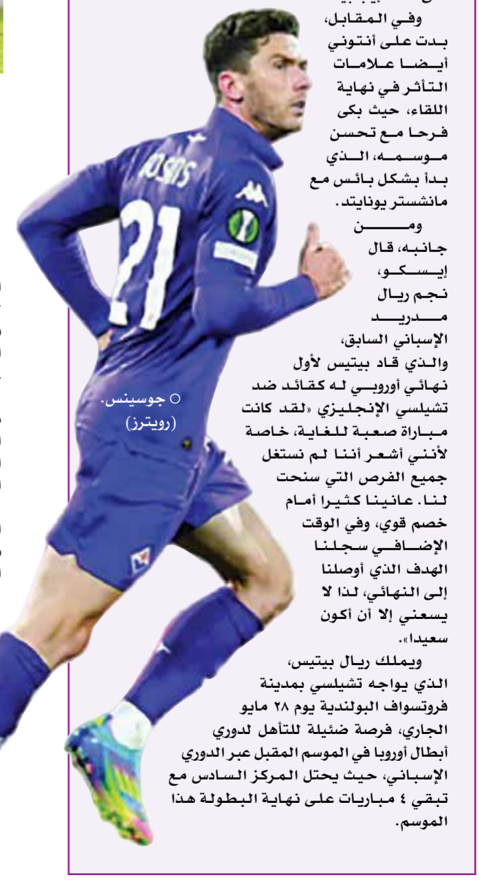
○ جوسينس (رويتزر)

ويملك ريال بيتيس، الذي يواجه تشيلسي بمدينة فروتسوفا البولندية يوم ٢٨ مايو الجاري، فرصة ضئيلة للتأهل لدوري أبطال أوروبا في الموسم المقبل عبر الدوري الإسباني، حيث يحتل المركز السادس مع باقي ٤ مباريات على نهاية البطولة هذا الموسم.