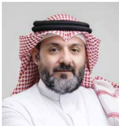
○ عيسى تقي

أكد لاعب منتخب السعودية سلطان المصري أن بطولة «خالد بن حمد» الثالثة للبولينج تكتسب أهمية خاصة كونها تواصل ترسيخ مكانتها كواحدة من أبرز البطولات