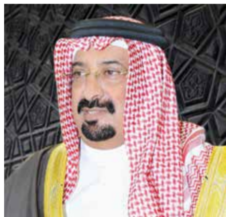
○ الشيخ أحمد بن علي بن عبدالله آل خليفة.

نادي المحرق للمشاركة في هذا الحدث القاري الهام وفي النسخة الأولى للبطولة، ممثلاً لكرة الطائرة البحرينية.