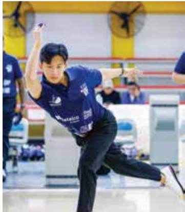
○ من مناسبات البطولة