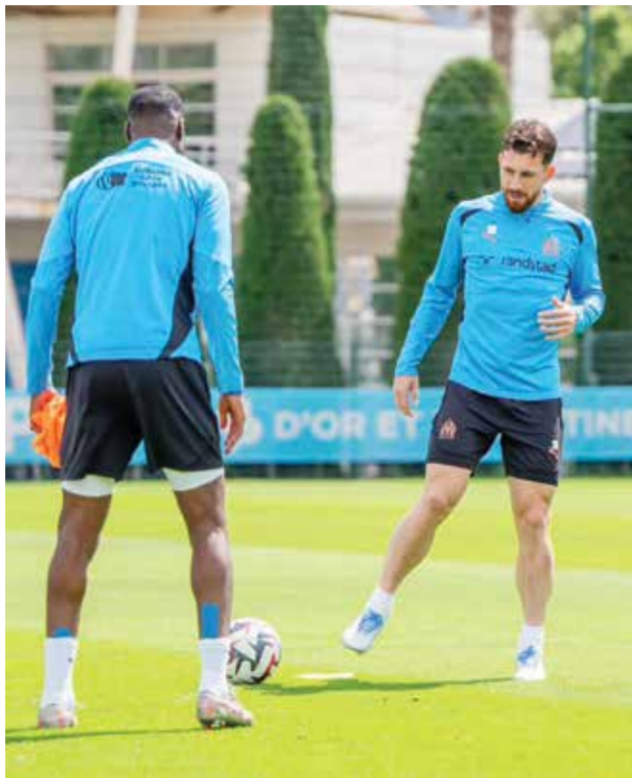
○ استعدادات مرسييا