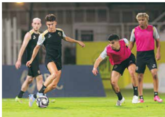
○ تدريبات الاتحاد.