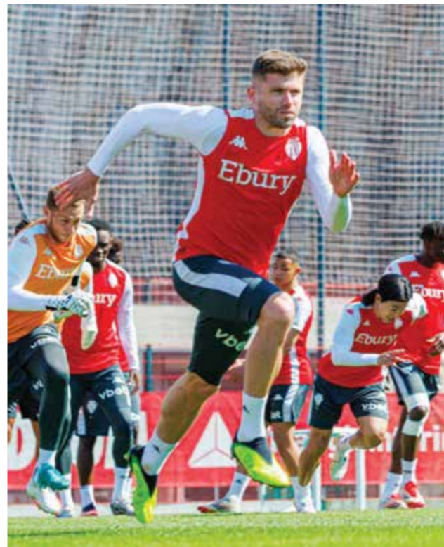
○ تحضيرات موناكو