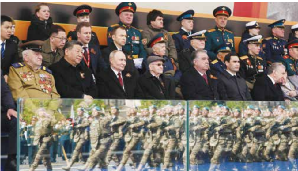
○ الرئيس الروسي وزعماء أجناب يتابعون الاستعراض العسكري بمناسبة عيد النصر في موسكو.

موسكو - (أ ف ب): أشاد الرئيس فلاديمير بوتين أمس الجمعة ببسالة الجنود الروس الذين يحاربون في أوكرانيا، أمام عشرات آلاف الأشخاص المحتشدين في الساحة الحمراء ونحو ٢٠ زعيما أجنيا حضروا إلى موسكو للمشاركة في احتفالات الذكرى الثمانين للانتصار على ألمانيا النازية.