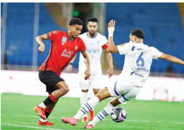
○ من لقاء الهلال والرائد.

ويحتل هايدنهايم المركز الثالث من القاع، الذي يخوض صاحبه ملحق الصعود والهبوط، وذلك قبل مواجهة يونيون برلين اليوم السبت.