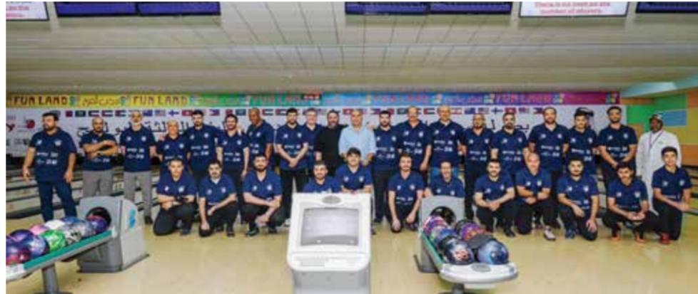
○ صورة جماعية لعدد من المشاركين