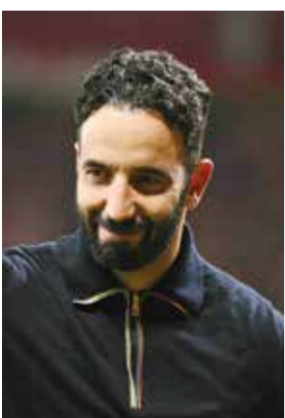
○ أموريم (أ ف ب)

مانشستر - (د ب أ)؛ أكد البرتغالي روبين أموريم، المدير الفني لفريق مانشستر يونايتد، أن الفريق بأكمله سيشارك في جولة الفريق في آسيا بعد نهاية الموسم مباشرة، سعياً منه لتأسيس أجواء عائلية في الفريق.. وذكرت وكالة الأنباء البريطانية (بي إي ميديا) أن فريق مانشستر يونايتد قد ينهي موسمه الصعب بأفضل شكل ممكن في حال فوزه بالدوري الأوروبي حينما يواجه توتنهام في النهائي يوم ٢١ مايو الجاري، حيث سينال لقب البطولة التي ستؤهله لدوري أبطال أوروبا الموسم المقبل.. وفي حال فشل الفريق في تحقيق ذلك ستتحول الجولة الآسيوية إلى جولة باسطة، فيما سيهني الفريق أسوأ موسم له بالدوري الإنجليزي حينما يستضيف أستون فيلا بعد أربعة أيام من النهائي في بلباو..