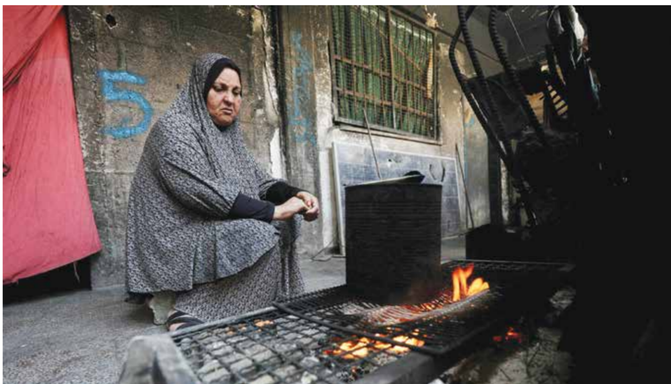
نازحة فلسطينية في مدرسة تابعة للأونروا في مخيم جباليا. (رويترز)

«سيشارك الإسرائيليون في توفير الأمن العسكري اللازم، لأنها منطقة حرب، لكنهم لن يشاركوا في توزيع المواد الغذائية، أو حتى في إدخالها إلى غزة». وقال السفير الأمريكي «سيشارك الإسرائيليون في توفير الأمن العسكري اللازم، لأنها منطقة حرب، لكنهم لن يشاركوا في توزيع المواد الغذائية، أو حتى في إدخالها إلى غزة». وأضاف هاكابي «ندعو الأمم المتحدة. ندعو كل منظمة غير حكومية. ندعو كل حكومة... ندعو كل من كان مهتما بالأمر للانضمام إلى هذه العملية». وعبر عن أمله في أن تنفذ الخطة في وقت «قريب جدا». ولم يقدم جدولا زمنيا لعملية الإغاثة أو أي معلومات إضافية عن المؤسسة غير الحكومية التي ستشارك فيها. وقال هاكابي، وهو حاكم ولاية نيويورك سابق ومؤيد علني لإسرائيل، إن هناك «عدة شركاء وافقوا بالفعل على المشاركة في هذا الجهد، بدون أن يسميهم». المساعدة، وتخشى اليونسف أيضا من «فصل أفراد العائلة الواحدة خلال الجولات المكوكية لاستلام المساعدات في المراكز الخمسة المحددة الواقعة جميعها في جنوب، غزة» في منطقة غير آمنة بسبب القصف المتواصل، وفق ما قاله الناطق باسمها. وأمس قال سفير واشنطن لدى إسرائيل مايك هاكابي إن إسرائيل لن تشارك في توزيع مساعدات غذائية بموجب الخطة الأمريكية لقطاع غزة، لكنها ستوفر «الأمن العسكري اللازم». وكان هاكابي يتحدث إلى الصحفيين في القدس المحتلة بعد يوم من إعلان وزارة الخارجية الأمريكية إنشاء مؤسسة جديدة ستتولى توزيع مساعدات إنسانية في قطاع غزة الذي يشهد حربا مدمرة وحيث تسبب حصار إسرائيلي مطبق منذ أكثر من شهرين في نقص حاد في كافة المواد، من الغذاء والمياه النظيفة إلى الوقود والأدوية. وقال السفير الأمريكي