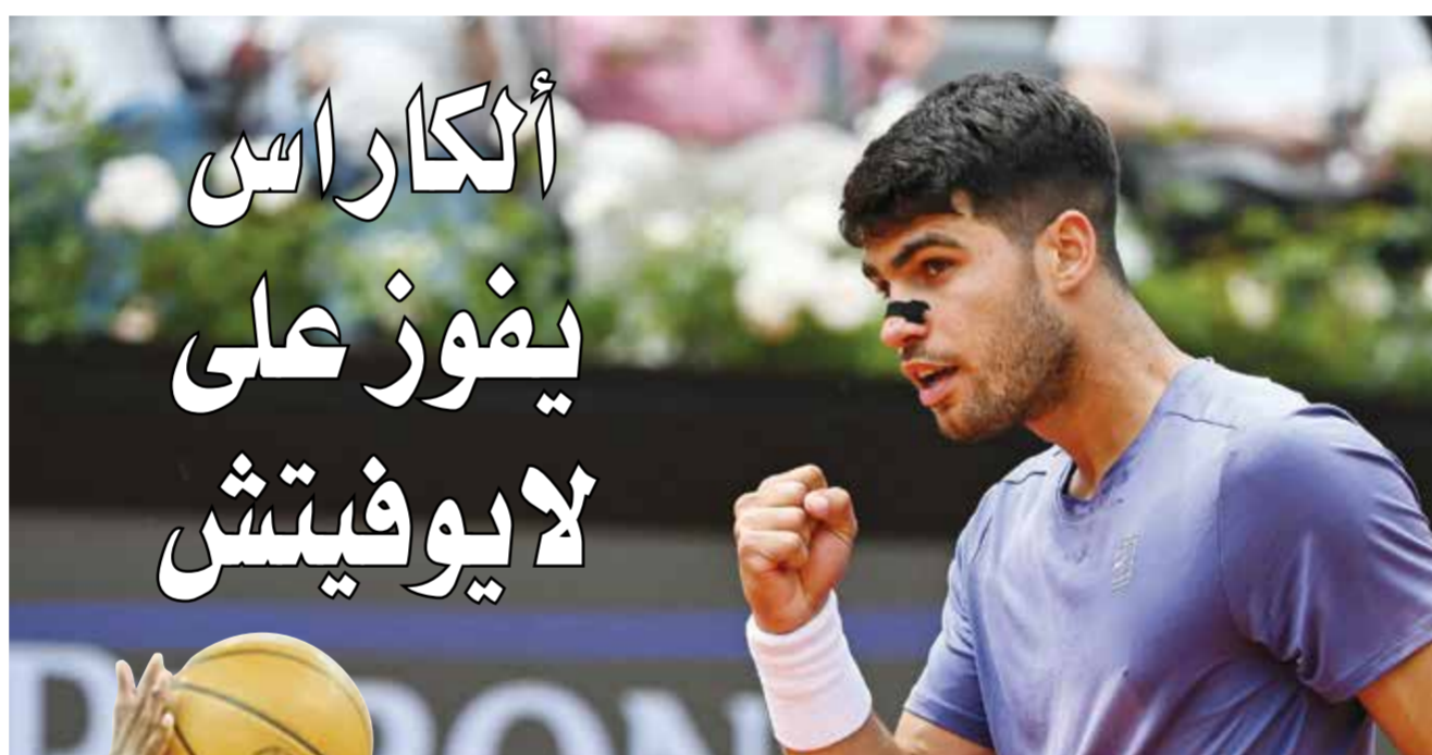
O الكاراس

وتلتقي سابالينكا في الدور الثالث مع الأميركية صوفيا كينن الحادية والأربعين والفائزة على الروسية أناستاسيا بافلوتشكوفا ٦-٢ و ٦-٦ في ٦٦ دقيقة.