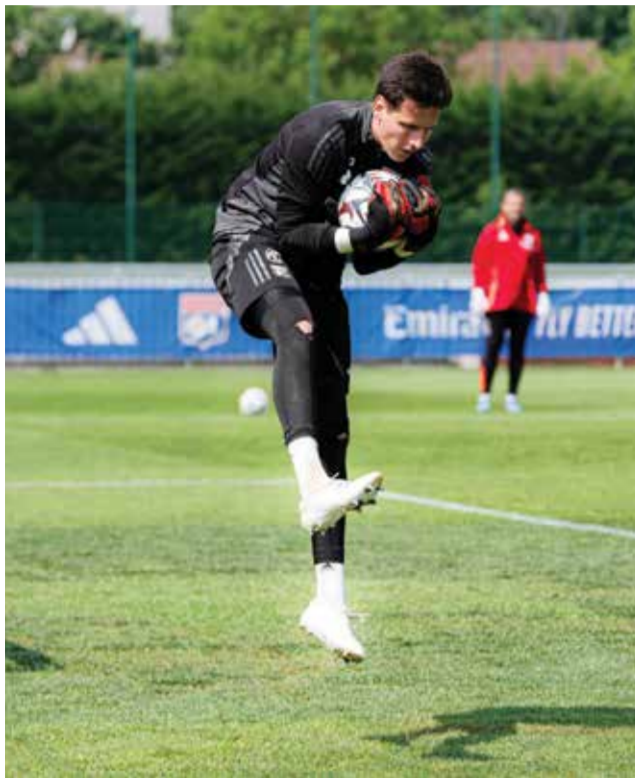
○ تدريبات ليون