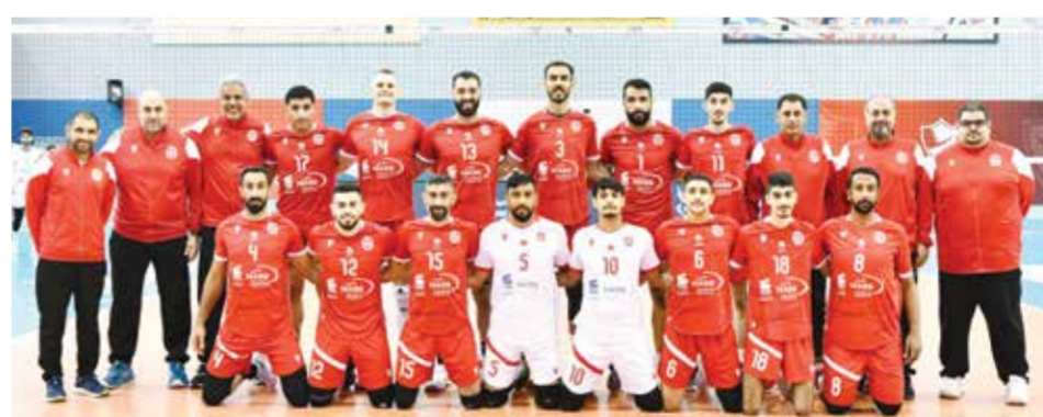
○ فريق المحرق للكرة الطائرة