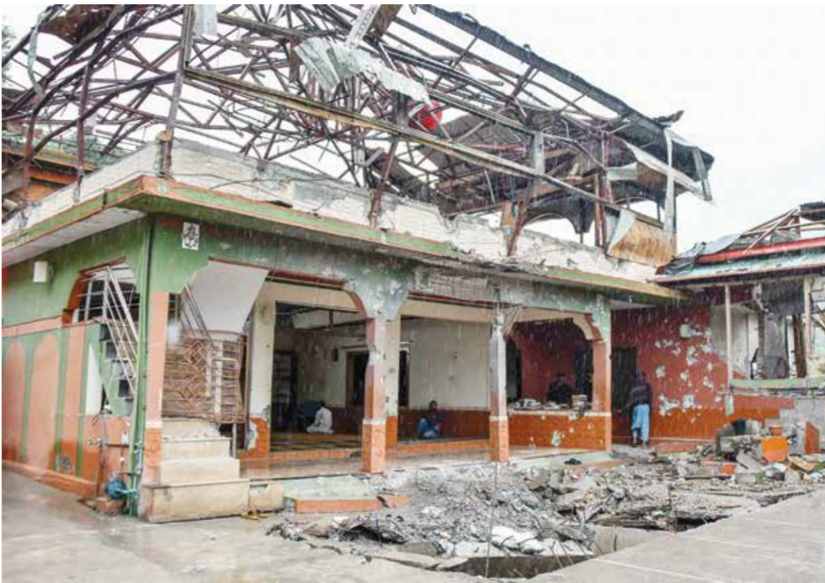
○ مسجد تضرر في قصف هندي على مظفر آباد.

الهندي سوبرامانيام جايشانكار من جهته أن بلده «ليس في وارد» التسبب بتصفيد جديد، ولكنه توعد ببرد حازم جداً، على أي هجوم جديد.