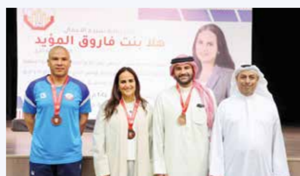
○ جانب من حفل التكريم.

ودعا رئيس النادي في ختام كلمته مجلس الإدارة وكافة العاملين بالنادي إلى مزيد من العمل والتواصل مع النادي بصورة أكبر لتمكين من مواجهة كل التحديات في طريق تحقيق أهداف النادي ورويته. تجدر الإشارة إلى أن نادي مدينة عيسى يقيم هذه الفعالية لتكريم العاملين لديه وأعضاء مجلس الإدارة المنتهية مدته إضافة إلى تكريم الفريق الأول لكرة القدم الحاصل على المركز الثالث بدوري الدرجة الثانية وفريق ناشئي كرة السلة وعدد من الشخصيات التي خدمت النادي من الرعيل الأول إضافة إلى عدد من الإعلاميين العاملين في حفل الإعلام الرياضي.