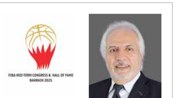
○ علاء مَدَارَا ○ شعار اجتماع الكونغرس.

وفي لفتة تقديرية، وجّه الاتحاد الآسيوي لسباقات الهجن شكره العميق إلى اللجنة الأولمبية البحرينية برئاسة سمو الشيخ خالد بن حمد آل خليفة، على إدراج سباقات الهجن ضمن منافسات دورة الألعاب الآسيوية الثالثة للشباب التي تستضيفها مملكة البحرين في شهر أكتوبر المقبل، معتبراً هذه الخطوة دعماً استراتيجياً يسهم في ترسيخ مكانة رياضة الهجن ضمن الخارطة الرياضية القارية. وأكد الاتحاد أن هذا الإدراج يعكس التوجه البحريني الخلاق نحو