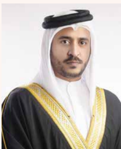
○ سمو الشيخ خالد بن حمد آل خليفة

تحت رعاية كريمة من سمو الشيخ خالد بن حمد آل خليفة النائب الأول لرئيس المجلس الأعلى للشباب والرياضة رئيس الهيئة العامة للرياضة رئيس اللجنة الأولمبية البحرينية، تَحْتَمُّ اليوم السبت عند الساعة الثامنة والنصف مساءً بطولة «خالد بن حمد، الثالثة للبولينج التي ينظمها الاتحاد البحريني للبولينج على صالة أرض المرع، وسط أجواء رياضية حماسية وتنظيم عالي المستوى، بعد أن شهدت البطولة مشاركة أكثر من ١٢٠ لاعباً من نخبة لاعبي العالم.