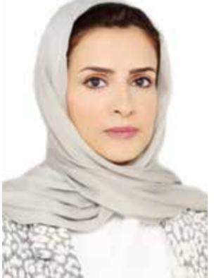
○ بقلم: عائشة يوسف السادة

الاصطناعي في خدمة الثقافة. فواحدة من أبرز هذه الإمكانيات هي رقمنة التراث الثقافي المادي وغير المادي، وحمايته من الاندثار، من خلال استخدام تقنيات المسح ثلاثي الأبعاد، والتحليل اللغوي، والتوثيق الرقمي، ما يجعل الثقافة أكثر استدامة وأقرب إلى الأجيال الجديدة. ولم تغف القصة عند حدود التوصيف، بل تقدمت برؤية استراتيجية توطن العلاقة بين الإنسان والآلة على أنها علاقة شراكة تكاملية، لا تنافسية. فالتحدي اليوم، وفق ما خلصت إليه المناقشات، لا يكمن في وجود الذكاء الاصطناعي، بل في كيفية تسخيرها لخدمة الثقافة الإنسانية بدلاً من تقويضها. وفي هذا السياق، أوصت القصة بضرورة وضع أطر تنظيمية وأخلاقية واضحة تحكم استخدام الذكاء الاصطناعي في مجالات الإنتاج الثقافي، بما يضمن عدم انتهاك الخصوصية، أو تشويه الروايات الثقافية الأصيلة. كما دعت إلى دعم المبادرات المحلية والإقليمية التي تعنى بإنتاج محتوى ثقافي عربي رقمي عالي الجودة يعتمد على الذكاء الاصطناعي، بما يسهم في تعزيز حضور الثقافة العربي في المشهد الرقمي العالمي. وانتهت نقاشات القصة إلى أن الثقافة، في عصر الذكاء الاصطناعي، يجب ألا تقتفي بدور المستجيب السلبي للتحولات التقنية، بل تتطلع بدور ريادي استشرافي يعيد تأطير المسار الإنساني من منظور قيمي وأخلاقي. فالمطلوب اليوم، أكثر من أي وقت مضى، هو بناء خطاب ثقافي إنساني يقاوم النزعة التقنية البحتة التي تهدد بتجريد الإنسان من خصوصيته، ويغلي من شأن الحوار والاعتراف بالأخر، بوصفهما أساساً لإعادة بناء عالم أكثر عدلاً وتشاركية واستدامة.