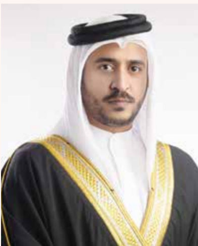
○ سمو الشيخ خالد بن حمد آل خليفة

تحت رعاية كريمة من سمو الشيخ خالد بن حمد آل خليفة النائب الأول لرئيس المجلس الأعلى للشباب والرياضة رئيس الهيئة العامة للرياضة رئيس اللجنة الأولمبية البحرينية، تَحْتَمُّ اليوم السبت عند الساعة الثامنة والنصف مساءً بطولة خالد بن حمد، الثالثة للبولينج التي ينظمها الاتحاد البحريني للبولينج على صالة أرض المرع، وسط أجواء رياضية حماسية وتنظيم عالي المستوى، بعد أن شهدت البطولة مشاركة أكثر من ١٢٠ لاعباً من نخبة لاعبي العالم.