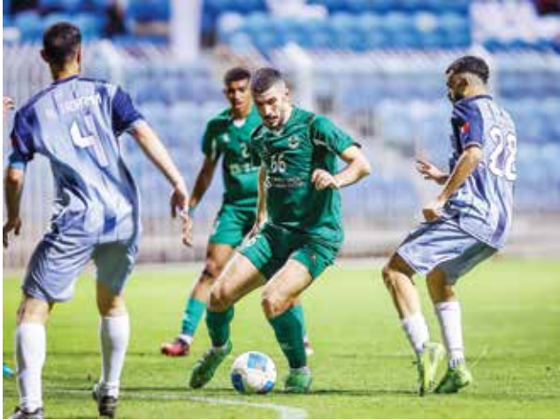
○ من لقاء البديع والتضامن.