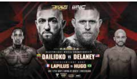
○ إعلان البطولة.

دايليدكو والمعروف بالقوة البدنية العالية وقوة الضربة القاضية، يعد قوة مهيمنة في هذا الوزن، والذي نجح في إيقاف بعض المقاتلين الكبار في الوزن الثقيل في قارة أوروبا.