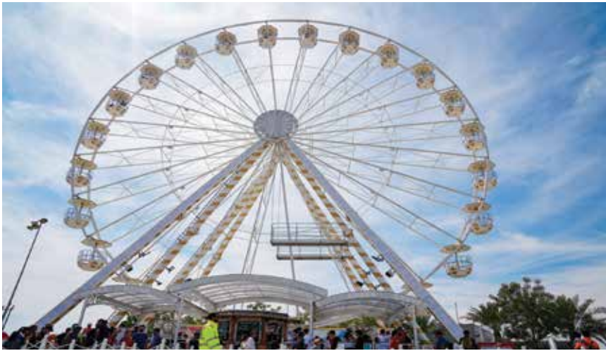
○ العجلة الدوارة.

جدول حافل من فعاليات الترفيه العالمية على مدار عطلة نهاية الأسبوع. وكعادة حلبة البحرين الدولية ففي كل عام ينطلق جدول حافل بالفعاليات الترفيهية العالمية، ليستمتع بها جميع أفراد العائلة لسباق جائزة البحرين الكبرى للفورمولا وان. ويشمل ذلك الفرق المتجولة، والعروض