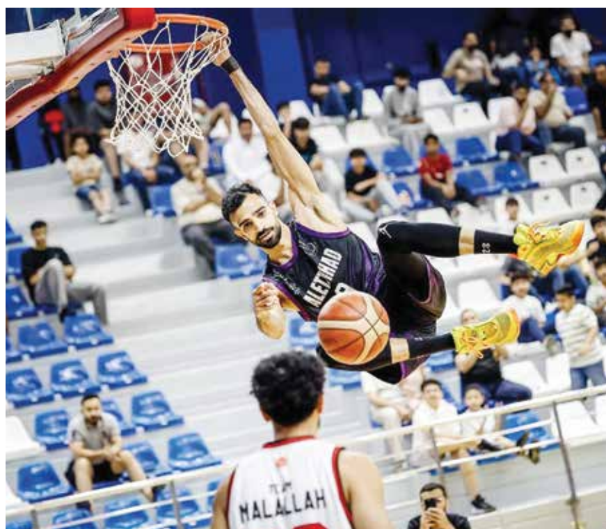
○ من تحدي الدانك.