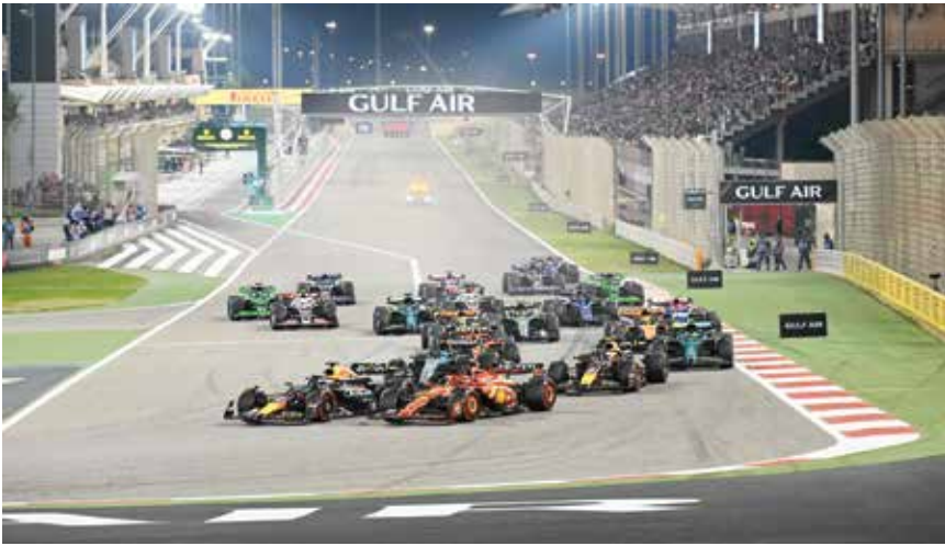
○ من سباق الفورمولا وان.

«نبض الصحراء لا يتوقف، هو الشعار الذي تم إطلاقه على سباق هذا العام الذي يعبر عن عطلة نهاية أسبوع مليئة بإثارة السباقات الدولية والفعاليات الترفيهية العالمية والحفلات الغنائية، وكذلك سينطلق السباق كجزء من الذكرى السنوية الـ ٧٥ للفورمولا وان ٢٠٢٥. وتستعد بطولة الفورمولا وان لجولتها الرابعة بعد سباقَي الصين واليابان، لتحط رحالها في حلبة البحرين الدولية، وتشهد الحلبة إلى جانب سباق الفورمولا وان، سباقات دولية رئيسية أخرى وبطولات إقليمية من الصباح حتى المساء، وأبرزها الجولة الثانية من بطولتي الفورمولا ٢ والفورمولا ٣ التابعتان للاتحاد الدولي للسيارات، إلى جانب انطلاق الجولة الخامسة من بطولة تحدي كأس بورش كاريرا الشرق الأوسط. وتعدكم الحلبة بجدول حافل بالفعاليات الترفيهية والتي تشمل مجموعة مختارة من أشهر الفرق الاستعراضية والمتجولة