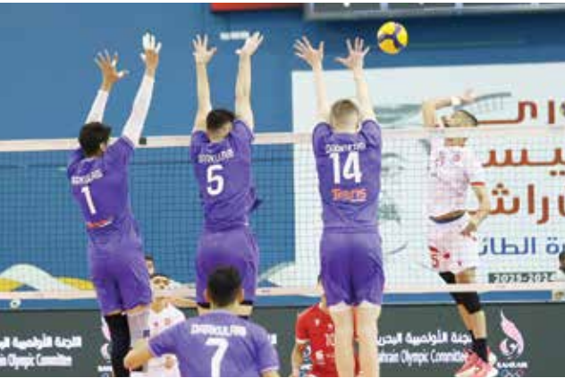
○ من لقاء المحرق ودار كليب.