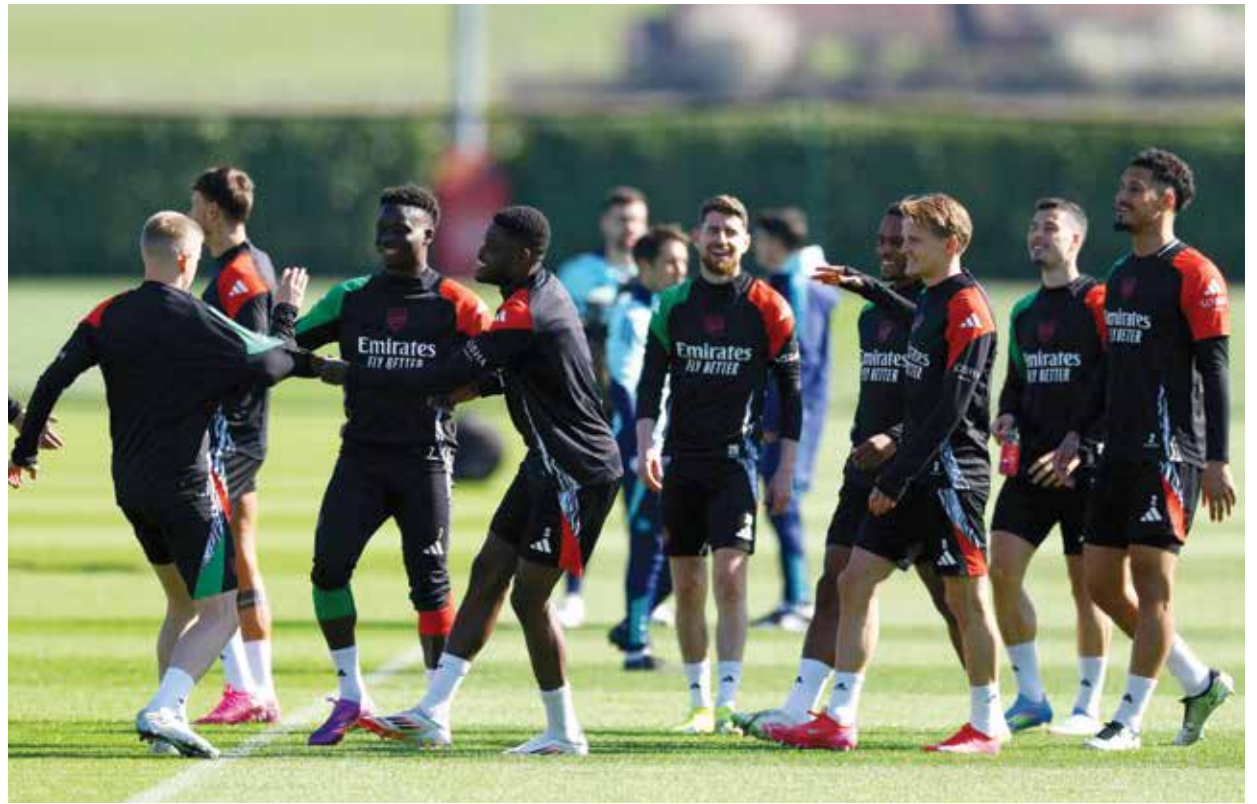
○ تحضيرات أرسنال