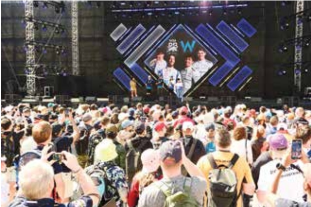
○ من فعالية مقابلة السائقين.