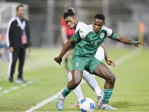
○ من لقاء مدينة عيسى واتحاد الريف.

وجاء نتائج الفترات كالتالي: الفترة الأولى (٢٠-١٢) لصالح القادسية، والفترة الثانية (٢١-٢٠) للقادسية، والفترة الثالثة (١٨-١٧) للقادسية، والفترة الرابعة (٢٢-٢٤) للمنامة. ولم يتمكن ممثل الوطن من التواجد ضمن أقوى ثمانية فرق في البطولة، حيث سبق له تحقيق لقب النسخة الأولى في إنجاز غير مسبق، وتمكن من تحقيق المركز الثاني لمنطقة الخليج في النسختين الأخيرتين.