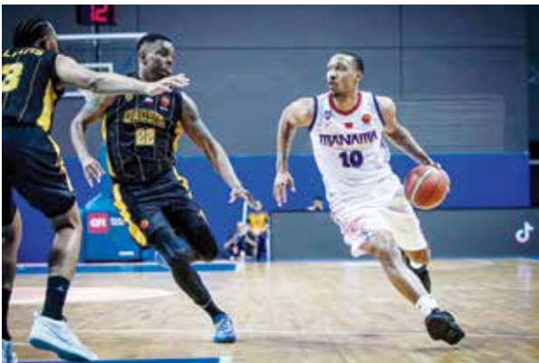
○ جانب من المباراة.

وتأتي هذه المؤتمرات بغية تعريف الرياضي والمتابعين على آخر الاستعدادات والتحضيرات الخاصة بالأندية الأربعة الساعية وراء المنافسة للظفر باللقب الأعلى.