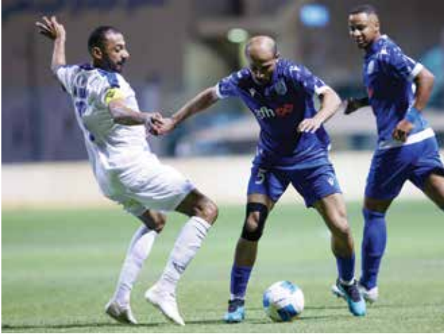
○ من لقاء الحد وأم الحصم.