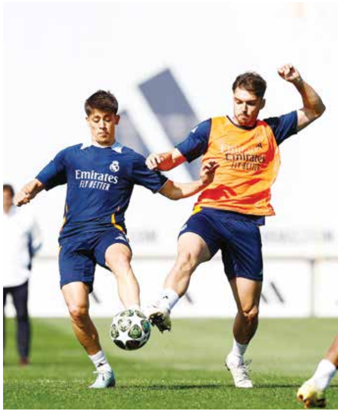
○ تدريبات الريال