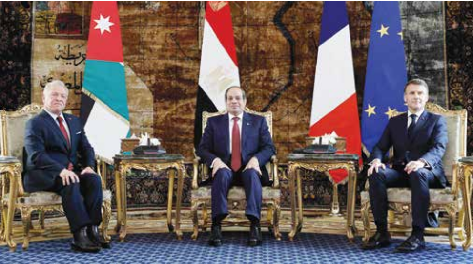
○ ماكرون والسيسي والملك عبدالله الثاني ناقشوا في قمة ثلاثية بالقاهرة التطورات في غزة.

وقال ماكرون في المؤتمر الصحفي في القاهرة لنظيره المصري: «شكرا على استقبالكم لنا في العريش.. في هذا الموقع المتقدم لدعم المدنيين في غزة». وعلى مستوى العلاقات المصرية الفرنسية، شهد الرئيس توقيع اتفاقات في قطاعات التعليم والنقل والطاقة المتجددة.