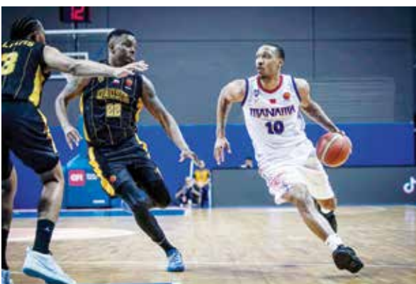
○ جانب من المباراة.

وتأتي هذه المؤتمرات بغية تعريف الرياضيين والمتابعين على آخر الاستعدادات والتحضيرات الخاصة بالأندية الأربعة الساعية وراء المنافسة للظفر باللقب الأعلى.