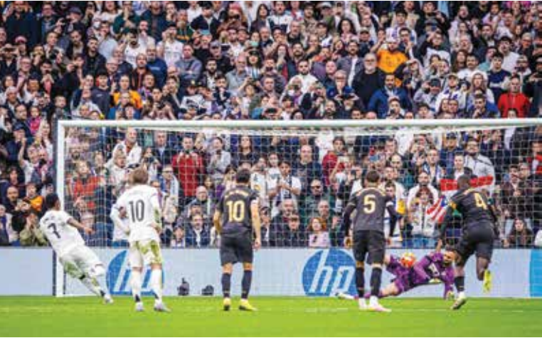
O من لقاء الريال وفالنسيا .

عدم فرض نفسه بشكل تام، فيما يوكل للالمانى أنتونيو رودرغرز حمل دفاع الفريق على كتفيه بشكل مستمر.