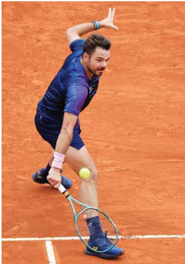
O فافرينكا .