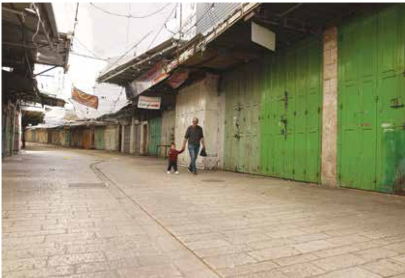
○ محلات تجارية مغلقة في الخليل بسبب الإضراب الشامل.

كما وسع الجيش الإسرائيلي توغله البري في مناطق مختلفة من القطاع، ملوحا بالمزيد ما لم يتوقف إطلاق الصواريخ نحو إسرائيل.