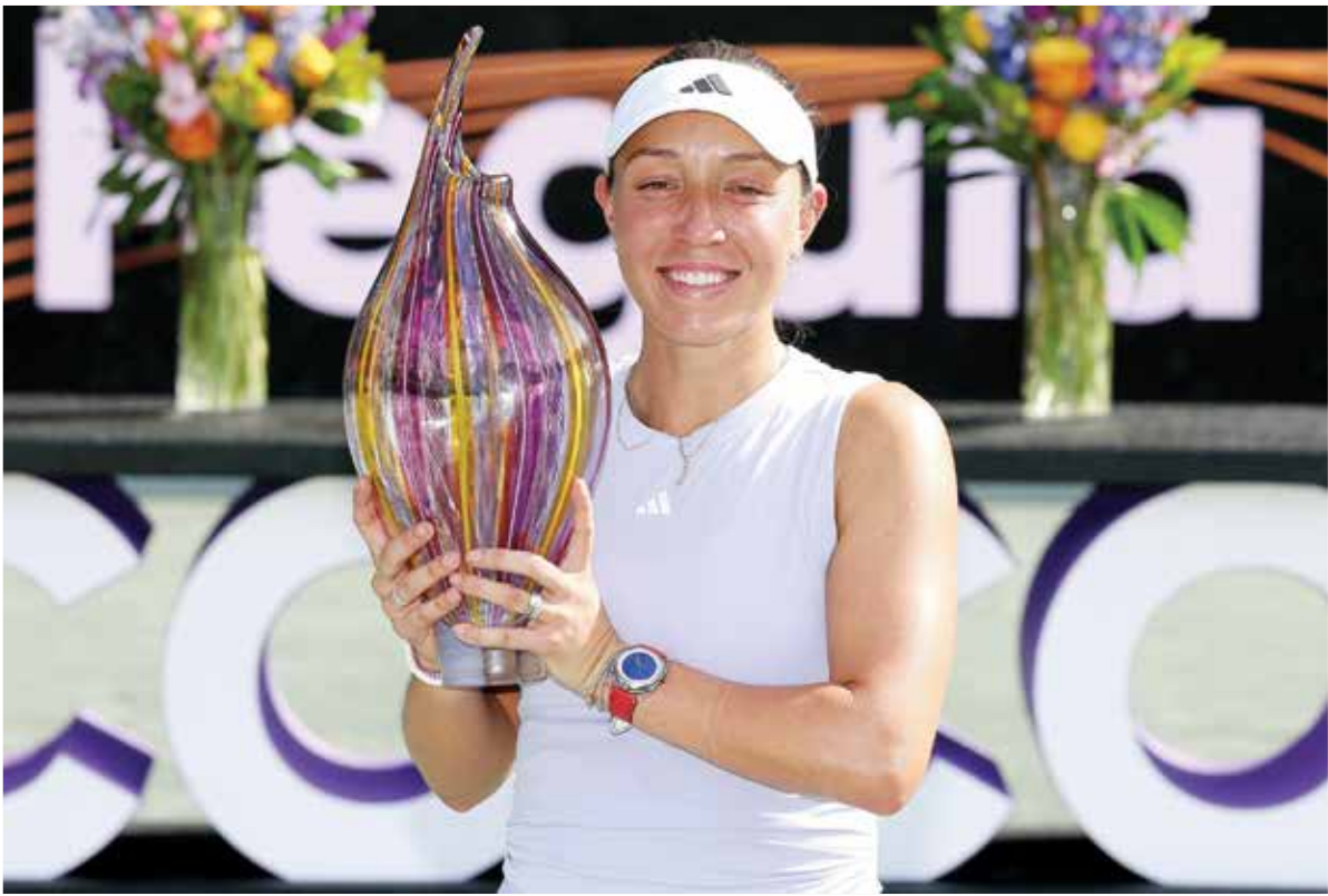
O بيغولا