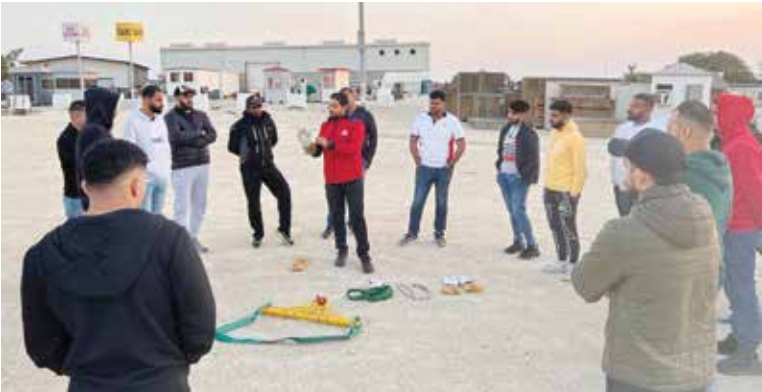
○ جانب من التدريبات.

وتشهد بطولة BRAVE CF ٩٤ إقامة حدث رئيسي على اللقب العالمي في الوزن الثقيل، والذي يجمع بين البطل الحالي بافيل دايليدكو صاحب السجل المميز بـ٩ انتصارات وتعادلتين، والمقاتل الليتواني أودي ديلاني الذي يمتلك في رصيده ٥ انتصارات نظيفة.