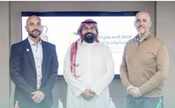
O صورة جماعية