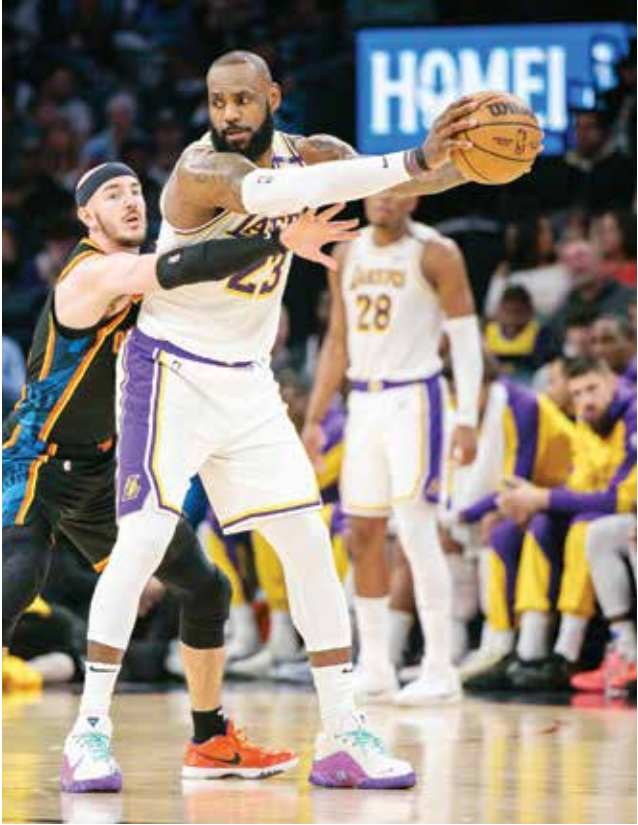
O من لقاء ليكرز وثلندر .

وتابع مدير مكلارين: «عندما نكون في موقف قوي، يكون ذلك أفضل طريقة لتحقيق