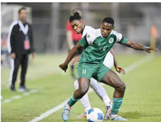
○ من لقاء مدينة عيسى واتحاد الريف.

وجاء نتائج الفترات كالتالي: الفترة الأولى (٢٠-١٢) لصالح القادسية، والفترة الثانية (٢١-٢٠) للقادسية، والفترة الثالثة (١٨-١٧) للقادسية، والفترة الرابعة (٢٢-٢٤) للمنامة. ولم يتمكن ممثل الوطن من التواجد ضمن أقوى ثمانية فرق في البطولة، حيث سبق له تحقيق لقب النسخة الأولى في إنجاز غير مسبق، وتمكن من تحقيق المركز الثاني لمنطقة الخليج في النسختين الأخيرتين.