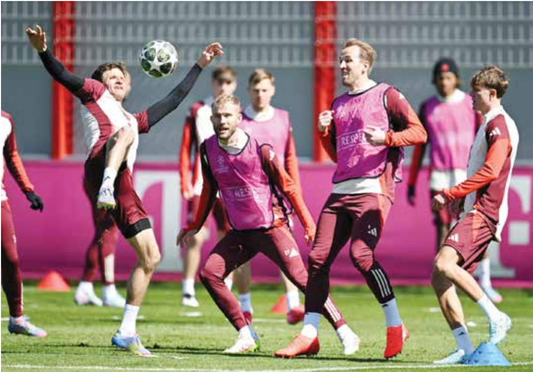
○ استعدادات بايرن

ولم يكن نهائي ٢٠١٠ المواجهة الأخيرة بين الفريقين، إذ التقيا في العام التالي خلال ثمن النهائي حين فاز إنتر أيضا بفارق الأهداف المسجلة خارج الديار (١-٠ ذهابا على أرضه و٢-٢ إيابا) قبل أن يسترد بايرن اعتباره في موسم ٢٠٢٢-٢٠٢٣ حين فاز في دور المجموعات ذهابا وإيابا بنتيجة واحدة ٢-٠.