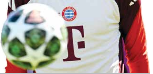
○ مولر

جمال موسيالا الذي سبب عدة أسابيع بسبب إصابة في أوتار الركبة.