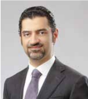
○ وزير البلديات.

فيما يتعلق بالإجراءات التي تتخذها الحكومة للحد من تعتثر المشاريع العقارية، قال الوزير