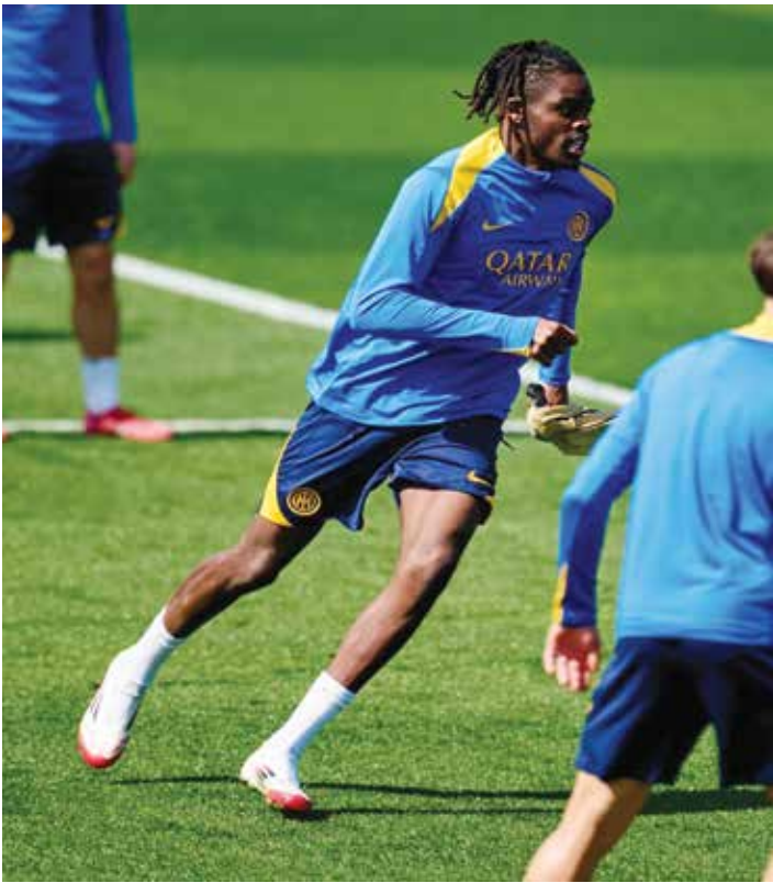
○ تدريبات إنتر