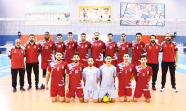
○ فريق الشباب للكرة الطائرة.