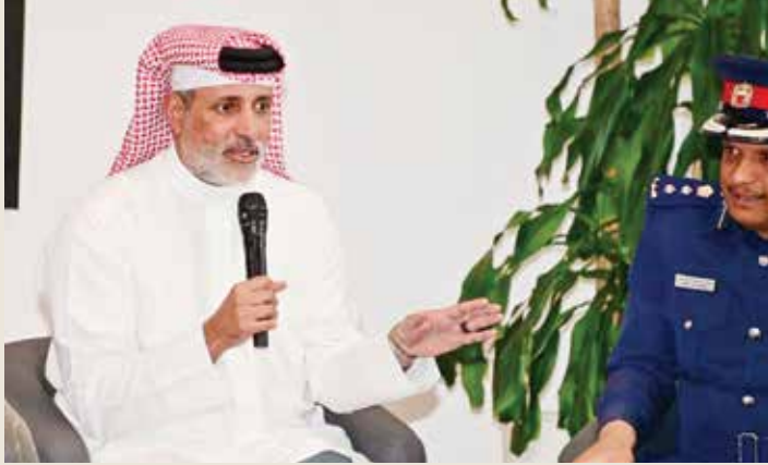
○ الشيخ سلمان بن عيسى آل خليفة.

أكد الشيخ سلمان بن عيسى آل خليفة، الرئيس التنفيذي لحلبة البحرين الدولية، حرص مملكة البحرين على مواصلة تقديم نموذج متميز في تنظيم الفعاليات العالمية الكبرى، حيث تم تطوير منظومة متكاملة من الإجراءات التنظيمية بالتعاون مع الشركاء في فريق البحرين، بما يضع تجربة الجماهير في صلب الأولويات ويعكس التطور التنظيمي الملموس الذي يشهده سباق جائزة البحرين الكبرى لطيران الخليج للفورمولا وان عاماً بعد عام. جاء ذلك خلال إحاطة إعلامية عُقدت في المركز الإعلامي بحلبة البحرين الدولية، بحضور ممثلين عن الإدارة العامة للمرور بوزارة الداخلية، ومركز الاتصال الوطني، وحلبة البحرين الدولية، تم خلالها استعراض الإجراءات التطويرية والاستعدادات التنظيمية والخطة المرورية المحدثة لسباق جائزة البحرين الكبرى لطيران الخليج للفورمولا وان لعام ٢٠٢٥، الذي سيقام خلال الفترة من ١١ إلى ١٣ أبريل الجاري.