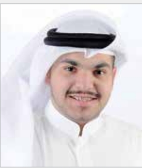
بقلم: ابتك عبدالله محمد سيف

مر على غيابك اليوم يا بوي عام أبشرك يا بوي فطرت الصيام وأنا اريت على ظهر أمي واخواني على خطاك مثل ما تباني عام وأنا انطرك عند أبواب الأحلام وكتاب على قبرك أبو الصيام أزهم الدمع كيف جاك وخلاتي شاهد عليك والله دعاني أرقب زولك يمر ما بين الأنعام وماي السبيل اللي بنيتك قبل أعوام أتلقف سراب صوتك في المحاني مازال يسقي كل قاصي وداني ما غاب طاريك طول هل عام ومسجدك قايم بهدي الإسلام يا راعي الجود والكرم بكل مكاني مثل ما تحب وترسم لي أماني ألقاك بصوت المآذن وتغريد الحمام يا بن سيف ومثلك ما يهام وترتيل السور وقيام ليلك الهاني حتى وان كنت عند رب المعاني الله خذاك لعنده والله لا يظام أرقى سنودي يا نوري بالظلام أكيد ان فقدي لك له معاني يلي غيابك مازال يحضني لو تدور الدنيا وتلف الأيام اشبهك صرت بالصوت والكلام ما أبديل أبوتك بأب ثاني عسى ان خطاك دايم يشبهني علمتني كيف المراحل تنسام مرثية أكتبها بالدمع والكلام وعلمتني إن الصبر تاج المعاني ومهما كتبت ما يكفي لأني ولبستني الفخر صمصام فاقدك هذا اليوم لي عام وبديتني بالجود بين العياني عام ولا خفّت طاريك عني قلدتني اسمك والفعايل جسام ما ينام الذيب وأهله نيام وأنا مبدى منك عشاني حتى لو الموت خذاك مني ما ملني قبرك كل زام ماخذ من تحفيك الأولاني