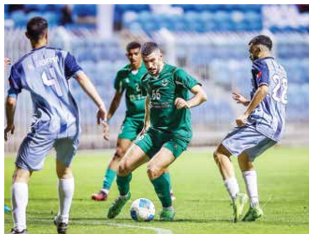
○ من لقاء البديع والتضامن.