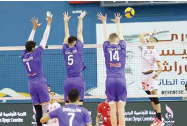
○ من لقاء المحرق ودار كليب.