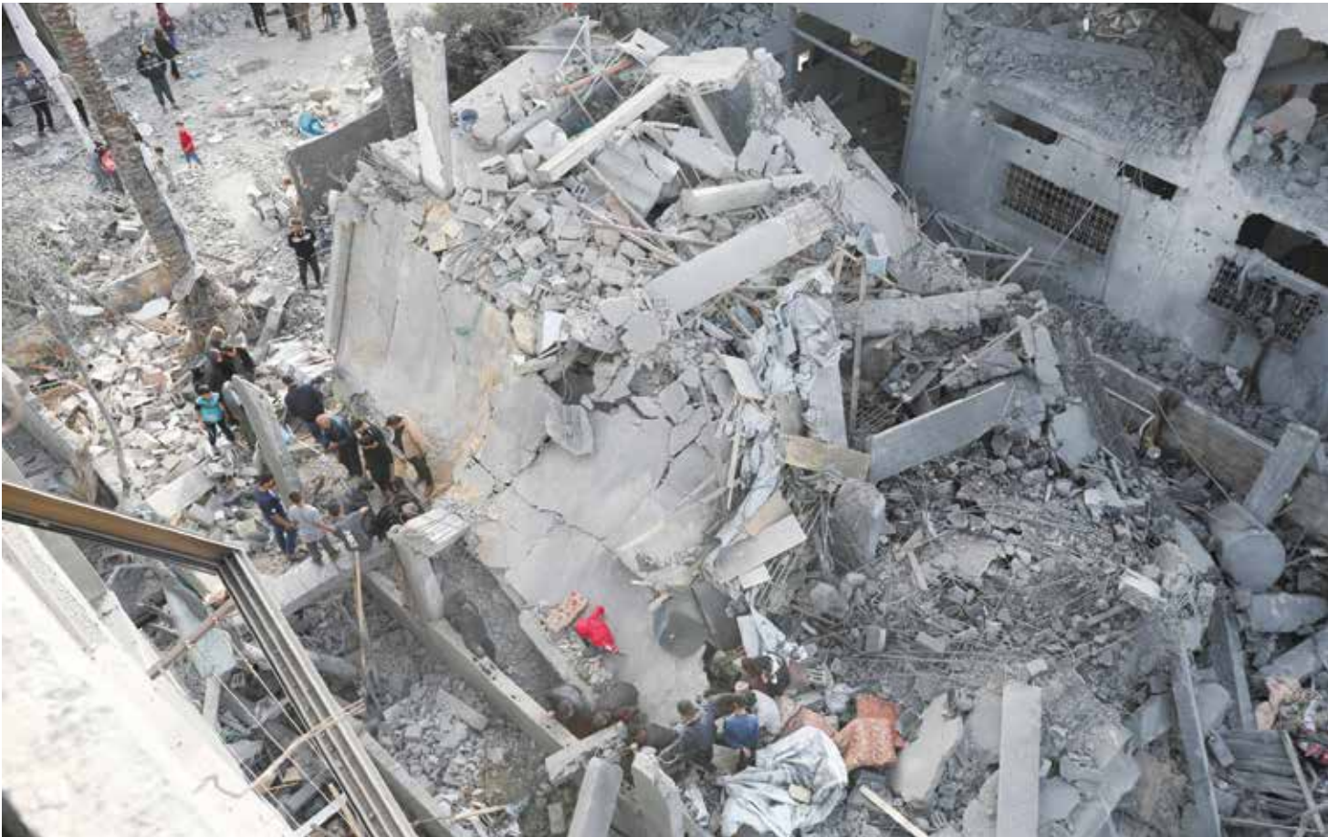
○ فلسطينيون يبكون عن ضحايا غارة إسرائيلية على منزل في دير البلح.

غزة □ الوكالات: شنت طائرات إسرائيلية غارات فجر أمس في مناطق مختلفة من قطاع غزة، ما تسبب باستشهاد ١٢ شخصا بينهم أطفال، وفق الدفاع المدني، وصحفي، وفق المكتب الإعلامي بغزة.