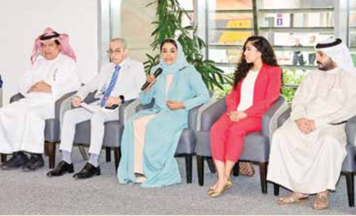
○ جانب من الحضور.