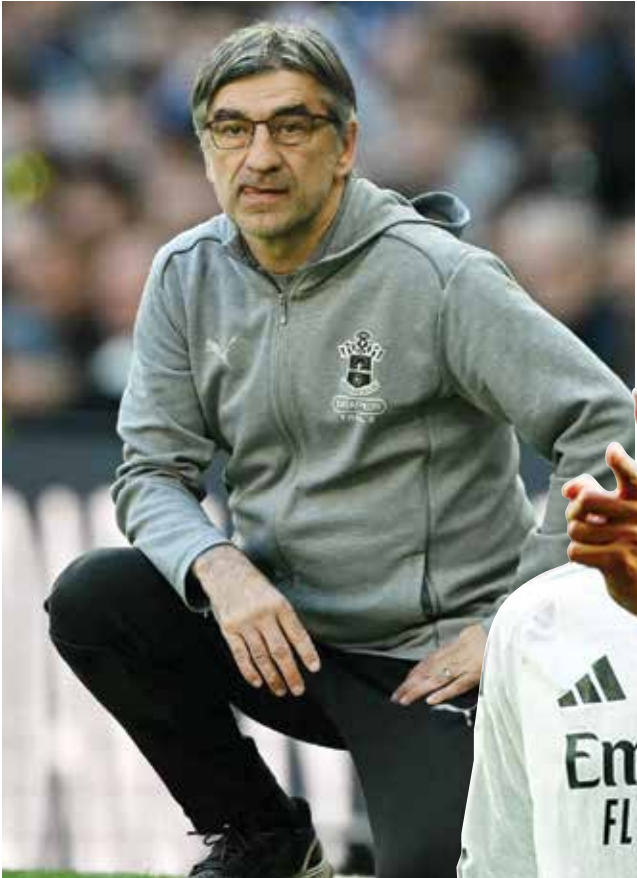
O يوريتش.(١ ف ب)