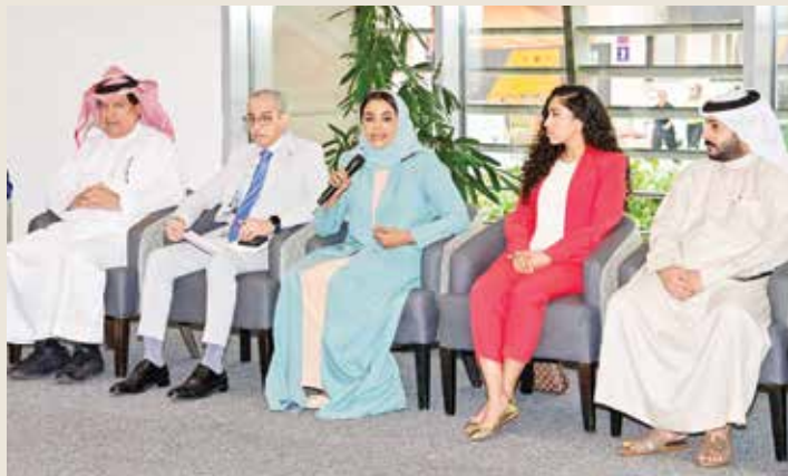
○ جانب من الحضور.