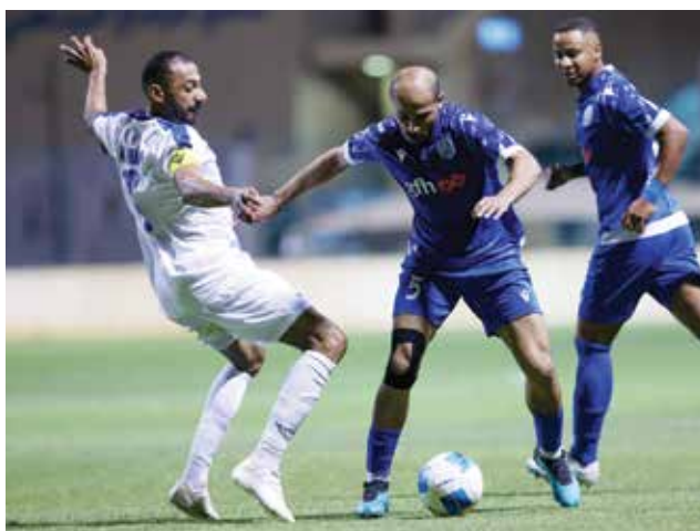
○ من لقاء الحد وأم الحصم.