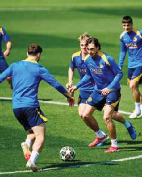
O تدريبات الإنتر

وتلقى إنتر أهدافا في مرما مرتين فقط خلال