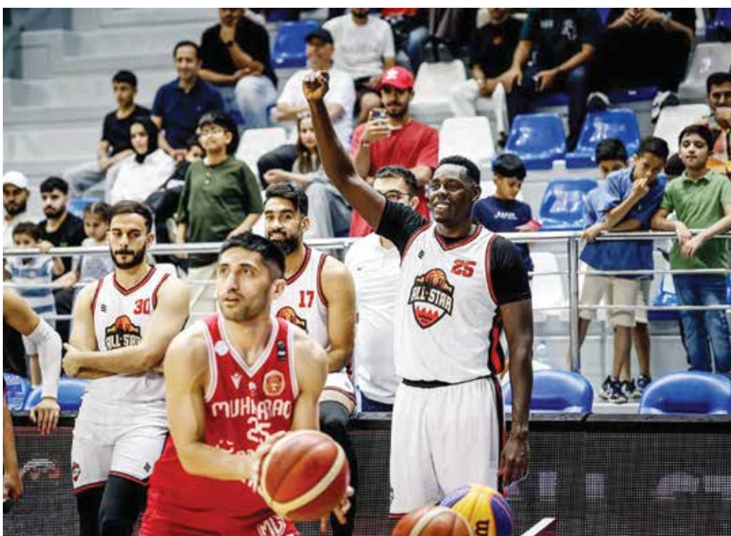
○ من تحدي التصويبات الثلاثية.