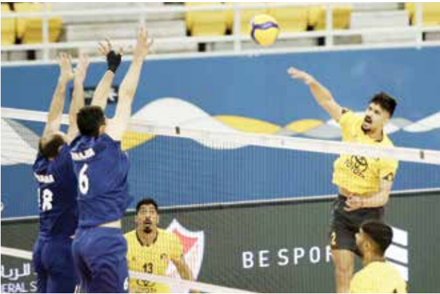
○ من مباراة الأهلى أمام النجمة.