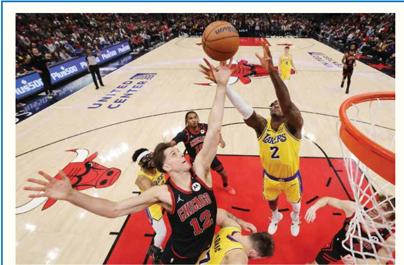
○ من لقاء ليكرز و بولز