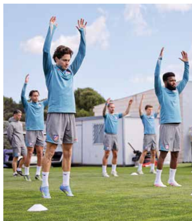
○ تدريبات أتلتيكو.

من ناحيته، يبحث ريال الثاني بفارق ثلاث عن نفاذ عن برشلونة المتصدر عن فوزه الثالث تواليا في «الليغا»، بعدما كان إسقط رايو فايكانو وفياربال بالنتيجة ذاتها ٢-٢ في المرشحين الماضيتين. ويتوجع على الإيطالي كارلو أنشيلوتي مدرب النادي الملكي التعامل مع عامل الأرقام الذي أصاب لاعبيه وتحديدا الذين ارتدوا قمصان منتخبات بلادهم على غرار البرازيليين فينيسوس جونيور ورودرغو والمهاجم الفرنسي كيليان مبابي ثاني هدافي الدوري مع ٢٠ هدفا بفارق ٣ أهداف عن المتصدر البولندي روبرت ليفاندوفسكي مهاجم برشلونة. ويلعب برشلونة المتصدر أمام جاره جيرونا مفاجأة الموسم الماضي باحتلاله للمركز الثالث في اليوم ذاته، علما أن رجال المدرب الألماني هانزي فليك يخوضون مبارياتهم الثانية من تسع في غضون ٢٨ يوما، وتخطوا الخميس ضيفهم أوساسونا بثلاثية نظيفة في مباراة مؤجلة ببرشلونة. ويسبب وفاة طبيبه كارليس مينارو غارسيا.