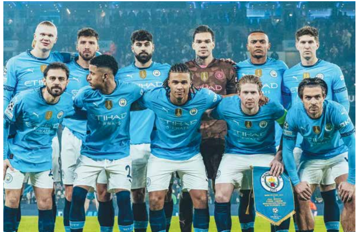
○ فريق سيتي