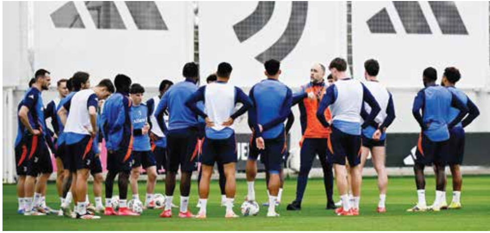
○ تدريبات يوفنتوس

قادر على الاحتفاظ باللقب بعد فوزه في المرحلة الماضية على أتالانتا الثالث ٢-٠ خارج الديار. في المقابل، يمر ميلان بمرحلة انتعاش بعد فوزه بمباراته الأخيرتين على ليتشي وكومو، لكن الأمور ستكون هذه المرة أصعب بالتأكيد على رجال المدرب البرتغالي سيرجيو كونسيساو في مواجهة نابولي الذي فاز ذهاباً في «سان سيرو» بهدفين نظيفين. ومن جهته، سيحاول أتالانتا استعادة توازنه والتمسك بأمل المنافسة على اللقب في ظل فارق النقاط الست الذي يفصله عن إنتر، لكن المهمة لن تكون سهلة الأحد في ضيافة فيورنتينا الذي أدل يوفنتوس في مباراته الأخيرة ٣-٠.