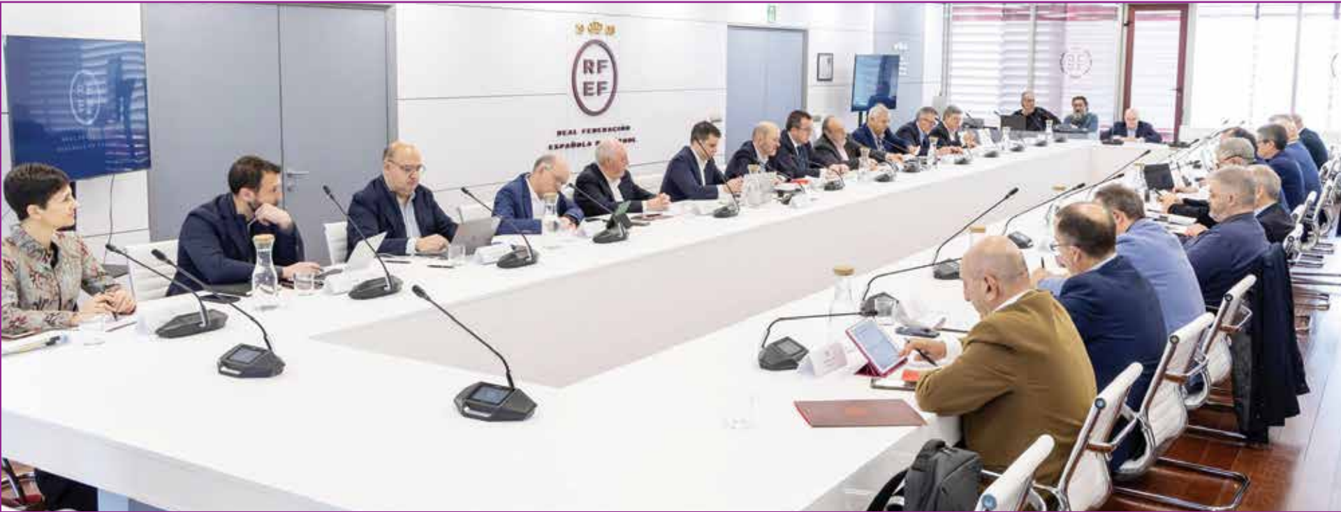
○ من اجتماع الاتحاد الإسباني