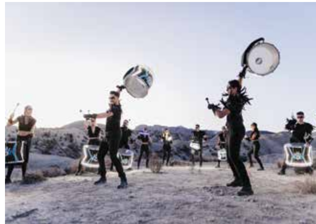
○ من الفعاليات الترفيهية