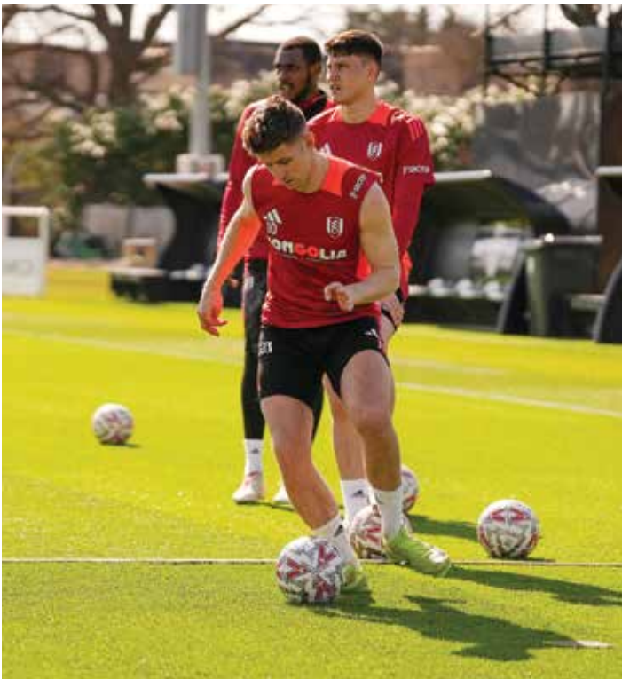
○ استعدادات نوتنغهام