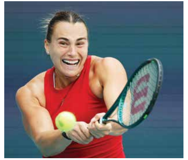
○ سابالينكا.

لوس أنجلوس - : واصل الكندي شاي غلجويس-الكسندر تألق بتسجيله ٣٧ نقطة قاد بها فريقه ثاندر، الفريق الوحيد الذي ضمن حتى الآن تأهله إلى الدبلاي أوف، في الغرب، إلى فوزه القياسي الحادي والستين وذلك على حساب غريزليز ١٢٥-١٠٤ في دوري كرة السلة الأمريكي للمحترفين (إن بي إيه). وفي أول مشاركة له بعد غياب لسبع