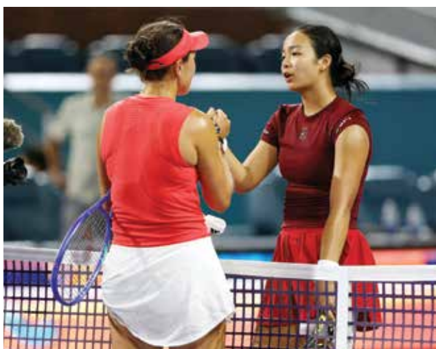
○ إيالا تودع ميامي

أن تستفيد من انسحاب الإسبانية بولا بادوسا بسبب تعرضها لإصابة في ظهرها، لتبلغ الدور ربع النهائي حيث حققت اعظم انتصار لها بالفوز على البولندية إيغا شفيوتيك الثانية عالميا. وستكون مواجهة النهائي التاسعة بين بيجولا وسابالينكا التي تتفوق على الأمريكية بستة انتصارات، آخرها في نهائي بطولة فلاشينغ ميدوز ٢٠٢٤ وقبلها بأربعين مرة في نهائي دورة سيسيناتي الألف نقطة.