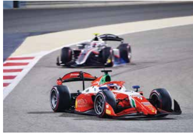
○ جانب من المنافسات في الحلبة.