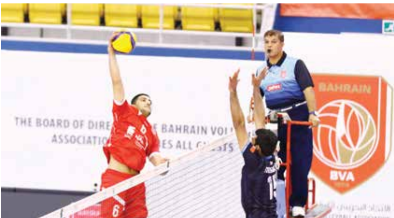
جانب من لقاء المحرق والنبهه صالح.

وفي اللقاء الآخر، يدخل فريق الرفاع المواجهة برصيد ٢٠ نقطة بالمركز الثالث، ويطمح المدرب الإسباني كارلوس هيرنانديز إلى تحقيق الفوز وكسب النقاط الثلاث والتقدم في سلم الترتيب، وقد فاز بالجولتين السابقتين على البحرين (٢-٠)، والنمامة