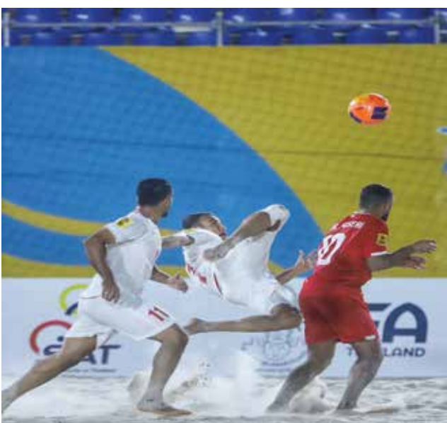
○ من لقاء إيران والبحرين

النهائي اليابان التي فازت على لبنان ٨-٣ يوم السبت،