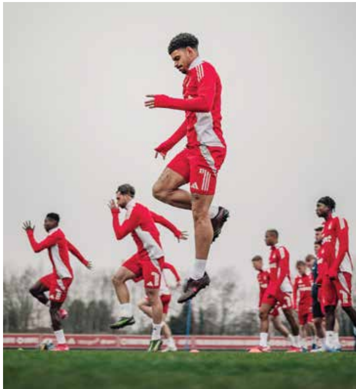
○ تحضيرات فولهام