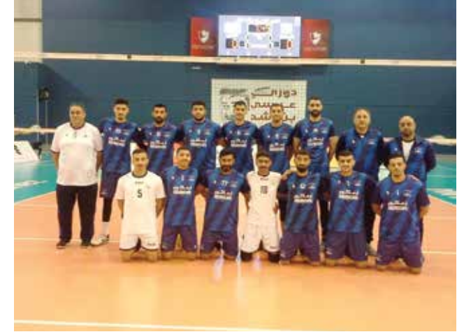
○ فريق المعامير لكرة الطائرة.