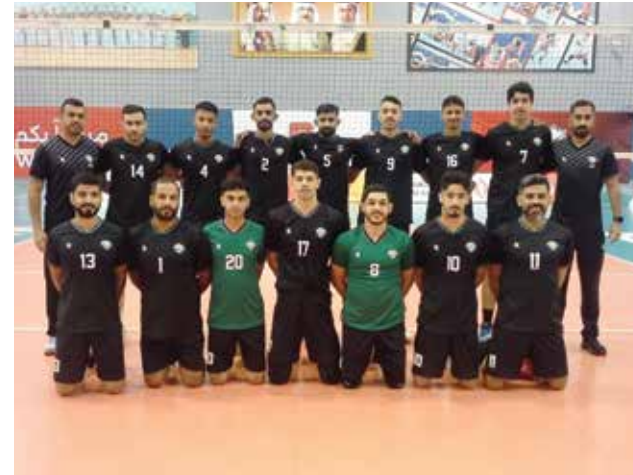
○ فريق بني جمرة لكرة الطائرة.