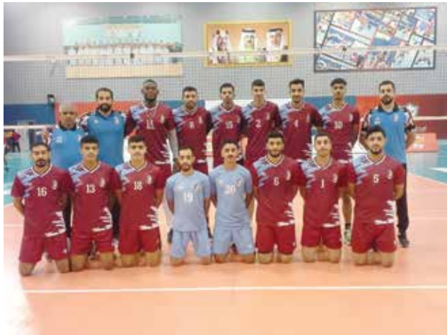
○ فريق الشباب لكرة الطائرة.