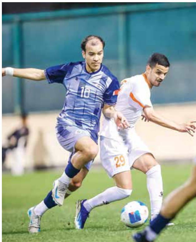
من لقاء الحالة والتضامن.