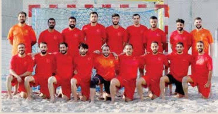
منتخب كرة اليد الشاطئية