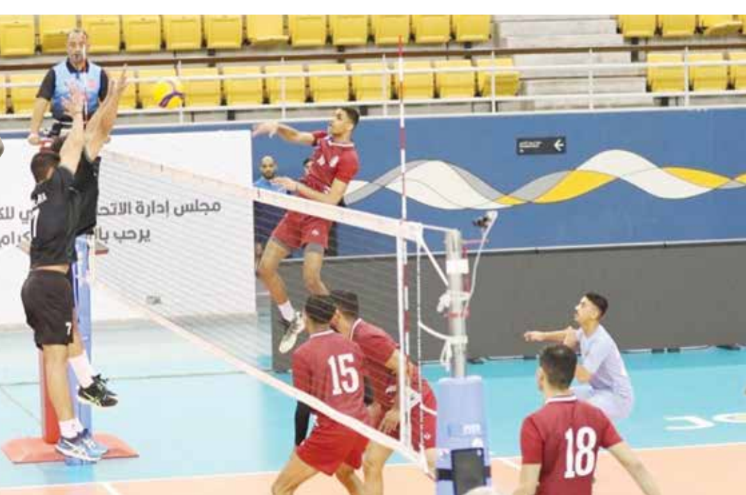
○ لحظة فنية من منافسات دوري الاتحاد.