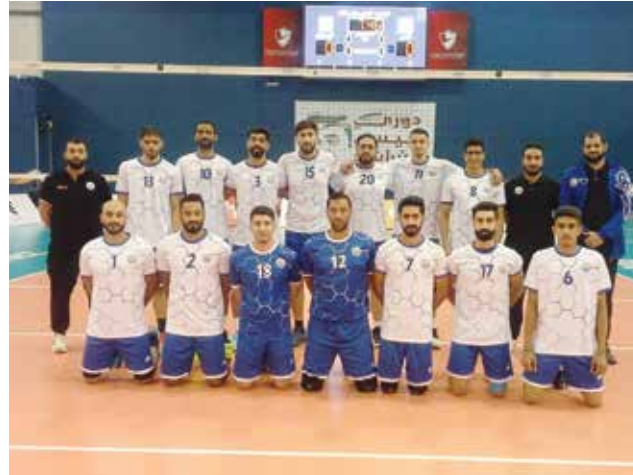
○ فريق البيسيتين لكرة الطائرة.