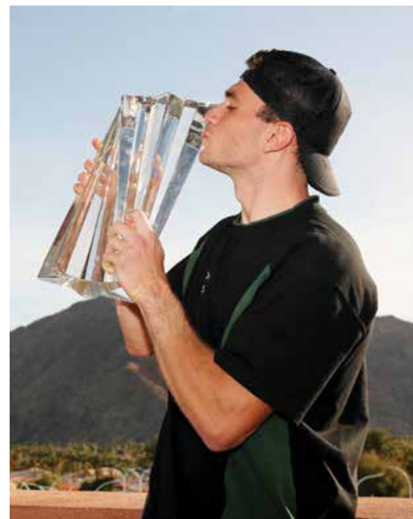
○ درايبير. (أ ف ب)

لوس أنجلوس - (أ ف ب): أوقف أورلاندو ماجيك مسلسل انتصارات مضيفه لكيفلاند كافاليري، متصدرا المنطقة الشرقية والترتيب العام، بالفوز عليه ١٠٨-١٠٣ في دوري كرة السلة الأمريكي للمحترفين (إن بي إيه). ودخل كافاليري اللقاء على خلفية ١٦ انتصارا متتاليا في أطول سلسلة في تاريخه، ما جعله مرشحا طبيعيا للخروج منتصرا من مواجهته مع ماجيك الذي يقاوم من أجل نيل مركز مؤهل إلى الملحق «بلاي إن» في المنطقة الشرقية.