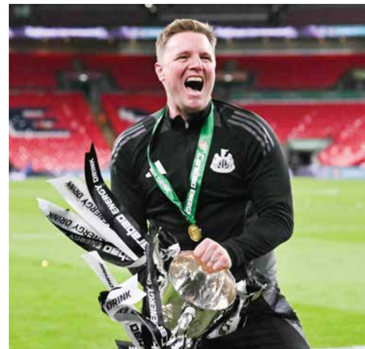
○ هاو (أ ف ب)