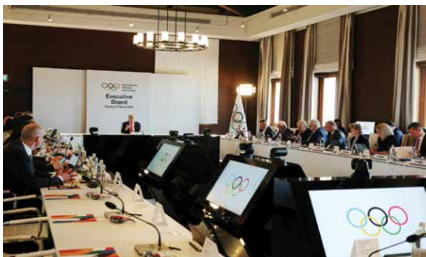
○ من اجتماع المجلس التنفيذي. (رويترز)

بيلوس - (رويترز): أوصى المجلس التنفيذي للجنة الأولمبية الدولية أمس الاثنين بإدراج الملاكمة في دورة الألعاب الأولمبية الصيفية المقررة في لوس أنجلوس عام ٢٠٢٨، منهيًا بذلك قصة ملحمة استمرت سنوات بشأن المستقبل الأولمبي لهذه الرياضة.