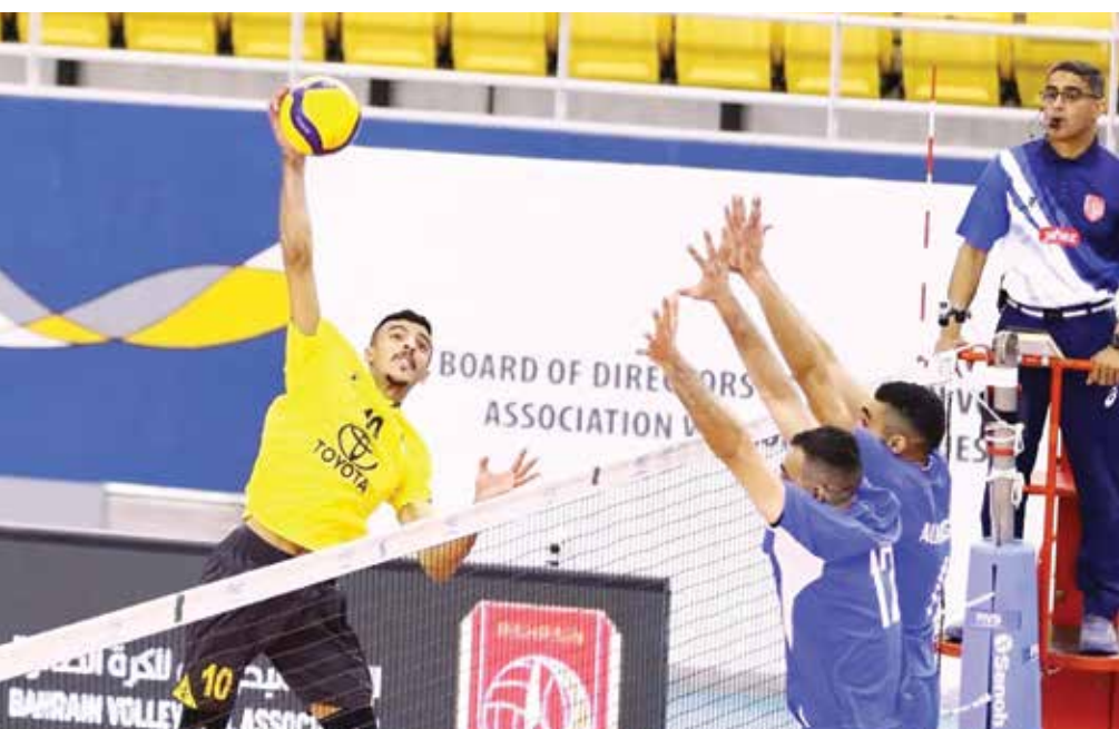
○ جانب من المباراة.

عزز فريق الأهلي صدارته للسداسي الثاني من دوري عيسى بن راشد للكرة الطائرة ليرفع رصيده إلى ١٨ نقطة بعد تكرار فوزه على النصر بثلاثية صفراء ٢٥-١٧، في المباراة التي جمعت الفريقين في صالة عيسى بن راشد في الرفاع التي ادارها الدوليان جعفر المعلم (١) وعلي عبدالحميد (٢)، وبهذه الخسارة ظل النصر على نقاطه الثلاث بعد سبع خسائر.