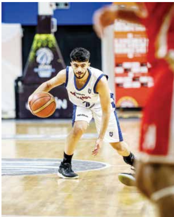
○ لقطة من لقاء المنامة والمحرق في نصف النهائي.

وخرج ممثل الوطن للمرة الأولى من الدور النصف النهائي، حيث تمكن في النسختين الأخيرتين من الوصول للمباراة النهائية، وتحقق لقب البطولة في النسخة الأولى في إنجاز غير مسبق لكرة السلة البحرينية، وينتظر شباب الأهلي المتأهل من الطرف الآخر الذي يجمع بين القادسية الكويتي والاتحاد السعودي.