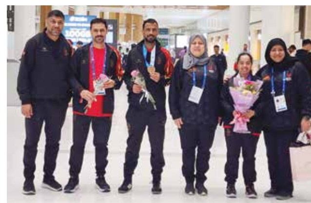
○ وفد البحرين.

وتختتم فعاليات الدورة اليوم بعد منافسات قوية جمعت نخبة من الرياضيين من مختلف دول العالم، حيث شكلت المشاركة البحرينية محطة مهمة لاكتساب الخبرة والتنافس في المحافل الدولية، مع تطلعات لتحقيق نتائج أفضل في المستقبل.