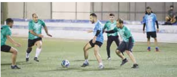
○ من منافسات كبار الهمة.