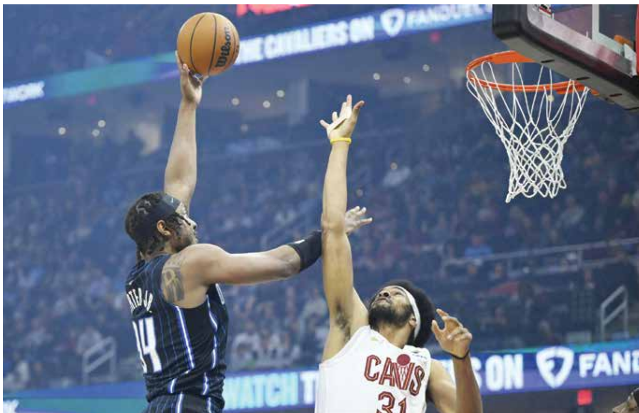
○ من لقاء ماجيك وكافاليري

ومنحت اللجنة الأولمبية الدولية الشهر الماضي اعترافا مؤقتا بالاتحاد العالمي للملاكمة في خطوة كبيرة نحو إدراج الرياضة في دورة الألعاب الأولمبية ٢٠٢٨. وأقيمت منافسات الملاكمة في أولمبياد باريس ٢٠٢٤ تحت إشراف اللجنة الأولمبية الدولية بعد أن جردت الاتحاد الدولي للملاكمة من الاعتراف به عام ٢٠٢٣ بسبب فشله في تنفيذ إصلاحات في مجال الحوكمة والمالية.