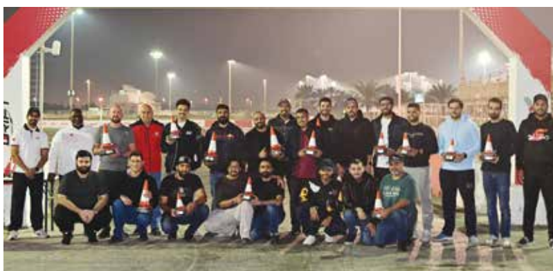
○ الفائزون في صورة جماعية.

ومشيدين بالتزامهم بالتعليمات والأنظمة والقوانين المعمول بها في عالم رياضة السيارات، والمشاركة الواسعة التي شهدتها جولات البطولة في هذا الموسم، مؤكداً أن المشاركة الفاعلة كان لها الأثر الكبير في تحقيق النجاح.