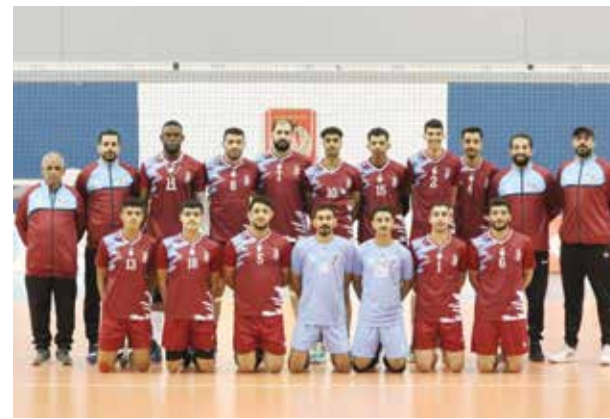
○ فريق الشباب للكرة الطائرة.

وكان الأهلي قد فاز على النصر خلال مباريات السداسي الأول بثلاثة أشواط مقابل شوطين.