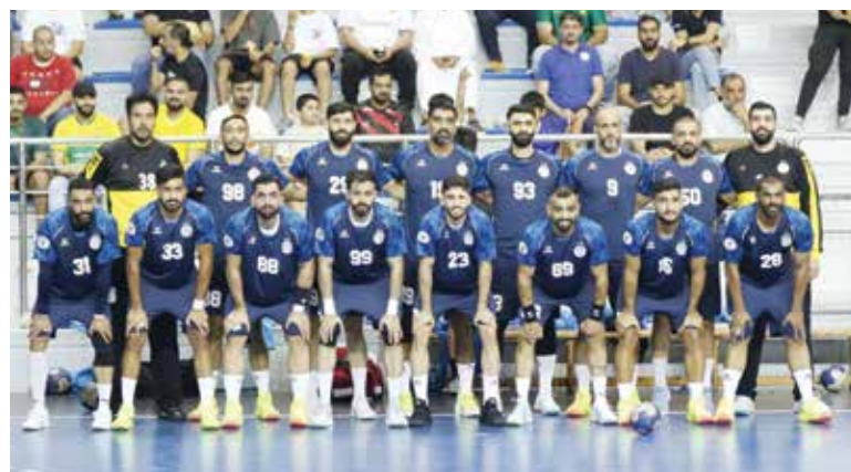
○ فريق النجمة.