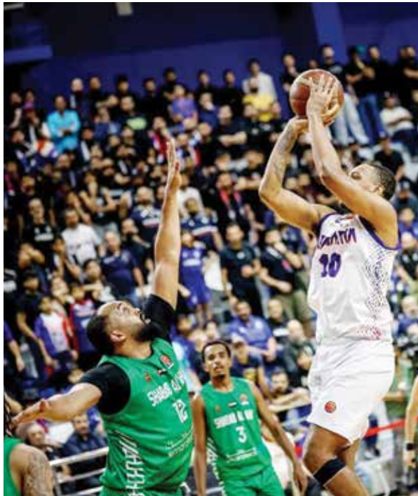
○ جانب من المباراة.