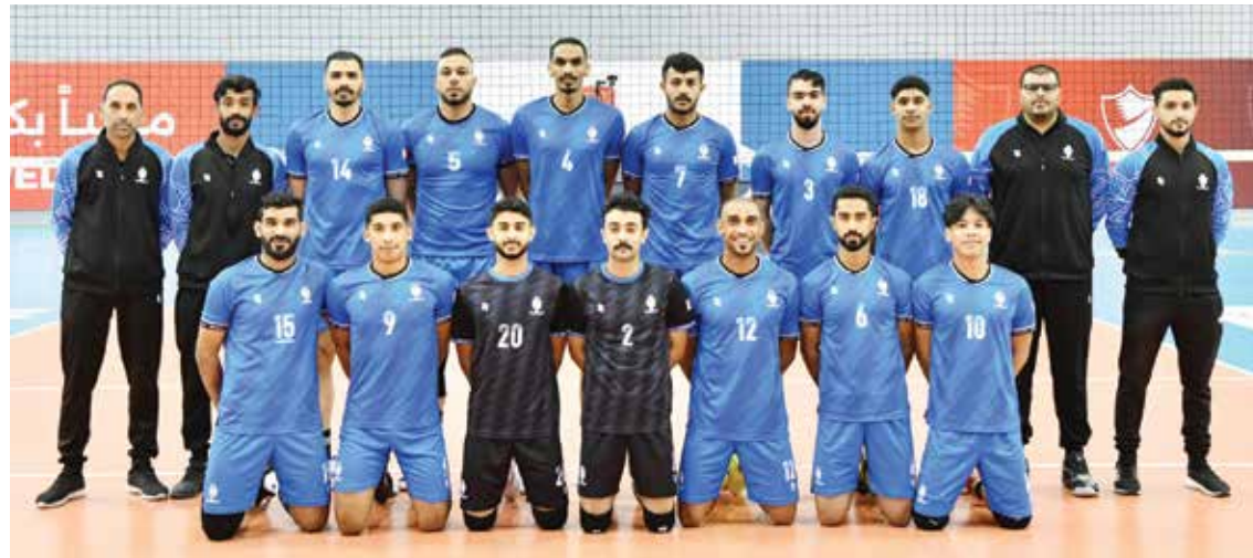
○ فريق النبيه صالح للكرة الطائرة.