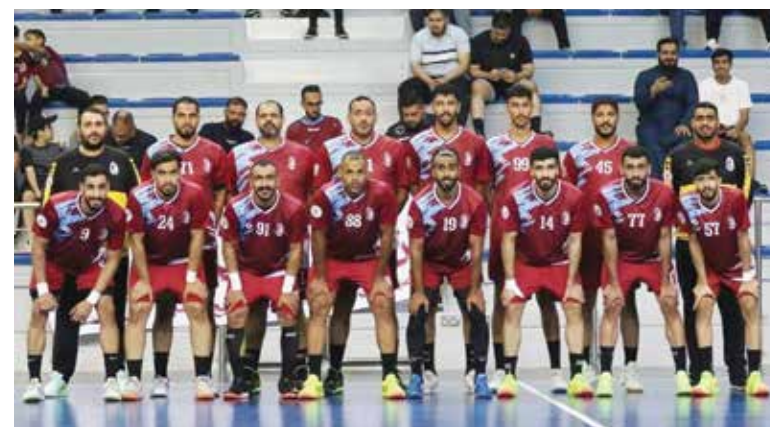
○ فريق الشباب.