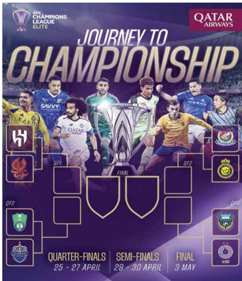
○ نتيجة القرعة.

ويستعد فريق باب سويقة، كما يلعب في تونس لخوض منافسات الدور ربع النهائي لدوري أبطال إفريقيا بملاقاة ماميلودي صانداونز الجنوب إفريقي مطلع أبريل المقبل.