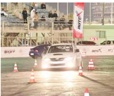
○ من منافسات الجولة الختامية.