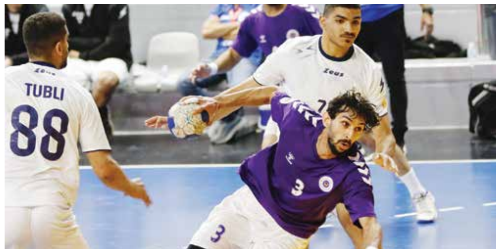
○ من لقاء باربار وتوبلي .

يدخل الاتفاق المباراة دون ضغوط بعدما فقد فرصة المنافسة على التأهل، لكنه يسعى لتحقيق نتيجة إيجابية لإنهاء مشواره بأفضل صورة ممكنة، ما يجعل المواجهة غير محسومة سلفاً.