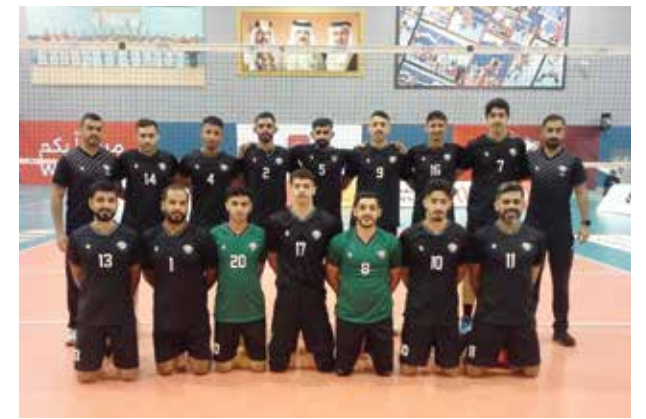
○ فريق بني جمرة للكرة الطائرة.