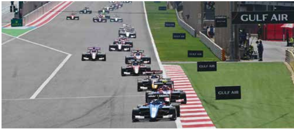
○ من سباقات فورمولا ١.

تذاكر نادي الياكوت وتذاكر قاعات الشركات، وتدعو حلبة البحرين الجماهير الراغبين في حضور أكبر فعالية رياضية وترفيهية اجتماعية في المنطقة إلى حجز مقاعدكم، وذلك لتوافر عدد محدود من التذاكر لنادي الأبطال وذا دوم لاونج إلى جانب بيع أكثر من ٩٠٪ من تذاكر المنصة الرئيسية، وبيع ما يقارب ٨٠٪ من منصة بيون ومنصة الخمسة في سباق الأول، وتوافر عدد محدود من منصة الجامعة ومنصة الفوز.