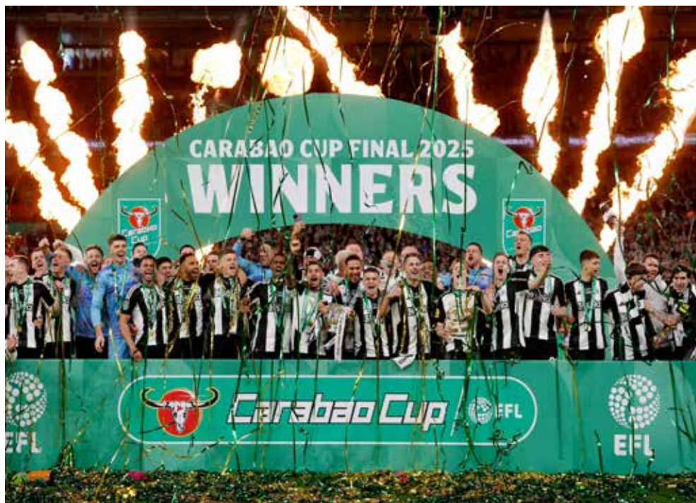
○ من تتويج نيوكاسل يونايتد بالكأس

منذ ٥٠ عاماً، حيث يعود آخر لقب أحرزته الفريق الملقب بـ(المايكث) داخل إنجلترا إلى موسم ١٩٥٤/١٩٥٥، حينما أحرز لقب كأس الاتحاد الإنجليزي آنذاك، كما صار الفريق ٢٤٤ الذي ينضم إلى قائمة الفائزين بكأس الرابطة الآن.