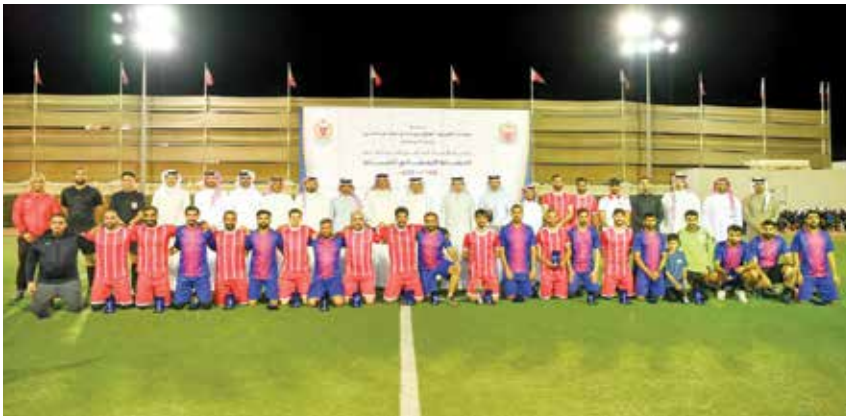
○ صورة جماعية.