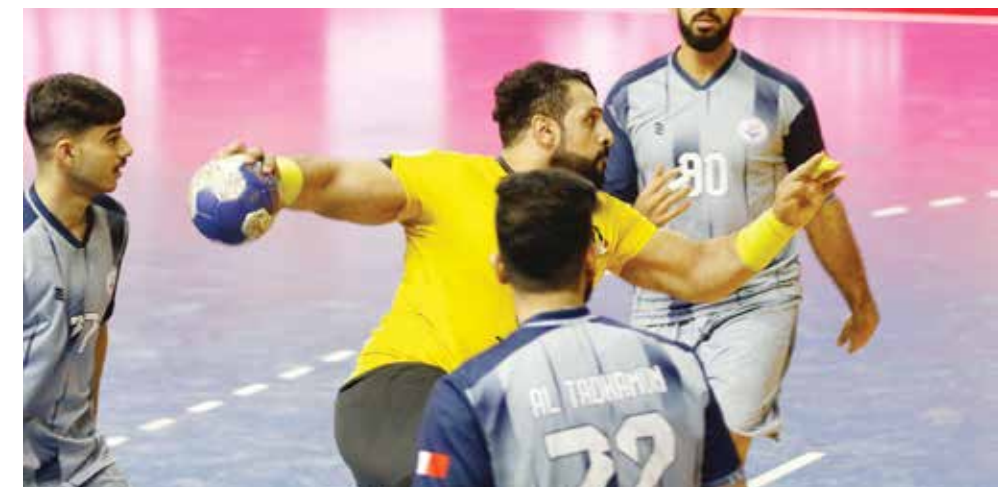
○ من لقاء الأهلي والتضامن.