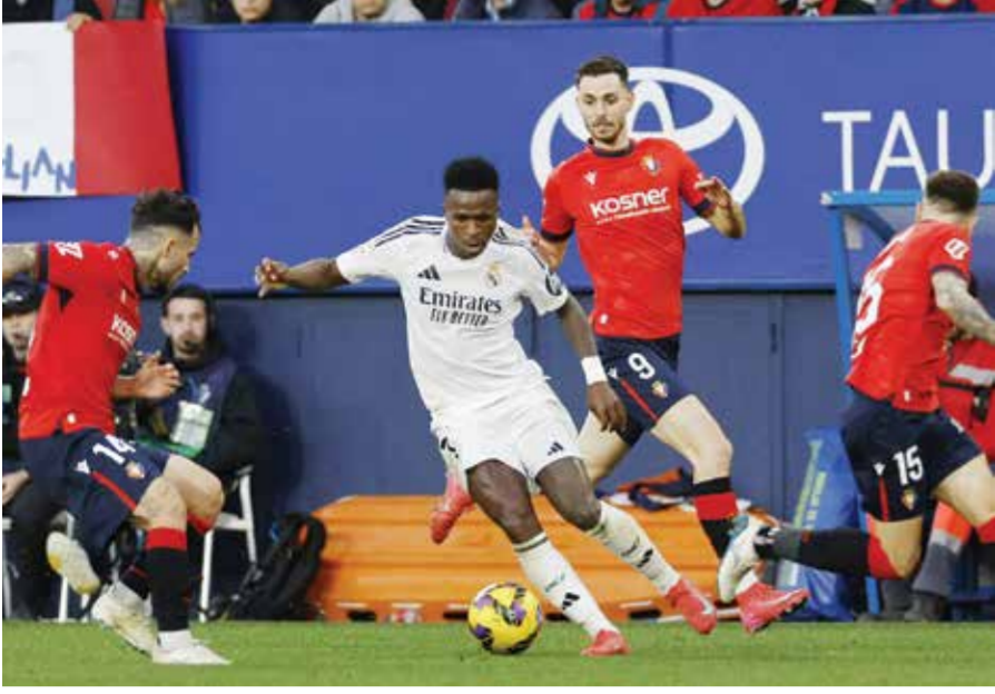
○ من لقاء ريال مدريد وأوساسونا .