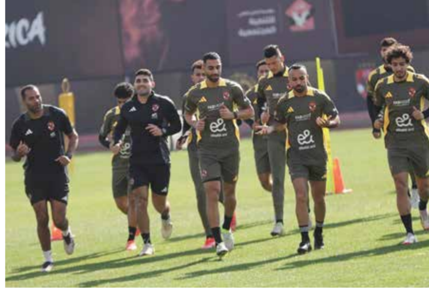
○ تحضيرات الأهلي.

أضم لاعبين جدد، ولدي ثقة في التشكيلة التي نملكها حالياً، من جانبه، يدخل الإسماعيلي المباراة