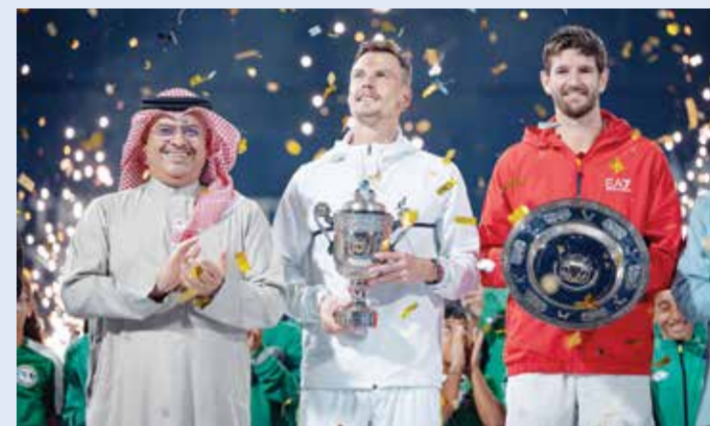
تتويج الفائزين بالكؤوس.

شهد الفريق أول الشيخ راشد بن عبدالله آل خليفة وزير الداخلية، مساء أمس، ختام بطولة وزارة الداخلية تشالنجر للتنس، بحضور السيد صالح بن عيسى بن هندي مستشار جلالة الملك للشؤون الشباب والرياضة، السيد أيمن بن توفيق المؤيد الأمين العام للمجلس الأعلى للشباب والرياضة، السيدة روان بنت نجيب توفيق وزيرة شؤون الشباب، الفريق طارق بن حسن الحسن رئيس الأمن العام وعدد من كبار المسؤولين.