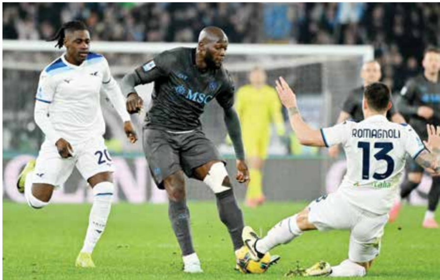
○ من لقاء نابولي ولاتسيو.

وجاءت آخر هذه الانتصارات في ديسمبر عندما أطاح ليفركوزن بلقب بايرن، من مسابقة كأس ألمانيا على ملعب «الليانيس آرينا»، وفي لقاء شهد طرد الحارس المخضرم مانويل نوير للمرة الأولى في مسيرته. ويشارك ليفركوزن تلقى خسارة يتيمة في البوندسليغا إلى حد الآن هذا الموسم، بيد أنه بخلاف الموسم الماضي عانى «دي فيركسليف» لحسم المياريات المتقاربة، فوقع في فخ التعادل ثماني مرات مقابل أربع بايرن.