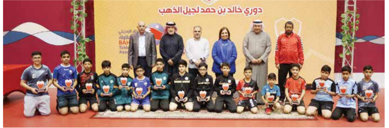
○ صورة جماعية.

وقالت الشيخة حياة بنت عبدالعزيز آل خليفة أن الإتحاد البحريني لكرة الطاولة ولله الحمد يلمس التطور الملحوظ الذي شهدته اللعبة على مستوى الفئات السنية من خلال عدد اللاعبين المميزين والإنجازات التي تحققت خارجياً، وأن هذا المشروع يدعم خطة الإتحاد البحريني لكرة الطاولة في تطوير اللعبة لإستدامة وزيادة الإنجازات بإذن الله تعالى، مشددة على أن التطوير يبدأ من القاعدة دائماً.