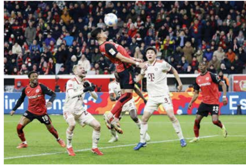
○ من لقاء بايرن وليفركوزن.

وسجل المهاجم جيورجوس مازوراس ثنائية أصحاب الأرض (٣٣ ٥٥)، ليواصل مدرب دورتموند الجديد الكرواتي نيكو كوفاتش البحث عن تحقيق فوزه الأول في البوندسليغا منذ انضمامه إلى الفريق في ٣٠ ديسمبر ٢٠٢٥. وتجمد رصيد دورتموند عند ٢٩ نقطة في المركز الحادي عشر، بينما انعش بوخوم حظوظه للهروب من منطقة الهبوط ويات في رصيده ١٤ نقطة في المركز السابع عشر قبل الأخير بفارق أربع نقاط عن منطقة الأمان. وسقط أونيون برلين على أرضه أمام بوروسيا مونشنغلاذباخ ٢-١.