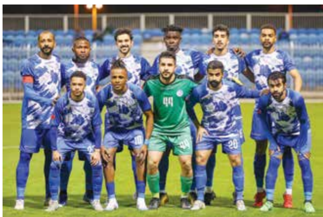
فريق أم الحصم.

ويشير الترتيب العام قبل انطلاق هذه الجولة إلى تصدر البديع برصيد ٣٥ نقطة، الحد ثانياً برصيد ٣٠ نقطة، مدينة عيسى ثالثاً برصيد ٢٤ نقطة، الاتحاد رابعاً برصيد ٢٤ نقطة، الحالة خامساً برصيد ٢٤ نقطة، البستين سادساً برصيد ١٩ نقطة، أم الحصم سابعاً برصيد ١٧ نقطة، بوري ثامناً برصيد ١٣ نقطة، الاتفاق تاسعاً برصيد ١٢ نقطة، اتحاد الريف عاشراً برصيد ٧ نقاط، قلالي في المركز الحادي عشر برصيد ٥ نقاط، وفي المركز الأخير التضامن برصيد ٣ نقاط.