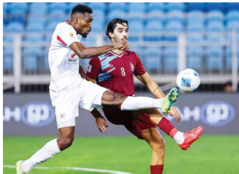
جانب من لقاء الشباب والرفاع الشرقي.