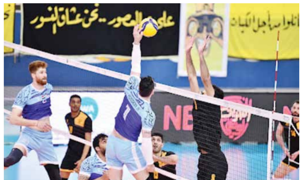
○ جانب من لقاء فرقتي العربي والأهلي.

كان الفريق العراقي هو الأفضل خلال الشوطين الأولين على مستويات الهجوم وحواجز الصد والتنظيم، وقد دفع القادسية ثمن العودة المتأخرة إلى أجواء المباراة بعد تأخره بشوطين نظيفين، وكاد القادسية أن يأخذ منافسه في الأمتار الأخيرة إلى شوط فاصل.