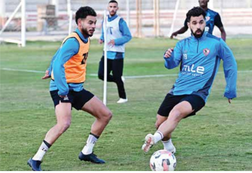
○ استعدادات الزمالك.

ولن تكون مواجهة بتروجت سهلة على بيسيرو الذي يخوض مهمته الثانية في الدوري المصري بعدما سبق له تدريب الأهلي في عام ٢٠١٥ لفترة قصيرة، حيث يعاني الزمالك من تدني في النتائج والأداء هذا الموسم، بعدما حقق ٨ انتصارات وتعادلين وخسر ٣ مباريات ليحتل المركز الثالث.