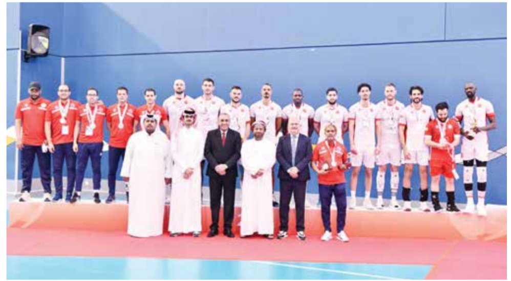
○ تتويج العربي بالمركز الثاني.