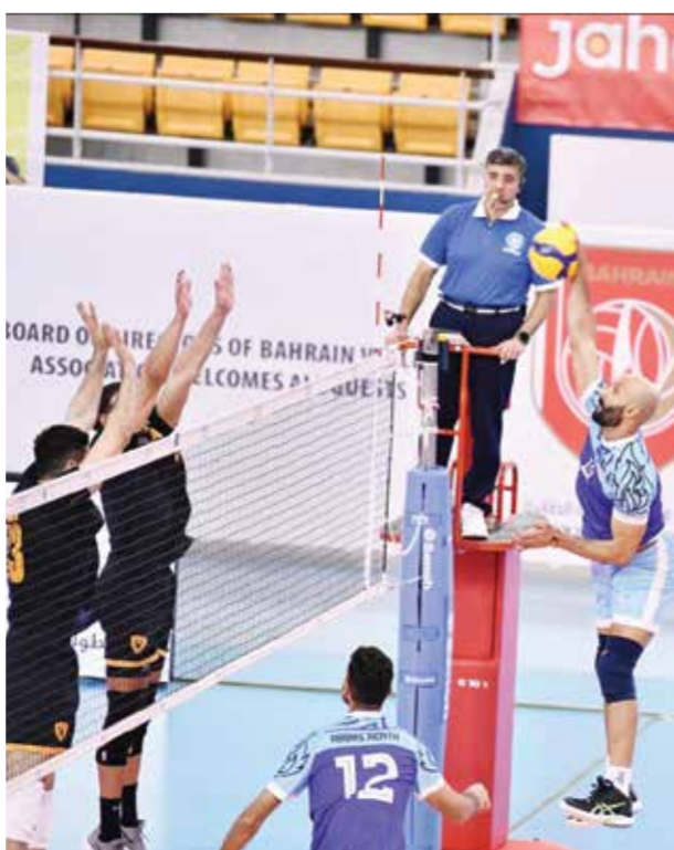
○ لحظة من لقاء القادسية ومصافي الشمال.