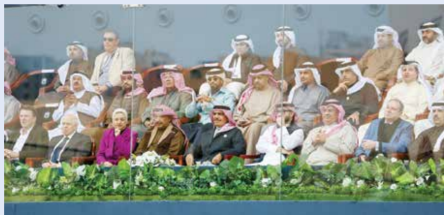
حضور رسمي كبير.