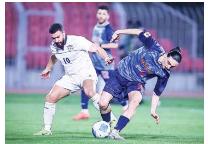
جانب من لقاء المنامة والنجمة.