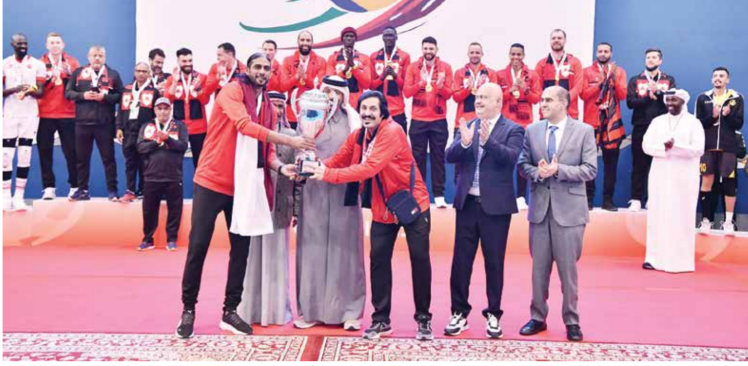
○ تتويج الريان بالمركز الأول.