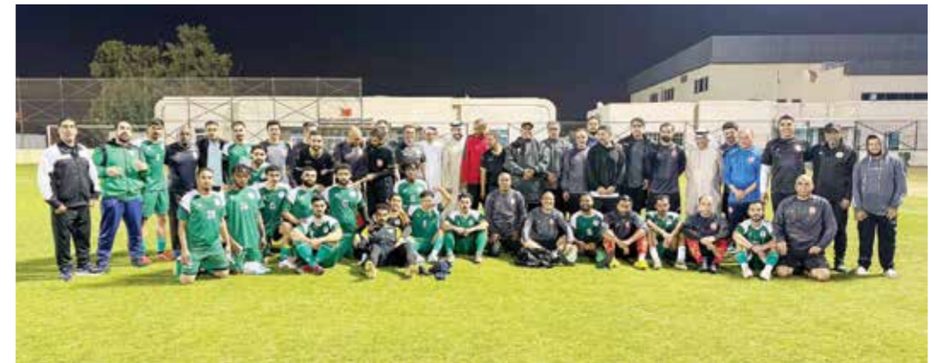
○ منتخب القدامى.

وكان المنتخب الوطني قد استأنف مساء أمس تدريباته بعد استراحة نهاية الأسبوع التي منحها الجهاز