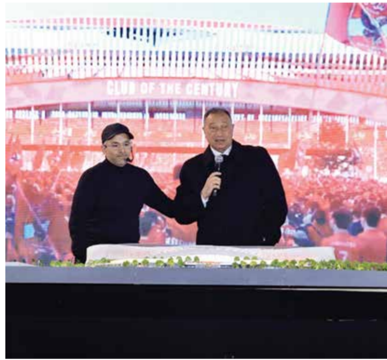
○ الخطيب يعلن بناء الملعب الجديد.

شركاء المشروع سيتم الكشف عنهم يوم ٢٤ أبريل المقبل تزامناً مع ذكرى تأسيس النادي الأهلي رقم ١١٨، حيث تأسس في اليوم نفسه من عام ١٩٠٧.