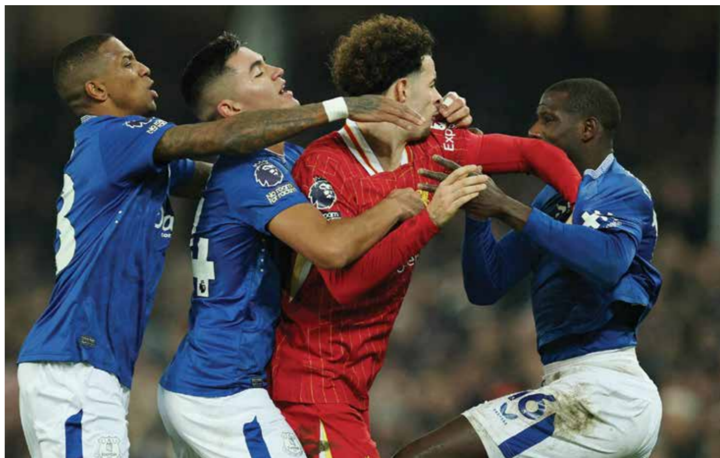
◦ شجار اللاعبين.

وقال لام: «قضيت وقتاً طويلاً مع باستيان، وتوماس، ونوير. كنا زملاء مخلصين وملتزمين. كنا نكمل بعضنا بعضاً وندعم بعضنا بعضاً. لا يمكن أن تعرف ما إذا كان ذلك مناسباً في منصب وموقف مختلف إلا بعد أن تجربته».