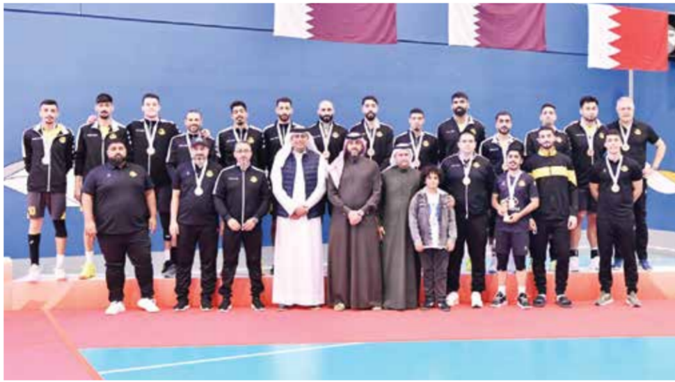
○ تتويج الأهلي بالمركز الثالث.