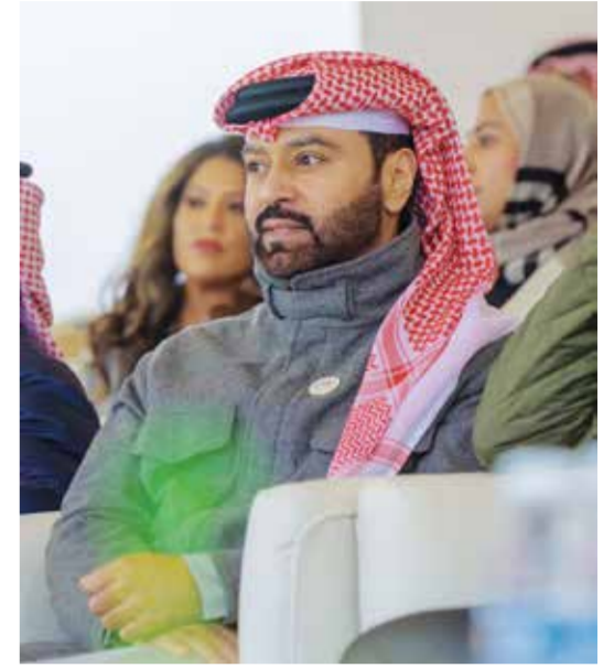
○ سمو الشيخ فيصل بن راشد آل خليفة.