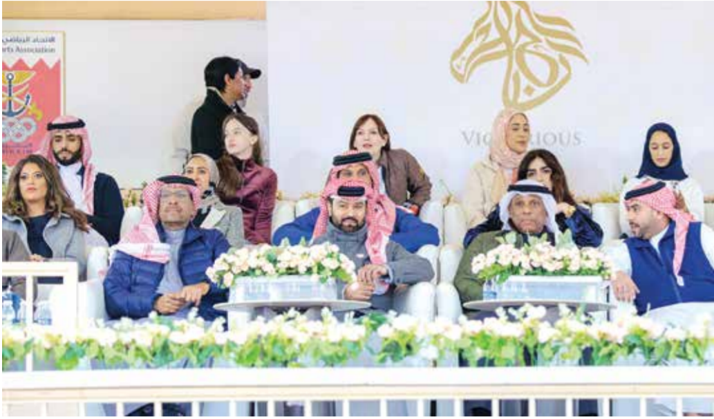
○ جانب من الحضور.