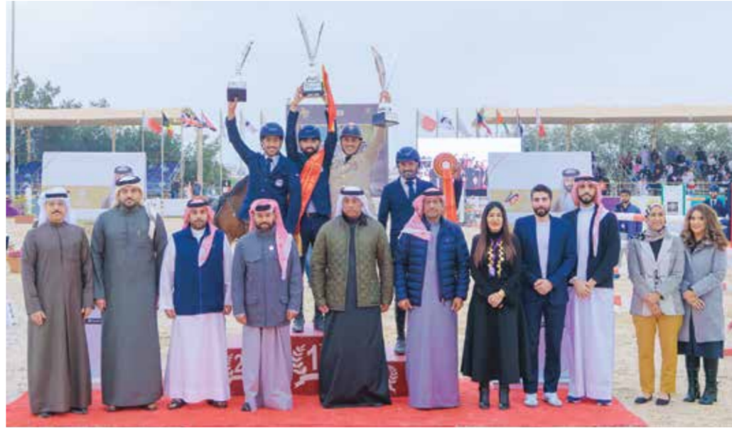
○ سموه يتوج الفائزين.