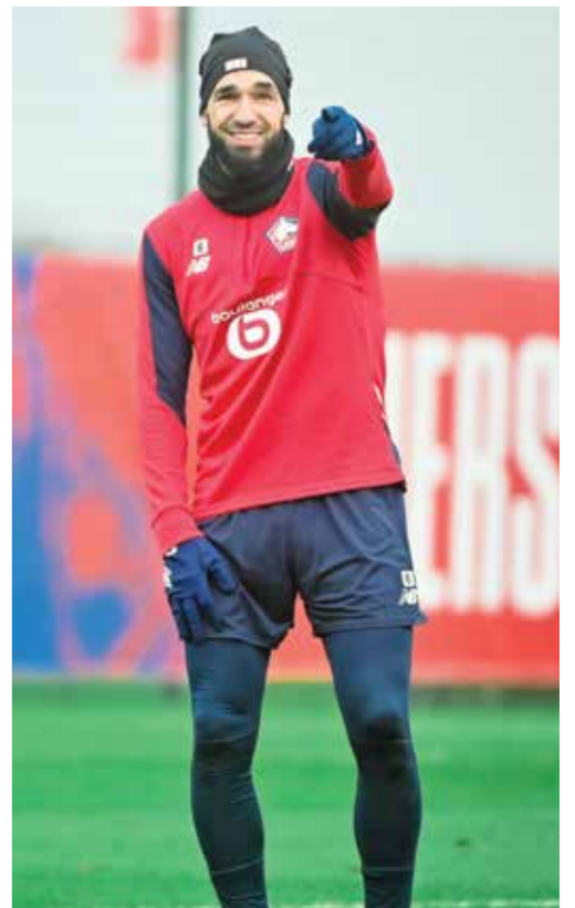
○ بن طالب.

كل هذا حتى صدر الرأي الإيجابي من اللجنة الطبية بالاتحاد الفرنسي لكرة القدم مساء الأربعاء، وهو ما يشكل سابقة في فرنسا، حيث لم يتمكن أي لاعب محترف آخر من اللعب بجهاز طبي، حتى لو لم يكن محظوراً رسمياً.