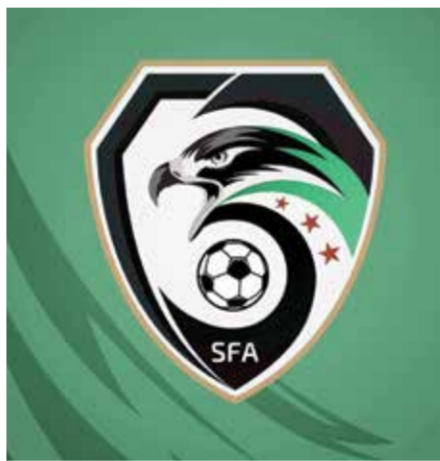
○ شعار الاتحاد.