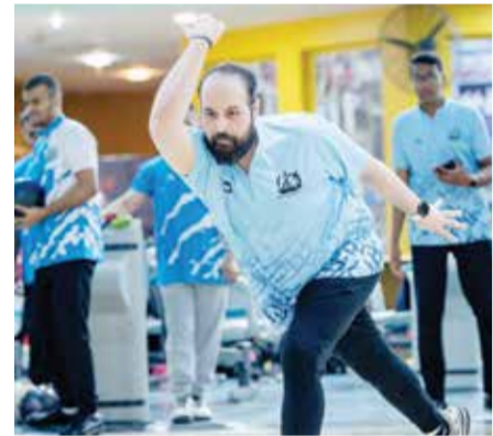
○ من منافسات الدوري العام للبولينج.