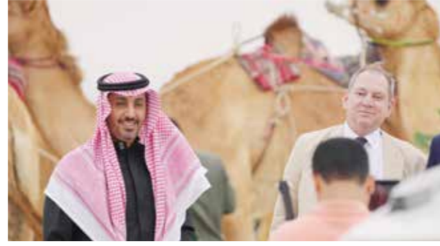
○ جانب من زيارة السفير الإيطالي لسباقات الهجن.