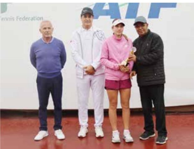
○ تتويج بطل فردي الفتيات.